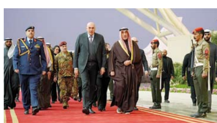
الشيخ فهد اليوسف يستقبل وزير الدفاع الإيطالي

جمهورية إيطاليا الصديقة لدى البلاد لورنزو موريني وعدد من كبار الضباط من كلا الجانبين. الجدير بالذكر أن وزير الدفاع في الجمهورية الإيطالية الصديقة غويدو كروسيو قد وصل إلى البلاد اليوم حيث كان في استقباله لدى وصوله النائب الأول لرئيس مجلس الوزراء ووزير الدفاع ووزير الداخلية الشيخ فهد اليوسف.