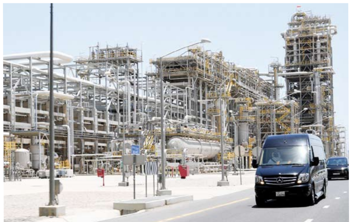
سمو الأمير خلال جولة تفقدية لمصفاة الزور