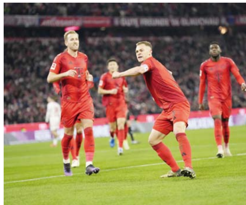
فوز كبير للبايرن على لايبزيغ

هدفين للبايرن في الدقيقتين (25 و36)، ثم اختتم ليروي ساني والكندي ألفونسو ديفيز خماسية فريقهما بهدفين في الدقيقتين (75 و78).