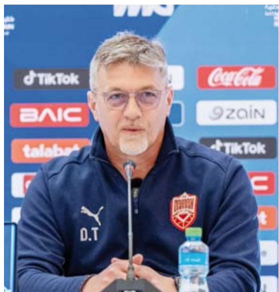
الكرواتي دراغان تالاييتش مدرب منتخب البحرين