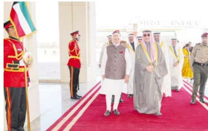
الشيخ فهد اليوسف في مقدمة مستقيل رئيس وزراء الهند

كما عقد الجحيا خلال الزيارة جلسة مباحثات رسمية مع وزير الشؤون الخارجية الهندي سوبراهمانيام جايشانكار ناقشت أطر تعزيز العلاقات الثنائية والدفع بها نحو مزيد من التطور والنماء بالإضافة إلى بحث كل ما من شأنه أن يحقق رؤى قيادتي البلدين الصديقين نحو المزيد من التقدم ومستقبل أرحب يعكس التطورات ويحقق المصالح المشتركة للبلدين والشعبين الصديقين. وبحث الجحيا وجايشانكار كذلك المستجدات على الساحتين الإقليمية والدولية والتطورات المتسارعة التي تشهدها المنطقة وفي مقدمتها الأوضاع في الأراضي الفلسطينية المحتلة.