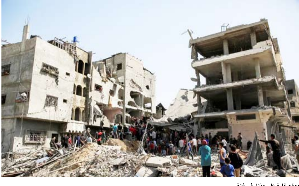
موقع غارة على منزل في غزة