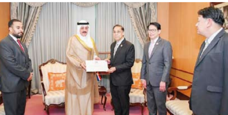
السفير سمح جوهري يسلم الرسالة الخطية

سليم مساعد وزير الخارجية لشؤون آسيا السفير سمح جوهري حيات، أول أمس، رسالة خطية موجهة من وزير الخارجية الكويتي عبدالله الجحيا إلى نظيره التايلندي مارييس ساغيامونغسا. جاء ذلك خلال لقاء عقده السفير الكويتي المستشار السياسي لوزير الخارجية التايلندي السفير شو تينتون كونغساندي بحضور القائم بأعمال سفارة الكويت لدى تايلند المستشار عبدالعزیز الحوطي بمقر وزارة الخارجية التايلندية في بانكوك والوفد الكويتي المرافق على هامش الزيارة الرسمية التي يقوم بها إلى تايلند لترؤس وفد الكويت المشارك في المشاورات السياسية الأولى بين وزارتي الخارجية في كلا البلدين. وذكرت وزارة الخارجية التايلندية أنه تم خلال اللقاء استعراض العلاقات بين البلدين