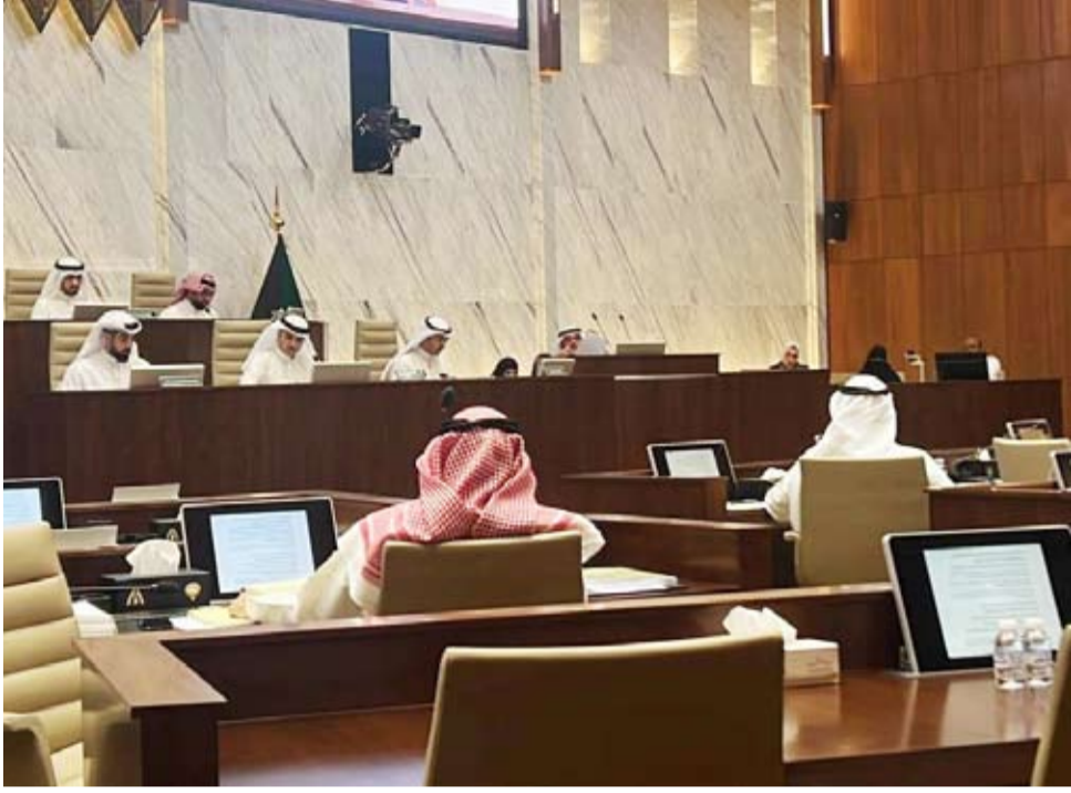
جلسة سابقة للمجلس البلدي

منطقة العمل الممتدة من الدائري السادس شمالاً، وامتداد الدائري السابع جنوباً، والدائري السابع شرقاً، وطريق السالمي غرباً، والموافقة النهائية على جدول واشتراطات المواصفات الخاصة بالمناطق الزراعية ومناطق تنمية الثروة الحيوانية بلائحة تنظيم أعمال البناء والتعديلات النهائية عليها.