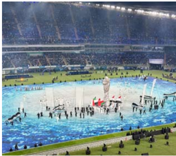
عروض فنية وترفيهية خلال حفل الافتتاح