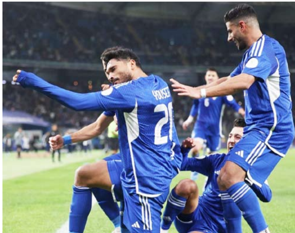
التعادل الإيجابي يحسم مباراة الكويت وعمان في افتتاح «خليجي 26»