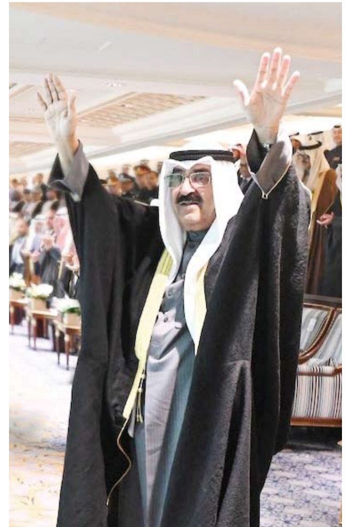
صاحب السمو الأمير يحيي الجماهير لدى وصوله استاد جابر الأحمد أمس

أعلن سمو أمير البلاد الشيخ مشعل الأحمد، مساء أمس، انطلاق بطولة كأس الخليج العربي لكرة القدم «خليجي 26»، وسط حضور جماهيري كبير وبحضور رئيس الاتحاد الدولي لكرة القدم جيانجي إنفانتينو ورئيس الوزراء الهندي ناريندرا مودي . وقال سمو الأمير في كلمته: نرحب بكم جميعاً في هذا الحفل الرياضي الذي يجمعنا في دولة الكويت أرض المحبة والسلام ويعكس الروح الأخوية الرياضية بين شعوبنا الخليجية بسم الله ويعون من الله نفتتح دورة كأس الخليج العربي 26 لكرة القدم. وقد شهد سمو أمير البلاد