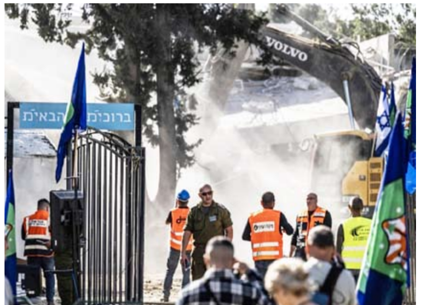
16 شخصا أصيبوا بشظايا الزجاج و 7 إصابات بصدمة نفسية

فشل جيش الاحتلال، امس، في اعتراض صاروخ أطلقه الحوثيون من اليمن وسقط وسط تل أبيب، وسط تقارير عن وقوع عدد كبير من الإصابات. وقال المتحدث باسم جيش الاحتلال في بيان مقتضب على منصة إكس: «عقب إطلاق صاروخ من اليمن وتفعيل إنذارات وسط إسرائيل جرت محسولات اعتراض غير ناجحة ليتم تحديد منطقة سقوطه، التفاصيل لا تزال قيد الفحص». وأفادت نجمة داود الحمراء بأن 16 شخصاً أصيبوا بشظايا الزجاج عقب الهجوم الصاروخي، وتم تحديد 7 إصابات بصدمة نفسية.