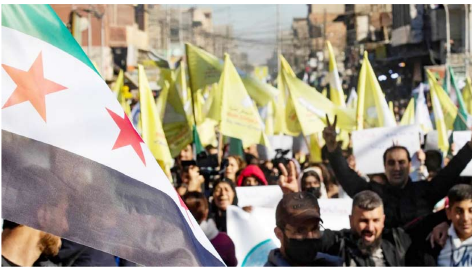
مظاهرة دعم لـ«قسد» في القامشلي

تصاعدت الخلافات التركية الأميركية حول التعامل مع «وحدات حماية الشعب الكردية»، التي تُعد أكبر مكونات قوات سوريا الديمقراطية «قسد»، في الوقت الذي أعلن فيه الرئيس رجب طيب أردوغان أن «التنظيمات الإرهابية» في سوريا لن تجد من يدعمها أو يتعامل معها بعد الآن. وصعدت القوات التركية وفصائل الجيش الوطني السوري الموالي لها، ضرباتها على مواقع «قسد» في منبج وعين العرب (كوباني)، بعدما نفت أنقرة ما أعلنته واشنطن عن تمديد لوقف إطلاق النار بين تركيا و«قسد». وواصلت القوات التركية، قصف محيط سد تشرين بريف منبج شرق حلب، وسط دعوات من قبل الأتالي للتدخل، للحد من التصعيد، وضمان حماية المنشآت الحيوية. وأفاد «المركز السوري لحقوق الإنسان» بأن القذائف الصاروخية التركية دمرت أجزاء من السد، ما يهدد بعواقب بيئية وإنسانية خطيرة إذا استمر التصعيد، الذي بدأ باشتباكات عنيفة بين قوات «مجلس منبج العسكري» والفصائل الموالية لتركيا، استخدمت خلالها الأسلحة المتوسطة والثقيلة. وترأست الاشتباكات مع حركة نزوح كبيرة للمدنيين من المنطقة باتجاه المناطق الأكثر أمناً. وقتل صحافيان، وأصيب سائق سيارة في استهداف مسيرة تركية، السيارة التي كانت تقلهم على الطريق الواصل بين سد تشرين وبلدة صرين في ريف عين العرب (كوباني) الجنوبي، في شرق حلب. وقتل 5 من عناصر الفصائل الموالية لتركيا أثناء محاولتهم التسلل إلى مواقع «قسد»، بعد اندلاع اشتباكات عنيفة بين الطرفين، في بلدة دير حافر بريف حلب الشرقي. وفي تصريحات أدلى بها صحافيون مهاجرين في طريق عودته من القاهرة، حيث شارك في قمة مجموعة «الخماني النامية»، نُشرت، قال