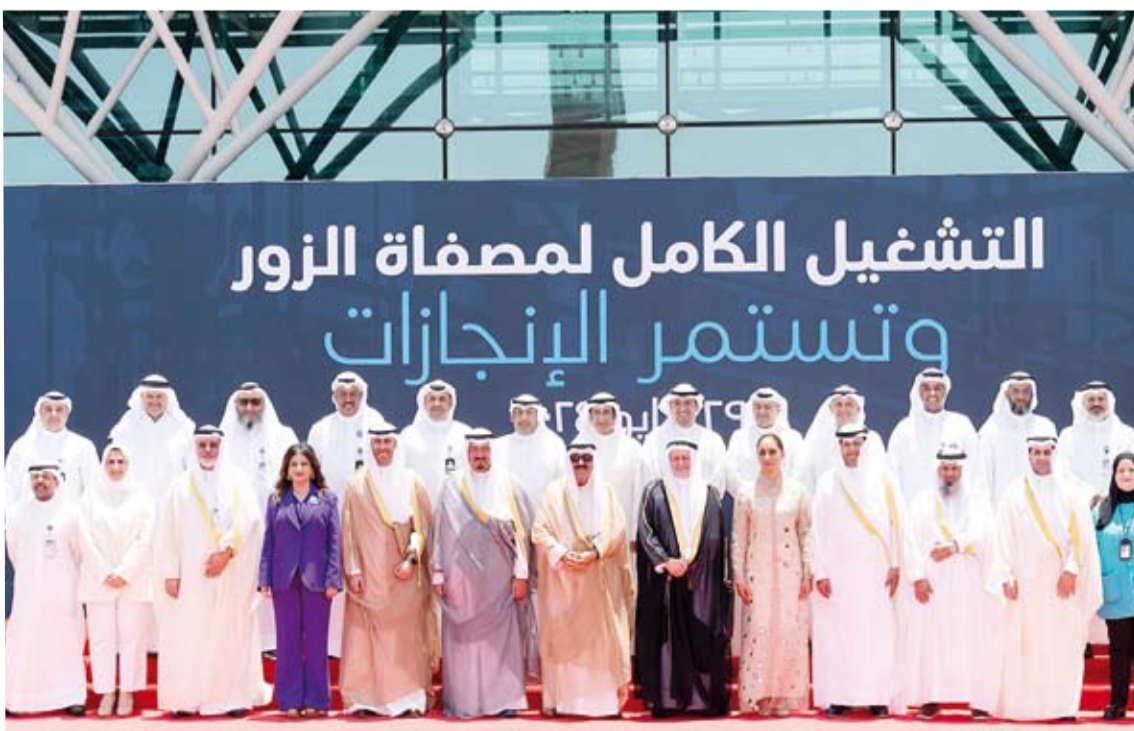
لقطة تذكارية مع سمو أمير البلاد خلال رعايته وحضوره الاحتفالية الرسمية للتشغيل الكامل لمصفاة الزور

وتقدمت الكويت مرتبة واحدة في تقرير الكتاب السنوي للتنافسية العالمية الصادر عن مركز التنافسية العالمي التابع للمعهد الدولي