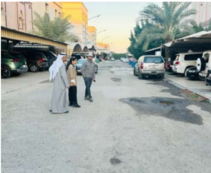
وزيرة الأشغال في أحد المواقع

♦ أكدت جاهزية فرق «الأشغال» لمراقبة أعمال الشركات المنفذة