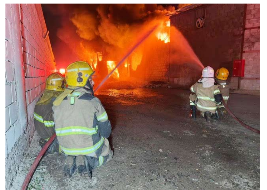
رجال الإطفاء يقاومون حريق الصبية

سيطرت فرق الإطفاء من مراكز الجهراء والجرهاء الحرفي والإسناد ومشرق والصلبيخات والاستقلال مساء يوم أمس الأول على حريق مخزن خاص بمواد البناء يحتوي على أصباغ وأخشاب وورشة حداده حيث باشرت الفرق بمكافحة الحريق والسيطرة عليه، ولم يسفر الحادث عن أي إصابات تذكر.