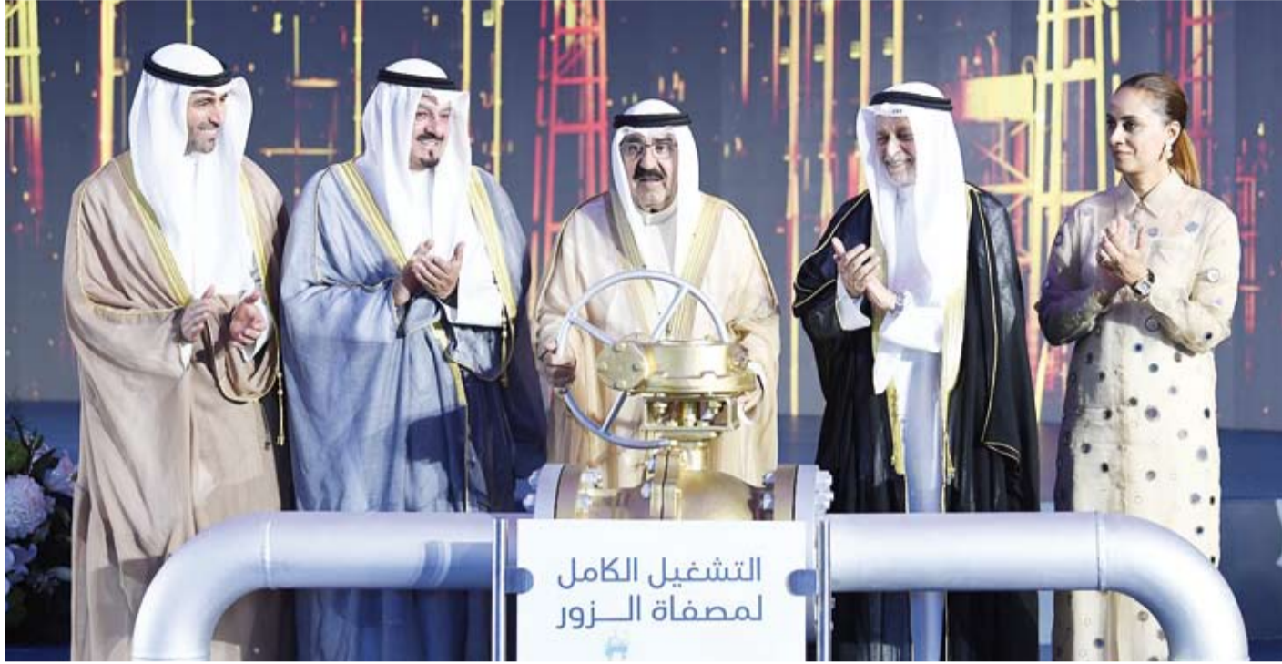
سمو أمير البلاد يتفضل بتدشين مصفاة الزور