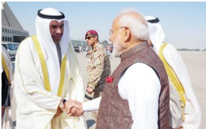
وزير الخارجية عبدالله الجحيا في استقبال رئيس وزراء جمهورية الهند