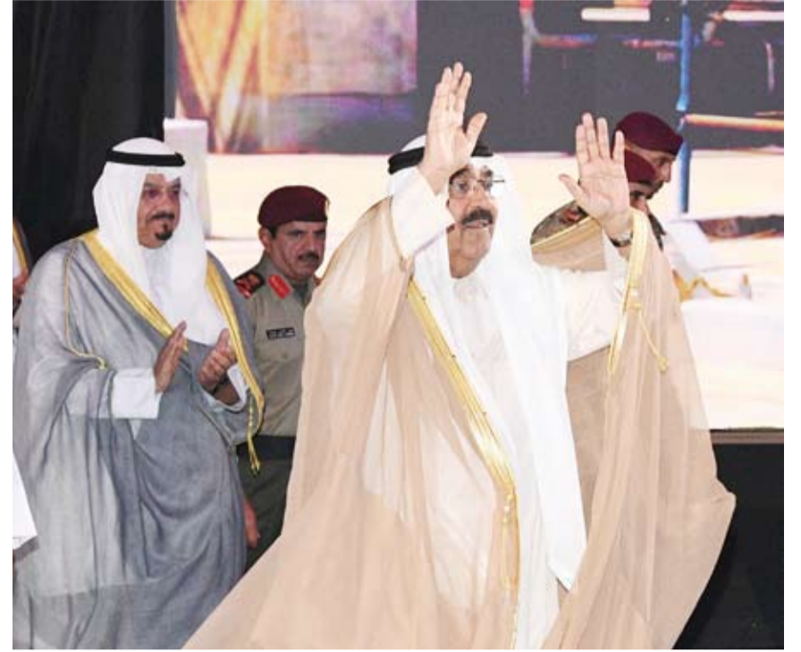
سمو أمير البلاد الشيخ مشعل الأحمد

التوجيهات الأميرية السامية أُرست على التحولات المنشودة في طبيعة الاقتصاد وقاعدته الإنتاجية