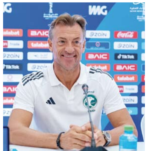
رينارد مدرب الأخضر السعودي