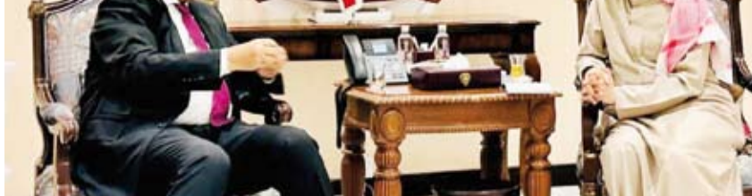
عبدروس الزبيدي مستقبلاً السفير فلاح الجحرف

الأخوي اللامحدود لإعادة تأهيل البنية التحتية التي دمرتها الحرب في عدد من القطاعات الحيوية وفي طبيعتها قطاعي التعليم والصحة ودعمها المتواصل في المجال الإنساني. واستعرض اللقاء سبل تعزيز الدعم الكويتي ودعمه لليمن في هذه المرحلة الدقيقة وتعزيز التعاون مع الحكومة في مختلف القطاعات الحيوية.