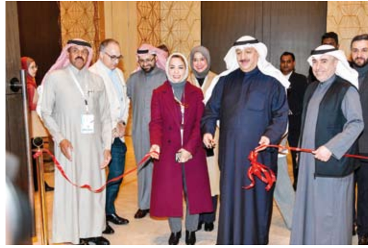
. ويفتح المؤتمر المصاحب