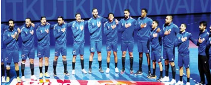
صورة جماعية لمنتخب الكويت لكرة اليد