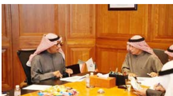
الزامل مجتمعاً مع احد الوكلاء

عقد وكيل وزارة الكهرباء والماء والطاقة المتجددة الدكتور عادل الزامل اجتماعاً مع عدد من الوكلاء المساعدين بقطاعات الوزارة المختصة بالكهرباء للاطلاع على الوضع الحالي للقطاعات والتحديات والمعوقات التي تواجههم والرؤية التطويرية لهم. وبدأ الاجتماع بكلمة ترحيبية بالوكلاء وتقدم لهم بجزيل الشكر على جهودهم في متابعة الأعمال بالقطاعات المكلفين بها والحرص على إيصال خدمات الوزارة للعملاء بأعلى جودة.