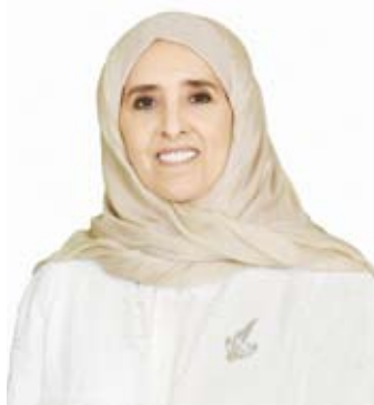
الشيخة عايدة سالم العلي

جامعة القاهرة ثم الماجستير والدكتوراه في التشفير من جامعة ستانفورد الأمريكية ويعتبر أحد رواد الأمن المعلوماتي، إذ ابتكر (خوارزمية الجمل) للتشفير والتوقيع الرقمي واعتمدها المعايير الدولية.