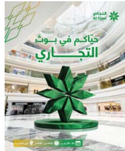
الخدمات والعروض من خلال تقنيات متطورة ومتنوعة.

في إطار حرص البنك التجاري الكويتي على اطلاع العملاء على منتجاته وخدماته المصرفية المصممة لتلبية احتياجات جميع الفئات فضلاً عن جهوده في مجال التكيف والتوعية المالية، يتواجد البنك في مجمع العاصمة من الخميس الموافق 23 يناير إلى السبت الموافق 25 يناير 2025 من خلال جناحاً يقيم فيه البنك بهدف تعريف رواد المجمع بالزمايا والخدمات والحلول المصرفية التي يقدمها البنك التجاري الكويتي بطريقة مبتكرة. هذا، وسوف يستقبل فريق إدارة المبيعات المباشرة - التابع لقطاع الخدمات المصرفية للأفراد رواد المجمع للإجابة على أي استفسار لديهم حول مزاي حسابات البنك التجاري الكويتي والبطاقات الائتمانية والسبقة الدفع التي يقدمها البنك لعملائه والتي تمنحهم مزاي استثنائية منها دخول قاعات الانتظار في المطارات والتي يحرص البنك على توفيرها لحاملي بطاقته المصرفية التي تناسب جميع شرائح العملاء. كما أن البنك يوفر بعض الفعاليات التقنية لزوار الجناح لمعرفة آخر