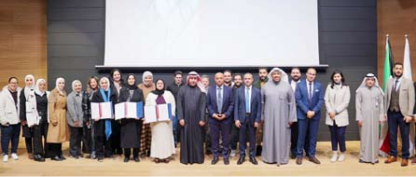
مشاركون في جلسة التوعية