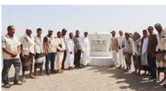
افتتاح أحد المشاريع

سبل العيش الكريم في المناطق الأكثر احتياجاً. وشكر الشباب، وزاراتي الشؤون الاجتماعية والخارجية بدولة الكويت على دعمهما المستمر للعمل الخيري الكويتي، معرباً عن تقديره البالغ للمتبرعين والداعمين الكويتيين على دعمهم السخي في مساعدة المحتاجين في اليمن وفي كل مكان.