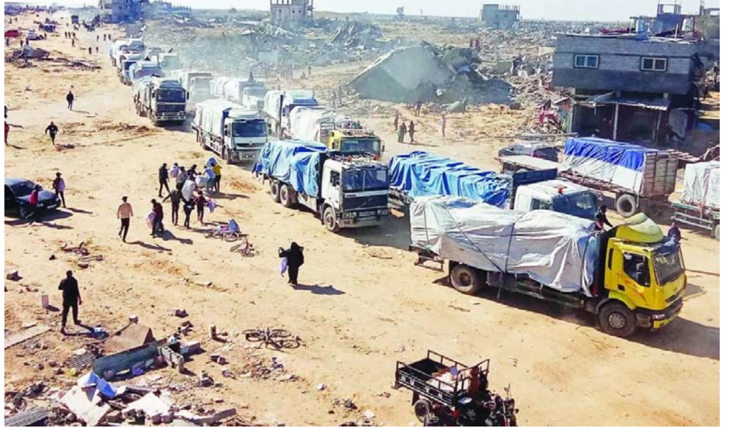
عشرات الشاحنات تدخل قطاع غزة

قال رولاند فريدريك، مدير شؤون وكالة غوث وتشغيل اللاجئين الفلسطينيين (أونروا) في الضفة الغربية، إن إسرائيل استخدمت أسلحة متطورة وأساليب حرب متقدمة، بما فيها الغارات الجوية، في العملية العسكرية التي تشنها على مخيم جنين. وذكر فريدريك في حساب على منصة «اكس» أن قوات الأمن الإسرائيلية شنت عملية واسعة النطاق في المخيم والمدينة، متوقفاً أن تستمر العملية أياماً عدة.