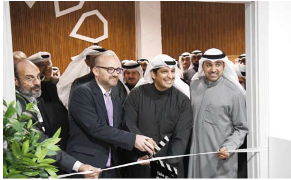
وزير الإعلام خلال تدشين المرحلة الثانية بحضور السفير الفرنسي

أكد وزير الإعلام والثقافة ووزير الدولة لشؤون الشباب عبدالرحمن المطيري، أن مشروع أرشفة التلفزيون يمثل مرحلة مهمة في مسيرة تطوير البنية التحتية الإعلامية لدولة الكويت.