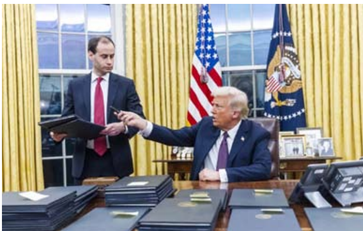
ترمب أثناء في مكتبه بالبيت الأبيض

وذلك يوم الاثنين الموافق 10 فبراير 2025 الساعة الثامنة مساءً في اليرموك - ق 3 - ش 2 - جادة 16 - منزل 16 رئيس مجلس الإدارة