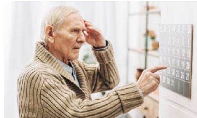
أمراض اللثة تؤثر تزيد من خطر الإصابة بمرض الزهايمر

كشفت دراسة حديثة أجراها باحثون من كلية الطب بجامعة أنهوي في الصين عن وجود صلة بين أمراض اللثة وتدهور الوظائف العقلية، مما يزيد من خطر الإصابة بمرض الزهايمر. ووفقاً للدراسة، التي نشرت في مجلة Journal of Periodontology المتخصصة في أمراض اللثة، قام الباحثون بمقارنة صور أشعة الرنين المغناطيسي للمخ لدى 51 شخصاً بالغا لا يعانون من مشاكل عقلية، من بينهم 11 مصاباً بأمراض اللثة، حيث أظهرت النتائج أن الحالات المتوسطة إلى الحادة من أمراض اللثة تؤدي إلى تغيرات في الوصلات العصبية بين مناطق المخ المختلفة. وأكدت الدراسة أن البكتيريا التي تنمو داخل اللثة المصابة يمكن أن تصل إلى أنسجة المخ، مما يسبب استجابة مناعية تؤدي إلى أضرار محتملة. وأوضحت أن أمراض اللثة تعد من عوامل الخطورة التي قد تؤدي إلى تراجع الوظائف الإدراكية، كما يمكن أن