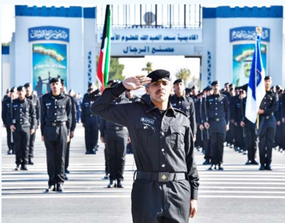
تخرج الدفعة الثانية عشر من طلبة مدرسة الشرطة

تحت رعاية النائب الأول لرئيس مجلس الوزراء ووزير الدفاع ووزير الداخلية الشيخ فهد اليوسف، شهد وكيل وزارة الداخلية الفريق الشيخ سالم النواف والقيادات الأمنية، أمس، حفل تخرج الدفعة الثانية عشر من طلبة مدرسة الشرطة، تخصصي الدرجات النارية والأثر، التابعين لقطاع المرور والعمليات، والبالغ عددهم 690 خريجاً، في أكاديمية سعد العبدالله للعلوم الأمنية. وفي كلمته خلال الحفل، دعا النواف الخريجين أن يكونوا مثلاً يُحتذى في الانضباط والالتزام، مؤكداً أهمية احترام الزي العسكري وصون القسم الذي أؤده، مشدداً على أن ما تلقوه من تدريبات ومعارف يجب أن يكون أساساً راسخاً لأداء مهامهم اليومية وتحقيق أعلى معايير الكفاءة والجاهزية في حفظ الأمن والاستقرار في الوطن.