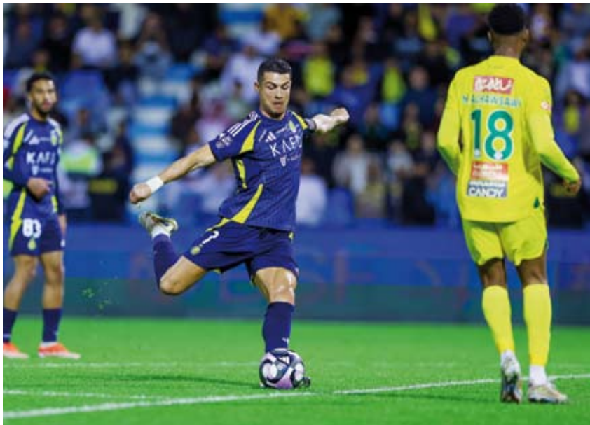
رونالدو يواصل التهديد مع النصر

مضيفه الخليج بنتيجة (1-3) على ملعب نادي الخليج في سيهات. وسجل البرتغالي كريستيانو رونالدو في الدقيقتين (65، +90) و (8)، وسلطان الغنام في الدقيقة (81) أهداف النصر، والبوناني كوستاس فورونيس من ركلة جزاء في الدقيقة (80) هدف الخليج.