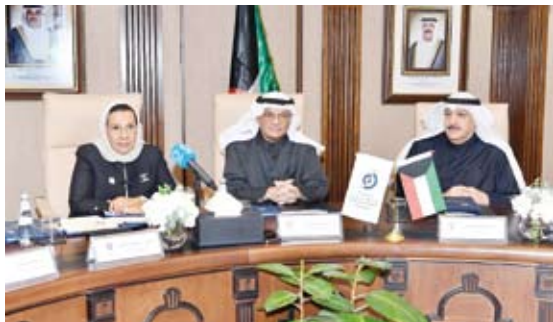
وزيرا الصحة والتعليم العالي ود. موزي الحمود

وقعت جامعة عبدالله السالم ووزارة الصحة اتفاقية إنشاء كلية الطب والعلوم الصحية (كلية الطب والعلوم الصحية) للعام الأكاديمي 2026-2027 بحضور وزير الصحة الدكتور أحمد العوضي ووزير التعليم العالي والبحث العلمي الدكتور نادر الجلال ورئيس المجلس التأسيسي للجامعة الدكتورة موزي الحمود.