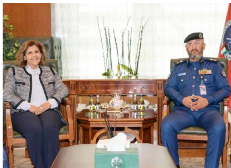
رئيس قوة الإطفاء العام ومساعد وزير الخارجية لشؤون حقوق الإنسان السفيرة الشبيخة جواهر ابراهيم دعيج الصباح

استقبل سعادة رئيس قوة الإطفاء العام اللواء طلال محمد الرومي مساعد وزير الخارجية لشؤون حقوق الإنسان سعادة السفيرة الشبيخة جواهر ابراهيم دعيج الصباح ورحب اللواء الرومي في سعادة السفيرة كما تم تباحث أوجه التعاون ذات الاهتمام المشترك في مجال حقوق الانسان وتمكين المرأة. من جهة أخرى ذكرت قوة الإطفاء العام أن فرق إطفاء مركزي الفروانية وصبحان سيطرت فجر أمس الأربعاء على حريق شقة في عمارة بمنطقة خيطان. وقالت «الإطفاء» إن الفرق باشرت بمكافحة الحريق والسيطرة عليه، وقد أسفر الحادث عن حالة إصابة وتم تسليم الموقع للجهات المختصة. من جهة أخرى أصيب 6 عمال آسيويين بحروق مختلفة إثر اندلاع حريق في أحد المطاعم بمنطقة السالمية، وجرى نقلهم إلى المستشفى للعلاج، فيما قام رجال الإطفاء بمكافحة الحريق والسيطرة عليه. من جهة أخرى شاركت القوة صباح مؤخرًا تمريناً عملياً في محطة الوحدة الغربية والذي نظمه الحرس الوطني بالتعاون مع وزارة الكهرباء والماء والذي تم من خلاله عملية إخلاء للمحطة و إقناع المصابين والسيطرة على الحريق الافتراضي الذي وضع ضمن سيناريو التمرين. ويهدف هذا التمرين على رفع مستوى جاهزية رجال الإطفاء للتعامل مع الحرائق التي قد تتعرض لها هذه المنشآت كما يهدف أيضاً إلى توحيد الجهود والتنسيق بين الجهات الحكومية ذات الصلة للتعامل مع هذه الحوادث