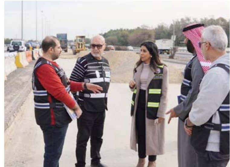
وزيرة الاشغال اثناء جولتها على طريق الفحيحيل