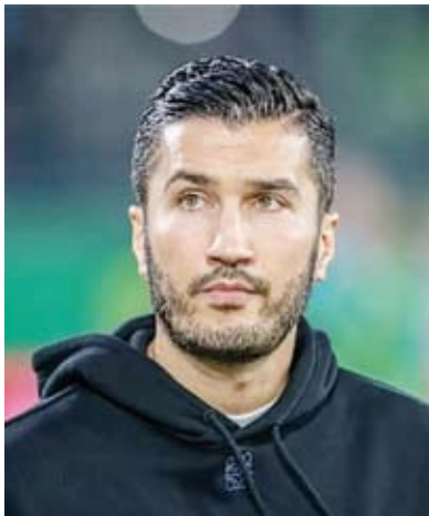
التركي نوري شاهين

أعلن نادي بروسيا دورتموند الألماني إقالة التركي نوري شاهين مدرب الفريق الأول لكرة القدم بالنادي، وذلك بسبب تراجع نتائج الفريق. وقال النادي: سيفصل بروسيا دورتموند ونوري شاهين، وسيعمل النادي في الوقت المناسب معلومات حول من سيكون على مقاعد البدلاء في مباراة السبت المقبل بالدوري الألماني ضد فيردر بريمن.