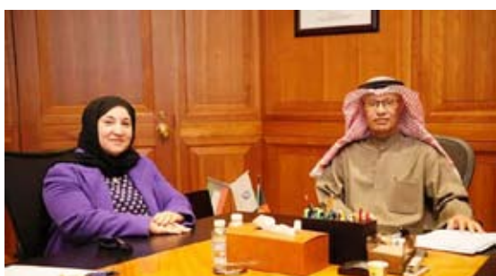
الزامل والوكيلة المساعدة

عقد وكيل وزارة الكهرباء والماء والطاقة المتجددة الدكتور عادل الزامل اجتماعاً مع عدد من الوكلاء المساعدين بقطاعات الوزارة المختصة بالكهرباء للاطلاع على الوضع الحالي للقطاعات والتحديات والمعوقات التي تواجههم والرؤية التطويرية لهم. وبدأ الاجتماع بكلمة ترحيبية بالوكلاء وتقدم لهم بجزيل الشكر على جهودهم في متابعة الأعمال بالقطاعات المكلفين بها والحرص على إيصال خدمات الوزارة للعملاء بأعلى جودة.