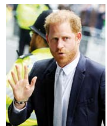
توصل الأمير هاري إلى تسوية مالية مع الجهة المالكة لصحيفة «ذي صن»، ينهي ملاحقات أطلقها الأمير ضد مجموعة روبرت مورودوك الإعلامية، وفق ما أعلن ديفيد شيربورن، محامي الإبن الأصغر للملك تشارلز الثالث. واعتذرت مجموعة «نيوز غروب نيوزبيبرز NGN» للأمير هاري عن «اختراق الهاتف والمراقبة وإساءة استخدام المعلومات الخاصة من جانب صحافيين ومحققين خاصين» يعملون لحساب المجموعة، وستدفع له «تعويضاً كبيراً»، بحسب ما أوضح المحامي أمام المحكمة العليا في لندن.

ويتهم الأمير هاري الصحيفتين الشعبيتين «ذي صن» و«نيوز أوف ذي وورلد»، التي توقفت عن الصدور، باستخدام أساليب غير قانونية، بما يشمل الاستعانة بمحققين خاصين، لجمع معلومات مقلات عنه قبل أكثر من عقد. وحقق دوق ساكس، الذي تخلى عن مسؤولياته في العائلة الملكية، انتصاراً كبيراً ضد الصحافة الشعبية في عام 2023 عندما حصل على إمانة ضد ناشر صحيفة «ديلي ميلور»، بشأن مقالات تستند إلى اختراق للرسائل الهاتفية. ولا تتعلق الإجراءات أمام المحكمة العليا في لندن بقضية التنصت على الهاتف، بعد أن قضى القاضي تيموثي فانتورث بأن المهلة الزمنية للتصرف في هذه النقطة قد انقضت.