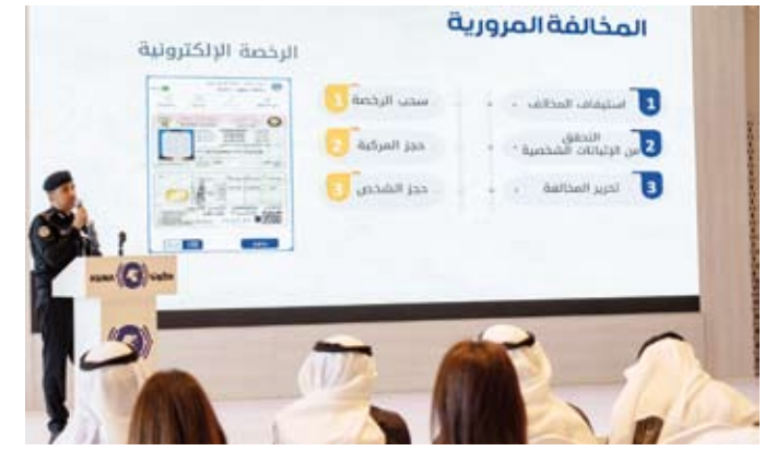
جانب من المحاضرة المرورية

حزام الأمان ب 152367 مخالفة، بينما بلغت أعداد مخالفات استخدام الهاتف وعدم الانتباه 79519 مخالفة فيما بلغ عدد مخالفات الأصوات المزعجة 27163 مخالفة يليها مخالفة الرعونة والتفريط والإهمال ب 11307 مخالفة.