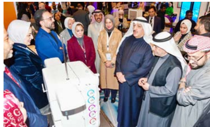
إجراء 71 عملية زراعة خلايا جذعية للأطفال خلال 4 سنوات