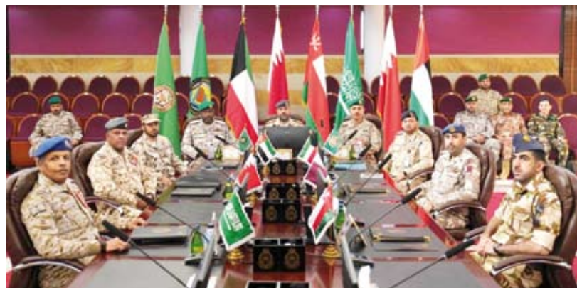
جانب من الاجتماع

أعلنت وزارة الدفاع اختتام أعمال الاجتماع الـ22 لمجموعة عمل حزام التعاون للقوات الجوية بدول مجلس التعاون لدول الخليج العربية بحضور القيادة العسكرية الموحدة