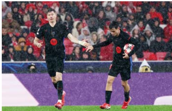
فوز ثمين لبرشلونة على بنفكيا