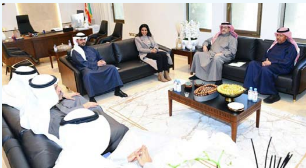
وزيرة الاشغال اثناء اجتماعها والمحافظين

عقدت وزيرة الأشغال العامة د.نورة المشعان، اجتماعاً مع المحافظين لبحث سبل تعزيز التعاون المشترك مع المحافظات. وتناول الاجتماع أبرز التحديات التي تواجه البنى التحتية بما في ذلك صيانة الطرق ومناقشة المشاريع والخطط المستقبلية وآلية تنفيذها. وبحسب بيان صادر عن محافظة الفروانية أمس الأربعاء، إذ شارك محافظ الفروانية الشيخ عذبي الناصر العذبي الصباح في الاجتماع. وبحسب البيان تناول الاجتماع سبل تطوير الخدمات العامة والاهتمام بالطرق والبنى التحتية، وصيانتها، لتنفيذ السياسة العامة للدولة بما يتوافق مع توجهات القيادة السياسية ويرقى لتطلعات المواطنين في جميع المحافظات. ووفق البيان أكد الشيخ عذبي الصباح أهمية التعاون المشترك بين وزارة الأشغال العامة والمحافظات لتسريع إنجاز المشاريع التنموية. وتمن محافظ الفروانية جهود وزيرة الأشغال وحرصها على إنجاز كل المشاريع التي من شأنها توفير جودة الحياة وتحقيق التنمية المستدامة.