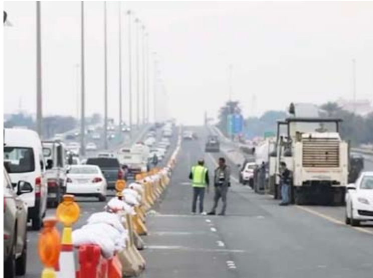
جانب من الاعمال في مشروع طريق الفحيحيل