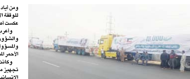
شاحنات متوجهة إلى غزة

وكانت مصر قد أعلنت الأحد الماضي تجهيز مئات الشاحنات من المساعدات الإنسانية والإغاثية استعداداً لدخولها إلى قطاع غزة وذلك عقب دخول اتفاق إيقاف إطلاق النار حيز التنفيذ. وبذلت مصر وقطر والولايات المتحدة جهوداً مضنية «للتوصل إلى اتفاق إيقاف إطلاق النار وتبادل الأسرى بين حركة حماس والاحتلال.