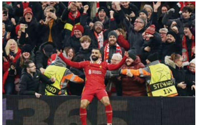
محمد صلاح يحتفل بالفهد الأول