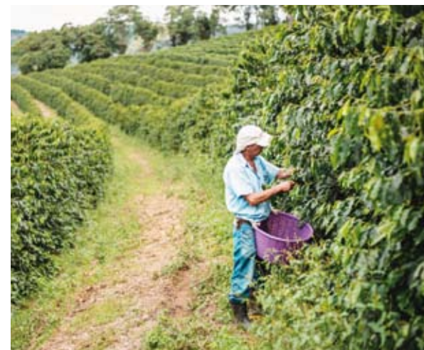
مزارع القهوة في البرازيل

يتوقع أن يؤدي الجفاف الناجم عن التغيير المناخي في البرازيل، أكبر منتج ومصدر للقهوة على مستوى العالم، إلى ارتفاع قياسي لأسعار السلعة في مختلف أنحاء المعمورة، بسبب ما سيحدثه نقص المعروف مع ارتفاع الطلب وفق قواعد الاقتصاد. ففي صبيحة أحد أيام سبتمبر 2024، أتت النيران على إحدى مزارع البن، فتأثرت مئات المزارع الأخرى بهذا الحريق، وهو الأسوأ على الإطلاق الذي تم تسجيله في كاكوندزي، المدينة التي تشهد أكبر إنتاج للبن في ولاية ساو باولو جنوب شرق البلاد. ورغم أن الحريق بدأ على الأرجح من كومة قمامة أضرم النار فيها أحد السكان، إلا أن انتشاره الدمار والخارج عن السيطرة بالكامل يرجع في المقام الأول إلى الجفاف الشديد الذي ضرب البرازيل العام الماضي، مع ارتفاع درجات الحرارة.