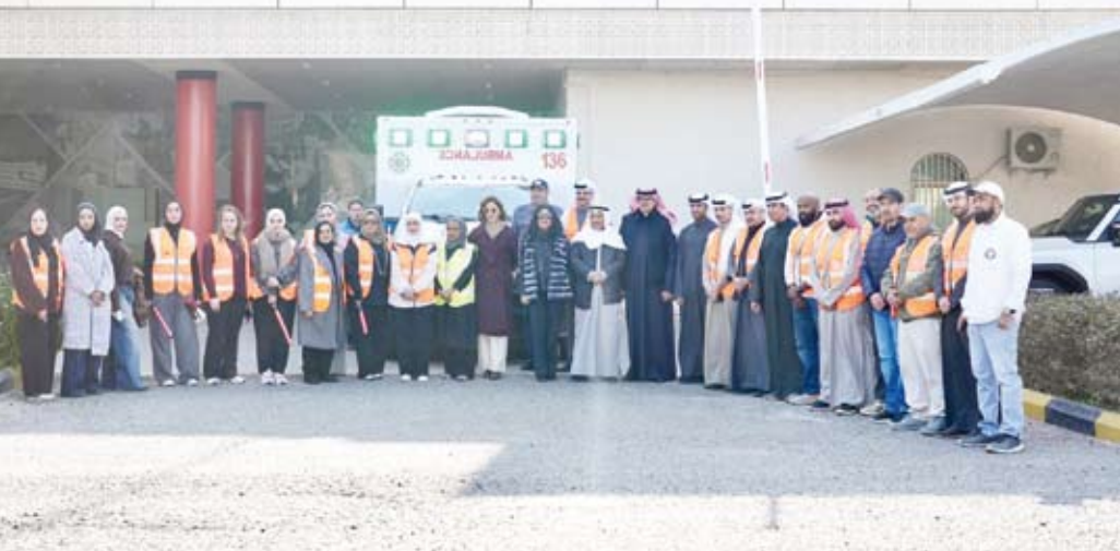
المشاركون في صورة جماعية