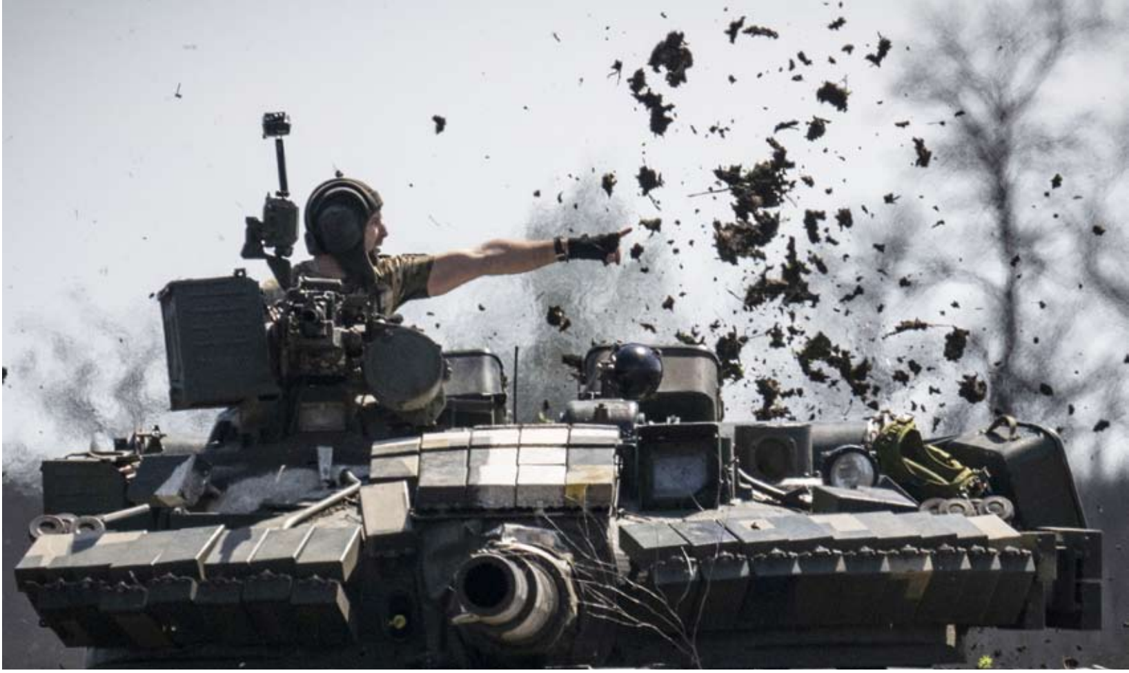
العناصر المسلحة في البلدين تتقاتل منذ سنوات

قال المبعوث الأميركي ستيف ويتكوف إنه متفائل بشأن قرب التوصل إلى اتفاق بشأن أوكرانيا، وذلك قبل لقاء مقرر مع الرئيس الروسي فلاديمير بوتين في موسكو. وأضاف ويتكوف في كلمته خلال المنتدى الاقتصادي العالمي في دافوس إنه سيسافر إلى موسكو في وقت لاحق لبحث إنهاء الحرب في أوكرانيا. وقال المبعوث الأميركي "أظن أنها باتت تقتصر على مسألة واحدة وقد ناقشنا صيغا لهذه المسألة، ما يعني أنه من الممكن حلها. وإذا ما آزاد الطرفان تسوية الأمر، فسنقوم بتسويته". ولم يقدم ويتكوف أي تفاصيل إضافية. وأضاف أن إنشاء منطقة معفاة من الرسوم الجمركية في أوكرانيا سيكون بمثابة "تغيير في قواعد اللعبة" بالنسبة لاقتصاد البلاد. وفي وقت سابق قال بوتين، في اجتماع لمجلس الأمن الروسي، إنه سيجتمع مع المبعوثين الأميركيين ويتكوف وجاريد كوشنر، في موسكو "لحوالة الحوار بشأن التسوية الأوكرانية"، إضافة إلى مناقشة فكرة "مجلس السلام" التي طرحها الرئيس الأميركي دونالد ترامب وإمكانية استخدام الأصول الروسية المجمدة. وتجري الولايات المتحدة محادثات مع روسيا، وبشكل منفصل مع كييف وعدد من القادة الأوروبيين بشأن مسودات مختلفة