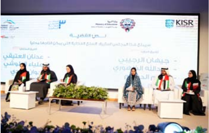
جانب من المشاركين

وأكد أن الملتقى يمثل محطة مهمة في مسيرة دعم الموهوبين على مستوى دول مجلس التعاون الخليجي ويؤسس لنسخ قادمة أكثر توسعاً وتأثيراً بما يعزز مكانة دولة الكويت كمركز إقليمي لاحتضان العقول المبدعة وصناعة المستقبل المستدام.