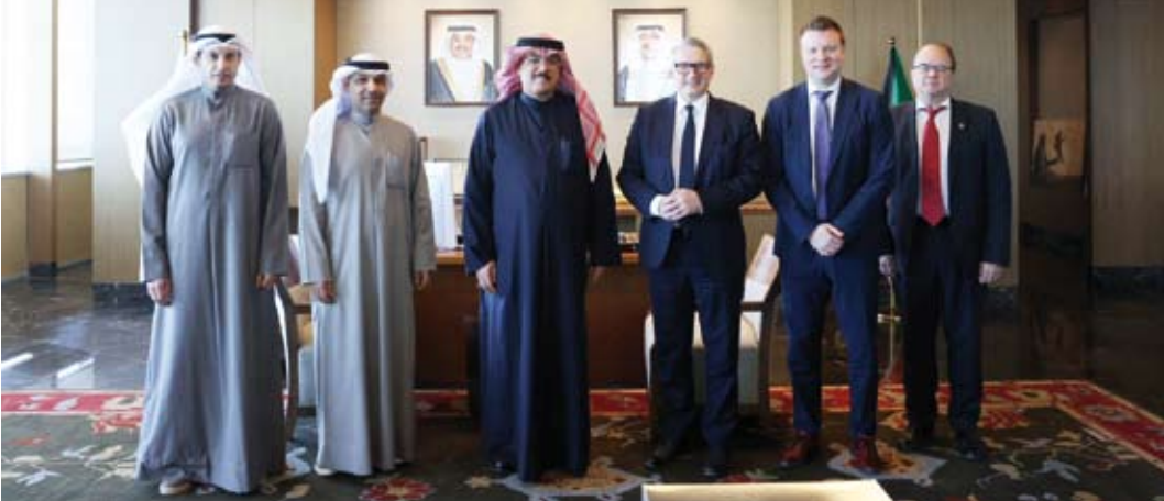
الطبطبائي مستقبلاً السفير والوفد المرافق

بحث وزير التربية سيد جلال الطبطبائي مع سفير جمهورية فنلندا لدى دولة قطر غير المقيم لدى دولة الكويت يوها مستونين وعضو البرلمان الفنلندي ورئيس مجموعة الصداقة الفنلندية-القطرية في البرلمان الفنلندي فيلي سكيناري والمستشار التجاري في سفارة فنلندا بالدوحة كيمو لاسونين تعزيزاً لأطر التعاون المشترك في المجال التعليمي وتبادل الخبرات. وذكرت وزارة التربية في بيان صحفي اليوم الخميس أنه جرى خلال اللقاء بحث سبل تطوير التعاون الثنائي في القطاع التعليمي ومناقشة عدد من الموضوعات ذات الاهتمام المشترك بما يسهم في دعم تطوير التعليم والاستفادة من التجربة الفنلندية الرائدة في هذا المجال وتعزيز الشراكات المستقبلية بين المؤسسات التعليمية في البلدين.