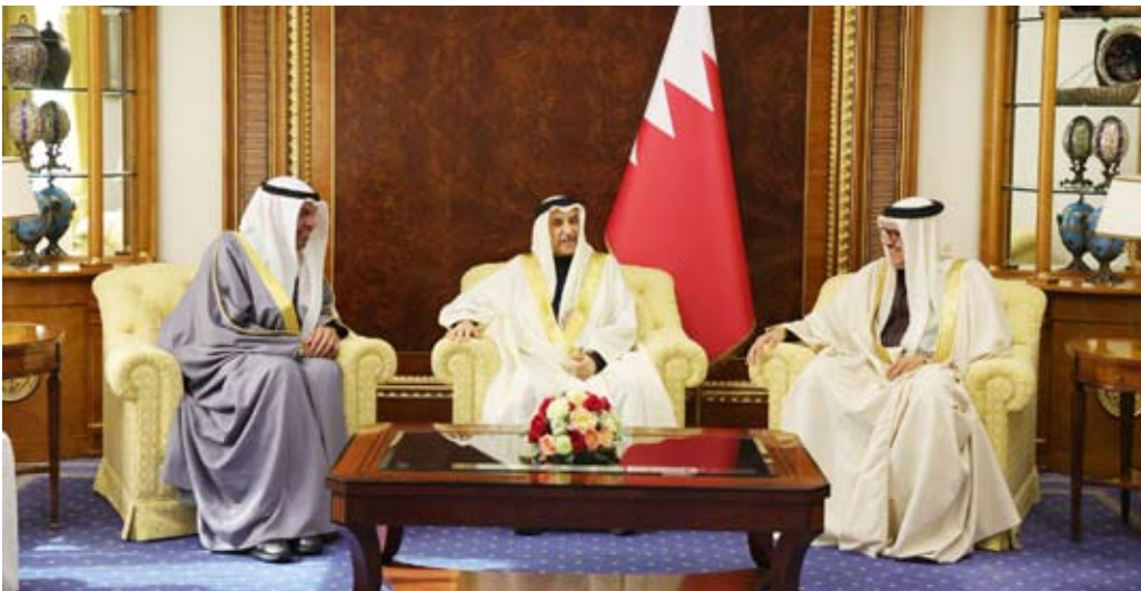
جانب من لقاء آل خليفة واليحييا أمس

خليفة ، وتم خلال اللقاء بحث العلاقات الأخوية المتينة التي تربط البلدين الشقيقين وسبل تعزيزها وتطويرها في مختلف المجالات. كما التقى وزير الخارجية عبدالله اليحيا ووزير الداخلية بمملكة البحرين الشقيقة الشيخ راشد بن عبدالله آل