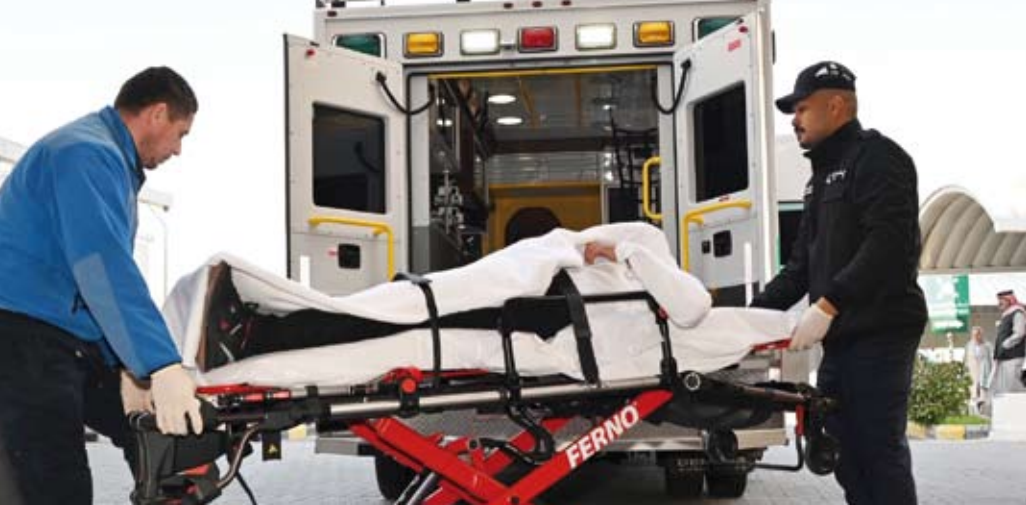
جانب من عملية الإخلاء الوهمي