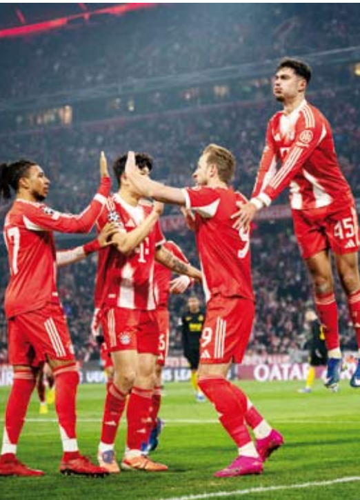
هاري كين يحتفل بالتسجيل

سجل هاري كين هدارف أيرن ميونخ هدفين في ثلاث أسابيع ليقود فريقه للفوز 2- 0 أمام أودينسا في ضيفه البلجيكي في دوري طال أوروبا، ليحجز مقعده في مرحلة خروج المغلوب قبل بضعة أيام من انتهاء سجل كين هدفه الأول من سلسلة من خمسة أهداف قريب من تمريره عن عشرين من ركلة كنية قذفها مايكل أوديس في الدقيقة 52، وأضاف هدفه الثاني من ركلة جزاء في الدقيقة 55 بعد تعرضه لعرقلة.