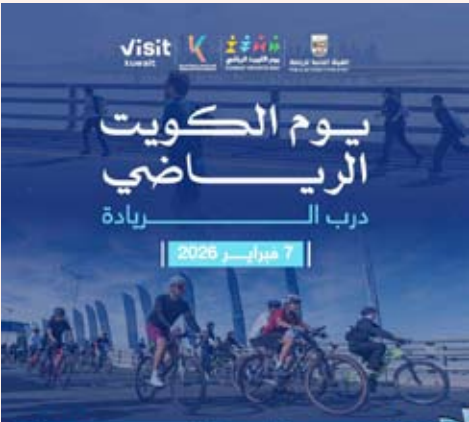
فتح باب التسجيل ليوم الكويت الرياضي

أعلن الاتحاد الكويتي للرياضة للجميع عن بدء التسجيل للمشاركة في فعاليات يوم الكويت الرياضي المقرر إقامته يوم 7 فبراير المقبل على جسس (الشيخ جابر الأحمد) برعاية وزير الاعلام والثقافة وزير الدولة لشؤون الشباب عبدالرحمن المطيري.