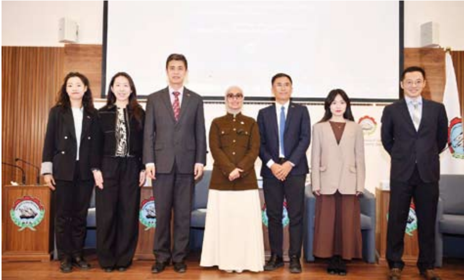
مشاركون في الندوة

♦ شركات صينية تنفذ مشاريع حيوية بالكويت في الطاقة والإسكان