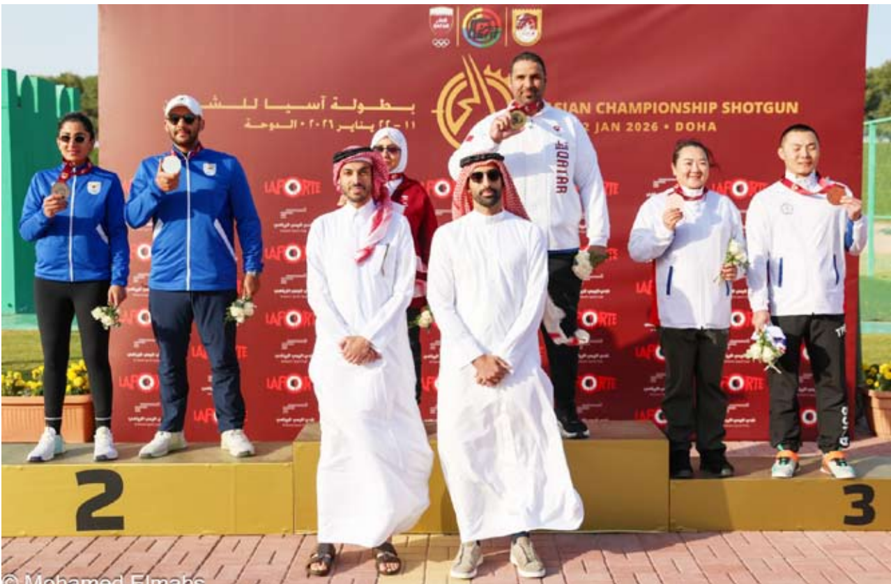
منافسات قوية شهدت بطولة آسيا للشوزن الدوحة 2026

توج المنتخب القطري بالميدالية الذهبية لمسابقة التراب للفرق مختلط وحقق رقما قياسيا آسيويا عالميا جديدا في ختام بطولة آسيا للشوزن الدوحة 2026 التي أقيمت على مجمع ميادين لوسيل للرماية طيلة 11 يوما، وسط مشاركة 196 راميا ورامية يمثلون 17 دولة تنافسوا في مسابقتي السكيت والتراب لفئات فردي وزوجي الرجال والسيدات والشباب والشابات والفرق مختلط.