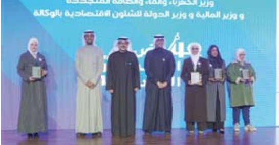
تنويع الفائزات بجائزة الاستدامة

وتأتي جهود بيت التمويل الكويتي في تنظيم وتخصيص جائزة الاستدامة البيئية في إطار الحرص على تشجيع المبادرات التي تهتم بالاستدامة والبيئة ضمن حملة Keep it Green، وتعتبر عن الاستراتيجية المتكاملة للبنك بالاستدامة والالتزام بالمعايير البيئية والاجتماعية والحوكمة.