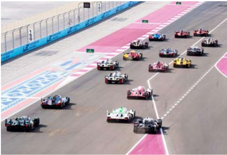
موسم 2026 يشهد مشاركة 35 سيارة طوال الموسم

تواصل حلبة لوسيل الدولية استعداداتها لإطلاق موسم 2026 بزخم عال، حيث تتاهب دولة قطر لاستضافة التجارب الأوليّة والسباق الافتتاحي لبطولة العالم لسباقات التحمل للعام الثالث على التوالي.