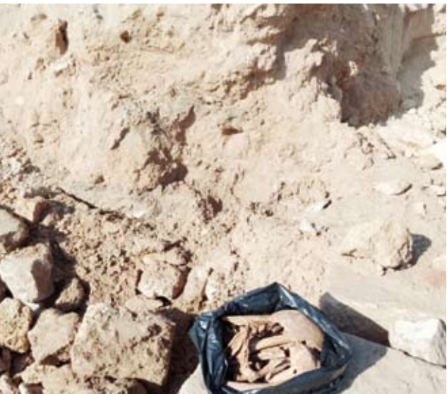
جانب من الآثار المكتشفة

أعلنت وزارة الشؤون الثقافية في تونس أمس اكتشاف عدد من القطع الأثرية في سواحل محافظتي نابل والمهدية على إثر الوضع المناخي الاستثنائي الذي عاشته تونس منذ أيام حيث تسببت الأمواج القوية بالمناطق الساحلية في تراجع مستوى البحر في هذه المناطق.