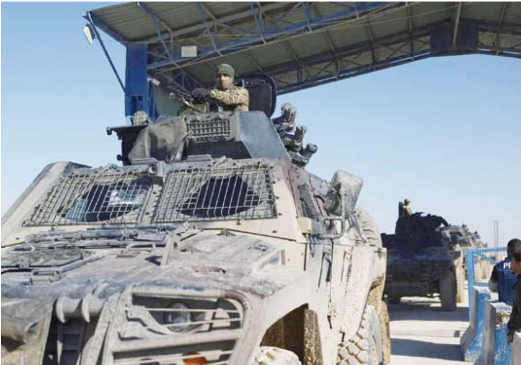
عربات مدرعة تابعة للجيش السوري بمخيم الهول

مهلة وقف إطلاق النار. وطالب وزير الدفاع السوري عناصر «قسد» بوقف عمليات الاعتقال على الفور، وإطلاق سراح جميع المعتقلين من أهالي منطقة الحسكة.