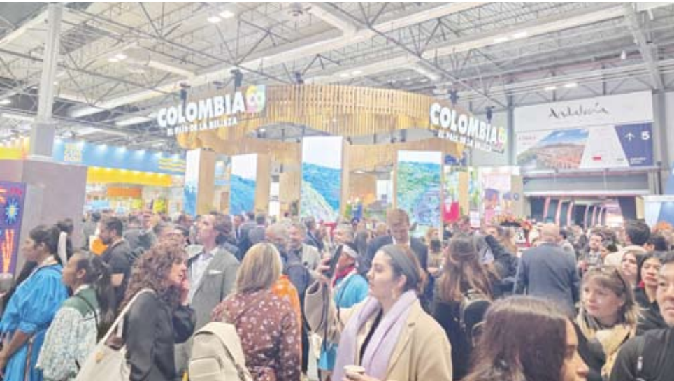
حضور دولي واسع