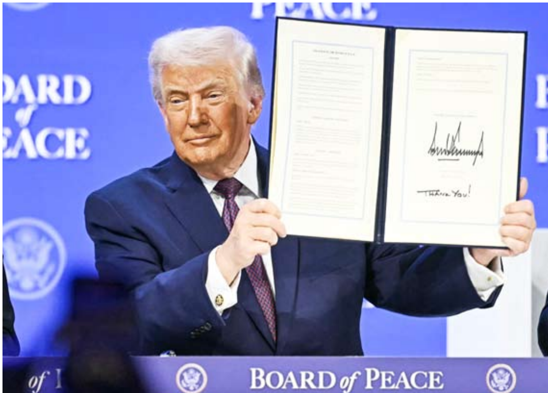
الرئيس الأمريكي ترامب يوقع ميثاق مجلس السلام

يترافق ذلك مع الحديث عن فتح معبر رفح الحدودي بين مصر وقطاع غزة الأسبوع المقبل في الاتجاهين للمرة الأولى منذ توقيع اتفاق شرم الشيخ.. فهل تشهد غزة انفراجة سياسية وإنسانية في القريب العاجل؟!