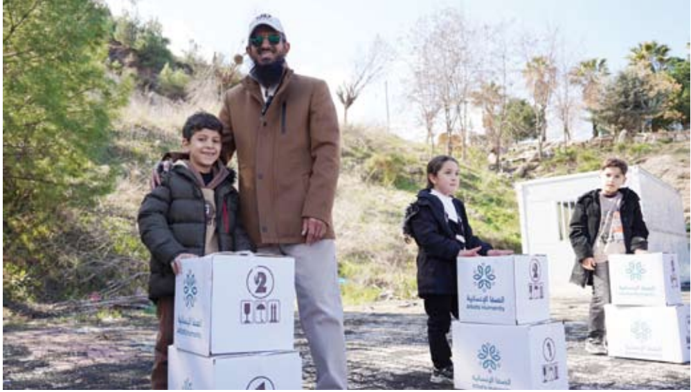
الشايح خلال أحد المشاركات

أفراد، وتكفي احتياجاتهم الغذائية طوال شهر رمضان، وبكلفة تبدأ من 20 ديناراً كويتيًّا. وبيّن أن المشروع سيُنَفَّذ هذا العام في 13 دولة تشمل: الكويت، قبر غيزيا، فلسطين، تركيا، اليمن، لبنان، الهند، سريلانكا، بنغلاديش، النيجر، تشاد، الصومال، ومالي، لافتًا إلى أن الأوضاع الإنسانية الصعبة التي يعيشها كثير من الأسر في هذه الدول، وافتقارهم لأبسط مقومات الحياة الكريمة، تستوجب تكاتف الجهود ومضاعفة العمل الإنساني لتخفيف معاناتهم. وأكد الشايح أن لهذا المشروع أثرًا بالغًا في التخفيف من الأعباء المعيشية