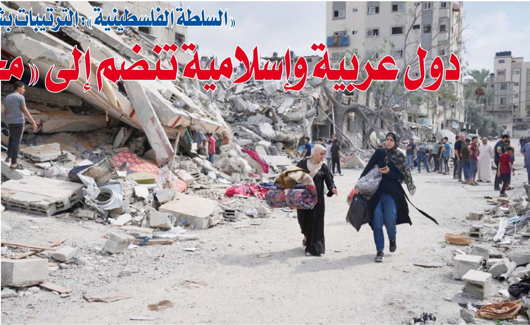
معاينة الفلسطينيين مستمرة بسبب الحصار