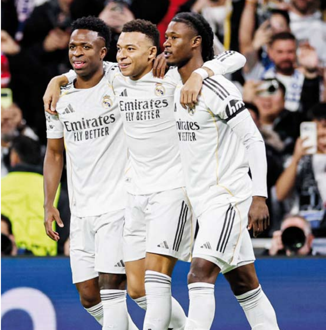
نجوم ريال مدريد فشلوا في تحقيق أي لقب كبير الموسم الماضي

حافظ زبال مدير الاداري لجمعية صادراته لقائمة أغنى أثرياء كرة القدم في العالم، هي حين جئت لتلقي الإغتراب الإنجليزي على مواطنيه للمرة الأولى، وذلك وفقاً للدراسة «ديلويت ماني لينج». وحقق الاتحاد الإسباني إيرادات بلغت نحو 1.4 مليار دولار في موسم