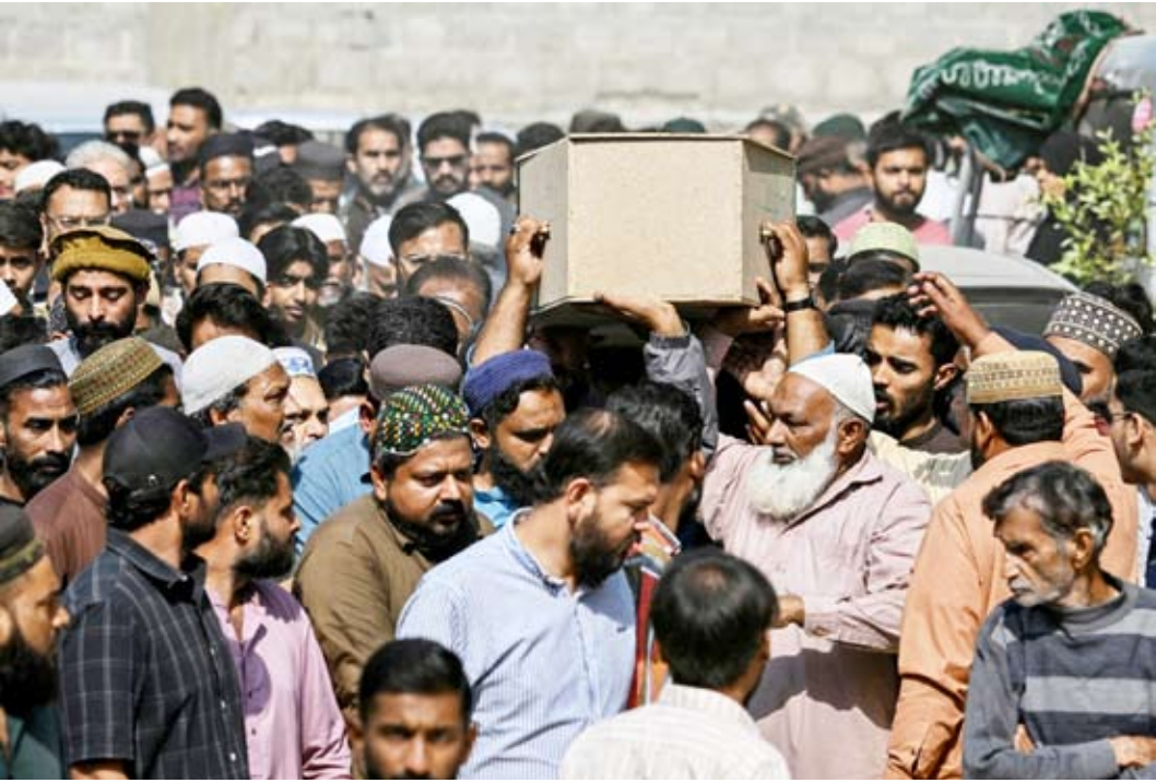
مشيعون يحملون نعش أحد ضحايا الحريق

وصرحت للصحفيين من أمام مشرحة المستشفى «سنسلم الجثث للأسر بعد مقارنة عينات الحمض النووي» وتحديد هوياتها. من جهتها، انتقدت أسر الضحايا السلطات على بطء عمليات البحث في المركز التجاري التي تتواصل بين الانقراض المتفحمة. وكثيرا ما تشهد أسواق كراتشي ومصانعها المعروفة ببنائها التحتية المتداعية حرائق، لكن نادرا ما تقع حوادث بهذه الجسامية.