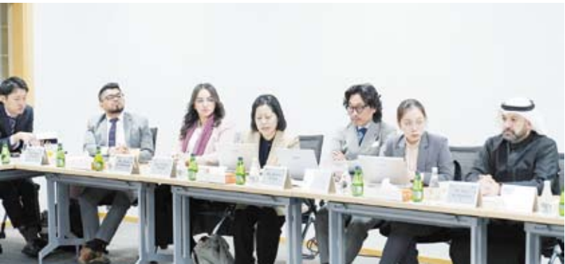
جانب من ورشة العمل

استضافت مؤسسة الكويت للتقدم العلمي ورشة عمل بعنوان الطريق نحو إزالة الكربون: تطوير آلية سياسة الكربون للكويت بالتعاون مع معهد الكويت للأبحاث العلمية ومعهد وشركة ميتسو ييشي اليابانيين بهدف إطلاق حوار وطني حول تطوير سياسات كربون تتلاءم مع السبيل الاقتصادي والمؤسسي للدولة. وقالت المؤسسة في بيان صحفي أمس إن الورشة جمعت نخبة باحثين وخبراء من اليابان وفنطراهم من معهد الكويت للأبحاث العلمية وممثلين عن السفارة اليابانية ومنظمة التجارة الخارجية اليابانية ومؤسسة البترول الكويتية والهيئة العامة للبيئة ووزارة الكهرباء والماء والطاقة المتجددة وبرنامج الأمم المتحدة الإنمائي لتعزيز تبادل الخبرات في المسار المناخي. وأضافت أن المناقشات ركزت على تقديم البلاد نحو رؤية (الكويت 2035) وتعزيز تنفيذ