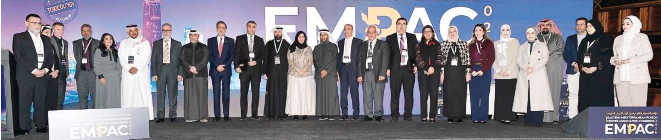
جانب من المشاركين

تاكيدا على الكفاءة المحورية لطب السموم ضمن منظومة الطوارئ الوطنية ودوره الأساسي في دعم اتخاذ القرار السريري في