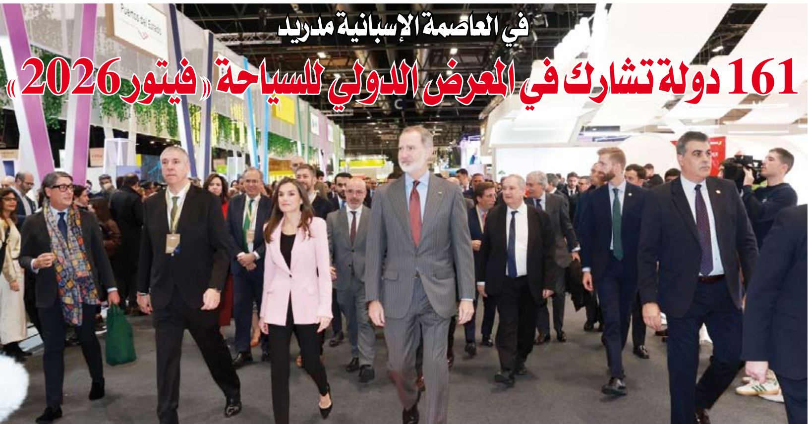
ملك إسبانيا يفتتح فعاليات المعرض