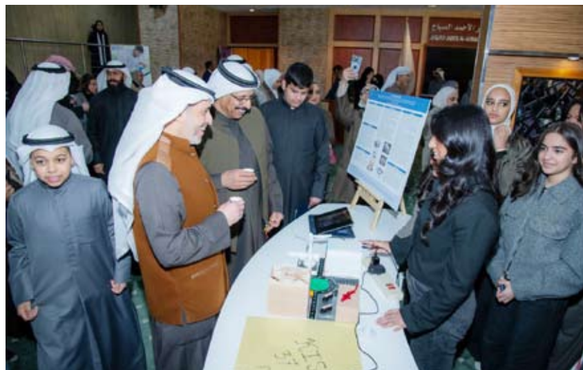
الحميديان يطلع على أحد المشاريع المشاركة

المخبرية وتشكيل النماذج العلمية التي تحفز التفكير النقدي والإبداعي. وأضافت الفيلكاوي أن البرنامج التدريبي تضمن أنشطة تطبيقية تعزز الربط بين المعرفة النظرية والتجربة العملية بما يسهم في صقل مهارات الطلاب وتشجيعهم على الاستكشاف والتعلم الذاتي.