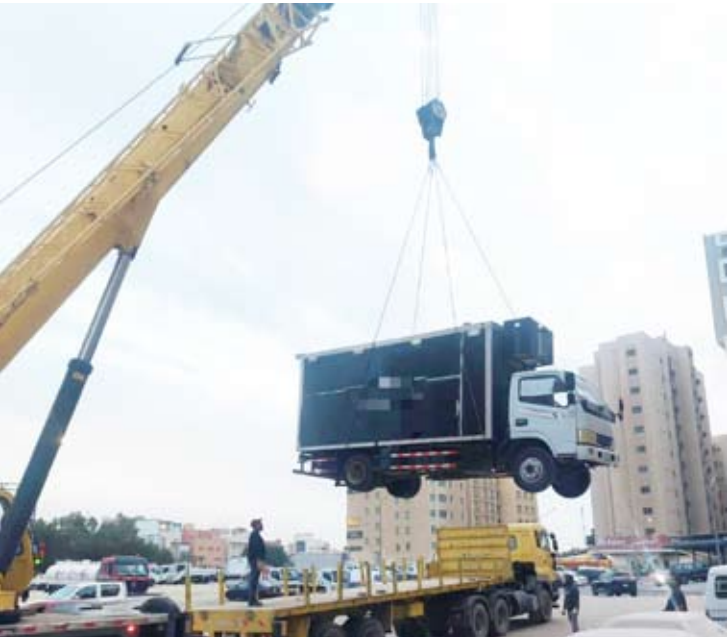
رفع بقالة متقلبة مخالفة

النظافة وكل ما يعمل على إعاقة الطريق ويشوه المنظر العام ومنع رمي النفايات خارج الحاويات. وقد أسفرت الجولة عن رفع 14 سيارة مهمله وسكراب بالإضافة إلى عدد 2 فود ترك مخالف تم رفعهم وإرسالهم إلى موقع الحجز وتم الإفراج عن 5 سيارات وتحرير 11 مخالفة نظافة عامة واشغالات طرق ومخالفة عدد 3 باعة متجولين بالإضافة إلى توجيه 95 إنذار لالازالة تضمنت سيارات مهمله وحوايات تجارية. .