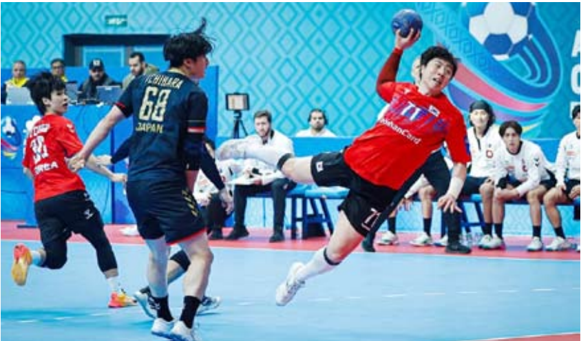
منافسات قوية يشهدها كأس آسيا لكرة اليد

تعادل منتخبا اليابان وكوريا الجنوبية بنتيجة (23-23) ضمن المجموعة الأولى للدور الرئيسي من كأس آسيا لكرة اليد الـ22 المؤهلة لكأس العالم (المانيآ 2027) التي تستضيفها دولة الكويت حاليا.