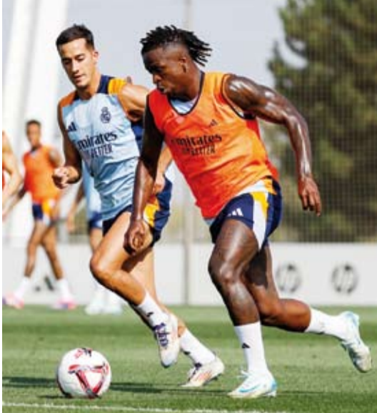
جانب من تدريبات الريال

يبحث ريال مدريد عن استعادة توازنه عندما يواجه بلد الوليد. وفشل الريال في الفوز في أول جولة له بالدوري هذا الموسم حيث اكتفى بالتعادل مع ريال مايوركا. ولم يقدم ريال مدريد العرض المنتظر منه في مواجهة الافتتاحية، رغم أن الفريق كان قد قدم عرضا جيدا أمام أتلانتا في مباراة كأس السوبر الأوروبي والتي توج بلقبها عقب فوزه بهدفين نظيفين في أول ظهور لنجمه الفرنسي كيليان مبابي. ورغم أن حامل اللقب يملك خط هجوم قوي للغاية خاصة بعد انضمام كيليان مبابي لروديغو وفينيسيوس جونيور وجود بيلينغهام، لكن الفريق فشل في تسجيل أكثر من هدف أمام مايوركا، وهو الأمر الذي يسعي الإيطالي كارلو أنشيلوتي لتداركه أمام بلد الوليد. وسيخسر ريال مدريد