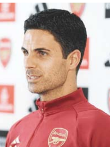
الإسباني ميكل أرتيتا

بنوي أرسنال الإنجليزي تمديد تعاقد مع مدربه الإسباني ميكل أرتيتا لفترة طويلة، وذلك وفقا لما نشرته شبكة "سكاي سبورتنس". وتجسد علاقة أرتيتا (42 عاما) بالأميركي ستان كروتكي مالك النادي، والبرازيلي إيدو المدير الرياضي لأرسنال قوة للغاية لدرجة أن المحادثات الرسمية لا يُنظر إليها على أنها ضرورية. وكتب الموقع الرسمي للشبكة الشهيرة: كانت هناك محادثات جيدة جدا، وهناك قناعة بأن النادي سيكون قوة أعظم في السنوات القادمة تحت قيادة أرتيتا، وينتهي تعاقد أرتيتا مع أرسنال العام القادم، لكن لم يكن هناك أي اندفاع من جانبه أو من جانب النادي في تمديد التعاقد، حيث يوجد توافق تام في الرؤية، وبالتالي لا يوجد ما يدعو للاسراع في عملية المفاوضات. وقال أرتيتا في وقت سابق إن تمديد عقده سيحدث بطريقة "طبيعية"، مشيرا إلى أن تركيزه هو وإيدو يدور حول إعادة تقييم الفريق وضمان بداية قوية للموسم الجديد.