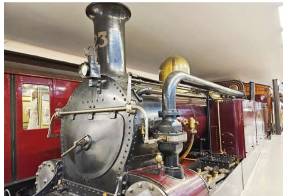
قطار أنفاق عمل بالبخار 1866

وتخدم الشبكة في الوقت الحاضر ما يربو على 1.3 مليار راكب سنوياً ويبلغ عدد محطاتها 272 محطة فيما يبلغ عدد خطوط السير 15 خطاً وهي مستمرة في التطوير والنمو وتصف ثاني أكبر نظام في العالم بعد شبكة قطارات الأنفاق في شنغهاي الصينية.