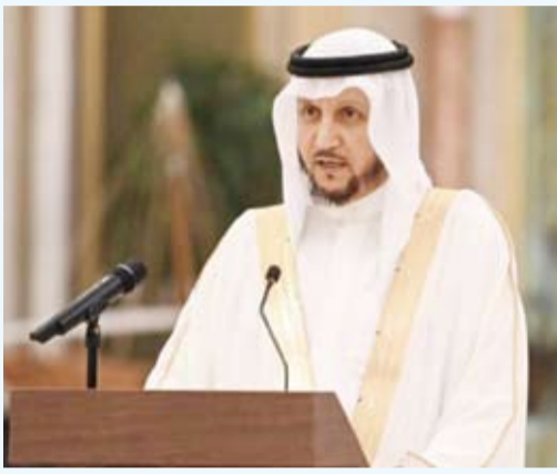
الوزير شريدة المعوشي

أكد نائب رئيس مجلس الوزراء وزير الدولة لشؤون مجلس الوزراء شريدة المعوشي أنه ستتم محاسبة المتسبب بحادث انهيار العمارة في منطقة الجابرية وكل مخطئ سينال جزاءه، مضيفاً بهذا الشأن أننا الآن بانتظار التقرير النهائي بشأن هذا الحادث.