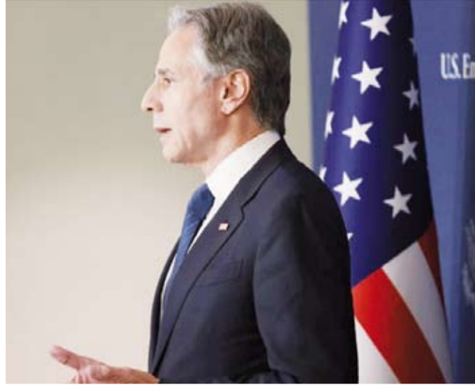
بليكن بث تغاؤلاً لاعتبارات سياسية أمريكية داخلية

والأحد، أكد نتنياهو إصراره على إبقاء سيطرة قواته على محور فيلا دلفيا، واتهمه زعيم المعارضة يائير لابيد، بالمطالبة وتخريب المفاوضات.