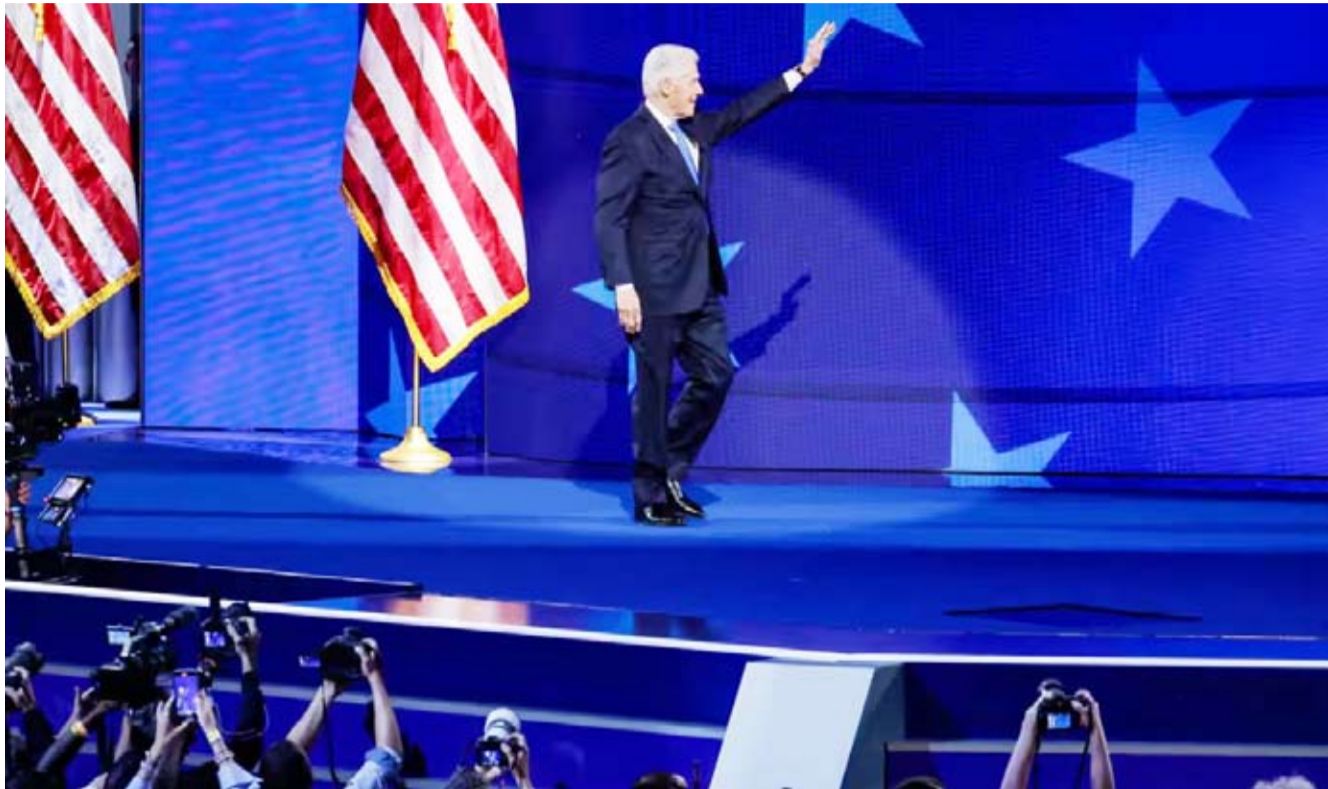
الرئيس الأمريكي الأسبق بيل كلينتون

بارئيس الحالي جو بايدن وقراره الأخير بالانسحاب من السباق الرئاسي مشيراً إلى أن ذلك «سيعزز من إرثه السياسي». واعتبر أن قرار هاريس بالترشح لانتخابات الرئاسة كان قراراً صحيحاً مؤكداً أنه سيكون «سعيداً جداً» حين تدخل البيت الأبيض برئاسة للبلاد. وأضاف «يجب علينا اختيار رئيس يقدم لأجبلنا مستقبلاً أفضل