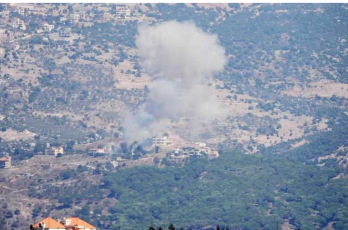
غارات إسرائيلية على جنوب لبنان

أفاد حزب الله -أمس- بقصف 5 مواقع شمالي إسرائيل، مؤكداً تحقيق إصابات مباشرة، بعد سلسلة غارات إسرائيلية استهدفت قرى جنوب لبنان بعد منتصف الليل. وأضاف الحزب أنه قصف بقذائف المدفعية الثقيلة ثكنة برانيت، وبالمسيرات الانتحاضية تموضعات لجنود إسرائيليين في مستوطنة كريات شمونة، كما استهدف مواقع لجنود إسرائيليين في محيط موقع المطل. وأشار إلى أنه استهدف بمسيرة انتحاضية تجهيزات تجسسية في موقع جبل العلام، مؤكداً إصابته بشكل مباشر. وقال إنه استهدف تجمعاً لجنود الاحتلال في محيط موقع الجرج، مؤكداً إيقاعهم بين قتيل وجريح.