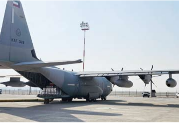
جانب من إقلاع الطائرة