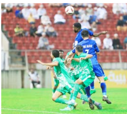
6- انطلاقة قوية للدوري العماني

حقق فريقا النصر وعمان فوزين مستحقين في ختام مباريات الجولة الثانية من بطولة الدوري العماني الممتاز لكرة القدم.