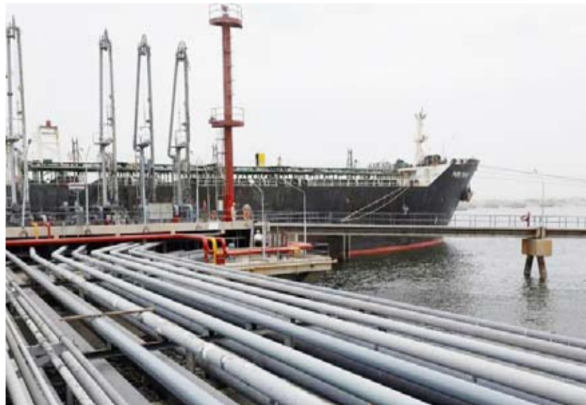
صادرات النفط الروسي إلى الهند زادت خلال الشهر الماضي

تخطت الهند الصين واحتلت صدارة مستوردي النفط الروسي في يوليو الماضي، وذلك في الوقت الذي تقلص فيه شركات التكرير الصينية مشترياتها بسبب انخفاض هوامش الربح من إنتاج الوقود. وأظهرت بيانات الشحنات الهندية من مصادر بقطاعي التجارة والنفط أن الخام الروسي استحوذ على حصة غير مسبوقة بلغت 44% من إجمالي واردات الهند الشهر الماضي، إذ ارتفع إلى مستوى قياسي بلغ 2.07 مليون برميل يوميا، بزيادة 4.2% على يونيو و12% عن المستوى قبل أكثر من عام.