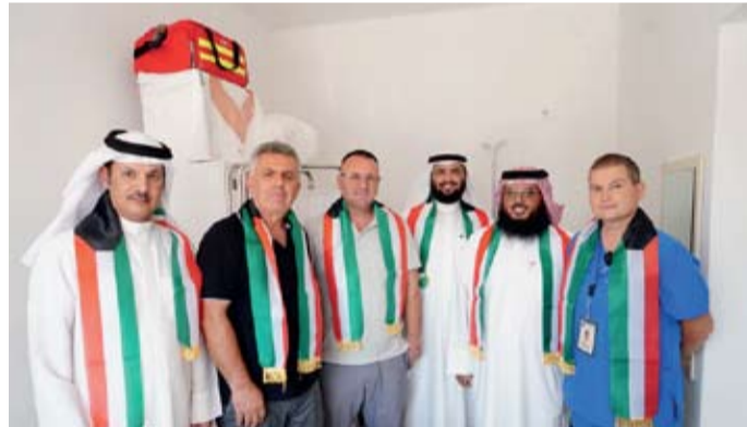
وفد «عطاء» خلال افتتاح المستوصف الطبي

داعية جمعية عطاء وخص بالشكر وزارة الشؤون الخارجية وسفارات الكويت بالخارج على دعمهم للعمل الإنساني.