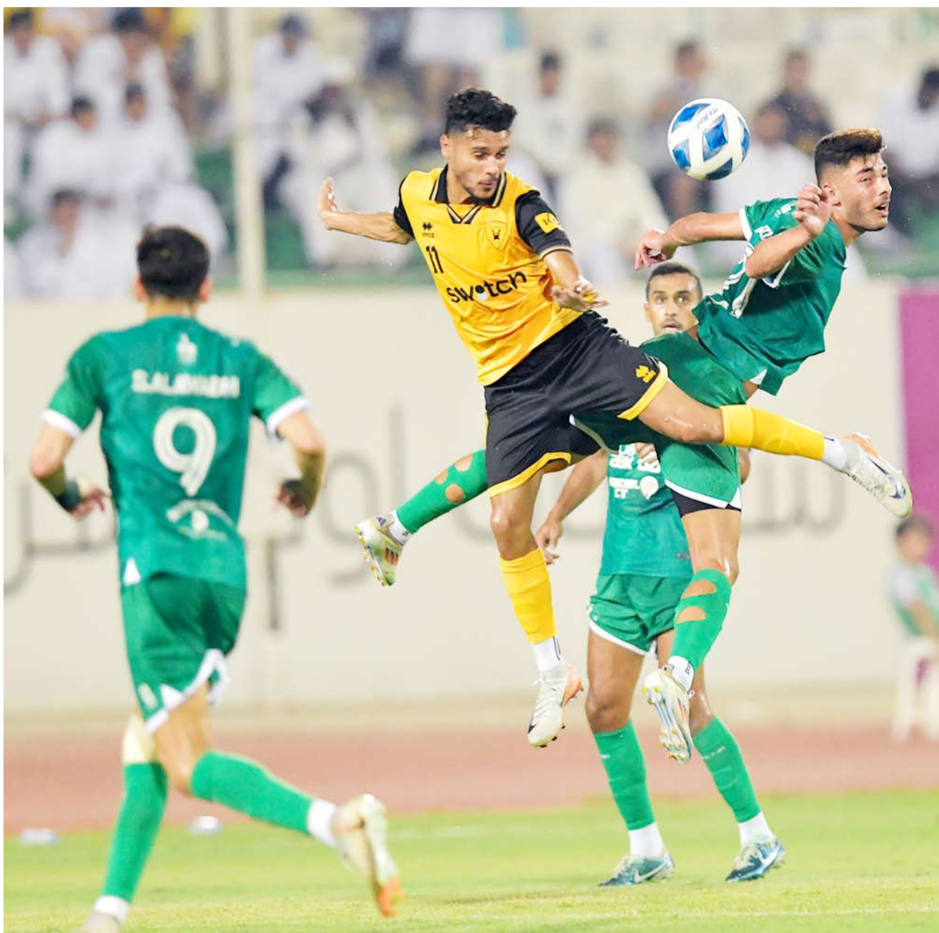
ديربي مثير بين القادسية والعربي