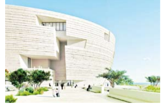
متحف لوسيل المستقبلي

جدير بالذكر، أن جيروم، هو واحد من أشهر الفنانين الأوروبيين الناجحين تسويقياً في القرن التاسع عشر، وقد عرف في زمانه بصفته رساماً يتناول التاريخ في أعماله، فضلاً على كونه راوياً بصرياً، من خلال إحياء عالمي اليونان القديمة