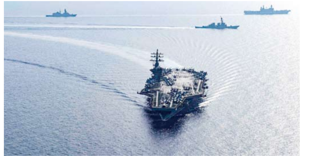
حاملة الطائرات الأميركية «إيزنهاور» مع مجموعتها القتالية في البحر الأحمر

ومن المفترض أن تحلّ ليكولن محلّ حاملة الطائرات «يو إس إس ثوبور روزفلت». والأربعاء، قالت القيادة العسكرية الأميركية لمنطقة الشرق الأوسط «ستكوم» في بيان إن «حاملة الطائرات يو إس إس أبراهام ليكولن، المجهزة بمقاتلات إف 35-سي وإف /إيه18-بلوك 3، دخلت نطاق مسؤولية ستكوم». وأضافت أن ليكولن «هي السفينة الرئيسية في مجموعة حاملة الطائرات الضاربة الثالثة، ويرافقها أسطول المدمرات (ديسون) 21 وجناح حامل الطائرات (سي في ديليو) التاسع». وكانت وزارة الدفاع الأميركية (البيتاغون) أعلنت في 11 أغسطس أن أوستن أمر الحاملة ليكولن «بتسريع انتقالها» إلى الشرق الأوسط، بعد أن كان قد أمر بإرسالها إلى المنطقة في بداية تصعيد عسكري كبير في المنطقة منذ توعد حزب الله وحليفته إيران بالرّد على الإغتيال للذين حصلوا في الضاحية الجنوبية لبيروت وطهران في نهاية يوليو الماضي بفارق بضع ساعات فقط.