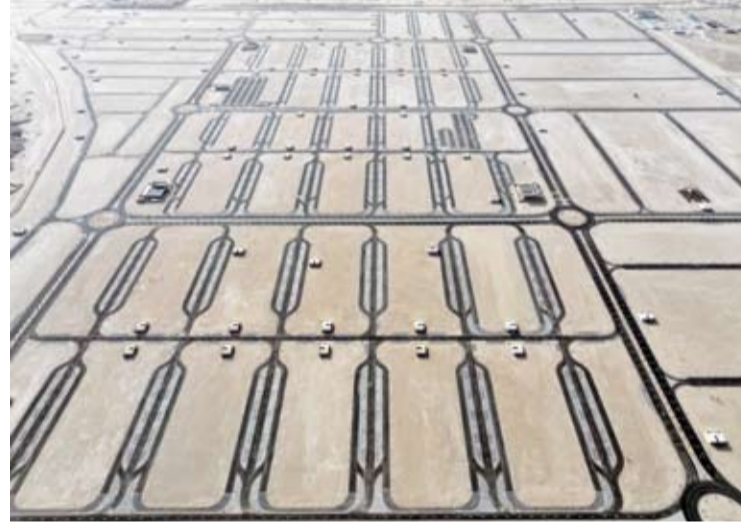
موقع مشروع مدينة الشدادية الصناعية