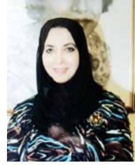
د. سعاد الصباح

والأهات التي تنجرعها اليوم، فعن الطفولة كتبت في العام 1988 تقول: "إن الطفل العربي هو الاستثمار الرابع. في حين أن بقية استثمارنا قابلة للريح والخسارة. الطفل العربي هو آخر حصان جميل نراهن عليه.. فإذا خسر هذا الحصان، فإن سلامة الخيول العربية كلها سوف تقرر. قد يكون كلامي جارحاً بعض الشيء. ولكنني أكتب ما أكتبه، لأنني ألاحظ أن الأطفال العرب يعيشون في مناخ ملوث، وصحياً وثقافياً، اجتماعياً، وقومياً.. فهم ضائعون، ومكسرون جسدياً ونفسياً، ومهزون تشجيرات من القصب تحصف بها الريح".