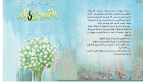
غلاف الإصدار الجديد