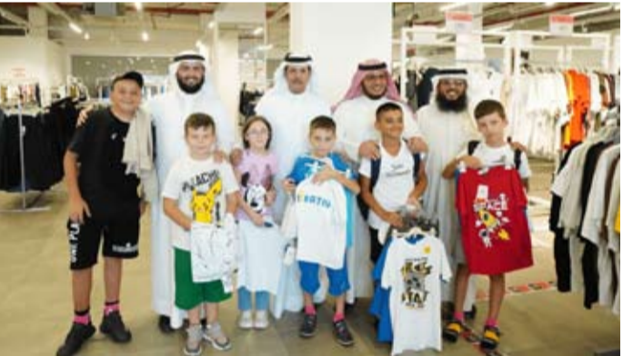
توزيع الكسوة على الأيتام