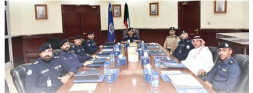
جانب من اجتماع مجلس إدارة نادي ضباط الشرطة