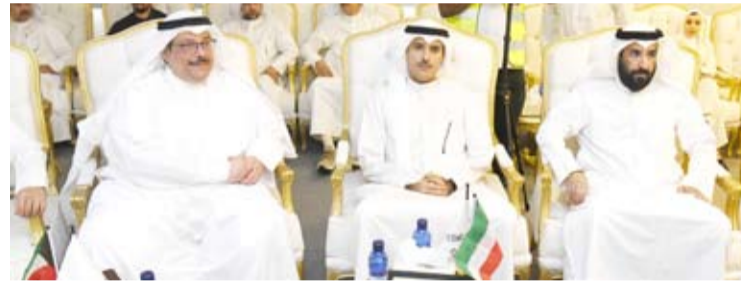
محافظ الأحمدى ومسؤولو «الصناعة» و«الطرق»

قالت المبعوثة الأمريكية لدى الأمم المتحدة ليندا توماس جرينفيلد لمجلس الأمن أمس إن اتفاق وقف إطلاق النار في غزة وإطلاق سراح الرهائن «يلوح في الأفق» بينما حثت المجلس المكون من 15 عضواً على الضغط على حركة حماس الفلسطينية لقبول اقتراح لسد الفجوات في مواقف الجانبين. وأضافت أنها لحظة حاسمة لمحادثات وقف إطلاق النار للمنطقة، وبالتالي يجب على كل عضو في هذا المجلس أن يستمر في إرسال رسائل قوية إلى الجهات الفاعلة الأخرى في المنطقة لتجنب الإجراءات التي قد تبعثنا عن إنجاز هذا الاتفاق.