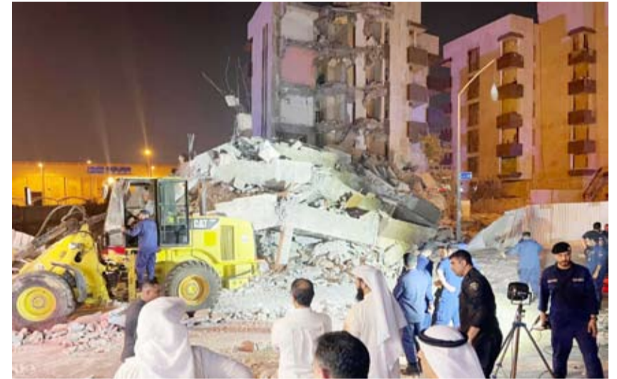
انهيار بناية من 6 طوابق أثناء عملية هدمها

أكد نائب رئيس مجلس الوزراء وزير الدولة لشؤون مجلس الوزراء شريدة المعشرجي أنه ستتم محاسبة المتسبب بحادث انهيار العمارة في منطقة الجابرية وكل مخطن سينال جزاءه «مضيفاً بهذا الشأن» أننا الآن بانتظار التقرير النهائي بشأن هذا الحادث. وكانت قوة الإطفاء العام أعلنت في مساء أمس الأول أن بناية مكونة من ستة طوابق في منطقة الجابرية انهارت أثناء عملية هدمها.