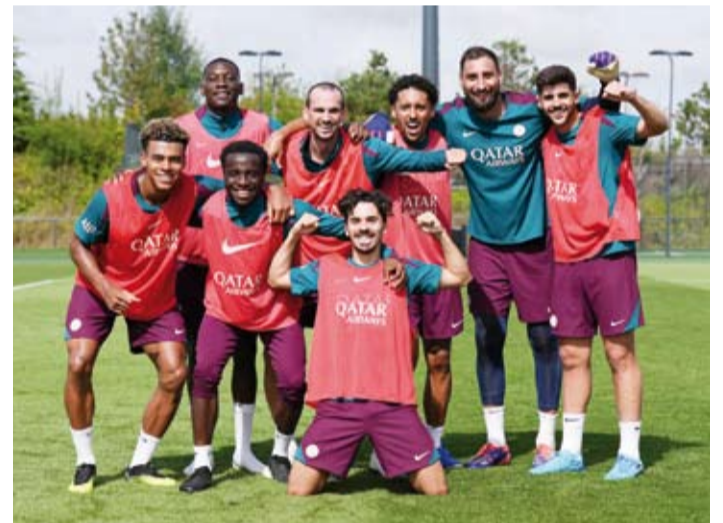
باريس سان جيرمان ومغامرة جديدة مع انريكي

سانت إيتيان بهدف الياباني تاكومي مينامينو. ويبدو ليل الأقرب لتحقيق الفوز أمام ضيفه أنجيه الذي خسر على ملعبه بهدف في المباراة الأولى أمام لانس، بينما انطلق ليل بفوز ضمين خارج ملعبه أمام ريمس بثلاثية دون رد. وفي لقاء آخر يأمل سانت إيتيان الصاعد مجددا للدوري الممتاز لتجاوز خسارته في الجولة الأولى أمام مونكو، عندما يستضيف لوهافر الذي خسر برعاية أمام باريس سان جيرمان.