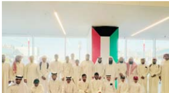
لقطة جماعية للمشاركين في الرحلة

انطلقت إلى المدينة المنورة الرحلة التاسعة عشرة لحفظ القرآن الكريم والتي تشرف عليها جمعية إحياء التراث الإسلامي من خلال مركز أهل القرآن التابع لها في منطقة الجهراء، والذي يعتني بحفظ القرآن الكريم والأسانيد القرآنية.