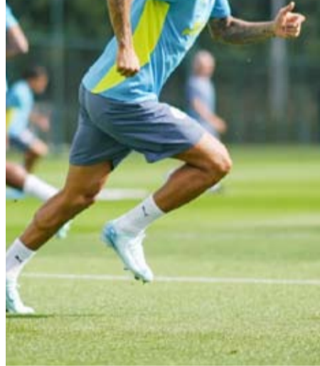
جواو كانسيلو من تدريبات سيتي

كشفت تقارير صحفية أن البرتغالي جواو كانسيلو ظهر مانشستر سيتي الإنجليزي يقرب من الانتقال لصفوف الهلال السعودي خلال فترة الانتقالات الصيفية الحالية. كان كانسيلو قد عاد إلى مانشستر سيتي هذا الصيف بعد انتهاء إعارته الموسم الماضي لبرشلونة، في ظل عدم قدرة النادي الكتلوني. قالت صحيفة "ديلي ميل" الإنجليزية أن كانسيلو هو أحد المرشحين لتعويض رحيل سعود عبد الحميد لاعب الهلال إلى روما الإيطالي. وأضافت أن الهلال ومانشستر سيتي توصلا لاتفاق بخصوص انتقال كانسيلو إلى الهلال مقابل 35 مليون يورو في الميركاتو الصيفي الحالي.