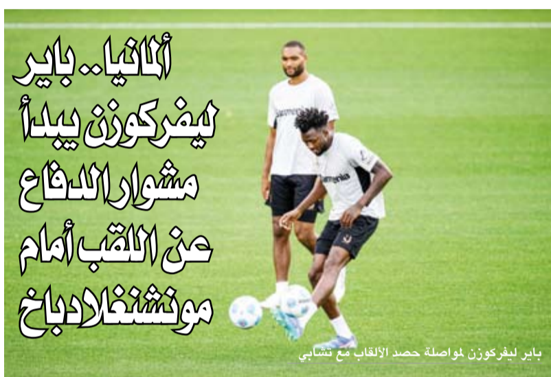
باير ليفركوزن لمواصلة حصد الألقاب مع تشابي

لجهود فيرلاند ميندي بعدما حصل على بطاقة حمراء في الجولة الأولى، حيث يرغب الفريق في تحقيق مفاجأة ومواعدة الانتصارات بالدوري.