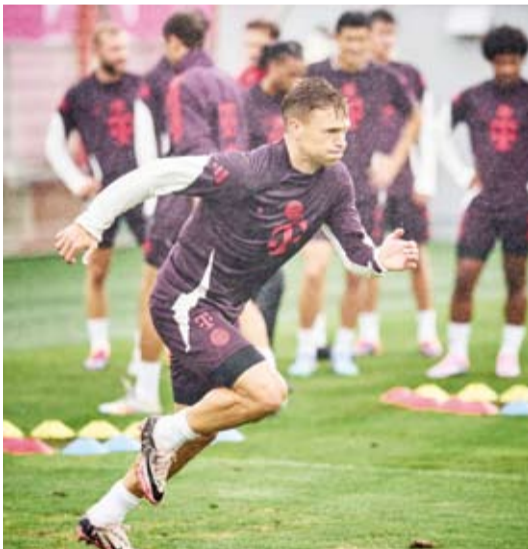
إدارة فنية جديدة للبايرن بهدف العودة لمنصات التتويج

يحاول بايرن ميونخ البطل القياسي للدوري تعويض خيبة الأمل في الموسم الماضي، حينما حرمه ليفركوزن من التتويج بلقب الثاني عشر على التوالي، حيث يبدأ الفريق مسواره بملاقاة مضيفه فولفسبورغ تحت قيادة مديره الفني الجديد البلجيكي الجديد فينست كومباني.