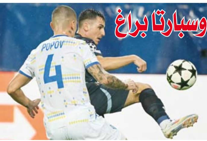
اكتمال دوري المجموعات الأسبوع المقبل

الذين سجلوا الأهداف الأربعة في المباراة الأولى أمام لوهافر، وإمكانته أيضا لتوظيف الإسباني ماركو أسنيسيو في مركز المهاجم الصريح، وهو ما لجأ إليه في عدد من المباريات بالموسم الماضي. في المقابل، يريد مونبيليه احراز نتيجة إيجابية على أرض المنافس خاصة بعدما تعثر الفريق في الجولة الأولى بالتعادل 1/1 على ملعبه ووسط جماهيره أمام ستراسبورغ.