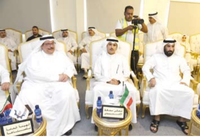
محافظ الأحمدى ومدير عام الهيئة العامة للصناعة خلال الزيارة