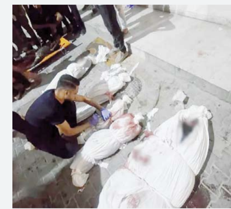
معظم الشهداء من الأطفال والنساء

وفي مدينتي (رفح) و(خانونس) جنوبي القطاع نقلت الطواقم الطبية جثامين أربعة من الشهداء بقصف استهدف مجموعة مواطنين فلسطينيين فيما تم نقل جثامينهم إلى مجمع (ناصر الطبي) بحسب السلطات. كما انتشلت الطواقم الطبية في مخيم (جباليا) شمال القطاع جثمان شهيد إثر قصف مدفعي على منطقة (السكة) شرق المخيم. وأعلنت السلطات الصحية في قطاع غزة أمس الأول عن استشهاد 50 فلسطينياً بمجازر ارتكبتها جيش الاحتلال بينهم أطفال وذلك بقصف منازل وخيام للنازحين في المنطقة الغربية على الطريق الساحلي. وتواصل مدفعية جيش الاحتلال الإسرائيلي عدوانها بعشرات القذائف شرق مدينة (دير البلح) التي تنفذ فيها عملية عسكرية فيما استهدفت المدفعية مناطق متفرقة وسط القطاع.