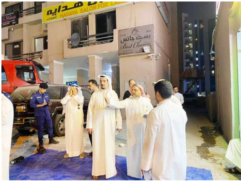
مسئولو البلدية والإطفاء