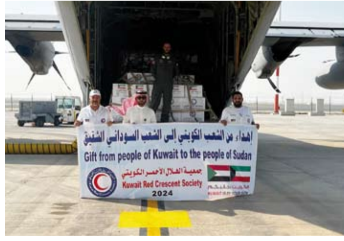
إهداء من الشعب الكويتي إلى الشعب السوداني

السودان والقوة الجوية الكويتية لجهودهم في التنسيق والمتابعة لإيصال المساعدات الإغاثية مستحقها. وأكد قوف دولة الكويت إلى جانب الشعب السوداني الشقيق في أزمته الإنسانية ورفع المعاناة عن المتضررين وتخفيف آلام ضحايا الفيضانات والسيول التي اجتاحت السودان الشقيق أخيراً.