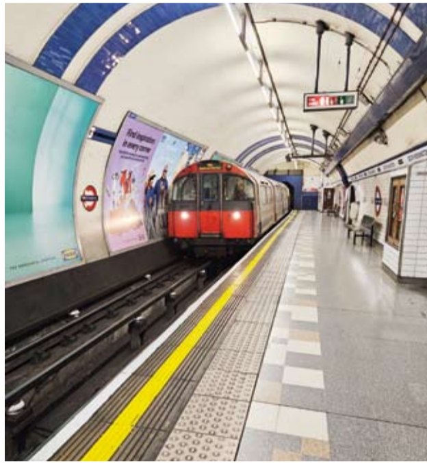
قطار أنفاق حديث