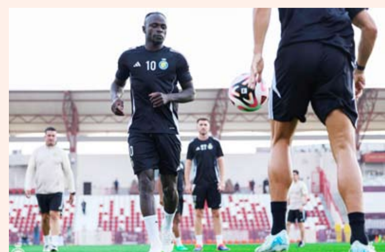
ماني من تدريبات النصر

40 مليون يورو، من أجل إتمام صفقة انتقاله على سبيل الإعارة. وكشفت، أن ماني غاضب بسبب عرضه على نادي الاتحاد دون معرفته، بجانب رغبته في البقاء مع النصر.