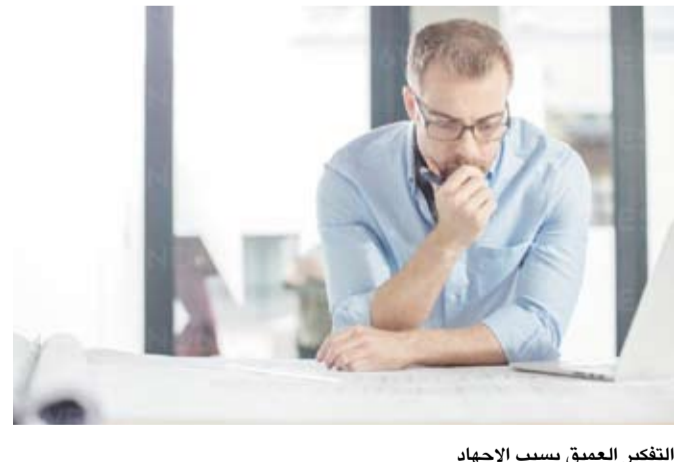
التفكير العميق يسبب الإجهاد

وتزايد المشاعر السلبية مثل الإحباط والتوتر والقلق، كما لوحظ أن هذه العلاقة متواجدة عبر مختلف الفئات العمرية والمهنية، بدءاً من الطلاب وصولاً إلى العسكريين.