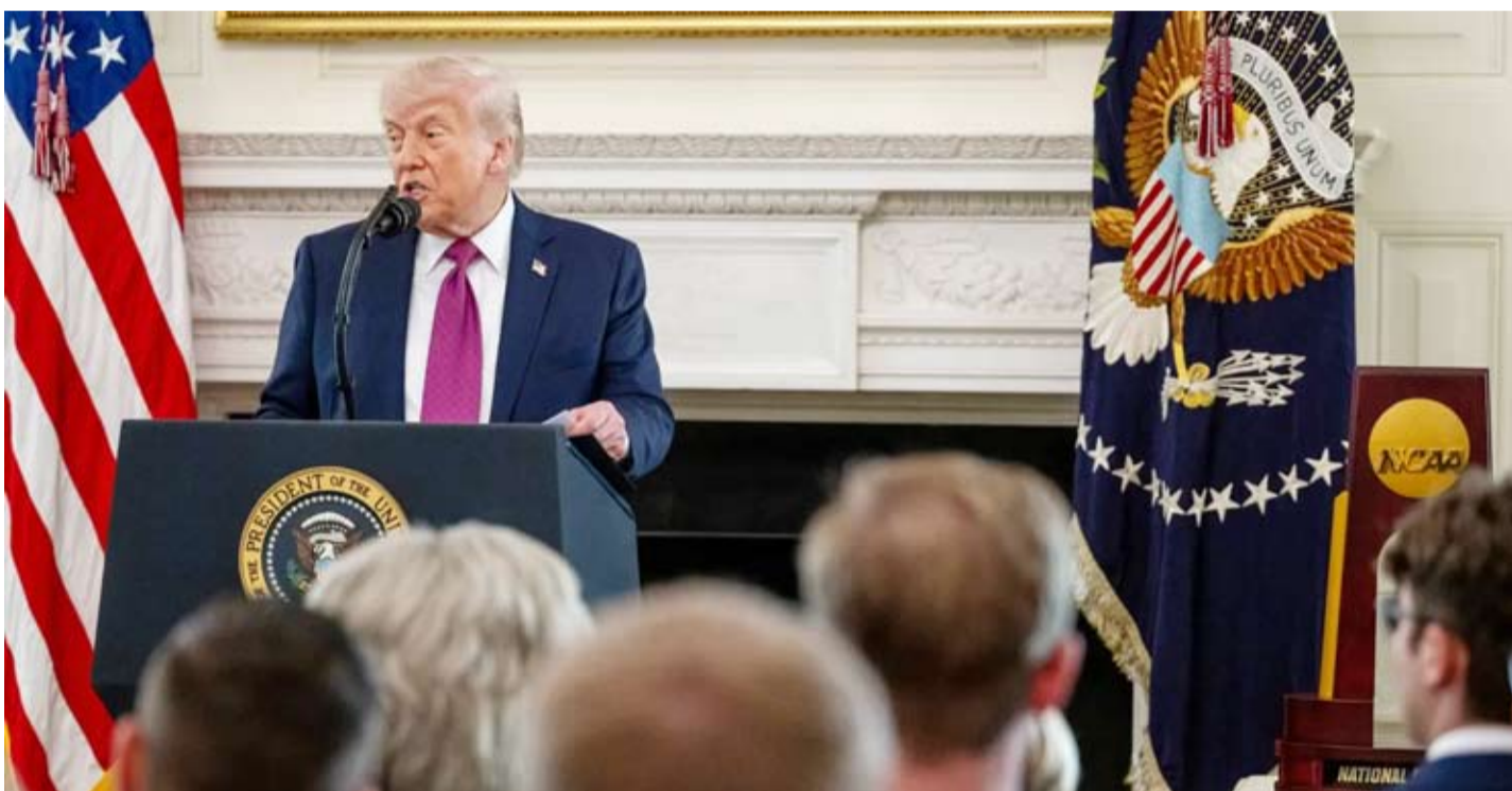
الرئيس الأمريكي ترامب