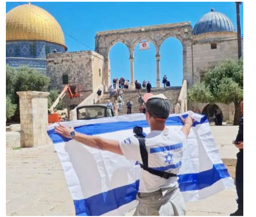
استفزازات مدعومة بقوات الاحتلال أمام قبة الصخرة

نكرت محافظة القدس أن عشرات المستوطنين اقتحموا المسجد الأقصى أمس وسط حراسة مشددة من شرطة الاحتلال. وأضافت أن «المستوطنين اقتحموا المسجد الأقصى منذ ساعات الصباح بحراسة قوات الاحتلال حيث قاموا بالغناء أمام قبة الصخرة خلال الاقتحام».