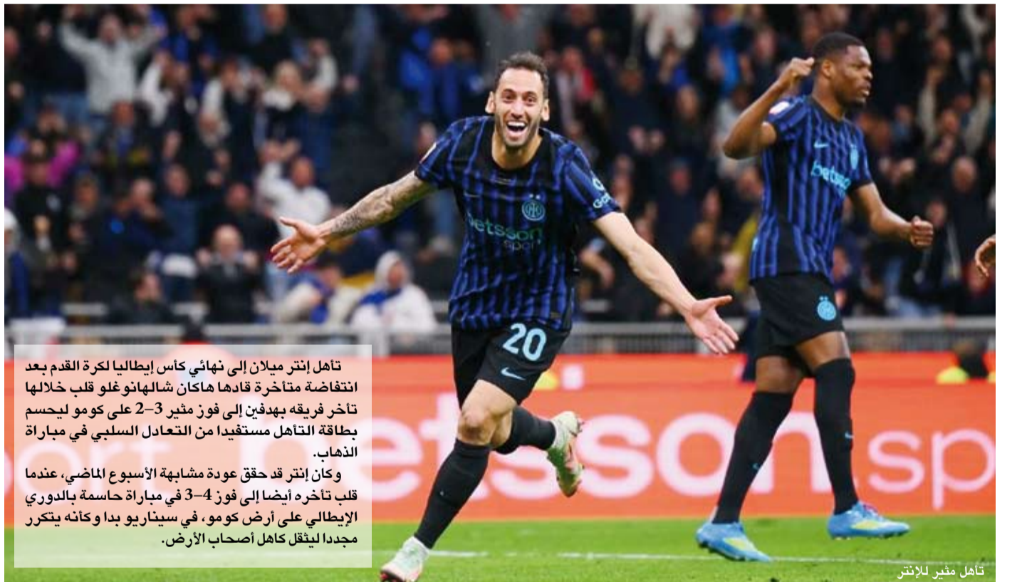
تأهل منير للإنتر

تأهل إنتر ميلان إلى نهائي كأس إيطاليا لكرة القدم بعد انتفاضة متأخرة قادها هاكان شالهانو غلو قلب خلالها تاخر فريقه بهدفين إلى فوز مثير 3-2 على كوهو ليحسم بطاقة التأهل مستفيداً من التعادل السلبي في مباراة الذهاب. وكان إنتر قد حقق عودة مشابهة الأسبوع الماضي، عندما قلب تأخره أيضاً إلى فوز 4-3 في مباراة حاسمة بالدوري الإيطالي على أرض كوهو، في سيناريو بدا وكأنه يتكرر مجدداً لينقل كامل أصحاب الأرض.