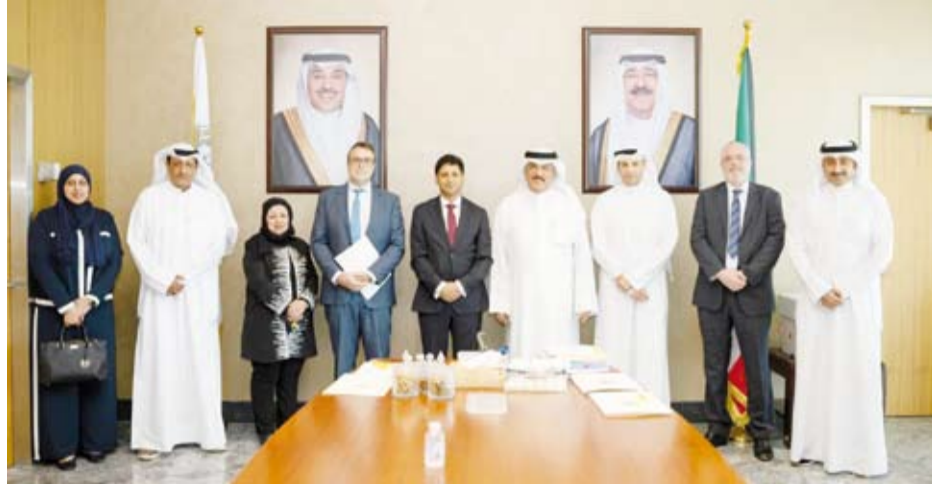
وزير التربية مستقبلاً السفير البريطاني

بحث وزير التربية سيد جلال الطبطائي، أمس، مع سفير المملكة المتحدة لبريطانيا العظمى وإيرلندا الشمالية لدى دولة الكويت قدسي رشيد تعزيز التعاون في مختلف المجالات لا سيما المجال التعليمي الذي يعد ركيزة أساسية في دعم مسارات التنمية وبناء القدرات البشرية.