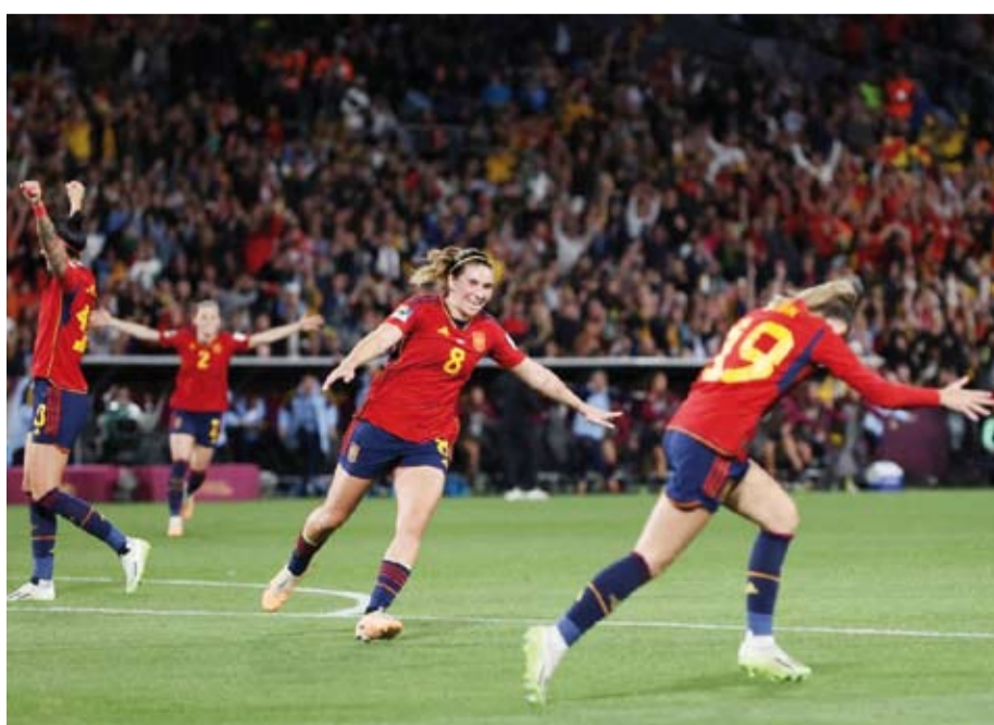
نشاء المنادور يحافظن على صدارة التصنيف العالمي

حافظ المنتخب الإسباني على صدارته لتصنيف العالمي للسيدات الصادر عن الاتحاد الدولي لكرة القدم (فيفا). ورغم خسارة منتخب إسبانيا أمام إنجلترا بهدف دون رد، حافظت بطلات العالم 2023 على موقعهن في القمة. وشهدت النسخة الجديدة من التصنيف تحركات مهمة بين العشرة الكبار، حيث قفز المنتخب الإنجليزي إلى المركز الثالث متجاوزاً ألمانيا، ليصبح خلف المنتخب الأميركي الذي استقر في الوصافة. وحقق المنتخب الياباني قفزة نوعية بصعوده ثلاثة مراكز ليستقر في المرتبة الخامسة عالمياً، مدفوعاً بتتويجه بلقب كأس آسيا للسيدات، وهي البطولة المؤهلة لمونديال البرازيل 2027. وفي بقية المراكز، حلت البرازيل سادسة بعد فوزها بلقب «سلسلة فيفا الدولية 2026» التي أقيمت على أرضها، بينما تراجعت فرنسا للمركز السابع، وتبعها المنتخب السويدي في المركز الثامن بعد بداية متعثرة في التصفيات الأوروبية، في حين تقدمت كندا للمركز التاسع، وعاد المنتخب الهولندي ليدخل قائمة العشرة الأوائل مستفيداً من نتائجه الإيجابية أمام فرنسا.