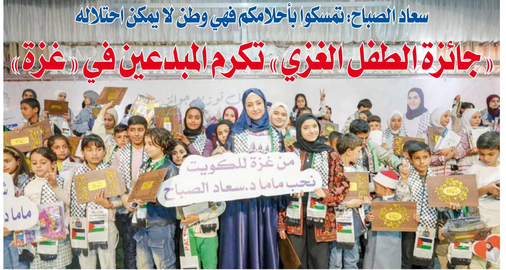
لقطة جماعية للمكرمين

سعاد الصباح: تمسكوا بأحلامكم فهي وطن لا يمكن احتلاله «جائزة الطفل الغزي» تكرم المبدعين في «غزة» أقامت جائزة الدكتورة سعاد الصباح للطفل الغزي المبدع في مدينة غزة، حفل تكريم الفائزين بالجائزة بمشاركة نحو 400 طفل من المبدعين وأمهاتهم في فعالية احتفت بقيمة الإبداع بمختلف فنونه في مدينة غزة، حيث رفعت أعلام الكويت في المناسبة. وقالت الدكتورة سعاد الصباح في كلمة مسجلة ألقاها نيابة عنها مدير دار سعاد الصباح للثقافة والإبداع علي المسعودي أمس: إن أبناء غزة هم قناديل النور في ليلنا الطويل وأمهاتهم نبض هذه الأرض الفلسطينية المقاومة فهن الوسام الحقيقي والحكاية التي لا تهزم فرغم كل الماسي استطعن زراعة الصبر في قلوب الصغار ونشر الحب في صدورهم فغدو المثل والمثارة. وأضافت الدكتورة سعاد الصباح، أن أطفال غزة هم القدوة، إذ يصنعون من الألم معنى ومن الجرح نافذة أمل ومن الرماد لوحة بعد أن كتبوا بالحروف الصغيرة سيرة كبيرة ورسوما بالألوان ما عجزت عنه خرائط العالم وصدقوا أمام الكون: «نحن هنا... بالحياة ننتصر». وخطبت أطفال غزة: «تمسكوا بأحلامكم فهي وطن لا يمكن احتلاله واحفظوا قلوبكم فهي الأرض تبقى وأقول لكم: سيكبر هذا الأمل ليصير مجدداً وستكونون أنتم ليصير بكم الغد أجمل». من جهتها توجهت المشرفة على الحفل والجائزة الدكتورة آلاء القطراوي في كلمة مماثلة، بالشكر إلى الدكتورة سعاد الصباح