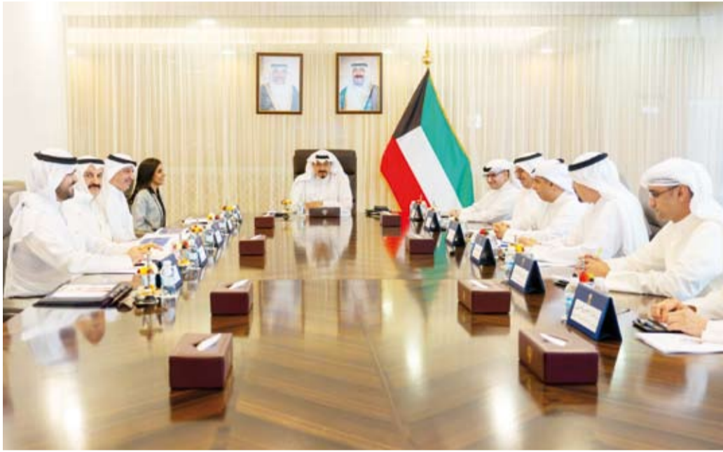
سمو الشيخ أحمد العبدالله يترأس الاجتماع