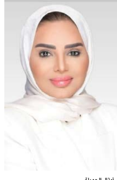
د. أمثال الحويلة

بحثت وزيرة الشؤون الاجتماعية وشؤون الأسرة والطفولة د. أمثال الحويلة مع وزيرة الأسرة الإماراتية سناء سهيل سبل تبادل الخبرات وأبرز الممارسات في مجال السلامة الرقمية للأطفال.