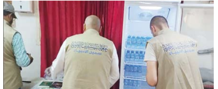
تنفيذ مشروع سقيا الماء

سلسبيل تقدم خدمات متعددة للجاليات خصوصاً وأهمها المشاريع الدعوية والتوعوية من خلال المحاضرات والندوات التي تقيمها بواسطة قسم الجاليات لديها.