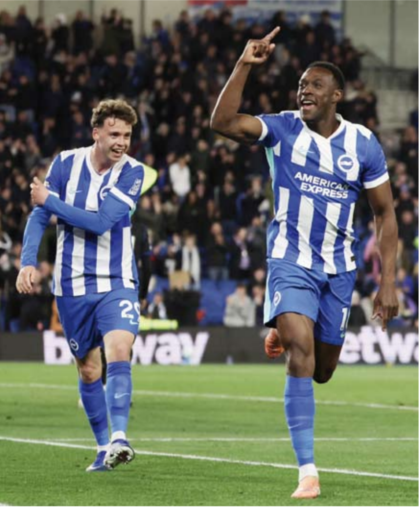
فرحة لاعبي برايتون بالفوز

عن المسابقات الأوروبية الموسم المقبل، في حال عجزه عن الخروج من دوامة نتائجه السلبية. على التشكيلة وخطة اللعب خلال مجريات المباراة، إلا أن لاعبيه عجزوا عن الرد بعد التأخر بهدف في الشوط الأول، ليتعرض الفريق لهزيمة مرحة جديدة. أمريكان إكسبريس. وبهذه النتيجة، ارتقى برايتون إلى المركز السادس في جدول الترتيب برصيد 50 نقطة، متقدماً بنقطتين على تشيلسي، الذي حقق فوزاً واحداً فقط في آخر تسع مباريات له في الدوري. ويواجه الفريق خطر الغياب