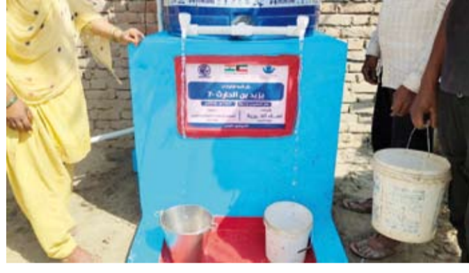
تنفيذ مشروع بئر شبه ارتوازي في الهند

وأضاف أن حفر الآبار الثلاث وفر مصدراً آمناً ومستداماً للمياه لنحو 9000 مستفيد، مبيناً أن المياه لا تمثل فقط مورداً للشرب، بل هي أساس للحياة الريفية وركيزة للصحة العامة وعنصر رئيسي في تحسين سبل العيش وتعزيز الاستقرار المجتمعي.