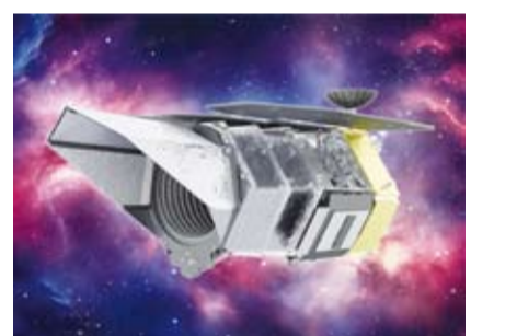
التلسكوب الفضائي الجديد «رومان»

كشفت وكالة الفضاء الأمريكية «ناسا» عن تلسكوبها الفضائي الجديد «رومان»، القادر على مسح أجزاء شاسعة من الكون بحثاً عن كواكب خارجية، وعن إجابات لأكبر الألغاز الفيزيائية المتخلفة في المادة والطاقة المظلمتين. ويهدف «رومان» إلى دراسة ما هو غير مرئي، أي المادة والطاقة المظلمتان اللتان يعتقد أنهما تمثلان 95 بالمئة من الكون، وسيتمكن بفضل الأشعة تحت الحمراء من رصد الضوء المنبعث من أجرام سماوية قبل مليارات السنين، والعودة بذلك إلى الماضي لفهم هاتين الظاهرتين الغامضتين. وسيوفر «رومان» لكوكب الأرض أطلساً جديداً للكون، ويتجاوز طوله 12 متراً، وهو مزود بالأواح شمسية ضخمة، وسيُنقل إلى فلوريدا تمهيداً لإرساله إلى الفضاء مطلع سبتمبر المقبل، بواسطة صاروخ تابع لشركة سبياس إكس. وسيمسح «رومان» مناطق شاسعة من السماء بفضل مجال رؤيته الواسع الذي يفوق مجال رؤية «هابل» بأكثر من مئة مرة، وذلك من خلال نقطة مراقبة تبعد 1.5 مليون كيلومتر عن كوكب الأرض.