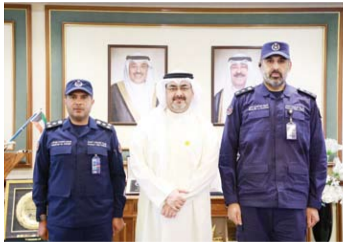
الشيخ عبدالله سالم العلي مستقبلاً العميد مصعب الأنصاري والعقيد خليفة السويدي

الدور الحيوي الذي تضطلع به قوة الإطفاء العام بقطاعاتها المختلفة في تأمين المنشآت الحيوية وحماية الأرواح والممتلكات خاصة في مواقع المطارات التي تمثل بوابة البلاد الأولى، كما أشار المحافظ إلى أن أحدث التقنيات والمعدات المستخدمة في مكافحة الحرائق والمنشآت الحية يعكس كفاءة الأجهزة الوطنية وقدرتها على إدارة الأزمات بكفاءة واحترافية.