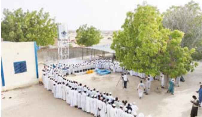
افتتاح مشروع بئر ارتوازي بولاية «حجر ميس» في تشاد