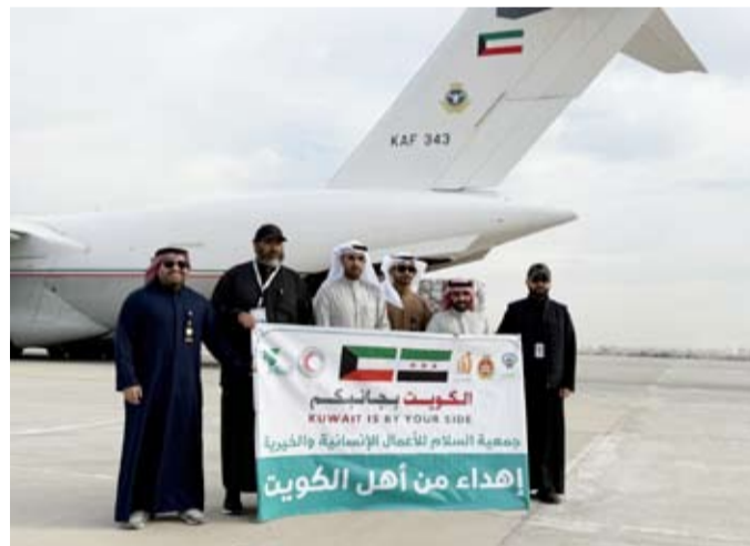
الجهات الرسمية المشاركة بالرحلة العاشرة من الجسر الجوي الكويتي