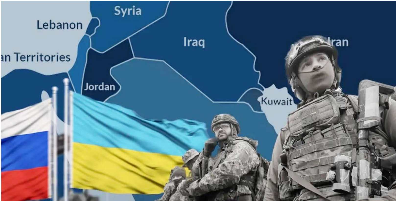
تاثيرات دولية للحرب الروسية الأوكرانية

جديد في حال التوصل إلى هدنة مع روسيا، وفق ما أورده «وكالة الصحافة الفرنسية». وقال زيلينسكي خلال مشاركته في المنتدى الاقتصادي العالمي في دافوس بسويسرا، في مقابلة نشرت في الثامنة على موقعها الإلكتروني، إن «200 ألف هو حد أدنى. إنه حد أدنى، وإلا فهي لا تعني شيئاً». وهذه أول مرة يتحدث مسؤول أوكراني كبير علناً عن عدو قوة مماثلة في حين يجري بحث الموضوع بعيداً عن الأضواء منذ أشهر عدة بين كييف وحلفائها الغربيين. وكان الرئيس الفرنسي إيمانويل ماكرون طرح فكرة نشر قوات غربية في أوكرانيا لمرافقة اتفاق وقف إطلاق نار محتفل مع روسيا. وتشن روسيا هجوماً عسكرياً على كييف منذ ثلاث سنوات، احتلت خلاله حتى الآن نحو 20 في المائة من أراضي أوكرانيا في شرق البلاد وجنوبها. وترد تكهنات منذ أسابيع حول مفاوضات محتملة لوضع حد للنزاع وسط تساؤلات حول موقف الرئيس الأميركي الجديد دونالد ترامب الذي تُعدّ بلاده مصدر الإمداد الرئيسي بالمساعدات العسكرية والمالية لأوكرانيا.