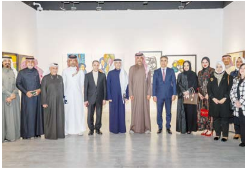
لقطة جماعية للمشاركين