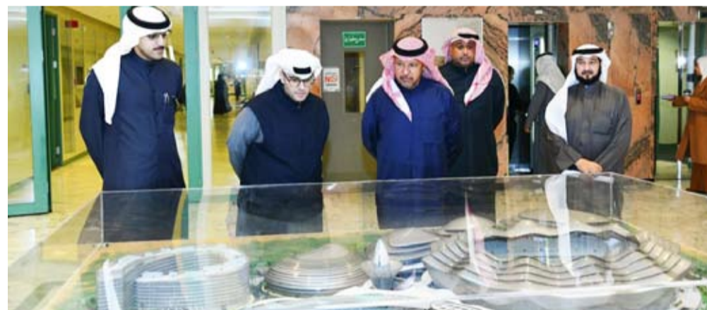
وزير شؤون البلدية خلال الاطلاع على أحد المشاريع

أكد وزير الدولة لشؤون الإسكان، عبد اللطيف المشاري، أنه منذ توليه زمام الأمور في البلدية حرص على اتخاذ ما يلزم من خطوات وقرارات لتنفيذ المشاريع التنموية، فأثلاً إن الارتقاء بالعمل البلدي، ومواكبة التطور الجغرافي والعمراني على رأس أولوياتنا. جاء ذلك خلال استقباله محافظ الفروانية، الشيخ عذبي الناصر، حيث ناقشا العديد من الأمور التي تخص البلدية وتعزيز التعاون والتنسيق المشترك بين المحافظة والبلدية للقضاء على الظواهر السلبية. من جهته، أشار الناصر إلى أنه حرص كل الحرص على تعزيز التواصل مع جميع الجهات الخدمية التي تلبي مطالب واحتياجات أهالي المحافظة، مؤكداً أهمية استمرار التواصل ومد جسور التعاون بين جهات الخدمية من أجل النهوض بمستوى الخدمات والارتقاء بها.