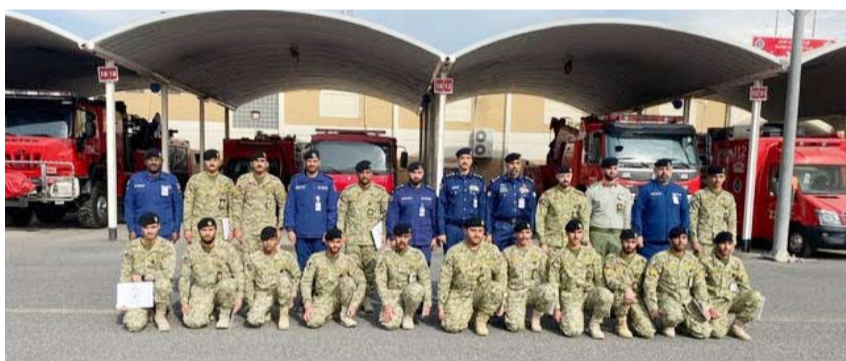
قوة الإطفاء المشاركة في الدورة