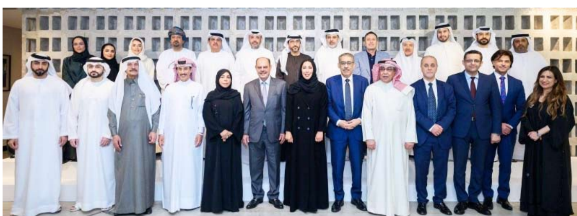
مسؤولو جمعية الصحافيين الكويتية والإماراتية

تأسيس مركز عصري للإبداع الإعلامي، وآخر للتدريب بهدف رفع مستوى الكفاءة الإعلامية وتطوير المهنة».