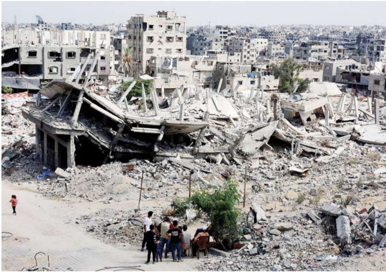
جانب من الدمار في قطاع غزة

قالت حركة «حماس»، إنه من المقرر السماح للنازحين في غزة بحرية التنقل بين جنوب القطاع وشماله، بداية من السبت المقبل، وهو اليوم السابع من سريان اتفاق وقف إطلاق النار الذي دخل حيز التنفيذ هذا الأسبوع.