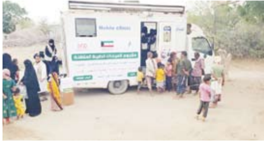
مشروع العيادات المتنقلة

دشنت الهيئة الخيرية الإسلامية العالمية تحت شعار «الكويت بجانكم» مشروع العيادات الطبية المتنقلة الذي قامت بتنفيذه مؤسسة «داء» للتنمية والتطوير، يوم الثلاثاء الماضي بمديرية الوضيع بمحافظة أبين.