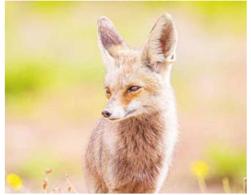
الحصني في الكويت