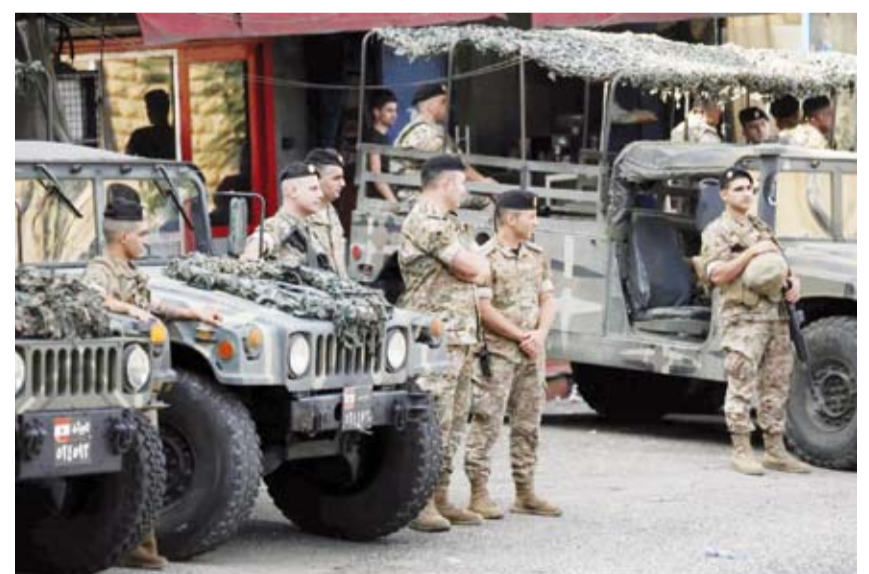
عناصر في الجيش اللبناني

أعلن الجيش اللبناني، أنه أكمل الانتشار في عدة نقاط في بلدة كفرشوبا-حاصبيا بعد انسحاب الجيش الإسرائيلي. وقال الجيش في بيان: «في ظل العمل المتواصل لاستكمال بنود اتفاق وقف إطلاق النار... استكملت وحدات عسكرية انتشارها في عدة نقاط في بلدة كفرشوبا-حاصبيا في القطاع الشرقي... وذلك بالتنسيق مع اللجنة الخماسية للإشراف على اتفاق وقف إطلاق النار وقوة الأمم المتحدة المؤقتة في لبنان (اليونيفيل)». وطلب الجيش اللبناني المدنيين بعدم الاقتراب