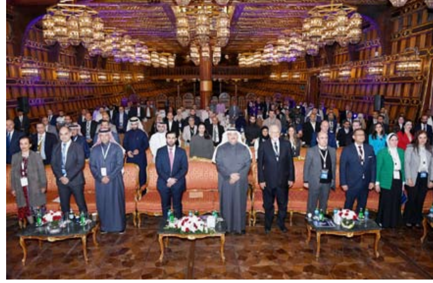
وزير الصحة د. أحمد العوضي يتقدم الحضور

أكد وزير الصحة الدكتور أحمد العوضي، أن الكويت على أعتاب تطوير برامج جديدة تشمل زراعة الكبد والقلب والبنكرياس وتعمل حالياً على إطلاق برنامج زراعة الرئة، فيما تواصل الوزارة تقديم الدعم الكامل للبرامج الطموحة بعد النجاحات التي حققتها بمجال زراعة الأعضاء مثل برامج زراعة الخلايا الجذعية والبنكرياس.