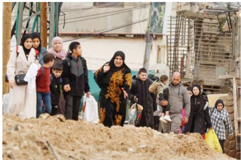
عائلات فلسطينية تغادر منازلها في مخيم جنين

أفادت وكالة الصحافة الفرنسية نقلاً عن محافظ جنين بدء مغادرة مئات من سكان مخيم جنين في شمال الضفة الغربية المحتلة منازلهم، يوم أمس، بعد تهديدات أطلقها جيش الاحتلال عبر مكبرات الصوت، بالإخلاء. وأفسادت وكالة الأنباء الفلسطينية (وفا)، أن النازحين «هم من كبار السن والنساء والأطفال، وأن القوات الإسرائيلية أجبرتهم على إخلاء منازلهم بالقوة وتحت تهديد السلاح». وأعلنت وزارة الصحة الفلسطينية، يوم أمس، عن مقتل اثنين في جنين، ليرتفع إجمالي عدد القتلى منذ بدء العملية العسكرية الإسرائيلية هناك إلى 12 شهيداً.