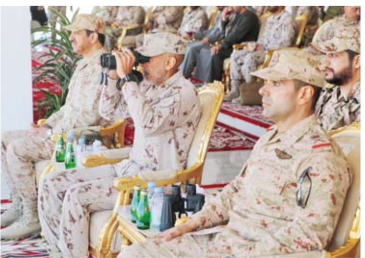
نائب رئيس الأركان يتابع التمرين

عقب ذلك، رعا نائب رئيس الأركان ونظيره الإماراتي فعاليات ختام تمرين «درع الوطن» في ميدان الأديرع، والذي نفذته القوة البرية بمشاركة وحدات من مختلف القطاعات العسكرية، وبمشاركة العنصر النسائي والتي تعبر الأولى في التمارين العمليانية في الجيش الكويتي. ويهدف التمرين إلى رفع الجاهزية العملياتية وتعزيز التنسيق بين الوحدات العسكرية، بما يسهم في صقل مهارات منتسبي الوحدات المشاركة وزيادة كفاءتهم. وشهد هذه الفعاليات حضور مساعد وزير الخارجية لشؤون حقوق الإنسان، السفيرة الشيخة جواهر الصباح، وسفير الإمارات العربية المتحدة لدى الكويت، الدكتور مطر النيايدي، بالإضافة إلى عدد من كبار الضباط القادة من كلا الجانبين.