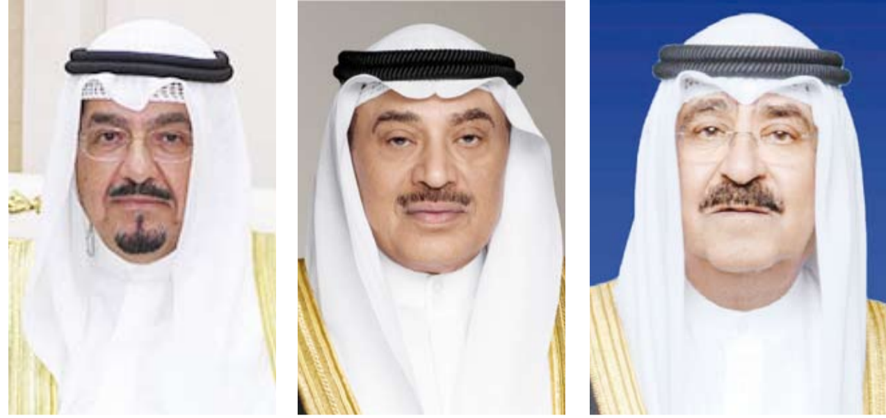
سمو أمير البلاد الشيخ مشعل الأحمد سمو ولي العهد الشيخ صباح الخالد سمو الشيخ أحمد العبد الله

أعربت وزارة الخارجية الكويتية، عن إدانة دولة الكويت واستنكارها الشديد للعدوان الذي شنته قوات الاحتلال الإسرائيلي على مدينة جنين في الضفة الغربية المحتلة الذي تسبب في سقوط العشرات من الشهداء والجرحى من المدنيين الفلسطينيين إضافة إلى تدمير واسع للبنية التحتية ونزوح عدد كبير من العائلات. وأكدت الوزارة في بيان لها أمس، أن استمرار الاحتلال الإسرائيلي في انتهاكاته الصارخة للقانون الدولي والقانون الدولي الإنساني وخرقه لقرارات الشرعية الدولية دون محاسبة يشكل تهديداً للأمن والاستقرار الإقليميين ويقوض فرص تحقيق السلام العادل والشامل. من جهة أخرى، أعربت وزارة الخارجية، ترحيب الكويت، بجهود الوساطة التي قادتها سلطنة عمان الشقيقة ونتج عنها الإفراج عن طاقم السفينة (جالاكسي ليدر) الذين كانوا محتجزين قبالة السواحل اليمنية منذ شهر نوفمبر 2023 وعدادهم 25 شخصاً من جنسيات متعددة. واذ أعربت الوزارة في بيان لها، أمس، عن تقدير دولة الكويت العميق للجهود الإنسانية التي بذلتها سلطنة عمان الشقيقة التي تعكس التزامها الراسخ بتعزيز السلم والاستقرار الإقليميين لتؤكد أهمية تعزيز التعاون الإقليمي والدولي لإرساء الأمن في منطقة البحر الأحمر، معربة عن أملها في أن تسهم هذه الخطوة في خفض التوتر وإرساء الأمن الإقليمي.