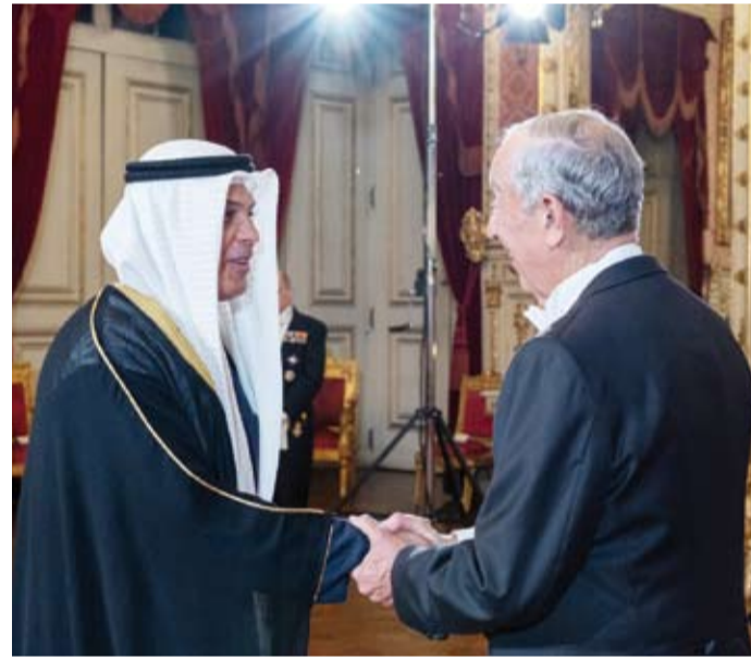
السفير حمد الهزيم مع رئيس البرتغال مارسيلو ريبيلو دي سوزا خلال الحفل

الكبير الذي شهدته العلاقات الثنائية في العام الماضي لا سيما على الصعيدين الاقتصادي والتجاري. بدوره نقل الرئيس بيد سوزا أطيب التحيات لصاحب السمو وولي عهده الأمين والحكومة الكويتية الرشيدة وللشعب الكويتي الصديق متمنياً للكويت المزيد من التقدم والازدهار. وسلط دي سوزا الضوء على أهمية الاستثمارات الكويتية ودورها في البرتغال معرباً عن تطلع بلاده إلى تطوير العلاقات الثنائية ودفعها وزيادة حجم التبادل التجاري وتعزيز مستوى الشراكة الاقتصادية. واستضافت الكويت في يوليو 2023 الجولة الأولى من المشاورات السياسية الكويتية - البرتغالية لتعزيز العلاقات بين البلدين في المجالات كافة. وتحفلت الكويت والبرتغال هذا العام بمرور 50 عاماً على إقامة العلاقات الدبلوماسية بين البلدين الصديقين.