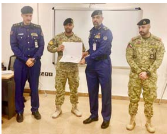
تكريم أحد المشاركين

اختتمت قوة الإطفاء العام صباح أمس الخميس دورة البحث والإنقاذ التأسيسية المخصصة لمتسبي الحرس الوطني، للتدريب على التعامل مع حوادث الأماكن المغلقة وحوادث المرتفعات، بالإضافة إلى عمليات تدعيم المباني المنهاره والتعامل بالحبال تحتوي الدورة على تدريبات نظرية وعملية من خلال استخدام أحدث المعدات لرفع