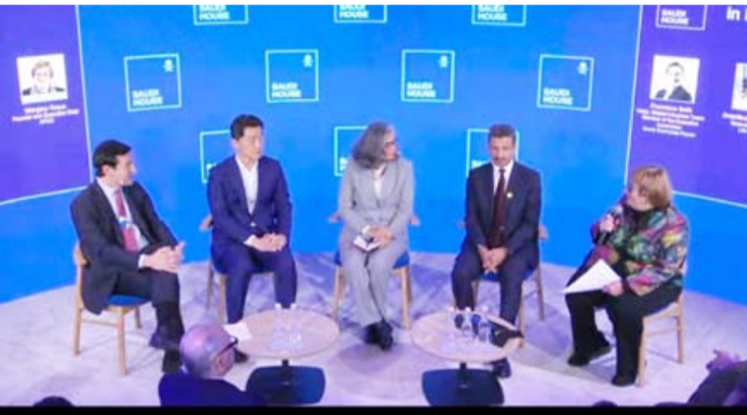
الخطيب متحدثاً في «دافوس 2025»

العوامل الأساسية لبناء قطاع قوي، لافتاً إلى «وجود كفاءات وطنية طموحة، حيث يسعى الشباب السعودي للانضمام إلى هذا القطاع الواعد». وأضاف أن توظيف السعوديين في قطاع السياحة، يساهم في نقل الثقافة المحلية، ويعزز من تجربة الزوار عبر التفاعل مع السكان المحليين».