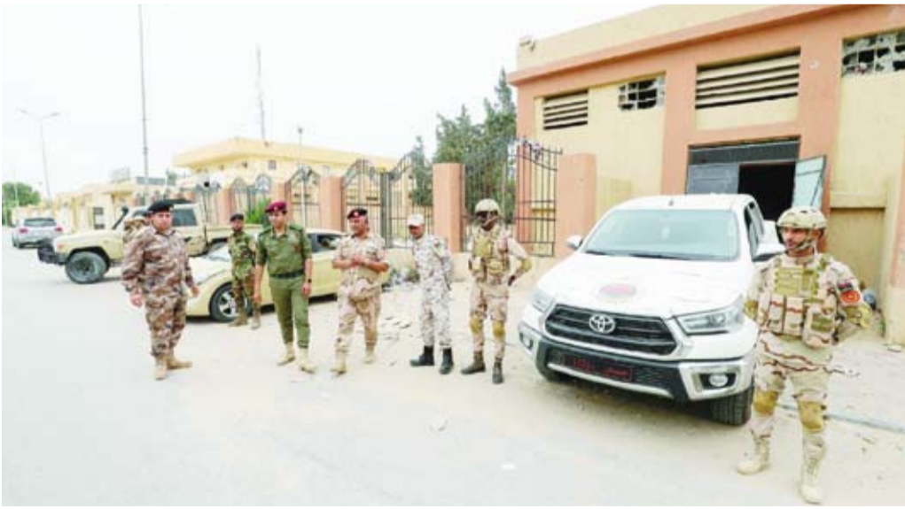
قوات تابعة لحكومة الوحدة

واعتبر المستبعد أن ليبيا «دولة صغيرة وإمكاناتها ضعيفة». وعلى ترمب عدم دعم أي طرف ليبي أمنياً، لكنه أكد مع ذلك على «دور ليبيا في تعزيز الأمن والاستقرار الإقليمي». وكرر رؤيته حول «هي النظام العسكري، والأيديولوجي، وانتصار النظام السابق». وقال الدببية بهذا الخصوص: «عندما تسلمنا الحكومة كانت أمامنا عراقيل كبيرة، لكن الحكومة عملت على التنمية، وتوفير الخدمات للمواطنين، وقد نجحنا في الوصول إلى مستويات طبيعية داخل البلاد وفي جل القطاعات»، معرباً عن تطلعه للوصول إلى «دستور حقيقي».