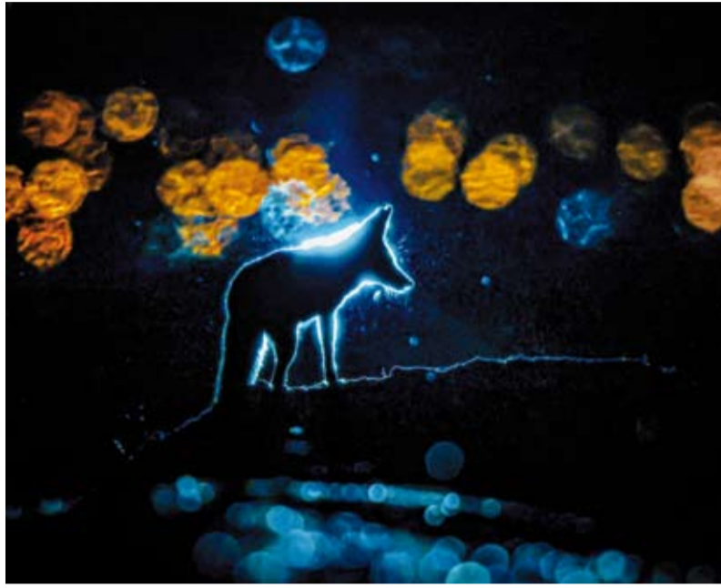
الحصني ينشط ليلاً