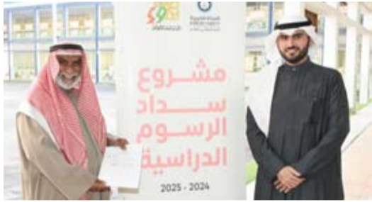
تسليم التبرع مدير إحدى المدارس الأهلية

في إطار دعمها المستمر للمشاريع التعليمية داخل الكويت ساهمت الأمانة العامة للأوقاف في سداد رسوم الطلبة الأيتام وأبناء الأسر المتعطفة بالتعاون مع لجنة طالب العلم التابعة لجمعية الخياة الخيرية.