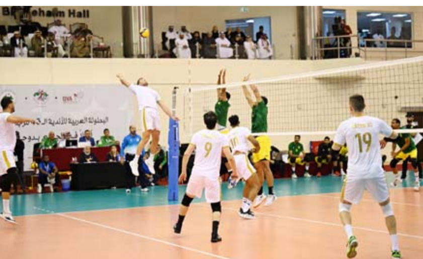
منافسات قوية في البطولة العربية لكرة الطائرة

الخميس الماضي تقام لأول مرة في قطر منذ انطلاقها في ليبيا عام 1978 فيما كان فريق (السويحلي) الليبي هو آخر فريق يتوج باللقب وذلك في النسخة الماضية بإلأردن عام 2024.