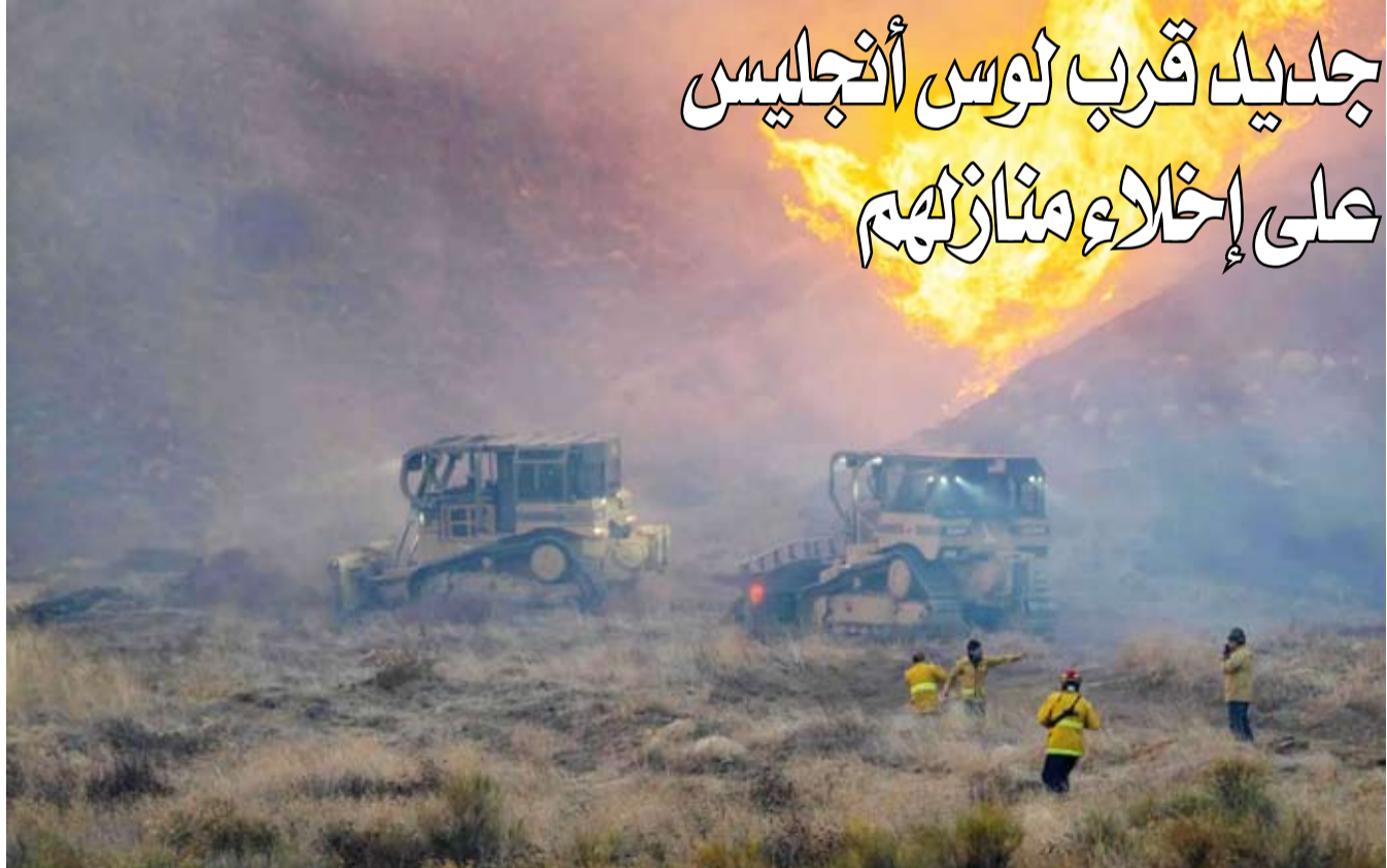
انتشار النيران بالقرب من بحيرة كاستايك

أحالت وكالة مكافحة الفساد الوطنية في كوريا الجنوبية قضية التعمد المتعلقة بالرئيس، يون سو ك يول، إلى النيابة العامة، وقدمت طلباً إليها لتوجيه الاتهام إلى يون بشأن محاولته الفاشلة لفرض الأحكام العرفية، وفقاً لوكالة الأنباء الألمانية. وأوضح مكتب التحقيق في فساد كبار المسؤولين، أنه طلب من مكتب المدعي العام لمنطقة سيول المركزية توجيه تهمة قيادة التمرد، وإساءة استخدام السلطة، إلى الرئيس، في أثناء إحالة القضية إلى النيابة العامة، حسبما ذكرت وكالة «يونهاب» للأخبار. يُشار إلى أن مكتب التحقيق ليست لديه سلطة توجيه الاتهام ضد الرئيس، لذلك عليه إحالة القضية إلى النيابة العامة من أجل توجيه الاتهامات. ويواجه يول اتهامات بالتواطؤ مع وزير الدفاع آنذاك كيم يونغ هيون، وغيره، لإثارة أعمال شغب بإعلان الأحكام العرفية في 3 ديسمبر. كما يُتهم بإساءة استخدام السلطة بإرسال قوات إلى الجمعية الوطنية، لمنع المُشرعين من التصويت ضد المرسوم.