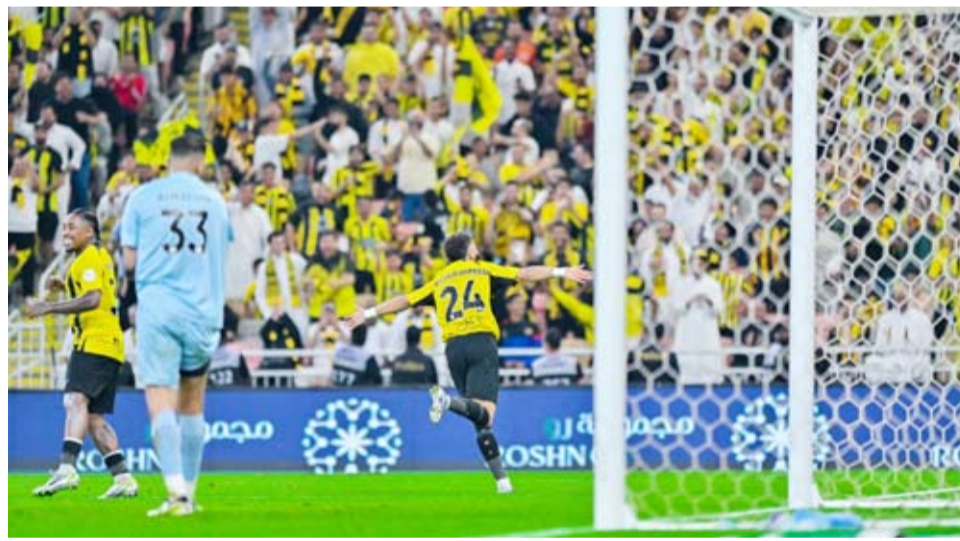
الاتحاد يرفع رصيده إلى 43 نقطة

فاز فريق (الاتحاد) السعودي على نظيره (الشباب) بهدفين مقابل هدف ضمن منافسات الجولة الـ 16 من دوري (روشن) السعودي للمحترفين لكرة القدم.