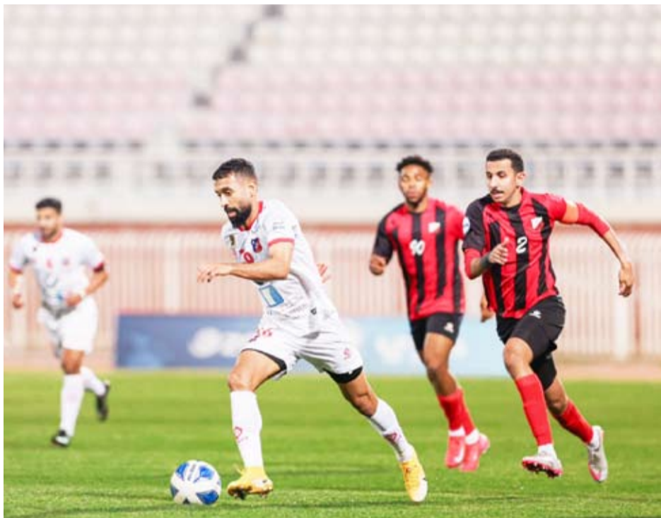
الكويت يمتلك الرقم القياسي للفوز بالسوبر

يلتقي الكويت مع السالمية على ستاد جابر المبارك، ويلعب العربي مع القادسية على ستاد جابر الدولي. ويتواجه الفائزان الثلاثاء المقبل على ستاد جابر في المباراة النهائية للبطولة.