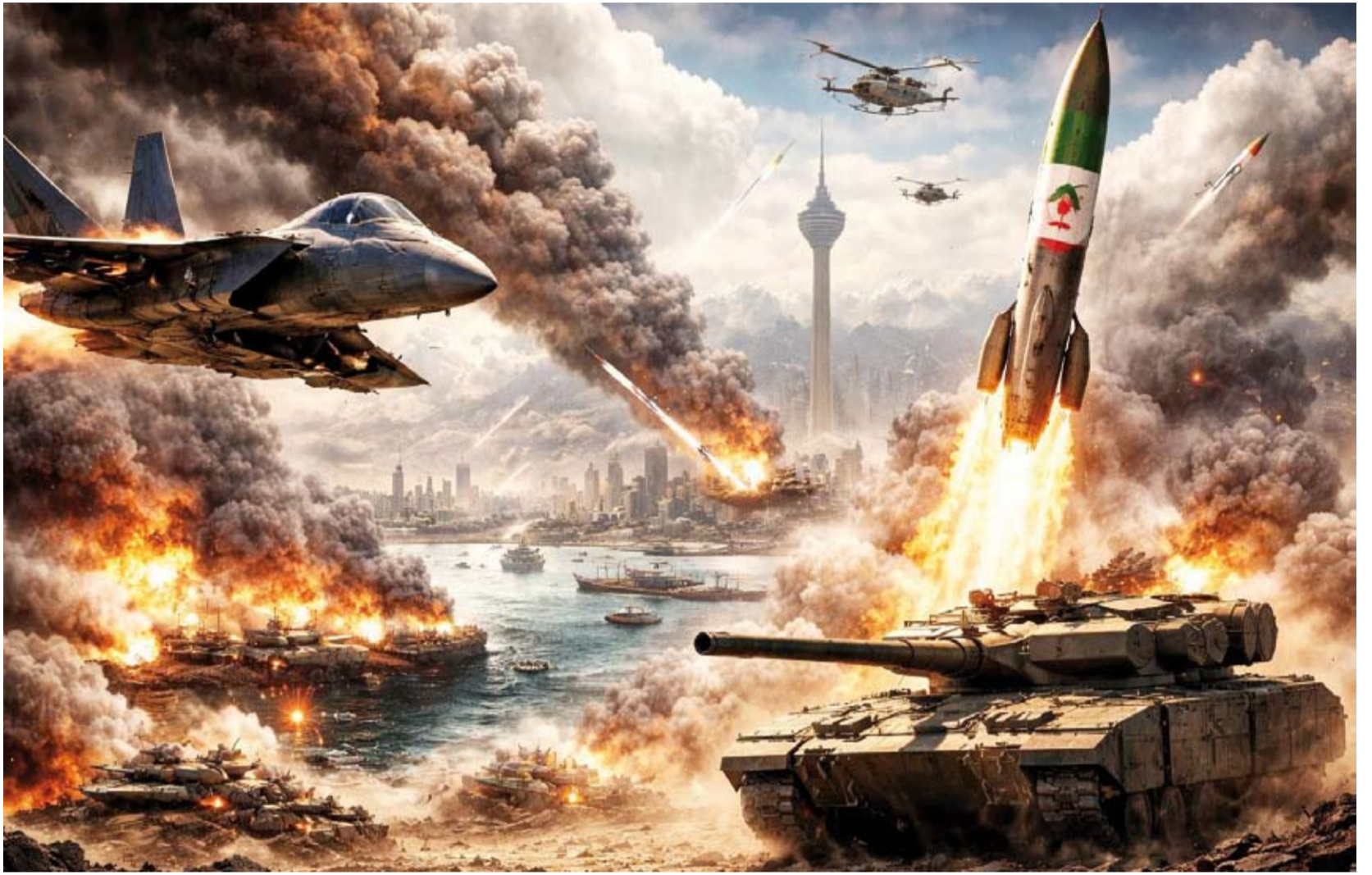
اضطراب أسواق الطاقة تعمق حالة عدم اليقين