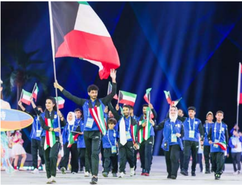
الفريق الكويتي خلال حفل الافتتاح

الشاطئية عام 2008 وأقيمت النسخة الأولى في مدينة بالي الإندونيسية تلتها العاصمة العمانية مسقط في 2010 ثم (هايانغ) الصينية في 2012 و(بوكت) التايلاندية في 2014 ثم (دانانغ) في فيتنام في 2016.