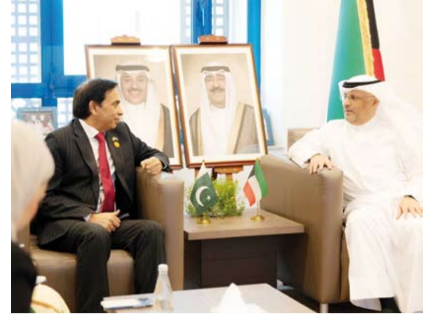
الوزير عمر العمر خلال لقائه سفير باكستان د. ظفر إقبال

بحث وزير الدولة لشؤون الاتصالات وتكنولوجيا المعلومات وزير الإعلام والثقافة بالوكالة عمر العمر، أمس، مع سفير جمهورية باكستان الإسلامية لدى دولة الكويت الدكتور ظفر إقبال سبل تعزيز التعاون المشترك بين البلدين. وقالت وزارة (الاتصالات) في بيان لـ (كونا): إنه تم خلال اللقاء استعراض العلاقات الثنائية التي تجمع البلدين الصديقين والتأكيد على منابقتها وحرص الجانبين على مواصلة تطويرها وتنميتها في مختلف المجالات بما يعكس عمق الروابط المشتركة ويخدم المصالح المتبادلة بينهما. وأضاف البيان أن اللقاء تناول بحث عدد من الموضوعات ذات الاهتمام المشترك وسبل تعزيز التعاون والتنسيق في المجالات ذات الصلة بما يسهم في دعم جهود العمل المشترك وتبادل الخبرات بين البلدين. وذكر أن الجانبين أكدا أهمية استمرار التشاور والتنسيق فيما يخدم المصالح المشتركة ويعزز آفاق التعاون المستقبلي في إطار العلاقات الثنائية القائمة بين دولة الكويت وجمهورية باكستان الإسلامية.