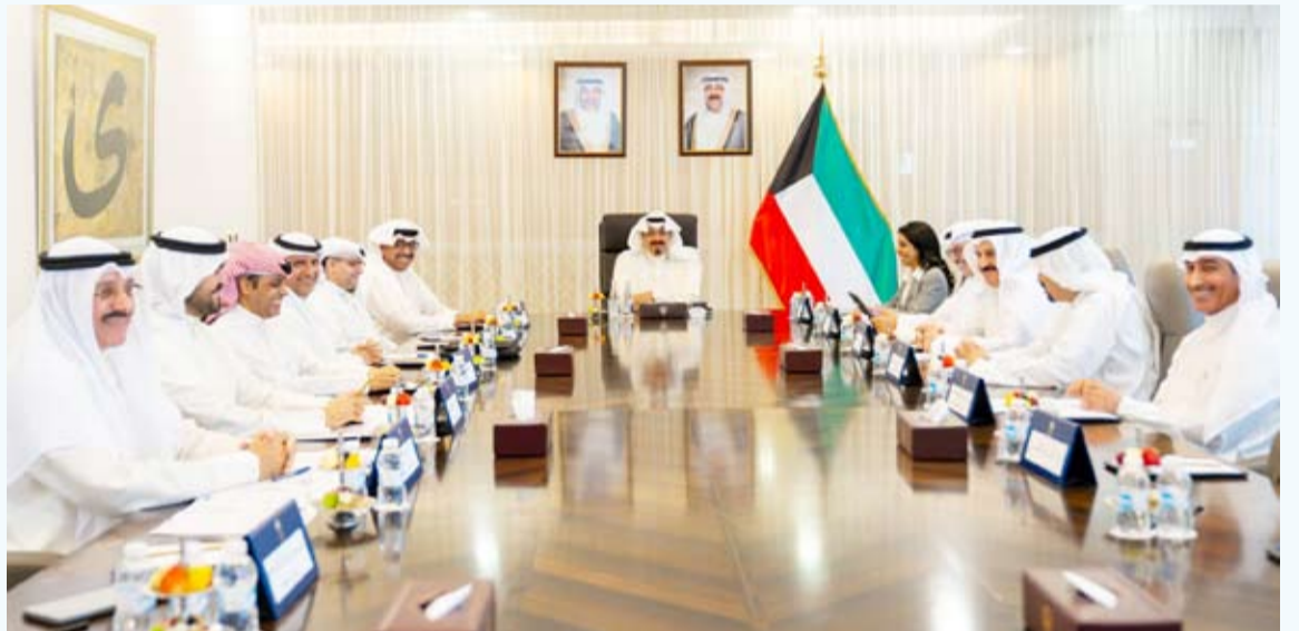
العبد الله يتراس اجتماع اللجنة الوزارية لمتابعة تنفيذ المشاريع التنموية الكبرى

ترأس سمو الشيخ أحمد العبدالله رئيس مجلس الوزراء اجتماعاً لبحث ومتابعة إعادة هيكلة الأجهزة الحكومية والمؤسسات العامة في الدولة وذلك في خطوة استراتيجية تهدف إلى تحديث منظومة الإدارة العامة وترشيق أجهزة الدولة ورفع كفاءتها. ووجه سموه بالعمل على دراسة التفاصيل التنفيذية ومراجعة التشريعات والقوانين المرتبطة بإعادة هيكلة الأجهزة الحكومية والمؤسسات العامة في الدولة بما يضمن العوائد المتوقعة من هذا المشروع من رفع الفاعلية الإدارية والارتقاء بالخدمات العامة فضلاً عن دورها المحوري في مسار الإصلاحات الإدارية الشاملة.