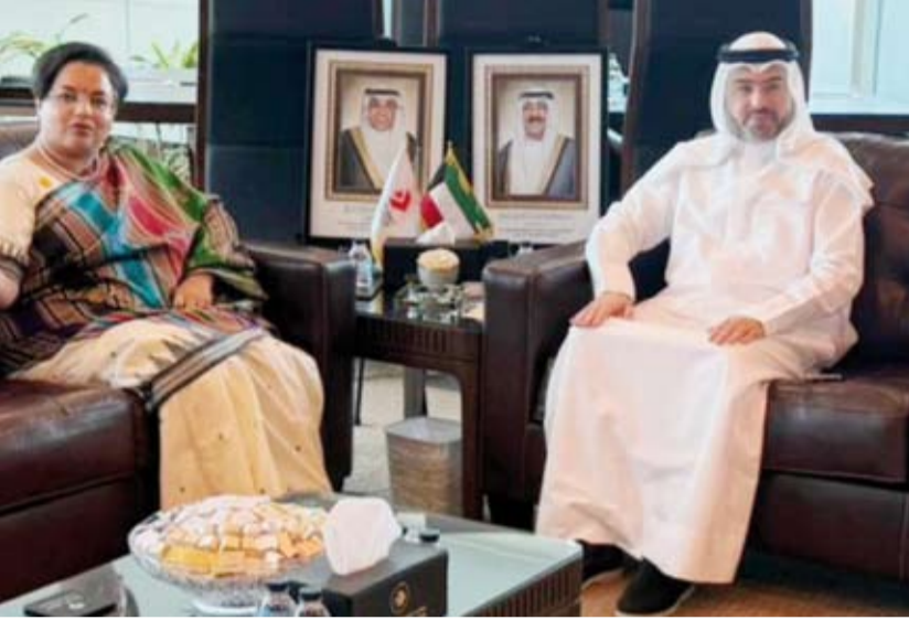
الشيخ حمود المبارك خلال لقائه مع السفيرة الهندية