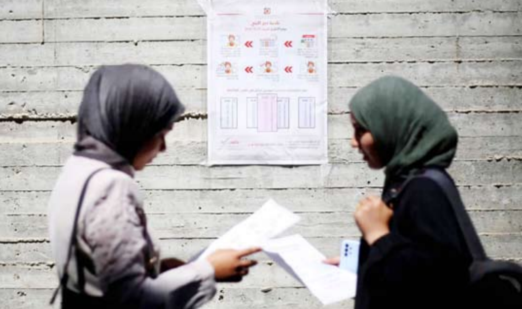
سيداتان فلسطينيتان تقرأن تعليمات التصويت

هي التي تُؤمّن العملية الانتخابية بشكل كامل، ووفقاً للجنة الانتخابات المركزية، فإن من يحق لهم التصويت في دير البلح، وفق السجل المدني، «بلغ نحو 70449 ناخباً وناخبة، سيدلون بأصواتهم في 12 مركزاً للاقتراع».