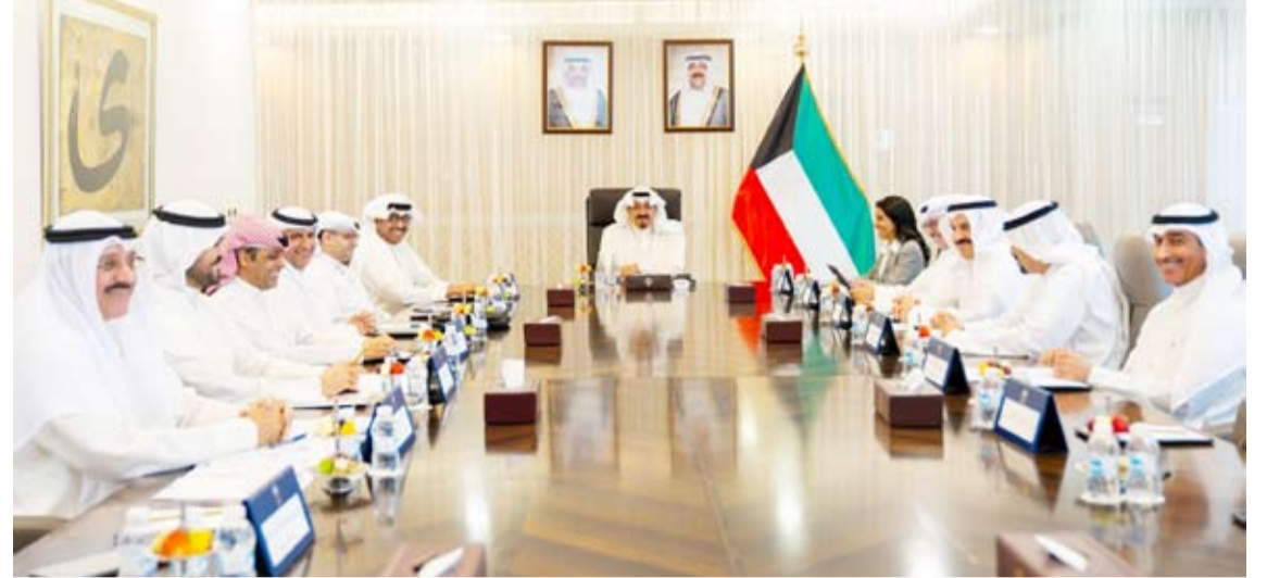
سمو الشيخ أحمد عبدالله يترأس اجتماع اللجنة الوزارية

الدولة ورفع كفاءتها. ووجه سمو رئيس مجلس الوزراء بالعمل على دراسة التفاصيل التنفيذية ومراجعة التشريعات والقوانين المرتبطة بإعادة هيكلة الأجهزة الحكومية والمؤسسات العامة في الدولة بما يضمن العوائد المتوقعة من هذا المشروع من رفع الفاعلية الإدارية والارتقاء بالخدمات العامة فضلاً عن دورها المحوري في مسار الإصلاحات الإدارية الشاملة. وحضر الاجتماع وزير الدولة للشؤون الاقتصادية والاستثمار عبدالعزيز المرزوق، ووزير المالية الدكتور يعقوب الرفاعي، والمستشار بديوان رئيس مجلس الوزراء الدكتور خالد الفاضل، ومدير عام هيئة مشعل جابر الأحمد، ورئيس ديوان رئيس مجلس الوزراء بالإدارة العامة عن دورها المحوري في مسار الإصلاحات الإدارية الشاملة. وحضر الاجتماع وزير الدولة للشؤون الاقتصادية والاستثمار عبدالعزيز المرزوق، ووزير المالية الدكتور يعقوب الرفاعي، والمستشار بديوان رئيس مجلس الوزراء الدكتور خالد الفاضل، ومدير عام هيئة مشعل جابر الأحمد، ورئيس ديوان رئيس مجلس الوزراء بالإدارة العامة عن دورها المحوري في مسار الإصلاحات الإدارية الشاملة. وحضر الاجتماع وزير الدولة للشؤون الاقتصادية والاستثمار عبدالعزيز المرزوق، ووزير المالية الدكتور يعقوب الرفاعي، والمستشار بديوان رئيس مجلس الوزراء الدكتور خالد الفاضل، ومدير عام هيئة مشعل جابر الأحمد، ورئيس ديوان رئيس مجلس الوزراء بالإدارة العامة عن دورها المحوري في مسار الإصلاحات الإدارية الشاملة.