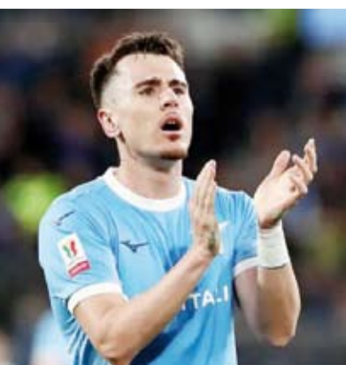
ركلات الترجيح حسمت اللقاء

حجز لاتسيو مقعده في نهائي كأس إيطاليا، عقب فوزه الكبير على مضيفه أتالانتا بركلات الترجيح. وكانت مباراة الذهاب قد انتهت بالتعادل (2-2)، قبل أن تتكرر النتيجة الإجمالية بتعادل الفريقين (1-1) في الإياب، ليتحكم الطرفان إلى ركلات الترجيح التي ابتسمت للاتسيو. وفي ركلات الترجيح، أهدر لاتسيو محاولتين عبر نونو تافاريس ودانييلو كاتالدي، بينما أضع أتالانتا ثلاث ركلات بواسطة جيانلوكا سكاماكوا ودافيدي زاباكوستا وباشاليتش. وبهذا التأهل، يضرب لاتسيو موعداً في النهائي مع إنتر ميلان، الذي بلغ المباراة النهائية بعد فوزه على كومو.