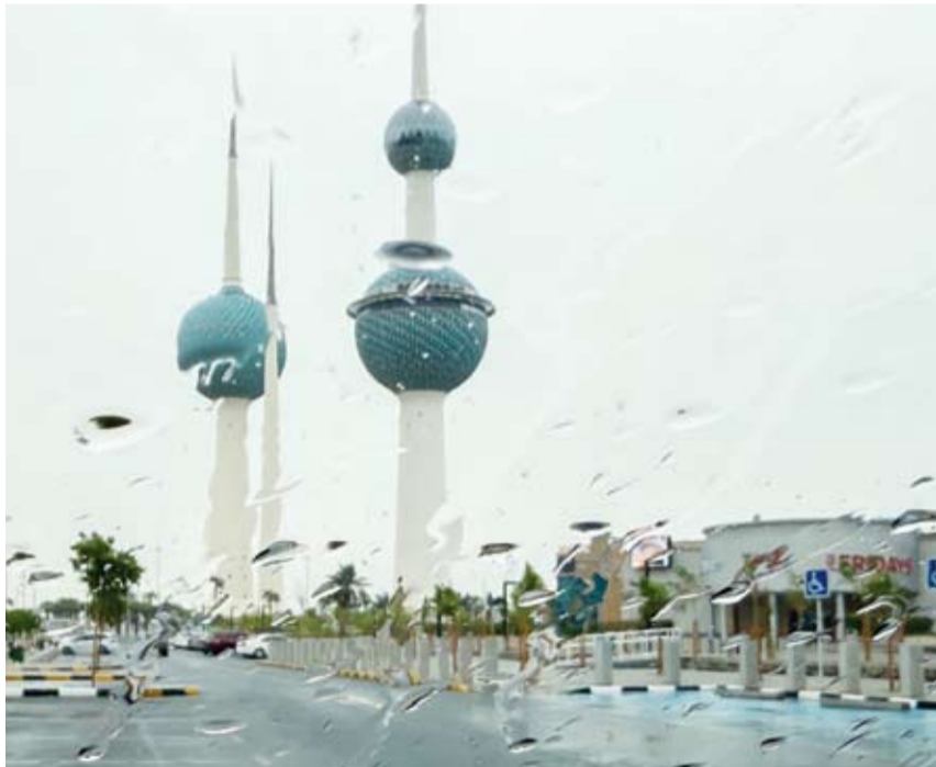
موجة جديدة من الأمطار

نهار اليوم مائل للحرارة وغائم جزئياً إلى غائم، بينما يكون ليلاً معتدل وغائم جزئياً إلى غائم مع فرصة لأمطار متفرقة. وذكر أن الطقس نهار السبت سيكون مائلاً للحرارة وغائم إلى غائم جزئياً مع فرصة لأمطار متفرقة متوسطة. أما ليلاً فيكون معتدلاً وغائماً مع فرصة أيضاً لأمطار متفرقة رعدية وفرصة لتكون الضباب في المساء.