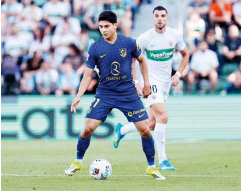
أتلتيكو مدريد يواجه مستويات غير مطمئنة

ويأمل سيميوني في تصحيح المسار سريعاً، قبل مواجهتين مهمتين الأسبوع المقبل على أرضه أمام أتلتيك بلباو في الدوري، ثم آرسنال في ذهاب نصف نهائي دوري أبطال أوروبا. في المقابل، واصل التشي نتائج الإيجابية محققاً فوزه الثاني تواليًا، ليرفع رصيده إلى 35 نقطة في المركز الخامس عشر، مبتعداً خطوة عن مناطق الهبوط، قبل مواجهته المرتقبة خارج أرضه أمام ريال أوفيديو في الجولة المقبلة.