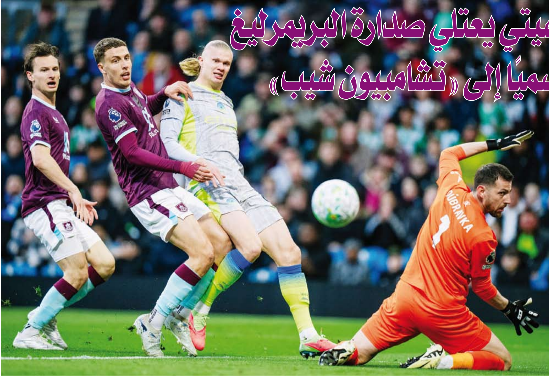
هالاند يسجل هدف للقاء

خطف مانشستر سيتي صدارة الدوري الإنجليزي الممتاز، متقدماً على آرسنال بفارق الأهداف، عقب فوزه على مضيفه بيرنلي (1-0)، في مباراة شهدت هبوط أصحاب الأرض رسمياً إلى دوري «تشامبيون شيب».