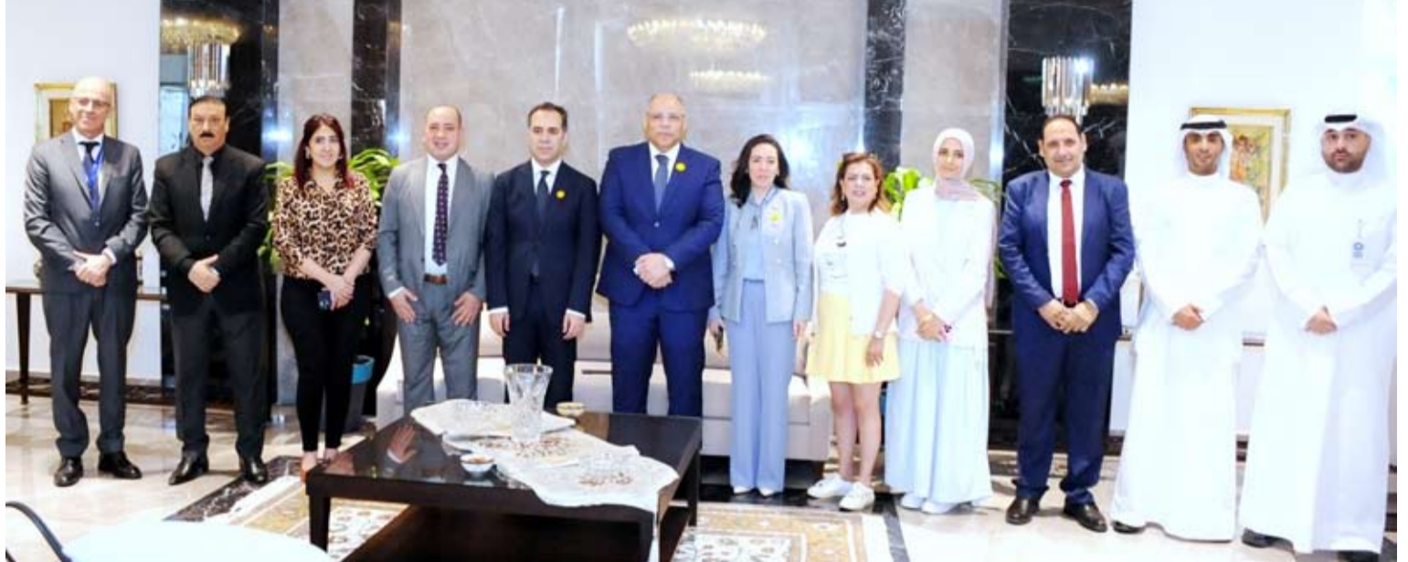
السفير المصري والمستشار محمد علوي خلال اللقاء مع الصحفيين

كما أشار السفير إلى عقد لقاء ثنائي بين وزيرى خارجية البلدين في اليوم ذاته، وهو ثاني لقاء يجمعهما خلال أقل من أسبوعين، بما يعكس عمق العلاقات الأخوية المشتركة، حيث جرى التشاور حول تطورات الأوضاع في المنطقة، والتأكيد على استمرار التنسيق والتشاور الوثيق في ظل ما تشهده المنطقة