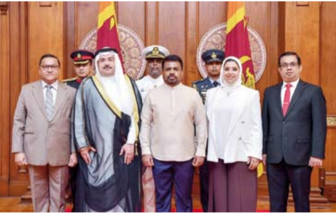
جانب من المراسم