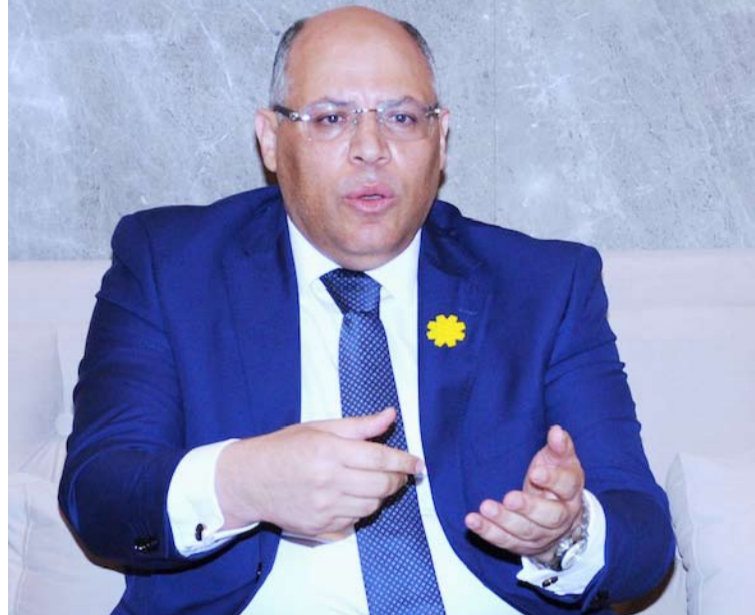
أبو الوفا متحدثا

من تحديات دقيقة. وأكد الوزير أن خلال اللقاء على مواصلة الجهود الرامية إلى الدفع نحو حلول مستدامة للأزمات القائمة، شريطة أن تكون دول الخليج العربية شريكا أساسيا في صياغة هذه الحلول، وبما يضمن حماية مصالحها وصون أمنها واستقرارها. وأضاف «أبو الوفا» أن لقاء وزيرى خارجية البلدين مثل فرصة سانحة لبحث الجهود الرامية إلى وقف التصعيد وإنهاء الحرب، ومستجدات المفاوضات الأمريكية - الإيرانية، حيث اطلع الوزير المصري نظيره الكويتي على نتائج زيارته الأخيرة إلى واشنطن والاجتماع الرباعي الذي عُقد في أنطاليا بتاريخ 18 أبريل 2026 لوزراء خارجية مصر والسعودية وباكستان وتركيا، وتأكيد مصر على أهمية مراعاة الشواغل الأمنية لدول الخليج في أي ترتيبات إقليمية مستقبلية.