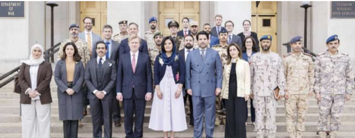
صورة جماعية للمشاركين

شاركت سفيرة دولة الكويت لدى الولايات المتحدة، الشيخة الزين الصباح، مساء أمس الأول، في اجتماع طاولة مستديرة عقد في مقر وزارة الحرب الأمريكية (بنناغون)، وذلك ضمن الجولة الثانية من الاجتماعات التي جمعت سفراء دول مجلس التعاون الخليجي والأردن مع المسؤولين الأمريكيين. وذكرت سفارة الكويت في واشنطن في بيان لها، أنه جرى خلال الاجتماع الذي ترأسه من الجانب الأمريكي وكيل وزارة الحرب لشؤون السياسات البريدج كولبي، استعراض تطورات الأوضاع في المنطقة وبحث عدد من المسارات المرتبطة بتعزيز التنسيق والتعاون المشترك إلى جانب مواصلة دعم القدرات الدفاعية الجماعية. وأضاف البيان أن المشاركين أكدوا أهمية الشراكة الاستراتيجية القائمة بين دول مجلس التعاون والأردن من جهة والولايات المتحدة الأمريكية من جهة أخرى وضرورة مواصلة التنسيق الوثيق بما يسهم في تعزيز الأمن والاستقرار الإقليمي.