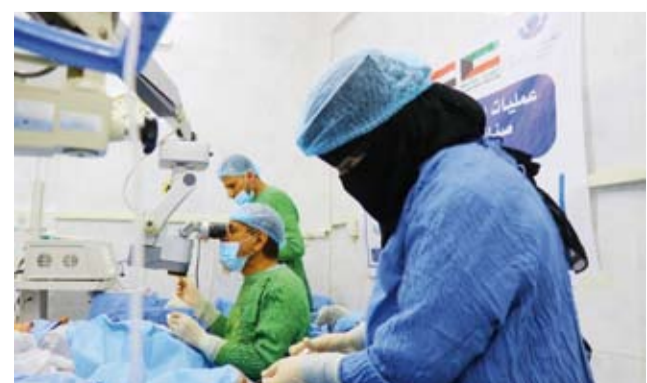
إحدى العمليات الجراحية ضمن مشروع المخيم الطبي

وبيّن الوند أن مشروع الأضاحي يُعد من أعظم القربات إلى الله تعالى، لما فيه من امتثال لأمره سبحانه