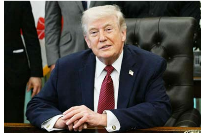
ترامب يأمر بإطلاق النار على أي زورق إيراني يعيق الملاحة

أبلغت الولايات المتحدة الكيان المحتل بأن الرئيس ترامب قرر تمديد مهلة وقف إطلاق النار مع إيران حتى يوم الأحد. كما أصدر ترامب أوامر للجيش الأميركي بـ«إطلاق النار» على الزوارق الإيرانية الصغيرة التي تعيق الملاحة في مضيق هرمز و«تدميرها»، معلناً بدء عمليات إزالة الألغام من الممر البحري الحيوي. وقال ترامب في منشور آخر: إن إيران تواجه صعوبة كبيرة في تحديد من هو قائدها، موضحاً أن الصراع الداخلي يدور بين المتشددين، الذين يتعرضون لخسائر كبيرة في ساحة المعركة، والمعتدلين، الذين ليسوا معتدلين جداً.