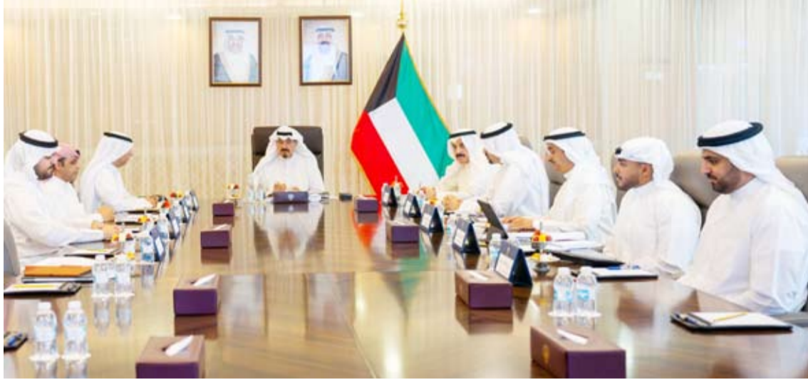
... وسموه يترأس اجتماعاً لبحث ومتابعة إعادة هيكلة الأجهزة الحكومية والمؤسسات العامة في الدولة