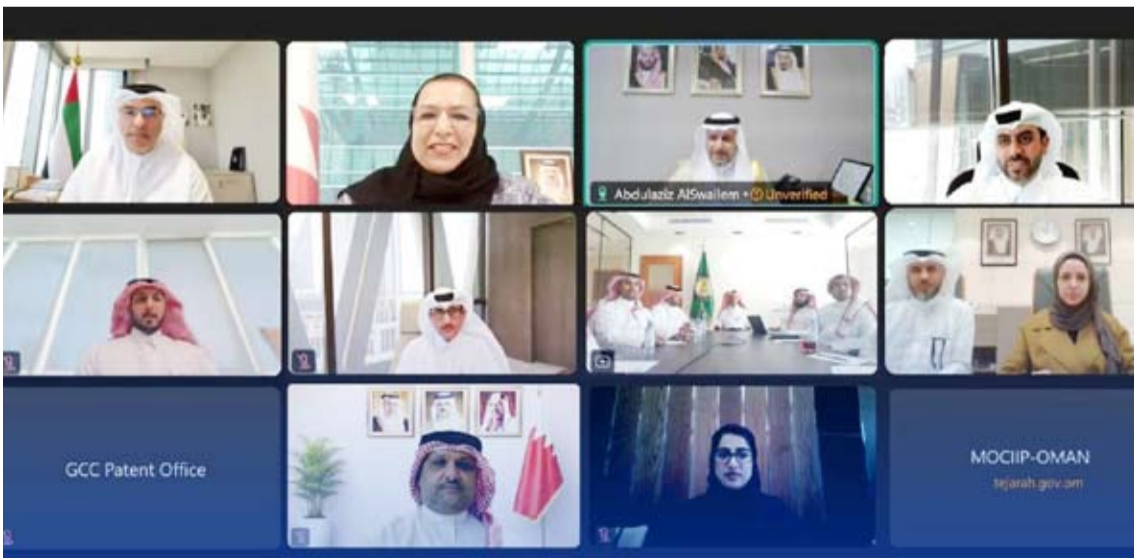
جانب من الاجتماع عبر الاتصال المرئي

اللجنة واختصاصاتها وتسمية المكتب واختصاصاته وحوكمة أعمال اللجنة ونموذج عمل مكتب براءات الاختراع واستراتيجية العمل الخليجي المشترك في مجال براءات الاختراع والمختصة الخليجية لبراءات الاختراع وتكلفتها التقديرية. كما شمل كذلك قواعد عمل لجنة التظلمات ومكافحة أعضائها ولجنة احترام حقوق الملكية الفكرية وتبادل الخبرات في هذا المجال إلى جانب مناقشة موعد الاجتماع القادم وما يستجد من أعمال.