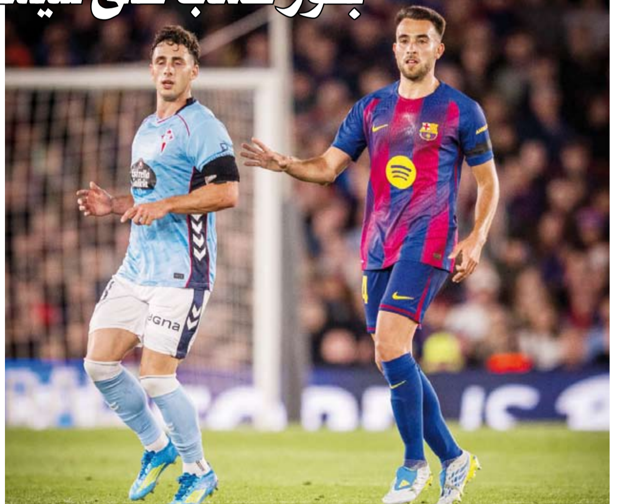
فوز صعب للنادي الكتلوني

في المقابل، تلقى سيلتا فيغو خسارته الثالثة تواليًا، ليتجمد رصيده عند 44 نقطة في المركز السابع، متفوقًا بفارق الأهداف على خبيثافي صاحب المركز السادس.