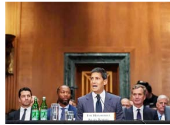
وارش خلال جلسة الاستماع

الرؤساء، أو أعضاء مجلس الشيوخ، أو أعضاء مجلس النواب - آراءهم بشأن أسعار الفائدة. لقد كلف الكونغرس الاحتياطي الفيدرالي بمهمة ضمان استقرار الأسعار، دون أعذار أو مراوغة، أو جدال من العنق 56 عاماً والمحافظ السابق للاحتياطي الفيدرالي: «لا اعتقد أن استقلالية السياسة النقدية مهددة بشكل خاص عندما يُبدي المسؤولون المنتخبون