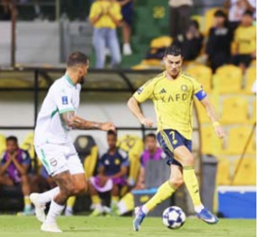
رونالدو يقود النصر إلى نهائي أبطال آسيا

سجل كينغسلي كومان ثلاثة أهداف وأضاف أنجيلو وعبد الله الحمدان هدفاً واحداً لكل منهما، ليقلب النصر تأخره المبكر ويحقق فوزاً ساحقاً 5-1 على الأهلي القطري، في الدور نصف نهائي لبطولة دوري أبطال آسيا 2 لكرة القدم.