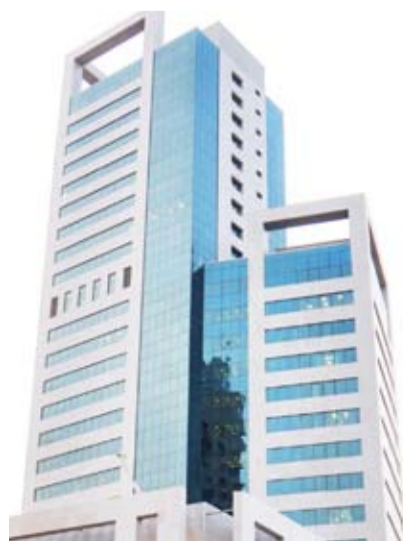
الهيئة العامة لشؤون القصر

أعلنت الهيئة العامة لشؤون القصر، أمس، زيادة حضور العاملين إلى نسبة 50 في المئة اعتباراً من الأحد المقبل وفقاً لمقتضيات المصلحة العامة وحاجة العمل مع تحديد آلية التدوير بين الموظفين من قبل المسؤولين. وذكرت (شؤون القصر) في بيان صحفي لـ (كونا)، أن ديوان الخدمة المدنية وافق على طلب زيادة نسبة تواجد العاملين في الهيئة من نسبة 30 في المئة إلى 50 في المئة. وأضاف أن القرار قد تضمن تحديد نسبة عدد العاملين في مقر العمل بما لا يتجاوز نسبة 50 في المئة من إجمالي عدد الموظفين على أن توزع هذه النسبة بنظام التناوب بين الموظفين ضمن مجموعتين (أ-ب) وتكون طريقة توزيعها (يوم عمل يقابله يوم راحة) بما يضمن استمرارية العمل وتحدد آلية التناوب بشكل يومي.