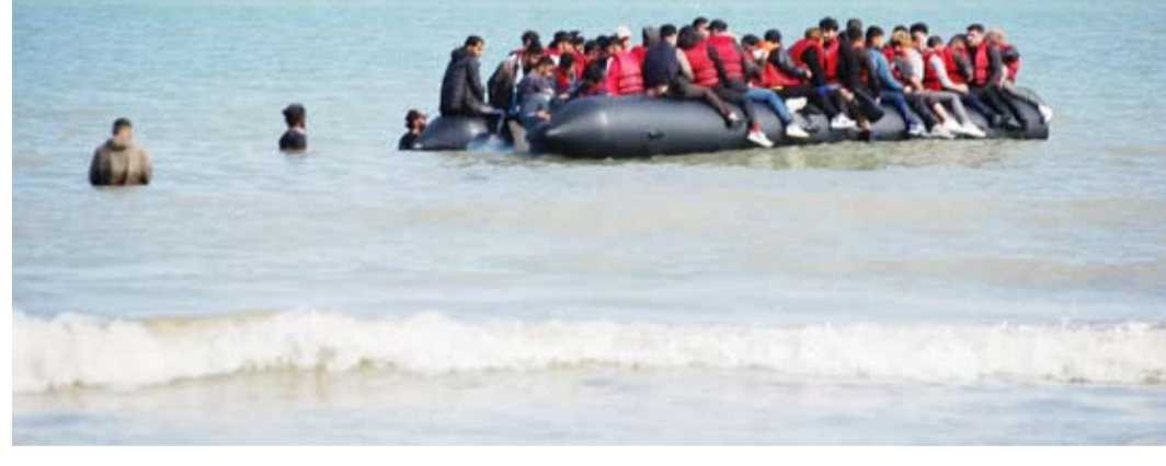
مهاجرون يعبرون بحر المانش

لن تجدد معاهدة ساندهيرست إلا إذا تمكنت من فرض شروط على طريقة استخدام الحكومة الفرنسية لأموال دافعي الضرائب البريطانيين. وحسب الأرقام الرسمية الصادرة عن السلطات البريطانية، وصل 41472 شخصاً إلى المملكة المتحدة المحفوف بالخطر إلى بريطانيا. ولطالما اتهمت المملكة المتحدة فرنسا بأنها لا تفعل الكثير لمنع طالبي اللجوء المحتملين من الانطلاق من الشواطئ الفرنسية حيث يخاطر المهربون والمهاجرون بشكل متزايد لتجنب اكتشافهم.