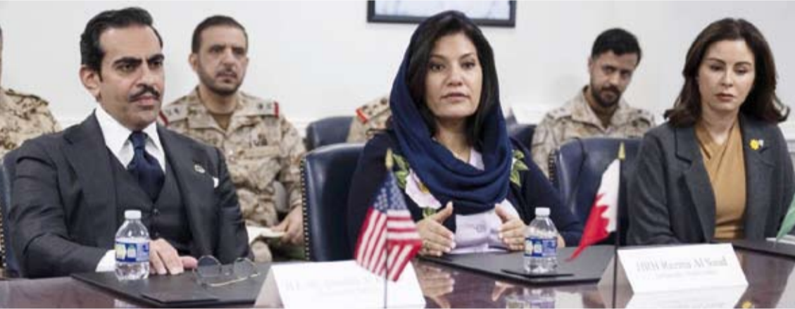
الشيخة الزين الصباح خلال مشاركتها في الاجتماع

شاركت سفيرة دولة الكويت لدى الولايات المتحدة، الشيخة الزين الصباح، مساء أمس الأول، في اجتماع طاولة مستديرة عقد في مقر وزارة الحرب الأمريكية (بنناغون)، وذلك ضمن الجولة الثانية من الاجتماعات التي جمعت سفراء دول مجلس التعاون الخليجي والأردن مع المسؤولين الأمريكيين. وذكرت سفارة الكويت في واشنطن في بيان لها، أنه جرى خلال الاجتماع الذي ترأسه من الجانب الأمريكي وكيل وزارة الحرب لشؤون السياسات البريدج كولبي، استعراض تطورات الأوضاع في المنطقة وبحث عدد من المسارات المرتبطة بتعزيز التنسيق والتعاون المشترك إلى جانب مواصلة دعم القدرات الدفاعية الجماعية. وأضاف البيان أن المشاركين أكدوا أهمية الشراكة الاستراتيجية القائمة بين دول مجلس التعاون والأردن من جهة والولايات المتحدة الأمريكية من جهة أخرى وضرورة مواصلة التنسيق الوثيق بما يسهم في تعزيز الأمن والاستقرار الإقليمي.