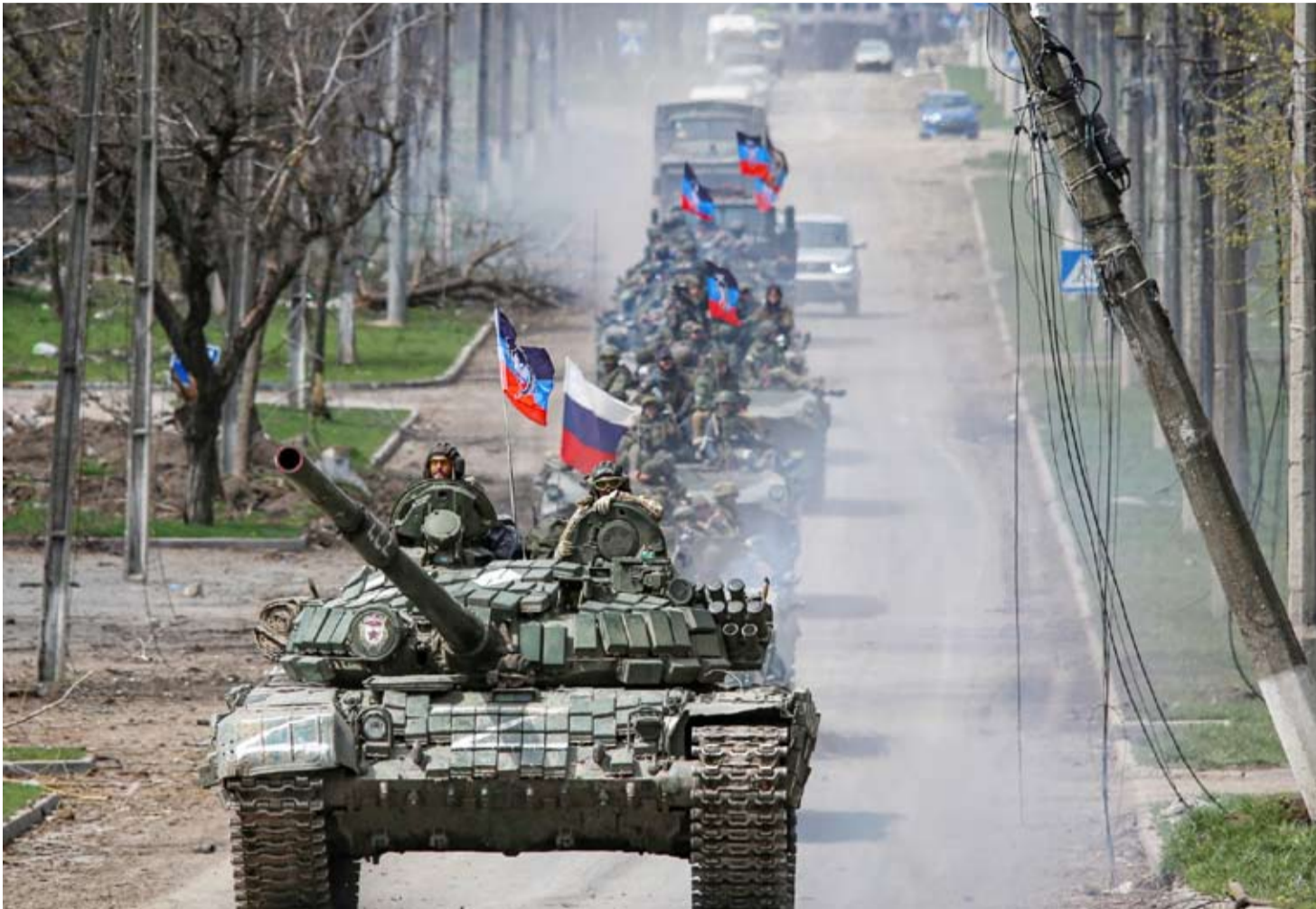
رتل من الدبابات الروسية جنوب أوكرانيا

ألقت الحرب بظلالها الثقيلة على الاقتصاديين الروسي والأوكراني، حيث تواجه كييف تحديات كبيرة في تمويل العمليات العسكرية وإعادة الإعمار، بينما تتعامل موسكو مع ضغوط العقوبات الغربية، رغم نجاحها النسبي في الحفاظ على استقرار بعض القطاعات الحيوية، وعلى رأسها الطاقة.