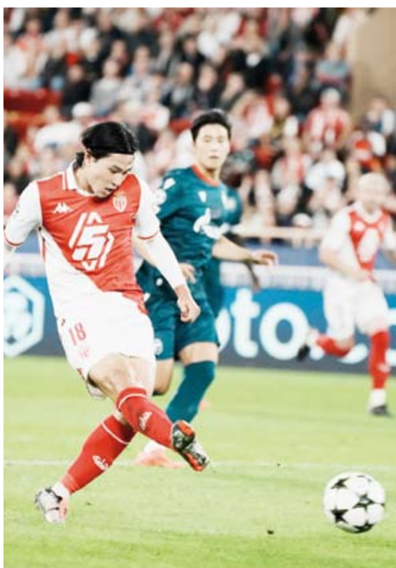
أداء قوي لموناكو أمام ضيفه الصربي

واصل فريق موناكو الفرنسي بدايته الجيدة في المسابقة، بعد فوزه على ضيفه سرفينا زفيدا الصربي (1-5) على ملعب "لويس الثاني" في موناكو. وسجل الياباني تاكومي مينامينو في الدقيقتين (20، 70) والسويسري بريال إيمبولو في الدقيقة (45+) و(4) والإيفواري ويلفريد سنجو في الدقائق (54)، وماجنيس أكليوش في الدقيقة (690+) أهداف موناكو، والسنگالي شريف ندي في الدقيقة (27) هدف سرفينا زفيدا. ورفع موناكو بفوزه الثاني مقابل تعادل وحيد، رصيده إلى 7 نقاط وانفرد مؤقتا بصدارة الترتيب العام للمجموعة، فيما منى سرفينا زفيدا بهزيمة ثالثة على التوالي وظل بلا نقاط في المركز الـ36 والأخير.