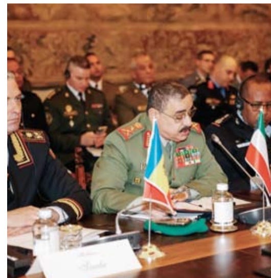
الفريق هاشم الرفاعي متحدثاً

سنوات لافتاً إلى استضافة الكويت بنجاح مؤتمر القوى البشرية للاتحاد الدولي لقوات الشرطة والدرك ذات الطابع العسكري (FIEP) في ديسمبر العام الماضي بمشاركة وفود 14 دولة وقد حظي بإشادة الأعضاء في المؤتمر الحالي. وقال وكيل الحرس الوطني إن المؤتمر الحالي شهد تسليم الرئاسة من إيطاليا إلى فرنسا،