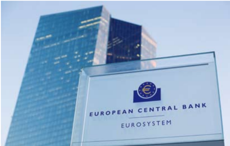
جانب من رحلة المعرفة في الكويت

وأكدت لاغارد أنه ربما يكون أعلى الآن مما كان عليه قبل بضع سنوات، ولكنه أقل من المعدل الحالي، الذي لا يزال يقيد النشاط الاقتصادي بشكل واضح. وقالت: «لذلك، إذا سألتني: أين هو فإن الإجابة الصادقة هي: لا أعلم».