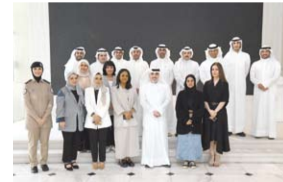
لقطة جماعية للمشاركين

اختتم مركز (كونا) لتطوير القدرات الإعلامية، أمس، برنامج المتحدثين الرسميين (مهارات الحديث وتقنيات المتحدث الرسمي للمؤسسات الحكومية) بمشاركة عدد من منتسبي وكالة الأنباء الكويتية (كونا) ووكالة الأنباء القطرية (قنا) ووزارة الداخلية ووزارة النفط ومؤسسة البرترول الكويتية والهيئة العامة للشباب وبنك وربة.