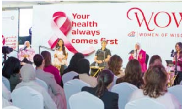
جانب من الندوة

والفعاليات التوعوية لزيادة الوعي الصحي بالمرض، وتشجيع النساء على الفحص الدوري لتسهيل الاكتشاف المبكر للمرض. وتعد الفعاليات والندوات التي ينظمها البنك بمثابة دعوة لموظفاته وعملياته بأهمية الكشف المبكر، والعمل على تشجيع نساء المجتمع على إجراء الفحص المبكر وحماية المجتمع من أخطار هذا المرض.