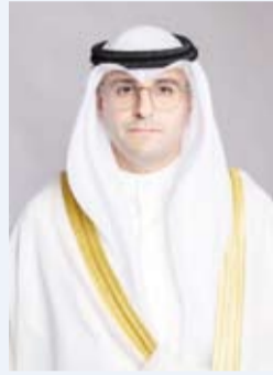
وزير الدولة لشؤون البلدية

ووجه وزير الدولة لشؤون البلدية ووزير الدولة لشؤون الإسكان عبداللطيف المشاري بربط حجز مواقع التخيم مع تطبيق «سهل».