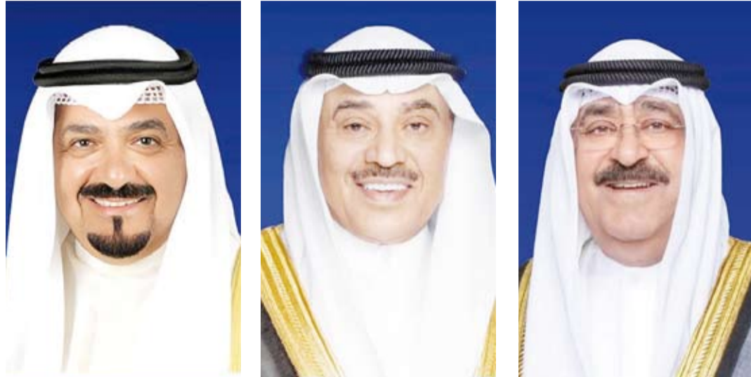
سمو الشيخ أحمد عبدالله رئيس الوزراء