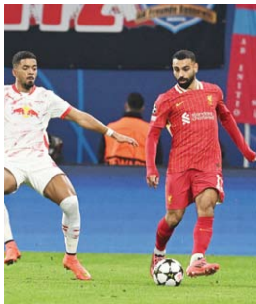
الريدز يواصل حصد النقاط

الممتاز، حيث يسعى فريق المدرب الهولندي آرنه ستول لاحتفاظ بقمة ترتيب البطولة.