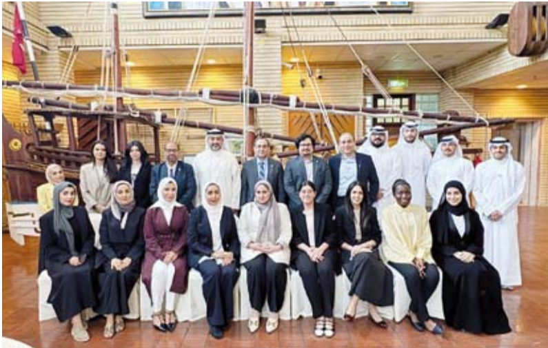
جانب من رحلة المعرفة في الكويت

البشرية وتعزيز مشاركة الشباب في تحقيق التنمية المستدامة، انطلاقاً من إيمانها بأن الشباب هم قادة التغيير، ومن خلال رفدهم بالمعرفة والخبرات يمكّننا بناء اقتصاد قوي ومتنوع».