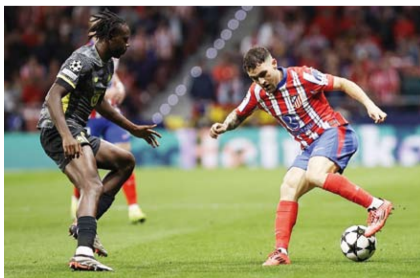
هزيمة مفاجئة لاتلتيكو أمام ليل الفرنسي

منى فريق أتلتيكو مدريد الإسباني بخسارة مفاجئة أمام ضيفه ليل الفرنسي (1-3) على ملعب سيفيتاس ميتروبوليتانو في مدريد، حيث سجل أهداف ليل إيدون زيجروفا في الدقيقة (61)، والكندي جوناثان دايفيد في الدقيقتين (74) من ركلة جزاء (89)، فيما سجل الأرجنتيني جوليان غاريز في الدقيقة (8) هدف أتلتيكو مدريد. ورفع ليل رصيده إلى 6 نقاط في المركز الـ15، فيما منى أتلتيكو مدريد بهزيمته الثانية مقابل فوز، وتجمد رصيده عند 3 نقاط في المركز الـ27. وأخيرا، أهدر بنفيكا