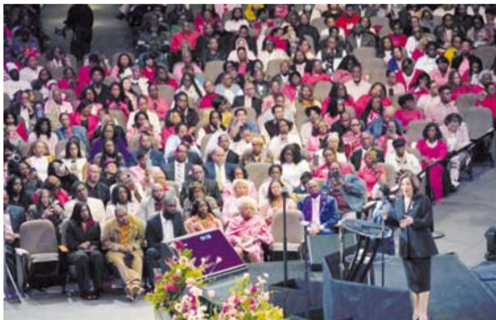
هاريس في تجمع انتخابي

عثر مسؤولون على أكثر من 200 قطعة سلاح في منزل رجل من ولاية أريزونا تم إلقاء القبض عليه على خلفية إطلاق نار على مكتب حملة مرشحة الحزب الديمقراطي في انتخابات الرئاسة الأميركية كامالا هاريس.