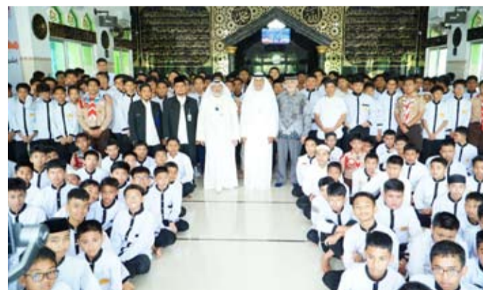
جانب من افتتاح المشروع

بوضع حجر الأساس لبناء مدرسة ابتدائية بمسجد يتسع لـ 200 مصل و144 طالباً، إلى جانب وضع حجر الأساس لسكن للطالبات بنجع جامعة الوفاء التي دشنتها الجمعية وأصبحت منارة علمية لآلاف الطلاب في مختلف التخصصات، كما توجه الحداد بالشكر لأهل الخير في كويت الخبير على تبرعاتهم المباركة في مختلف أصقاع الدنيا، ونقتهم في دعم المشروعات التنموية التي دشنتها والجهات المختلفة التي تمد يدها بدعم العون لمختلف المؤسسات الخيرية داخل وخارج الكويت، مسائلاً الولي العلي القدير أن يحفظ الكويت أميراً وحكومة وشعباً، وأن يديم عليها الأمن والأمان والسكينة والاستقرار.