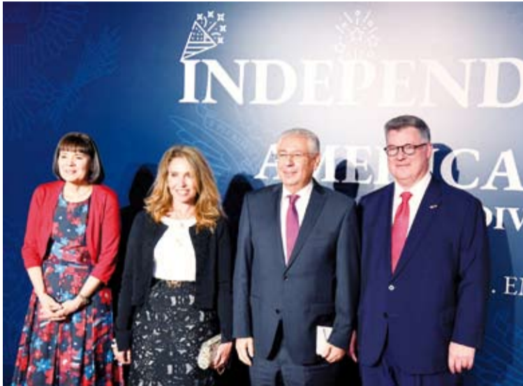
السفيرة الأمريكية تستقبل المهثين

ولفتت إلى أن العام الجاري 2024 يشهد إجراء أكثر عدد من الانتخابات حول العالم فأكث من 100 دولة ستشهد إجراء انتخابات ديمقراطية "مشيرة إلى أن "كل شخص له دور أو صوت في نهضة بلده وتطورها"