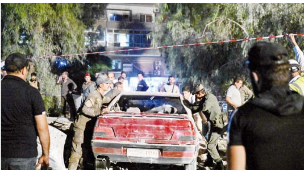
غارة في ضاحية المزة بدمشق

أفاد مصدر عسكري سوري بمقتل جندي وإصابة سبعة في ضربات إسرائيلية على دمشق وحمص استهدفت نقطتين في حي كفر سوسة في العاصمة دمشق وإحدى النقاط العسكرية في ريف حمص. وأوضح المصدر أن الهجوم نفذ حوالي الساعة 0340 بالتوقيت المحلي، مشيراً إلى أن «العدو الإسرائيلي شن عدواناً جدياً من اتجاه الجولان السوري المحتل ومن اتجاه شمال لبنان». وأضاف أن الهجوم أسفر كذلك عن أضرار مادية. قال مسؤول رفيع في الأمم المتحدة إن سوريا تتراجع على حافة «عاصفة» عسكرية وإنسانية واقتصادية، محذراً من العنف المتصاعد داخل البلاد وتمدد النزاعات من غزة ولبنان.