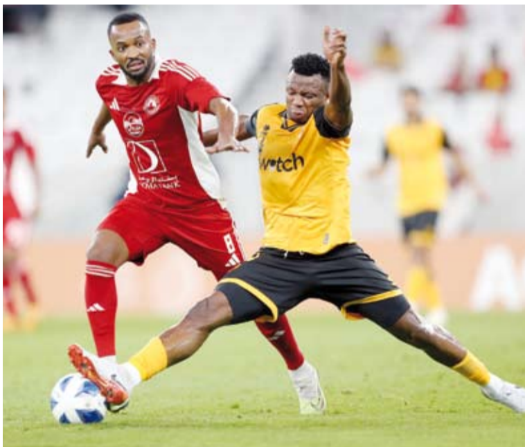
مباراة قوية بين القادسية والعربي القطري