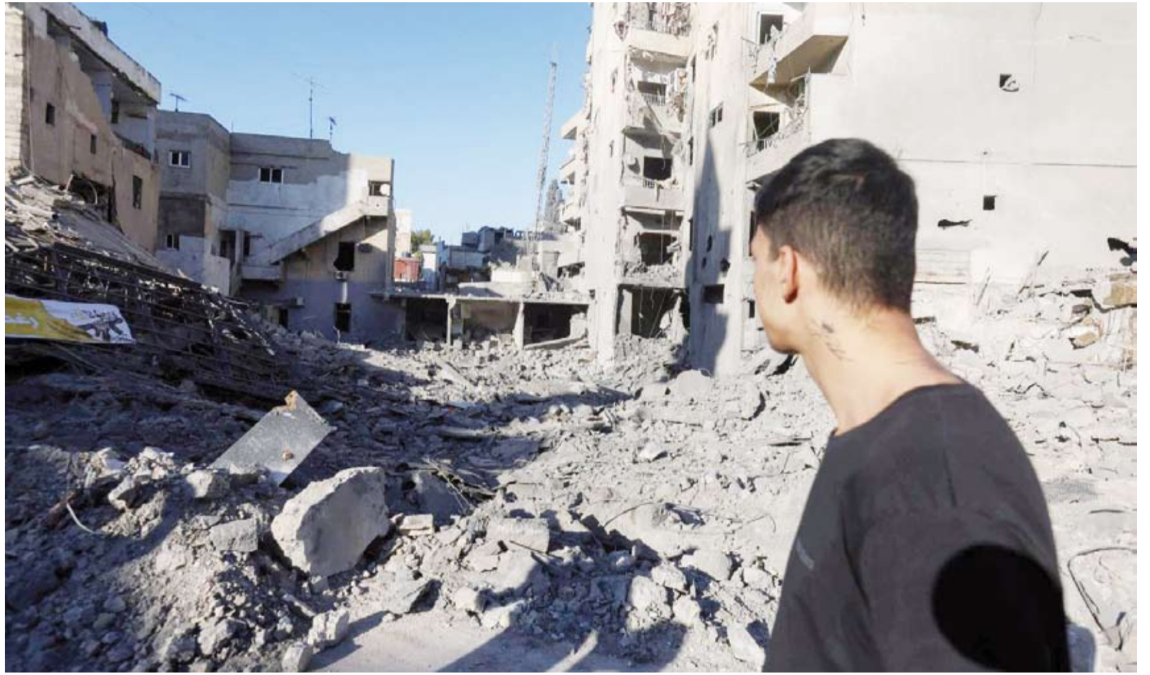
موقع قصف وسط مدينة صور

أعلن الجيش الإسرائيلي، استهداف منشآت لإنتاج وتخزين الأسلحة عائدة لجماعة «حزب الله» اللبناني، في غارات ليلية نفذها طالت الضاحية الجنوبية لبيروت. وقال الجيش، في بيان: «خلال الليل، نفذ سلاح الجو بتوجيه استخباري، غارات على منشآت عدة لتخزين الأسلحة وتصنيعها تابعة لمنظمة حزب الله في منطقة الضاحية» الجنوبية، مشيراً إلى أنها تقع «تحت وداخل المباني المدنية». وأضاف البيان أن الجيش «اتخذ العديد من الخطوات للتخفيف من خطر إيذاء المدنيين بما في ذلك تعميم تحذيرات مسبقة للسكان في المنطقة». وكان الإعلام الرسمي اللبناني قد أفاد بأن الدولة العبرية شنت 17 غارة على الضاحية الجنوبية، أدى بعضها إلى تسوية 6 مبانٍ بالأرض، وفق ما نقلته «الصحافة الفرنسية». وقالت الوكالة الوطنية للإعلام إن ستة مبانٍ دُمّرت في محيط منطقة الليك، وأصفت الغارات بأنها «الأكثر عنفاً في المنطقة منذ بداية الحرب». من جهته، أعلن الإسعاف الإسرائيلي، إصابة شخصين بجروح خطيرة جراء صواريخ أطلقت من لبنان على شمال إسرائيل. وقالت نجمة داود الحمراء، وفق ما أورده قناة 13 الإسرائيلية، إن «شخصين أصيبا بجراح خطيرة في نهاريا»، موضحة أن صفارات الإنذار دوت في نهاريا والمنطقة المحيطة بها في الليل الأعلى.