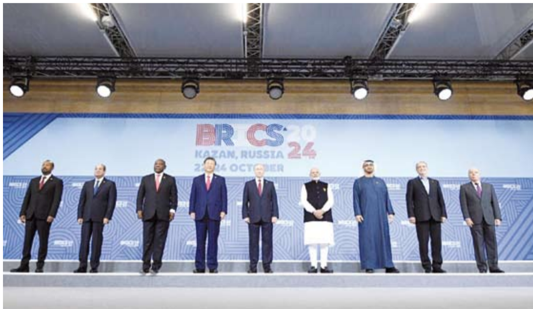
زعماء مجموعة بريكس

افتتح الرئيس الروسي فلاديمير بوتين الشق الرسمي لأعمال قمة مجموعة «بريكس»، التي تستضيفها بلاده بصفتها رئيساً للمجموعة هذا العام، بحضور زعماء وممثلين من أكثر من 30 بلداً، ومنظمة إقليمية ودولية، في حدث عُقد الأضخم الذي تحتضنه موسكو منذ اندلاع الحرب الروسية-الأوكرانية في عام 2022، وعزز وفقاً لوجهة النظر الروسية، القناعة بفشل الغرب في عزل روسيا ومقاطعة بوتين.