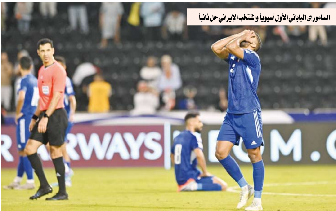
الساموراي الياباني الأول آسيويا والمنتخب الإيراني حل ثانيا