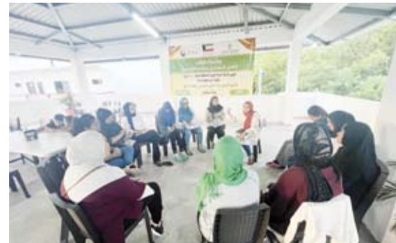
جانب من مشروع «كوادر»

اختتمت الهيئة الخيرية الإسلامية العالمية بنجاح مشروع «كوادر» لتأهيل المعرفين بالثقافة الإسلامية في دولة السلفادور، والذي يهدف إلى سد العجز الكبير في أعداد الكوادر الدعوية في السلفادور. وقد تم تنفيذ المشروع بتمويل من الهيئة الخيرية بقيمة 56.400 دولار، في استجابة للحاجة الماسة لتعزيز الثقافة الإسلامية بين المسلمين والمجتمع العام في السلفادور.