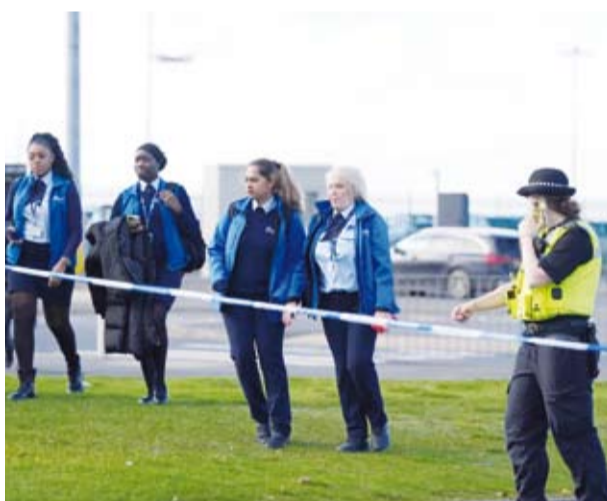
إخلاء مطار برمنغهام في وسط إنجلترا

أعلنت الشرطة، أن الرحلات استؤنفت بعد الظاهر في مطار برمنغهام بوسط إنجلترا الذي تم إخلاؤه قبل ساعات بعد الإبلاغ عن «سيارة مشبوهة».