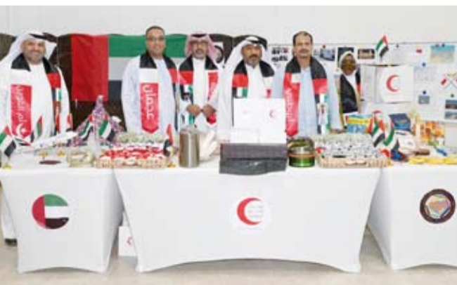
جانب من الاحتفالية

ولفت إلى أن هذه المناسبة تأتي تكريماً لجهود المتطوعين في خدمة الإنسانية وتزامناً وذكراً لانعقاد أول اجتماع لجمعية الهلال الأحمر الخليجي في عام 1984 بالعاصمة الإماراتية أبو ظبي.