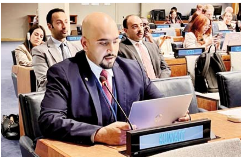
الملحق الدبلوماسي عبدالله العبيد

مركز أبحاث العلوم البيئية والحياتية في معهد الكويت للأبحاث العلمية كمرکز تعاون لدى الوكالة لدراسة التلوث الإشعاعي في البحار للأعوام 2023-2024.