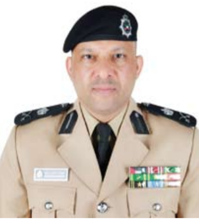
اللواء يوسف الخده

وأضاف أن الفئة الثانية هي لمن (قاد مركبة تحت تأثير المسكرات أو المخدرات أو المؤثرات العقلية وتسبب في إتلاف أملاك الدولة أو أملاك الغير) فغرامتها لا تقل عن ألفي دينار (نحو 6527 دولاراً) ولا تزيد على ثلاثة آلاف دينار (نحو 9791 دولاراً) والحبس لا يقل عن ستة ولا يزيد على ثلاث سنوات.