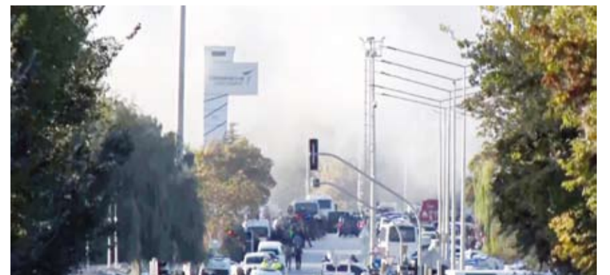
موقع الهجوم على شركة «توساش»

منشآتها لأسباب أمنية. وشدد الرئيس التركي رجب طيب إردوغان، خلال مشاركته في قمة مجموعة «بريكس» بروسيا، على أن تركيا لن تتسامح مع الإرهاب وستواصل مكافحته بكل حزم. بدوره، قال وزير الداخلية، علي يرلي كايا، إنه تم القضاء على مسلحين في الهجوم. وأظهرت صور لكاميرات مراقبة 3 مهاجمين قدموا بسيارة أجرة، فجر أحدهم قنبلة، ودخل الأخران الشركة، حيث سمع دوي إطلاق نار، وتحدثت وسائل إعلام عن وجود رهائن داخل مقر الشركة. ولم تعلن أي جهة مسؤوليتها عن الهجوم على الفور، فيما تواصل نيابة أنقرة تحقيقاتها لكشف أبعادها.