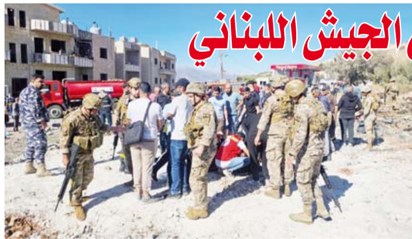
عناصر من الجيش اللبناني

وترتفع بذلك حصيلة القتلى من الجيش اللبناني إلى 6 بعد مقتل 3 عسكريين الأحد الماضي في استهداف آلية تابعة له على طريق عين إبل - حانين جنوب البلاد. ويشن الجيش الإسرائيلي منذ نهاية سبتمبر الماضي غارات جوية مستهدفة مجمل قرى جنوب وشرق لبنان والضاحية الجنوبية لبيروت، فيما يواصل مقاتلو «حزب الله» إطلاق صواريخ على الأراضي الإسرائيلية.