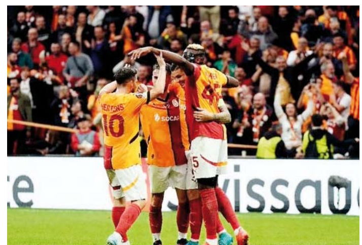
صدارة مؤقتة لغلطة سراي

انفرد غلطة سراي التركي بالصدارة مؤقتا بفوزه على ضيفه إفسبورغ السويدي (4-3) في إسطنبول في افتتاح الجولة الثالثة من مسابقة الدوري الأوروبي (يوروبا ليغ) لكرة القدم. وهذا الفوز هو الثاني لغلطة سراي بعد تغلبه على ضيفه باوك سالونيك اليوناني في الجولة الأولى، وتعادله مع مضيغه أف أس اللاتفي، ليرفع رصيده إلى سبع نقاط في الصدارة مؤقتا بفارق نقطة واحدة أمام لاتسيو الإيطالي، وليون الفرنسي، وأف سي أس بي الروماني، وتوتنهام هوتسبير الإنجليزي، وأندرلخت البلجيكي. في المقابل، منى إفسبورغ بخسارته الثانية بعدما انهزم أمام مضيغه الكمار الهولندي، مقابل فوز على روما الإيطالي،