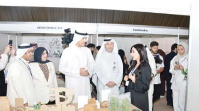
محافظ الأحمدية خلال جولة في المعرض

وأكد العبدان أن معرض "الأحمدية 2024" جاء استكمالاً للتعاون المستمر ومن منطلق الشراكة الاستراتيجية بين المحافظة وشركة نطق الكويت وقناعة "الشركة" بأهمية التواصل المجتمعي مع مختلف الأنشطة الثقافية والصحية والاجتماعية والرياضية التي تنظمها المؤسسات الإعلامية بقطاعاتها المختلفة ولوسائل الهيئات وأنشطة وفعاليات محافظة الأحمدية على نحو خاص.