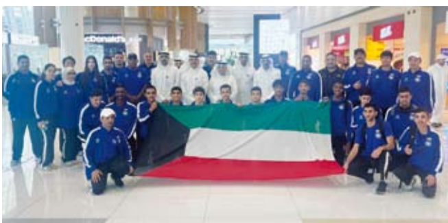
وفد الكويت المشارك في البطولة

وتم خلال الاجتماع اعتماد محضر الاجتماع السابق المنعقد في المكسيك العام الماضي ومناقشة ميزانية الاتحاد الدولي للرياضة المدرسية لعامي 2024 و2025 والإطلاع على عرض عن أبرز أنشطة وفعاليات الاتحاد في الفترة المقبلة وغير ذلك من المحاور المدرجة ضمن جدول الأعمال مع الاستماع إلى اقتراحات وآراء الأعضاء من مختلف الدول.