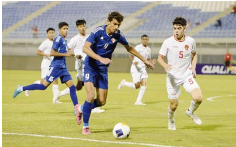
جانب من مباراة الأزرق أمام نظيره الإندونيسي

وبهذه النتيجة حصد منتخب إندونيسيا النقاط الثلاث الأولى له في التصفيات فيما بقي منتخب الكويت من دون رصيد. وتستضيف البلاد مباريات المجموعة السابعة من التصفيات والتي تضم بجوار الكويت وإندونيسيا أستراليا وجزر ماريا الشمالية.