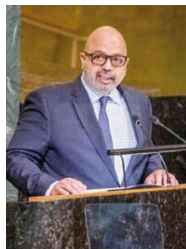
السكرتير طارق البنائي

أكد مندوب دولة الكويت الدائم لدى الأمم المتحدة، السفير طارق البنائي، أمس، أن إصلاح المنظومة الأوسع للأمم المتحدة وكذلك مجلس الأمن الدولي "أصبح ضرورة ملحة" لضمان قدرتها على مواكبة التطورات وتلبية تطالعات الشعوب في ضوء التحديات المتزايدة التي يواجهها العالم.