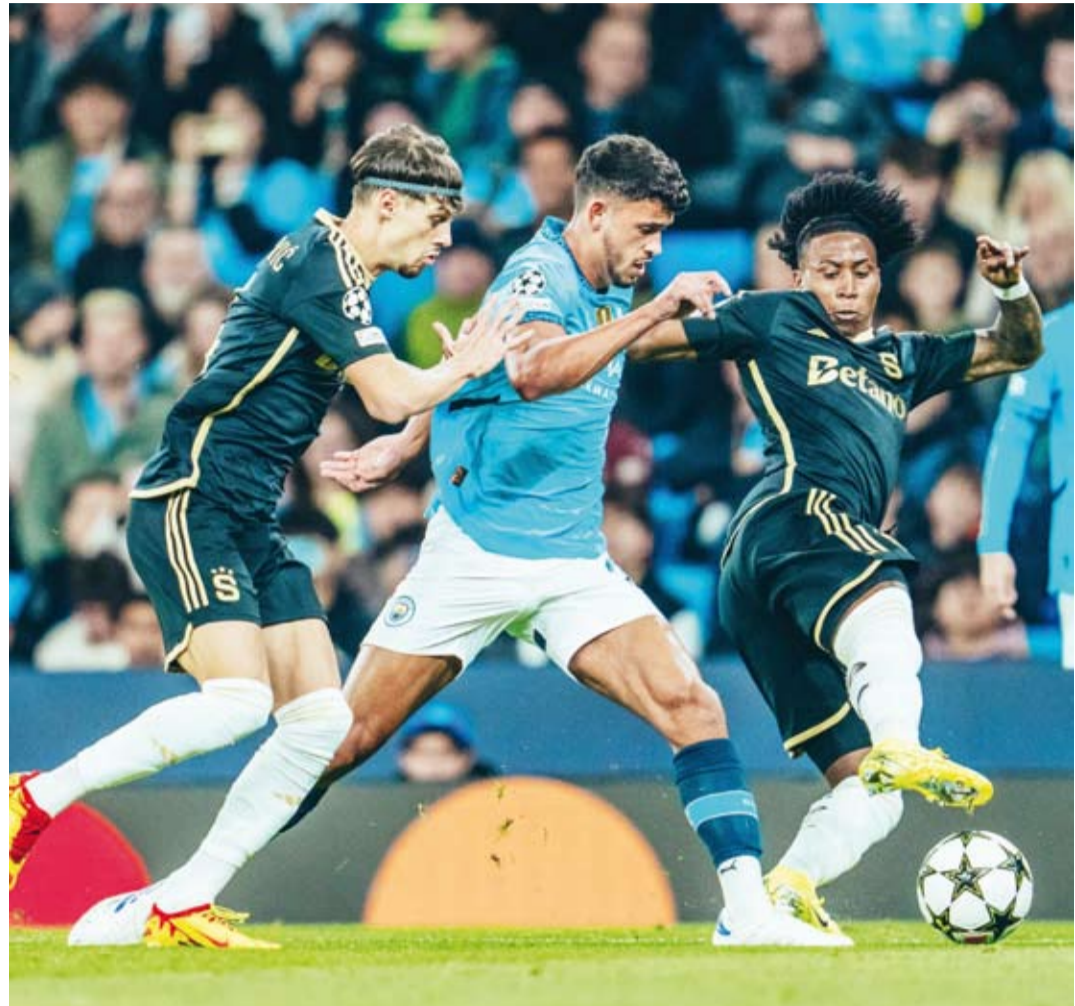
حصار ثنائي للاعب سيتي

في المقابل، تغلب سبارتا براغ 3-0 صفر على ضيفه ريد بول سالزبورغ النمساوي في الجولة الافتتاحية، ثم تعادل 1-1 مع مضيغه شتوتغارت الألماني في الجولة الثانية.