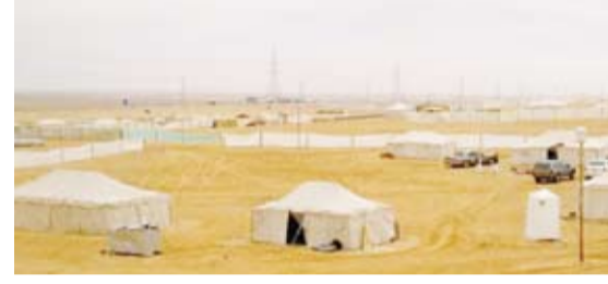
مخيمات في البر

بها جنوب البلاد والتأكد من جاهزيتها وخلوها من أي عوائق وتوفير الحاويات بمختلف المقاسات، وأهابت البلدية بالمواطنين الراغبين بالتخيم هذا العام عدم إقامة مخيماتهم قبل الفترة الرسمية المحددة من قبل البلدية التي تبدأ بتاريخ 15 نوفمبر المقبل حتى 15 مارس.