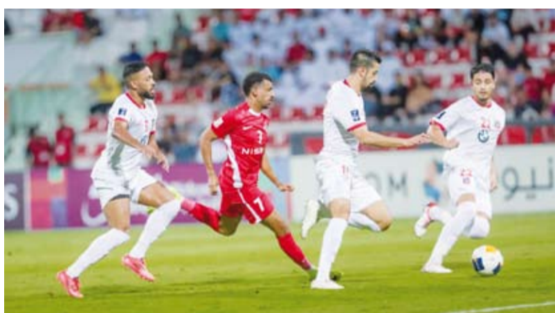
محاولة بيضاء للكويت