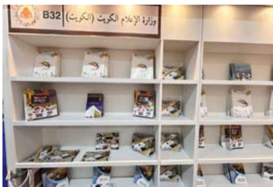
جانب من الجناح

وحول إشادة جمهور المعرض بدعم الكويت للثقافة الفلسطينية أكد الرفدي أن القضية الفلسطينية بالنسبة للكويت «قضية مبداء» وأنها تتقف مع الأشقاء