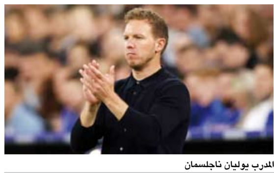
المدرب يولييان ناغلسمان

2028 وقال في هذا الصدد: "نحن على الطريق الصحيح ونريد الاستمرار في التطور، ونريد إحراز الألقاب". وكان ناغلسمان، قد تولى تدريب المنتخب الألماني، في شهر سبتمبر 2023، خلفا للمدرب هانز فليك، وقاد المنتخب الألماني في يورو 2024، ووصل إلى ربع