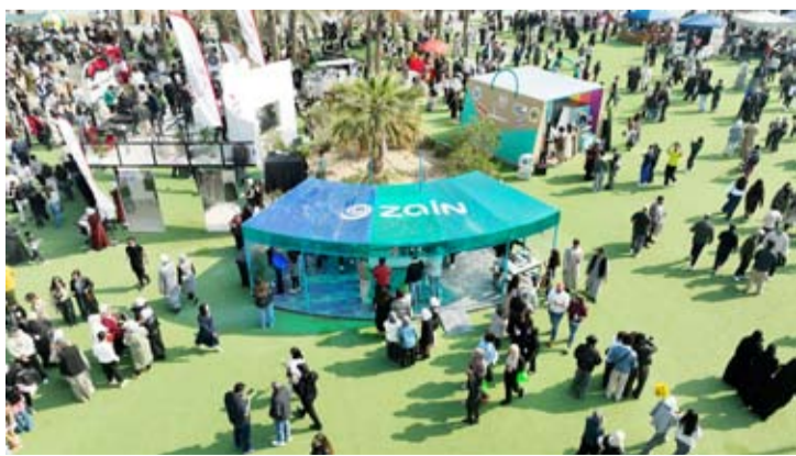
جناح زين في قوت ماركت

أعلنت زين عن عودتها كشريك رئيسي للموسم الحادي عشر من «قوت ماركت» - التجمع الأبرز من نوعه لأصحاب المشاريع الصغيرة والمتوسطة الناشئة في الزراعة والغذاء والحرف اليدوية، وذلك تشجيعاً للمواهب والطاقات الشبابية والإبداعات الوطنية ودعماً للمنتجات المحلية. أقيم التجمع هذا العام في واحة مشرف وسط أجواء شتوية جميلة، بمشاركة ما يقارب 100 جهة من الشركات الصغيرة والمزلية والمشاريع المحلية المبدعة من مختلف المجالات، وبحضور آلاف الزوار من العائلات والأطفال والشباب الذين قضاوا أوقاتاً ممتعة، وسبقهم السوق القادم يوم السبت 22 فبراير 2025.