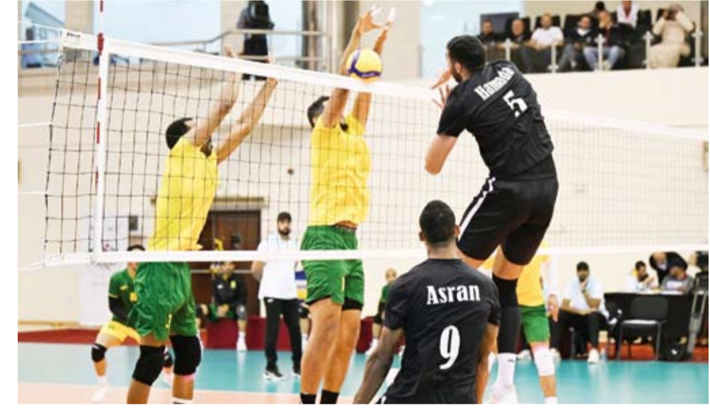
الأهلي عبر السيب العماني إلى النهائي