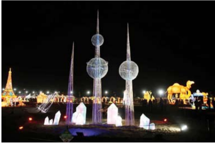
جانب من «المدينة المضيئة»