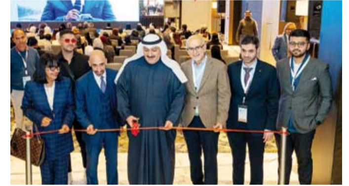
وزير الصحة د. أحمد العوضي يفتتح المعرض المصاحب

ومستشفياتها وما تمتلكه من أجهزة وأدوية وغرف الأوكسجين في مختلف المستشفيات بطاقة قد تصل إلى 12 مريضاً وما تقوم به من أبحاث علمية جميعها تصب في مصلحة أهل الكويت والمقيمين على أرضها علاوة على التوعية الشاملة وتحديد التوعية بأخطار