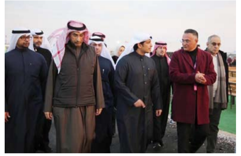
وزير الإعلام خلال جولة في «المدينة المضيئة»

العام للمجلس الوطني للثقافة والفنون والآداب الدكتور محمد الجسار وعدد من مسؤولي وزارة الإعلام وجمع من المواطنين والمقيمين، فيما قدمت فرقة الجفر للفنون الشعبية السعودية وصلات غنائية متميزة من التراث الخليجي.