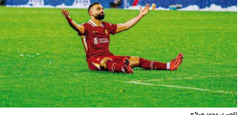
المصري محمد صلاح

أكد النجم المصري محمد صلاح مهاجم ليفربول الإنجليزي، على رغبته في الفوز بلقب الدوري الإنجليزي الممتاز مرة أخرى قبل رحيل جميع اللاعبين المتبقين منذ التتويج الأخير، مشيراً إلى أنه جاكحة كورونا منعت الفريق حينها من الاحتفال بالطريقة المناسبة. ولا يزال مستقبل صلاح غامضاً، ومن المرجح أن يكون موسم الأخير في أنفيلد وسط عدم التوصل لاتفاق مع ناديه على التجديد، إذ يحق له التفاوض حالياً مع أي ناد، لكنه يقدم مستويات مميزة رغم ذلك إذ سجل 22 هدفاً وصنع 17 حتى الآن. وقال صلاح في تصريحات نقلها موقع "أنفيلد أنش" قبل مباراة فريقه أمام إيسويتش تاون: أحاول دائماً تقديم أفضل ما لدي مهما كان الأمر، سواء فزت بالبطولات أم لا، لكن دافعي هذا العام كان حقاً الفوز بلقب وأن أكون جزءاً من ذلك، وخاصة الدوري الإنجليزي الممتاز. وأضاف: لذا ما زلت أعتقد أن الفريق يحتاج إلى الفوز بلقب لأن ما يقرب من نصف الفريق الذي كان هنا عندما فزنا باللقب قد رحل، لا يزال يتبقى أنا وفيرجيل فان دايك وترينت ألكسندر آرنولد واليسون وجو جوميز وروبرتسون، لذا فإن خمسة أو ستة لاعبين ما زالوا متبقين، لذلك أعتقد أنه من الضروري الفوز بلقب آخر قبل أن نرحل جميعاً. وأتبع صلاح: أعتقد أننا بحاجة إلى لقب آخر. لقد فزنا بكل شيء تقريباً، لكننا فزنا به مرة واحدة فقط، لذا نأمل أن نتمكن من الفوز به مرتين. سيكون أمراً رائعاً. وختم النجم المصري: لم نتمكن من الاحتفال بشكل صحيح باللقب الأول بسبب جائحة كورونا، كنا نتفكر هذا اللقب لمدة 30 عاماً، لكن لم يكن لدينا الوقت للاحتفال بالطريقة الصحيحة، أمل أن نتمكن من القيام بذلك هذا العام. أنا متحمس حقاً للفوز بالدوري، ربما أيضاً لأن لدينا مدرب جديد.