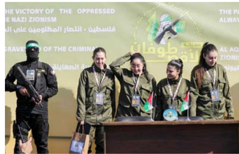
مجندات الاحتلال قبل تسليمهن للصليب الأحمر وسط حضور جماهيري كثيف

سلمت كتائب القسام الجناح العسكري لحركة حماس الفلسطينية أسس أربع مجندات في قوات الاحتلال الإسرائيلي للصليب الأحمر وسط مدينة غزة. وتسلمت اللجنة الدولية للصليب الأحمر الأسيرات اللواتي وصلن عبر أربع مركبات للقسام وجرت عملية التسليم على منصة وسط المدينة. كما سلمت سلطات الاحتلال للجانب الفلسطيني قائمة تضم أسماء 200 أسير فلسطيني من المؤبدات والأحكام العالية وسيتم إبعاد 70 منهم إلى الخارج، ضمن الدفعة الثانية من اتفاق إيقاف إطلاق النار.