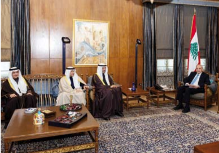
رئيس مجلس النواب نبية بري خلال لقائه وزير الخارجية والأمين العام لمجلس التعاون والوفد المرافق لهما

وأعتبر أن الإصلاحات التي وعد بتبنيها الرئيس اللبناني تعد الطريق الصحيح نحو النهوض بلبنان، مشدداً على مواقف دول الخليج "التاريخية الثابتة" تجاه دعم لبنان ومساندته. وقال نقل تهمة دول مجلس التعاون لدول الخليج العربية للشعب اللبناني الشقيق بمناسبة انتخاب البرلمان للعداء جوزيف عون رئيساً للجمهورية وحيازته على هذه الثقة، معرباً عن الأمل بأن يسهم انتخابه في استعادة الأمن والسلام في لبنان.