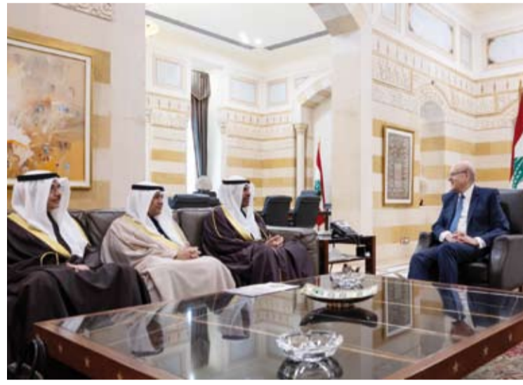
رئيس حكومة تصريف الأعمال نجيب ميقاتي مستقبلاً وزير الخارجية في السراي الحكومي

الشيخ أحمد العبد الله رئيس مجلس الوزراء ورئيس حكومة تصريف الأعمال نجيب ميقاتي ورئيس الوزراء المكلف بتشكيل الحكومة نواف سلام ووزير الخارجية والمغتربين عبد الله بوحبيب. وأعرب عن بالغ سعادته والوفد المرافق له بوجودهم في بيروت، ناقلاً تحيات صاحب السمو أمير البلاد الشيخ مشعل الأحمد وسمو ولي العهد الشيخ صباح الخالد وسمو