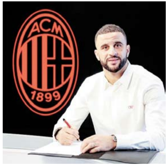
الإنجليزي كايل ووكر

واحد. ويحتل ميلان المركز الثامن في الدوري الإيطالي برصيد 31 نقطة، بفارق 19 نقطة خلف نابولي المتصدر، لكنه يملك مباراة متوجلة ضد بولونيا.