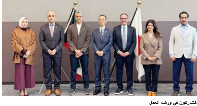
المشاركون في ورشة العمل