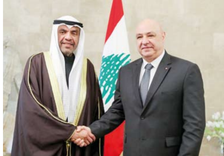
الرئيس اللبناني جوزيف عون خلال استقباله وزير الخارجية عبدالله الجحيا في قصر بعبد

جسور الحوار والتواصل. وقال بوحبيب: أعبر عن محبتنا وتقديرنا وعرفاننا لسمو أمير الكويت وحكومتها وشعبها على قوفهم الدائم إلى جانب لبنان وأخرها جهودهم الدبلوماسية التي أثمرت بتهدئة النفوس في العام 2022 وسعيهم إلى عودة العلاقات الأخوية التاريخية للبنان باشاقهم الخليجين. كما أعرب عن ترحيبه بالأمين العام