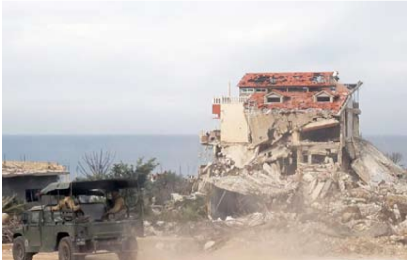
منطقة سكنية دمرتها الحرب

«الله» بعد نحو عام من تبادل إطلاق النار بين الجانبين. وبموجب الاتفاق، يتعين على «حزب الله» ترك موقعه في جنوب لبنان والتحرك إلى الشمال من نهر الليطاني على بعد نحو 30 كيلومتراً من الحدود مع إسرائيل التي يجب أن تتسحب بدورها بشكل كامل من جنوب لبنان.