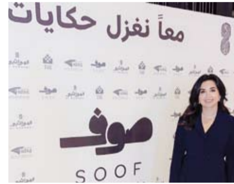
مصنع «صوف» لصناعة الغزل