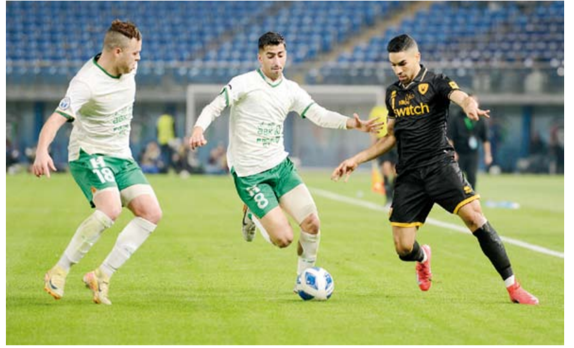
الأصفر رد الدين للأخضر