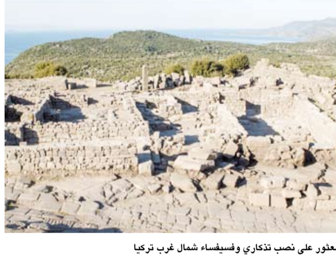
عثرت فرق التنقيب عن الآثار في تركيا على لوحة فسيفسائية عمرها 2200 عام ونصب تذكاري عمره 1800 عام بمنطقة أسوس بولاية (تشاناق قلعة) شمال غرب البلاد.