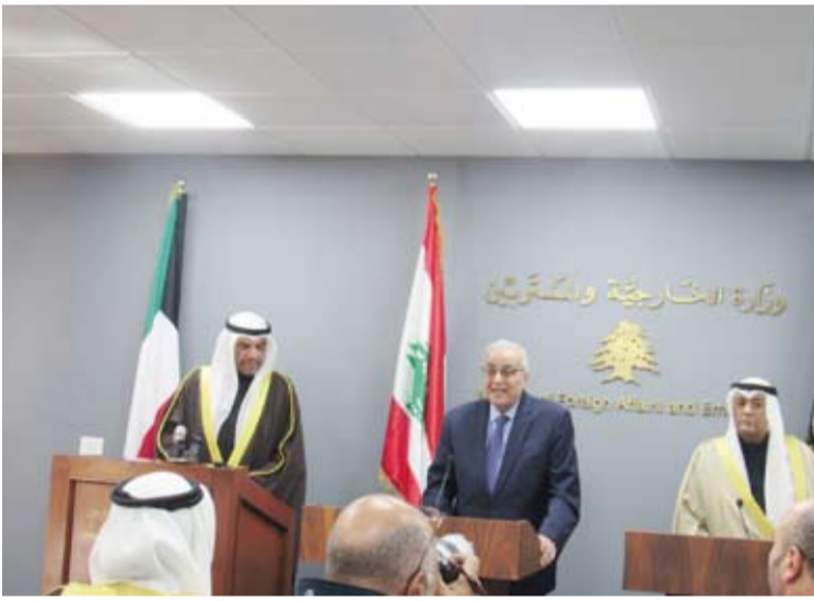
وزير الخارجية والأمين العام لمجلس التعاون خلال جلسة مباحثات مع وزير الخارجية اللبناني

مجلس التعاون لدول الخليج العربية جاسم البديوي الذي يمثل مجلساً شقيقاً احتضنته دولة اللبانيين في ريوغها. وقال وزير الخارجية اللبناني: نتوسم خيراً من هذه الزيارة المشتركة لما فيه مصالحنا جميعاً. من جهته أكد الأمين العام لمجلس التعاون، جاسم البديوي، دعم دول المجلس للجمهورية اللبنانية لكل ما من شأنه أن يعزز أمنها