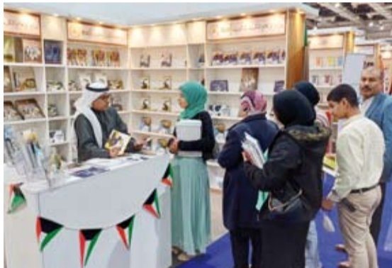
إقبال كبير على جناح وزارة الإعلام

أبرز جناح وزارة الإعلام الكويتية المشارك في معرض القاهرة الدولي للكتاب دور دولة الكويت وإسهاماتها في نشر الوعي والثقافة في محيطها العربي والإقليمي وخاصة أن الكويت هي عاصمة الثقافة العربية لعام 2025 وعاصمة الإعلام العربي للعام ذاته.