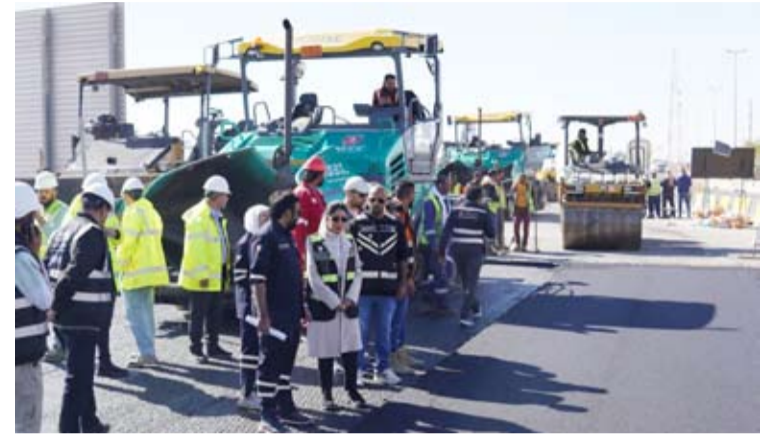
المشعان في أحد المشاريع