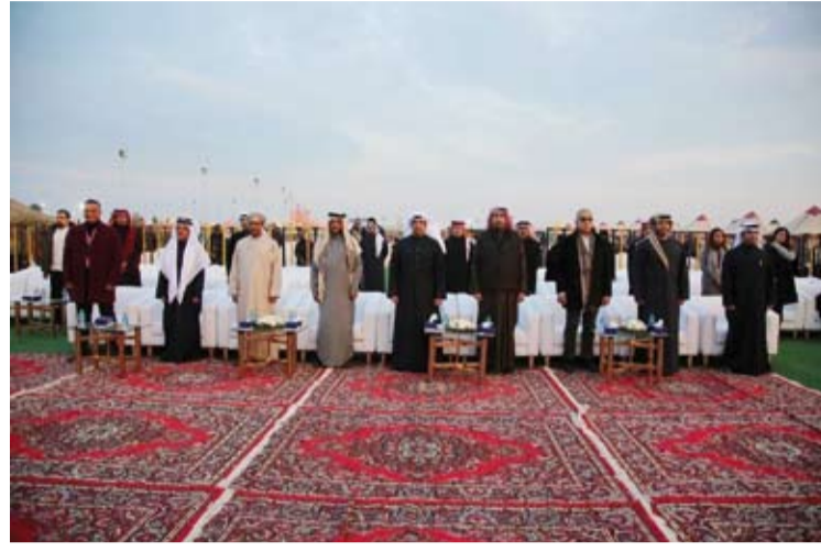
وزير الإعلام وممثلو سفارات دول مجلس التعاون الخليجي ومسؤولون كويتيون خلال الحفل