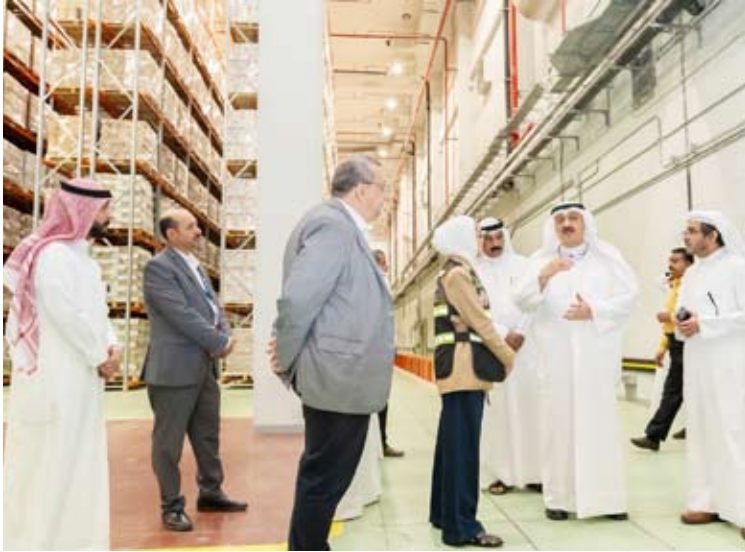
وزير الصحة أثناء جولته في مبنى المستودعات الطبية