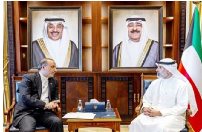
نائب وزير الخارجية يستقبل السفير الإيراني لدى البلاد

استقبل نائب وزير الخارجية السفير الإيراني الشيخ جابر الأحمد الصباح، أمس، سفير الجمهورية الإسلامية الإيرانية لدى دولة الكويت محمد تونجي، حيث تم بحث العلاقات الثنائية بين البلدين الصديقين والقضايا محل الاهتمام المشترك.