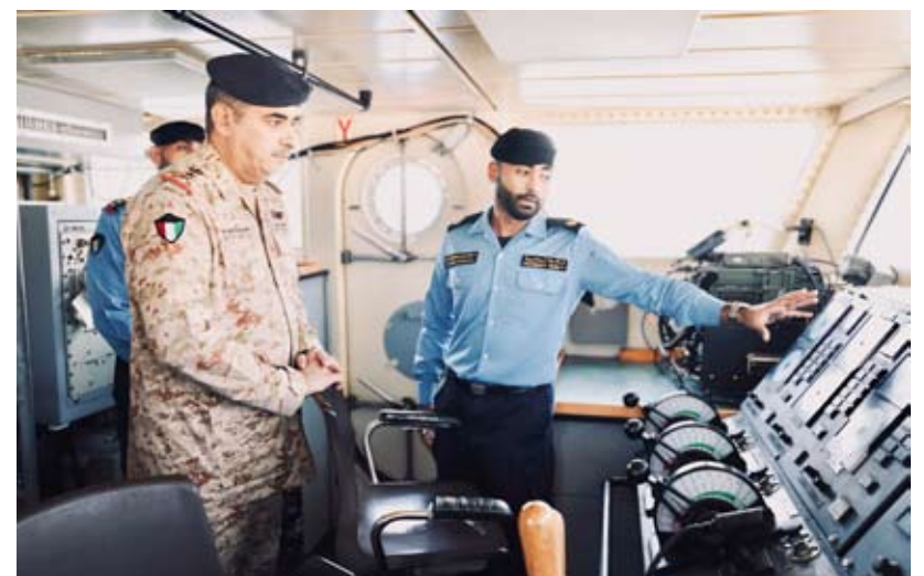
الفريق الركن طيار بندر المرين خلال جولته التفقدية

قام رئيس الأركان العامة للجيش، الفريق الركن طيار بندر المرين، صباح أمس، بزيارة تفقدية ميدانية إلى القوة البحرية، وكان في استقباله لدى وصوله مساعد أمر القوة البحرية اللواء الركن بحري سيف عبدالهادي سيف وعدد من كبار ضباط القوة البحرية.