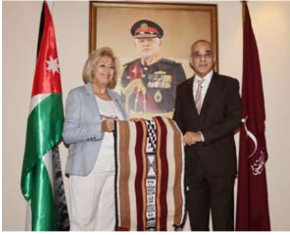
جانب من تبادل الهدايا التذكارية