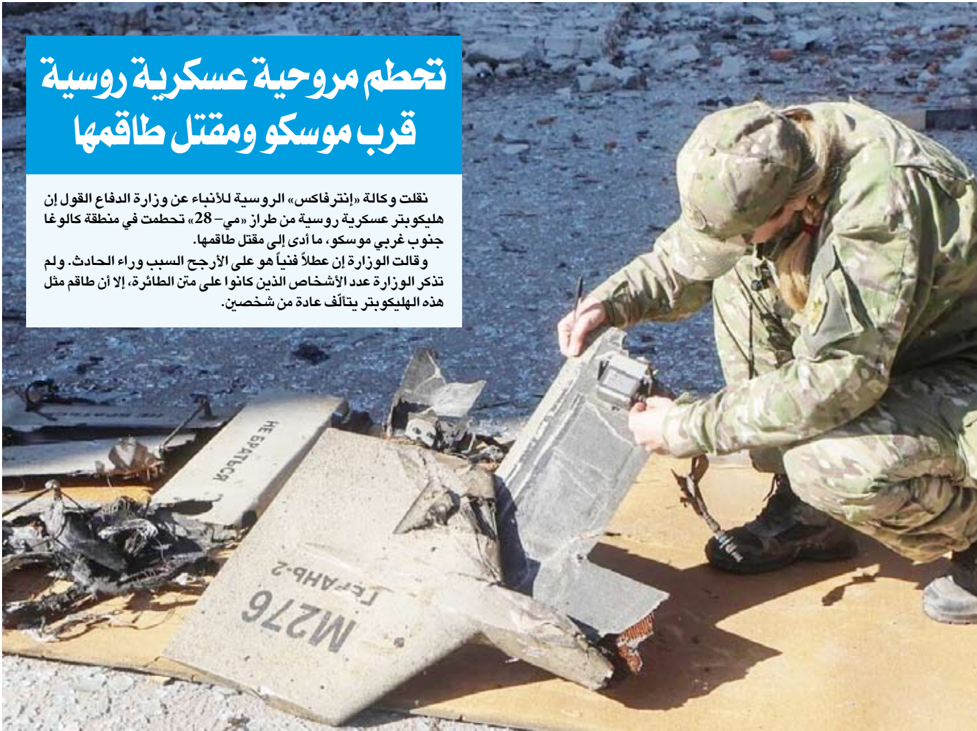
حرب مسيرات بين أوكرانيا وروسيا

نقلت وكالة «إنترفاكس» الروسية للأنباء عن وزارة الدفاع القول إن هليكوبتر عسكرية روسية من طراز «مي-28»، تحطمت في منطقة كالوغا جنوب غربي موسكو، ما أدى إلى مقتل طاقمها. وقالت الوزارة إن عطلاً فنياً هو على الأرجح السبب وراء الحادث. ولم تذكر الوزارة عدد الأشخاص الذين كانوا على متن الطائرة، إلا أن طاقم مثل هذه الهليكوبتر يتألف عادة من شخصين.