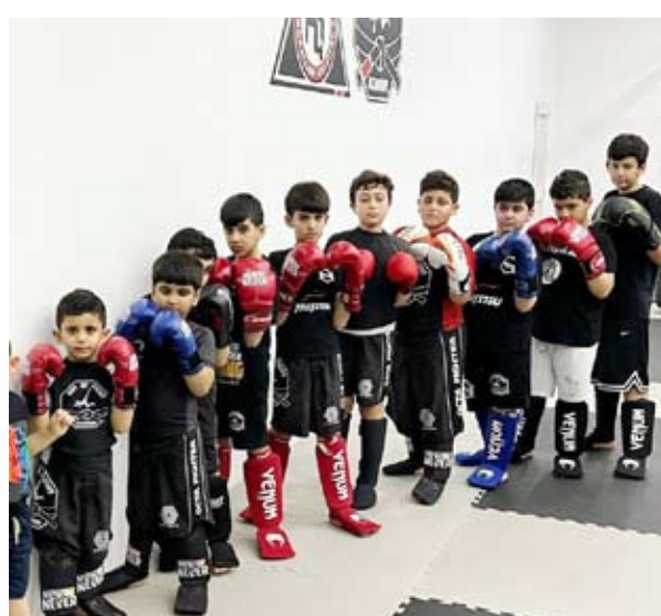
انتشار ألعاب الفنون القتالية لدى صغار السن

تعتبر ألعاب الفنون القتالية لدى الكثيرين في البلاد هواية يمارسونها بغية الحفاظ على مستوى بدني وذهني عال إلا أنها شهدت في الآونة الأخيرة إقبالا واضحا وخصوصا من صغار السن ومن الجنسين. ولأقوى انتشار هذه الفنون لدى صغار السن في البلاد استعان العديد من الآباء نظرا لما لاحظوه لدى أبنائهم من تطور في بناء شخصياتهم جراء تعلم كيفية وطرق الدفاع عن النفس بطريقة إيجابية بالإضافة لبناء جسد قوي وانضباط وثبات انفعالي عال. ومن أهم تلك الألعاب وأشهرها مجال الفنون القتالية لعبة (التايكوندو) و(الجودو) و(الكاراتيه) و(الجوجيتسو) و(الكيك بوكسينغ) وغيرها العديد من الألعاب القتالية تدرج تحت مسمى (فنون قتالية). ويرى العديد من الآباء أن ممارسة الفنون القتالية رياضة مهمة لأطفالهم تزيد بشكل مباشر الثقة بالجانب النفسي وقدرة الدفاع عن النفس بطريقة إيجابية وبناء الجسم السليم وزرع ثقافة الحلم والصبر حيث أغلب ألعاب الفنون القتالية تهتم وتعمل على تقوية الجانب الذهني وكيفية السيطرة على الغضب والتحكم به.