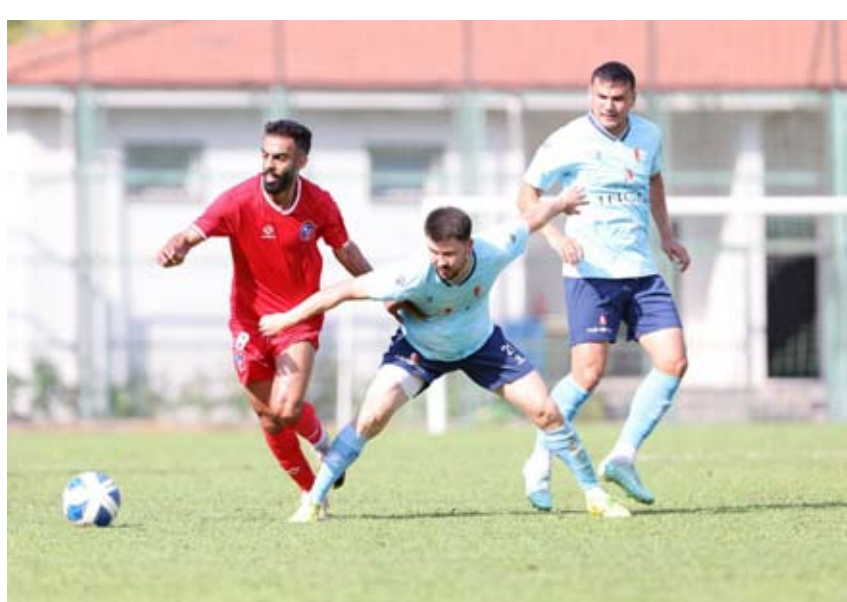
جانب من لقاء الكويت في معسكر تركيا

الفرق للموسم الجديد. والعربي اختارا تركيا لإقامة المعسكر التدريبي الخاص بهما جدير بالذكر أن الكويت