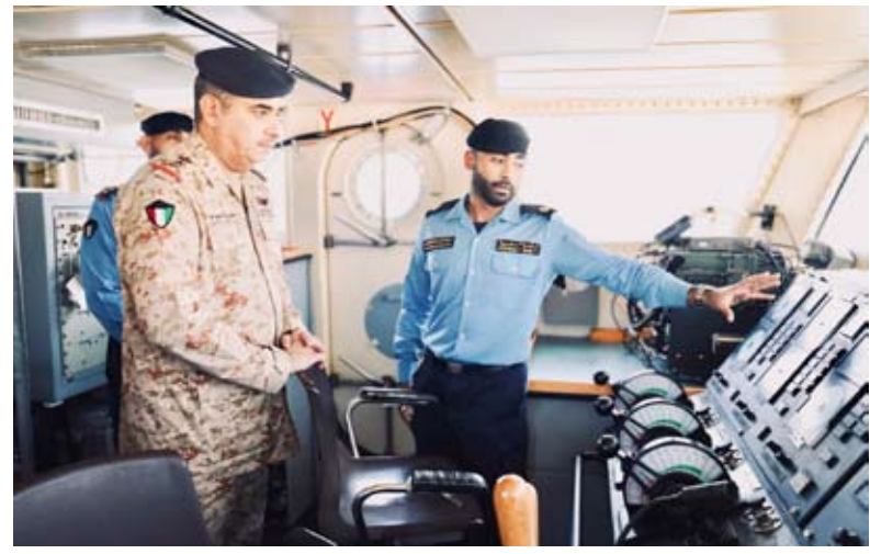
المزين يتطلع على طبيعة المهام والواجبات التي يقوم بتنفيذها رجال القوة البحرية

أكد رئيس الأركان العامة للجيش الفريق الركن طيار بندر المزين أمس ضرورة تحقيق أقصى درجات اليقظة والجاهزية والاستعداد لحفظ أمن وسلامة الوطن من أي تهديدات خارجية والاستمرار في هذا النهج وتعزيز القدرات عبر التدريب المستمر والتطوير الذاتي. جاء ذلك في بيان صحفي صادر عن رئاسة الأركان عقب زيارة تفقدية ميدانية قام بها الفريق المزين إلى القوة البحرية بمختلف وحداتها حيث أشاد بدورها في الدفاع عن الحدود البحرية والمياه الإقليمية للبلاد.