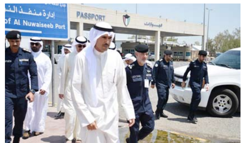
محافظ الأحمدى خلال جولته برفقة قيادي أمن المنفذ والجمارك

تفقد محافظ «الأحمدي»، الشيخ حمود جابر الأحمد الصباح، منفذ النويصيب البري، صباح أمس، للاطلاع على سير العمل، ومناقشة الإجراءات الأمنية والجمركية المتبعة سواء مع المغادرين أو القادمين من وإلى دولة الكويت. وخلال الجولة التفقدية، أشاد المحافظ بجهود جميع العاملين بالمنفذ، مؤكداً أنهم خط الدفاع الأول عن الكويت، مقمناً دورهم في منع عمليات التهريب للممنوعات التي من شأنها الإضرار بالأمن. وأكد محافظ الأحمدى الحرص على دعم جهود