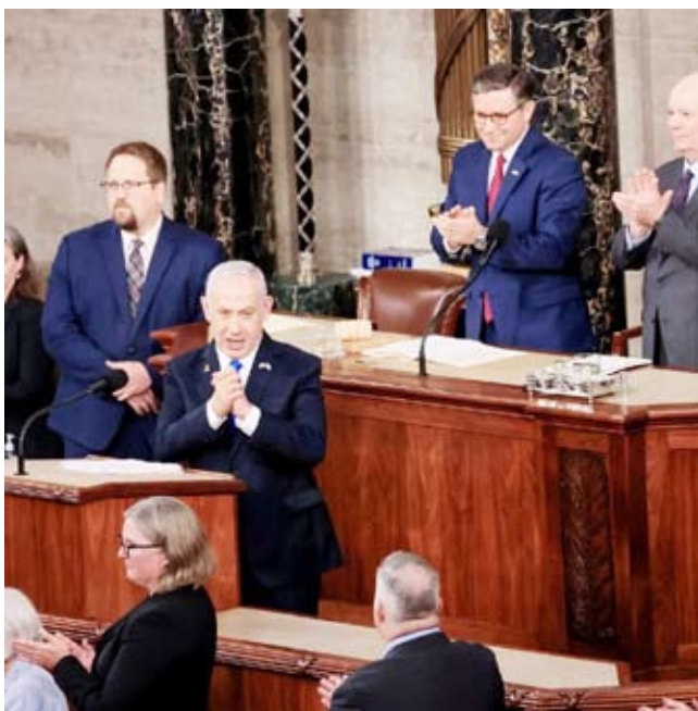
نتنياهو بعد خطابه أمام الكونغرس

غير أن الشويخي أبدى «تفاؤلاً حذراً» إزاء إمكانية التوصل لاتفاق همدنة كون هذه المرة من المفاوضات «تبدو مختلفة» مع قناعات إسرائيلية بأنها حققت الجانب الأكبر من «إضعاف حماس»، مع مرونة الحركة ليقول الوقت الموقت لإطلاق النار بآول المراحل وليس دائماً كما كانت تطرح، ومن ثم فإننا «أمام مجموعة من المتغيرات» تشي باننا «أمام فرصة للهدنة».