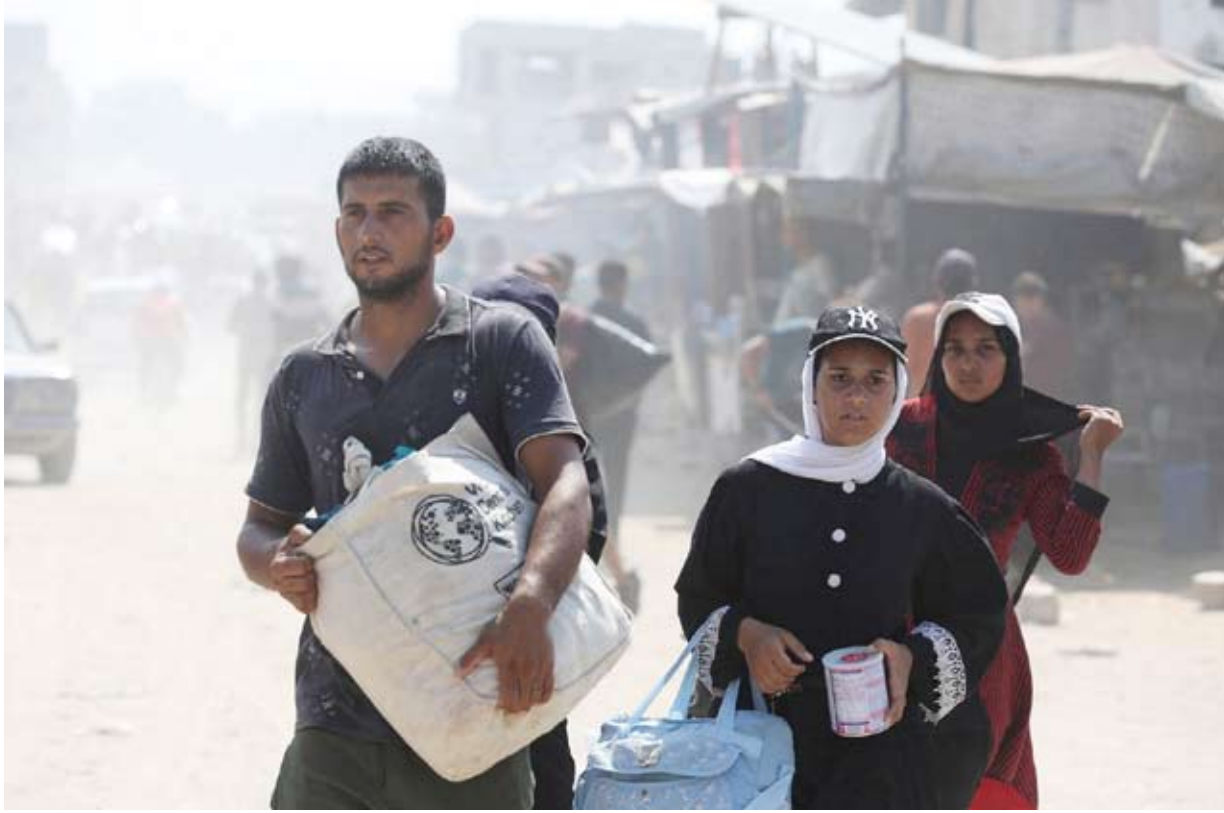
فلسطينيون يفرّون من خان يونس

المخاوف من عراقيل نتنياهو أبدتها المعارضة في إسرائيل على لسان الوزير السابق بيني غانتس، بقوله إن «الخطوط العريضة التي وضعتها لاتفاق عودة المحتجزين قبلت بالفعل