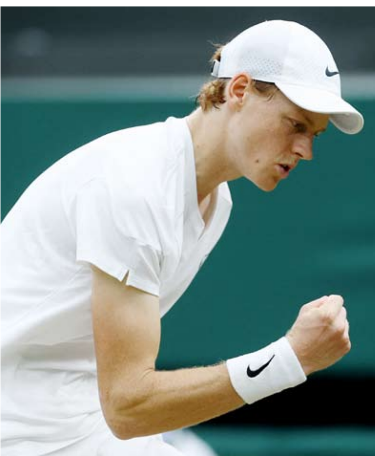
الإيطالي يانيك سينر

وأعلن اللاعب الإيطالي يانيك سينر المصنف الأول عالمياً في رياضة التنس انسحابه من أولمبياد باريس بسبب التهاب في اللوزتين. وقال سينر بأول لقب له في البطولات الأربع الكبرى في بطولة أستراليا المفتوحة في وقت سابق من هذا العام ووصل إلى الدور قبل النهائي في بطولة فرنسا المفتوحة. وكتب سينر في منشور عبر منصة "إكس": "يخزنني أن أبلغكم أنني للأسف لن أتمكن من المشاركة في دورة الألعاب الأولمبية في باريس، فبعد أسبوع جيد من التدريب على الملاعب الرملية، بدأت أشعر بالإعياء.