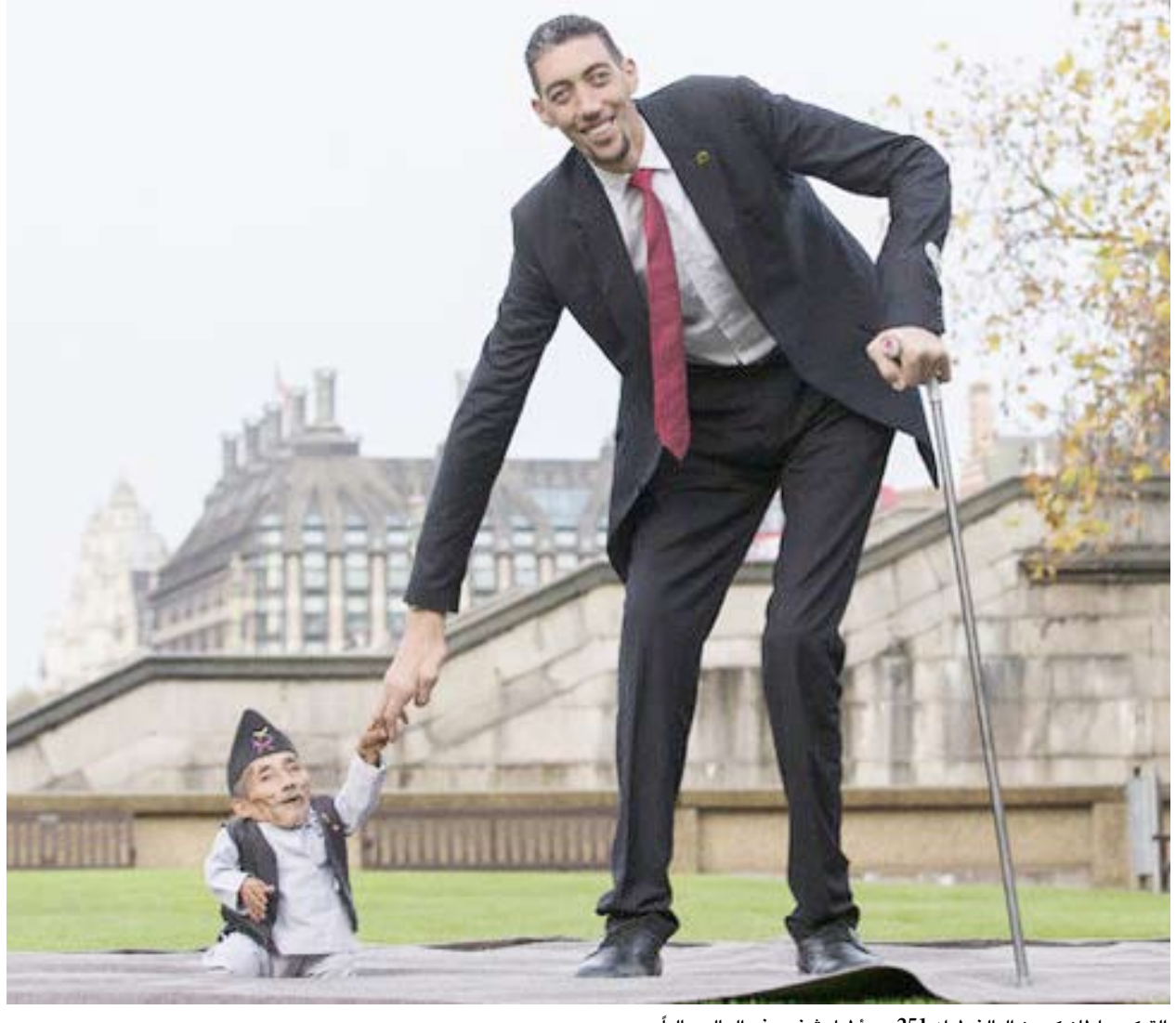
التركي سلطان كوسن البالغ طوله 251 سم أطول شخص في العالم حالياً

كشفت أرقام حديثة أن الهولنديين يحتلون المرتبة الأولى عالمياً من حيث متوسط الطول، إذ يبلغ متوسط طول الرجال 1.83 متر والنساء 1.70 متر، وجاء في المرتبة الثانية والثالثة مواطنو مونتينيغرو والبوسنة والهرسك توالياً. عربياً، تصدر اللبنانيون القائمة محتلين المرتبة 24 عالمياً بمتوسط طول 1.78 متر. وجاء في المرتبة الثانية عربياً التونسيون (المرتبة 40 عالمياً) بمتوسط 176.85 سم، يليهم الليبوني بـ176.39 سم، ثم المغاربية بـ176.35 سم، في المرتبتين 46 و48. ووفق مجلة «سي إي أو وورلد ماغازين»، احتل الفلسطينيون المرتبة الخامسة عربياً بمتوسط 175.05 سم، تلاهم الجزائريون بـ175.04 سم، أما المصريون فجاءوا في المرتبة 71 عالمياً والسابعة عربياً بمتوسط 174.57 سم. وفي دول الخليج، سجل الكويتيون أعلى متوسط بـ174.96 سم، يليهم الإماراتيون بـ174.08 سم. وجاء القطريون في المرتبة 93 عالمياً بمتوسط 1.73 متر، بينما احتل البحرينيون المرتبة 98 بمتوسط 172.76 سم. وأشارت الدراسة إلى أن السعوديين سجلوا متوسط طول بلغ 170.67 سم، فيما جاء العمانيون والسوريون بمتوسط طول يبلغ 171.7 سم و171.64 سم على التوالي. يذكر أن التركي سلطان كوسن، البالغ طوله 251 سم، يعد أطول شخص في العالم حالياً، رغم أن تركيا لا تصنف ضمن الدول ذات أعلى متوسطات الطول.