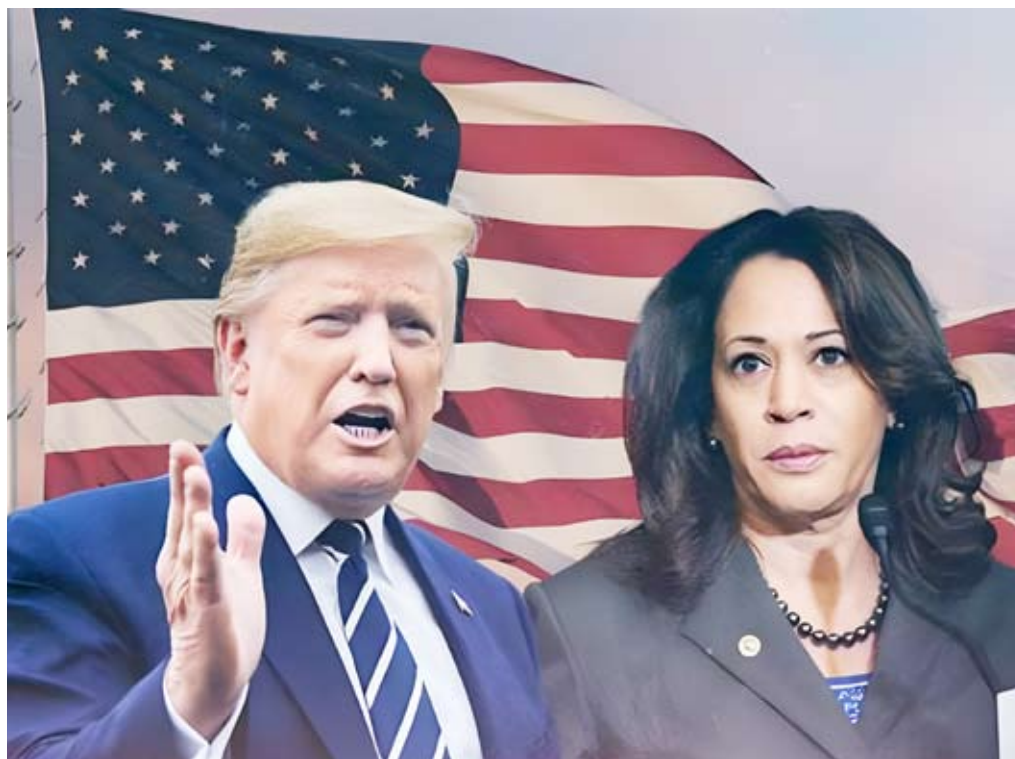
ترامب و هاريس

وأضاف «لا يوجد مكان في أميركا للعنف السياسي، وسأواصل حماية أطفالنا من العنف المسلح، وكوكبنا من التهديد الوجودي للمناخ، والقضاء على السرطان وإصلاح المحكمة العليا». وشدد قائلاً «مستعمرون في العمل لضمان بقاء أميركا قوية وأمنة». وتعهد بايدن بمنع بوتين من السيطرة على أوكرانيا، وتعزيز قوة حلف شمال الأطلسي، وتعزيز التحالفات في المحيط الهادئ، وأنهاء الحرب في قطاع غزة وإعادة جمع الرهائن وإحلال السلام والأمن في الشرق الأوسط، واستعراض الرئيس إنجازاته مشيراً إلى توفير الرعاية الصحية، ومساعدة ملايين المحاربين القدامى، وخفض معدلات الجريمة العنيفة إلى أدنى مستوياتها، وحماية المعابر الحدودية.