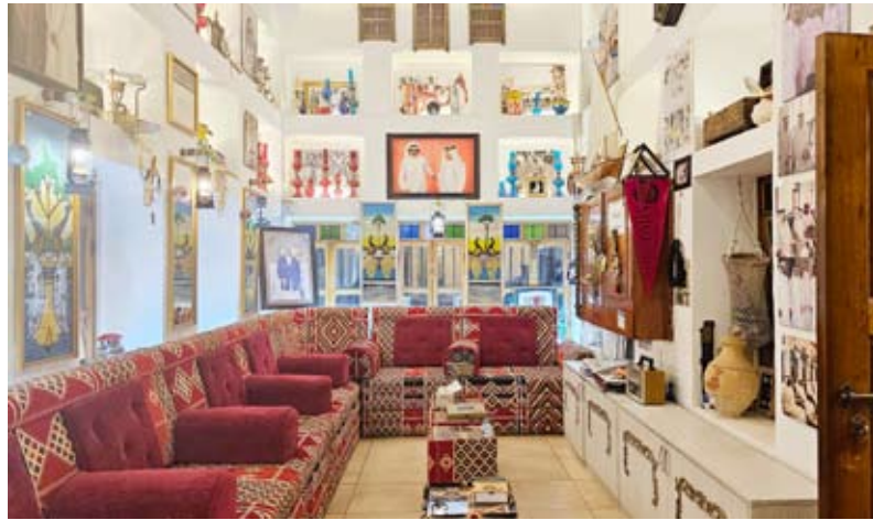
المجلس من الداخل