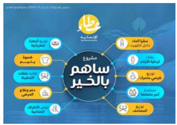
10 مشاريع خيرية

وأوضح الحتيه، أن المتبرع الذي يشارك بدينار واحد في مشروع «سأهم بالخير» يدخل بإذن الله تعالى في تنفيذ 10 مشاريع خيرية، مؤكداً أن «عطاء للعمل الإنساني» تحرص على تنفيذ المشاريع الخيرية الرائدة التي تحدث أثراً مباشراً في حياة المستفيدين.