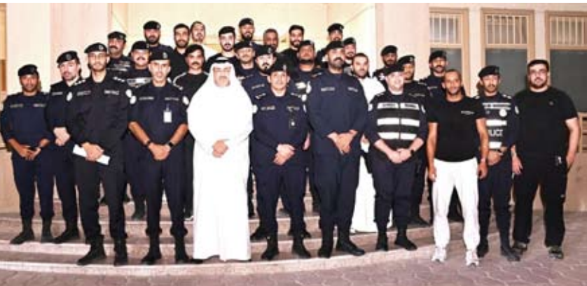
الشيخ عبدالله سالم العلي الصباح في لحظة جماعية مع رجال الأمن

تمن محافظ العاصمة الشيخ عبدالله سالم العلي الصباح، الجهود الكبيرة التي يبذلها رجال الأمن، لضبط مخالفات قانون الإقامة والمطلوبين، في كافة أنحاء البلاد. جاء ذلك بعد الجولة الميدانية التي قام بها المحافظ، مسانداً لجهود الحملة التفتيشية في منطقة بنيد القار، بحضور العميد سليمان الجراح المدير العام لمديرية أمن العاصمة، وعدد من القيادات الأمنية ورجال الأمن. وقال محافظ العاصمة: إن هذه الحملة التفتيشية المفاجئة تأتي ضمن الكثير من الحملات الأمنية، التي يقوم بها رجال الأمن بكافة محافظات البلاد، للتعاون مع رجال الأمن، والإبلاغ عن أي مخالفين أو خارجين عن القانون، حتى يتم ضبطهم من الجهات الأمنية.