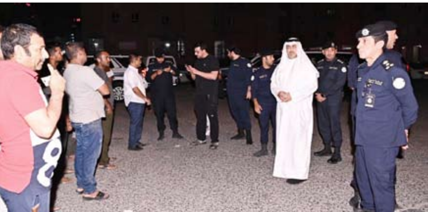
محافظ العاصمة خلال الحملة

تمن محافظ العاصمة الشيخ عبدالله سالم العلي الصباح، الجهود الكبيرة التي يبذلها رجال الأمن، لضبط مخالفات قانون الإقامة والمطلوبين، في كافة أنحاء البلاد. جاء ذلك بعد الجولة الميدانية التي قام بها المحافظ، مسانداً لجهود الحملة التفتيشية في منطقة بنيد القار، بحضور العميد سليمان الجراح المدير العام لمديرية أمن العاصمة، وعدد من القيادات الأمنية ورجال الأمن. وقال محافظ العاصمة: إن هذه الحملة التفتيشية المفاجئة تأتي ضمن الكثير من الحملات الأمنية، التي يقوم بها رجال الأمن بكافة محافظات البلاد، للتعاون مع رجال الأمن، والإبلاغ عن أي مخالفين أو خارجين عن القانون، حتى يتم ضبطهم من الجهات الأمنية.