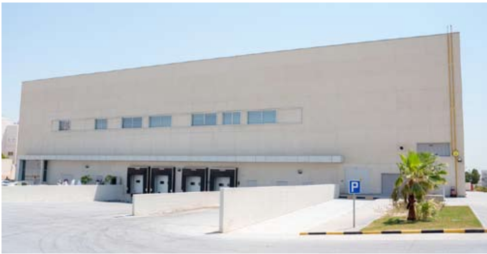
مبنى المستودعات الطبية التابع لمشروع مستشفى العدان الجديد

المراكز الصحية، والبنية التحتية الصحية وتوفير مع رؤية الكويت لتحقيق التغطية الصحية الشاملة وتقديم خدمات طبية متميزة للمواطنين.