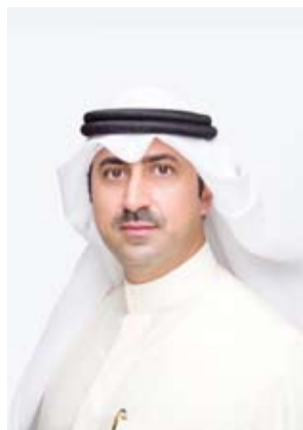
الشيخ نمر الصباح