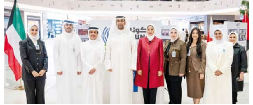
د. ناصر المحسين وعدد من منسوبي وكالة «كونا»

أكد وكيل وزارة الإعلام الدكتور ناصر محسين، أول أمس، معرض الصور الذي تقيمه وكالة الأنباء الكويتية (كونا) ضمن فعاليات الأسابيع المصاحبة للقمة الخليجية الـ45 والمقرر أن تستضيفه دولة الكويت في الأول من ديسمبر المقبل بمرور دور وكالات الأنباء الخليجية في التوثيق والتاريخ للتعاون بين دول مجلس التعاون. وأضاف محسين في تصريح لـ(كونا) خلال زيارته المعرض المقام في مجمع الأفنيون، أن وكالات الأنباء الخليجية تقوم بدور كبير جداً في حصر وتوثيق الأحداث المهمة والقيمة ومن ضمنها ما يتم حفظه وتوثيقه في أرشيفها من مسيرة التعاون الخليجي ليشكل تعريفاً للجمهور الآن ومستقبلاً عما تقوم به دول المجلس وتوثيقاً للتعاون الكبير ومدى الارتباط الأخوي بينها وهو عمل كبير لنشر هذه الثقافة. وأكد أن التعاون بين (كونا) ووكالات الأنباء الخليجي في هذا المعرض يعد من صور التعاون الخليجي إذ نجد أن العلاقة بين وكالات الأنباء الخليجية «تكاملية وتعاونية» ومنها تبادل