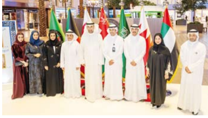
وكيل وزارة الإعلام وعدد من القائمين على المعرض

والاطلاع على ما يحتويه المعرض المقام في مجمع (الافنيون) لما يحمله من قيمة كبيرة. وأشار المشعان إلى أن التنسيق قائم مع الإعلاميين الذي سيحضره أكثر من 80 شخصية إعلامية وعضوهم هذا الحدث الهام مبيّن أن التنسيق مع الإعلاميين مستمر سواء من داخل الكويت أو خارجها. ولفت إلى أنه سيقام مركز إعلامي مصاحب للقمة سينطلق في 29 نوفمبر الجاري برعاية وزير الإعلام ويضم جميع الإعلاميين المهتمين بتغطية القمة من خلال هذا المركز والالتقاء بالزملاء الإعلاميين من خارج الكويت. ويستمر المعرض حتى 28 نوفمبر الجاري متضمناً أكثر من 40 صورة متنوعة توثق للمقام الخليجي والمتابعة والمسيرة المباركة لهذا المجلس والإنجازات الكبيرة له.