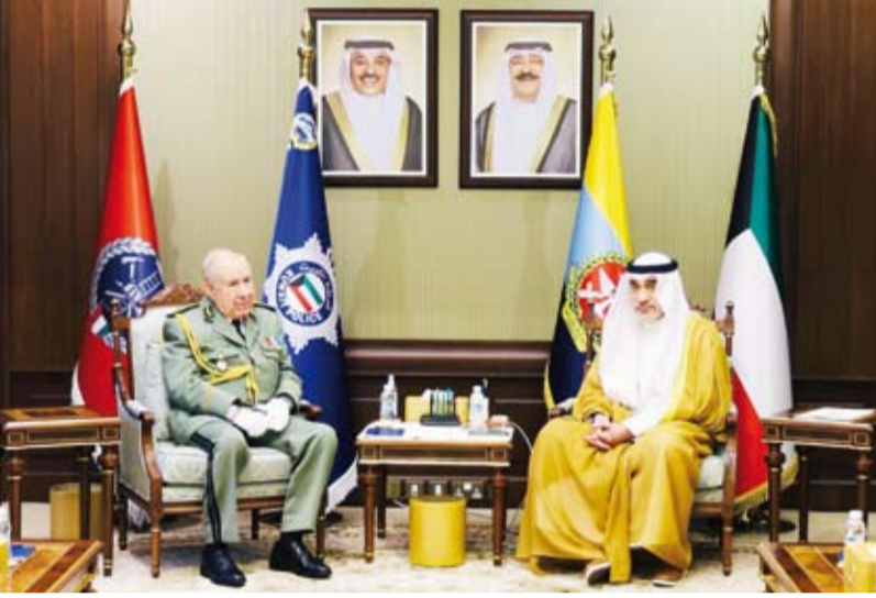
الشيخ فهد اليوسف مستقبلاً الفريق أول ركن السعيد شترقيحه

خلال اللقاء تبادل الأحاديث الودية التي رحب من خلالها الشيخ فهد اليوسف بالضيف الكريم والوفد المرافق له في بلدهم الثاني الكويت مشيداً بعمق العلاقات الوطيدة التي تربط البلدين الشقيقين وتعاونهما المشترك على مختلف الصعد والمستويات لاسيما المتعلقة منها بالشؤون العسكرية.