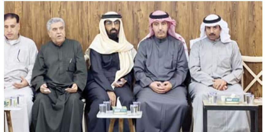
السفير حمد المري يقدم واجب العزاء

في لفتة إنسانية تعكس عمق التزام دولة الكويت بالدبلوماسية الإنسانية، قام سفير دولة الكويت لدى المملكة الأردنية الهاشمية حمد المري بزيارة إلى دار الإيواء التابعة لنماء الخيرية بجمعية الإصلاح الاجتماعي لتقديم واجب العزاء في أحد الأيتام.