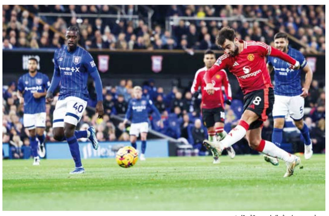
برونو بيسد على شباك إيسويتش تاون

أكتفى مانشستر يونايتد بالتعادل مع مضيفه إيسويتش تاون بهدف مثله، في المباراة التي جمعتهم ضمن الجولة الثانية عشر للدوري الإنجليزي الممتاز لكرة القدم. سجل هدف مانشستر يونايتد، ماركوس راشفورد في الدقيقة الثانية، فيما عادل النتيجة لإيسويتش تاون بياوماري هوشينسون في الدقيقة 43. وبهذه النتيجة، رفع مانشستر يونايتد، الذي تعادل للمرة الرابعة في البطولة هذا الموسم مقابل 4 انتصارات والخسارة في مثلها، رصيده إلى 16 نقطة في المركز الثاني عشر. كما رفع إيسويتش تاون، العائد للعب في المسابقة بعد غياب دام 22 عاماً، رصيده إلى 9 نقاط في المركز الثامن عشر (الثالث من القاع)، بعدما تعادل للمرة السادسة في البطولة هذا الموسم مقابل فوز وحيد و5 هزائم.