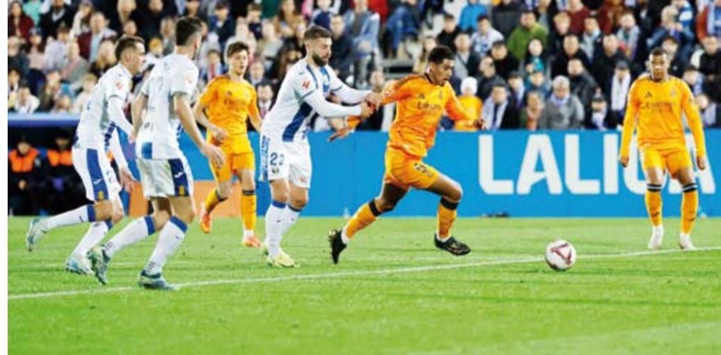
بيلينجهام يتأهب لتسجيل هدف الملكي الثالث

حقق ريال مدريد الفوز على ليجانيس بثلاثة أهداف دون رد، خلال المباراة التي جمعتهم، في الجولة الرابعة عشر من الدوري الإسباني لكرة القدم.