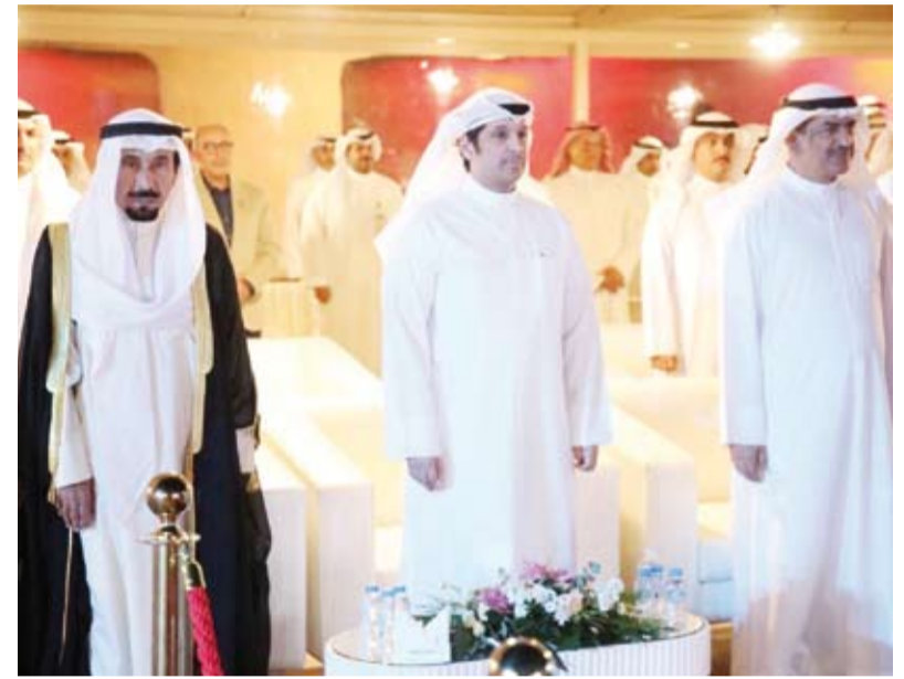
وزير الإعلام يتقدم الحضور

في الصميم وزارة الداخلية حضرت أمس من الإعلانات المرسله من جهات مهجولة تعد المستهلكين بتخفيضات عالية لأنها قد تحتوي على برمجيات ضارة. وقالت الوزارة عبر حسابها في منصة X: من أجل تسويق الإلكتروني آمن قم بتثبيت تطبيقات تسوق فقط من المتاجر الرسمية، وعند الشراء من الإنترنت تأكد بان الرابط الإلكتروني صحيح وليس مزورا أو منتحلا صفة الموقع الرسمي للمتجر، مشددة على عدم الدفع عبر شبكات (Wi-Fi) العامة وذلك لسهولة اختراقها. يجب على الجميع خاصة بناتنا وأبنائنا صغار السن الحذر عند الدفع عبر المواقع الإلكترونية والانتباه جيدا لـ «الألعاب» الهاكرز لأنها كثيرة وتتطور يوميا.