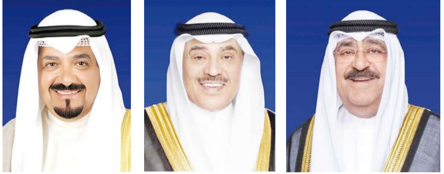
سمو الشيخ أحمد العبدالله