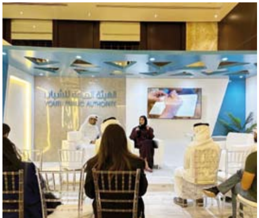
جانب من أنشطة الهيئة خلال المعرض

الأنشطة. ودعت الجميع إلى زيارة جناح الهيئة ومتابعة حساباتها على منصات التواصل الاجتماعي للتعرف على الفعاليات وأوقاتها مؤكدة الحرص على المشاركة في كافة المناسبات والمعارض المهمة التي تقام في دولة الكويت للإسهام في إنجازها وتحقيق أهدافها المرسومة.