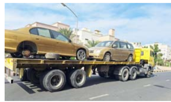
رفع سيارات مخالفة

أعلنت إدارة العلاقات العامة في بلدية الكويت مواصلة الفرق الميدانية لإدارات النظافة العامة واشغالات الطرق تكثيف جولاتها التفتيشية لرصد وإزالة مخالفات لأحتي النظافة واشغالات الطرق البلدية في كافة المحافظات وتفعيل الدور الرقابي للأجهزة الرقابية لتطبيق قوانين البلدية. وأوضحت أن إدارة النظافة العامة واشغالات الطرق بفرع بلدية محافظة مبارك الكبير بعمل جولات واسعة على المناطق السكنية وذلك لرفع مستوى النظافة وكل ما يعمل على إعاقة الطريق ويشوه المنظر العام ومنع رمي النفايات خارج الحاويات. وفي هذا السياق أوضح مدير إدارة النظافة العامة و