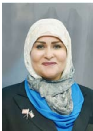
الشيخة تامضر الصباح