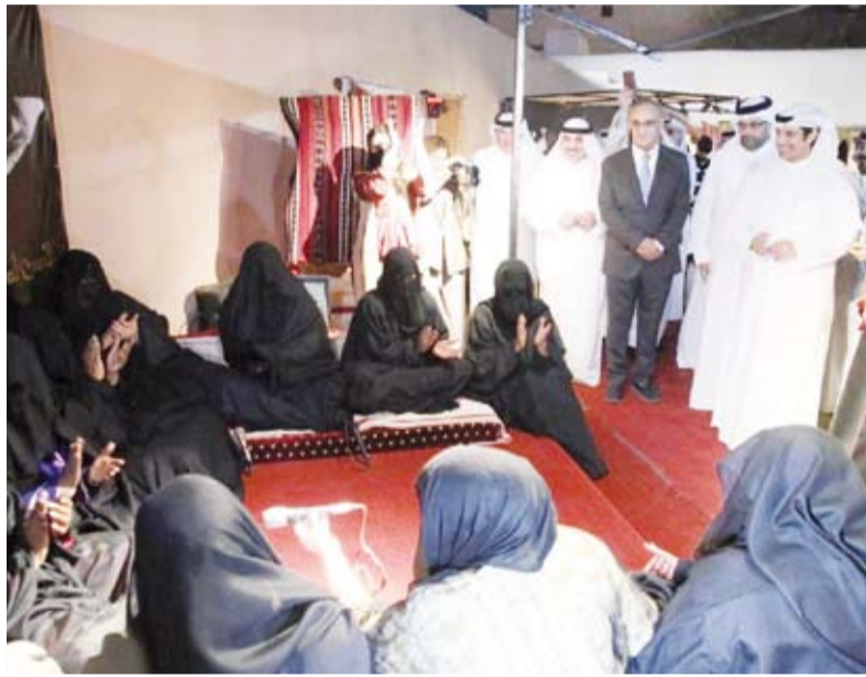
جولة في مرافق القصر الأحمر