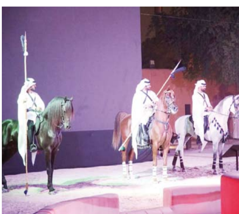
جانب من لوحة الأداء الحركي (المحورب)