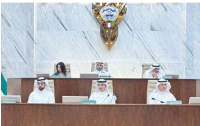
المحري مترأساً جلسة البلدي