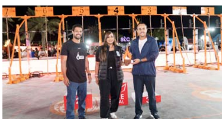
النجادة تسلم الدرع من الشيخ مبارك

النسخة الأخيرة، وجميع الفائزين على ما قدموه من أداء يستحق الفناء. إن دعم القطاع الرياضي والمواهب الشبابية هو جزء أساسي من مسؤوليتنا المجتمعية.