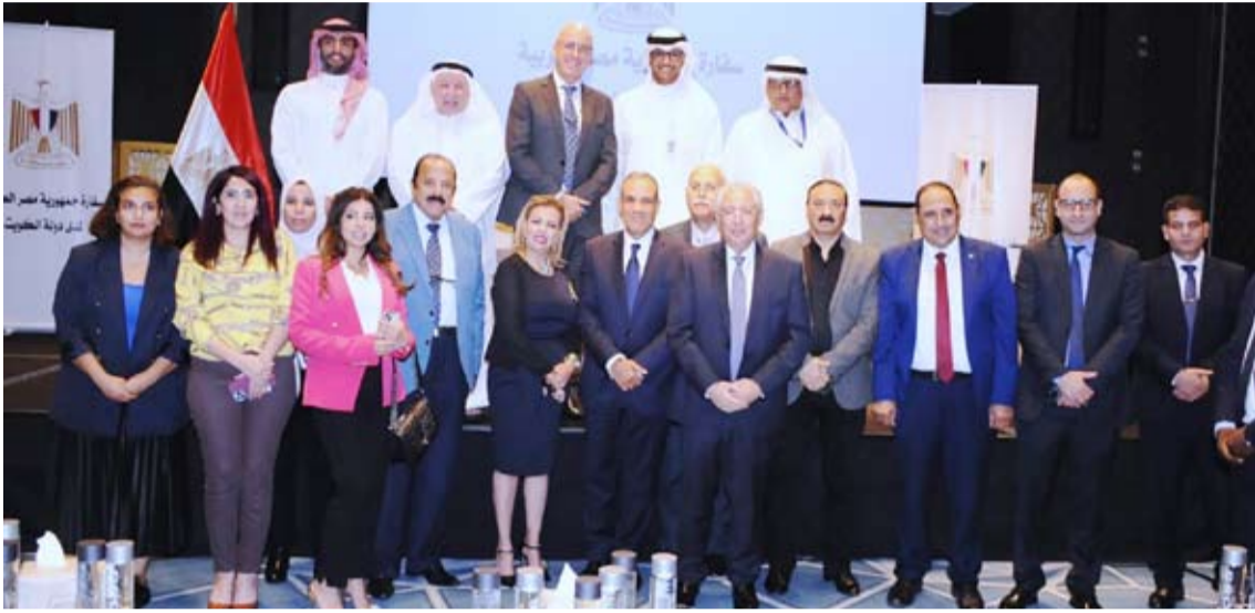
وزير الخارجية المصري متوسط الإعلاميين

حذر في مؤتمر صحافي من جر المنطقة إلى حرب شاملة.. وأكد أن الجهود مستمرة عربياً وإقليمياً حتى يتوقف العدوان