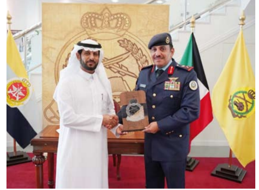
تقديم درع اللواء الركن متقاعد عبدالله الشايح

أشاد اللواء الركن متقاعد عبدالله الشايح من قطاع الشؤون العسكرية بالأمانة العامة لمجلس التعاون لدول الخليج العربية، أمس، بالدور المميز لدولة الكويت في مسيرة العمل الخليجي المشترك. جاء ذلك حسب بيان صحفي صادر لوزارة الدفاع خلال محاضرة قدمها اللواء الشايح للدارسين في دورة القيادة والأركان المشتركة رقم (29) في كلية مبارك العبدالله للقيادة والأركان تحت عنوان (مسيرة العمل