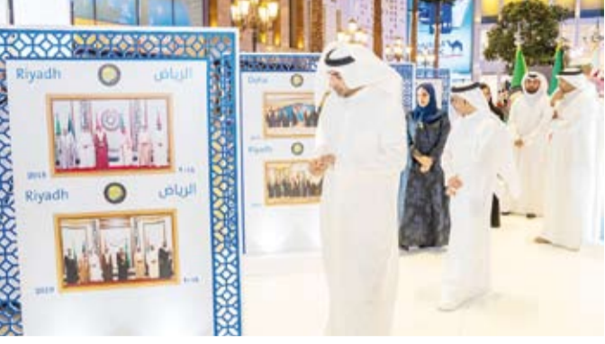
المحسين يطلع على جانب من المعرض