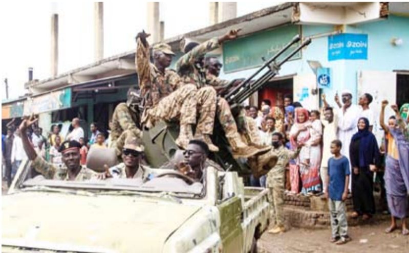
عناصر من الجيش السوداني

التي كانت قد فقدتها في يونيو الماضي... وعادة لا يشير كلا الطرفين، إلى خسائرها في المعارك. وتضم منطقة وادي سيدنا العسكرية التي تقع شمال مدينة أم درمان، أكبر قاعدة جوية عسكرية، وفيها المطار الحربي الرئيس، إلى جانب الكلية الحربية السودانية، وبعد اندلاع الحرب تحوّلت إلى المركز العسكري الرئيس الذي يستخدمه الجيش ضد «قوات الدعم السريع».