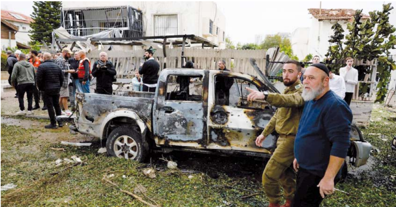
«حزب الله» قصف «بتاح تكفا» قرب تل أبيب

عاش لبنان وإسرائيل، يوماً عنيفاً من الغارات والصواريخ؛ إذ شنت إسرائيل عشرات الغارات، بعضها على ضاحية بيروت الجنوبية وفي الجنوب حيث مسحت حياً بأكملها، في حين وسع «حزب الله» استهدافاته للأراضي الإسرائيلية وصولاً إلى تل أبيب ومحيطها، مطلقاً نحو 300 صاروخ.