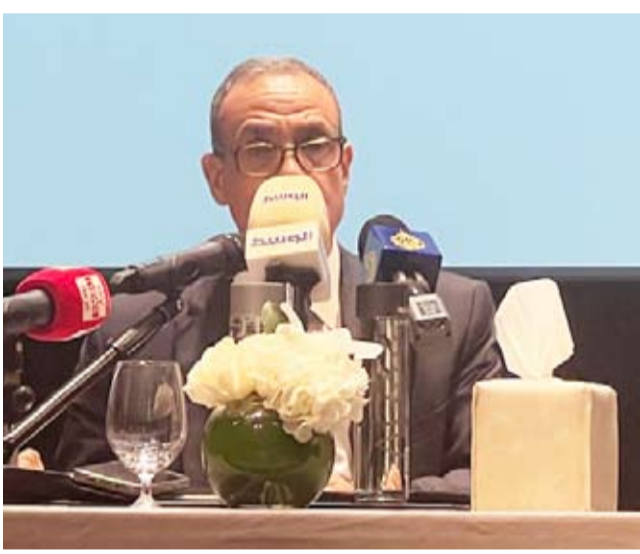
وزير الخارجية المصري متحدثا

مصر ترفض أي عدوان على أي دولة عربية حريصون على المزيد من الاستثمار والتجارة مع الكويت ونعزز بدور العمالة المصرية النظام الأممي بات على المحك في ظل الصمت المخجل لاستمرار العدوان الإسرائيلي على النساء والأطفال هناك تنسيق مصري، كويتي مستمر فيما يتعلق بمجمل قضايا المنطقة كالفضية السورية ولبنان وفلسطين