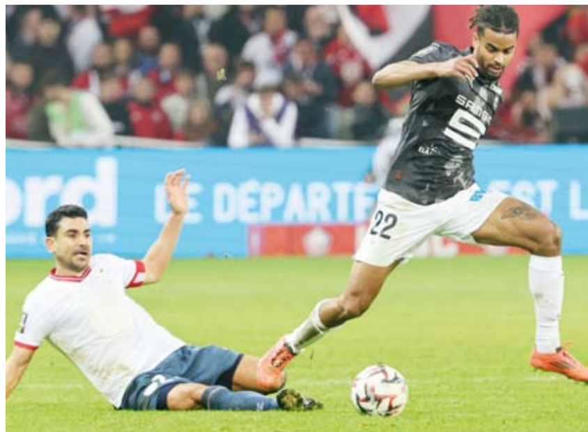
جانب من فوز ليل على رين

الدوري هذا الموسم ليترجم رصيده عند 11 نقطة في المركز الرابع عشر. وسيرفع هذا الفوز معنويات فريق ليل قبل أن يحل ضيفاً على بولونيا الإيطالي في الجولة الخامسة لدوري أبطال أوروبا، أما رين سيحاول التعويض عندما يستضيف سانت إتيان /السيب/ /الغبل في الجولة الـ 13 من الدوري الفرنسي.