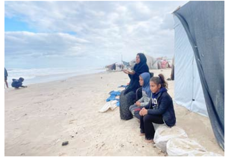
مياه الأمطار تزيد من معاناة النازحين الفلسطينيين

قال جهاز الدفاع المدني الفلسطيني أمس إن مياه الأمطار غمرت مناطق نزوح مئات العائلات الفلسطينية على ساحل بحر مدينة خانونس جنوبي القطاع وتسببت بتدمير خيامهم. وأضاف الدفاع المدني الفلسطيني في بيان صحفي أن عشرات المناشآت وردت إليهم من نازحين على ساحل القطاع ومناطق متفرقة بعد أن غمرت مياه الأمطار خيامهم وما تحويه من مفروشات وأغطية بسبب الأحوال الجوية التي شهدت كثافة في الأمطار وامتداداً لمياه البحر. ومنذ أن بدأ العدوان الإسرائيلي على قطاع غزة نزح أكثر من مليون و900 ألف فلسطيني في خيام مهترئة أغلبهم بمحافظة الوسطى وخانونس جنوب القطاع يفتقدون إلى أدنى مقومات الحياة.