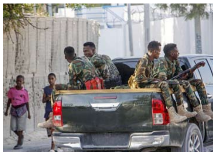
تعزيزات أمنية بعد مقتل عناصر من «حركة الشباب»

وصادق نواب مجلسي البرلمان الفيدرالي (الشعب والشيوخ) في جلسة مشتركة، على مشروع قانون الانتخابات الوطنية عقب تصويت 169 نائباً لصالحه، فيما رفضه نائبان، وامتنع عن التصويت نائب واحد، وفق ما نقلته وكالة «الأنباء الصومالية» الرسمية، لافتة إلى أن القانون «هام لإجراء انتخابات بنظام الصوت الواحد في البلاد». وأجريت آخر انتخابات مباشرة في البلاد عام 1968، تلاها انقلابات وحروب أهلية لبيد الصومال العمل بنظام الانتخابات غير المباشرة في عام 2000. إذ ينتخب أعضاء المجلس التشريعية المحلية ومدنوبو العشائر نواب البرلمان الفيدرالي، الذين ينتخبون بدورهم رئيس البلاد، إلا أنه في الآونة الأخيرة تزايدت المطالب لإجراء انتخابات مباشرة، التي اعتمدها بالفعل البرلمان، وفق إعلام محلي.