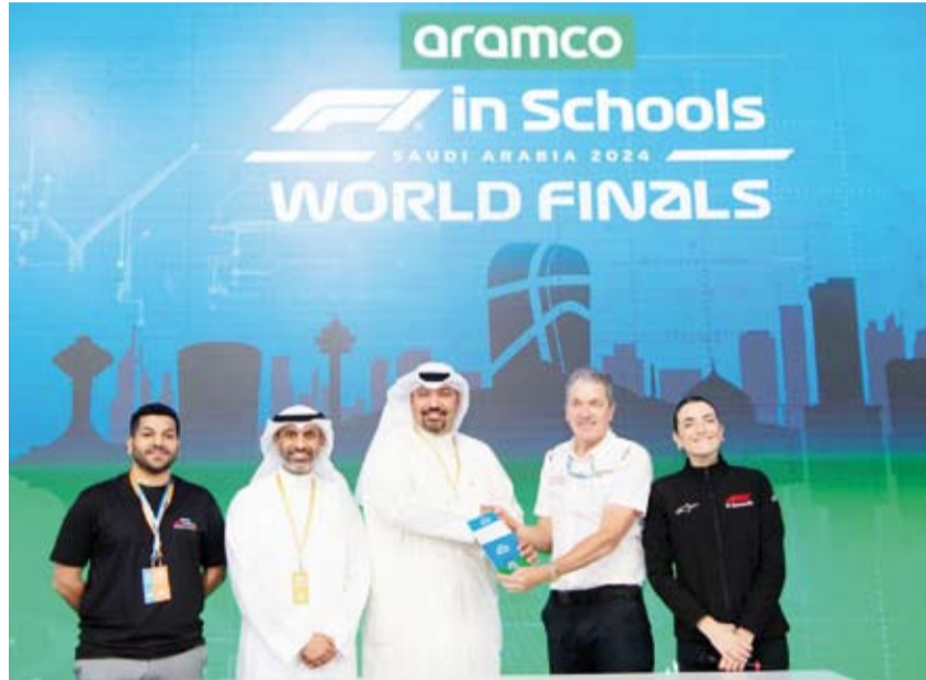
مركز صباح الأحمد للموهبة والإبداع يوقع اتفاقية شراكة مع منظمة الفورمولا 1

من جهته أعرب مؤسس ورئيس مجلس إدارة فورمولا 1 للمدارس أندرو دينغورد عن سعادته بانضمام الكويت إلى الدول المشاركة في هذا البرنامج. وأوضح أن نهائيات هذا العام شهدت مشاركة أكثر من 55 فريقاً يمثلون 25 دولة بإجمالي 450 طالباً وطالبة. وأضاف أن البرنامج يشمل أكثر من 64 دولة حول العالم ويطلق في أكثر من 29 ألف مدرسة مع استفادة أكثر من مليون ونصف المليون طالب منذ إنطلاقه.