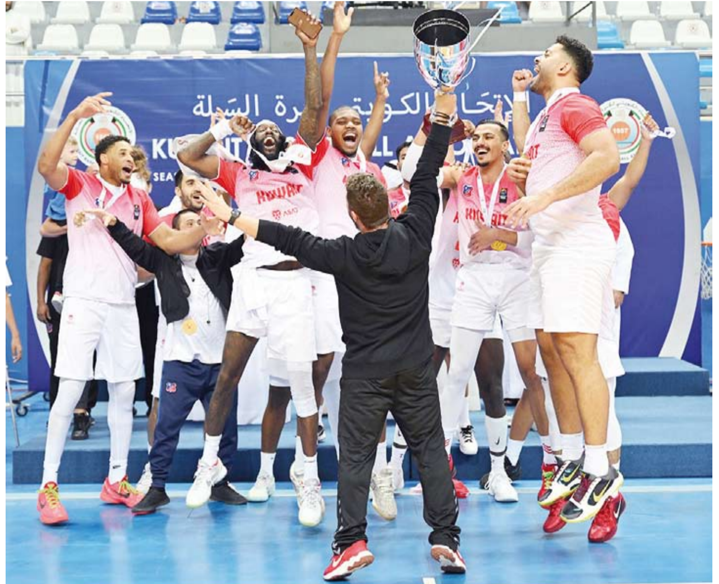
جانب من التتويج

محققاً البطولة الأولى له بالموسم المحلي. وعقب المباراة التي تعد أولى البطولات المحلية التي ينظمها الاتحاد الكويتي للعبة قام رئيس الاتحاد ضاري برجس بتتويج الفريق الفائز بحضور عدد من أعضاء مجلس إدارة الاتحاد ومسؤولي النادييين.