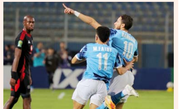
إنجاز كبير لنادي بيراميدز المصري