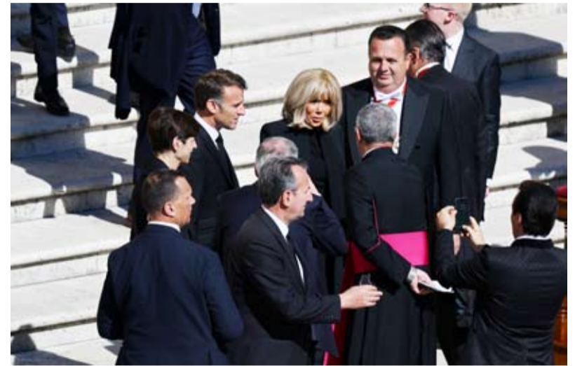
250 ألف مشيع احتشدوا في ساحة القديس بطرس بالفاتيكان

توافد أمس ملوك ورؤساء دول وحكومات وحشود على ساحة القديس بطرس بالفاتيكان لحضور قداس جنازة البابا فرنسيس، من بين أكثر من 150 دولة يشارك الرئيس الأمريكي دونالد ترامب الذي اختلف بشدة مع البابا فرانسيس في مناسبات عديدة بسبب مواقفهما المتناقضة بشكل صارخ في شأن الهجرة. إلى جانب ترامب حضر رؤساء الأرجنتين وفرنسا واليابون وألمانيا وإيطاليا والفلين وبولندا وأوكرانيا، إلى جانب رئيسي وزراء بريطانيا ونيوزيلندا، والعديد من أفراد العائلات المالكة الأوروبية. وكان الرئيس الأمريكي السابق جو بايدن وزوجته جيل من أوائل الشخصيات المهمة التي وصلت إلى الفاتيكان لتشجيع البابا الراحل.