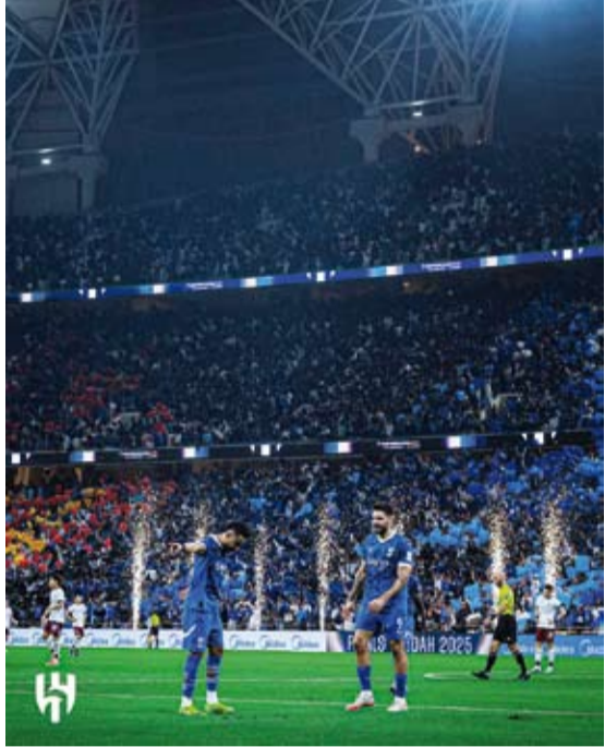
أداء مميز للهلال السعودي أمام غوانغجو الكوري

لدوري أبطال آسيا للنخبة بداية من دور الثمانية حتى المباراة النهائية في مدينة جدة السعودية، خلال الفترة من 25 إبريل الجاري حتى 3 مايو المقبل.