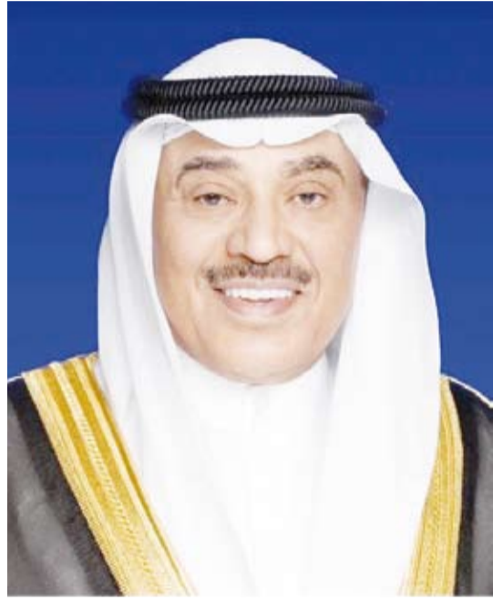
سمو ولي العهد الشيخ صباح الخالد

بعث سمو ولي العهد الشيخ صباح الخالد، ببرقية تهنئة إلى الرئيسة سامية صلوحو حسن رئيسة جمهورية تنزانيا المتحدة الصديقة، ضمنها سموه خالص تهانيه بمناسبة ذكرى يوم الاتحاد لبلادها وراجياً لفخامتها دوام الصحة والعافية. كما بعث سمو ولي العهد الشيخ صباح الخالد، ببرقية تهنئة إلى صاحب الجلالة الملك فيليم الكسندر ملك مملكة نيدرلاندز الصديقة، ضمنها سموه خالص تهانيه بمناسبة ذكرى العيد الوطني لبلادها وراجياً لجلالته دوام الصحة والعافية.