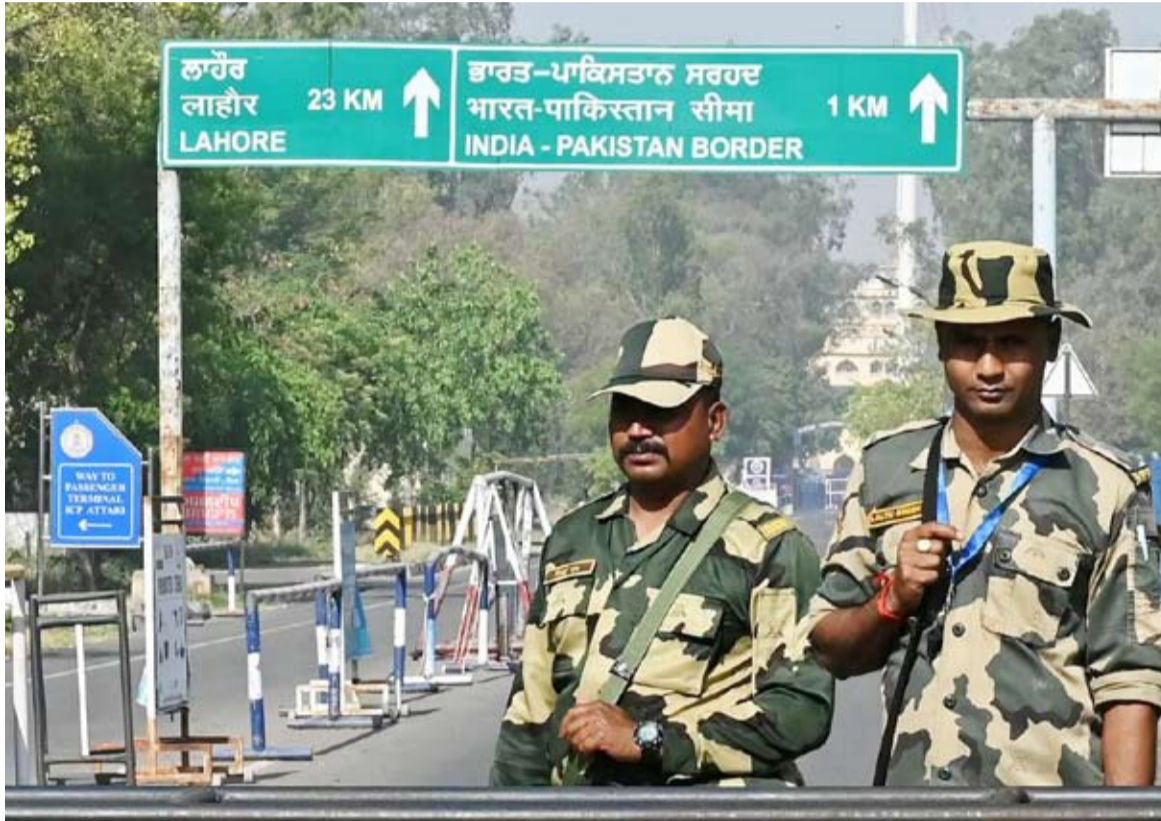
جنود من قوة أمن الحدود الهندية

أعلن الجيش الهندي أن عناصره تبادلوا إطلاق النار خلال الليل مع القوات الباكستانية على طول خط المراقبة، وهو الحدود الفعلية بين الهند وباكستان في كشمير، في عقب حوادث وقعت، وفقاً لوكالة الصحافة الفرنسية. وقال الجيش الهندي إن إطلاق نار «غير مبرر» بأسلحة خفيفة شُن من مواقع «عدة» للجيش الباكستاني «على طول خط السيطرة في كشمير». وأوضح في بيان أن «القوات الهندية ردت بشكل مناسب مستخدمة أسلحة خفيفة»، مضيفاً أن إطلاق النار لم يسفر عن وقوع إصابات. وتصاعد التوتر بين الهند وباكستان، وهما دولتان تملكان السلاح النووي وحليفتا الولايات المتحدة، منذ هجوم فتاك في كشمير الهندية. وتتهم نيودلهي جار تها بأنها مرتبطة بالهجوم الذي أودى بحياة 26 شخصاً في باهالنام. ودخلت الدولتان في الأيام الأخيرة في دوامة من الإجراءات العقابية والانتقامية. زدمر الجيش الهندي بالمتفجرات منزلين قال إنهما عائدان لعائلات منفذي الهجوم، في حين أقر مجلس الشيوخ الباكستاني بالإجماع قراراً يرفض «الانتهاكات التي لا أساس لها» الموجهة من الهند، محذراً من أن باكستان «مستعدة للدفاع عن نفسها». منذ التقسيم في العام 1947 واستقالتهما تواجه البلدان في ثلاث حروب. ويقاتل متمر دون في كشمير منذ العام 1989 لتحقيق استقلال الإقليم أو إلحاقه بباكستان. وتتهم نيودلهي إسلام آباد منذ فترة طويلة بدعمهم. لكن باكستان تنفي ذلك وتقول إنها تتكفي بدعم نضال سكان كشمير من أجل تقرير المصير. ودعا مجلس الأمن الدولي البلدين إلى «أقصى درجات ضبط النفس».