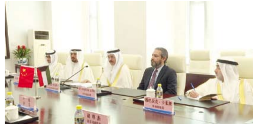
مساع وزير الخارجية لشؤون آسيا السفير سميح حيات مترشداً وفد الكويت

اختتمت في العاصمة الصينية بكين، أول أمس، أعمال الجولة الخامسة من آلية المشاورات السياسية بين وزارة الخارجية في دولة الكويت ووزارة خارجية جمهورية الصين الشعبية.