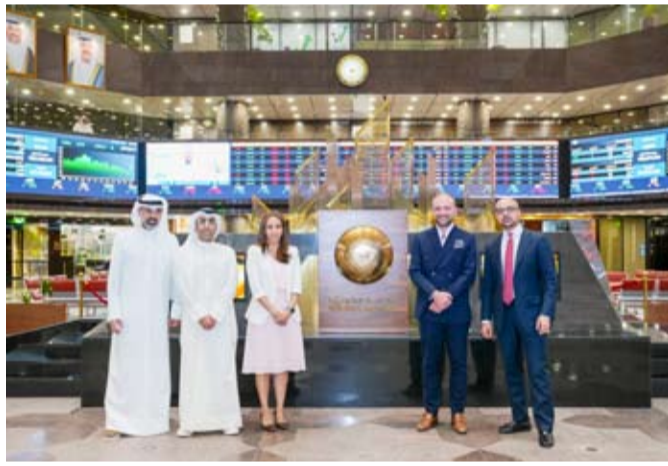
مشاركون في ورشة العمل

وتأثيراتها المتسلسلة على مستوى دول مجلس التعاون الخليجي، مع التركيز بشكل خاص على الكويت. وتطرق الورشة إلى عدة محاور من ضمنها مسارات أسعار الفائدة، وتدفقات رؤوس الأموال، واستدامة السياسات المالية في المنطقة، إضافة إلى التطورات التنظيمية والمؤسسية في دولة الكويت. قال ياب ميچر: "وقرت الورشة نظرة شاملة حول كيفية تأثير الديناميكيات الاقتصادية - ابتداء من تغيير السياسات النقدية وصولاً إلى المخاطر الجيوسياسية - على توجهات المستثمرين وتدفقات رؤوس الأموال في دول مجلس التعاون الخليجي، وساهمت في تزويد المشاركين برؤى تساعد على التنقل في بيئة السوق الديناميكية من خلال الربط بين هذه التوجهات العالمية والسياق الاقتصادي والتخليفي في الكويت. أتقدم بالشكر إلى بورصة الكويت على إتاحة هذه الفرصة لمشاركة هذه الرؤى، وعلى دورها المستمر في تعزيز الوعي المالي والشفافية".