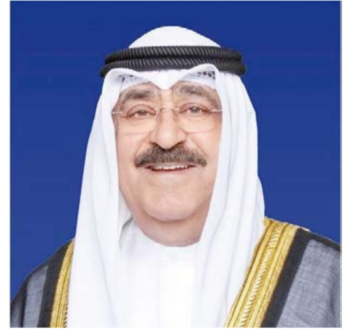
سمو أمير البلاد الشيخ مشعل الأحمد

بعث صاحب السمو أمير البلاد الشيخ مشعل الأحمد، ببرقية تهنئة إلى الرئيسة سامية صلوحو حسن رئيسة جمهورية تنزانيا المتحدة الصديقة، عبر فيها سموه عن خالص تهانيه بمناسبة ذكرى يوم الاتحاد لبلادها. متمنياً سموه لفخامتها موفور الصحة والعافية ولجمهورية تنزانيا المتحدة وشعبها الصديق كل التقدم والأزدهار. كما بعث صاحب السمو أمير البلاد الشيخ مشعل الأحمد، ببرقية تهنئة إلى صاحب الجلالة الملك فيليم الكسندر ملك مملكة نيدرلاندز الصديقة، عبر فيها سموه عن خالص تهانيه بمناسبة العيد الوطني لبلادها. متمنياً سموه لجلالته موفور الصحة والعافية ولملكة نيدرلاندز وشعبها الصديق كل التقدم والأزدهار.