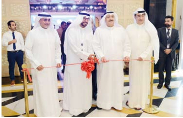
وزير الصحة يفتتح المعرض للمؤتمر

وأوضح البيان أن حملة (وجهني) تهدف إلى تعريف وتوعية وإرشاد الطلبة الكويتيين من خريجي الثانوية العامة والمنظم التعليمية الأجنبية الصادرة من داخل وخارج الكويت الراغبين في الابتعاث بالخارج لضمان أحاطتهم الكاملة بإجراءات الابتعاث واختبار التخصصات المناسبة التي يحتاجها سوق العمل وتقديم طلباتهم بالشكل الصحيح.