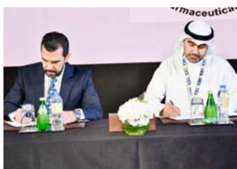
جانين من توقيع الاتفاقية

«أورجانون» في الكويت: «إن شراكتنا مع الجمعية الصيدلية الكويتية تتماشى مع رسالتنا المتمثلة في تحسين صحة المرأة والأسرة وتمكين اختصاصيي الرعاية الصحية من تقديم الخدمات اللازمة. فمن خلال الاستثمار في تقديم التعليم والتدريب للصيادلة، نسعى إلى توفير أساس متين للخدمات الصحية المتحورة حول المرضى ومعالجة أهم أوجه صحة المرأة والعائلة للارتقاء بصحة المجتمع. ولذلك، نفخر بهذا التعاون باعتباره جزءاً من التزامنا بتعزيز الرعاية الصحية للمرأة والأسرة في المنطقة».