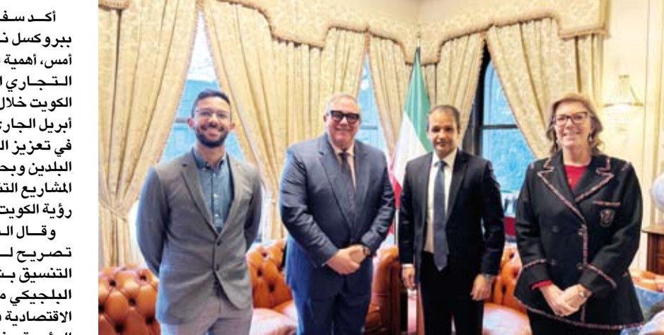
السفير نواف العنزي مع الممثلة الاقتصادية البلجيكية الغنيمه بالكوت وممثلي الهيئات التجارية الإقليمية البلجيكية

أكد سفير دولة الكويت ببروكسل نواف العنزي، أول أمس، أهمية الزيارة المرتقبة للوفد التجاري البلجيكي إلى دولة الكويت خلال الفترة من 28 إلى 30 أبريل الجاري، مشدداً على دورها في تعزيز العلاقات الثنائية بين البلدين وبحث فرص التعاون في المشاريع التنموية بما يتماشى مع رؤية الكويت 2035. وقال السفير العنزي في تصريح له (كونا): إنه جرى التنسيق بشأن زيارة الوفد التجاري مع مختلف الهيئات الاقتصادية في الأقاليم البلجيكية الرئيسية وغرفة التجارة العربية إلى البلجيكية اللوكسمبورغية إلى جانب غرفة تجارة وصناعة