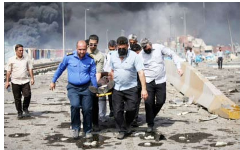
الانفجار الكبير أوقع ضحايا وجرحى بالمئات

قُتل 4 أشخاص على الأقل وجرح 561 آخرون في انفجار ضخم وقع أمس السبت في ميناء الشهيد رجائي بمدينة بندر عباس جنوب شرقي إيران. ونقلت وكالة أنباء (إيسنا) الإيرانية عن المتحدث باسم منظمة الطوارئ والإسعاف بابك بكتابريست القول "إن عدد المصابين جراء الانفجار بلغ 516 تم نقلهم إلى المستشفيات لتلقي العلاج اللازم".