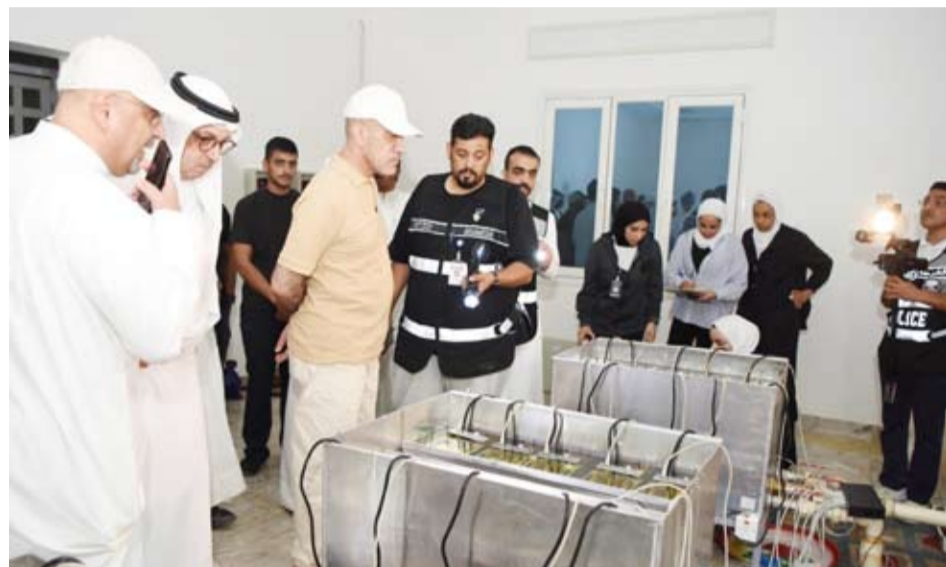
الشيخ فهد اليوسف يشرف على الحملة الموسعة في الوفرة السكنية

الحملة الميدانية الموسعة التي تمت يوم الجمعة الماضي في منطقة الوفرة السكنية، وأشرف عليها رئيس مجلس الوزراء بالإناية، أوضحت مدى الاستغلال غير القانوني للتيار الكهربائي واستخدامه في أنشطة غير مشروعة ومحظورة مثل تعدين العملات المشفرة. خلال الحملة التي شاركت فيها نحو سبعة جهات حكومية، تم ضبط 47 منزلاً مخالفاً تستخدم لتعدين العملات المشفرة، وتستهلك الكهرباء بأكثر من المعدل الطبيعي بنحو 60 بالمئة.. وزارة الكهرباء قدرت الوفرة السنوي بنحو 15 مليون دينار... «طيب لو مسكتوا الباقي كم توفرون»؟! «طالع صفحتي 2 و 4»