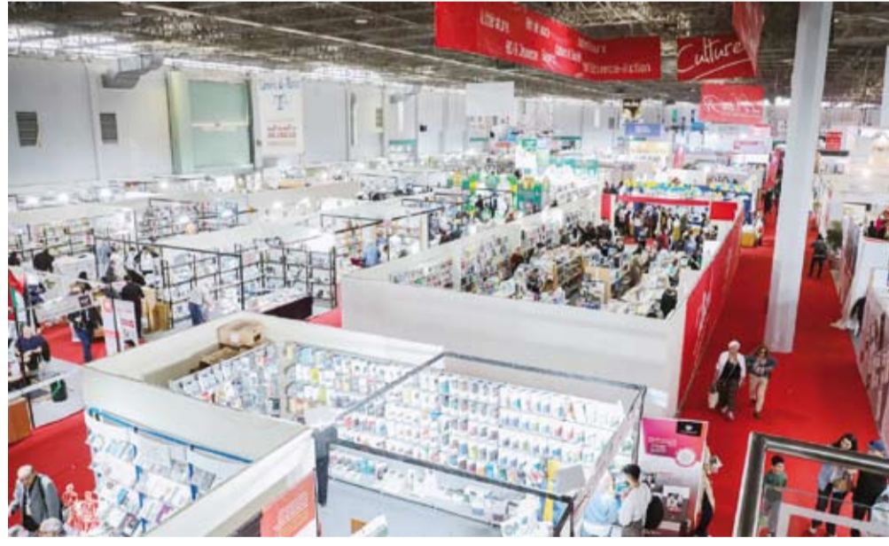
جانب من افتتاح معرض تونس الدولي للكتاب

افتتح الرئيس التونسي قيس سعيد اليوم الجمعة الدورة 39 لمعرض تونس الدولي للكتاب والتي تتواصل فعاليات حتى الرابع من مايو القادم تحت شعار (نقرأ لنبتني) بمشاركة ممثلين عن 29 دولة عربية وأجنبية و313 عارضاً من بينهم 166 من خارج تونس. وتتضمن هذه الدورة عرض أكثر من 110 آلاف عنوان وتتميز باستضافة 183 مفكراً ومثقفاً من بينهم بشكل خاص الكاتب الليبي