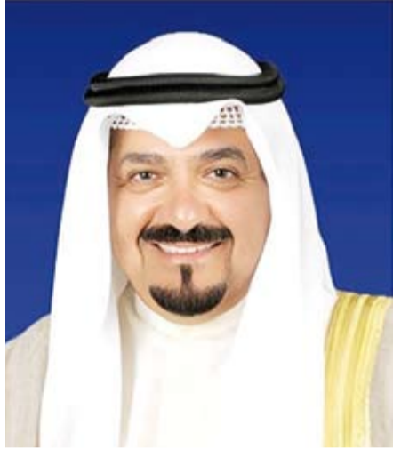
سمو الشيخ أحمد العبد الله

بعث سمو الشيخ أحمد العبدالله رئيس مجلس الوزراء، ببرقية تهنئة إلى الرئيسة سامية صلوحو حسن رئيسة جمهورية تنزانيا المتحدة الصديقة بمناسبة ذكرى يوم الاتحاد لبلادها. وبعث سمو الشيخ أحمد العبدالله رئيس مجلس الوزراء، ببرقية تهنئة إلى صاحب الجلالة الملك فيليم الكسندر ملك مملكة نيدرلاندز الصديقة بمناسبة العيد الوطني لبلادها.