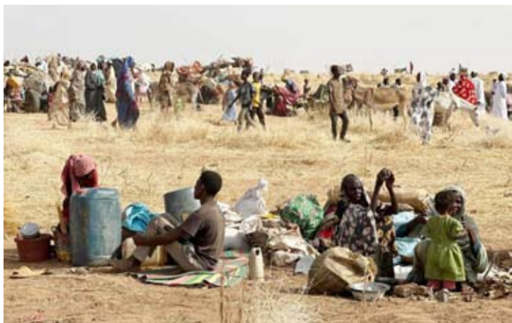
فارون من مخيم زمرز للنازحين

بولاية النيل الأبيض جنوب البلاد، ومشتات الكهرباء في سد مروى بشمال البلاد. وبعد استعادة الجيش السوداني للعاصمة الخرطوم ولايات الجزيرة وسنار، تمررت «قوات الدعم السريع» بشكل رئيسي في مناطق غرب وجنوب مدينة أم درمان.