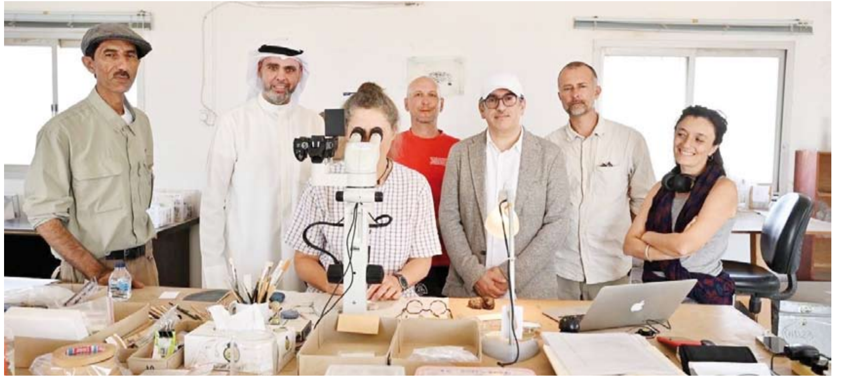
وفد المجلس الوطني للثقافة والفنون والآداب مع أعضاء البعثة الدنماركية في مختبر الآثار