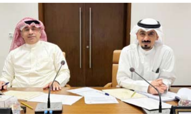
رئيس اللجنة ومقرها

يزيد على المساحات المقررة في حال تعارضه مع أي خدمات بنية تحتية قائمة أو أي دواع تنظيمية. من جهة أخرى أيقت اللجنة على جدولها طلب وزارة الكهرباء والماء المتجددة تخصيص موقع محطة التحويل الثانوية بمنطقة سلوى قطعة 6 محطة رقم 2 وذلك لدعوة وزارة الكهرباء كما أحيطت اللجنة بالعمل بتمديد استغلال الأرض المخصصة لرياض الأطفال في منطقة الجابرية - قطعة 7.