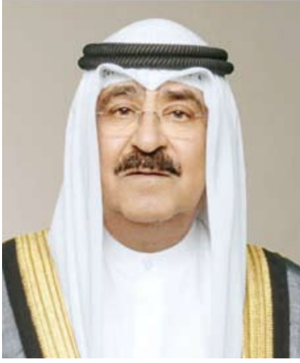
سمو أمير البلاد الشيخ مشعل الأحمد

الأمير ورجلاً لجلالته ولكافة أفراد الأسرة المالكة الكريمة جميل الصبر وحسن العزاء.