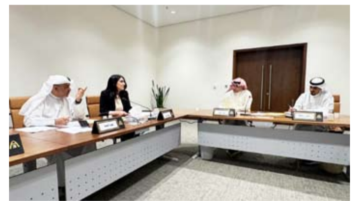
جانب من اجتماع لجنة حولي

ثانياً: الموافقة على طلب وزارة الخارجية تخصيص الموقع الكائن بالضاحية الدبلوماسية قطعة 2 جنوب منطقة السفارات والبالغ مساحته 29587.98م لإقامة سارية علم بارتفاع 29م وتيليط وتجميل بقية الموقع شريطة ما يلي: أخذ موافقة الإدارة العامة للطيران المدني بشأن ارتفاع السارية قبل الترخيص. تخويل الإدارات المختصة بزحزحة وتعديل أبعاد الموقع ومساحته بما لا