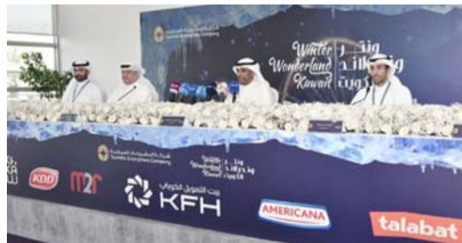
المتحدثون خلال المؤتمر الصحفي