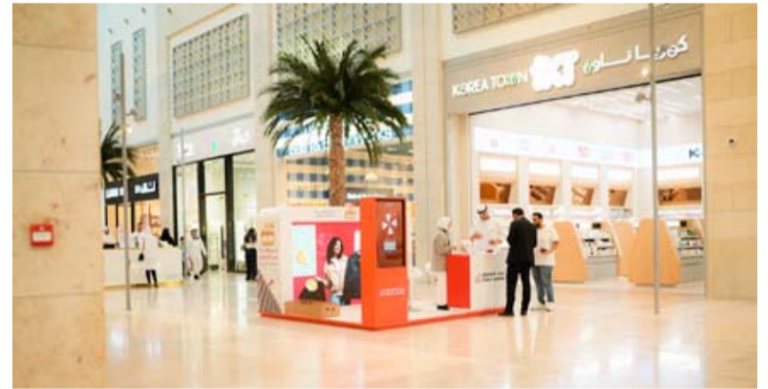
جناح البنك في الخيران مول

حساب الراتب من الكويتين هو تقديم هدية ترحيبية نقدية تصل إلى 1200 دينار تُضاف مباشرة إلى حساب العميل عند تحويل الراتب، ما يمثل حافزاً إيجابياً لبداية مالية قوية سواء للمعلماء الجدد. ويحظى العميل بخيارات واسعة للتحويل تلبى مختلف احتياجات العملاء، تشمل: قرض استهلاكي يصل إلى 25,000 دينار بفترة سداد مرنة تمتد حتى 5 سنوات، لتغطية احتياجات التعليم أو السفر أو تجديد المنزل. قرض إسكاني يصل إلى 70,000 دينار بفترة سداد تصل إلى 15 سنة، لمساعدة العملاء في تحقيق حلم امتلاك منزل المستقبل.