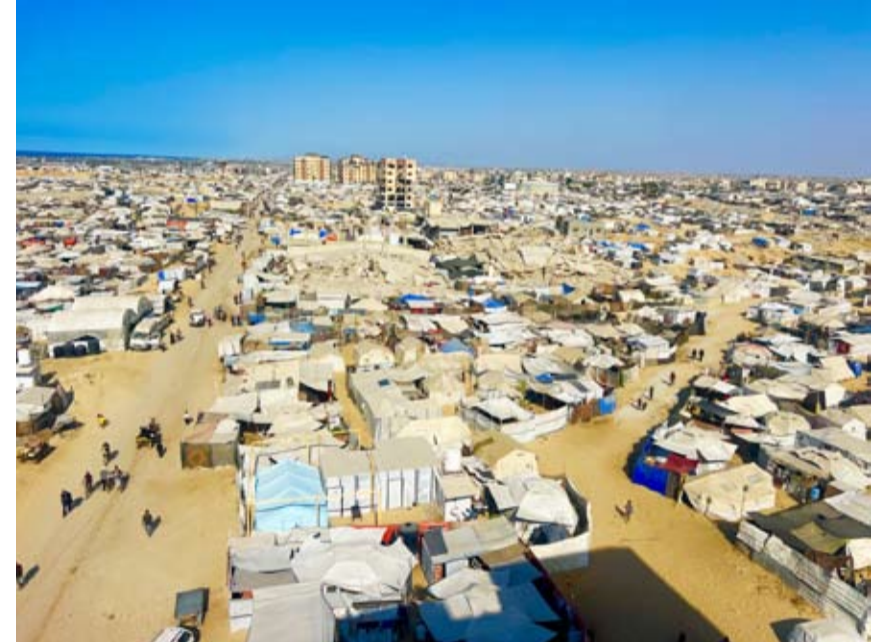
خيام النازحين تتكدس في منطقة المواقص غرب خانونس

تتكسد خيام النازحين الفلسطينيين في منطقة المواقص غرب مدينة خانونس جنوب قطاع غزة في مشهد إنساني بالغ القسوة بعد أن اضطرت عشرات الآلاف من الأشخاص إلى النزوح قسراً بأوامر من جيش الاحتلال في ظل عمليات قصف وترويع ممنهجة. إلى ذلك أكد رئيس وزراء الاحتلال بنيامين نتانياهو، أمس، أنه حدد القوات غير المقبولة تواجدها في قطاع غزة، معلناً رفضه دخول قوات تركية إلى غزة، ضمن خطة الرئيس الأميركي دونالد ترامب لإنهاء الحرب.