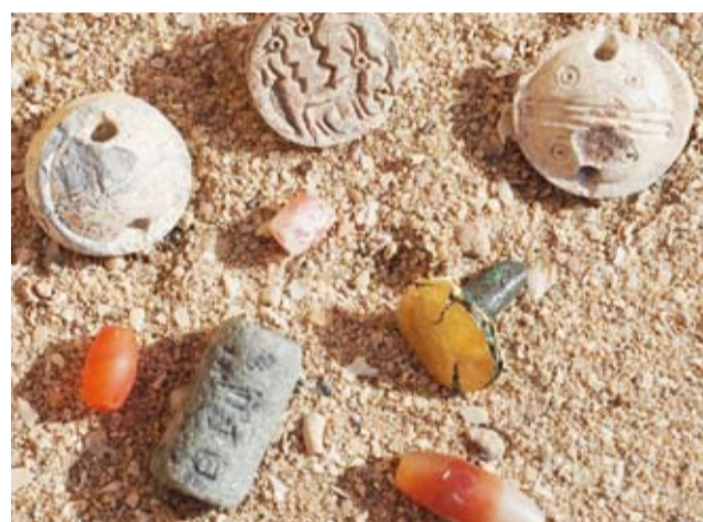
مجموعة من خرز الأحجار الكريمة وخنم دلموني