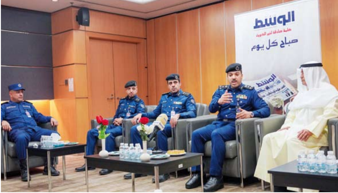
رئيس التحرير متحدثاً مع العميد الغريب