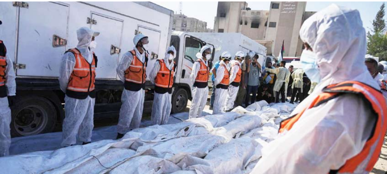
جثث للفلسطينيين مجهولي الهوية

صرح مسؤول دفاعي إسرائيلي بأن فريقاً مصرياً دخل قطاع غزة برفقة عدة مركبات هندسية للمساعدة في تحديد مكان جثث الرهائن في القطاع، وذلك في إطار جهود استعادة رفات الرهائن الثلاثة عشر المتبقين في غزة. وأضاف المسؤول، وفق صحيفة «تايمز أوف إسرائيل»، أن هذه الخطوة حظيت بموافقة القيادة السياسية الإسرائيلية. وما زالت الخروقات الإسرائيلية في قطاع غزة متواصلة، على وقع استمرار الاستهدافات التي تطال المواطنين في مناطق متفرقة من القطاع، خاصة في المناطق الشرقية بالقرب من المناطق المصنفة أنها قرب «الخط الأصفر» وفق ما يحدده اتفاق وقف إطلاق النار. وقُتل فلسطينيان، بقصف من مسيّر إسرائيلية استهدفتها بالقرب من أبراج «القسطل»، في منطقتي دير البلح ووسط قطاع غزة، وهما شقيقان، أثناء محاولتهما تفقد منزل عائلتهما. واستمرت عمليات القصف المدفعي