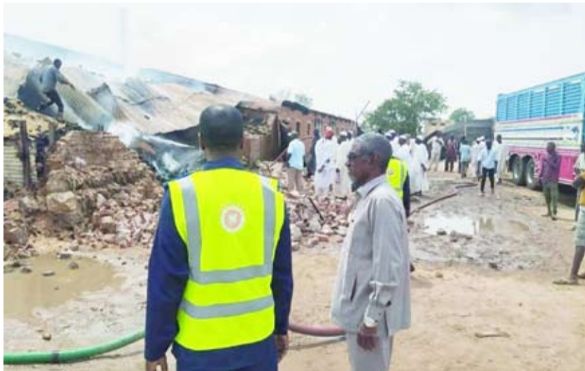
جانب من الدمار الذي لحقته الحرب في السودان

ولم يصدر تعليق رسمي من الجيش عن الوضع في بارا، في الوقت الذي انقطعت فيه الاتصالات عن المدينة، بينما تناقل شهود أحاديث عن نزوح الأسر إلى أطراف المدينة الشرقية. وعادة لا يعلن طرفا القتال في السودان عن خسائرهم البشرية