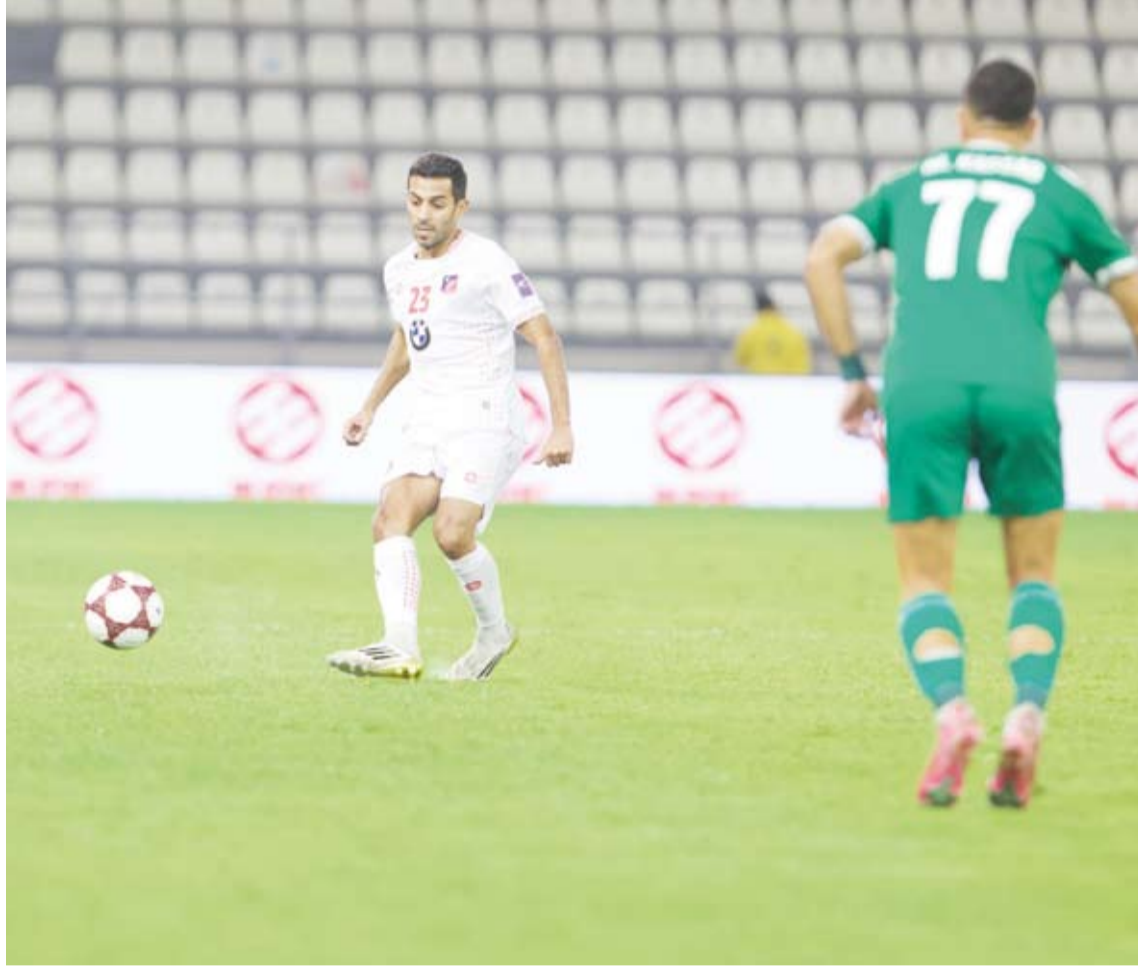
مباراة مثيرة شهدت تسجيل 5 أهداف