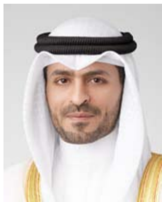
الشيخ صباح السالم

والرياضات الخارجية، ويوفر منصة مثالية للتعرف على أحدث الابتكارات في عالم القوارب، وأدوات الصيد، ومعدات التخيم، والرحلات، كما يُعد فرصة مميزة للشركات المحلية والعالمية لعرض منتجاتها والتواصل مع جمهورها المستهدف. وذكر أن المعرض يهدف إلى المساهمة في دعم عجلة التنمية وتشجيع السياحة الداخلية من خلال إبراز مكانة الكويت كوجهة للفعاليات والمعارض المتخصصة في الأنشطة الترفيهية والرياضية الخارجية، فضلاً عن تشجيع الهواة والمحترفين على التعرف على أحدث الابتكارات في مجالات التخيم، تجهيز السيارات، الغوص، القنص، الكرفانات، ومقصورات السفر وغيرها من المستلزمات.