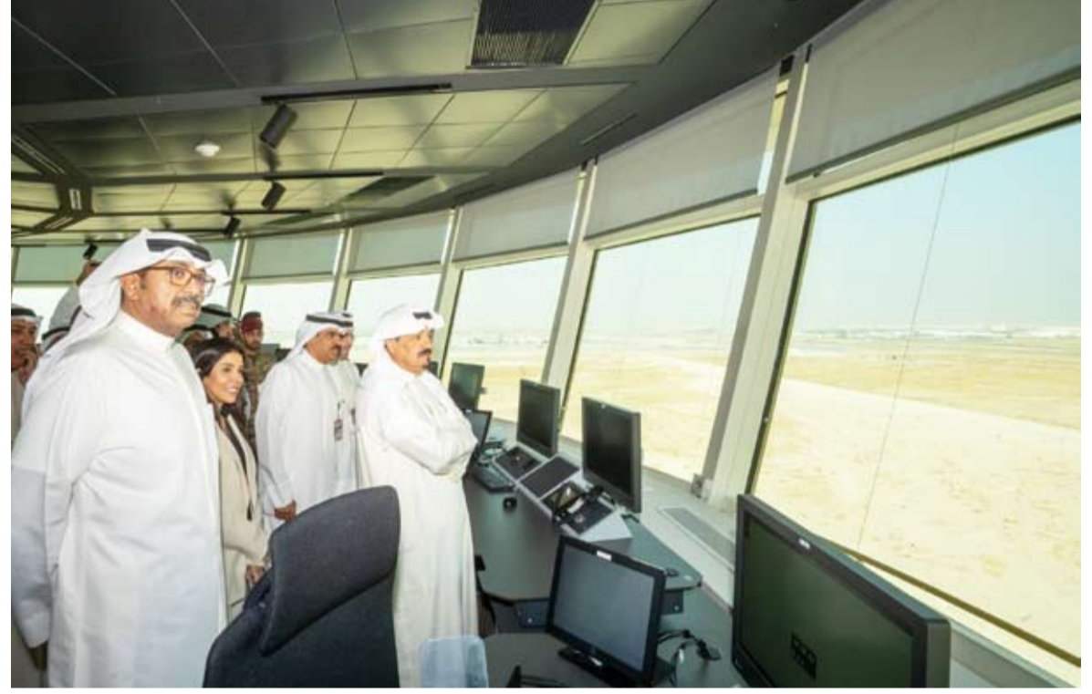
العيدالله وعدد من الوزراء يتفقدون برج المراقبة الجديد والمدرج الثالث في مطار الكويت الدولي

تحت رعاية وحضور سمو الشيخ أحمد العبدالله رئيس مجلس الوزراء أقامت الإدارة العامة للطيران المدني امس احتفالا بالافتتاح الرسمي لبرج المراقبة الجديد والمدرج الثالث في مطار الكويت الدولي. واستمع سمو رئيس مجلس الوزراء إلى شرح مفصل من القائمين على التنفيذ حول مراحل الإنجاز ومكونات المشروع الفنية والتشغيلية خلال جولة تفقدية في موقع المشروع. وقال سموه في تصريح صحفي إن افتتاح وتشغيل برج المراقبة الجديد والمدرج الثالث في مطار الكويت الدولي يمثلان نقلة نوعية في منظومة النقل الجوي الوطني، ويعكسان التزام الدولة بتنفيذ رؤيتها التنموية الشاملة. وأكد سموه أن الحكومة تولي اهتماما كبيرا بتطوير البنية التحتية للمطارات