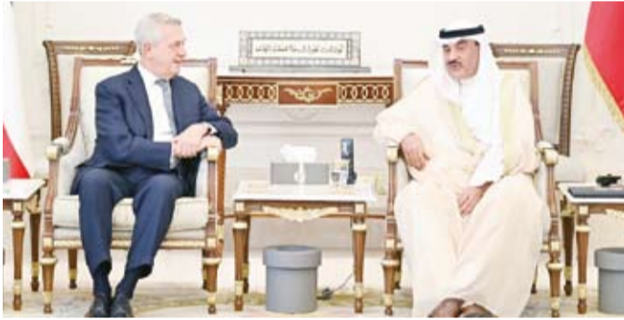
سمو ولي العهد مستقبلاً المفوض السامي للأمم المتحدة لشؤون اللاجئين فيليبو غراندي

سمو ولي العهد يهنئ رئيس النمسا بالعيد الوطني بعث سمو ولي العهد الشيخ صباح الخالد، ببرقية تهنئة إلى الرئيس الدكتور ألكسندر فان دير بيلين رئيس جمهورية النمسا الصديقة، ضمنها سموه خالص تهانيه بمناسبة ذكرى العيد الوطني لبلاده. متمنياً سموه لفخامته