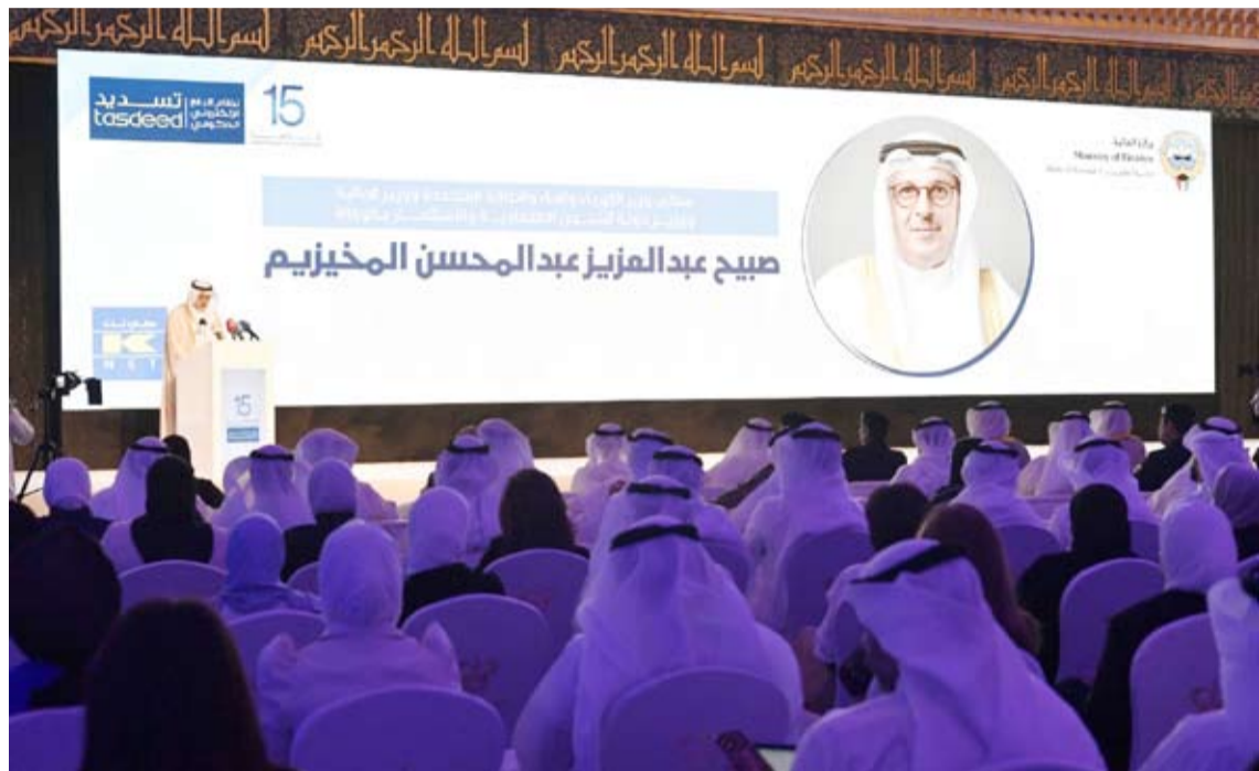
المخيزيم أثناء القائه كلمة افتتاحية

والتعاون المشرم بين مختلف الجهات الحكومية والجهود المتواصلة للكوادر الوطنية بوزارة المالية.