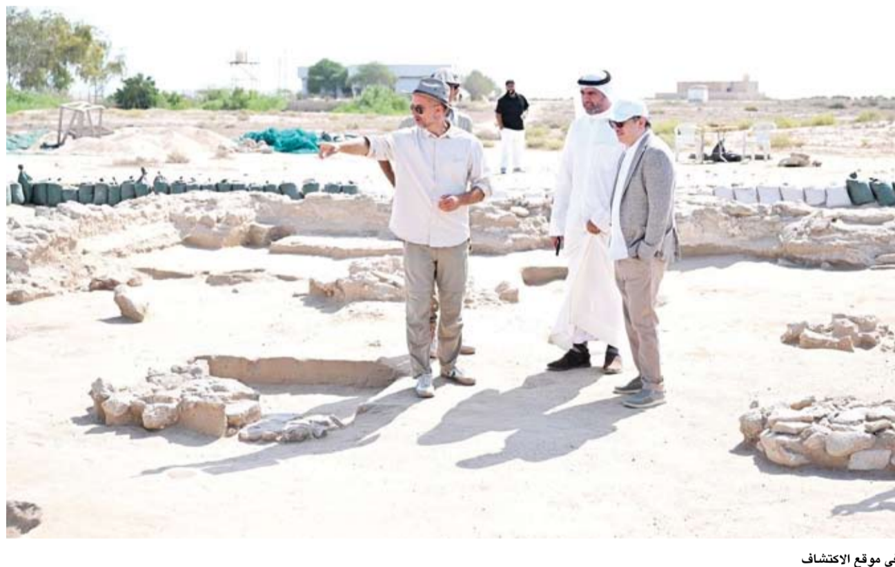
في موقع الاكتشاف

المعبد المكتشف سابقا ويعود أيضا إلى العصر البرونزي موضحا أن القطع الأثرية المكتشفة مثل الأختام والأواني الفخارية تؤكد انتماء المعبد الجديد إلى فترة دلمون المبكرة ما يمثل علامة بارزة في فهم الممارسات الدينية لحضارة ومملكة دلمون. بدوره قال استناد الآثار والأنثروبولوجيا في جامعة الكويت الدكتور حسن أشكناني لـ (كو نا): إن اكتشاف معبدتين لحضارة دلمون يعودان إلى الفترة ما بين 1900 و1800 قبل الميلاد يعتبر إنجازاً أثرياً فريداً في تاريخ الاكتشافات بدولة الكويت. وأوضح أشكناني أن هذا الاكتشاف يرفع عدد المعابد المعروفة في المنطقة