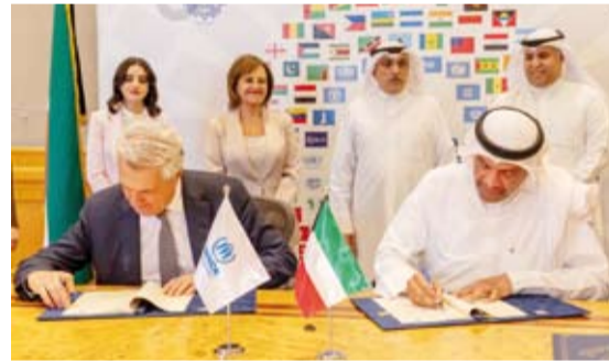
عبدالله اليحيا وفيليبو غراندي أثناء توقيع الاتفاقيتين

دولة الكويت تسرين ربيعان في تصريح مماثل لـ (كوونا): إن الاتفاقيتين تستهدفان أوضاع اللاجئين السودانيين في تشاد والنيجر السودانين المتواجدين في السودان، موضحة أن أزمة السودان تبقى إحدى الأزمات الإنسانية التي تحتاج إلى مساعدة إنسانية دائمة. وأشارت ربيعان إلى أن الصندوق الكويتي ساهم في عدة أوضاع إنسانية من خلال