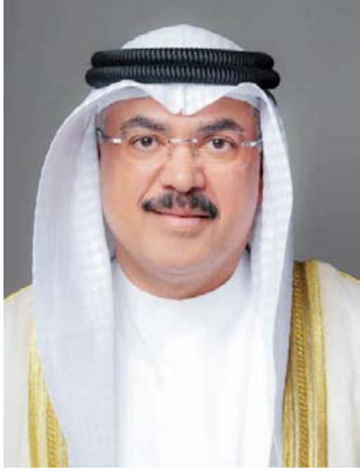
وزير التربية، م. سيد جلال الطيباني

◆ لجنة صلاحية مباشرة التحقيق في أي مخالفات إدارية أو مالية قد تكشف أثناء فحص المستندات