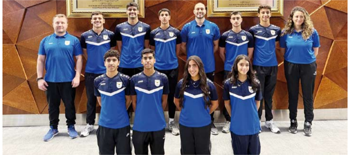
صورة جماعية لمنتخب الشباب المشارك في دورة الألعاب الآسيوية