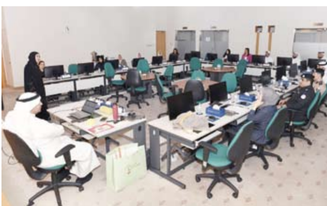
جانب من البرنامج التدريبي

مثال واقعي وتأثير وسائل التواصل الاجتماعي على العمل الإعلامي مع مثال واقعي. ويخترق البرنامج الذي يعتمد الأسلوبين النظري والعملي كذلك إلى تكوين فرق العمل الإعلامية من القائد ومدير العلاقات العامة ومدير الإنتاج ومدير البرامج وأهمية توزيع الأدوار بوضوح بين الأعضاء وتحديد الأهداف والمهام بدقة وبناء روح التعاون والمسؤولية المشتركة وأيضاً معايير الجودة في العمل الإعلامي من وضوح