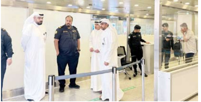
جانب من الجولة التفقدية

أكد مدير عام الإدارة العامة للجمارك يوسف النويف، أول أمس، أهمية تكثيف الجهود وتعزيز التعاون بين مختلف الإدارات الجمركية بما يحقق الانسيابية في حركة تفتيش المسافرين وحماية البلاد من أي محاولات للتهديب.