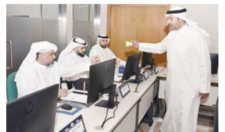
جانب من البرنامج التدريبي

مثال واقعي وتأثير وسائل التواصل الاجتماعي على العمل الإعلامي مع مثال واقعي. ويخترق البرنامج الذي يعتمد الأسلوبين النظري والعملي كذلك إلى تكوين فرق العمل الإعلامية من القائد ومدير العلاقات العامة ومدير الإنتاج ومدير البرامج وأهمية توزيع الأدوار بوضوح بين الأعضاء وتحديد الأهداف والمهام بدقة وبناء روح التعاون والمسؤولية المشتركة وأيضاً معايير الجودة في العمل الإعلامي من وضوح