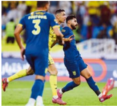
رونالدو يواصل التهديف

عادل النصر أفضل انطلاقه له في تاريخ مشاركاته في دوري "روشن" السعودي بفوزه على الحزم 2-0 ووصله إلى الانتصار السادس تواليا في ختام الجولة السادسة.