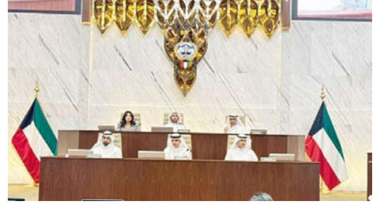
جانب من جلسة البلدي