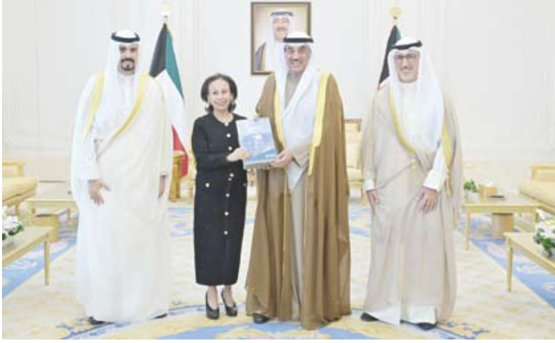
سمو ولي العهد يتسلم التقرير السنوي لهيئة تشجيع الاستثمار