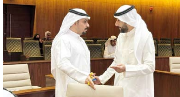
حوار عضوي البلدي