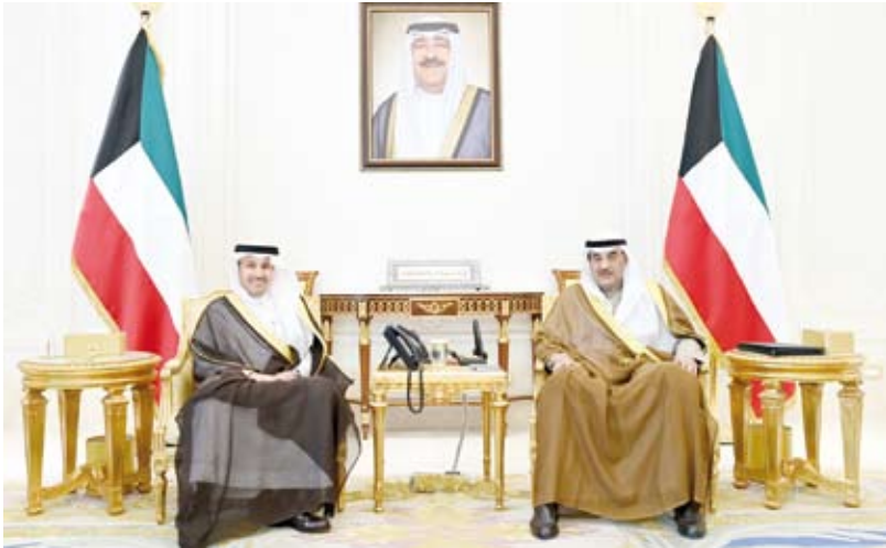
.. وسموه استقبال وزير النقل والخدمات اللوجستية السعودي

2024/2023 واستقبل سمو ولي العهد الشيخ صباح الخالد، وزير النقل والخدمات اللوجستية بالمملكة العربية السعودية الشقيقة المهندس صالح بن ناصر الجاسر والوفد المرافق وذلك بمناسبة زيارته الرسمية للبلاد. وحضر اللقاء زيارة الأشغال العامة الدكتور نورة المشعان ومدير مكتب سمو ولي العهد الفريق متقاعد جمال الذياب ورئيس الإدارة العامة للطيران المدني الشيخ المهندس حمود المبارك وكبير الشؤون الخارجية بديوان سمو ولي العهد مازن العيسى وسفير خادم الحرمين الشريفين لدى دولة الكويت صاحب السمو الأمير سلطان بن سعد.