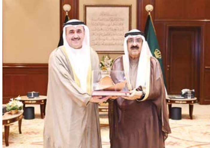
.. وسموه يتسلم التقرير السنوي لديوان المحاسبة من رئيس الديوان