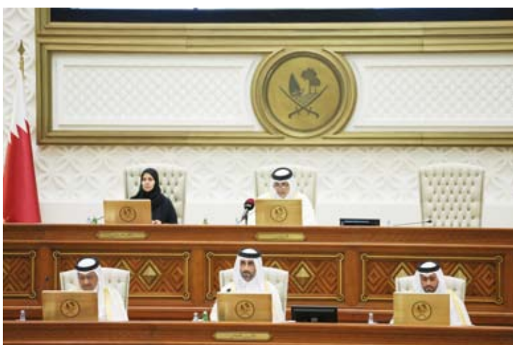
جانب من جلسة مجلس الشورى القطري