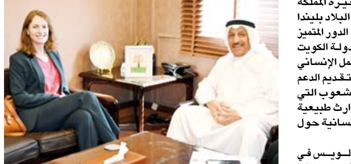
السفيرة بيلندا لويس أثناء لقائها خالد المغامس

تمت سفيرة المملكة المتحدة لدى البلاد بيلندا لويس، أمس، الدور المتميز الذي تؤديه دولة الكويت في مجال العمل الإنساني والإغاثي وتقديم الدعم والحوار للشعوب التي تتعرض لكوارث طبيعية أو أزمات إنسانية حول العالم. وقالت لويس في تصريح صحفي عقب لقائها رئيس مجلس إدارة جمعية الهلال الأحمر الكويتي السفير خالد المغامس: إن دولة الكويت جسدت نموذجاً متميزاً للعمل الإنساني الخيري ولم تتوان في تلبية نداء الواجب الإنساني من خلال المساعدات الإنسانية التي تقدمها للدول التي تتعرض للكوارث الطبيعية أو من صنع الإنسان. وأشارت في هذا الصدد بالجهد الذي يبذلها الهلال الأحمر الكويتي على الصعيدين العربي والدولي لتقديم الدعم والحوار الإنساني وتحسين ظروف ضحايا النزاعات والكوارث على جميع المستويات الدولية. وذكرت أن لقاءها مع المغامس تناول بحث الموضوعات المتعلقة بالعمل