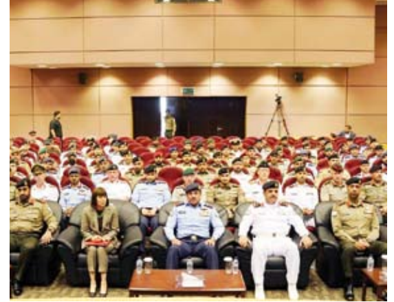
جانب من المحاضرة التي لقتها السفيرة الأمريكية

أشادت سفيرة الولايات المتحدة الأمريكية لدى البلاد كارين ساسامارا، أمس، بالعلاقات المتميزة التي تربط بين بلادها ودولة الكويت. جاء ذلك وفق بيان صحفي لوزارة الدفاع خلال استقبال أمر كلية مبارك عبدالله للقيادة والأركان اللواء الركن طيار فهد الخريج لسفيرة ساسامارا حيث ألقى محاضرة للدارسين في دورة القيادة والأركان المشتركة رقم (29) بعنوان (الولايات المتحدة الأمريكية والشرق الأوسط). وأشارت الوزارة إلى أن هذه المحاضرة تأتي ضمن سلسلة المحاضرات التي تقيّمها الكلية للدورات المنعقدة لديها من خلال استضافة محاضرين من مختلف التخصصات الأكاديمية المدنية والعسكرية من داخل الكويت وخارجها لتقديم محاضرات حول عدة مواضيع يتناولون من خلالها الشؤون العسكرية والسياسية والاستراتيجية.