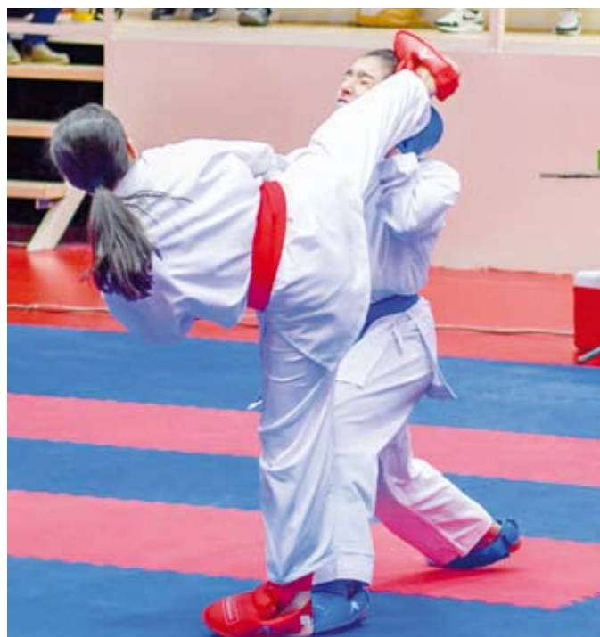
منافسات متقدمة شهدت البطولة

نادي فتيات العيون الرياضي بلقب بطولة الاتحاد المفتوحة الأولى للكراتيه للفتيات للموسم الرياضي المحلي (2024/2025) التي نظمتها الاتحاد الكويتي للعبة واختتمت بعد أربعة أيام من المنافسات وسط مشاركة أكثر من 150 لاعبة من 14 نادياً وأكاديمية متخصصة باللعبة. وتمكن «فتيات العيون» من حسم البطولة التي أقيمت بصالة الاتحاد بنادي السالمية وشملت فئات المراهق والاشبال والناشئات والشباب والعمومي بعد أن جمعت لاعباته 30 نقطة بمنافسة قوية مع حامل اللقب للموسم الماضي عن نادي (الفتاة) الذي تحصل على 27 نقاط فيما احتل نادي الكويت المركز الثالث بعد أن حصدت لاعباته 18 نقطة.