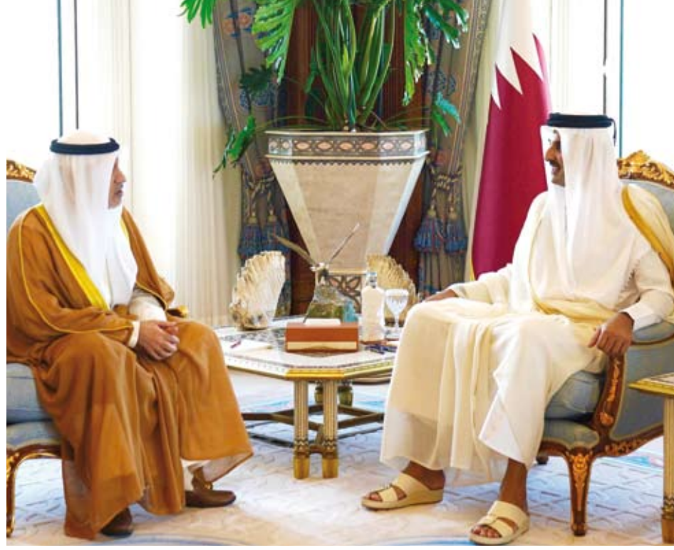
سمو الشيخ تميم بن حمد مستقبلاً الشيخ فهد اليوسف

كما بحث النائب الأول لرئيس مجلس الوزراء ووزير الدفاع ووزير الداخلية الشيخ فهد اليوسف مع وزير الداخلية القطري قائد قوة الأمن الداخلي "لخويا" في دولة