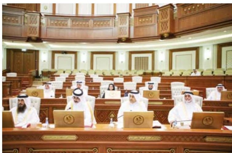
رئيس مجلس الشورى متحدثاً

أعضاء المجلس إلا إذا فقد الثقة والاعتبار، أو فقد أحد شروط العضوية التي انتخب على أساسها، أو أخل بواجبات عضويته، ويجب أن يصدر قرار إسقاط العضوية من المجلس بأغلبية ثلثي أعضائه. المادة رقم (104) أصبحت في النص المقترح (للأمير، في أحوال الضرورة، ومقتضيات المصلحة العامة، حل مجلس الشورى بمرسوم، وإذا حل المجلس وجب تعيين المجلس الجديد في موعد لا يتجاوز ستة أشهر من تاريخ الحل. وإلى أن يعين المجلس الجديد يتولى الأمير التشريع)، بعد أن كانت (للأمير أن يحل مجلس الشورى بمرسوم يبين فيه أسباب الحل، على أنه لا يجوز حل المجلس لذات الأسباب مرة أخرى، وإذا حل المجلس وجب إجراء انتخابات المجلس الجديد في موعد لا يتجاوز ستة أشهر من تاريخ الحل. وإلى أن يجري انتخاب المجلس الجديد يتولى الأمير بمعاونة مجلس الوزراء سلطة التشريع.)