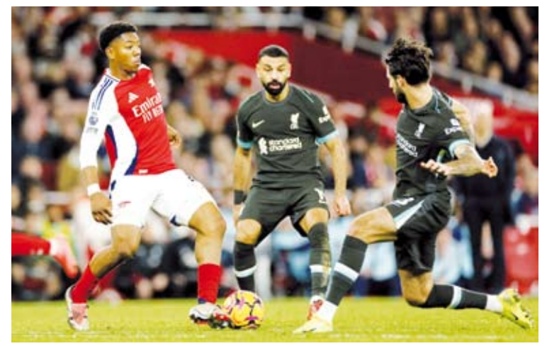
محمد صلاح أحرز هدف التعادل

تعادل فريق ليفربول مع مضيفه أرسنال بهدفين لملهما خلال المباراة التي جمعت بينهما في قمة مباريات الجولة التاسعة لبطولة الدوري الإنجليزي الممتاز لكرة القدم.