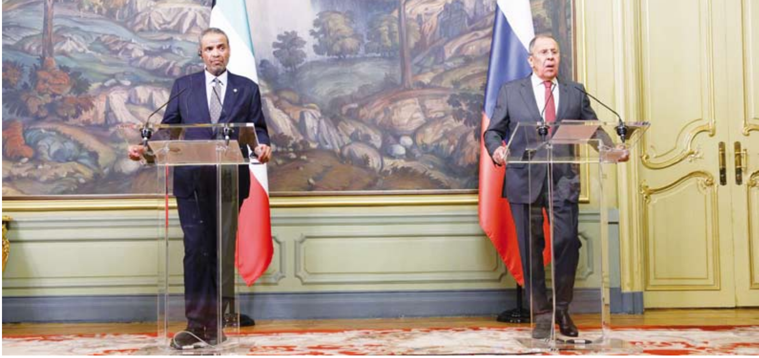
جانب من جلسة المباحثات بين وزير الخارجية الكويتي ووزير الخارجية الروسي

واستعرض الجانبان القضايا الإقليمية والدولية ذات الاهتمام المشترك وأعادوا التأكيد على الالتزام المشترك بتعزيز الاستقرار والأمن في المنطقة والعالم.