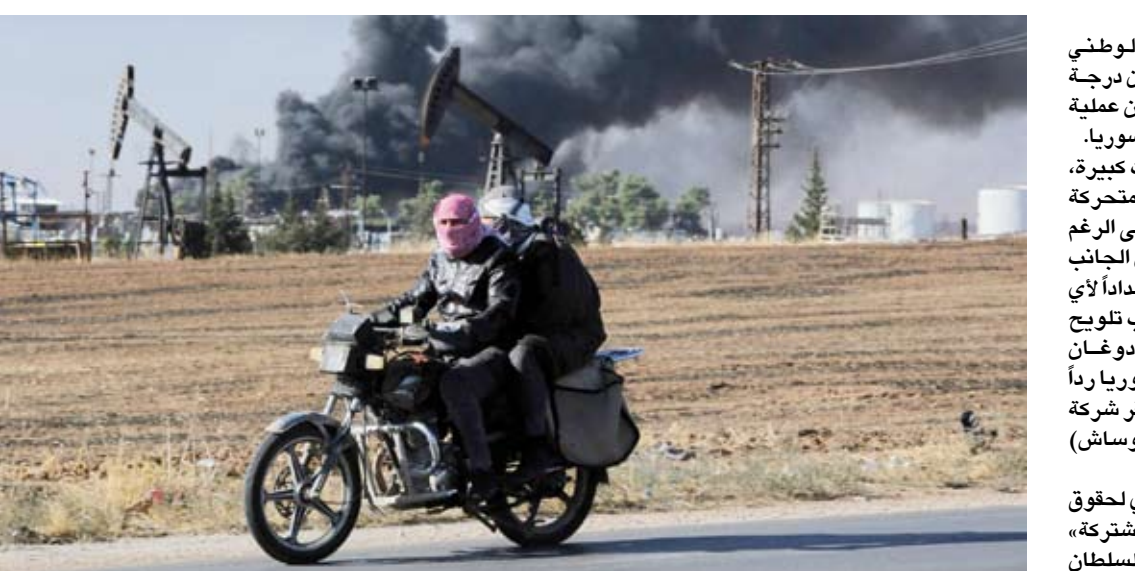
تركيا تواصل قصفها على مواقع «قسد»

الإرهابي الذي خلف 5 قتلى و 22 مصاباً، عملية جوية في شمال سوريا والعراق، وصعدت هجماتها على البنية التحتية في مواقع سيطرة «قسد» في شمال شرق سوريا، مستهدفة محطات المياه والغاز والكهرباء والأفران وصوامع الحبوب والمرافق الصحية.