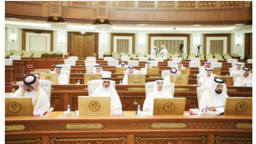
جانب من جلسة مجلس الشورى القطري أمس

أقر مجلس الشورى في دولة قطر، أمس، خلال جلسته الأسبوعية العادية في دور انعقاده العادي الرابع من الفصل التشريعي الأول، بإجماع مشروع التعديلات الدستورية، وذلك بعد استعراض تقرير