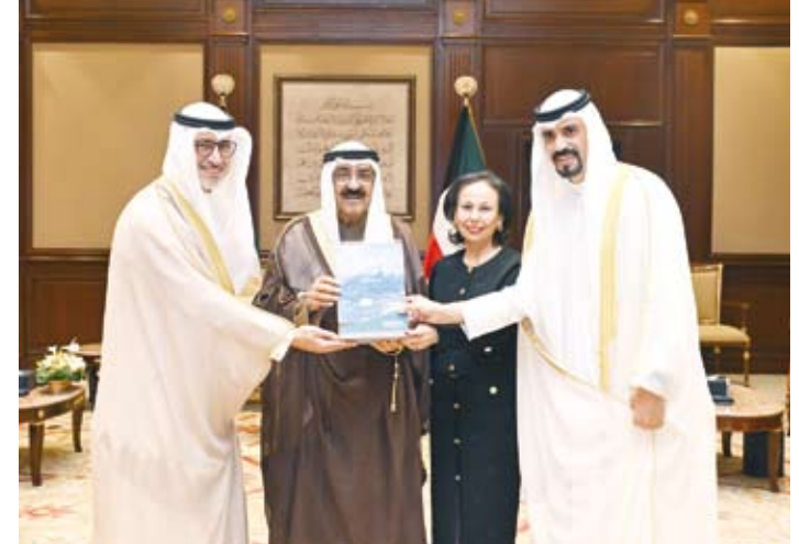
سمو الأمير يتسلم التقرير السنوي لهيئة تشجيع الاستثمار المباشر