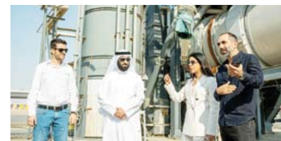
جانب من جولة الوزيرة

مشيدة بتوجيهات القيادة السياسية، ممثلة بسمو أمير البلاد وسمو ولي العهد، ودعمها لمشاريع صيانة الطرق على طريق تحقيق ركيزة بنية تحتية متطورة، ضمن خطة «كويت جديدة 2035».