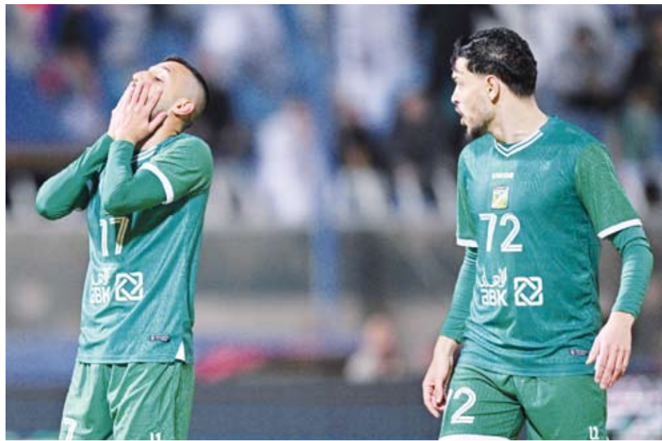
لا بديل عن الفوز أمام الأخضر