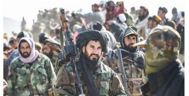
قتلى وجرحى إثر قصف متبادل بين القوات الأفغانية والباكستانية

قتل جندي باكستاني على الأقل وأصيب 7 آخرون في تبادل لإطلاق النار مع القوات الأفغانية في المنطقة الحدودية، وفق ما أفاد امس، مصدر أمني باكستاني. وأشار مسؤولون في البلدين إلى اندلاع مواجهات ليلاً استخدم فيها أحياناً السلاح الثقيل، بين ولاية خيبر باختونخوا الباكستانية ومنطقة خوست الأفغانية. يأتي ذلك بعد 4 أيام من ضربات جوية باكستانية خلفت 46 قتيلاً معظمهم مدنيون في شرق أفغانستان، بحسب كابل.