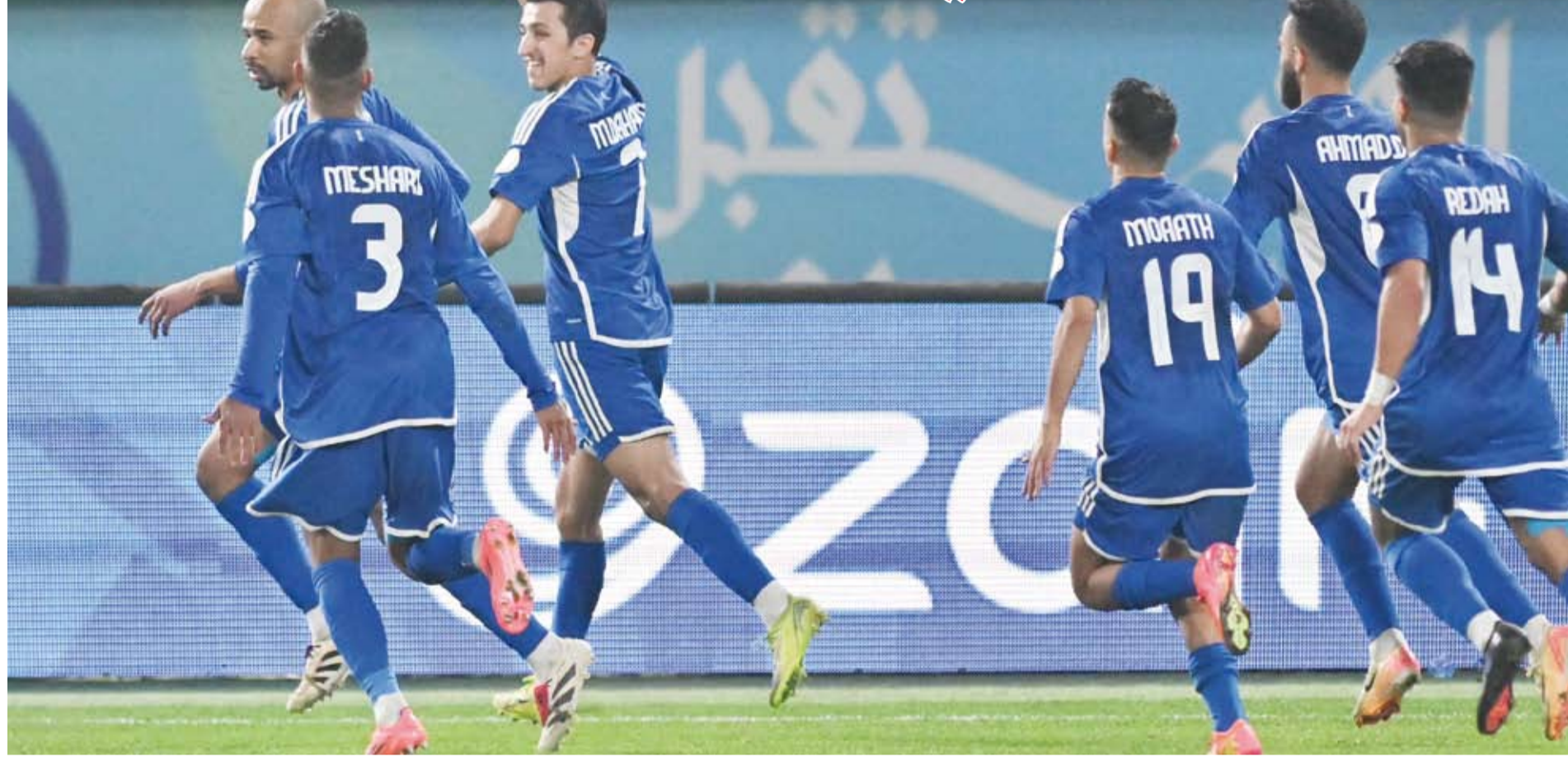
فرحة لاعبي الأزرق بالتأهل

يعود الأزرق إلى الظهور في الدور نصف النهائي للبطولة الخليجية بعد غيابه في النسخ الأربعة الأخيرة، حيث خرج من دور المجموعات في النسخة الماضية «خليجي 25»، التي استضافتها البصرة، بعد أن حل بالمركز الثالث في مجموعته برصيد 4 نقاط، وبفارق الأهداف عن المنتخب القطري صاحب المركز الثاني. وفي نسخة «خليجي 24»، في الدوحة، حل «الأزرق» بالمركز الرابع في مجموعته برصيد 3 نقاط، وبالمثل ودغ نسخة «خليجي 23»، التي أقيمت في الكويت بعد أن حل رابعا في المجموعة برصيد نقطة واحدة.