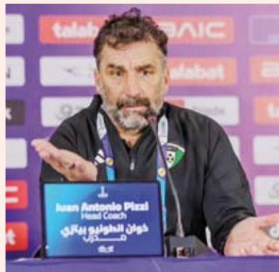
خوان انطونيو بيتزي

أعرب مدرب منتخبنا الوطني خوان انطونيو بيتزي عن اعتزازه وفخره بالتأهل إلى الدور نصف النهائي لبطولة «خليجي زين 26»، بعد التعادل مع المنتخب القطري 1-1 في ختام مباريات الدور التمهيدي للمجموعة الأولى، ليتأهل بالمركز الثاني برصيد 5 نقاط، وبفارق البطاقات الملونة عن المنتخب العماني الذي تأهل أولاً.