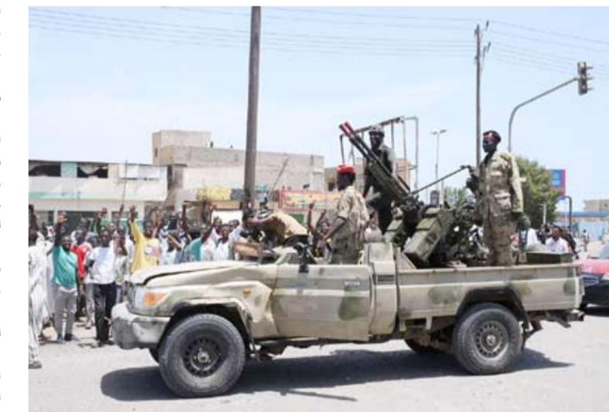
مؤشرات في الأفق على تهدئة بين حميدتي والبرهان

الإسلاميين (النظام البائد بقيادة الرئيس المعزول عمر البشير) الرامية لتقسيم البلاد، وأيضاً لعدم ترك صوت السودان للجبهة الإسلامية لتتحدث باسمه، وأخيراً لإجبار الطرف الآخر (الجيش) على القبول بمفاوضات لوقف الحرب». وأشار إدريس في الوقت ذاته إلى تمسكه بوحدة الصف المدني.