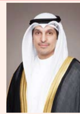
عبد الرحمن المطيري

بارك وزير الإعلام والثقافة وزير الدولة لشؤون الشباب عبدالرحمن المطيري رئيس اللجنة العليا المنظمة لبطولة «خليجي زين 26» للاعبين منتخبنا الوطني لكرة القدم والجهازين الفني والإداري واتحاد الكرة والجماهير الوفية على تأهل «الأزرق» المستحق للدور نصف النهائي لكأس الخليجية، التي تستضيفها دولة الكويت وتستمر حتى 3 يناير المقبل.