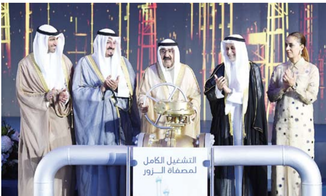
صورة تذكارية مع سمو أمير البلاد خلال رعايته وحضوره الاحتفالية الرسمية للتشغيل الكامل لمصفاة الزور

13 أغسطس: مجلس الوزراء يوافق على مشروع بقانون بشأن