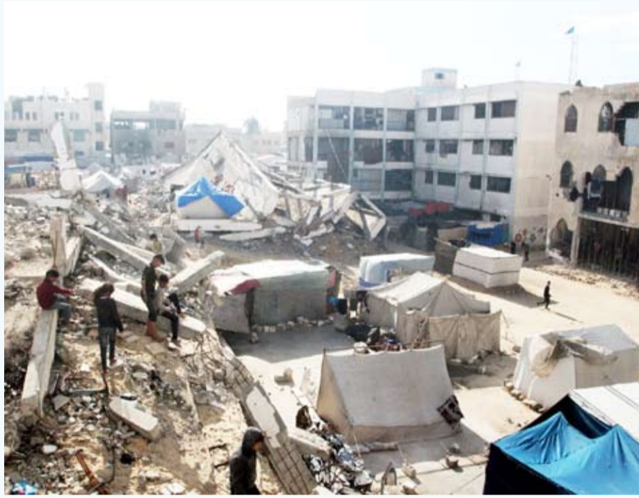
معاينة النازحين الفلسطينيين في مدارس الإيواء بقطاع غزة تتفاحم

أعلنت السلطات الصحية في قطاع غزة أمس استشهاد 48 فلسطينياً وإصابة 52 آخرين في عدة هجمات جوية وبرية شنتها الاحتلال الإسرائيلي على منازل سكنية وتجمعات للفلسطينيين بمناطق متفرقة بالقطاع. وقالت السلطات الصحية في قطاع غزة في بيان صحفي إن الاحتلال الإسرائيلي ارتكب أثناء الساعات الأربع والعشرين الماضية مجزرتين ضد العائلات في قطاع غزة وصل من جرائهما إلى المستشفيات 48 شهيداً و 52 مصاباً. وبذلك ترتفع حصيلة عدوان الاحتلال الإسرائيلي على قطاع غزة إلى 45484 شهيداً و 108090 مصاباً منذ السابع من أكتوبر 2023.