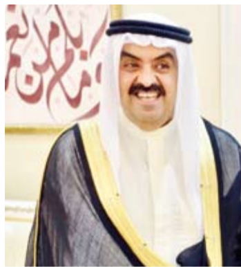
الشيخ خالد البدر الصباح

عبر رئيس الاتحادين الكويتي والأسوي للالعاب المائية الشيخ خالد البدر الصباح عن سعادته البالغة بتأهل منتخب الكويت إلى الدور نصف النهائي لبطولة خليجي 26 مشيداً بالأجواء التنافسية والحماسية التي تشهدها البطولة بين المنتخبات المشاركة والتي غلب عليها طابع الأخوة وكذلك حضور الجماهيري المميز الذي يؤكد على تعزيز اواصر الترابط والتلاحم بين أبناء دول مجلس التعاون الخليجي وتقدم البدر بالتهنئة للاعبين والجهازين الفني والإداري وأعضاء مجلس إدارة اتحاد كرة القدم على الأداء الفني المميز الذي قدمه الأزرق خلال الأدوار التمهيديّة موجهاً شكره لجميع الجهات القائمة على تنظيم هذا الحدث الرياضي والتي نجحت باقتدار في اظهار الوجه الحضاري والمشرق للكويت انطلاقاً من حفل الافتتاح مروراً بدقة التنظيم والتسهيلات المقدمة للجماهير التي حضرت لتشجيع المنتخبات متمنياً أن تكتمل الصورة المشرفة للبطولة بتتويج منتخب الكويت بطلاً عن جدارة واستحقاق وتقدم البدر بالتهنئة إلى المملكة العربية السعودية الشقيقة على استضافة النسخة من البطولة وذلك بإجماع أعضاء الجمعية العمومية لاتحاد كأس الخليج العربي وهو ما يعد تأكيداً على مكانة المملكة وما حققته من