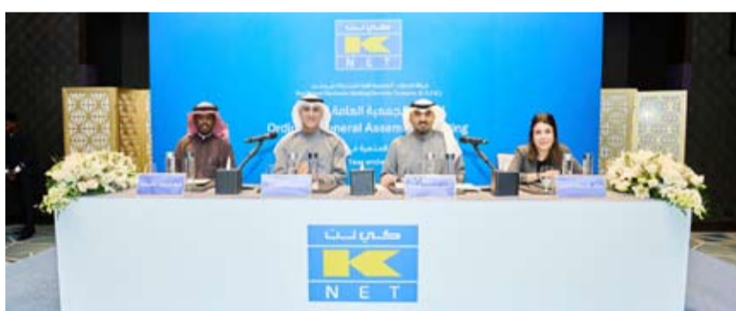
جانب من العمومية

الخسنام بان "كي نت" وفي ظل سياستها التطويرية المستمرة، تواصل ترسيخ حضورها الفعال في السوق الكويتي مع القنمى المستمر في حجم العمليات الإلكترونية والذي ينعكس بدوره على تحقيق رؤية دولة الكويت في التحول الرقمي وتقليل الاعتماد على الدفع النقدي. ولعل أبرز ما حققته الشركة كان طرحها لخدمة "مض" للدفع الفوري والتي قدمت لمستخدميها تجربة فريدة وغير مسبوقة من حيث السرعة والأمان في تحويل المبالغ بين الحسابات المصرفية الشخصية. وترتكز "مض" في المقام الأول على توفير بيئة دفع آمنة وموثوقة من خلال تعزيز البنية التحتية الحالية والعمل على بناء أنظمة دفع جديدة، بالإضافة إلى تطوير كفاءة الخدمات في السوق المحلي والإقليمي. وفور استكمالنا لتدشين هذه الخدمة، بدأنا بالعمل على المرحلة التالية من "مض" والذي نهدف إلى أن يكون الوسيلة الأولى لجميع أنواع التحويلات المالية في الكويت.