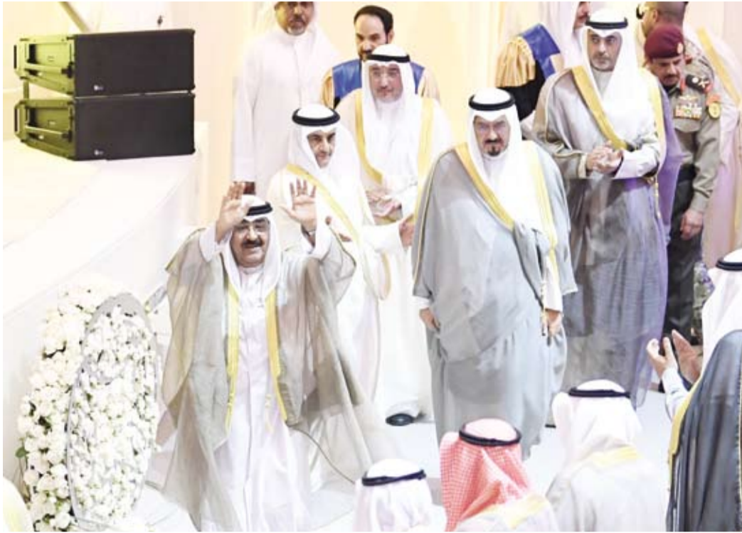
أمير البلاد خلال حضور سموه حفل افتتاح مدينة صباح السالم الجامعية وتكريم أوائل الخريجين المتفوقين

الأحمد يستقبل رئيس دولة الإمارات العربية المتحدة سمو الشيخ محمد بن زايد بن سلطان آل نهيان في زيارة دولة. 11 نوفمبر: صدور مرسوم أميري رقم (186 لسنة 2024 بتعديل وزاري بتعيين الدكتور محمد إبراهيم محمد الوسمي ليكون وزيراً للأوقاف والشؤون الإسلامية وتعيين ناصر يوسف محمد السميح وزيراً للعدل.