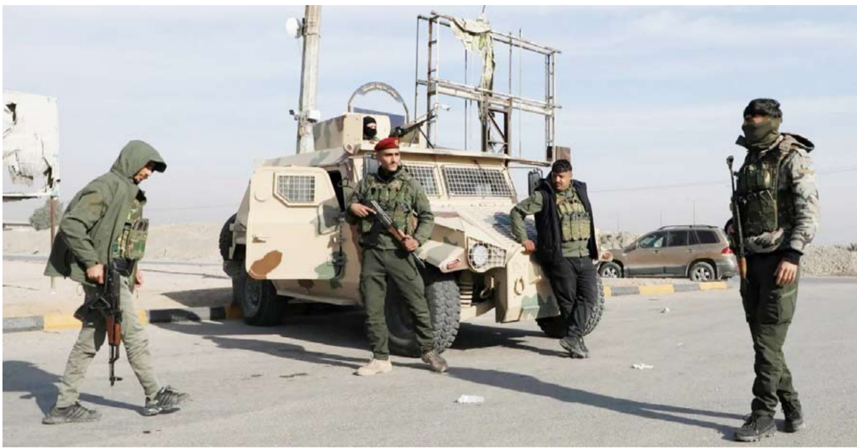
عناصر من قوات «قسد» في عين العرب

وقعت اشتباكات عنيفة بين فصائل «الجيش الوطني السوري» الموالي لتركيا، وقوات سوريا الديمقراطية «قسد» على محور سد تشرين بريف حلب الشرقي، أسفرت عن قتلى ومصائب من الجانبين. في الوقت ذاته، تواصلت التصريحات التركية حول دعم الإدارة السورية الجديدة بقيادة أحمد الشرع في مختلف المجالات، ومنها الطاقة والزراعة. وانسحبت اشتباكات، بالأسلحة الثقيلة مع تقدم قوات «قسد»، وسيطرها على قرية كبرية على محور القفسه، ما أسفر عن مقتل عنصر من قوات «مجلس منبج العسكري»، وقيادية من وحدات حماية المرأة (الكرديّة)، و10 عناصر من فصائل «الجيش الوطني» وتدمير عربات عسكرية للفصائل، بحسب ما أفاد «المركز السوري لحقوق الإنسان».