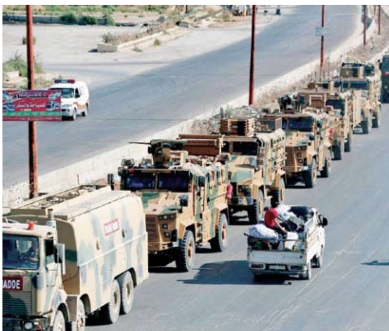
تعزيزات عسكرية تركية للنقاط العسكرية

دفع الجيش التركي، بتعزيزات عسكرية ضخمة إلى نقاطه العسكرية، المنتشرة في شرق إدلب وريف حلب الغربي، الواقعة ضمن مناطق خفض التصعيد في شمال غربي سوريا، والمعروفة باسم «بوتين - إردوغان».