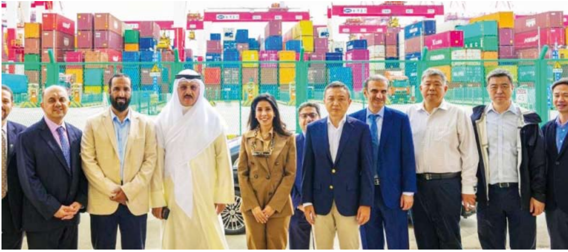
وزيرة الأشغال والوفد الكويتي والمسؤولين الصينيين

والذكاء الاصطناعي لإدارة نقل الحاويات ومن وإلى السفن بأسرع فترة ممكنة إذ إن قدرة الميناء تبلغ في المرحلة الحالية أكثر من 55 مليون وحدة قياس شحن TEU بتصاعد في حجم المنقولات في المرفأ يتجاوز 25 بالمئة سنوياً.