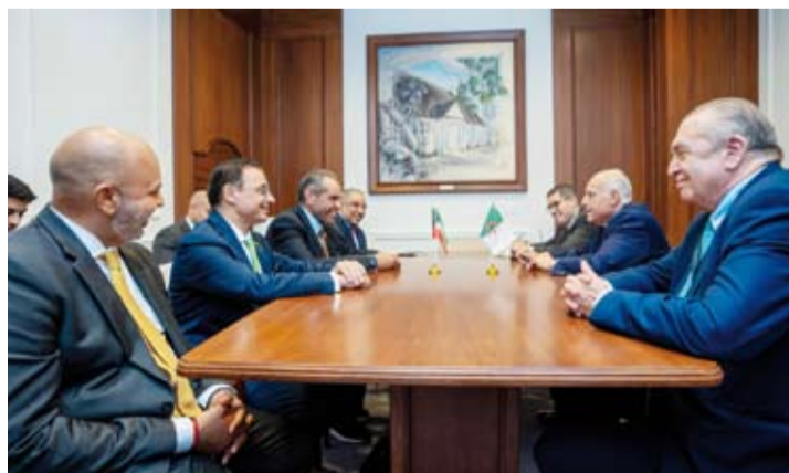
وزير الخارجية عبدالله الجحيا ونظيره الجزائري أحمد عطاف

فاجون وذلك على هامش أعمال الأسبوع الـ79 للجمعية العامة للأمم المتحدة في دورتها الـ79 بمدينة نيويورك. وذكرت وزارة الخارجية الكويتية في بيان أن الجانبين تناولا سبل تعزيز العلاقات الثنائية بين البلدين الصديقين في مختلف المجالات بالإضافة إلى مناقشة آخر المستجدات على الساحتين الإقليمية والدولية والقضايا محل الاهتمام المشترك. وناقش الجانبان سبل تعزيز العلاقات الثنائية بين البلدين الصديقين في مختلف المجالات بالإضافة إلى مناقشة آخر المستجدات على الساحتين الإقليمية والدولية والقضايا محل الاهتمام المشترك.