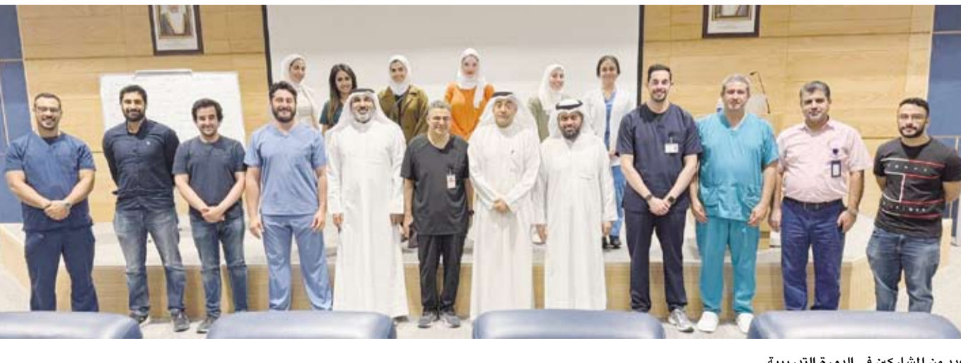
عدد من المشاركين في الدورة التدريبية

وقال: إن إقامة مثل هذه الدورات التدريبية دليل على إصرار الأطباء على التقدم والتطور العلمي، لافتاً إلى أهمية المواضيع المتنوعة التي طرحتها الدورة والتطورات الجديدة في مجال الاختصاص الواسع التي تهدف إلى تعزيز الممارسة الطبية المنهجية المعتمدة على البرهان ودور الأطباء الشباب في البحث والنشر.