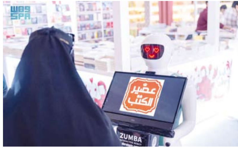
الروبوت يستقبل زوار المعرض

يفهم حتى اللهجات المحلية ومنها السعودية والمغربية والمصرية والبحرينية، مشيراً إلى أن الروبوت مزود بشاشة تعرض المطبوعات والمنشآت مع فيديو توضيحي لها، منوهاً بقدرته على الترحيب بالزوار والرد على استفساراتهم وتساؤلاتهم، كما يستطيع انطباعاتهم عن المعرض والتعرف إلى ميولهم الثقافية، إضافة إلى أنه يستطيع تقديم عبارات ترحيبية باسم المعرض أو دار النشر.