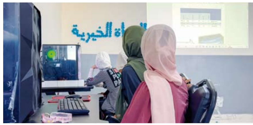
إتمام كبير بتعليم الأيتام

مبيّناً أن مشروع «7 سنابل» لرعاية وكفالة الأيتام يقدم الكفالة المادية للأيتام وكذلك نوزع عليهم السلالات الغذائية والزني المدرسي والحقيبة المدرسية ونسند عنهم الرسوم المدرسية وغيرها من أوجه الخير الأخرى التي تقدمها للأيتام. مستشهداً بأحد الأيتام الذين وصل الله عليه وسلم: «أنا وكافل اليتيم في الجنة هكذا وأشار اليتيم في الجنة هكذا».