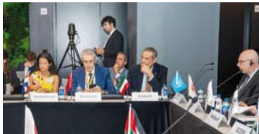
وزير الخارجية في الاجتماع الوزاري للمنتدى العالمي لمكافحة الإرهاب