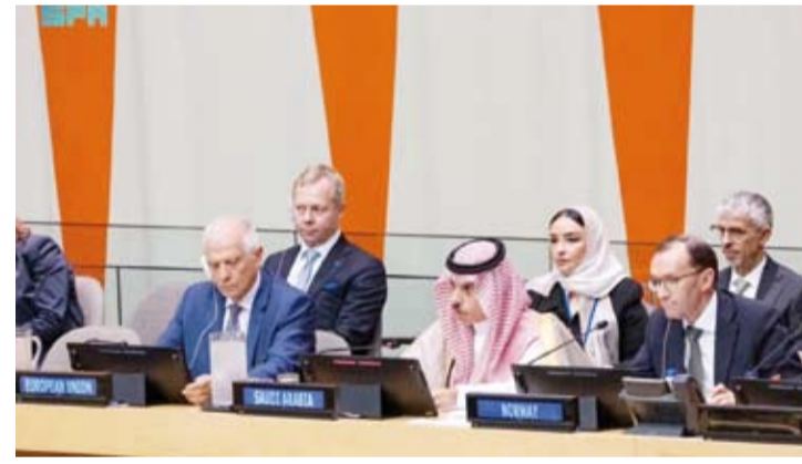
وزير الخارجية السعودي في الاجتماع الوزاري بشأن القضية الفلسطينية

قدما بذلك دعماً لحل الدولتين، وحفاظاً على فرص تحقيق التعايش والسلام المستدام. وأضاف أن السعودية تؤمن بأن إنهاء الاحتلال وتنفيذ حل الدولتين هو الأساس لإيقاف دوامة العنف ورفع المعاناة وتحقيق الأمن والاستقرار في المنطقة، ولذلك أطلقت مع شركائها في اللجنة الوزارية العربية الإسلامية المشتركة ومملكة النرويج والاتحاد الأوروبي «التحالف الدولي لتنفيذ حل الدولتين»، وذلك استشعاراً منها بالمسؤولية المشتركة للعمل على تغيير واقع الصراع. وشددت على أهمية تصدر القضية الفلسطينية اهتمام مجلس الأمن في ظل استمرار التجاوزات الإسرائيلية الجسيمة وتردي الأوضاع الإنسانية. مشيراً إلى الآثار الخطيرة التي باتت واضحة بسبب إطالة أمد الأزمة وتوسيع نطاق الصراع من خلال التصعيد العسكري المستمر. وقال: لقد طرحنا مراراً أمام مجلس الأمن ذات القضية الفلسطينية الملحة، دون أن يقابل ذلك بتحرك جاد.