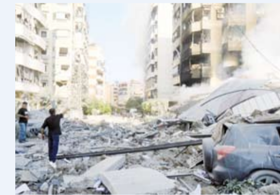
دمار في الضاحية الجنوبية

قال شهود لوكالة «رويترز» إن الضربات الإسرائيلية على الضاحية الجنوبية لبيروت متواصلة، وإنهم شاهدوا أعمدة دخان تتصاعد من المنطقة.