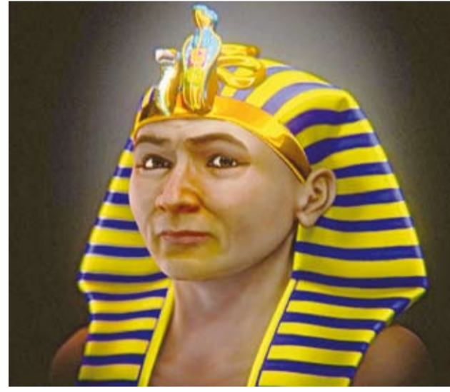
إعادة رسم وجه أحد أهم الفراعنة

استطاع علماء آثار مصريون، بالتعاون مع خبير الرسومات البرازيلي شيشرون موراييس، إعادة بناء وجه أمحتب الأول؛ أحد أهم فراعنة مصر، وثاني ملوك الأسرة الثامنة عشرة، الذي توفي عن 35 عاماً قبل 3500 عام، وكان أول من دفن في وادي الملوك. وتولى أمحتب الأول الحكم بعد رحيل والده أحسنس الأول الذي طرد الهكسوس، وقاد مصر إلى عصر جديد من السلام والازدهار.