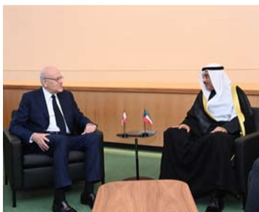
سمو ولي العهد خلال لقائه رئيس وزراء لبنان نجيب ميقاتي .. وسموه خلال لقائه رئيس وزراء لبنان نجيب ميقاتي