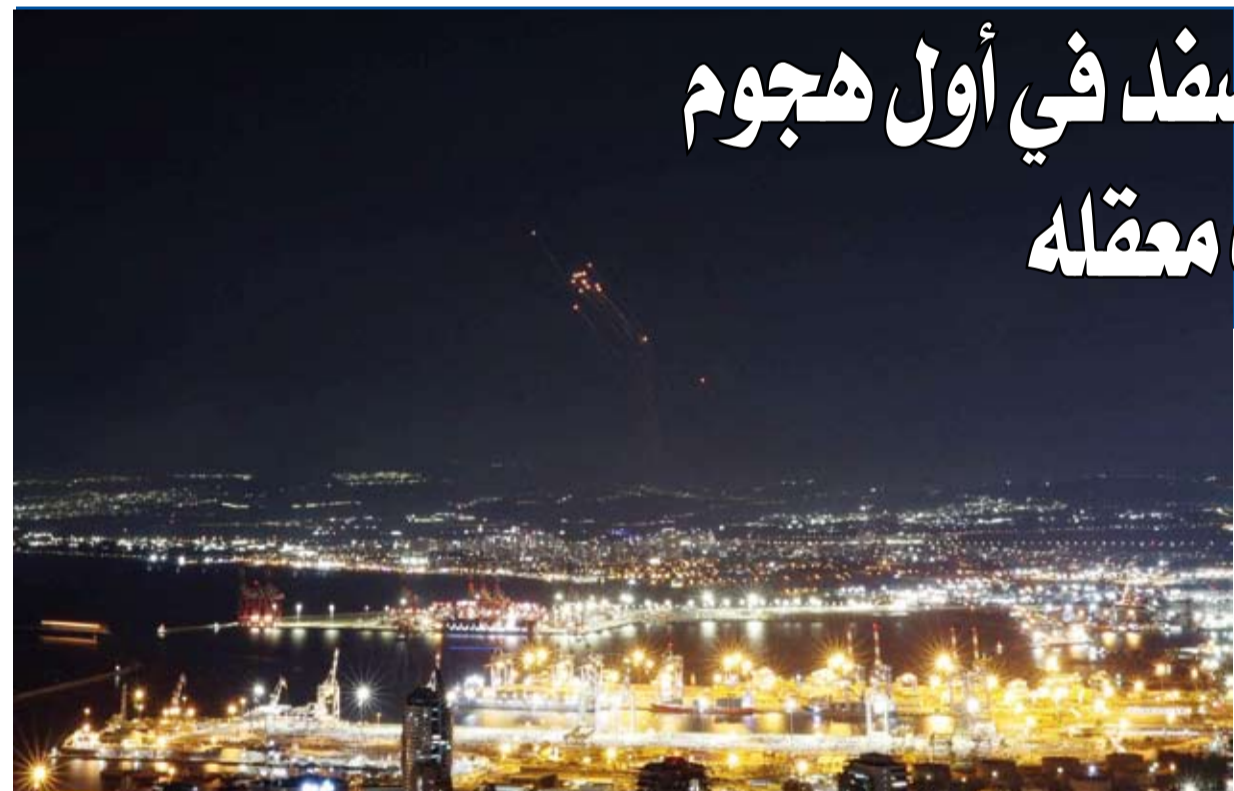
القبة الحديدية تتصدى لصواريخ حزب الله

أعلن «حزب الله»، قصفه مدينة صفد في شمال إسرائيل بصليبة صاروخية»، في أول هجوم إثر تعرض معقله في ضاحية بيروت الجنوبية لسلسلة غارات.