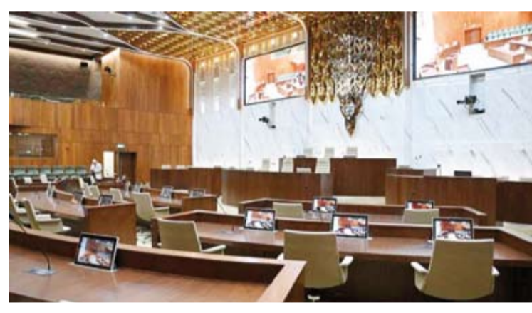
قاعة جلسات المجلس البلدي

الموافقة النهائية على إعادة تنظيم جزء من القطعة رقم 4 بمنطقة الصديق وذلك بتعديل القسائم أرقام من (145 إلى 153). وطلب إعادة تنظيم القطعة رقم 14 والتي تشمل على عدد من القسائم ومقر الصالحية ومرافق عامة بمنطقة القبلة وفق قواعد وشروط القطع التنظيمية.