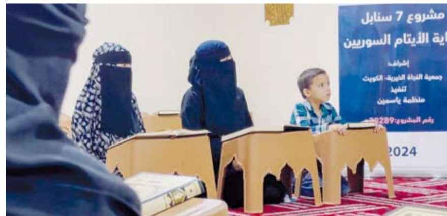
تحفيظ القرآن للأيتام اللاجئين السوريين