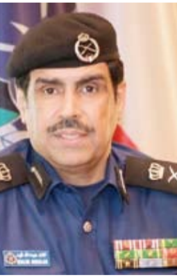
اللواء خالد فهد

ونوه اللواء فهد بما تمسسته قوة الإطفاء من تجاوب من المواطنين "فقد بدأ البعض بوضع جميع إجراءات تجديداتها علاوة على وجود شركات معتمدة من الإطفاء) وعلى كل شركة أن تعد تقريراً شهرياً لتقييمه للقوة. وأكد في هذا الصدد أن فرق التفقيش تعمل دورياً للكشف على جميع المنشآت لافتاً إلى أن حرص الملك على سلامة المنشأة التابعة له هو العنصر الأساسي في تحقيق مبدأ السلامة والأمان في هذا الشأن.