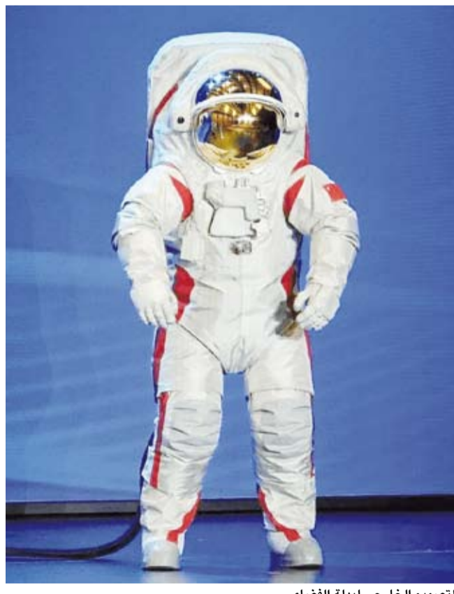
التصميم الخارجي لبدلة الفضاء

الذي يستخدم في السترات الواقية من الرصاص، بالإضافة إلى طبقة من نوكس المقاوم للهب، يرتديه سائقو السيارات، وكذلك النابليون المطلي باليورانيان، الذي يمكن أن يكون له طبقات ملحومة ويستخدم عادة في تويرفات (اللعزل، وطبقة كيتلر،