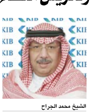
الشيخ محمد الجراح