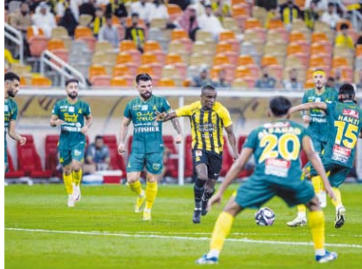
حصار خليجي للاعب الاتحاد