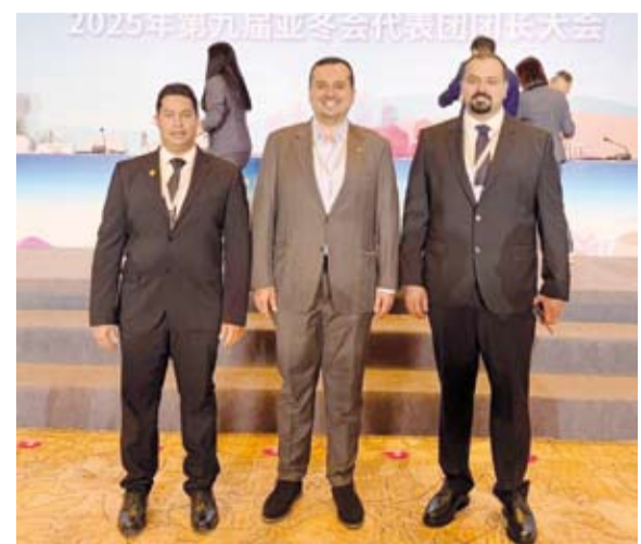
جانب من مشاركة الكويت

يواصل استعداده للمشاركة في دورة الألعاب الآسيوية الشتوية التاسعة المقررة في مدينة (هاربين) الصينية إذ يشارك بخمسة ألعاب جماعية وفردية وهي الهوكي على الجليد والفيغور والكيرلنج والتزلج على الجليد والسرعة على الجليد.