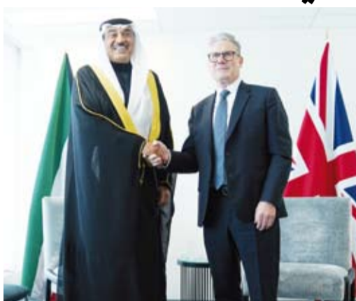
سمو ولي العهد خلال لقائه كبير سترامير رئيس وزراء المملكة المتحدة

الخالء، الرئيس دينيس بسيسير وفيتش رئيس مجلس رئاسة البوسنة والهرسك، وذلك على هامش أعمال اجتماعات الدورة الـ79 للجمعية العامة للأمم المتحدة في مقر منظمة الأمم المتحدة بمدينة نيويورك في الولايات المتحدة الأمريكية. وقد نقل سمو ولي العهد في مستهل اللقاء تحيات صاحب السمو أمير البلاد الشيخ مشعل الأحمد إلى فخامته. كما جرى خلال اللقاء استعراض العلاقات الثنائية الوثيقة التي تربط البلدين وسبل تعزيزها وتنميتها بما يحقق المصالح المشتركة للبلدين والشعبين الشقيقين بالإضافة إلى مناقشة أبرز المستجدات على الساحتين الإقليمية والدولية. وحضر اللقاء وزير الخارجية عبد الله الجحيا ووكيل الشؤون الخارجية بديوان سمو ولي العهد مازن العيسى والندوب الدائم لدى الأمم المتحدة السفير طارق البناي.