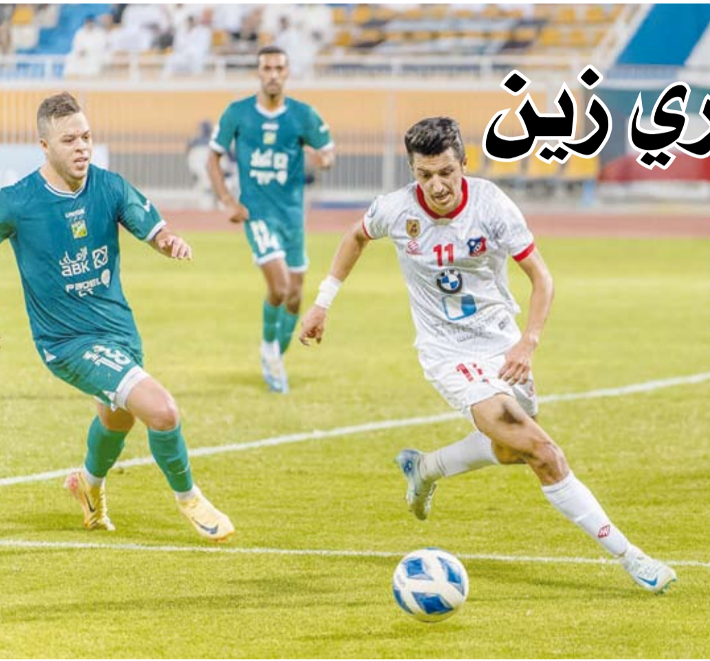
حصار عرباوي للاعب الكويت

Sunday 29 th September 2024 - 18 th year - Issue No.4454