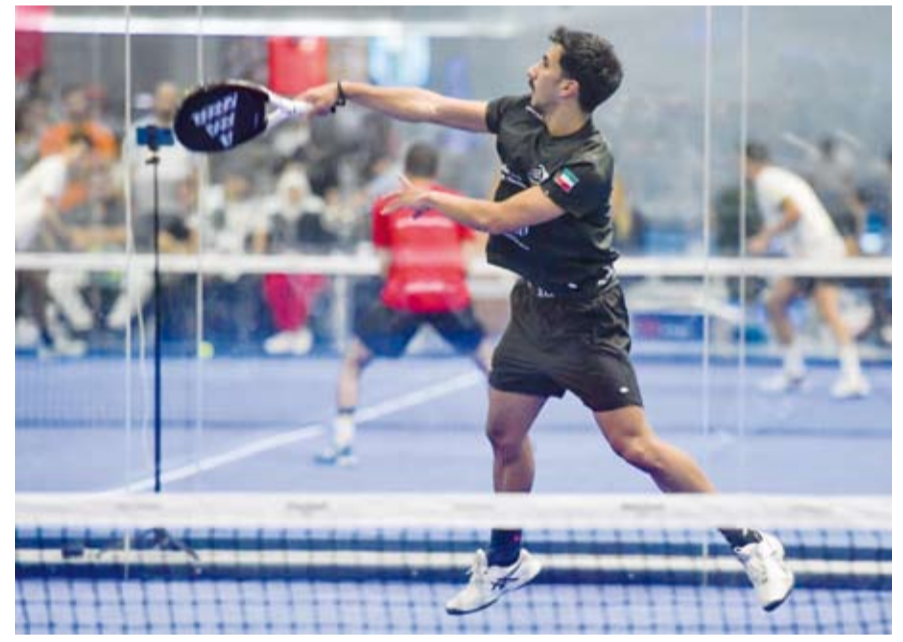
الإمارات تأهلت على حساب أستراليا