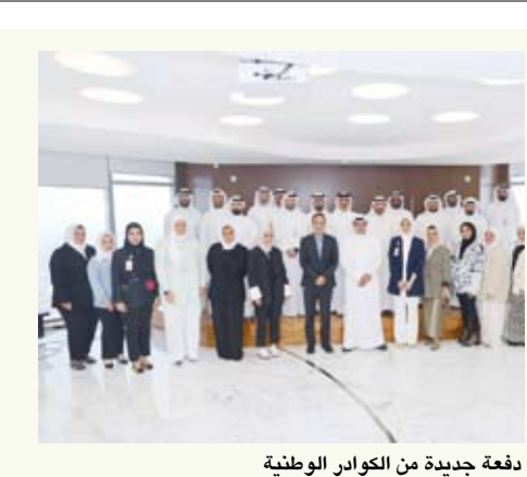
دفعة جديدة من الكوادر الوطنية