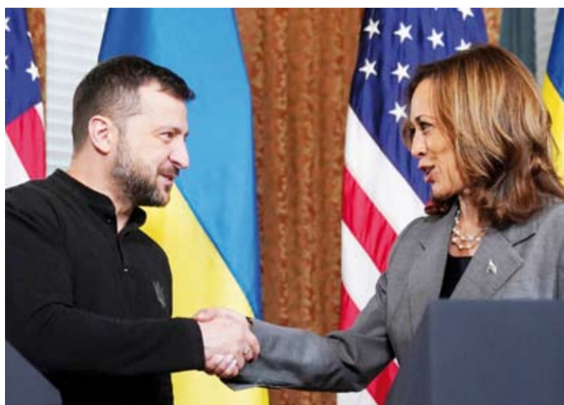
فولوديمير زيلينسكي يصافح كامالا هاريس

أكدت نائبة الرئيس الأميركي كامالا هاريس التي تتنافس مع دونالد ترمب في انتخابات نوفمبر للرئيس الأوكراني فولوديمير زيلينسكي، أن «دعماً للشعب الأوكراني راسخ»، وفق ما نقلته وكالة الصحافة الفرنسية.