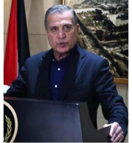
نيل أبو ردينة

فيما أعلنت وزارة الصحة الفلسطينية في قطاع غزة، أمس، ارتفاع حصيلة ضحايا العدوان الإسرائيلي المتواصل على القطاع منذ السابع من أكتوبر الماضي إلى 41 ألفاً و595 شهيداً، و96 ألفاً و251 مصاباً، فيما لا يزال آلاف الضحايا تحت الركام وفي الطرقات لا تستطيع طواقم الإسعاف والدفاع المدني الوصول إليهم. فقد أكد الناطق الرسمي باسم الرئاسة الفلسطينية نيل أبو ردينة، أن المنطقة بأسرها دخلت "مرحلة جديدة وخطرة" من عدم الاستقرار، مؤكداً أن الحل الوحيد لضمان مستقبل آمن ومستقر للمنطقة هو "حل القضية الفلسطينية حلاً عادلاً وفق الشرعية الدولية ومبادرة السلام العربية".