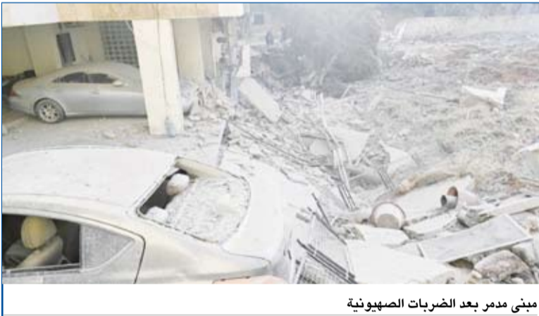
مبنى دمر بعد الضربات الصهيونية

الإسرائيلية، حيث أفيد عن قصف على بلدة بعدران بقضاء الشوف، ما أدى إلى مقتل شخصين، وإصابة آخرين بجروح وهم من أفراد عائلة جنوبية نزحت جراء القصف الإسرائيلي، وتلقى سكان أحد المياني في مرج بعقلين في الشوف تهديداً إسرائيلياً، وظُلب منهم إخلاؤها فوراً، وأقادت قناة «الجديد» بعد الظهر بقصف إسرائيلي استهدف أطراف المنطقة، وطال القصف الإسرائيلي في الجنوب أكثر من قرية وبلدة.