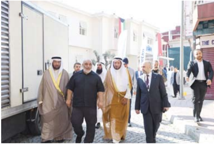
جولة ميدانية في مركز اللهب

وحضر حفل الافتتاح كل من وزيرة الأسرة والخدمات الاجتماعية ماهي نور أوزدمير غوكتاش، ووزير الداخلية التركي علي يرلي كايا، وعضو البرلمان عن إسطنبول والوزير السابق سليمان صوللو، والي إسطنبول داود جول، ورئيس هيئة الإغاثة الإنسانية التركية (IHH). ويقع مركز علي صالح اللهب "رحمه الله" لخدمة ورعاية الأيتام على مساحة 1.500 متر مربع بمنطقة الفاتح بإسطنبول، وقد أعيد تأهيل المبنى وترميمه بتكلفة إجمالية بلغت 846.365 دولاراً من عائد وقفية اللهب بالهيئة الخيرية. ويتسع المقر لأكثر من 50 عاماً، ويصل عدد المستفيدين منه سنوياً 800 ألف يتيم في 33 دولة.