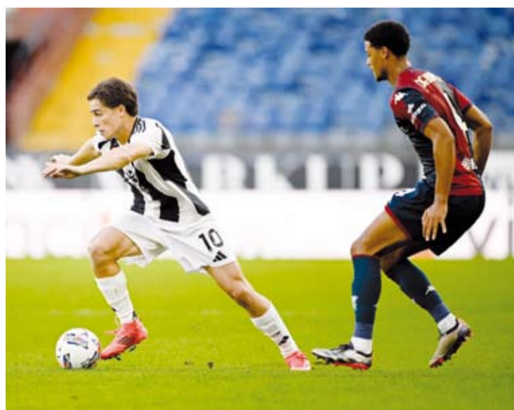
انطلاق قوية للاعب البيوفي

فاز يوفنتوس على ضيفه جنوى، ضمن منافسات الجولة السادسة من بطولة الدوري الإيطالي لكرة القدم، والتي شهدت أيضاً فوز إنتر ميلان على نظيره أودينيزي. ففي المباراة الأولى، نجح يوفنتوس في العودة إلى سكة الانتصارات بالفوز على جنوى بثلاثة أهداف دون رد، حيث سجل دوسان فلاو فيتش هدفين، الأول من ركلة جزاء في الدقيقة (48)، والثاني في الدقيقة (55)، بينما أضاف فرانسيسكو كونيساوا الهدف الثالث في الدقيقة (89). وبهذا الفوز، رفع يوفنتوس رسيدته إلى (12) نقطة ليقتز إلى صدارة الترتيب بشكل مؤقت، بينما توقف رسيد جنوى عند (5) نقاط في المركز السادس