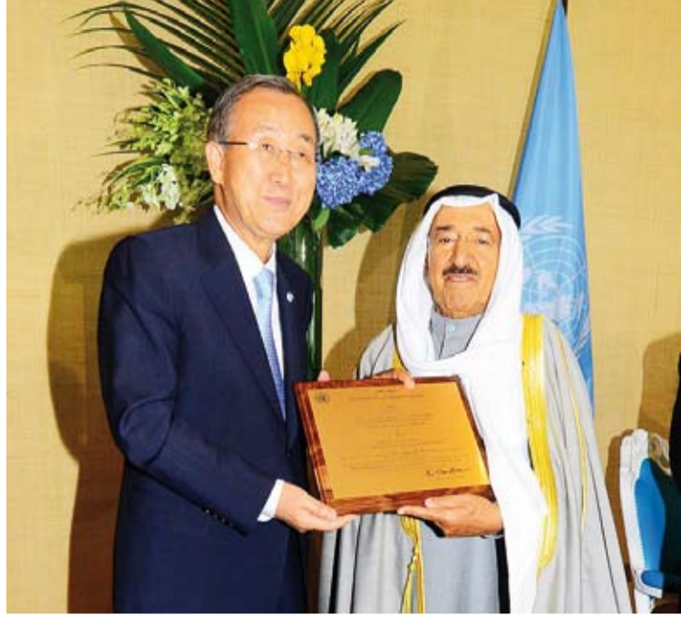
منظمة الأمم المتحدة خلال تكريمها الأمير الراحل بتسمية سموه «قائداً للعمل الإنساني»

وشهدت الكويت في عهد الأمير الراحل والذي استمر 14 عاماً نهضة تنموية شاملة زخرت بالمشاريع الضخمة اقتصادياً وصحياً وتنموياً وخدمياً وتبوات البلاد مكانة مرموقة بين دول العالم وحققت إنجازات عديدة ستظل مدونة في تاريخ الكويت وعطاءاته الخالدة وشاهدة على قائد فذ لا يطويه الشيان. وبعد الشيخ صباح الأحمد "رحمه الله" هو الابن الرابع للأمير الراحل الشيخ أحمد الجابر الصباح الذي توسر في لجلة الفطنة منذ صغر سنه فأدخله (المدرسة المباركية) ثم أوفده إلى بعض الدول للدراسة والتساقب الخبرات والمهارات التي أثقلت على مختلف الأصعدة وساعدته على ممارسة العمل في المنصب الرسمي. وهو الحاكم الخامس عشر لدولة الكويت الذي حطى تولىه دقة الحكم بمباركة وتأييد شعبي ورسمي كبير وبويع بالإجماع من أعضاء السلطتين التنفيذية والتشريعية ليصبح أول أمير منذ عام 1965 يؤدي اليمين الدستورية أمام مجلس الأمة.