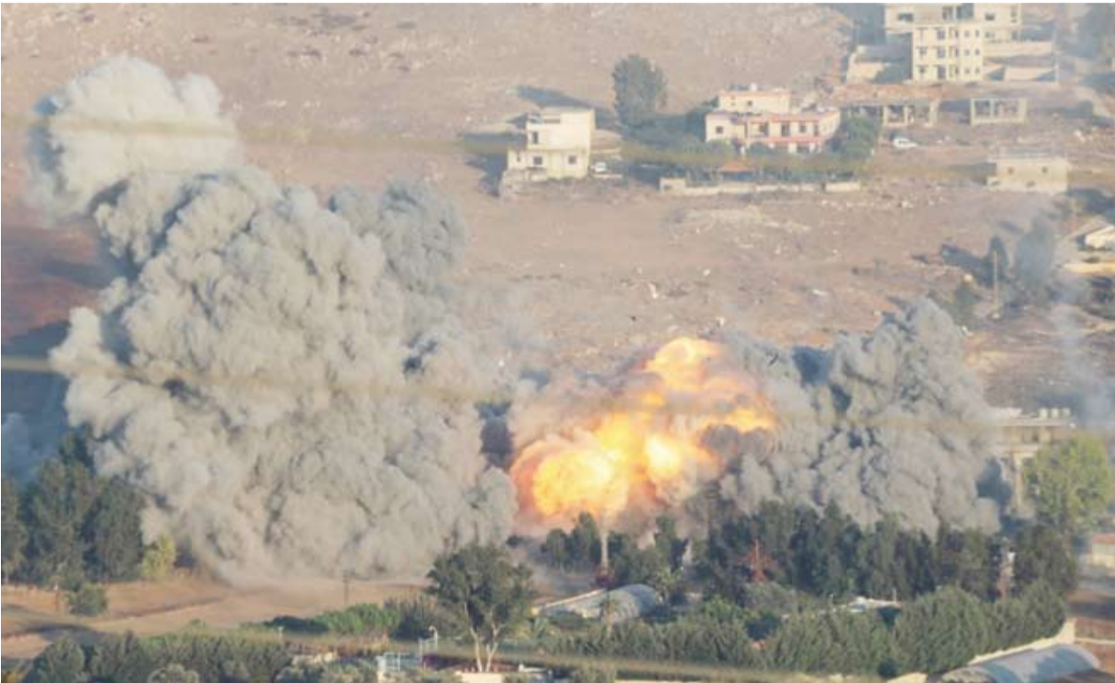
النيران تشتعل في الضاحية الجنوبية

الإسرائيلية عن وجود أسلحة أو مخازن أسلحة في المياني المدينة المستهدفة بالقصف في الضاحية الجنوبية، وكان لافتاً، خلال تنفيذ إسرائيل غارات على الضاحية الجنوبية لبيروت، حركة الطائرات المدنية في مطار بيروت الدولي، حيث رصدت عدسة وسائل الإعلام طائرات خلال إقلاعها وهبوطها في المطار، وكانت تدخل أجواء الضاحية الجنوبية بالتزامن مع الغارات، وأعلن «فوج إطفاء بيروت» في بيان، أن عناصره شاركت في عملية إخمد