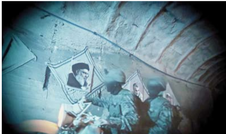
عناصر من «حزب الله»

ويضيف: «إما أن نرى رد فعل غير مسبوق من (حزب الله) أو ستكون الهزيمة الكاملة».