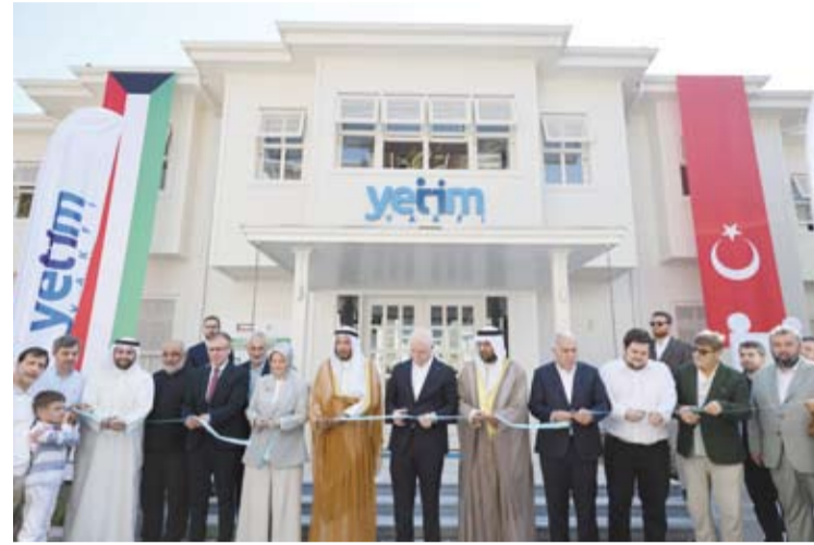
د. عبدالله المعتوق خلال افتتاح المركز

محضن تربوي وتعليمي آمن للأيتام، ودمجهم في مختلف البرامج والأنشطة الداعمة والنافعة، التي تبني الشخصية الإسلامية الوسطية المثزنة لليتيم، وتطور