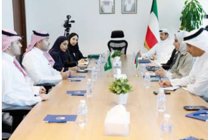
جانب من اجتماع وفد هيئة تنمية الصادرات السعودي مع مسؤولي «تكنولوجيا المعلومات»