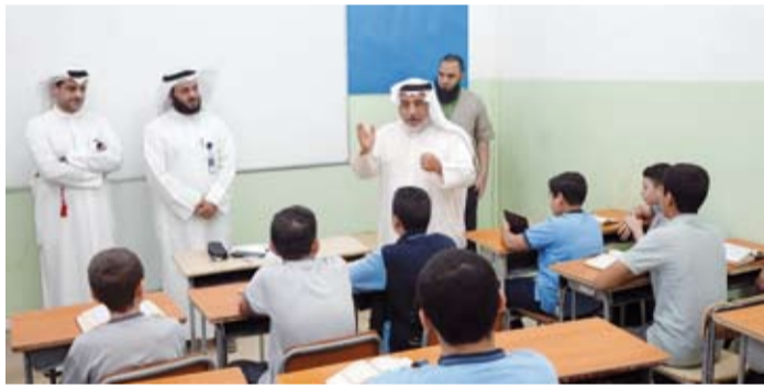
جانب من الجولة التفقدية

التأسيس قبل 56 عاماً سعت دوماً إلى بناء جيل متميز، نافع لوطنه، محافظ على قيمه ومعزز بدينه وتمسك بلغته العربية، وبفضل الله لدينا 17 مدرسة ما بين نموذجية وأهلية وينسب لنا 13 ألف طالب ونحرص بجانب تقديم التعليم النوعي والمميز إلى غرس القيم والأخلاق والفضائل في نفوس طلابنا.