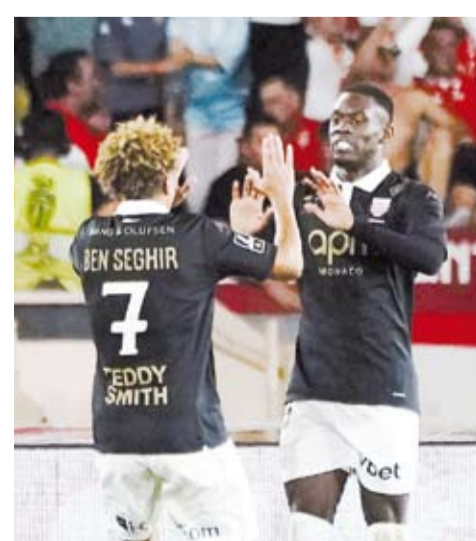
موناكو يحقق الفوز الثالث على التوالي

فاز يوفنتوس على ضيفه جنوى، ضمن منافسات الجولة السادسة من بطولة الدوري الإيطالي لكرة القدم، والتي شهدت أيضاً فوز إنتر ميلان على نظيره أودينيزي. ففي المباراة الأولى، نجح يوفنتوس في العودة إلى سكة الانتصارات بالفوز على جنوى بثلاثة أهداف دون رد، حيث سجل دوسان فلاو فيتش هدفين، الأول من ركلة جزاء في الدقيقة (48)، والثاني في الدقيقة (55)، بينما أضاف فرانسيسكو كونيساوا الهدف الثالث في الدقيقة (89). وبهذا الفوز، رفع يوفنتوس رسيدته إلى (12) نقطة ليقتز إلى صدارة الترتيب بشكل مؤقت، بينما توقف رسيد جنوى عند (5) نقاط في المركز السادس