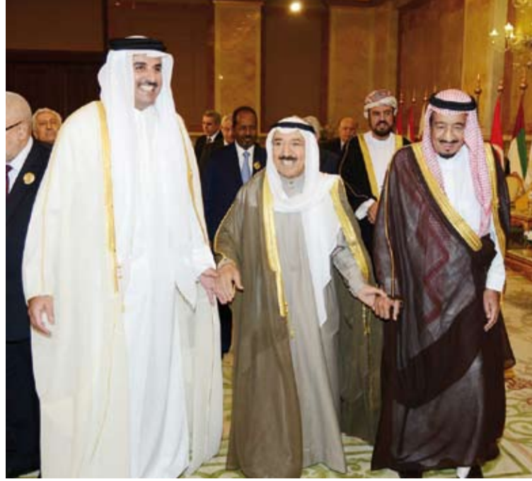
أمير الكويت الراحل الشيخ صباح الأحمد وبجانبه الملك سلمان بن عبد العزيز والشيخ تميم بن حمد آل ثاني