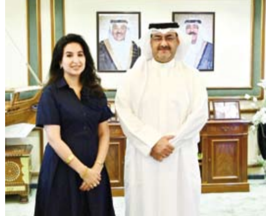
محافظ العاصمة مستقبلاً الشقيقة ببينبي الصباح

نفوس الأجيال القادمة. وقد أشاد المحافظ بالجهود التي تبذلها الجمعية نحو