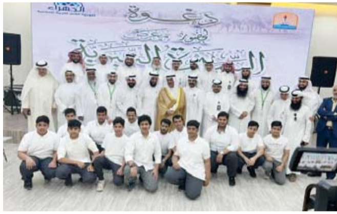
محافظ الجهراء متوسطاً المشاركين