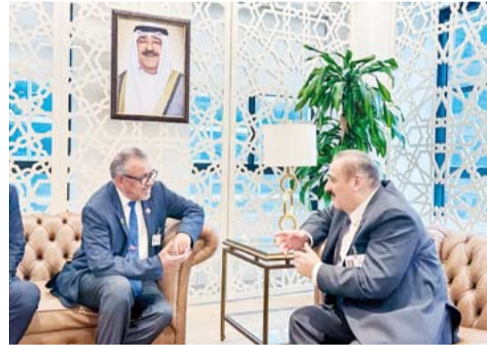
وزير الصحة خلال لقائه بالمدير العام لمنظمة الصحة العالمية

كما ناقش الطرفان التحديات الصحية الإنسانية التي تواجه بعض دول إقليم شرق المتوسط والأوضاع الصحية في قطاع غزة. وكان الوزير العوضي قد أكد في كلمة الكويت التي ألقاها خلال اجتماع رفيع المستوى بشأن مقاومة مضادات الميكروبات الذي عقد ضمن فعاليات الأسبوع رفيع المستوى للجمعية العامة للأمم المتحدة في دورتها الـ 79 أول من أمس أن الكويت وضعت خطة عمل وطنية لمقاومة مضادات الميكروبات وتعتمد على نهج قوي متعدد القطاعات يستند على مبدأ (الصحة الواحدة) علاوة على نجاح الكويت في تعزيز مشاركتها في نظام الترصد العالمي لمقاومة المضادات الحيوية واستخدامها (نظام جالس) التابع لمنظمة الصحة العالمية.