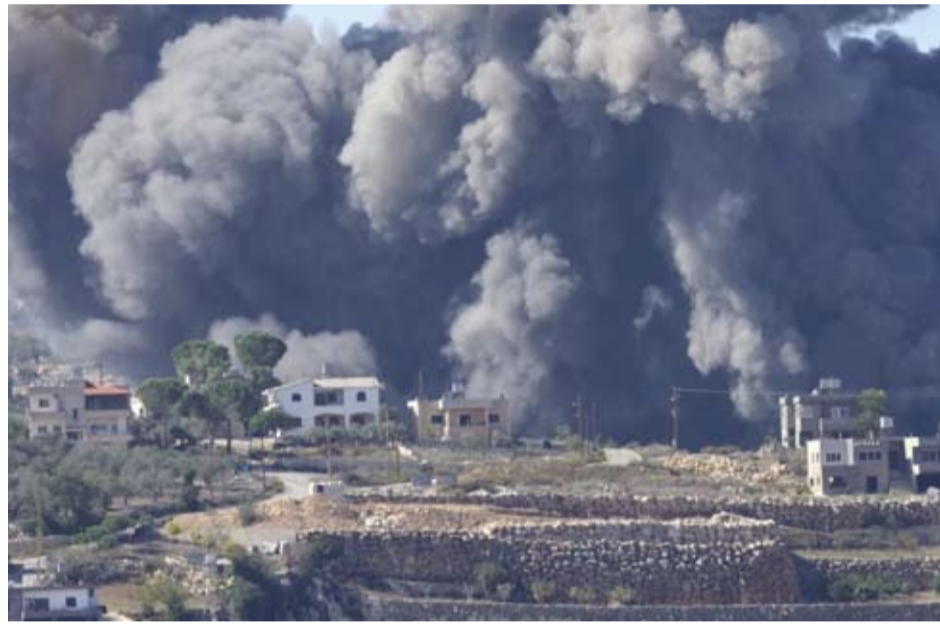
غارات جوية على مناطق متفرقة في لبنان

في تطور جديد قد يقود المنطقة بأسرها إلى حرب واسعة، أفادت صحيفة "يديعوت آخرونوت" العبرية، أمس، أن الطائرات الإسرائيلية تزن غارات على ميناء الحديدة في اليمن. وقالت وكالة "الأناضول": إن الجيش الإسرائيلي يعلن مهاجمة أهداف عسكرية للحوثي في مناطق بمدينة الحديدة اليمنية تتمثل في محطات توليد الكهرباء وميناء بحرياً قال إنه يستخدم لنقل الأسلحة. فيما قالت قناة "المسيرة" الفضائية التابعة لحركة "انصار الله" اليمنية: إن غارات إسرائيل استهدفت مينائي الحديدة ورأس عيسى ومحطتي "الحالي" ورأس كتبه الكهربائيتين بمحافظة الحديدة غرب اليمن. ونقل موقع "أكسبوس" عن مسؤولين إسرائيليين قولهم إن "سلاح الجو الإسرائيلي نفذ غارة جوية على ميناء الحديدة في اليمن".