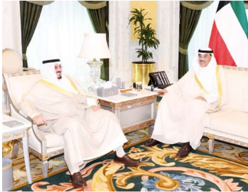
سمو ولي العهد يستقبل سمو رئيس مجلس الوزراء

سمو ولي العهد النائب الأول لرئيس مجلس الوزراء ووزير الدفاع ووزير الداخلية الشيخ فهد اليوسف.