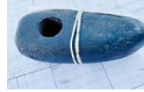
فأس من العصر البرونزي

الآثرية بقيادة عالم الآثار فالنتين يانين. وحصلت الحفريات على اسمها من كنيسة الخالوث الأقدس الواقعة في مكان قريب. ومنذ ذلك الحين استمرت الحفريات سنوياً في الكتلة الواقعة بين شارع Meretskova - Volosova وشارع Redyatina، وبعد الانتهاء من العمل السنوي تم تأسيس موقع تنقيب جديد حصل على رقم تسلسلي آخر.