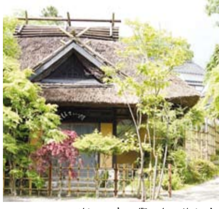
مبنى بكارز معماري تقليدي في «ريوكان»