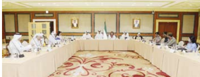
الشيخة جواهر إبراهيم الدعيج الصباح متحدثاً خلال الاجتماع

الخبرات ووجهات النظر حول أفضل السبل لإدماج مفاهيم حقوق الإنسان في المناهج الدراسية وتنظيم الأنشطة التوعوية والتدريبية في هذا الصدد. وشارك في الاجتماع ممثلون من عدة جهات منها كلية علي الصباح العسكرية وأكاديمية سعد العبد لله للعلوم الأمنية ومعهد سعود الناصر الصباح الدبلوماسي ومعهد الكويت للدراسات القضائية والقانونية والهيئة العامة للتعليم التطبيقي والتدريب وديوان الخدمة المدنية وجامعة الكويت. ويأتي هذا الاجتماع ضمن سلسلة من اللقاءات التي تعقدتها اللجنة الوطنية لإعداد التقارير ومتابعة التوصيات ذات الصلة بأهم الأسواق الدولية الجاذبة لمصدري السلع والمنتجات مضمياً أن قيمة الصادرات السعودية إلى الكويت في النصف الأول من العام الحالي بلغت 3.7 مليار ريال سعودي (حوالي 986 مليون دولار) ما يؤكد متانة وقوة العلاقات الثنائية وقوة السوق الكويتي، وأشار إلى أن وقد الهبته في زيارته إلى الكويت التي تستمر ثلاثة أيام يضم في عضويتها أربع جهات حكومية إضافة إلى 14 شركة متنوعة في مجالات مختلفة بهدف توفير الفرص وتقديم الحلول في القطاعات المستهدفة.