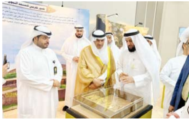
محافظ الجهراء مستمعاً إلى شرح لأحد الجسومات

التعليمية عن طريق الوسائل والطرق التي تحاكي بشكل كبير الواقع الذي يعيشه الرسول الكريم آنذاك. وكرمت جمعية المعلمين الكويتية (فرع الجهراء) المحافظ حمد الحسيني حيث قدمت له درعاً تذكرياً تكريماً له لرعابته وحضوره للمعرض وكذلك لدعمه المستمر لكل ما تحتاجه المحافظة لاسيما في الجانب التربوي الذي دائماً يوصي ويشدد عليه. بدوره قال مدير