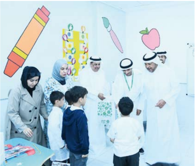
الشيخ عذبي ناصر العذبي الصباح خلال جولته التفتيشية

التجاري، ومن جانبه أكد بدر الدريس بأن اهتمام البنك التجاري يأتي تجسيدا لتوجيه البنك لمسؤوليته التربوية. وكما شكر الأستاذ جاسم بوحمد المحافظ على اهتمامه المستمر في العملية التعليمية وأبنائه الطلبة. وفي نهاية الجولة، شكر المحافظ مدير المنطقة التعليمية والهيئة الإدارية والتعليمية في المدارس على ما شاهدته من حسن تنظيم واجتهاد في توفير أجواء مناسبة لأبنائنا الطلبة.