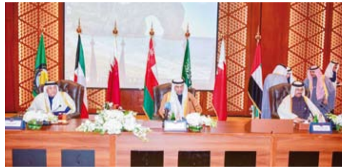
وزير الخارجية متحدثاً