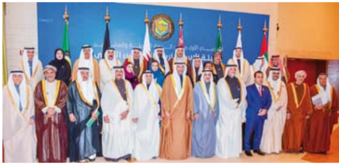
لقطة جماعية للمشاركين