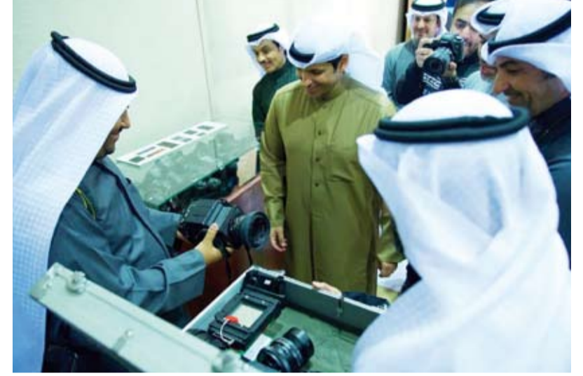
وزير الإعلام والثقافة ووزير الدولة لشؤون الشباب عبدالرحمن المطيري يفتتح الأرشيف

صورة منه حتى الآن والعمل جار على استكمال بقية الصور. وبين أن تاريخ الصور في الأرشيف يعود إلى العام 1958 مشيراً إلى أنه تم وضع فهرس للصور لتسهيل البحث عن أي صورة وكذلك تخزين الصور والاحتفاظ بها وأخذ نسخ احتياطية لها.