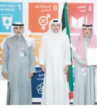
جانب من مذكرة التفاهم

تعزيز السياسات الصحية العامة في الكويت والاستفادة من الخبرات البحثية العالمية لتطوير الحلول العلمية التي تخدم المجتمع مندداً على التزام المعهد بمواصلة جهوده في دعم الدراسات والبحوث التي تحقق الأهداف الصحية والتنموية للدولة.