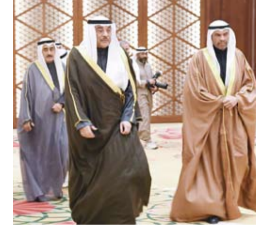
سمو ولي العهد الشيخ صباح خالد خلال الزيارة

تدعيم الروابط الأخوية بين دول مجلس التعاون الخليجي وتعزيز الجهود المشتركة في تحقيق طموحات دول المجلس وشعبها للوصول إلى النهضة المنشودة على كافة الأصعدة متمنياً سموه لهم التوفيق والنجاح.