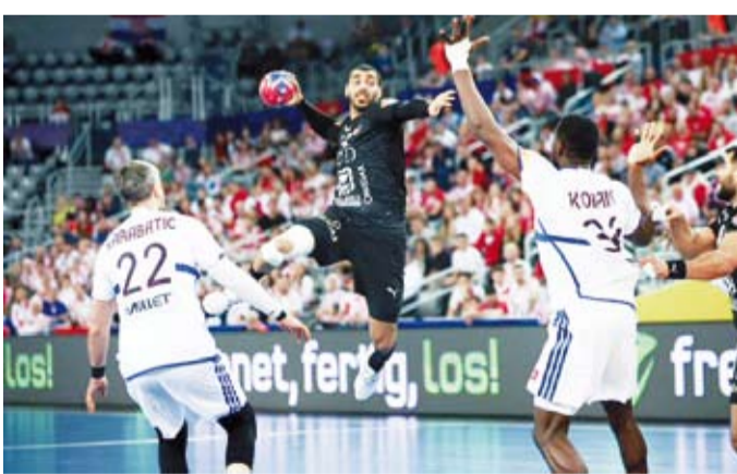
أداء مشرف لمنتخب مصر في كأس العالم لكرة اليد

تمكن صاحب الأرض والجمهور منتخب كرواتيا من الفوز على نظيره المجرى بنتيجة (31-30) في التواني الأخيرة. وفي مباريات دور التصنيف (كأس الرئيس) بالبطولة المقامة في كرواتيا والنرويج والدنمارك حققت بولندا المركز 25 بفوزها على أمريكا صاحبة المركز 26 بنتيجة (24-22). وتغلب منتخب الكويت على اليابان (32-37) ليحقق المركز 27 ويستقر الخاسر في المركز 28 وحققت البحرين المركز 29 بفوزها على الجزائر صاحبة المركز 30 بنتيجة (29-26) وفازت غينيا (المركز 31) على كوبا (32) بنتيجة (33-31).