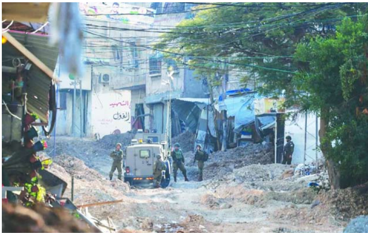
جنود الاحتلال وسط مخيم جنين

غداة مشاهد لافتة لعودة حاشدة لسكان شمال قطاع غزة إلى مناطقهم، ضغطت إسرائيل في الضفة الغربية، بعملية إخلاء قسري وهدم في مخيم طولكرم، وتوأكبت مع تحليق مكثف للطيران في جنين. وأقرت أوساط في الجيش الإسرائيلي، لوسائل إعلام عبرية، بأن أحد أهداف الهجمة الحالية على مخيمات الضفة «إفساد فرحة الاحتفالات الفلسطينية بتحرير الأسرى في صفقة التبادل»، وترسيخ القدرة على تنفيذ عمليات تدمير تجعل جنين شبيهة بغزة». وحذّر «برنامج الأغذية العالمي» من أن الوضع الإنساني في الضفة «حرج للغاية»، مؤكداً استعداده لتقديم مساعدات من خلال قسائم شراء لنحو 3750 شخصاً في مخيم جنين، فضلاً عن مساعدات نقدية لنحو 12750 أسرة نازحة متضررة من العمليات الإسرائيلية بالمنطقة. وفي غزة، واصل مئات آلاف الفلسطينيين النازحين العودة إلى شمال غزة لليوم الثاني على التوالي، وسط أجواء احتفالية لم تخل من صدمة بحجم الدمار. ووفق المكتب الإعلامي الحكومي بغزة، تمكّن، نحو 300 ألف نازح من العودة إلى محافظتي غزة والشمال، عبر مساري المشاة والمركبات. وكشف قيادي في حركة «حماس» لـ«الشرق الأوسط»، عن أن زيارة أكبر وفد للحركة إلى القاهرة منذ بدء حرب غزة شهدت لقاءات مع مسؤولي المخابرات المصرية جرى خلالها بحث ترتيبات المرحلة الثانية من اتفاق «الهدنة»، وأن الحركة طرحت «تشكيل حكومة توافق وطني».