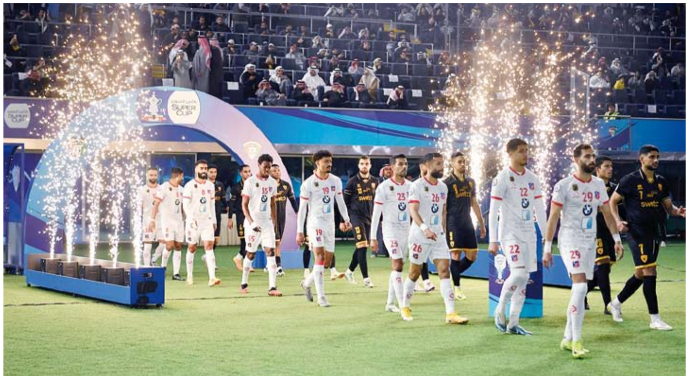
الكويت حافظ على لفة للمرة الثالثة على التوالي

الفريقان إلى ركلات الترجيح لتحديد البطل حيث ظفر الكويت باللقب بعد تسجيله سبع ركلات صحيحة مقابل ست للفرداسية، واللقب هو الثالث على التوالي للكويت والثامن له في تاريخ المسابقة، ليعزز رقمه القياسي في عدد مرات الفوز باللقب مقابل 6 ألقاب للفرداسية وثلاثة