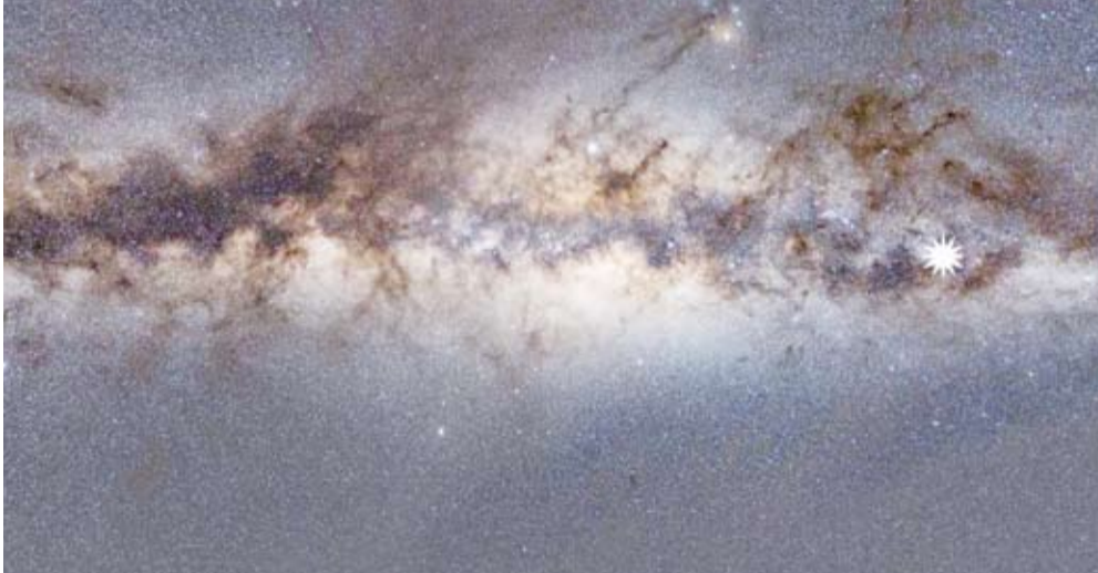
إشارات غامضة في الفضاء

بشكل متقطع، كما اكتشفوا أكثر من 20 انفجاراً إشعاعياً سريعاً. وقال الدكتور أندي وانج قائد مجموعة الأبحاث: ركزنا على العثور على انفجارات إشعاعية سريعة، وهي ظاهرة غامضة فتحت لنا مجالاً جديداً للبحث في علم الفلك. وأضاف: تمكننا عن طريق "كراكو" من اكتشاف هذه الانفجارات بشكل أفضل من أي وقت مضى. وتمكن علماء الفلك من رصد موجات