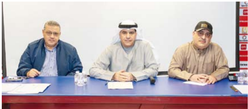
جانب من عملية القرعة

أجريت القرعة الأولى في ملعب الكويت مع اليرموك والقرين مع كازمة والصلبيخات بالمجموعة الأولى فيما ضمت المجموعة الثانية الكويت وكازمة والقرين واليرموك. ويشهد الدور التمهيدي للبطولة إقامة مباريات العربي مع التضامن والنصر مع الصليبيخات ضمن المجموعة