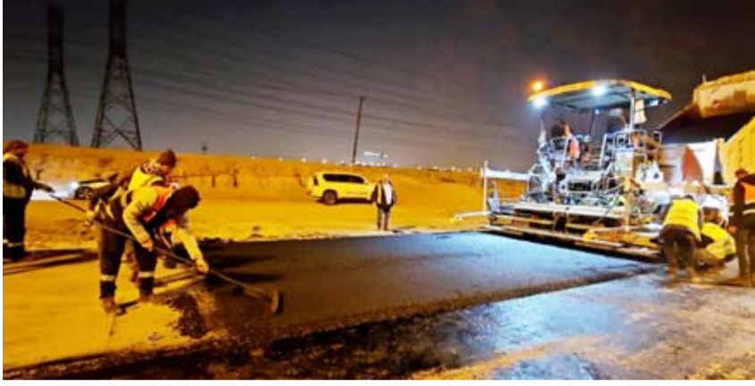
جانب من أعمال صيانة الطرق