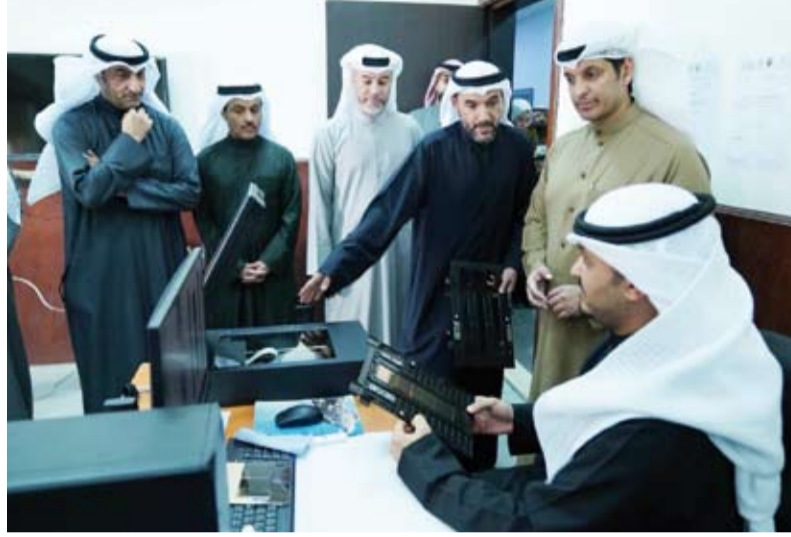
جانب من الجولة