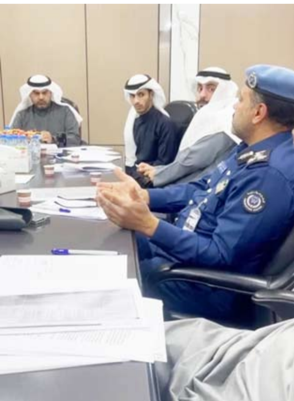
جانب من اجتماع قيادي البلدية

عقدت لجنة وضع الضوابط والاشتراطات وتحديد مواقع التشوين لعقود مناقصات أعمال النظافة المستقبلية صباح أمس الأربعاء.