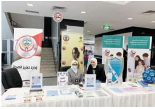
جانب من اليوم التوعوي