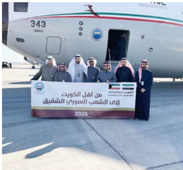
إهداء من الشعب الكويتي

أكد وزير الخارجية عبدالله اليحيا، أمس، أهمية التعاون المشترك لمواجهة التحولات السياسية والاقتصادية والأمنية بالمنطقة والعالم قائلًا: إن «رئاسة دولة الكويت للدورة الـ 45 للمجلس الأعلى لمجلس التعاون الخليجي تأتي في مرحلة دقيقة تتطلب تعزيز التكامل الخليجي ورسم رؤية موحدة لمواجهة التحديات الإقليمية والدولية». وأضاف الوزير اليحيا في كلمة له خلال الاجتماع الأول من الدورة الـ 28 للهيئة الاستشارية للمجلس الأعلى للتعاون لدول الخليج العربية، الذي انطلق أمس في الكويت ويستمر حتى اليوم الخميس، أن «هذا الاجتماع يمثل محطة بارزة في مسيرة التعاون والتكامل بين دول الخليج ويعكس التزام الدول الأعضاء بالعمل المشترك لتحقيق تطورات شعوب المنطقة نحو المزيد من التقدم والازدهار». وأضاف أن مجلس التعاون الخليجي أثبت طوال مسيرته الخيرة قدرته على الصمود والتكيف أمام هذه التحديات لافتاً إلى أن الهيئة الاستشارية تعد ركناً أساسياً في دعم رافد اتخاذ القرار داخل مجلس التعاون. ونقل الوزير اليحيا تحيات سمو أمير البلاد الشيخ مشعل الأحمد وتمنياته لأعمال الاجتماع بالتوفيق والنجاح، مشيداً بدعم سمو ولي العهد الشيخ صباح خالد لمهام الهيئة الاستشارية الذي يجسد الرعاية