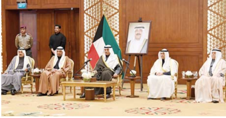
ولي العهد متحدثاً خلال اللقاء