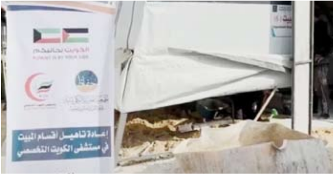
جانب من إعادة تأهيل المستشفى