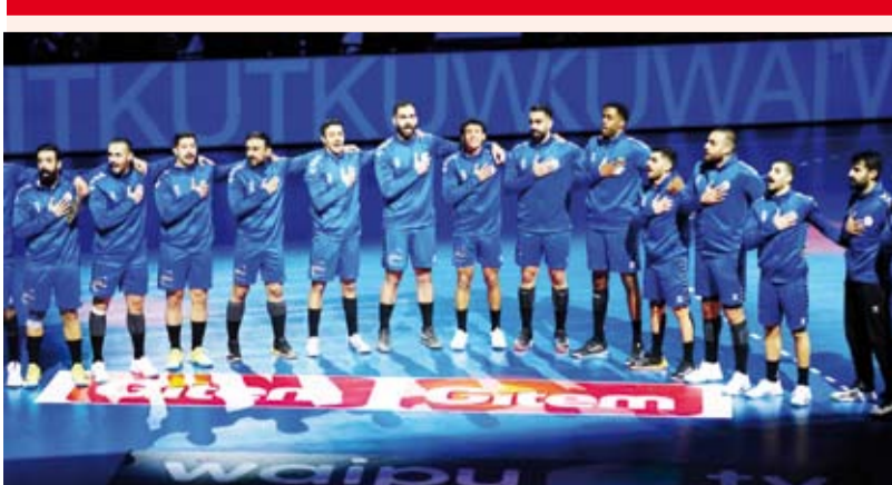
أزرق الطائفة المشارك في البطولة

حقق منتخب الكويت لكرة اليد المركز الـ 27 في بطولة كأس العالم بنسختها 29 وذلك بتغلبه على نظيره الياباني بنتيجة (37-32) ضمن منافسات تحديد المراكز (كأس الرئيس). ودخل منتخب الكويت المباراة بكل قوة بهدف تحقيق الفوز وتحسين تصنيفه الدولي لينتهي الشوط الأول متقدماً بفارق هدف واحد (17-16).