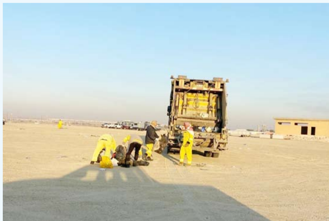
عمال البلدية ينظفون الشوارع