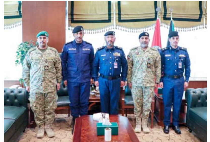
قياديو قوة الإطفاء والحرس الوطني

اختتمت قوة الإطفاء العام ممثلة بإدارة إطفاء المطارات صباح أمس الأربعاء دورة التعامل مع حرائق الطائرات العسكرية المخصصة لمنتسبي الجيش الكويتي، والتي تهدف إلى التعامل مع حوادث حرائق الطائرات العسكرية، واستخدام أحدث المعدات لرفع جاهزية القوة البشرية وتطويرها للتعامل مع هذه الحوادث النوعية