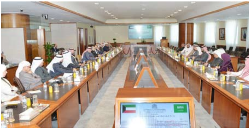
جانب من الاستقبال

تمتين روابط التكامل بينهما، بتوقيع اتفاقية الربط السلكي، مما يعزز التبادل التجاري والنمو الاقتصادي، ويحقق استراتيجية البلدين ببناء نموذج تكاملي استثنائي، يدعم مسيرة التعاون الخليجي المشترك، ويسهم في الوقت نفسه في حماية المكتسبات والمصالح وخلق فرص جديدة أمام الشعيين الشقيقين.