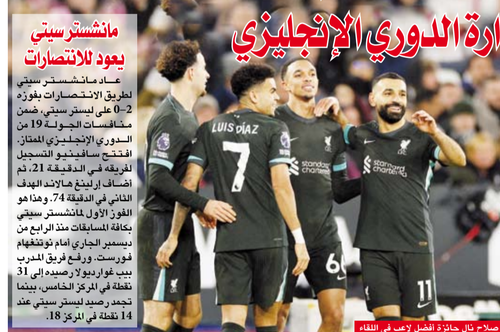
صلاح نال جائزة أفضل لاعب في اللقاء

حقق فريق ليفربول فوزاً كبيراً على مضيفه وست هام يونايتد (5-0 صفر) في المباراة التي جرت بينهما على استاد لندن الأولمبي في الجولة التاسعة عشرة من بطولة الدوري الإنجليزي لكرة القدم. وسجل الأهداف كل من الكولومبي لويس ديان، والهولندي كودي جاكوبو والمصري محمد صلاح وترينت الكسندر ارنولد، والبرتغالي ديوغو جوتا في الدقائق (30، 44، 44، 54، 84). ورفع ليفربول بفوزه الثالث تاليا والرابع عشر في المسابقة، رصيده إلى 45 نقطة معززاً موقعه في الصدارة بفارق 8 نقاط أمام أقرب منافسيه نوتنجهام فورست صاحب المركز الثاني. في المقابل، مني وست هام يونايتد بهزيمة الثامنة مقابل ستة انتصارات وخمسة تعادلات، ليتجمد رصيده عند 23 نقطة في المركز الثالث عشر.