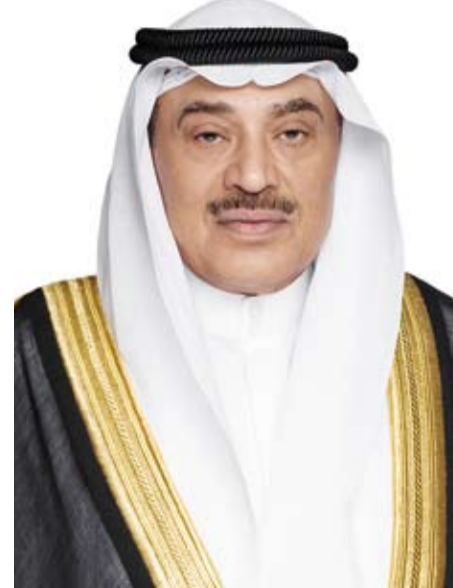
سمو ولي العهد الشيخ صباح الخالد