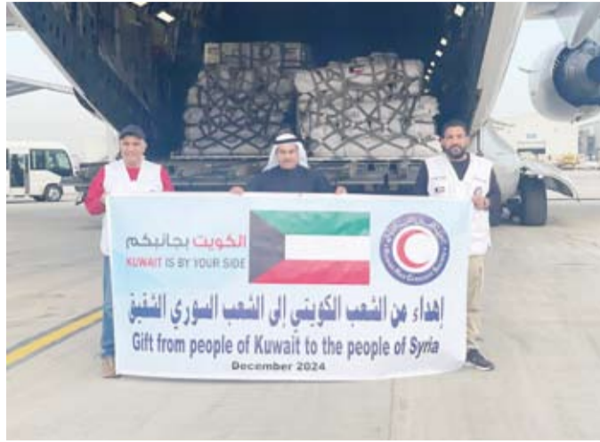
إهداء من الشعب الكويتي

وأعرب المغامس عن بالغ الشكر والتقدير للقيادة السياسية والموقف الرسمي الكويتي ووزارات الخارجية والشؤون والدفاع ممثلة بالقوة الجوية الكويتية لاتخاذ خطوات عملية وتحركات إنسانية تجاه الأشقاء في سورية. وشدد على أن هذه المساعدات تأتي ضمن الجهود الإنسانية والإغاثية التي تقدمها الكويت عبر ذراعها الإنسانية الهلال الأحمر الكويتي لدعم الفئات المتضررة والمكبوة في أنحاء العالم بمختلف الأزمان الإنسانية.