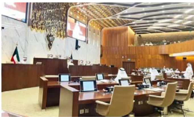
جلسة سابقة للمجلس البلدي

ويتكون المشروع من حديقة عامة تتميز بالأحواش والبراحات والمرافق التي تساهم في إحياء الموقع وتحويله إلى مساحات ذات هدف (مركز تعبير ثقافي)، كما يحتوي المشروع عناصر طبيعية بينها نباتات محلية مستدامة ومساحات مزروعة ومساحات مظلة لتوهية الخارجية بالإضافة إلى مساحات لترفيه الأطفال وإقامة الفعاليات والأنشطة الترفيهية والفنية الجاذبة للأطفال والعائلات.