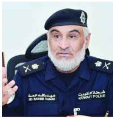
اللواء عيد العويهان

لحين عودتهم وتبصيمهم في الإدارة العامة للأدلة الجنائية أو في مطار الكويت. وذكر اللواء عيد العويهان أن الذين لم يجروا البصمة من المواطنين بلغ 16 ألفاً و442، أما المقيمين فبلغ عددهم 224 ألفاً وغير محدد الجنسية 88604 ألفاً.