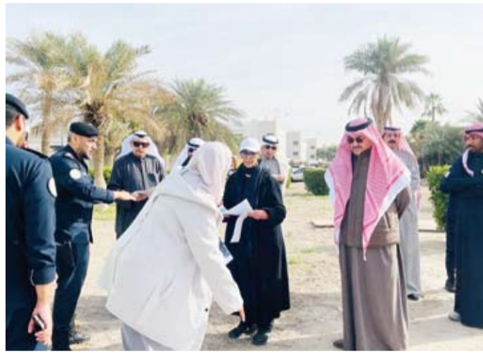
جانب من الجولة التفقدية