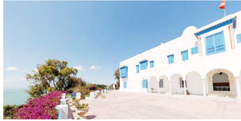
الفناء الخلفي للقصر يطل على البحر المتوسط

تونس والمنطقة العربية والوجهة الأشهر والمفضلة لزوار تونس. ويضم القصر الذي تحول عام 1991 إلى مركز للموسيقى العربية والمتوسطية 2200 تحفة تعكس اهتمام البارون ديرلانجي بالتراث الموسيقي العربي.