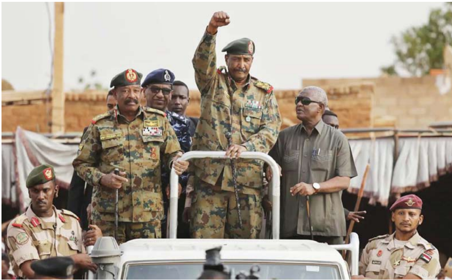
البرهان يحيى مؤيديه في أم درمان

وأوضح بيان «المشتركة»، أن قوات الدعم السريع «هاجمت مناطق في دري شقي، لك الحصار عن مليط؛ لكن «القوات المشتركة»، أوقعتها في كمين محكم، وقضت على القوة بالكامل، وتصدت لقوة متحركة ثانية حاولت نجدة الأولى، وألحقت بها خسائر فادحة، وقتلت 460 جندياً من القوة المهاجمة، بينهم قادة بارزون، مثل العميد فضل الناقي، وطم عثمان مدلل، والمقدم حامد دلسول. وأشار إلى تدمير 60 آلية عسكرية والسيطرة على 39 آلية عسكرية سليمة، ومن طرازات متنوعة.