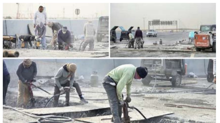
أعمال تبديل فواصل جسر الجهراء

ش رعت الهيئة العامة للطرق والنقل البري باستبدال فواصل التمدد على جسر طريق الجهراء السريع، وذكرت الهيئة العامة للطرق والنقل البري أنها بدأت باستبدال فواصل التمدد على