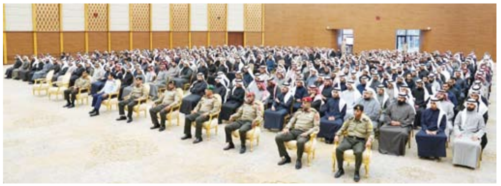
جانب من اللقاء التنويري

وقالت وزارة الدفاع في بيان صحفي: إن هذا اللقاء الذي عقد برعاية وحضور رئيس هيئة الخدمة الوطنية العسكرية اللواء الركن أحمد الشنقا يهدف إلى توضيح أهمية الخدمة الوطنية في إعداد شباب الوطن ليكونوا قادرين على تحمل المسؤولية وتعزيز