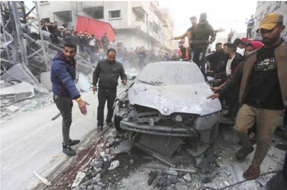
الدمار بعد غارة على رفح

وقُتل أكثر من 45 مسلحاً و500 فلسطيني في الحملة العسكرية الإسرائيلية «حماس»، غالبيةً من النساء والأطفال، وفق بيانات وزارة الصحة التي تديرها «حماس» في غزة، وتعتبر الأمم المتحدة أرقامها موثوقة.