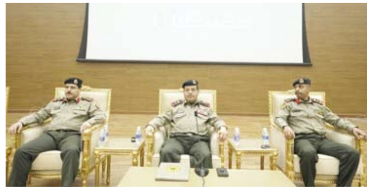
اللواء الركن أحمد الشنقا خلال رعايته وحضوره

المحددة وأن هذه الدعوة تمثل فرصة للمساهمة الفاعلة في تعزيز أمن الوطن واستقراره وترسيخ قيم الولاء والانتماء.