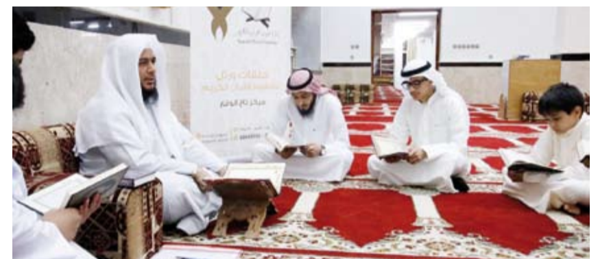
كوادر متخصصة في تعليم القرآن

أوضح أن «ورتل» حرصت على تنوع مبادراتها لتشمل الأندية التربوية مثل مشروع «أقرأ» لفتة الروضة، والمتحف الرمضاني، ومشروع «القادة الصغار» مؤكداً أن هذه المشاريع تهدف إلى تنمية