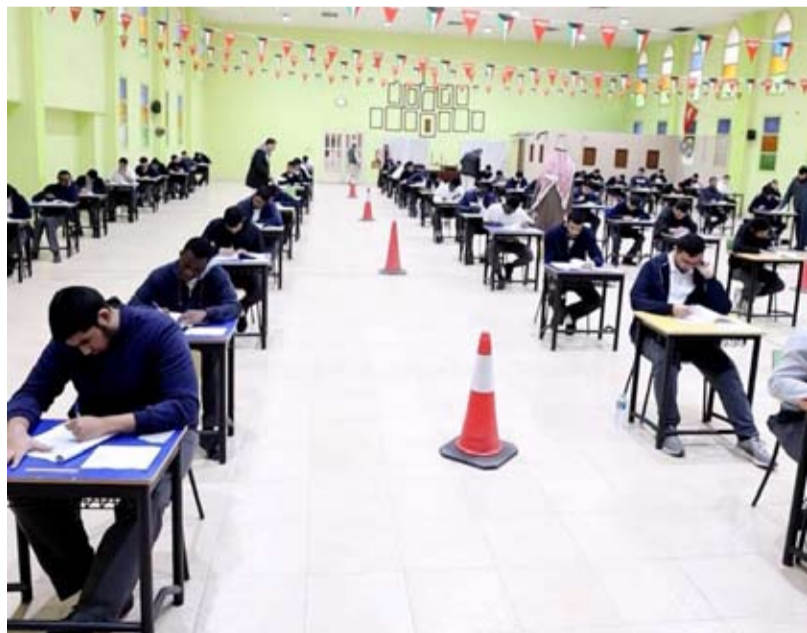
جانب من الاختبارات

مسار اللجان وتوضيح مداخل ومخارج المدرسة بالإضافة إلى أعمال الصيانة لمرافق المدرسة وتجهيز اللجان والفصول الدراسية لأداء الاختبار.