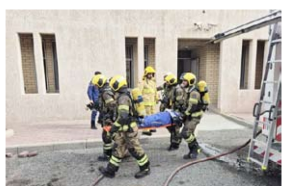
جانب من تدريب قوة الإطفاء

مع حادث انقلاب مركبة على طريق المطلاع وقد أسفر الحادث عن حالة وفاة وإصابة وتم تسليمهم إلى الجهات المختصة