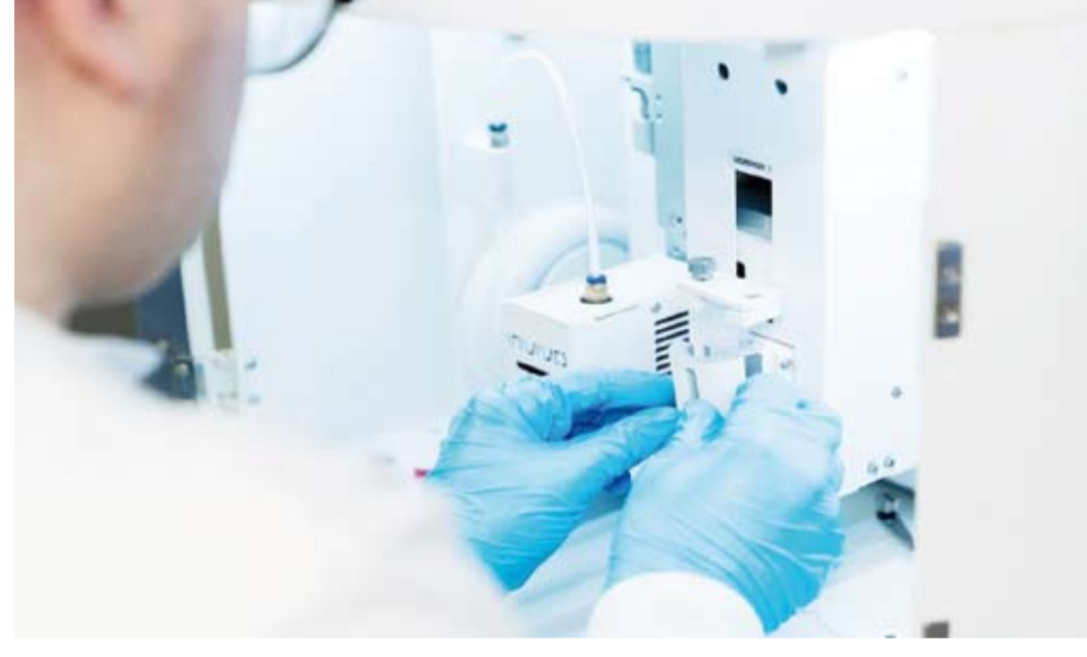
جانب من التجارب الطبية

الجراحية. وقالت ريبينا: إن هذه العملية أكثر بكثير من مجرد عملية زرع لأنها تسيج حي يرتبط بجسم المريض، حيث يتم زراعته من خلاياه الخاصة. يشار إلى أن اللثة عبارة عن مجموعة من الأنسجة تحيط بالأسنان وتعمل على تثبيتها في العظام، ويمكن أن تتعرض للالتهاب نتيجة لأمراض أو إصابات مختلفة.