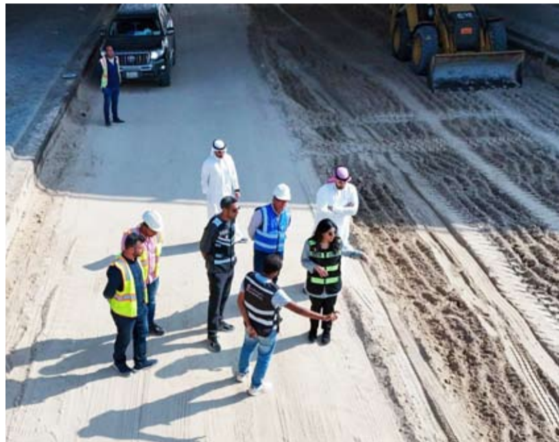
المشعان تتفقد أعمال الصيانة على الدائري السابع

وبينت أن الأشغال ستعمل بالتعاون مع الشركات المنفذة للمشاريع الحكومية الإنشائية التابعة للوزارة بمتابعة