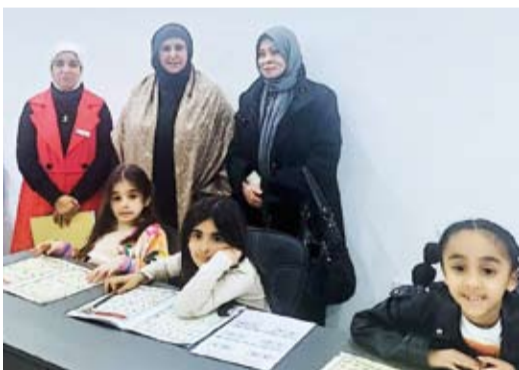
جانب من الافتتاح