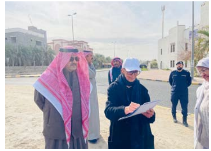
الشيخ عبدالله سالم العلي الصباح والشيخة أمثال الأحمد خلال الجولة

وأضاف إن الدولة حرصت بكافة قطاعاتها على إنجاز المزيد من المشاريع التنموية، وعلى تسريع وتيرة العمل في المشاريع الحكومية من أجل تحقيق تطورات المواطن، فضلاً عن إيجاد الحلول المناسبة للمشاكل والعراقيل وفق القوانين المتبعة، بالتنسيق مع عدة جهات حكومية مختصة.