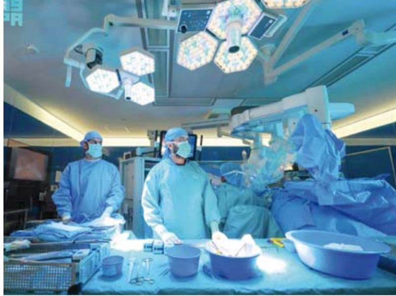
جانب من العملية

نجح مستشفى الملك فيصل التخصصي ومركز الأبحاث في إنهاء معاناة شاب مع السكري من النوع الأول، عبر إجراء أول عملية زراعة بنكرياس باستخدام الروبوت في المنطقة، في خطوة تعد أملاً جديداً لمرضى السكري من هذا النوع، لاسيما أنها حررت الشاب من قيود الأنسولين الذي ظل معتمداً عليه لسنوات، مما يبرز قدرة الابتكار الطبي في تحسين جودة حياة المرضى. وكان الشاب قبل خضوعه للزراعة، يعاني من السكري من النوع الأول لسنوات طويلة، إلى جانب مضاعفات شديدة تمثلت في الفشل الكلوي الذي يتطلب زراعة كلي في وقت سابق بالتخصصات، وعلى الرغم من نجاح المعقدة استمرت معاناته من السكري ومضاعفاته المعقدة التي لم تستجب للعلاجات التقليدية، مما جعل زراعة البنكرياس الخيار العلاجي الأنجع لإنهاء معاناته، وتحسين جودة حياته. وتميزت الزراعة باستخدام تقنيات الروبوت في تنفيذ عملية الاستئصال من المتبرع، وزراعتها للمريض دون أي تدخل بشري مباشر، ما يمكن