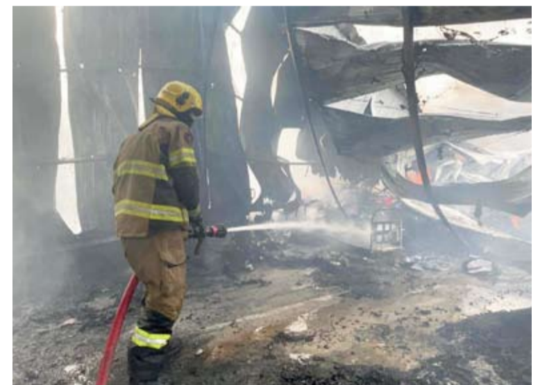
الفرق نجحت في مكافحة الحريق والسيطرة عليه دون تسجيل أي إصابات

أعلنت قوة الإطفاء العام أن خمسة فرق تابعة لها تمكنت أمس من السيطرة على حريق اندلع في مخزن بسكراب أمغرة يحتوي على سكراب حديد وملابس ودرجات نارية. وذكرت القوة في بيان صحفي أن فرق الإطفاء من مراكز التحرير والجبراء الحرفي والاستقلال ومشرف والإسناد قامت بمكافحة الحريق والسيطرة عليه دون تسجيل أي إصابات.