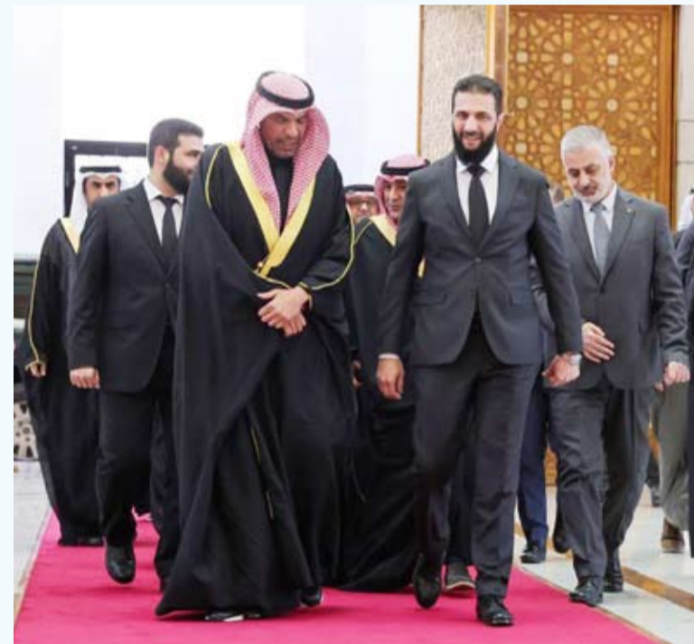
أحمد الشرع مستقبلاً الوزير عبدالله الجحيا وأمين عام مجلس التعاون

وصل وزير الخارجية دولة الكويت، رئيس الدورة الحالية للمجلس الوزاري لمجلس التعاون الخليجي، عبدالله الجحيا، والأمين العام للمجلس، جاسم البديوي، أمس، إلى العاصمة السورية، دمشق، على رأس وفد رفيع المستوى.