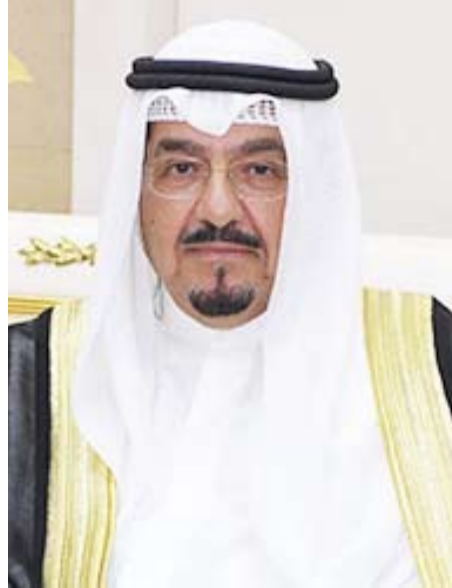
سمو الشيخ أحمد العبدالله