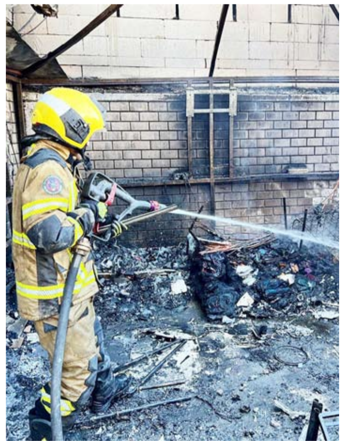
فرق الإطفاء نجحت في مكافحة الحريق والسيطرة عليه

قالت قوة الإطفاء العام إن حريقاً اندلع ظهر أمس الاثنين بمنزل في منطقة العدان أسفر عن وفاة شخصين. وذكرت «الإطفاء» في بيان صحفي أن فرق الإطفاء تعاملت مع الحريق بمكافحته والسيطرة عليه وإنقاذ 6 أشخاص وتأمينهم إلى الخارج لافتة إلى أنها قامت بعد ذلك بتسليم الموقع للجهات المختصة.