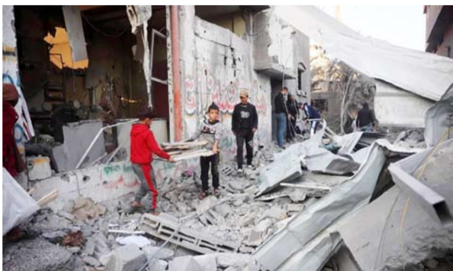
فلسطينيون يقفون أمام مبانٍ متضررة

شخصيات مستقلة، وتصدر برسوم رئاسي من الرئيس محمود عباس، وتولي مهمة إدارة الشؤون المدنية، وتوفير المساعدات الإنسانية للفلسطينيين، وتوزيعها في القطاع، وإعادة تشغيل معبر غزة، وإعادة إعمار ما دمرته الحرب الإسرائيلية، وفق مصادر فلسطينية تحدثت وقته لدا الشرق الأوسط». ويعتقد المحلل السياسي الفلسطيني، عبد المهدي مطاوع، أنه «بوجود حركتي فتح والجهاد الإسلامي، في القاهرة (حماس) في القاهرة يتبلور شقان: الشق الأهم يتعلق بالمقترح المصري لوقف هذه الحرب، والتوصل إلى هدنة على الأقل»، مؤكداً أن «نجاح هذه الهدنة يعتمد على إدارة فلسطينية وتشكيل اللجنة حتى لا تحدد إسرائيل شكل التالي للحرب ببسبانيا مرفوض عربياً».