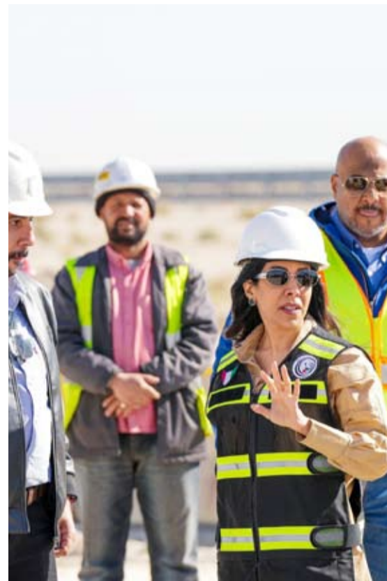
وزير الأشغال العامة د.نورة المشعان خلال الزيارة

من جهته أعرب فيليب كاتيتش عن سعادته وامتناحه لحفاوة الاستقبال، مثنياً الرعاية البالغة التي تحظى بها البعثة الدبلوماسية ومواطني جمهورية صربيا على الصعيدين الرسمي والشعبي في بلدهم الكويت، مؤكداً أن صربيا والكويت تربطهما علاقات وثيقة ومتجددة.