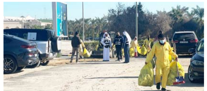
جانب من أعمال التنظيف

مقار للوفود الرياضية المشاركة في البطولة. وأوضحت أن أعمال التنظيف تشمل توزيع الحاويات بمختلف المقاسات في المواقع المستهدفة مؤكدة أن الحملة تهدف إلى تحقيق الجودة الكاملة قبل افتتاح البطولة رسمياً.