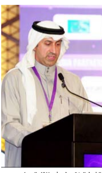
الشيخ الدكتور نمر فهد المالك الصباح

على الورق وتسريع العمليات إذ أسهم هذا التطور في تحسين الإنتاجية وتقليل الأخطاء وتعزيز الشفافية في العمل. وبين أنه تم استخدام أنظمة ذكية لمراقبة الأداء في المصافي النفطية تعتمد على مؤشرات أداء رئيسية تتابع باستمرار لضمان تحقيق أعلى معايير السلامة والجودة مما يدعم أهداف الوزارة في تحقيق الاستدامة البيئية وتقليل الأثر البيئي. وأشاد الشيخ نمر الصباح بجهود وزارة النفط في التحول الرقمي التي تؤكد مكانتها كركيزة أساسية للتنمية الاقتصادية في دولة الكويت إذ تعمل بشكل مستمر على التنسيق مع الجهات النفطية الأخرى لتوحيد تدقيق البيانات وتعزيز التكامل الرقمي بين مختلف مؤسسات القطاع بما يسهم في رفع تنافسية الدولة على الصعيد العالمي.