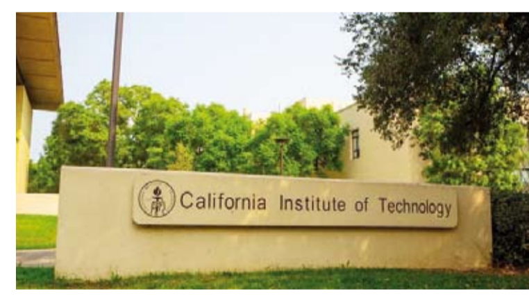
معهد كاليفورنيا للتكنولوجيا الأمريكي

الأمريكية: إن انقطاع «موهو» شيء مثير للاهتمام بالنسبة لعلماء الزلازل لأنه يخبرنا بما يحدث داخل وبين الصفائح التكتونية في الأعماق. وأوضح أوهولت أنه يمكن أن تخبرنا هذه التقنية ما إذا كانت الصدوع الرئيسية تحترق الوساح، وكيف تتركت العمليات القديمة والمعاصرة آثارها على القارات، ومدى قوة القشرة العميقة في أماكن معينة.