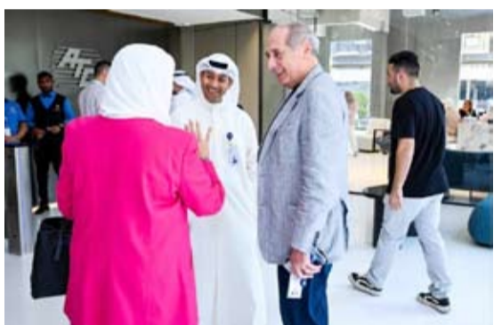
جانب من الفعاليات

في إطار مشاركتها في شهر التوعية بسرطان الثدي، وفي خطوة تعكس التزامها العميق وحرصها على التفاعل مع كل ما من شأنه دعم وتعزيز الجهود الصحية في البلاد لما فيه صالح الجسم الطبي والتربوي وخدمة المرضى ودعم الفعاليات التي تنظمها وزارة الصحة قامت شركة التقدم التكنولوجي (ATC) بالإشراف على تدريب عدد من العاملين في قسم الأشعة التشخيصية في مركز الكويت لمكافحة السرطان