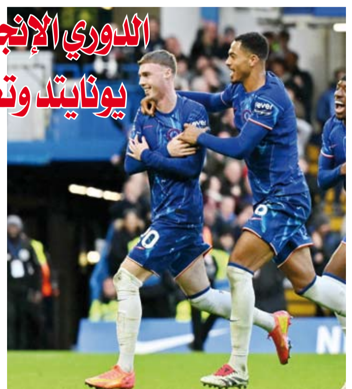
البلون ففنز للمركز الثالث

الذي حقق فوزه الخامس في البطولة خلال الموسم الحالي مقابل 4 تعادلات و 4 هزائم، إلى 19 نقطة في المركز التاسع. في المقابل، توقف رصيد إيفرتون، الذي عجز عن تحقيق أي انتصار في مباراته الخمس الأخيرة في البطولة، عند 11 نقطة في المركز الخامس عشر. وبعد انتصار مانشستر يونايتد اليوم هو الأول تحت قيادة مدربه البرتغالي روبن أموريه الذي استهل مسيرته مع الفريق بالتعادل (1-1) مع مضيفه إيبسويتش تاون في الجولة الماضية، قبل أن يحصد باكورة انتصاراته مع الفريق بوجه عام خلال فوز فريقه المخبر على ضيفه بودو جلينتس النرويجي (3-2)، بالدوري الأوروبي الخميس الماضي. وفي مباراة أخرى تعادل توتنهام هوتسبير وضيفه فولهام بهدف لثلاثة.