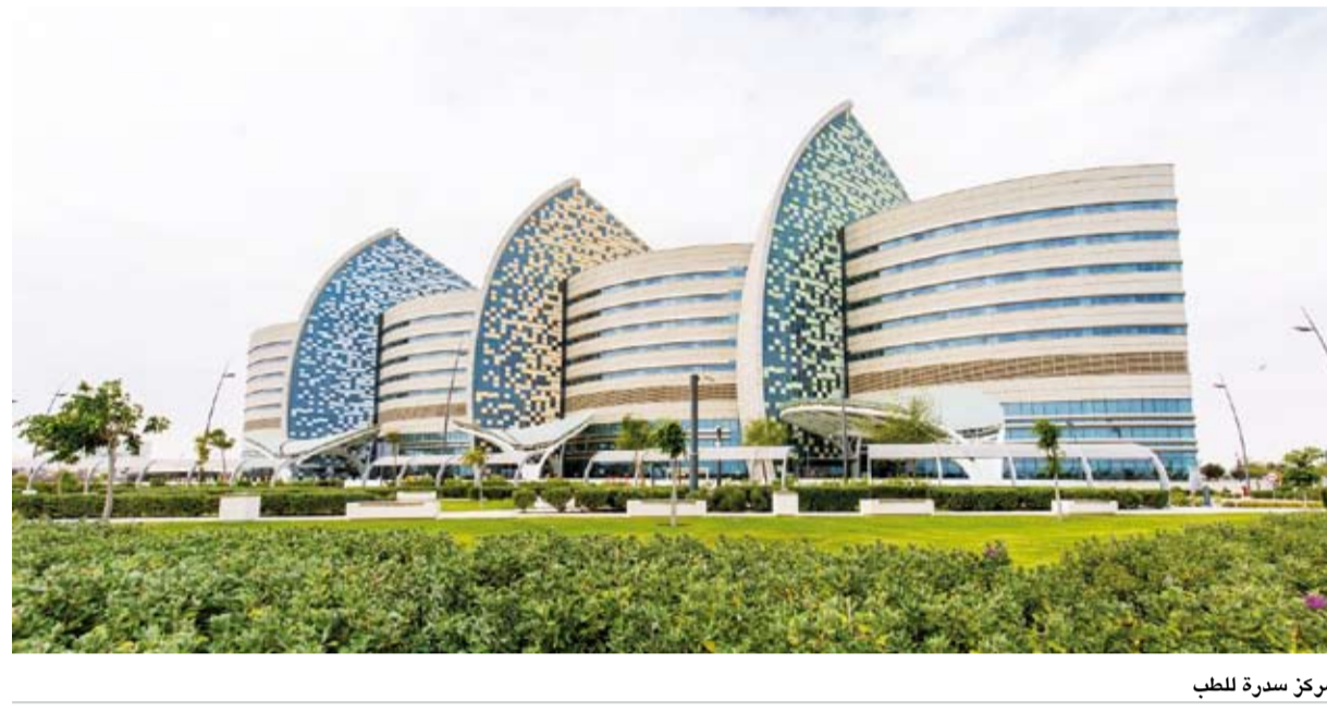
مركز سدرة للطب

معدله الطبيعي، وهي تتغذى بشكل طبيعي وسيتم متابعة التقدم في حالتها كل ثلاثة أشهر. وبالإضافة إلى اضطرابات الغدد الصماء مثل فرط الأنسولين الخلقى ومرض السكري من النوع الأول، يركز سدرة للطب أيضاً على الاضطرابات والحالات الطبية التي تشمل الحساسات العصبية العضلية مثل ضمور العضلات الشوكي واضطرابات التمثيل الغذائي مثل بيلة الهومو سيستين وسرطانات الأطفال مثل الورم الدموي منخفض الدرجة.