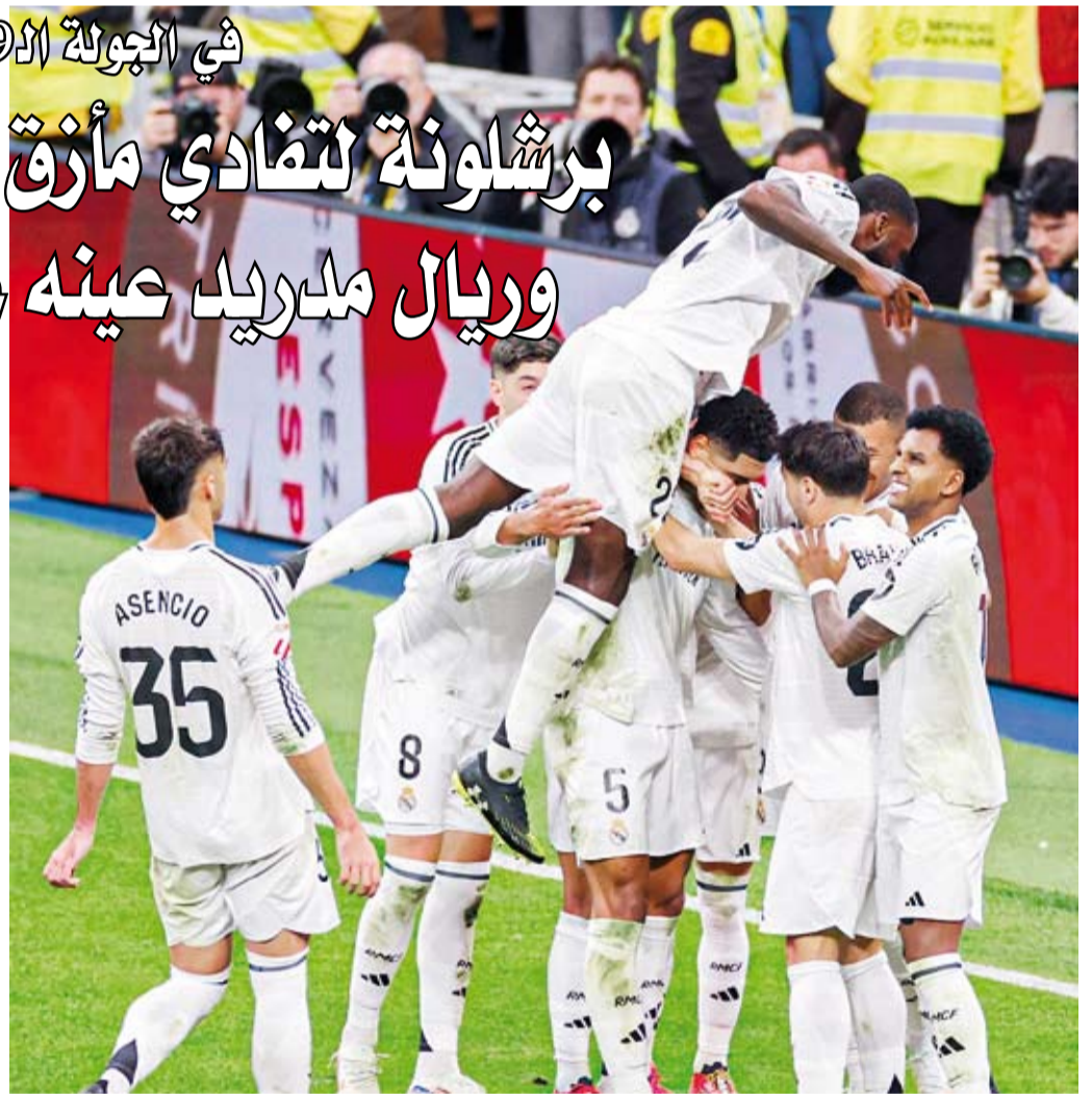
الملك الإسباني مواصلة نغمة الانتصارات أمام بيلباو

الفوز خلال آخر ثلاث مباريات بالدوري الإسباني، حيث تعادل في مباراة وخسر في اثنتين. ويعتلي برشلونة صدارة جدول الدوري الإسباني برصيد (34) نقطة، بفارق نقطة واحدة عن ريال مدريد، الذي ما زال لديه مباراة مؤجلة. وفي مباراة أخرى، يدخل ريال مدريد أمام أتلتيك بيلباو من أجل الفوز فقط، وذلك على أمل تعثر برشلونة ومن ثم الانتعاش على قمة جدول الترتيب، حيث يحتل الريال المركز الثاني برصيد (33) نقطة بفارق نقطة واحدة فقط عن المتصدر. وتمكن ريال مدريد من الفوز في آخر ثلاث مباريات له بالدوري الإسباني، واقترب بشدة من الصدارة مستغلا التعثرات الأخيرة لبرشلونة، بجانب أنه استعاد توازنه عقب الخسارة أمام ليفربول الإنجليزي بهدفين نظيفين في دوري أبطال أوروبا، من خلال فوزه على ختافي بهدفين نظيفين أمس /الأحد/.