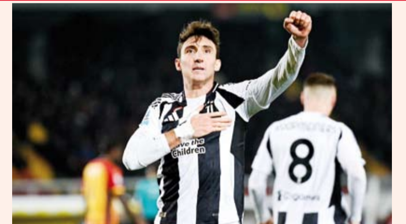
تعادل مخيب للووف وضعه في المركز السادس بالكالتشيو

تعادل فريق يوفنتوس مع مضيفه ليشي بهدف لثلاثة في المباراة التي جمعتها ضمن الجولة الرابعة عشرة من الدوري الإيطالي لكرة القدم. وتقدم يوفنتوس في النتيجة عن طريق أندريا كامبياسو في الدقيقة 68، وسجل هدف التعادل لفريق ليشي، أنثي ريبيتش في الدقيقة (390+). ولغت تقوية حكم الفيديو المساعد الفار هدفا ليوفنتوس سجله مهاجمه الأمريكي تيموتي وايا في الدقيقة 24 بسبب وجود تسلسل. وواصل يوفنتوس نزيف النقاط بعد تعادله في الجولة الماضية أمام ميلان، ليتراجع للمركز السادس برصيد 26 نقطة، في المقابل رفع