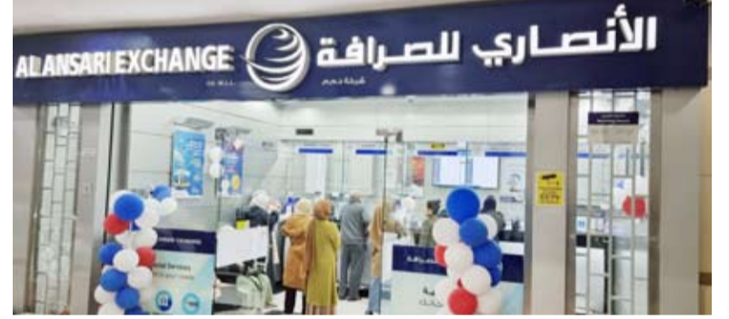
إطلاق خدمة فيزا دايركت

أعلنت «فيزا» عن إبرام شراكة مع شركة «الأنصاري للصرافة» في الكويت لتسهيل إجراء التحويلات المالية بسرعة وأمان حول العالم من خلال إطلاق خدمة «فيزا دايركت». ويتيح هذا التعاون لعملاء «الأنصاري للصرافة» في دولة الكويت إرسال الأموال عبر تطبيق الأنصاري للصرافة أو أحد فروع الشركة، مباشرة إلى أكثر من 4.4 مليون بطاقة فيزا في أكثر من مئتي دولة، بحيث يجري إيداع المبالغ على الفور في بطاقة المستلم بصورة شبيهة آتية.