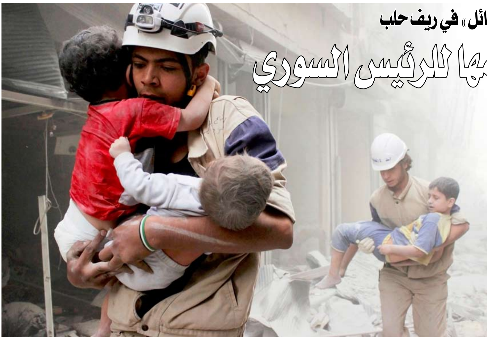
عناصر «الحوثيين» يحملون أطفالاً في ريف حلب.

أعلنت القيادة المركزية الأميركية أن المدمرتين التابعتين للبحرية «يو إس إس ستوكديل» (دي دي جي 106) و«يو إس إس أوكن» (دي دي جي 77) نجحتا في إحباط هجوم مجموعة من الأسلحة أطلقها الحوثيون أثناء عبورهما خليج عدن بين 30 نوفمبر والأول من ديسمبر. ووفقاً للبيان الذي ورد على الموقع الرسمي للقيادة المركزية الأميركية فإن «المدمرتين كانتا ترافقان ثلاث سفن تجارية