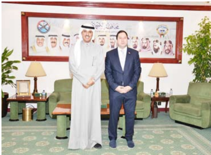
محافظ الأحمدى مستقبلاً القائم بأعمال سفير صربيا

استقبل محافظ الأحمدى الشيخ حمود جابر الأحمد الصباح، بمكتبه في ديوان عام محافظة الأحمدى صباح أمس الاثنين، القائم بأعمال سفير جمهورية صربيا لدى البلاد فيليب كاتيتش، حيث جرى التعارف وتبادل الأحاديث الودية التي تناولت العلاقات الثنائية الوثيقة التي تربط البلدين وسبل تعزيزها في جميع المجالات وبحث سبل تطوير التعاون المشترك.