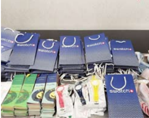
ضبط بضائع مقلدة

تمكّن رجال الإدارة العامة للجمارك في إدارة جمارك مطار الكويت (T4)، من ضبط مسافر قادم من جمهورية الصين الشعبية، وذلك بعد الاشتباه بامتاعته أثناء إنهاء الإجراءات الجمركية.