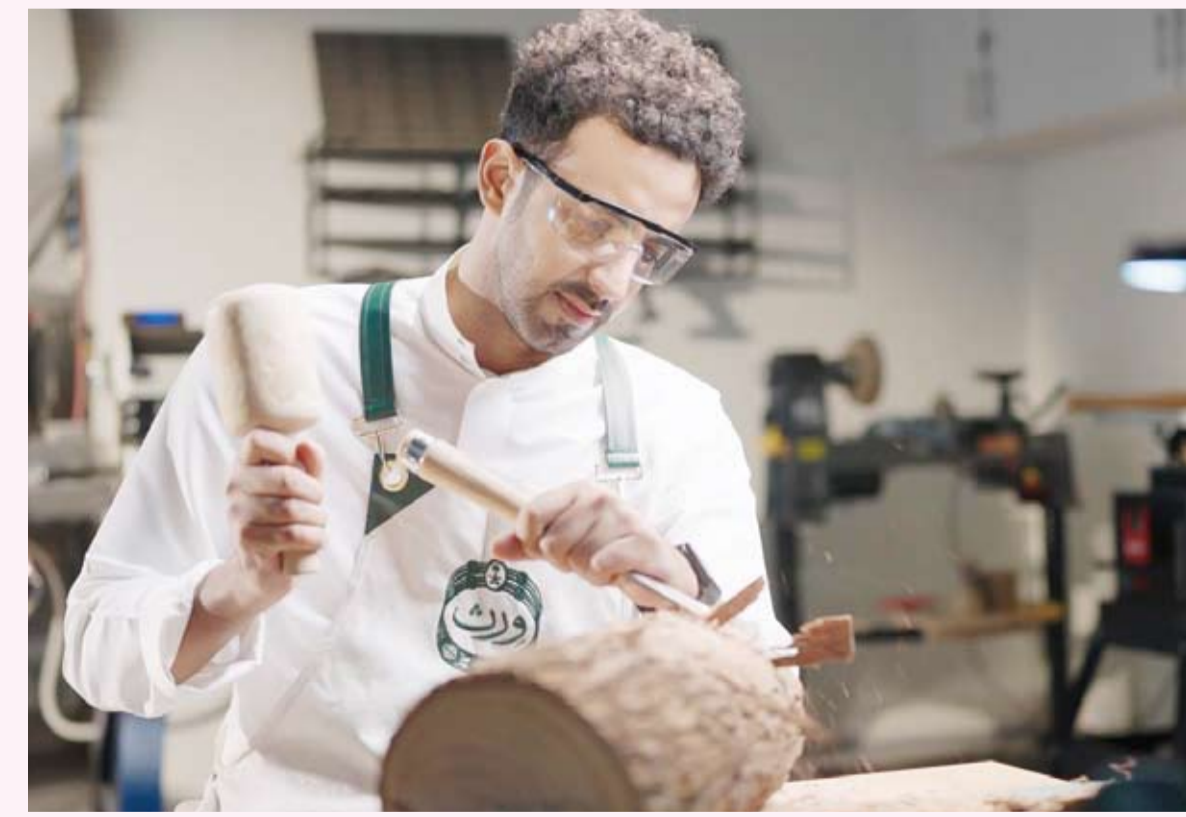
جانب من ورش العمل

ويؤكد هذا المشروع نهج "ورث" في تمكين طلابه وحرصه من المشاركة في مشاريع نوعية تتجاوز حدود المعامل، وتحول المعرفة إلى أعمال تخدم مناسبات ذات مكانة رفيعة، وتسهم في نقل الموروث الحرفي السعودي إلى واقع معاصر يحافظ على أصالته ويعزز استخدامه. ويواصل ورث تقديم برامج التعليمية والدورات المتخصصة عبر معامل