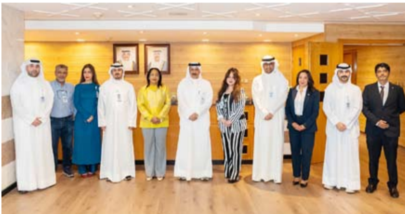
لقطة جماعية مع ممثل الأمم المتحدة غادة الطاهر وعدد من مديري ومحركي وكالة «كونا»

الدولية ويعزز الوعي المجتمعي بالقضايا التنموية والإنسانية. وأشار إلى أهمية الدور الذي تضطلع به وسائل الإعلام في دعم الجهود الدولية ونقل الرسائل الأممية، مشدداً على ضرورة تعزيز التعاون الإعلامي بما يواكب التطورات المتسارعة في قطاع الإعلام والإتصال. وجسرى خلال اللقاء استعراض أوجه التعاون القائمة بين (كونا) ومكتب الأمم المتحدة لدى دولة الكويت إضافة إلى مناقشة فرص توسيع الشراكة الإعلامية بما يساهم في إبراز أنشطة وبرامج الأمم المتحدة وتعزيز نشر الوعي بالقضايا الإنسانية والتنموية على المستويين المحلي والدولي. وشهد الاستقبال، تكريم الظاهر لعدد من مسؤولي ومديري ومحركي وكالة الأنباء الكويتية (كونا) تقديراً لجهودهم المهنية المتميزة ودورهم البارز في تغطية أنشطة وبرامج الأمم المتحدة المختلفة بكفاءة واحترافية.