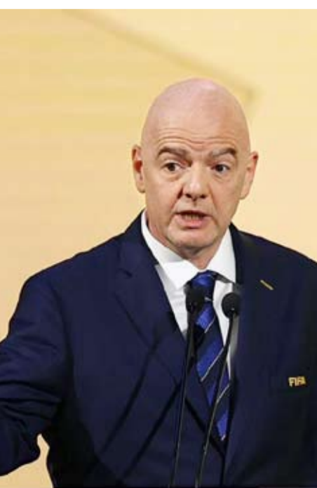
جيانني إنفانتينو رئيس الاتحاد الدولي لكرة القدم

ويسعى «نيوكاسل» لتعزيز صفوفه بجناح أيسر جديد لتعويض بيع لاعبه الإنجليزي أنتوني جورودون لنادي برشلونة الإسباني. وأفادت قناة «سكاي أناميا» ومجلة «كيكر» بأن اللاعب الإيفواري سيخضع قريباً لفحص طبي، بعد توقيع منتخب بلاده منافسات «كأس العالم 2026» في الولايات المتحدة وكندا والمكسيك.