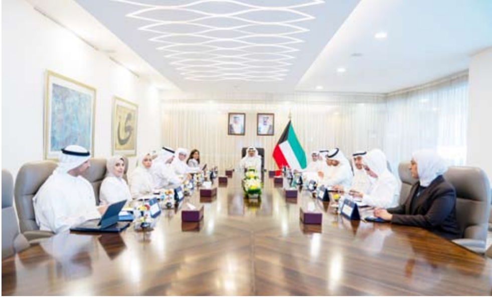
سمو الشيخ أحمد العبدالله يترأس الاجتماع

ووزير الدولة لشؤون البلدية ووزير الدولة لشؤون الإسكان عبدالله اللطيف المشاري، ووزير الكهرباء والماء والطاقة المتجددة الدكتور صبيح المخيزيم، ووزير الخارجية الشيخ جراح الجابر، ووزير الدولة للشؤون الاقتصادية والاستثمار عبدالعزيز المرزوق،