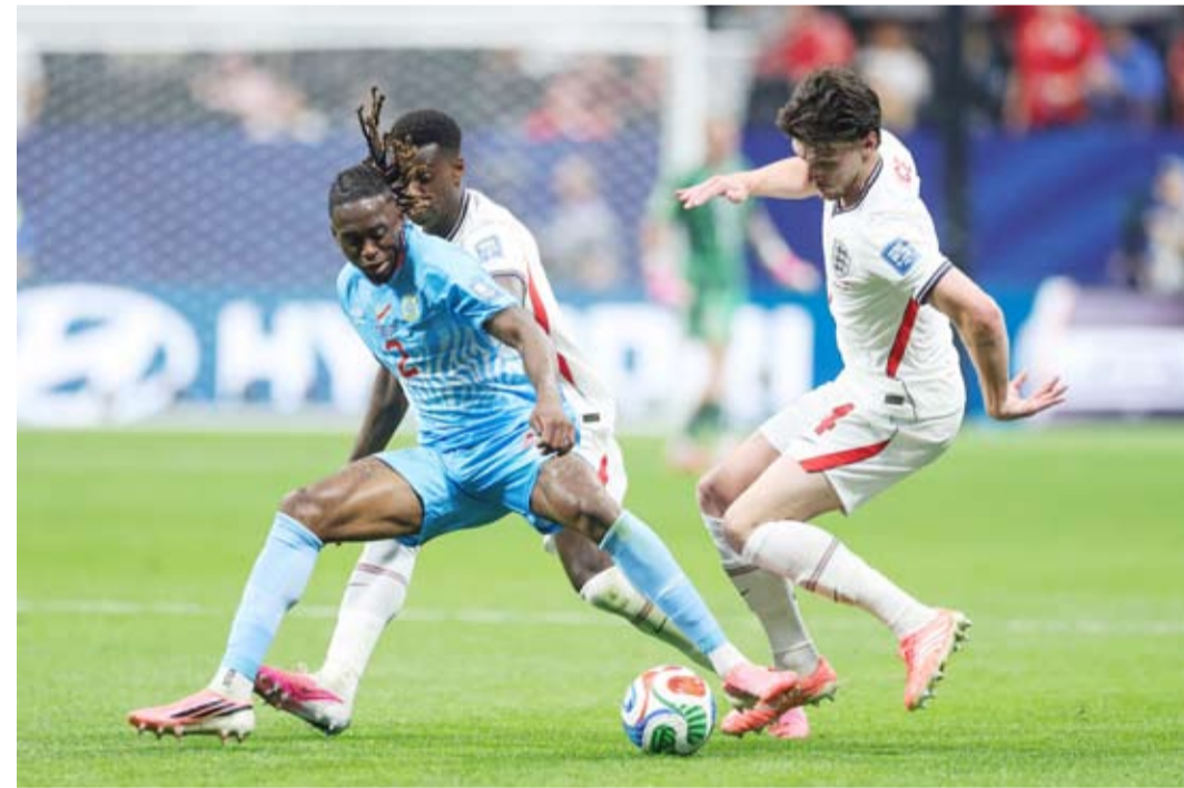
ماري كين يحتفل بعد تسجيل هدفي إنجلترا

معادلاً النتيجة. واستمرت محاولات إنجلترا للحسم اللقاء قبل الوقت الإضافي، حتى جاءت الدقيقة 86، عندما سدده بيلينغهام في جسد الحارس، لترتد الكرة إلى جورودون الذي مررها إلى كين، ليسددها بقوة داخل الشباك مسجلاً هدف الفوز.