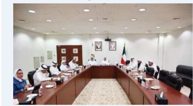
محافظ الجبراء خلال حضوره الاجتماع

بحضور محافظ الجبراء حمد جاسم الحبشي، عقدت لجنة الخدمات العامة بمجلس محافظة الجبراء اجتماعها رقم (6/2026)، وذلك في ديوان عام المحافظة، لمناقشة عدد من الموضوعات المدرجة على جدول الأعمال ومتابعة الملفات الخدمية ذات الأولوية داخل نطاق المحافظة. واستعرضت اللجنة خلال الاجتماع عدداً من الموضوعات المهمة، من بينها المقترحات المقدمة من المواطنين بشأن عدد من الملفات الخدمية، والمقترحات المتعلقة بمعالجة الكثافة المرورية، وتعزيز الربط العمراني بين مناطق المحافظة، وتطوير مرمرات عامة للمشاة مزودة بالخدمات اللائمة، إضافة إلى مناقشة عدد من الموضوعات المحالة من لجنة الصحة والتعليم والتنمية المجتمعية، ومتابعة ردود الجهات الحكومية بشأن عدد من الملفات الخدمية والتنظيمية. كما تطرقت اللجنة إلى خدمات نقل المياه والملاحظات المرتبطة بها، ومتابعة موضوع المياه المعالجة داخل المحافظة ومنطقة العبدلي الزراعية، وبحث سبل معالجة التحديات القائمة بالتنسيق مع الجهات المختصة، بما يضمن تحسين مستوى الخدمات المقدمة للمواطنين.