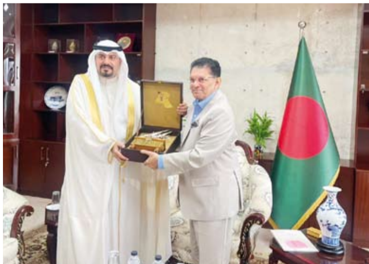
السفير علي حماده ووزير خارجية بنغلاديش الدكتور خليل الرحمن

دعم قيم لترشح بنغلاديش لرئاسة الجمعية العامة للأمم المتحدة. وأعرب السفير حماده عن التطلع لأن تواصل بنغلاديش خلال رئاستها الدورة المقبلة للجمعية العامة دعم القضايا والاهتمامات المشتركة من خلال تعزيز التنسيق والتشاور والعمل المشترك بما يحقق مصالح البلدين ويخدم قضايا الأمة الإسلامية متمنياً لويزر خارجية بنغلاديش التفوق في أداء هذه المهمة الدولية الراقية. وأكد اعتراز دولة الكويت بما يجمع البلدين من تعاون وثيق وتنسيق متبادل في المحافل الدولية داعياً إلى مواصلة هذا النهج وتعزيزه في المرحلة المقبلة. وأشاد بتعزيز العلاقات بين الكويت وبنغلاديش في مختلف المجالات مغرباً عن تمنياته لبنغلاديش وحكومتها وشعبها مزيداً من التقدم والأزدهار ومزيداً من التعاون الثنائي بين البلدين.