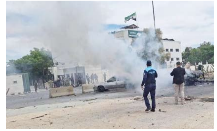
الانفجار حدث في محيط القصر العدلي بالعاصمة السورية

أسفر انفجار وقع داخل مقهى في محيط القصر العدلي في العاصمة السورية دمشق عن مقتل 5 أشخاص وإصابة 16 آخرين، وفق مدير الإسعاف والطوارئ في وزارة الصحة السورية. وترافق الانفجار -الذي وقع داخل مقهى شعبي في شارع النصر بمنطقة الحجاز وسط المدينة ويجري التحق من طبيعته- مع سماع دوي تلاه تحرك لسيارات الإسعاف والإطفاء التابعة لفرق إطفاء دمشق، في حين فرضت القوات الأمنية طوقاً مشدداً منعت بموجبه وسائل الإعلام من الاقتراب من الموقع.