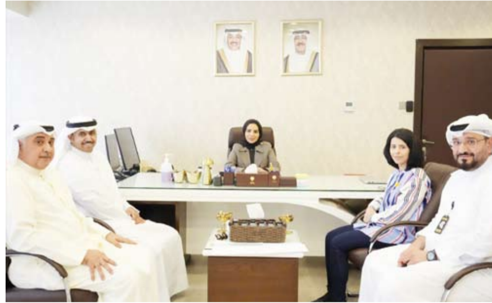
د. أمال الحويولة خلال اجتماعها مع قياديي هيئة ذوي الإعاقة

أكدت وزيرة الشؤون الاجتماعية وشؤون الأسرة والطفولة الدكتورة أمال الحويولة، أمس، ضرورة سرعة إنجاز معاملات الأشخاص ذوي الإعاقة ضمن المدد الزمنية المحددة ومواصلة تطوير الخدمات ورفع جودة الأداء بما يحقق رضا المستفيدين. وشددت الوزيرة الحويولة في تصريح صحفي عقب جولة تفقدية قامت بها للمقر الرئيسي للهيئة العامة لشؤون ذوي الإعاقة، على ضرورة الالتزام بأوقات العمل الرسمية والاهتمام بمقابلة ذوي الإعاقة وأسرة وأسرهم والاستماع إلى احتياجاتهم وملاحظاتهم. وقالت: إن الجولة استهدفت الإطلاع على سير العمل وآلية استقبال المراجعين في الصالات ومتابعة مستوى الخدمات المقدمة لهم عن كثب لضمان تلبية تطلعاتهم وتسهيل إجراءاتهم. وأوضحت أن الجولة شملت