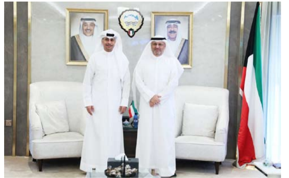
الوزيران عمر العمر ود. طارق الجلامه خلال اللقاء

بحث وزير الدولة لشؤون الاتصالات وتكنولوجيا المعلومات ووزير الإعلام والثقافة بالوكالة عمر العمر مع وزير الدولة لشؤون الشباب والرياضة الدكتور طارق الجلامه، سبل تعزيز التعاون والتنسيق بين الجانبين في عدد من الملفات ذات الاهتمام المشترك. وقالت وزارة الإعلام في بيان صحفي أمس: إن اللقاء يأتي في إطار تعزيز التكامل والتنسيق بين الجهات