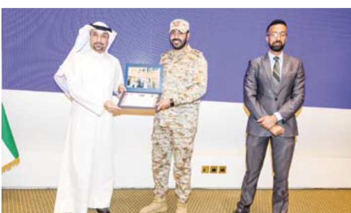
تكريم أحد المشاركين في الدورة

وأعرب الكندي عن شكره للمشاركين على اجتيازهم الدورة بنجاح مثنياً جهود المدربين من القيادة البرية لحلف شمال