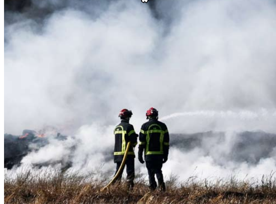
رجال إطفاء فرنسيون يعملون على إخماد حريق

اندلع حريق هائل في الغابات بجنوب فرنسا، مما أجبر عشرات السكان على إخلاء منازلهم، في حين تواصل فرق الطوارئ جهودها لإخماد النيران التي أجمعتها الظروف المناخية القاسية.