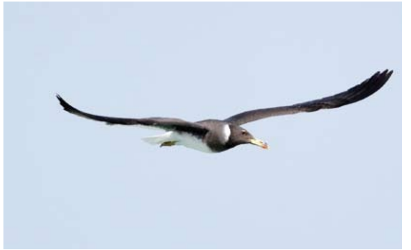
النورس الأسحم يصنف من الطيور الطارئة

عددها الى 426 نوأ. وأوضح أن هذا النورس يسمى محلياً (جنه) ويفرخ في بعض الجزر والسواحل في البحر الأحمر ويتواجد في جنوب الخليج العربي وفي دولة الإمارات العربية المتحدة وسلطنة عمان وجنوب باكستان وصولاً إلى شرق إفريقيا. وأقاد الشاهين بان هذا الطائر يتغذى على