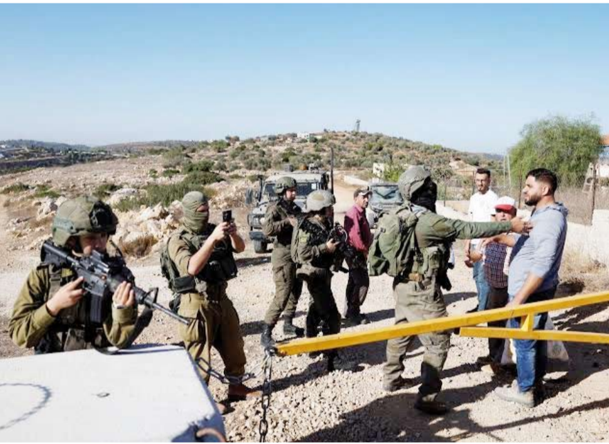
جيش الاحتلال يعتقل 20 فلسطينياً على الأقل

إلى 42 صحفياً، وفق النادي. وقال نادي الأسير الفلسطيني إن سلطات الاحتلال تستمر في تنفيذ حملات اعتقال يومية بمختلف أنحاء الضفة الغربية «في إطار سياسة عقاب جماعي». ويواجه النساء استهدافاً متصاعداً عبر حملات الاعتقال المتواصلة، ويشمل ذلك اتخاذهم رهائن والاعتقالات الليلية للمنزل وأساليب التحقيق القاسية. ورجح النادي في بيان نقلته عنه وكالة الأنباء الفلسطينية ارتفاع عدد المعتقلين إلى 24 ألف فلسطيني منذ بدء حرب الإبادة في 7 أكتوبر 2025. وفق إحصاءات نادي الأسير الفلسطيني، اعتقل جيش الاحتلال منذ ذلك التاريخ أكثر من 765 امرأة فلسطينية بينهن قنيتات قاصرات ومسنيات. كما صعد الجيش الإسرائيلي والمستوطنون اعتداءاتهم في الضفة الغربية المحتلة، بما فيها القدس الشرقية، مما أسفر عن مقتل أكثر من 1173 فلسطينياً وإصابة آلاف آخرين، وفق معطيات فلسطينية رسمية.