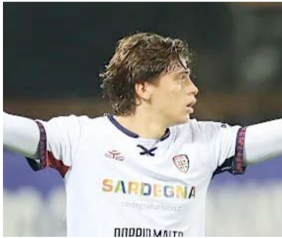
المدافع ماركو باليسترا

الممتاز في المركز العاشر، وسيساهل مشواره في الموسم الجديد 2026-2027 بمواجهة فولهام في الرابع والعشرين من أغسطس المقبل.