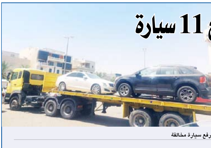
رفع سيارة مخالفة

أعلنت إدارة العلاقات العامة في بلدية الكويت مواصلة الفرق الميدانية لإدارات النظافة العامة واشغالات الطرق تكتيف جولتها التفقيسية لرصد وإزالة مخالفات لأحتي النظافة واشغالات الطرق البلدية في كافة المحافظات وتفعيل الدور الرقابي للأجهزة الرقابية لتطبيق قوانين البلدية .