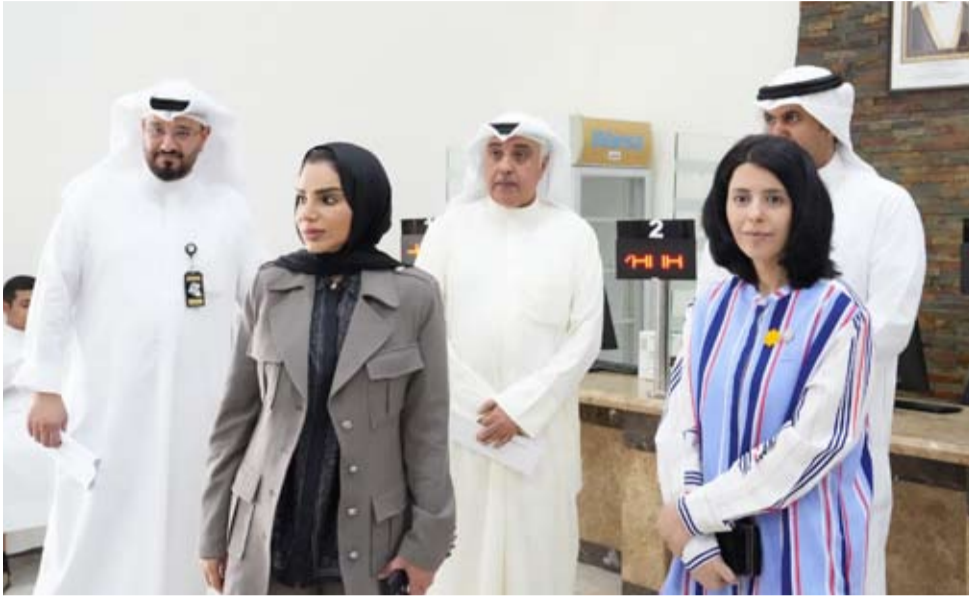
الحويولة خلال جولتها التقفدية في صالات استقبال المراجعين