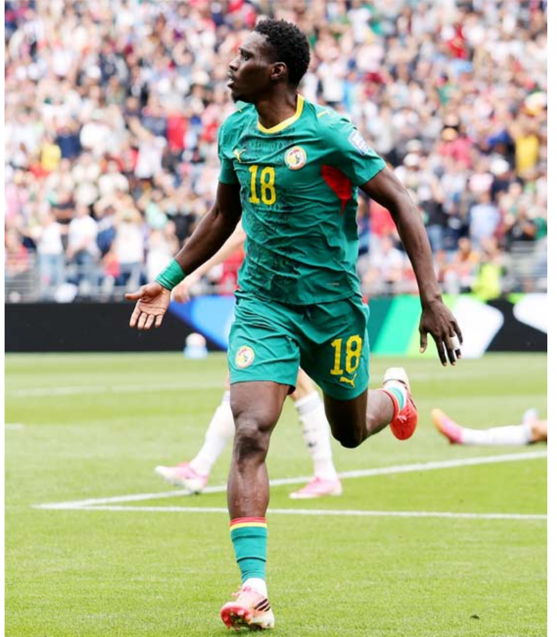
السنغال فرط في فوز كان في المتناول

وتحدّث ثياو عن المباراة قائلاً: «إنها خسارة قاسية، فقد كنا جيدين في اللقاء. كنا متقدمين 2-0 صفر، لكن مباراة كرة القدم لا يتم حسمها في 85 دقيقة. لقد عاد المنتخب البلجيكي، ولم نتحمّن من مجازاتهم. نهنئ بلجيكا على تأهلها».