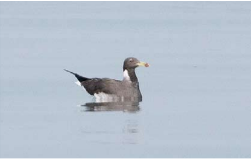
رصد النورس في جون الكويت