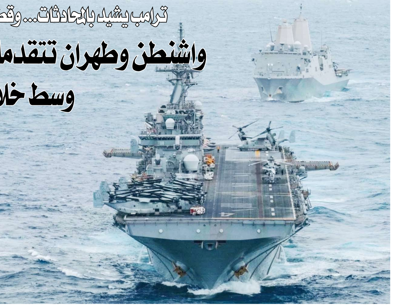
انتشار عسكري أميركي مقرر في الشرق الأوسط

للضربات كاد ينسف وقف إطلاق النار. وقال مسؤول أميركي رفيع لشبكة «فوكس نيوز» إن المحادثات تحقق «تقدماً جيداً»، وإن ويتكوف وكوشنر أجريا محادثات «إيجابية للغاية»، مع قادة إقليميين. وأضاف أن السفن تعبر مضيق هرمز بمعدلات أعلى، بينما تتراجع أسعار النفط.