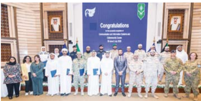
المشاركون ومنظمو دورة أنظمة المعلومات والعمليات السيبرانية