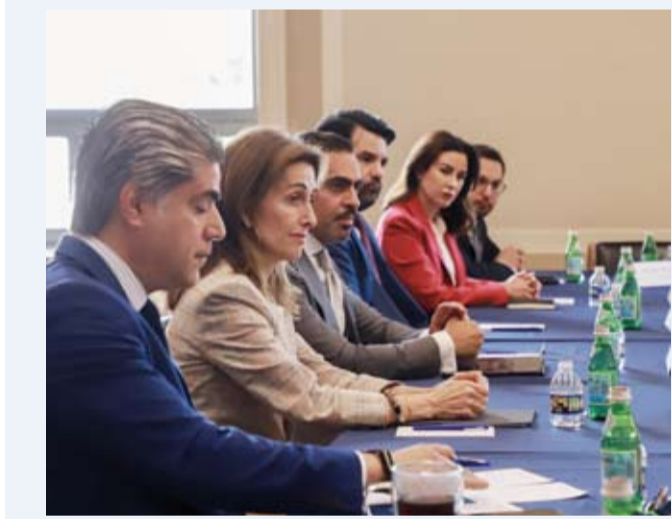
الشيخة الزين الصباح خلال مشاركتها في الاجتماع المشترك

شاركت سفيرة دولة الكويت لدى الولايات المتحدة الشيخة الزين الصباح، أول أمس، في الاجتماع المشترك الذي جمع سفراء دول مجلس التعاون لدول الخليج العربية والأردن مع رئيس لجنة الشؤون الخارجية في مجلس النواب الأمريكي النائب براين ماست وعدد من كبار أعضاء اللجنة. وذكرت سفارة دولة الكويت لدى الولايات المتحدة -في بيان- أن المباحثات خلال هذه الجلسة رفيعة المستوى تناولت آخر المستجدات الإقليمية إلى جانب استعراض الجهود المشتركة الرامية إلى تعزيز الأمن والاستقرار في المنطقة.