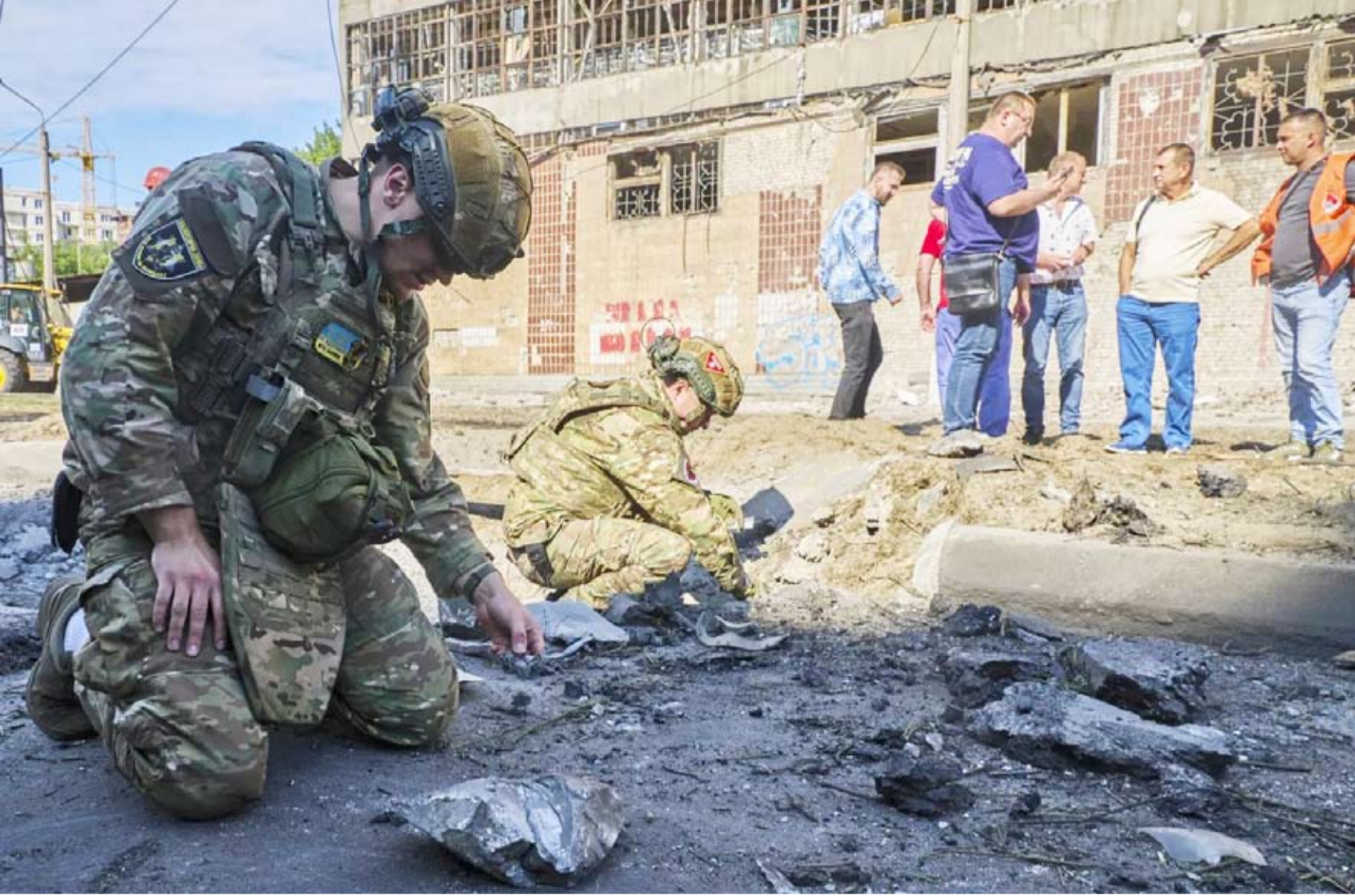
خبراء أوكرانيون يعملون في موقع غارة جوية روسية

هزت هجمات روسية بالصواريخ والطائرات المسيّرة كيف، بعدما حذر الرئيس فولوديمير زيلينسكي من أن موسكو تستعد لشن «هجوم ضخم».