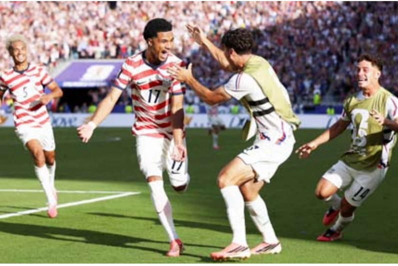
فرحة أميركية بالثنائية

وأكمل منتخب البلد المستضيف للبطولة، بالشاركة مع المكسيك وكندا، لمواجهة بـ10 لاعبين بعد طرد بالوغون ببطاقة حمراء مباشرة في الدقيقة 64. وضربت الولايات المتحدة موعداً في دور الـ16 مع بلجيكا الفائزة على السنغال 3-2 بعد التمديد (2-2 في الوقت الأصلي)، وذلك في مدينة سياتل الأميركية، الاثنين المقبل.