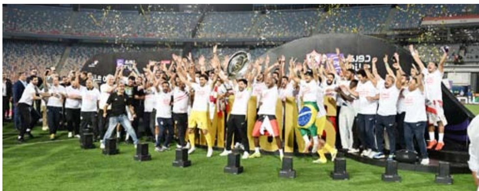
الزمالك بطل الدوري المصري في نسخته الأخيرة