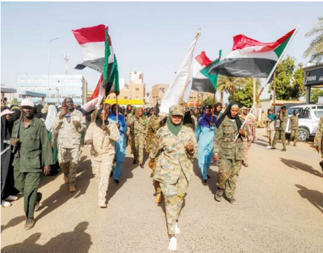
أعضاء من «المقاومة الشعبية» المؤيدة للجيش

أن الجيش تمكن من استعادة زمام المبادرة، متوقفاً أن تشهد المرحلة المقبلة تطورات ميدانية جديدة في دارفور. وتأتي المعارك في دارفور في وقت تتجه فيه الأنظار إلى مدينة الأبيض، التي تشهد تصعيداً عسكرياً متزايداً، مع استمرار الهجمات بالطائرات المسيّرة وتخفيف الحشود العسكرية على الأرض، رغم الدعوات الدولية المطالبة بوقف العمليات العسكرية وتجنباً لتوسع رقعة النزاع. وقال رئيس هيئة أركان الجيش السوداني السابق، هاشم عبد المطلب، في تصريحات لـ«الشرق الأوسط»، إن الجيش والقوات المتحالفة معه نفذوا ما وصفه بـ«مناورة ناجحة»، أعادت المعارك إلى إقليم دارفور، معتبراً أن هذه الخطوة تعكس تطوراً في إدارة العمليات العسكرية. وأضاف عبد المطلب أن الجيش تمكن من استعادة زمام المبادرة، متوقفاً أن تشهد المرحلة المقبلة تطورات ميدانية جديدة في دارفور، مشيراً إلى أن التقدم الأخير في غرب وشمال الإقليم يأتي ضمن خطط عسكرية أعلن عنها سابقاً مساعد القائد العام للجيش، الفريق ياسر العطا.