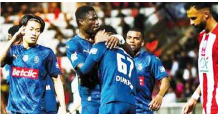
فوز مريح لستاد ريمس على مضيفه كان من الدرجة الرابعة