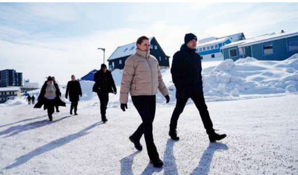
رئيسة الوزراء الدنماركية ميت فريديكسن

قالت رئيسة الوزراء الدنماركية ميت فريديكسن، بعد وصولها إلى جزيرة غرينلاند في زيارة تستغرق ثلاثة أيام، إن الولايات المتحدة لن تسيطر على الجزيرة، وفقاً لـ«رويترز». بشار إلى أنّ غرينلاند هي أراض تابعة للدنمارك، وهي حليف للولايات المتحدة بحلف شمال الأطلسي (الناتو). ويريد ترمب ضم هذه الأراضي، مدعياً أنها ضرورية لأغراض الأمن الوطني. وقال رئيس وزراء غرينلاند ينس فريديك قبل أيام إن الولايات المتحدة لن تستولي على غرينلاند، وذلك رداً على رغبة الرئيس الأميركي دونالد ترمب في السيطرة على المنطقة الشاسعة الواقعة في القطب الشمالي. ووفقاً لـ«رويترز»، أضاف في منشوره على «فيسبوك»: «يقول الرئيس ترمب إن الولايات المتحدة ستستولي على غرينلاند، دعوني أوضح: الولايات المتحدة لن تبلغ مرادها. نحن لا ننتهي إلى أي جهة أخرى. نحن من يحدد مستقبلنا». وكان ترمب قد قال لشبكة «إن بي سي نيوز» إنه أجرى «محاادثات جادة» بخصوص ضم الإقليم الدنماركي شبه المستقل، وأضاف: «سنستولي على غرينلاند، نعم بنسبة 100 في المائة».