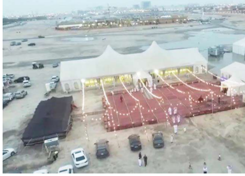
خيام مناسبات مؤقتة

تسائل عدد كبير من أصحاب خيام المناسبات المؤقتة عن صحة ما تناولته إحدى الصحف الكويتية مؤخراً عن إيقاف العمل بلائحة الخيام المؤقتة وما البدل عنها في ظل قيام بلدية الكويت بإنذار أصحاب تلك الخيام بإزالتها من المواقع التي نصبوا فيها خيامهم في جميع محافظات الكويت مع اتباع النظم واللوائح التي تنظم إصدار ترخيص خيام المناسبات حتى نفت البلدية هذا الخبر وطالبة بضرورة التزام وسائل الإعلام بعدم نشر المعلومات غير الصحيحة، داعية المواطنين لأخذها من مصادرها الرسمية.