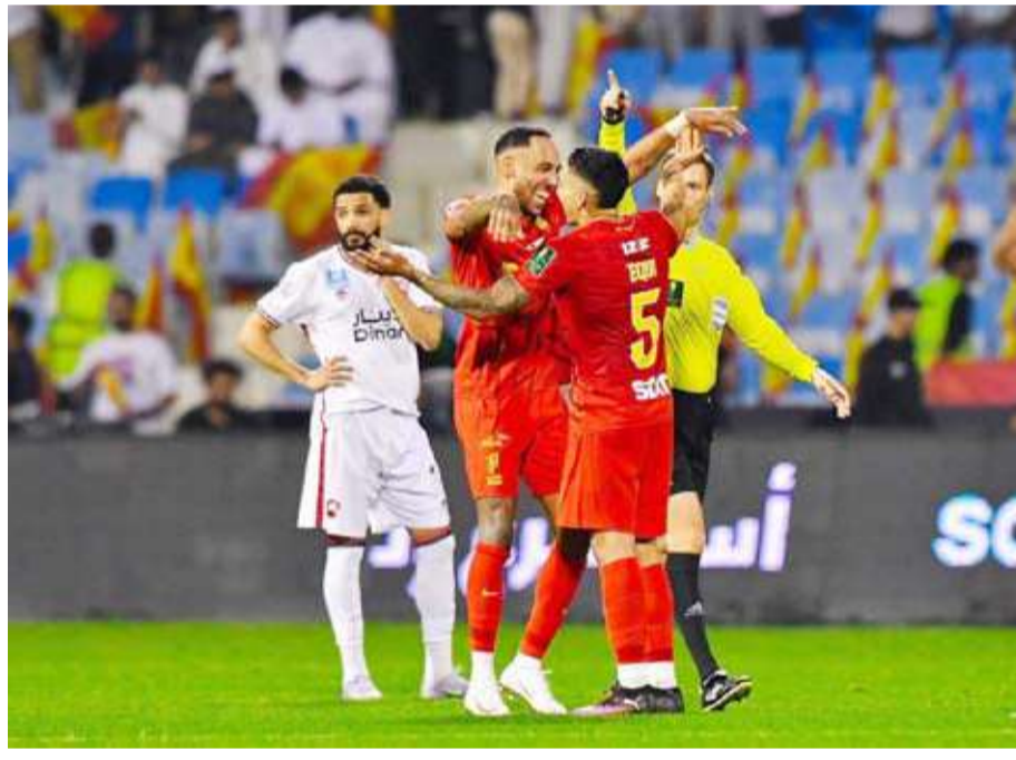
جانب من احتفال لاعبي القادسية بالفوز

تاهل فريق القادسية إلى نهائي بطولة كأس خادم الحرمين الشريفين لكرة القدم موسم 2024 - 2025، ولأول مرة في تاريخه بعد فوزه على نظيره الرائد بهدف دون مقابل، وذلك في مواجهة التي جمعتها في الدور نصف النهائي من المسابقة.