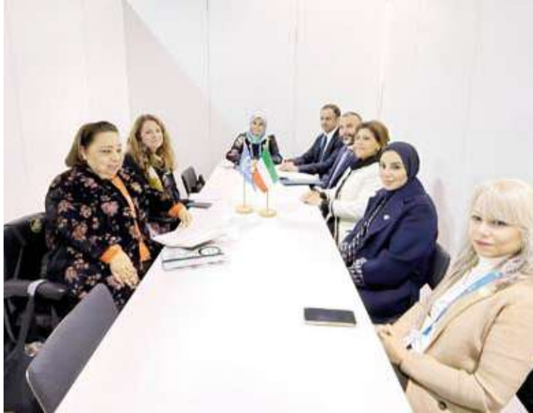
أعضاء الوفد الكويتي برئاسة الحويلة والمقررة الخاصة المعنية بحقوق الأشخاص ذوي الإعاقة في الأمم المتحدة الدكتورة هبة هجرس