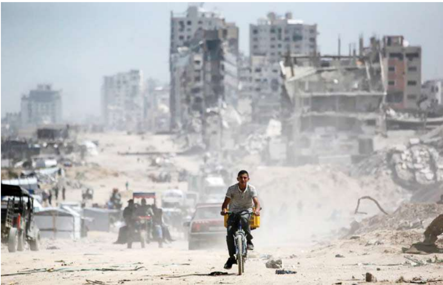
طريق الرشيد الذي يربط شمال وجنوب الأراضي الفلسطينية

مباشراً بينها وبين عملية الاستهداف في بيروت. وكان الجيش الإسرائيلي قال، إنه استهدف ما وصفه بأنه أحد عناصر الوحدة 3900 في «حزب الله» اللبناني وفيلق القدس التابع للحرس الثوري الإيراني في هجوم شنته بطائرات حربية على ضاحية بيروت الجنوبية. شت سلاح الجو الإسرائيلي، غارات على أكثر من 50 موقعا تابعا لحركة «حماس» وجماعات إرهابية أخرى، تمهيدا لشن هجوم بري واسع النطاق على جنوب قطاع غزة، وفقاً للجيش الإسرائيلي. وبحسب تقرير نشرته صحيفة «تايمز أوف إسرائيل»، خلال النهار، نفذ الجيش عشرات الغارات الأخرى في أنحاء غزة خلال. ويهدف الهجوم الأخير في جنوب غزة إلى تطويق رفح، وإنشاء ما يسمى بممر موراج، الواقع بين رفح وخان يونس. وتعد المنطقة الواقعة بين رفح وخان يونس من المواقع القليلة في غزة، التي لم تنفذ فيها القوات البرية عمليات بعد. وأصدر جيش الدفاع الإسرائيلي تحذيرات إخلاء للفلسطينيين في المنطقة، تمهيدا للهجوم. وفي الوقت نفسه، أعلن جيش الدفاع الإسرائيلي أنه يعمل على توسيع المنطقة العازلة على طول الحدود، شمال القطاع ويشدد الجيش على أن الهدف النهائي من الهجوم البري الجديد في رفح، جنوب غزة، هو الضغط على «حماس» لإطلاق سراح الرهائن، كما صرح رئيس أركان جيش الدفاع الإسرائيلي، إيل زامير.