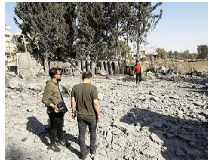
آثار قصف الكيان المحتل في جنوب سورية

وقالت الخارجية السورية، في بيان، أمس: إن القوات الإسرائيلية شنت مساء الأربعاء، غارات على 5 مناطق بأحياء البلاد خلال 30 دقيقة، ما أسفر عن تدمير شبه كامل لمطار حماة العسكري.