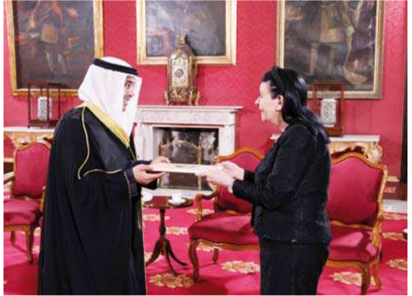
السفير مشعل المصفي يقدم أوراق اعتماده إلى رئيسة مالطا

قدم السفير مشعل المصفي، أول أمس، أوراق اعتماده إلى رئيسة جمهورية مالطا د. ميريام سبيتيري ديبونو سفيراً فوق العادة مفوضاً لدولة الكويت لدى جمهورية مالطا الصديقة وذلك خلال مراسم جرت في القصر الرئاسي. وذكرت سفارة الكويت لدى مالطا في بيان لـ (كونا)، أن السفير المصفي نقل إلى رئيسة مالطا أطيب تحيات صاحب السمو أمير البلاد الشيخ مشعل الأحمد وأصدق تمنيات سموه لها وإلى شعب مالطا الصديق وحرص