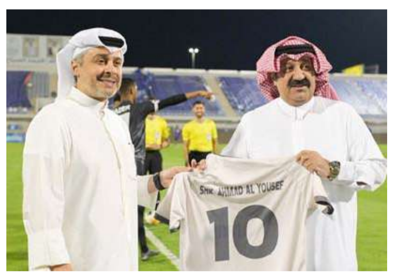
اليوسف من ملعب مباراة الجهراء والجزيرة

أكد رئيس الاتحاد الكويتي لكرة القدم الشيخ أحمد يوسف أنه يأمل في زيادة عدد الفرق المشاركة في مسابقات الاتحاد اعتباراً من الموسم المقبل بواقع 6 إلى 8 أندية جديدة. ويشترك في مسابقات الاتحاد الكويتي 15 نادياً، بما يعني أن العدد سيقرّب 21 نادياً على الأقل اعتباراً من الموسم المقبل. وقال اليوسف بعد مباراة الجزيرة الوافد الجديد على مسابقات الاتحاد الكويتي لكرة القدم، إنه كان حريصاً على مشاركة الجزيرة في مسابقات الاتحاد بالموسم الحالي، لتقديمه إلى القطاع الخاص كمنوذج يحتذى به، لافتاً إلى أن الاتحاد تلقى العديد من المطالبات من أندية جديدة على أن يتركز الاختيار على الأندية الأكثر ملاءة مالية.