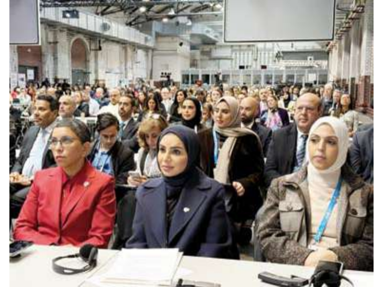
د. أمثال الحويلة وسفيرة الكويت في ألمانيا ريم الخالد