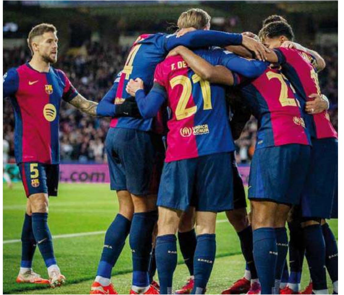
برشلونة ينتظر مواجهات حاسمة في الليغا

في المقابل، يتطلع فالنسيا لتحقيق انتصاره الثاني على التوالي وحصد ثلاث نقاط إضافية تساعده في التقدم خطوة بجدول الترتيب، والدخول أكثر في المنطقة الآمنة، حيث يحل بالمرکز الخامس عشر برصيد 31 نقطة، بفارق أربع نقاط أمام ليغانيس صاحب المركز الثامن عشر. ويلتقي جيرونا مع ديبورتيفو ألافيس، وريال مايوركا مع سلتا فيغو في بقية المباريات التي تقام بعد غد السبت. وافتتح منافسات هذه الجولة اليوم الجمعة، حينما يلتقي رايو فايكانو مع إسبانيول، وتستكمل مباريات هذه الجولة الأحد المقبل، حينما يلتقي أشبيلية مع أتلتيكو مدريد، الذي يسعى لاستعادة توازنه بعدما فشل في تحقيق أي انتصار في آخر ست مواجهات بكافة البطولات. ولم يحقق أتلتيكو أي فوز في آخر ثلاث مباريات له بالدوري، ويسعى لتحقيق الفوز بهذه المباراة من أجل العودة لدائرة المنافسة لاسيما وأنه يتواجد في المركز الثالث برصيد 57 نقطة بفارق تسع نقاط عن برشلونة أتلتيكو. وفي بقية المباريات التي تقام يوم الأحد، يلتقي لاس بالماس مع ريال سوسيداد، وبلد الوليد مع خيتافي، وفيار ريال مع أتلتيك بيلباو. وتختتم منافسات هذه الجولة يوم الإثنين المقبل، حينما يلتقي ليغانيس مع أوساسونا.