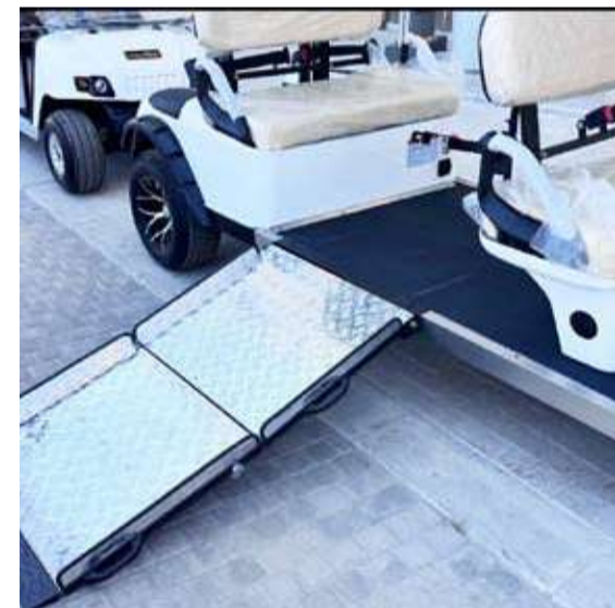
توفير وسيلة نقل كهربائية لذوي الإعاقة

جامعة الكويت تؤكد على أهمية دعم مرضى التوحد