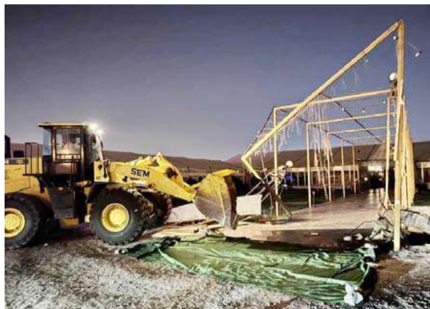
البلدية بعد ازالته للخيام المخالفة

كما اشترطت أن يكون للشركة أو المؤسسة ترخيص تجاري ساري المفعول طوال موسم الترخيص، والحصول على موافقة الهيئة العامة للبيئة، إضافة إلى موافقة الهيئة العامة للغذاء والتغذية، والالتزام بشروطها، مع توافر البطاقات الصحية للعامل سارية الصلاحية، والالتزام