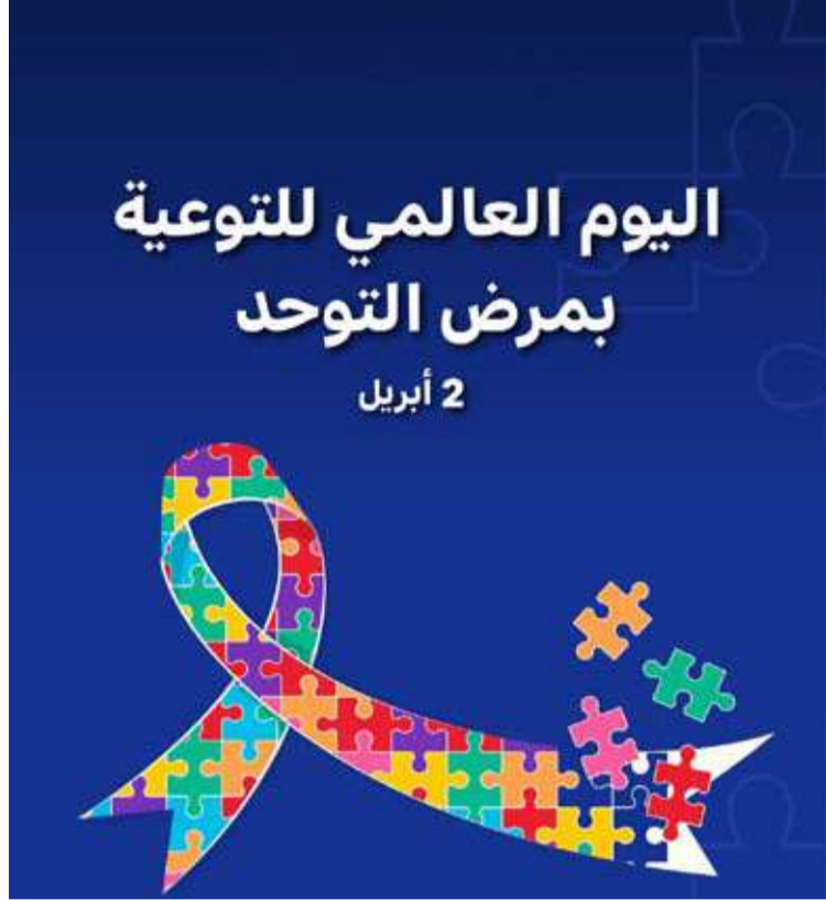
شعار اليوم العالمي لمرض التوحد

بأقرانه وغيرها. وشددت الجذوع على أهمية تكاتف الأسر مع (هيئة الإعاقة) للتدخل المبكر عند اكتشاف الصالة في حال وجودها بهدف الوصول إلى أفضل النتائج للحد من ثقافتها. وذكرت أن الهيئة تسعى لتحقيق رؤية (الكويت جديدة 2035) الرامية لتطوير جميع الخدمات المقدمة للمصابين منها البرامج التعليمية التي جانب تصافر الجهود بين المؤسسات والجهات الحكومية والقطاع الخاص لوضع استراتيجيات وتقديم أفضل البرامج والاختبارات الخاصة بالأطفال من ذوي التوحد.