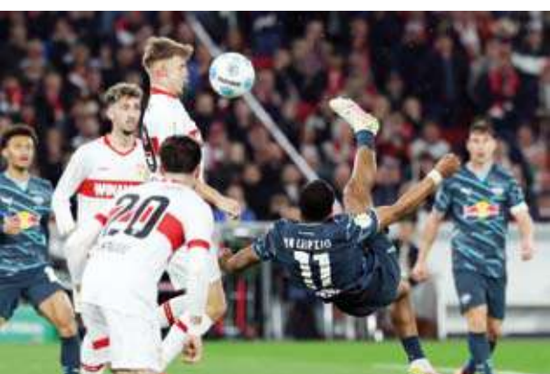
مباراة متوسطة المستوى سيطر شتوتجارت على العديد من فتراتهما

الثاني، في الوقت الذي حاول فيه لايبزيغ العودة وقلص الفارق لهدف واحد قبل أن يقضي شتوتجارت على أماله منافسه بتسجيل الهدف الثالث والذي حسم به تاهله على الرغم من محاولات لايبزيغ البات بالفشل. وتاهل شتوتجارت إلى النهائي لمواجهة فريق آر مينيا بيلفيلد الذي يلعب في دوري الدرجة الثالثة الألماني، والذي فجر مفاجأة من العيار الثقيل بفوزه أمس «الثلاثاء» على باير ليفركوزن حامل اللقب بهدفين مقابل هدف. وتقام المباراة النهائية لكأس ألمانيا يوم 24 مايو المقبل.