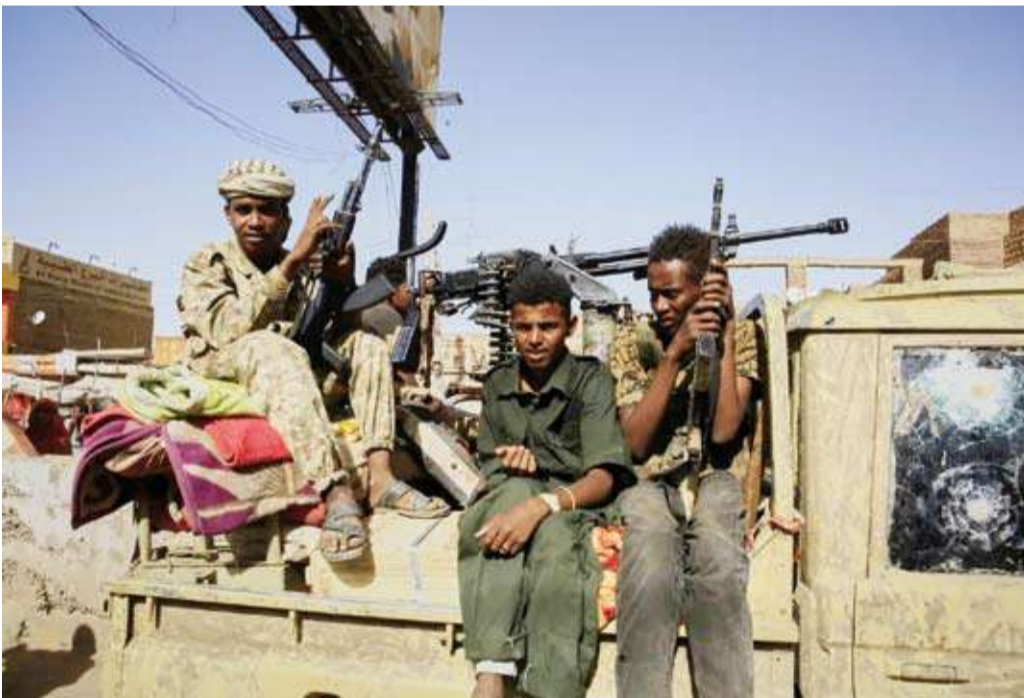
جنود في منطقة استعادها الجيش السوداني

قتل 85 شخصاً وأصيب عشرات في هجمات تشنها «قوات الدعم السريع»، منذ أسبوع، على قرى تقع إلى الجنوب من الخرطوم، وفق ما أفاد به نشطاء. وجاء في بيان لتنسيقية لجان مقاومة كرري: «لليوم السابع على التوالي... ميليشيا الجنجو يد تواصل هجماتها العنيفة على قرى الجموعية غرب جبل أولياء، ما أسفر عن أكثر من 85 شهيداً وعشرات المصابين والجرحى»، حسيما أفادت به «وكالة الصحافة الفرنسية». يتبادل الجيش السوداني وقوات «الدعم السريع» الاتهامات بشأن انتهاكات «فظيعة» لحقوق الإنسان، يرتكبها كل في مناطق سيطرته، وفي حين نفت منظمات حقوقية ونشطاء، مجازر بشعة بحق مدنيين في المناطق التي استردها الجيش أخيراً، وبخاصة في العاصمة الخرطوم وود مدني، تتضمن القتل على الهوية والتصفية العرقية، والتعذيب البدني والنفسي، والمحاكمات الجائرة، يقول الجيش إن مئات المدنيين قتلوا في سجون «الدعم السريع»، نتيجة للجوء والتعذيب، إلى جانب القتل جراء القصف الجوي والمدفعي من قبل الطرفين. وقال «محامو الطوارئ»، وهم منظمة حقوقية فهدى، في بيان، إنهم وثقوا مقاطع فيديو لتصفيات ميدانية نفذها أفراد من الجيش السوداني، والمجموعات التي تقاوت معه، ضد أسرى ومدنيين في أنحاء جنوب الخرطوم وجبل أولياء، وبزري، والجريف غرب، والصحافات، ومايو، والأزهرى، والكلكلة». وأوضح المحامون أن «عمليات القتل والتصفيات، تزامنت مع حملة مكثفة بوسائل التواصل الاجتماعي، نظمها نشطاء مؤيدون للجيش، لتغطية وتبرير هذه الجرائم، بذريعة التعاون (من الضحايا) مع قوات الدعم السريع». وعذروا ذلك «خرقاً خطيراً للقوانين الوطنية والدولية، وتاجيلاً لخطاب