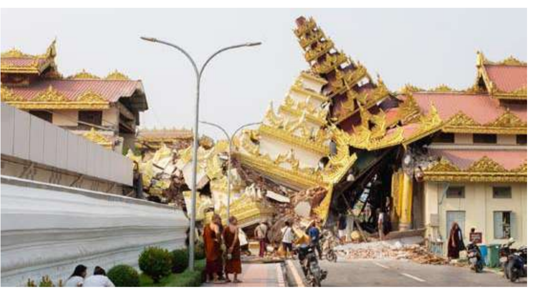
أشخاص ينظرون إلى معبد منهار

وتدرب على تنفيذ هجمات». وأعلن تحالف من ثلاث جماعات إئتية مسلحة متحدة على المجلس العسكري نية التزام وقف لإطلاق النار من جانب واحد لمدة شهر لأسباب إنسانية. ولقيت خطوة الجيش، إدانة المقرر الأممي الخاص لحقوق الإنسان في بورما توم أندروز الذي اعتبرها «مشيئة ويجب على قادة العالم إدانتها». وارتد النزاع المدني الذي اندلع عقب الانقلاب الذي أطاح في الأول من فبراير 2021 حكومة أونغ سان سو تشي المنتخبة، سلباً على نظام الصحة الذي كان وضعه مقلقاً أصلاً قبل الزلزال. مع تسبب المعارك بنزوح أكثر من 3.5 مليون شخص في وضع هش، بحسب الأمم المتحدة.