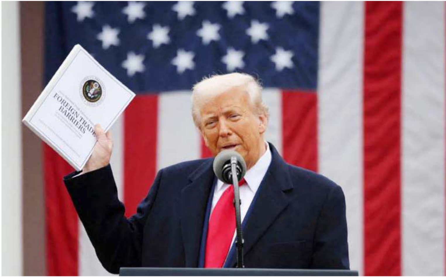
ترامب يحمل وثيقة «حواجز التجارة الخارجية»

بلاده من الأتحاد الأوروبي، داعياً الدول الـ27 الأعضاء في التكتل إلى الرد على واشنطن بطريقة «متناسبة». كولومبيا: اعتبر الرئيس الكولومبي غوستافو بترو، أنّ «الحكومة الأميركية تعتقد أنّ زيادة الرسوم الجمركية على وارداتها عموماً قد تزيد الإنتاج والثروة والعمالة. برأيي، قد يكون هذا خطأ فادحاً». الدنمارك: قال وزير الخارجية الدنماركي لارس لوك راسموسن، إنّ «الجميع استفادوا من التجارة العالمية (...) لا أفهم لماذا تريد الولايات المتحدة شنّ حرب تجارية على أوروبا. لا أحد ينتصر، الجميع خاسرون»، مؤكداً أنّ «أوروبا ستبقى موحدة. أوروبا ستقدم ردوداً قوية ومنتاسبة». سويسرا: أكدت الرئيسة كارين كيلر-سوتر، التي فرض ترمب على بلادها رسوماً جمركية بنسبة 31 في المئة، أنّ «المصالح الاقتصادية الطويلة الأمد للبلاد تشكل الأولوية». بكين: أعلنت الصين، أنها «تعارض بشدة» الرسوم الجمركية الأميركية الجديدة على صادراتها، متعهداً باتخاذ «تدابير مضادة لحماية حقوقها ومصالحها». طوكيو: حذرت اليابان، من أنّ الرسوم الجمركية الجديدة التي فرضها ترمب قد تنتهك قواعد منظمة التجارة العالمية والمعاهدة التجارية المبرمة بين البلدين. تايوان: أعلن رئيس الوزراء التايواني بايتو نغتانغ شيناواترا، أنّ بلاده لديها «خطة قوية» للتعامل مع الرسوم الجمركية التي فرضها ترمب على صادراتها إلى الولايات المتحدة، مؤكداً أنّ باتوكو تأمل بأن تتجبر عبر التفاوض في خفض هذه التعريفات الباهظة البالغة نسبتها 36 في المئة. كوريا الجنوبية: أعرب الرئيس بالإنابة هان داك سو، عن أسفه لأن «حرب الرسوم الجمركية العالمية أصبحت حقيقة»، متعهداً «استخدام جميع موارد الحكومة للتغلب على الأزمة التجارية».