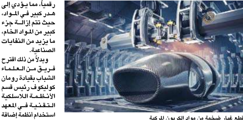
قطع غيار ضخمة من مواد الكربون المركبة

يذكر أن تقنية الطباعة ثلاثية الأبعاد المبتكرة تتيح إنتاج أجزاء يزيد حجمها عن 10 أمتار في كل من الأبعاد الثلاثة (XYZ). وتكمن أهمية الابتكار في الاستغناء عن الآلات التقليدية واستخدام رؤوس طباعة مثبتة على روبوتات متحركة ذات عجلات. ويعتمد النظام على التحكم في سرب من الروبوتات، مما يزيد إلى حد بعيد من سرعة الطباعة.