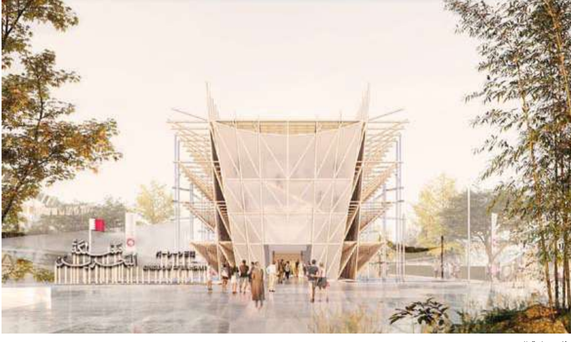
جنح مملكة البحرين