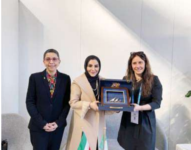
وزير الشؤون الاجتماعية تلتقي نظيرتها الإيطالية