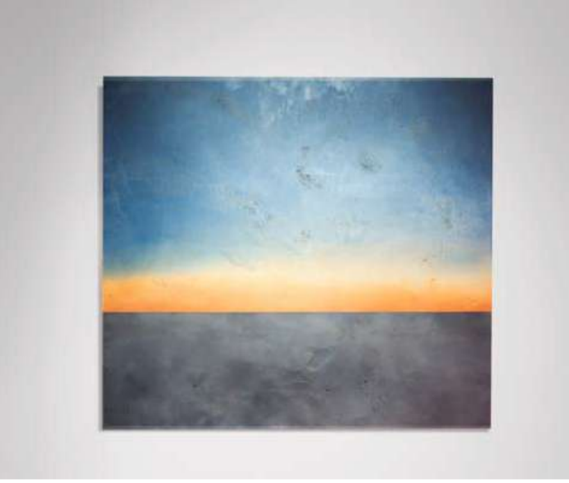
أحد الأعمال الفنية