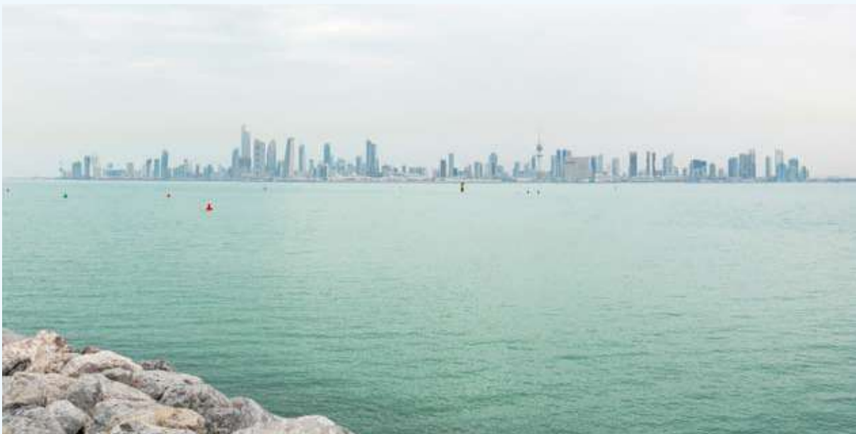
الطقس مائل للحرارة نهاراً

وقال العلي: إن الطقس نهار غد السبت يكون حاراً وغائماً إلى غائم جزئياً والرياح جنوبية شرقية خفيفة إلى معتدلة السرعة تنشط أحياناً مابين 12 و50 مايين و37 و50 كيلومتراً في الساعة مع فرصة لأمطار متفرقة تكون رعدية أحياناً وتتراوح درجات الحرارة العظمى المتوقعة ما بين 35 و37 درجة مئوية ويكون البحر معتدلاً إلى عالي الموج ما بين 3 و6 أقدام. وأشار إلى أن الطقس السبت ليلاً يكون معتدلاً إلى مائل للبرودة وغائماً جزئياً إلى غائم والرياح جنوبية شرقية إلى شمالية غربية خفيفة إلى معتدلة السرعة ما بين 10 و32 كيلومتراً في الساعة مع فرصة لامطار خفيفة متفرقة وتكون الضباب على بعض المناطق وتتراوح درجات الحرارة الصغرى المتوقعة ما بين 21 و22 درجة مئوية ويكون البحر خفيفاً إلى معتدل الموج ما بين 2 و4 أقدام.