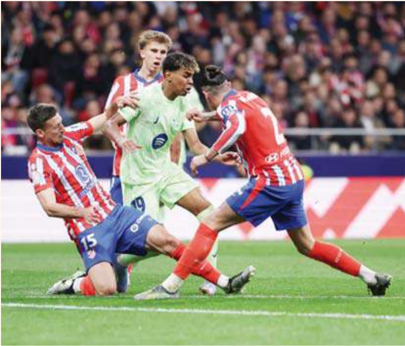
لامين يامال يقود هجمة خطيرة لبرشلونة على مرمرى أتلتيكو

.. ويضرب موعداً مع ريال مدريد في نهائي كأس الملك