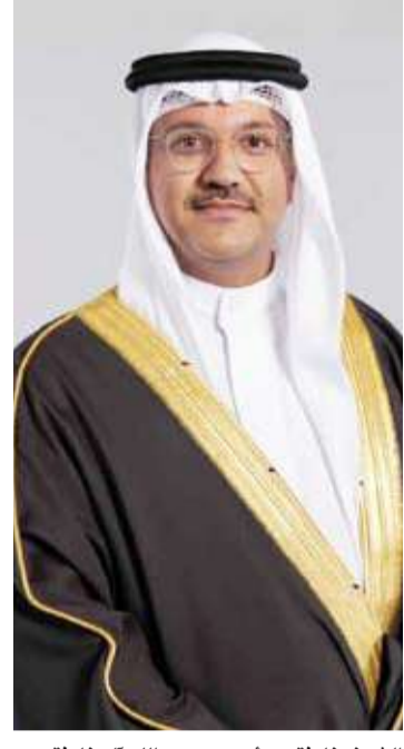
الشيخ خليفة بن أحمد بن عبدالله آل خليفة

تستعد مملكة البحرين لافتتاح مشاركتها الوطنية الرابعة في الإكسبو العالمي، وذلك خلال أقل من شهر، في إكسبو 2025 أوساكا في منطقة كانساي باليابان في الفترة من 13 أبريل إلى 13 أكتوبر الجاري، والمقام هذا العام تحت شعار «ابتكار المستقبل لتحسين حياة المجتمعات»، والمتضمن ثلاثة مواضيع فرعية تشمل: «ضمان استدامة الحياة»، و«حسية الحياة»، و«تعزيز الحياة عبر التواصل».