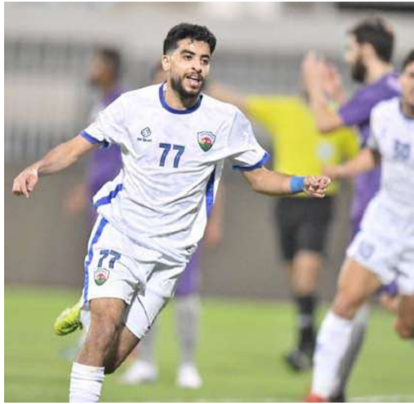
فرحة لاعبي الجهراء بالتسجيل

وبهذا الفوز ضرب الجهراء موعداً مع الكأس في ربيع نهائي البطولة في الثالث والعشرين من الشهر الجاري، فيما ودع الجزيرة في ظهوره الأول في مسابقات الاتحاد الكويتي بالمنافسات. هذا وقام رئيس مجلس إدارة الاتحاد الكويتي لكرة القدم الشيخ أحمد يوسف التهنئة لنادي الجزيرة على أولى مشاركاته في مسابقات الاتحاد الكويتي.