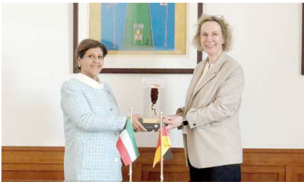
السفيرة جواهر الصباح مع مدير إدارة ملف حقوق الإنسان بوزارة الخارجية الألمانية جيسا براوتغرام

بحثت مساعد وزير الخارجية الكويتي لشؤون حقوق الإنسان، السفيرة جواهر الصباح، أول أمس، مع مسؤولين ألمان سبل تعزيز العلاقات بين البلدين في مجال حقوق الإنسان. وجاء اللقاء على هامش مشاركة السفير جواهر الصباح في قمة الإعاقة العالمية التي بدأت أعمالها بالعاصمة الألمانية برلين، الأربعاء، وتستمر حتى الخميس. وقالت السفيرة جواهر الصباح في تصريح لـ (كونا): إنها بحثت مع مدير إدارة ملف حقوق الإنسان والصحة العالمية بوزارة الخارجية الألمانية جيسا براوتغرام آليات وسبل تعزيز العلاقات بين البلدين الصديقين في جميع المجالات وذلك في إطار عضويتها في مجلس حقوق الإنسان التابع للأمم المتحدة. وشمل برنامج السفير جواهر الصباح في اليوم الأول من المؤتمر الدولي لقاء مسؤولين رفيعي المستوى من بينهم وزير التنمية والتعاون الاقتصادي الاتحادي الألمانية سفيتينا شولتسه.