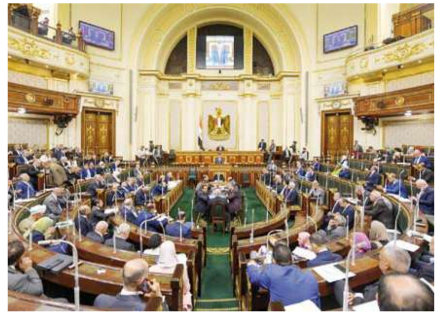
مجلس النواب المصري

على الرغم من توافق عدد من القوى السياسية المصرية على ضرورة إدخال تعديلات على قوانين الانتخابات البرلمانية، وصيغة النظام الانتخابي، فإن تلك المطالب «تصطدم بضيق الوقت»، مع اقتراب الاستحقاق الانتخابي نهاية العام، مما رجح الإبقاء على نظام الانتخابات «المختلط» القائم حالياً. ومن المقرر إجراء انتخابات مجلسي النواب والشيوخ قبل نهاية العام الحالي، وفقاً لنصوص الدستور التي تقضي بإجراء الانتخابات قبل 60 يوماً من انتهاء مدة المجلسين الحالية، وهو ما يعني الدعوة إلى انتخابات «الشيوخ» في أغسطس المقبل، يلي ذلك إجراء انتخابات النواب، في نوفمبر قبل نهاية فترة المجلس الحالي، في يناير 2026. ووفق القانون تُجرى انتخابات المجلسين بنظام مختلط، بواقع 50 في المائة بالنظام الفردي، و50 في المائة بنظام القوائم المغلقة المطلقة، مع أحقية الأحزاب والمستقلين في الترشح بكليهما معاً، غير أن أحزاباً وقوى سياسية تطالب بتعديله، وجرت بالفعل مناقشة عدد من المقترحات بشأنها في جلسات «الحوار الوطني».