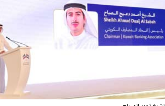
الشيخ أحمد الصباح