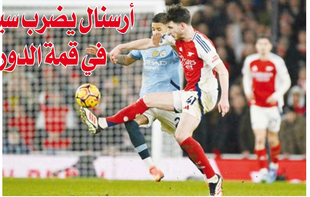
هزيمة ثقيلة لكتيبة غوارديولا

متتالية، سجلها توماس بارتي ولويس سكيلني وكاي هافيرتز وإيثان نوانيري في الدقائق 56 و62 و76 والدقيقة الثالثة من الوقت المحتسب بدلًا عن الضائع. والفوز هو الرابع عشر لآرسنال هذا الموسم ليرفع رصيده إلى 50 نقطة في المركز الثاني بفارق ست نقاط خلف ليفربول المتصدر. في المقابل مني مانشستر سيتي بالخسارة السادسة له هذا الموسم وتجمد رصيده عند 41 نقطة في المركز الرابع، كما فشل في الفوز على آرسنال للموسم الثاني على التوالي في بطولة الدوري، وللمباراة الخامسة على التوالي في جميع المسابقات. وفي مباريات أخرى ضمن نفس الجولة، فاز كريستال بالاس على مانشستر يونايتد (2-صفر). وسجل الهدفين اللاعب جون فيليب مانيتا في الدقيقتين 64 و89.