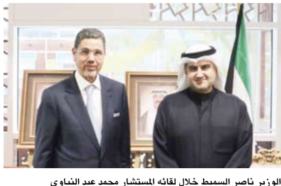
الوزير ناصر السميح خلال لقائه المستشار محمد عبد النباوي

بحث وزير العدل ناصر السميح مع الرئيس الأول لمحكمة النقض بالمملكة المغربية الرئيس المنتخب للمجلس الأعلى للقضاء للسلطة القضائية المستشار محمد عبد النباوي أوجه التعاون المشترك. وذكرت وزارة العدل في بيان على موقع التواصل الاجتماعي «إكس»، أمس، أنه تم خلال اللقاء بحث سبل التعاون في المجال القضائي والقانوني وتطويره بين البلدين الشقيقين. وأكد الوزير السميح وفق البيان عمق العلاقات التاريخية المشتركة بين البلدين وأهمية العمل على تطويرها والارتقاء بها وتعزيزها على جميع الأصعدة. وحضر اللقاء سفير المملكة المغربية لدى دولة الكويت علي ابن عيسى وقاضٍ رئيس قطب الشؤون القانونية والدراسات بالمجلس الأعلى للسلطة القضائية شكير فتوح ومنتدب قضائي من الدرجة الممتازة ورئيس ديوان الرئيس المنتخب للمجلس الأعلى للسلطة القضائية قدور الحجاجي.