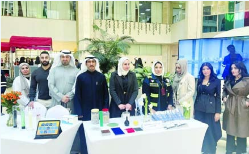
الرشديدي يشارك موظفي الوزارة احتفالهم