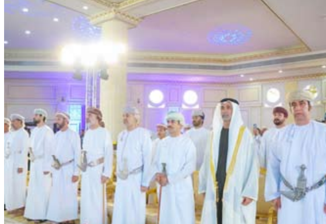
جانب من أعمال الملتقى

رعى حفل الافتتاح معالي الدكتور عبدالله بن ناصر الحراسي وزير الإعلام، بحضور سعادة خالد بن هلال المعولي رئيس مجلس الشورى، وسعادة السيد الدكتور حمد بن أحمد اليوسعدي محافظ البريمي، إلى جانب عدد من أصحاب المصالح والمصالحين من الجهات الحكومية والغرف التجارية والمؤسسات الاقتصادية من الدول العربية، إضافة إلى نخبة من الخبراء والمستثمرين في قطاعي السياحة والاستثمار. ويهدف الملتقى الذي يعقد على مدار يومين إلى مناقشة سبل تعزيز الاستثمارات السياحية في الدول العربية، وتسليط الضوء على المقومات الاقتصادية والسياحية التي تتميز بها محافظة البريمي.