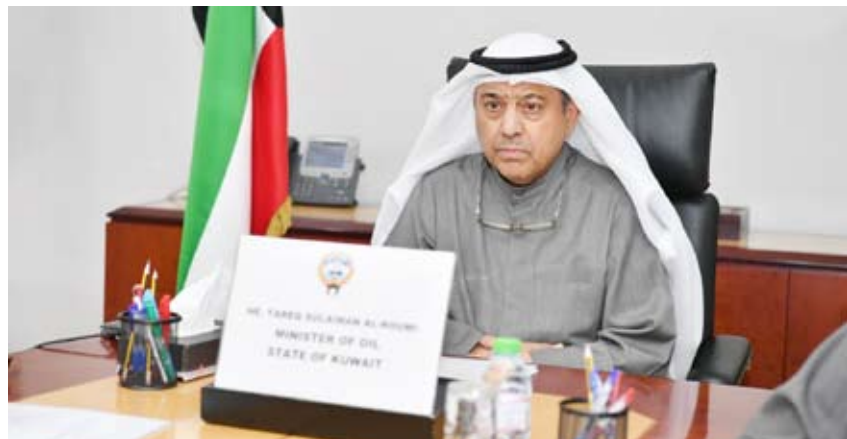
وزير النفط طارق الرومي خلال الاجتماع

الرومي، في تصريح صادر عن وزارة النفط، أن الاجتماع ناقش أحدث التطورات في أسواق النفط العالمية، مشيراً إلى أن تعزيز التعاون بين الدول المنتجة يُعتبر ركيزة أساسية لتحقيق التوازن بين العرض والطلب، وأضاف أن هذا التوازن يعد عاملاً محورياً لضمان استقرار السوق، وأمن الإمدادات لاسيما في ظل التحديات التي تشمل التقلبات الاقتصادية والتوترات الجيوسياسية. وفي ختام تصريحه، أكد الوزير طارق الرومي إلى التزام دولة الكويت بمواصلة تعاونها الوثيق مع شركائها في (أوبك بلس) بما يساهم في تحقيق الأهداف المشتركة وتعزيز التنمية المستدامة.