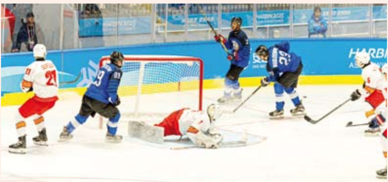
جانب من لقاء الكويت مع قبرغيزستان

التي تقام بمدينة (هارين) عاصمة إقليم (هيلونغجيانغ) شمال شرقي الصين بقوة ليسجل الهدف الأول بالمباراة وفي الدورة الـ3 أن منتخب قبرغيزستان عاد للمباراة ليسجل ثلاثة أهداف قبل ان يستعيد منتخب الكويت زمام المباراة ويحرز أربعة أهداف متتالية وسط تألق لافت للاعبين لينتهي هذا الشوط بالتقدم (3 / 5).