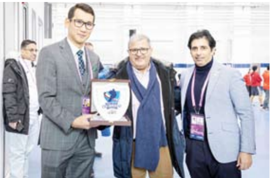
جانب من تكريم رئيس الألعاب الآسيوية الشتوية

مبارك فيصل الصباح حرصت على تسخير كافة الإمكانيات أمام الشباب الرياضي الكويتي المشارك في هذه الدورة التي تقام بمدينة (هارين) عاصمة إقليم (هيلونغجيانغ) شمال شرقي الصين لضمان تحقيقهم أفضل النتائج. وذكر المري ان (الهيئة العامة للرياضة) قدمت بدورها كافة أنواع الدعم للبعثة الكويتية من توفير معسكرات خارجية للفرق المشاركة وكل ما يخص احتياجات ومتطلبات الوفد الكويتي متمنيا ان تكون هذه المشاركة بمناسبة قفزة نوعية في تاريخ مشاركة رياضة الألعاب الشتوية الكويتية بهذه الدورة.