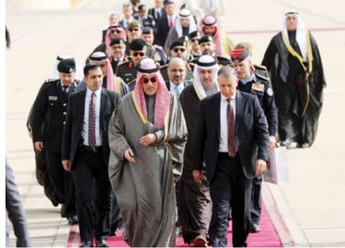
الشيخ فهد اليوسف لدى وصوله إلى الأردن

وأشاد السفير المري بالعلاقات الوطيدة وروابط الأخوة التي تجمع بين البلدين الشقيقين وشعبيهما، مشيراً إلى ما تحظى به من رعاية واهتمام القيادتين الحكيمتين في كلا البلدين الشقيقين. ولفت إلى أن زيارة الشيخ فهد اليوسف إلى الأردن تأتي في إطار جولة شملت مصر فيما تقوده لاحقاً إلى سلطنة عمان بهدف تعزيز منظومة العمل العربي ودعم التعاون الثنائي في المجالات المختلفة، مؤكداً أهمية استمرار التنسيق المشترك إزاء القضايا والموضوعات الإقليمية والدولية. وكان في مقدمة مستقبلي النائب الأول لرئيس مجلس الوزراء وزير الدفاع ووزير الداخلية الشيخ فهد اليوسف في مطار الملكة علياء الدولي بالعاصمة عمان وزير الداخلية الأردني مازن الغرايه وعدد من كبار المسؤولين العسكريين والأمنيين في الأردن.