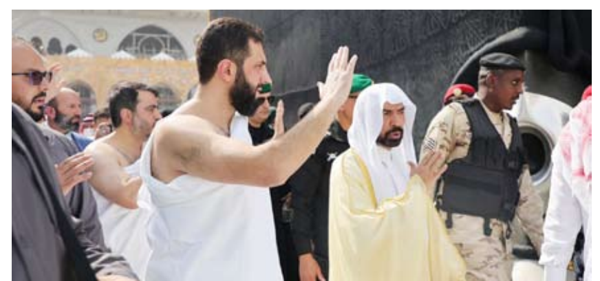
الرئيس السوري أحمد الشرع خلال أداء مناسك العمرة أمس

واختتم الرئيس الشرع أمس زيارته إلى المملكة أولى محطاته الخارجية الرسمية، حيث التقى خلالها ولي العهد الأمير محمد بن سلمان. من جانب آخر، أعلنت الرئاسة التركية أن الشرع يزور تركيا اليوم الثلاثاء، بدعوة من الرئيس التركي رجب طيب أردوغان.