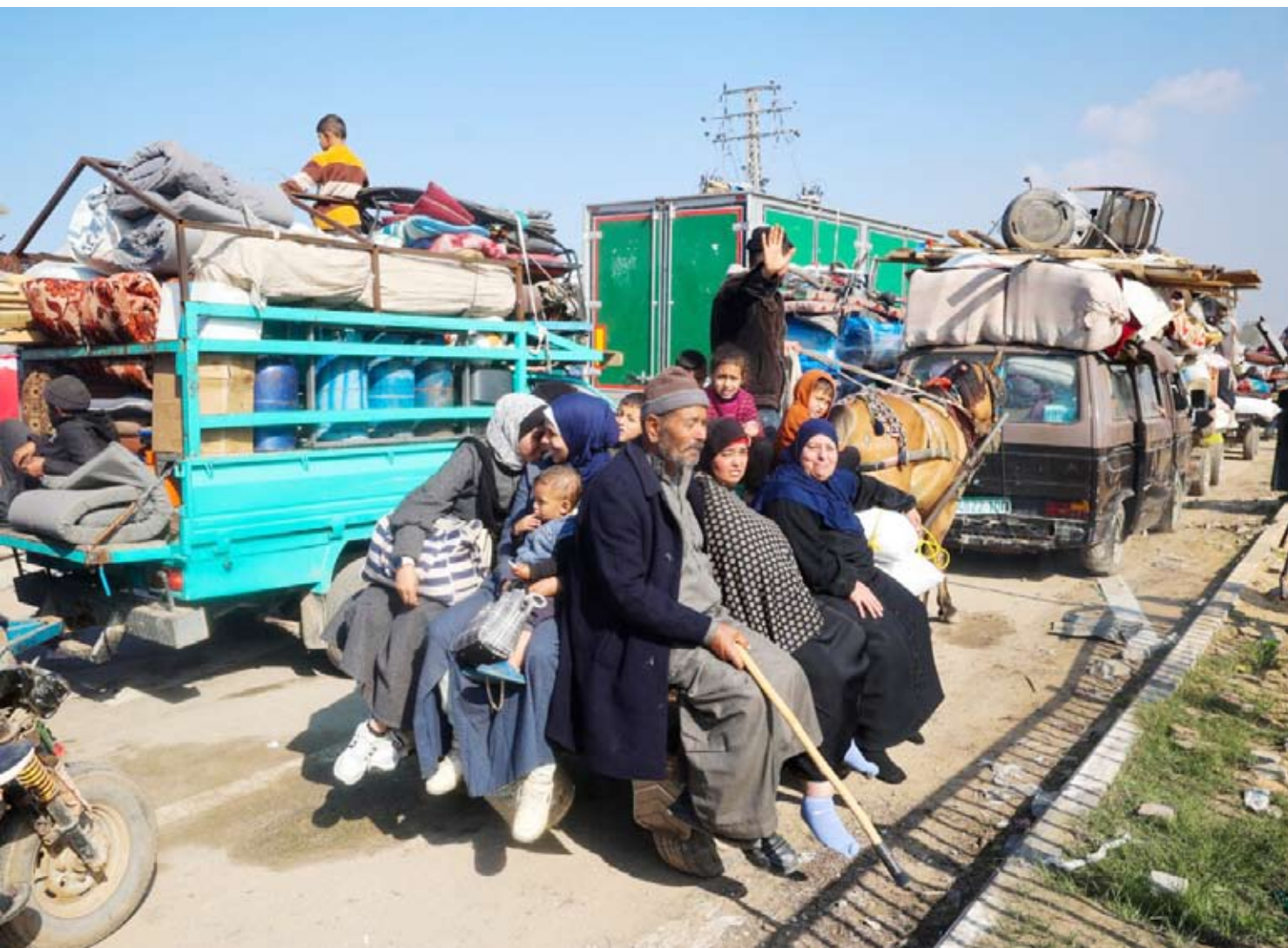
نساء واطفال غزيون نازحون

قال الرئيس الأمريكي دونالد ترمب، إن هناك «تقدماً» في المحادثات حول الشرق الأوسط مع إسرائيل ودول أخرى، وذلك قبيل بدء مناقشات في واشنطن بشأن المرحلة التالية من وقف إطلاق النار بقطاع غزة. وقال ترمب، للصحافة، على أثر نزوله من الطائرة في واشنطن، بعد عودته من مقر إقامته في مارالغو بفلوريدا: «المحادثات حول الشرق الأوسط مع إسرائيل ومختلف الدول الأخرى تتقدم. ببيني (بنيامين) نتنياهو سيأتي، وأعتقد أن لدينا بعض الاجتماعات الكبيرة جداً المقرر عقدها»، في إشارة منه إلى رئيس الوزراء الإسرائيلي. ويناقش نتنياهو المرحلة الثانية من وقف إطلاق النار في غزة، في واشنطن، قبل أن يستقبله الرئيس الأمريكي. ووصل نتنياهو، إلى العاصمة الأميركية، حيث سيصبح أول زعيم أجنبي