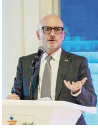
السفير الإيطالي متحدناً

انطلقت مساء أمس الأول، فعاليات (الاستريت... أسبوع رسم وتصميم المجوهرات) الذي ينظمه المجلس الوطني للثقافة والفنون والآداب وسفارة جمهورية إيطاليا لدى الكويت بالتعاون مع أكاديمية الاستريت و عدد من الأفراد ومؤسسات من المجتمع المدني. وقال الأمين العام للمجلس الدكتور محمد الجسار في تصريح صحفي على هامش حفل الافتتاح في متحف الفن الحديث: إن المجلس يحرص على إقامة مثل هذه الفعاليات التي تحتضن المبدعين في دولة الكويت وتسهم في تطوير إبداعاتهم ليتمكنوا من استثمارها مستقبلاً وتحولها إلى مصدر دخل.