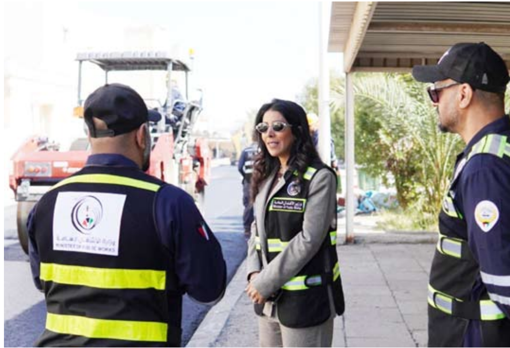
الوزيرة نورة المشعان تتفقد مشروع صيانة طرق الجابرية

وذكرت أن توجهاتها بسرعة إنجاز أعمال الصيانة جاءت بناء على توصيات سمو رئيس مجلس الوزراء الشيخ أحمد عبدالله الأحمد الصباح في إطار حرص الحكومة على صيانة وإصلاح البنية التحتية في البلاد مؤكدة أن البنية التحتية لأي بلد هي الركيزة الأساسية لأي رؤية اقتصادية.