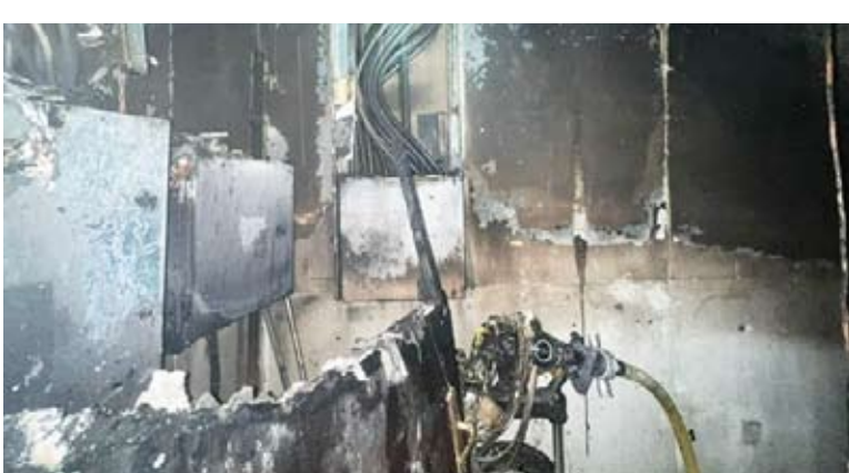
قوة الإطفاء تقاوم الحريق

بتوجيهات من النائب الأول لرئيس مجلس الوزراء ووزير الدفاع وزير الداخلية الشيخ فهد يوسف سعود الصباح وبإشراف مباشر من سعادة رئيس قوة الإطفاء العام اللواء طلال محمد الرومي، وبحضور مدير عام بلدية الكويت المهندسة منال العصفور نفذت قوة الإطفاء العام صباح أمس الإثنين حملة تفتيشية في منطقة جنوب خيطان وذلك بالتعاون مع وزارة الداخلية وبلدية الكويت والهيئة العامة للدفاع ووزارة الرصد المباني وتهدف الحملة إلى رصد المباني والمنشآت المخالفة لاشتراطات السلامة والوقاية من الحريق.