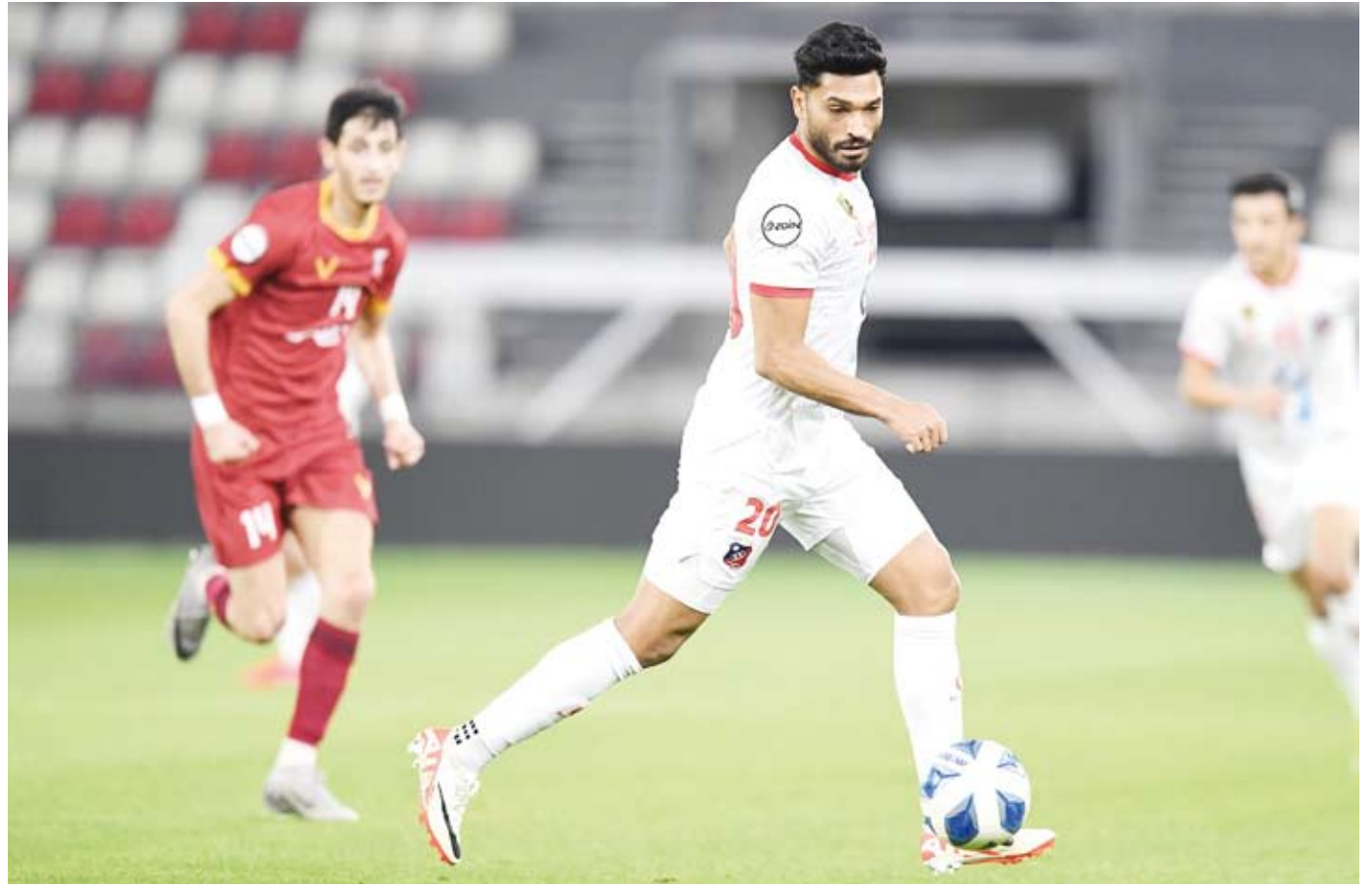
البيض يعتلي الصدارة بفارق الأهداف عن الأخضر العربي