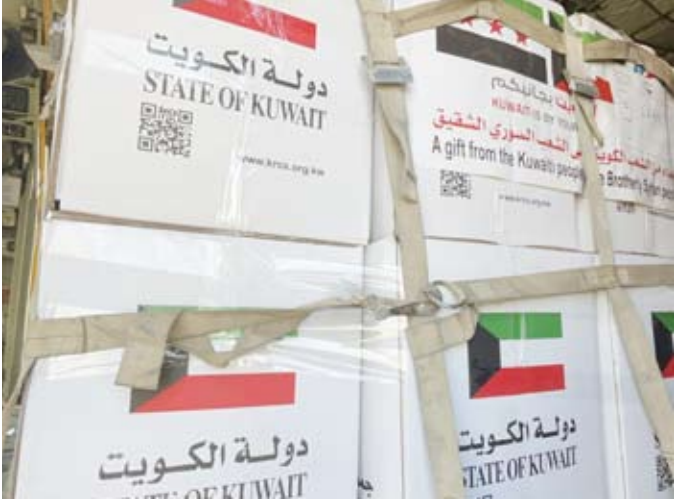
عملية نقل المساعدات المتنوعة إلى داخل الطائرة

المطلوبة من تنسيق وتسهيل لنقل المساعدات دعماً للمساعي الإنسانية الكويتية في إغاثة الشعوب المحتاجة أينما كانت. يذكر أن مجموع المساعدات التي قدمتها جمعية الهلال الأحمر الكويتي بست طائرات تقدر بنحو 150 طناً من المساعدات الإغاثية المتنوعة وأبرزها الغذاء والإيواء والمستلزمات الطبية ليصل لإجمالي المساعدات الكويتية للأشقاء السوريين إلى 489 طناً بمشراكة جمعيات وهيئات وجهات رسمية ضمن الجسر الجوي الكويتي إلى سورية.