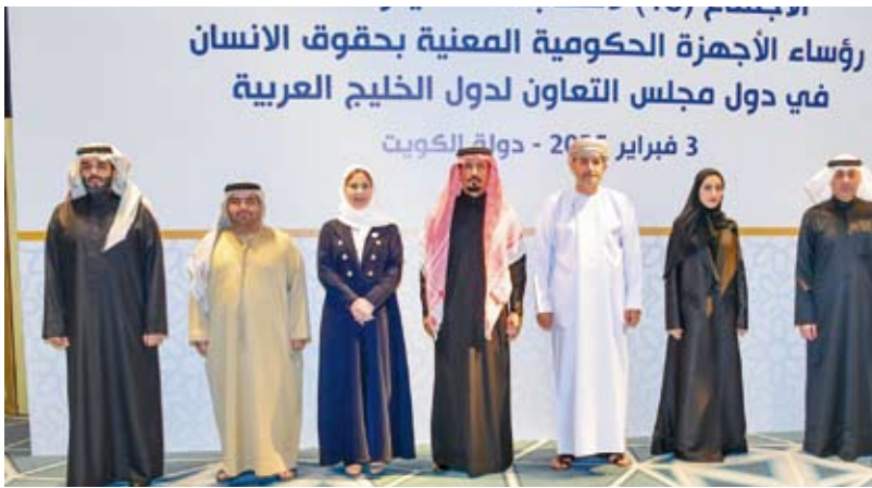
لقطة جماعية للمشاركين

أكد مساعد وزير الخارجية لشؤون الوطن العربي السفير أحمد البكر، أمس، أن دول مجلس التعاون أحرزت تقدماً كبيراً في مجال تعزيز حقوق الإنسان، مؤكداً أهمية استمرار التنسيق والتعاون لتعزيز الصورة المشرفة لدول المجلس في المحافل الإقليمية والدولية. جاء ذلك في كلمة للسفير البكر خلال ترؤسه أعمال الاجتماع الـ 18 لرؤساء الأجهزة الحكومية المعنية بحقوق الإنسان في دول المجلس. وأعرب عن أمله في أن تسهم