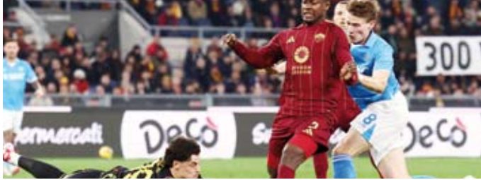
تعادل إيجابي بين نابولي وروما