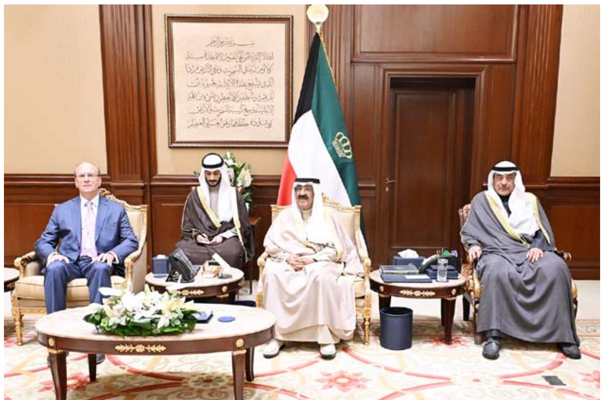
سمو الأمير بحضور سمو ولي العهد يستقبل رئيس مجلس الإدارة والرئيس التنفيذي لشركة بلاك روك

دفع عجلة التنمية في البلاد... من جهته أكد رئيس مجلس الإدارة والرئيس التنفيذي لشركة بلاك روك لاري فينك على أهمية تعزيز التعاون مع دولة الكويت والعمل على دعم أهداف رؤية الكويت 2035.