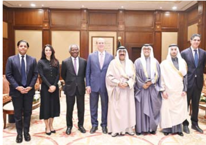
سمو الأمير مستقبلاً رئيس شركة بلاك روك والوفد المرافق