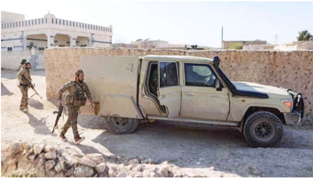
اشتبكات بين الفصائل الموالية لتركيا و«قسد»