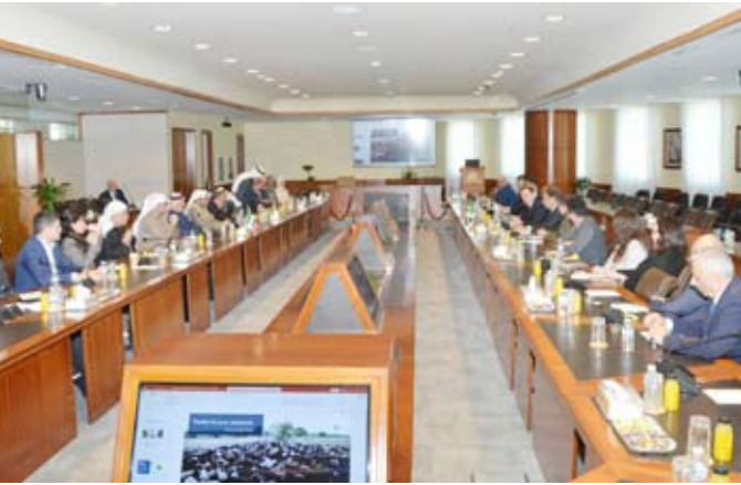
جانب من الاستقبال

استقبلت غرفة تجارة وصناعة الكويت وفداً اقتصادياً برازالياً برئاسة أمين عام الغرفة التجارية البرازيلية السيد محمد مراد، وحضور سعادة السفير البرازيلي رودريغو أرخوغايش، كما حضر اللقاء عدد من السادة أصحاب الأعمال المهتمين. وفي كلمتها الترحيبية، أكدت الغرفة أن العلاقات الكويتية البرازيلية تمتد عبر عقود من التعاون المتبادل الذي يشمل مختلف المجالات. فقد ساهمت الكويت في تعزيز أمن الطاقة في البرازيل من خلال صادراتها النفطية، في حين لعبت البرازيل