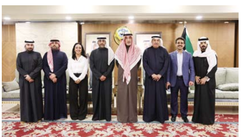
الشيخ فهد اليوسف لدى لقائه سفير الكويت في مصر غانم الغانم وأعضاء السفارة الكويتية

التقى النائب الأول لرئيس مجلس الوزراء ووزير الدفاع ووزير الداخلية الشيخ فهد اليوسف، أول أمس، سفير دولة الكويت لدى مصر غانم الغانم وأعضاء السفارة. وأشاد الشيخ فهد اليوسف وفق بيان صادر عن وزارة الدفاع بجهد البعثة الدبلوماسية الكويتية في تعزيز العلاقات الثنائية بين البلدين الشقيقين. كما التقى الشيخ فهد اليوسف بالضباط الكويتيين الدارسين في الكليات العسكرية المصرية مشيداً بجهدهم واجتهادهم في تحصيل العلوم العسكرية والأكاديمية التي تسهم في تأهيلهم لخدمة وطنهم.