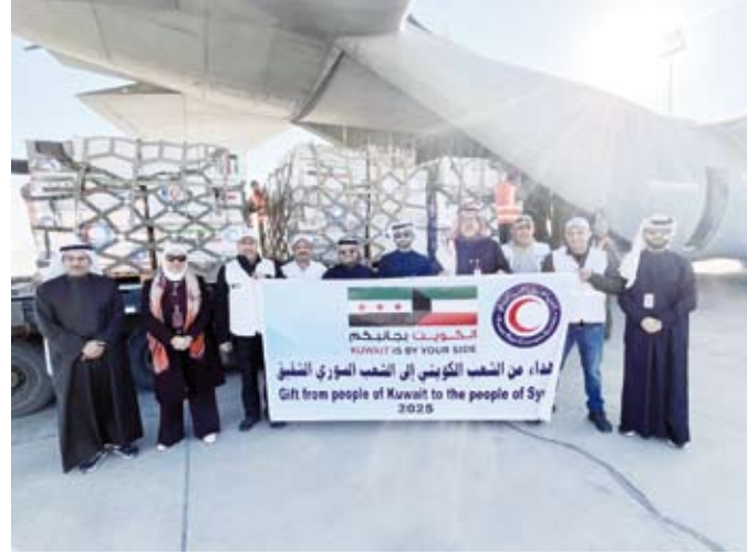
المشاركون في الرحلة الإغاثية

للقوف على آخر مستجدات الاحتياجات وسبل توزيعها للتخفيف من الظروف الإنسانية هناك، مشدداً على أنها والجمعيات الخيرية الكويتية تعمل عبر الجسر الجوي لتقديم العون والمساعدة لسد الاحتياجات العاجلة في القطاعات الإغاثية المتنوعة وعلى رأسها الغذاء والدواء والإيواء. وأعرب المغامر عن شكره لوزارات (الشؤون) والخارجية والدفاع على تقديم التسهيلات اللازمة لإيصال المساعدات لمستفيديها عبر الجسر الجوي الكويتي وتوفير جميع الاحتياجات