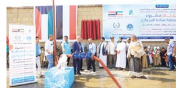
جانب من تدشين البئر الارتوازي

ويعد هذا المشروع واحداً من المشاريع الإنسانية والتنمية التي تقدمها الهيئة الخيرية لدعم الأشقاء في اليمن، انطلاقاً من التزامها بتحقيق التنمية المستدامة وتحسين نوعية حياة السكان في المناطق المتأثرة بالحروب. كما يمثل المشروع خطوة مهمة نحو تعزيز الأمن المائي في محافظة تعز، وتخفيف معاناة ملايين اليمنيين الذين يعانون من شح المياه بسبب الحصار المستمر، وتدمير العديد من الآبار القديمة بسبب النزاع المستمر. ويوفر المشروع، الذي نُفذ بتقنيات حديثة واستخدام الطاقة الشمسية لضخ المياه، مياهاً نظيفة صالحة للشرب لأكثر من 30,000 مستفيد في المنطقة، كما يحد من التكاليف المرتفعة التي يدفعها السكان لشراء المياه، بالإضافة إلى مساهمته في تنمية الاقتصاد اليمني المتدهور من خلال إقامة مشاريع البنى التحتية.