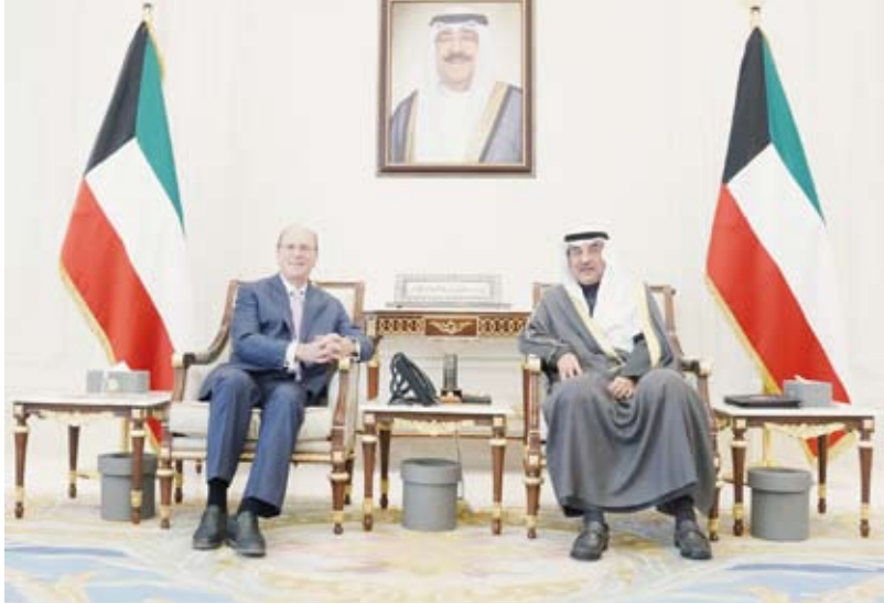
سمو ولي العهد يستقبل رئيس مجلس إدارة شركة بلاك روك

استقبل سمو ولي العهد الشيخ صباح الخالد، بقصر بيان، أمس، سمو الشيخ أحمد العبدالله رئيس مجلس الوزراء. كما استقبل سمو ولي العهد الشيخ صباح الخالد، بقصر بيان، صباح أمس، رئيس مجلس الإدارة والرئيس التنفيذي لشركة بلاك روك السيد لاري فينك وذلك بمناسبة زيارته للبلاد.