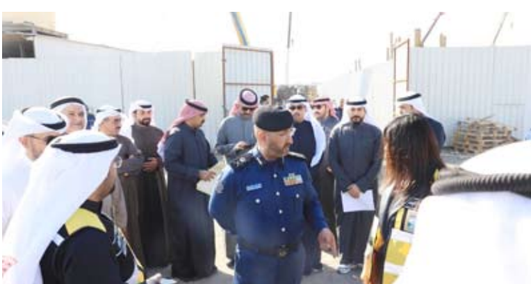
رئيس قوة الإطفاء ومدير عام البلدية أثناء الجولة