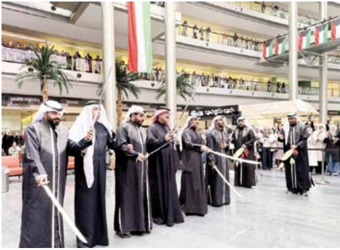
جانب من عرض الفرقة الشعبية