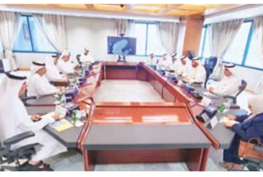
جانب من الاجتماع التنسيقى

أكد المدير العام لمؤسسة الموائى الكويتية الشيخ خالد الصباح، الحرص على تعزيز التعاون مع مجموعة موائى أبوظبي على نحو يركز على تطوير الأعمال وتبادل الخبرات وتطوير الخدمات البحرية واللوجستية. جاء ذلك في تصريح أدلى به الشيخ خالد الصباح لـ (كونا) أمس، عقب اجتماع تنسيقي عقده مع الرئيس التنفيذي لقطاع الموائى بمجموعة موائى أبوظبي سيف المزروعى وبحضور سفير دولة الإمارات العربية المتحدة لدى البلاد الدكتور مطر حامد النيايدي لتعزيز التعاون المشترك.