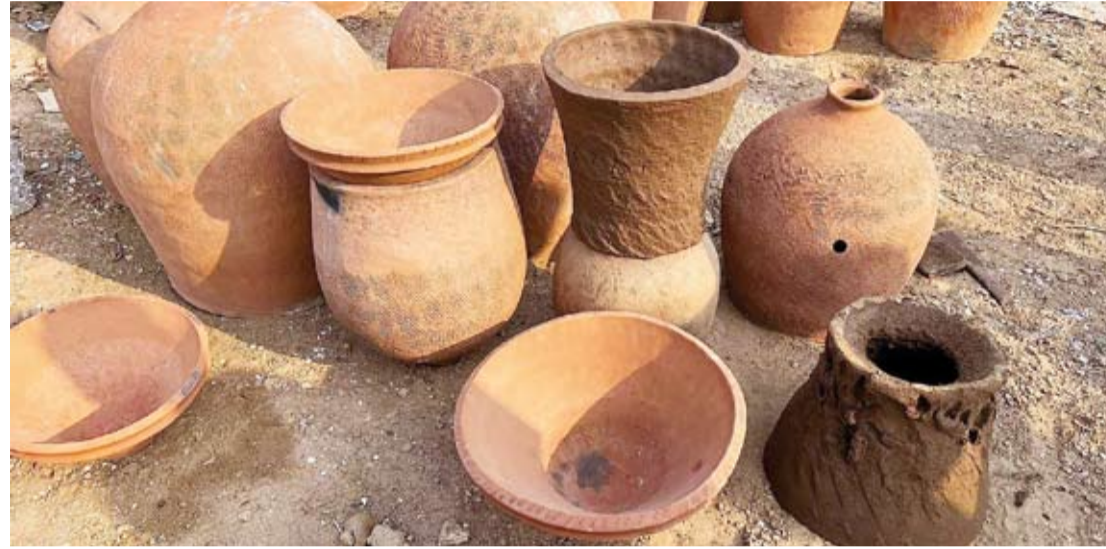
اواني فخارية في جازان

بفضل خصائصها الفريدة في توزيع الحرارة ببطء وتوازن، تمنح الأواني الفخارية للطعام نكهة خاصة تميزه، مثل أطباق «المطبخي» و«المندي» التي تزداد نضجاً وطراوة في أفران الفخار، ليصبح الطهي جزءاً من تجربة تراثية تُعيد إحياء الذكريات والدفء. ورغم تطور الأدوات المنزلية، لا تزال الأواني الفخارية تحظى بشعبية كبيرة داخل وخارج منطقة جازان، إذ يسعى الكثيرون للحصول على الأواني المصنوعة من الفخار لاستخدامها في الطهي أو تقديم الطعام، ليعيشوا تجربة مميزة تجمع بين النكهة الأصيلة وأجواء الماضي.