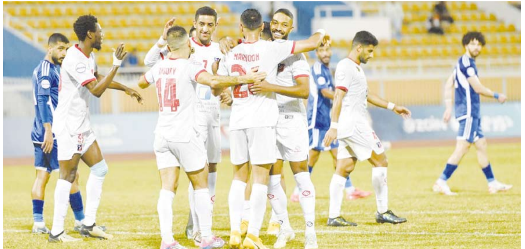
9 انتصارات متتالية وضعت الأبيض في الصدارة

ورفع كاظمة رصيده الى 10 نقاط بالمركز السابع في حين بقي اليرموك على نقاطه الثلاث بالمركز الاخير.