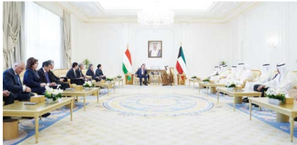
جانب من جلسة المباحثات الرسمية