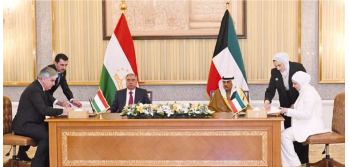
جانب من توقيع إحدى الاتفاقيات بحضور سمو ولي العهد ورئيس طاجيكستان

التحذير الذي أطلقته بلدية الكويت، من إمكانية استخدام السيارات المهملية كمأوى للعمال أو مخالفي الإقامة، منطقي وفي محله. وجود هذه السيارات في الساحات العامة أو أمام المدارس أو المساجد مخالفة جسيمة تستوجب فرض العقوبات والغرامات على أصحابها. هذه السيارات قد يتم استخدامها من قبل بعض ضعاف النفوس لتخزين وتوزيع المواد المخدرة، وبالتالي إلحاق الضرر بالمجتمع بأسره. دور أفرع البلدية المتواجدة في جميع المحافظات والمناطق يجب أن يكون أكثر فاعلية، ولا بد من القيام بحملات يومية أو أسبوعية على أقل تقدير للتأكد من عدم وجود هذه المخالفات، وضبطها وإزالة المخالفة إن وجدت، وتحمل أصحابها كامل التكاليف عن نقلها أو إتلافها. الأمر يحتاج إلى بعض التشديد لتحقيق مصلحة المجتمع بشكل عام.