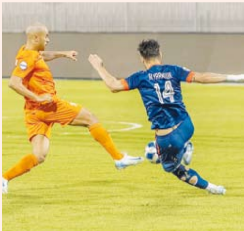
فوز مهم لكازمة على اليرموك

فاز نادي كاظمة على نظيره اليرموك بهدفين نظيفين ضمن مباريات الجولة التاسعة من دوري (زين) لكرة القدم والتي أقيمت على استاد عبدالله خليفة.