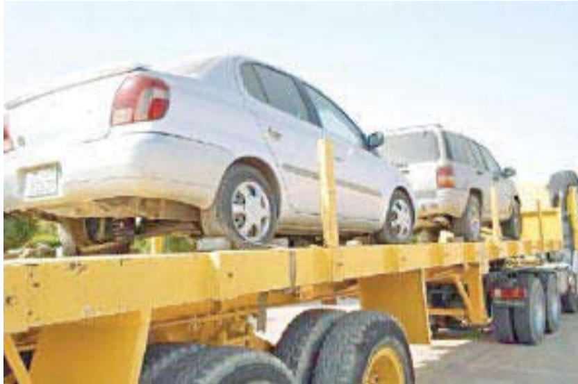
آليات البلدية تصادر سيارات

أو البنية التحتية نفسها، وفرض رسوم رمزية على مؤجري القسائم في المناطق الخدمية والحرفية والتجارية والصناعية لتشجيع المنطقة وزراعة الحدائق والمحافظة عليها، لاسيما رسوم تشجير على القسائم التي تمارس أي نشاط اقتصادي، والنظر في تخصيص مواقف عامة محددة الوظيفة كمواقف الشاحنات ومواقف المدى الطويل والمواقف المتعددة الأدوار للسيارات، في المناطق والمواقف الأمل لخدمة المجتمع. كما نصت على النظر في السماح للمواقف المتعددة الأدوار بزيادة ارتفاع الدور الأرضي وتخصيص جزء من الدور الأرضي لعملية التحميل للسيارات أو الشاحنات المتوسطة والصغيرة، واشترط بناء موقف للسيارات المتعددة الأدوار لخدمة مواقع المشاريع الاقتصادية المتوسطة والكبيرة قبل إكمال التيار الكهربائي لها.