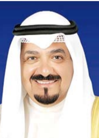
سمو الشيخ أحمد العبد الله

ثانياً: مذكرة تفاهم بين معهد سعود الناصر الصباح الدبلوماسي الكويتي، ووزارة الخارجية لدى دولة الكويت ومركز التدريب الدبلوماسي، ووزارة الخارجية لدى جمهورية طاجيكستان: الجهة المعنية بالتنفيذ: عن الجانب الكويتي: معهد سعود الناصر الصباح الدبلوماسي الكويتي ووزارة الخارجية لدى دولة الكويت ومركز التدريب الدبلوماسي، ووزارة الخارجية لدى جمهورية طاجيكستان: الجهة المعنية بالتنفيذ: عن الجانب الكويتي: معهد سعود الناصر الصباح الدبلوماسي الكويتي ووزارة