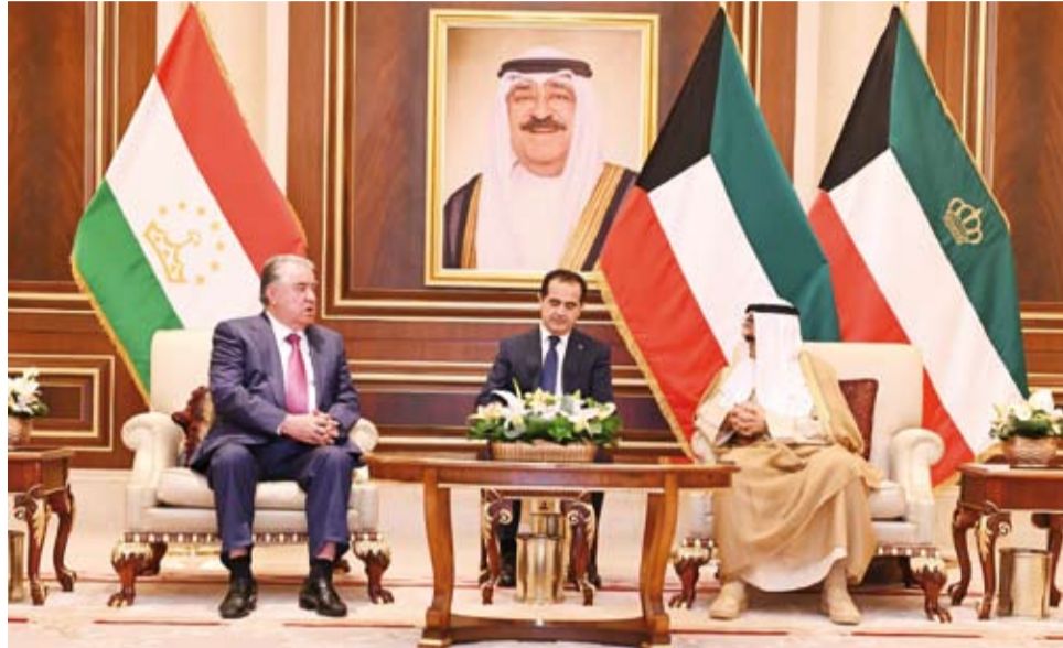
سمو أمير البلاد يستقبل رئيس طاجيكستان

استقبل صاحب السمو أمير البلاد الشيخ مشعل الأحمد، بقصر بيان، ظهر أمس، الرئيس إمام علي رحمان رئيس جمهورية طاجيكستان الصديقة والوفد الرسمي المرافق لفخامته، وبحضور سمو ولي العهد الشيخ صباح الخالد وذلك بمناسبة زيارته الرسمية للبلاد.