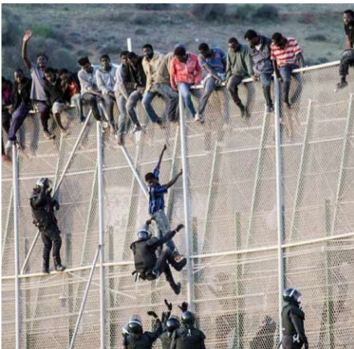
مهاجرون يحاولون اقتحام معبر سبحة الحدودي

بلدانهم في ظروف آمنة من جهة أخرى، ولفقت إلى أنه جرى ترحيل 4388 مهاجراً وأفاد طوابع إلى بلدانهم الأصلية، من بينهم 1664 مهاجراً بالتنسيق مع المنظمة الدولية للهجرة بالمغرب.