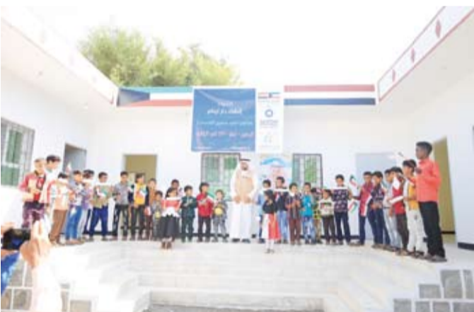
افتتاح دار لإيتام باليمن