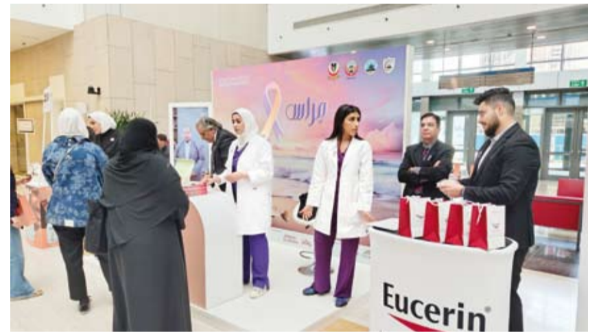
جانب من الفعالية

الكويتية) فعالية توعوية حول مرض الصدفية، بهدف تحسين الفهم العام لصحة الجلد، وذلك في يهو كلية العلوم الإدارية - الحرم الجنوبي بمدينة صباح - التساليم الجامعية، بحضور الأمين العام لرابطة أطباء الجلد الكويتية ورئيس قسم الأمراض الجلدية في مستشفى الفروانية،