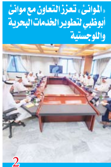
الموانئ، تعزيز التعاون مع موانئ أبوظبي لتطوير الخدمات البحرية واللوجستية