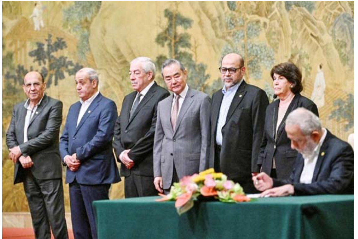
اجتماع سابق للفصائل الفلسطينية في الصين

في القاهرة «شان فلسطيني خالص والجهود المصرية هدفها توحيد الصف الفلسطيني والتخفيف من معاناة الشعب الفلسطيني»، وأن اللقاء يستهدف تحقيق الوحدة وعدم فصل الضفة الغربية عن قطاع غزة. وتابع قائلاً: «(فتح) و(حماس) لديهما نظرة إيجابية تجاه التحركات المصرية بشأن تشكيل لجنة الإسناد المجتمعي رغم التحديات التي تواجه القضية الفلسطينية».