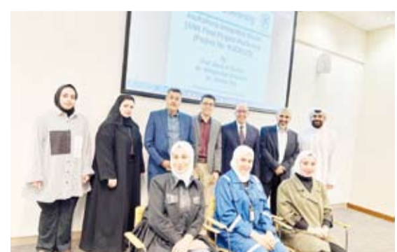
لقطة جماعية للمشاركة

الكويت على نموذج المحاكاة الذي تم تصميمه، ويعد هذا المشروع أحد مشاريع اتفاقية التعاون المشترك بين جامعة الكويت وشركة نفط الكويت، حيث تم تقديمه بناءً على طلب من الشركة، وقد أثمر التعاون بين الباحثين من المؤسستين إيجاد الحلول البحثية المطلوبة خلال مدة المشروع وهي سنتين ونصف، وقد عبر الأستاذ