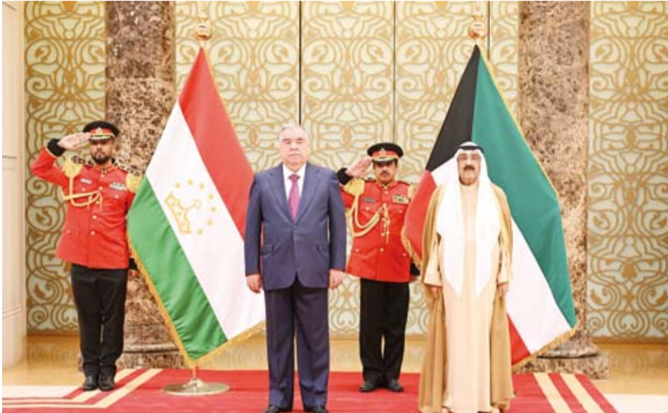
سمو الأمير ورئيس طاجيكستان في مقصورة الشرف