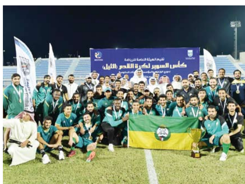
منافسات قوية تنتظر دوري الوزارات

تنطلق مساء اليوم (الاثنين) منافسات دوري الوزارات والهيئات والمؤسسات الحكومية لكرة القدم للموسم 2024 - 2025 بمشاركة 10 هيئات حكومية حيث تم تقسيمهم مجموعتين وتقام المنافسات بنظام الدوري من دورين يتأهل أول المجموعة مباشرة إلى الدور قبل النهائي بينما يلتقي أصحاب المركزين الثاني والثالث في دور ثمن النهائي ليتأهل الفائزين إلى قبل النهائي ففي المجموعة الأولى يلتقي فريق وزارة الداخلية مع وزارة التربية على ملاعب ساحة السرعة، بينما يتقابل فريق الإدارة العامة للجمارك مع فريق وزارة الصحة في نفس التوقيت على ملاعب ساحة مشرف ويحصل فريق الهيئة العامة للصناعة وصيف كأس السوبر على راحة من خوض منافسات الجولة الأولى. وتستضيف عدداً ساحة مشرف مواجهة وزارة الكهرباء والماء مع الحرس الوطني بطل