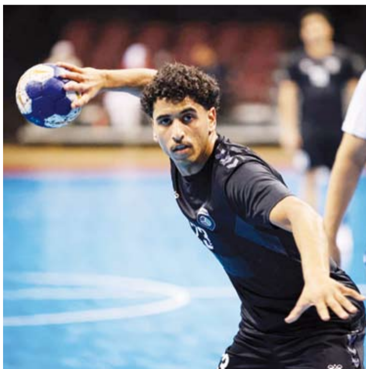
فوز مهم للقرين والسالمية في دوري اليد

حقق (القرين) فوزاً كبيراً على حساب (التضامن) بنتيجة 18/32 فيما حقق (السالمية) الفوز على (القادسية) بنتيجة 23/25 في ختام مباريات الأسبوع السادس للدوري العام لكرة اليد الكويتي للموسم 2024/2025.