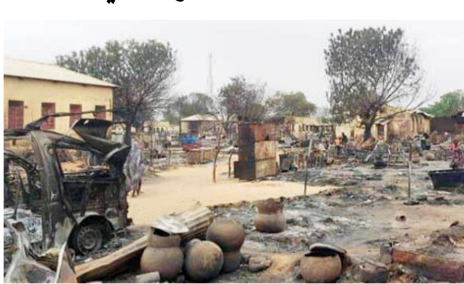
الدمار الذي خلفه القتال في الفاشر