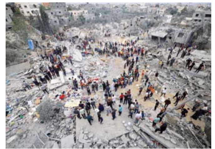
دمار كبير في قطاع غزة

وأوضح المتحدث أن هناك 137 من الضحايا تحت أنقاض المباني التي دمرته قوات الاحتلال في مشروع (بيت لاهيا) قبل عدة أيام.