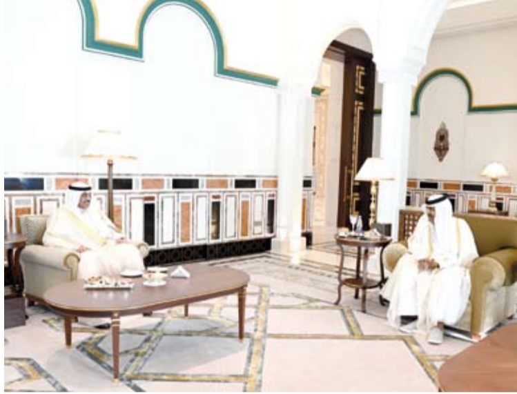
سمو ولي العهد يقوم بزيارة الأمير الوالد في قصر الوجبة بالدوحة