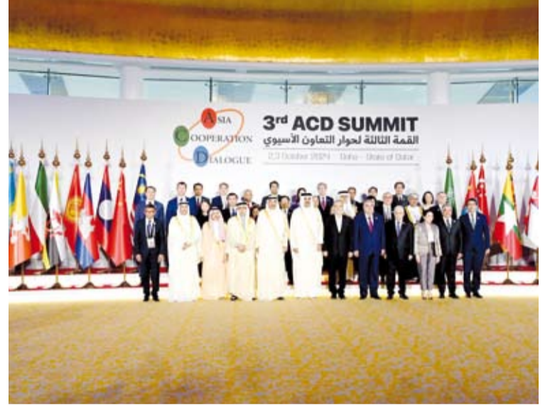
سمو ولي العهد خلال مشاركته في قمة منتدى حوار التعاون الآسيوي بالدوحة