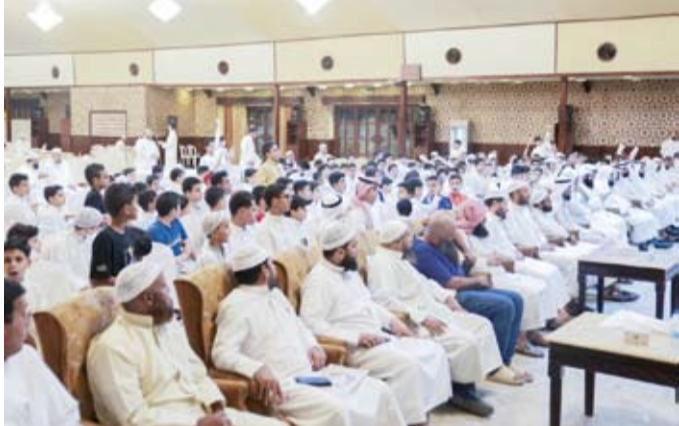
جانب من المعلمين والطلاب المشاركين في يوم البركة القرآني