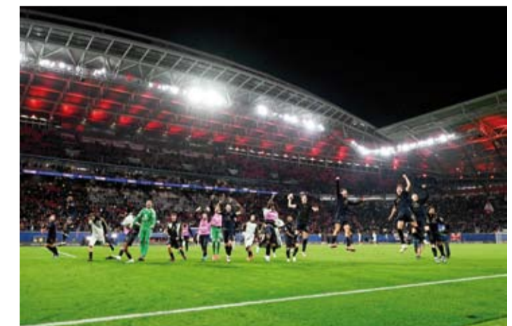
فوز مثير لليوفي رغم النقص العددي