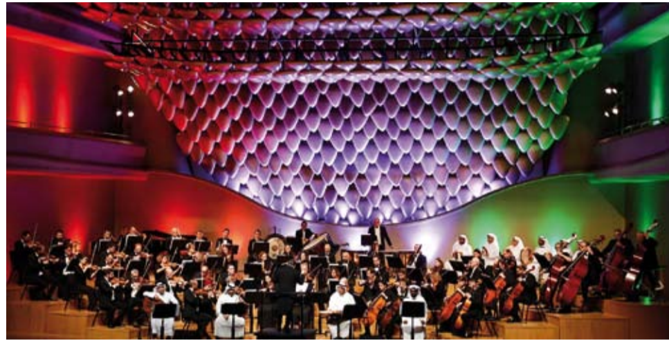
جانب من الحفل الموسيقي

أقام المجلس الوطني للثقافة والفنون والآداب بالتعاون مع مركز الشيخ جابر الأحمد الثقافي وسفارة فرنسا لدى دولة الكويت والمعهد الفرنسي حفل «أوركسترا باريس الفيهارموني» ضمن فعاليات موسمه الثقافي (2024-2025).