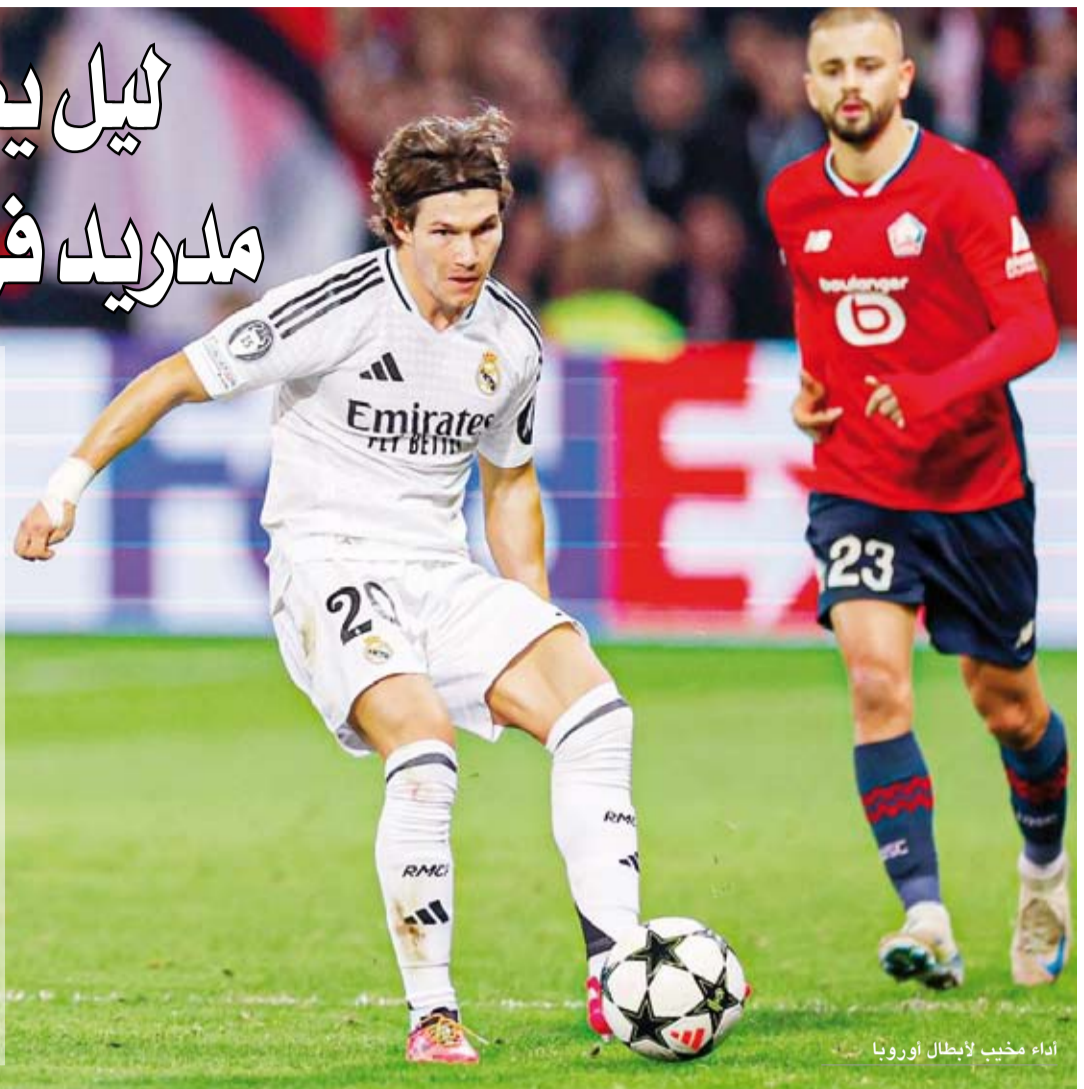
أداء مخيب لأبطال أوروبا

ويتجمد رصيد ريال عند ثلاث نقاط بعدما استهل مشواره في البطولة بالفوز على شوتوغارت.