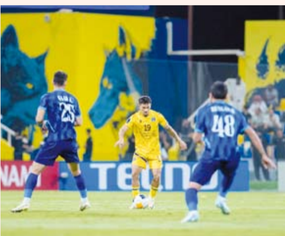
المفاجآت تتوالى في أبطال آسيا

حققت القوة الجوية العراقية والخالدية البحريني انتصاران مهمان في الجولة الثانية من دور المجموعات، ضمن منافسات بطولة دوري أبطال آسيا /2/ لكرة القدم، فيما خسرت فريقا التعاون السعودي وشباب الأهلي الإماراتي.