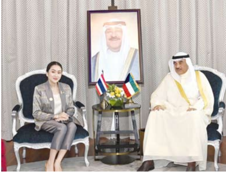
ولي العهد خلال لقائه رئيسة وزراء تايلاند

غارات الاحتلال الإسرائيلي على لبنان انتهاك صارخ لكافة الأعراف والقوانين الدولية