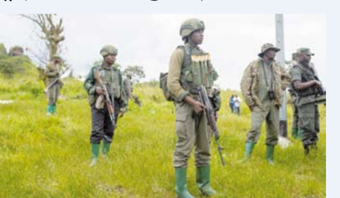
متمردو 23-م الكونغوليون في كيبويا

المسلحة. هذا أمر مقلق للغاية ويجب أن يتوقف». وأضافت كيتا أن «الغسل الإجرامي للموارد الطبيعية لجمهورية الكونغو الديمقراطية المهيرة إلى خارج البلاد يعزز نفوذ الجماعات المسلحة، ويديم استغلال السكان المدنيين، الذين يخضع بعضهم إلى عبودية بحكم الأمر الواقع، ويقوض جهود صنع السلام». وتقع غالبية الموارد المعدنية شرقي الكونغو الديمقراطية، وهي منطقة تعاني من الصراع على الأراضي والموارد بين عدة فصائل مسلحة، وقد تدهور الوضع منذ عودة تمرد حركة «إم23» عام 2022. وقد قُتل الآلاف ونزح أكثر من مليون شخص منذ تجدد القتال. ويخضع المصنعون للتدقيق للتأكد من المعادن المستخدمة في منتجات مثل أجهزة الحاسوب المحمولة وبطاريات السيارات الكهربائية لا تأتي من مناطق الصراع مثل شرق الكونغو الديمقراطية.