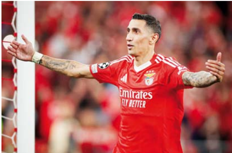
المخضرم أتخيل دي ماريا يحتفل بالهدف الثاني

في الدقيقة 75، واختتم التركي أوركون كوكجو رباعية أصحاب الأرض في الدقيقة 84 من ركلة جزاء.