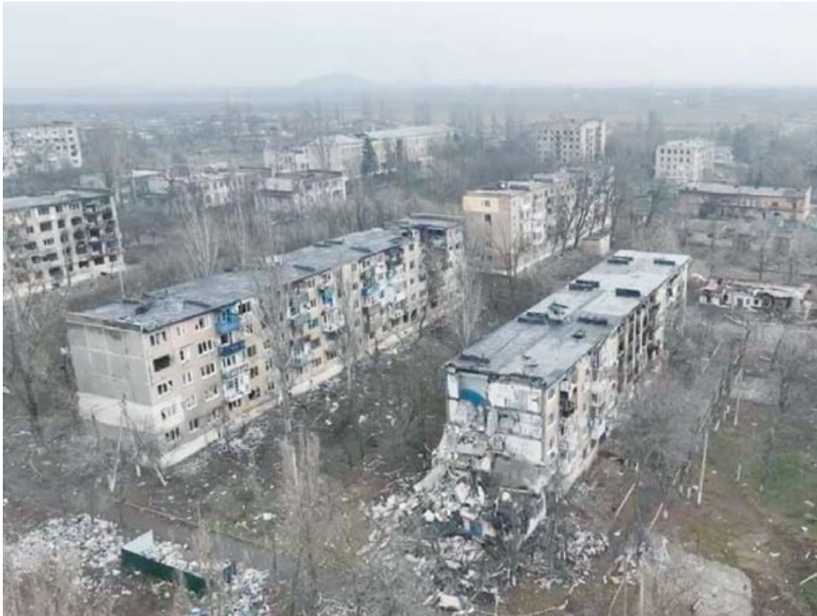
مباني مدمرة في أوغليدار

لا يشكل رفع العلم الروسي فوق ما تبقى من مبنى الإدارة المحلية لمدينة أوغليدار (فوليدار بالأوكرانية) مشهداً عابراً من مشاهد الحرب الدامية في أوكرانيا. فسقوط المدينة الصغيرة نسبيًا له أهمية كبرى بالنسبة إلى القوات الروسية، بعدما أخفقت لأشهر طويلة في اقتحام البلدة التي شكلت حاجزاً منيعاً أمام القوات الروسية منذ اندلاع الحرب في فبراير 2022. تم تثبيت العلم الروسي على أطلال إدارة أوغليدار، لكن من السابق لأوانه الحديث عن «تحرير المدينة بشكل كامل»، حسبما صرح مستشار رئيس مقاطعة دونيتسك يان جاجين لوكالة أنباء «نوفوستي» الروسية.