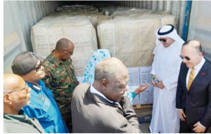
جانب من استقبال سفينة المساعدات

استقبل ميناء بورسودان بشمال شرق السودان، أول أمس، أضخم سفينة مساعدات تقدمها الكويت إلى السودان وذلك تعزيزاً لجهودها الإنسانية لدعم المتضررين من السيول والفيضانات والأزمة الراهنة التي يشهدها البلد الشقيق. وتتجاوز قيمة المساعدات الإنسانية التي حملتها السفينة المعروفة بـ «سفينة السودان» 2ر1 مليون دولار أمريكي وتحوي 2500 طن من المساعدات الإغاثية والغذائية والصحية موزعة بين 2000 طن مقدمة من الجمعية الكويتية للإغاثة و500 طن من هيئة الإغاثة الإنسانية التركية.