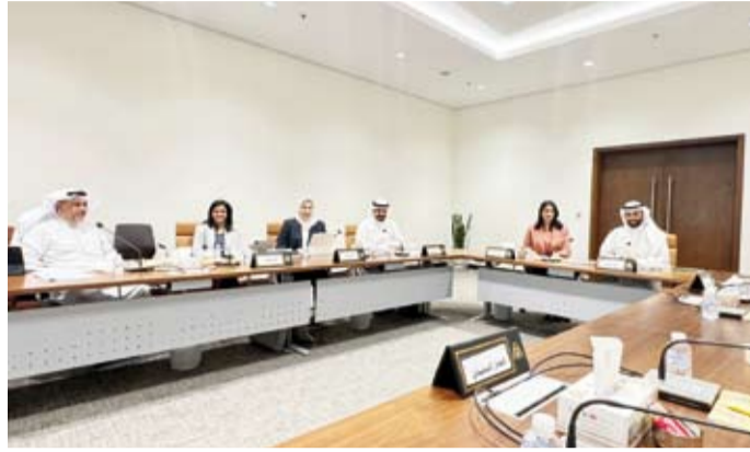
جانب من اجتماع لجنة الإصلاح والتطوير