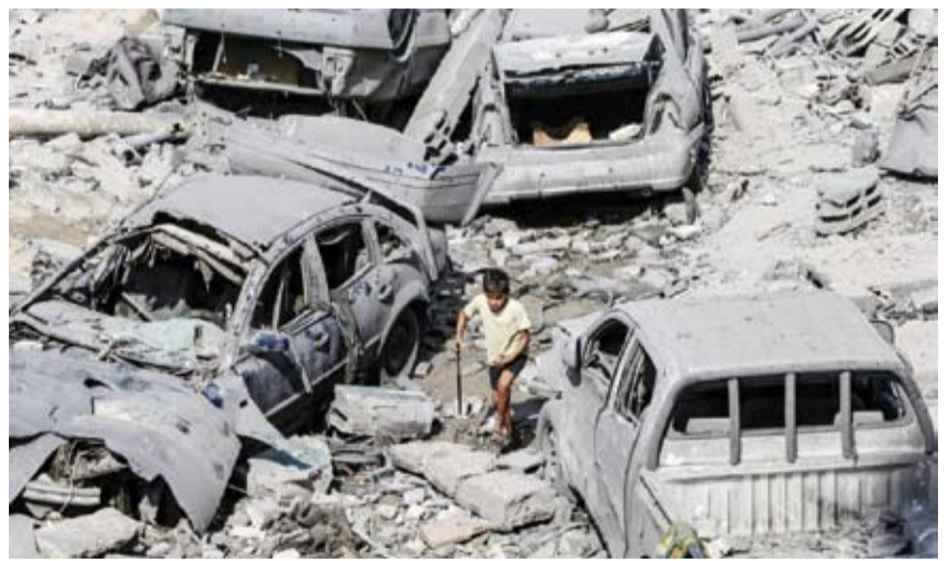
الاحتلال يبيد 902 عائلة فلسطينية

قال المكتب الحكومي في قطاع غزة، إن الجيش الإسرائيلي أباد 902 عائلة فلسطينية خلال سنة.