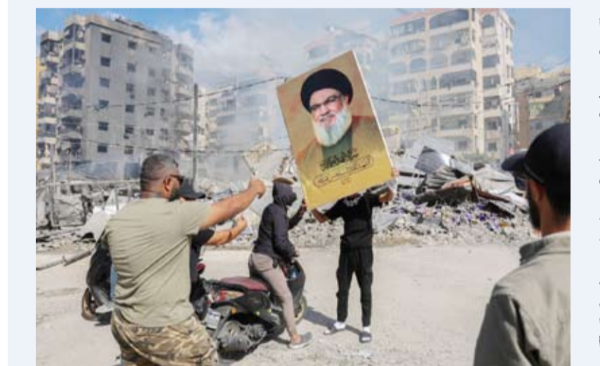
رجل يحمل لافتة عليها صورة نصر الله

كشّف وزير الخارجية اللبناني عبد الله بو حبيب عن أن الأمين العام الراحل لحزب الله، حسن نصر الله وافق على وقف إطلاق النار لمدة 21 يوماً، قبل أيام قليلة من اغتياله من قبل إسرائيل. وتمت الدعوة إلى وقف إطلاق النار المؤقت من قبل الرئيس الأميركي جو بايدن ونظيره الفرنسي إيمانويل ماكرون وحلفاء آخرين خلال أعمال الجمعية العامة للأمم المتحدة الأسبوع الماضي. وقال بو حبيب، لشبكة «سي إن إن» في مقابلة بثت: «لقد وافق نصر الله»، وأضاف: «لقد وافقنا تماماً». وافق لبنان على وقف إطلاق النار ولكن بالتشاور مع (حزب الله)، وتشاور رئيس مجلس النواب اللبناني نبيه بري مع الحزب وأبلغنا الأمين كيين والفرنسيين بما حدث».