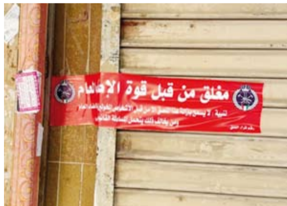
إغلاق محل مخالف