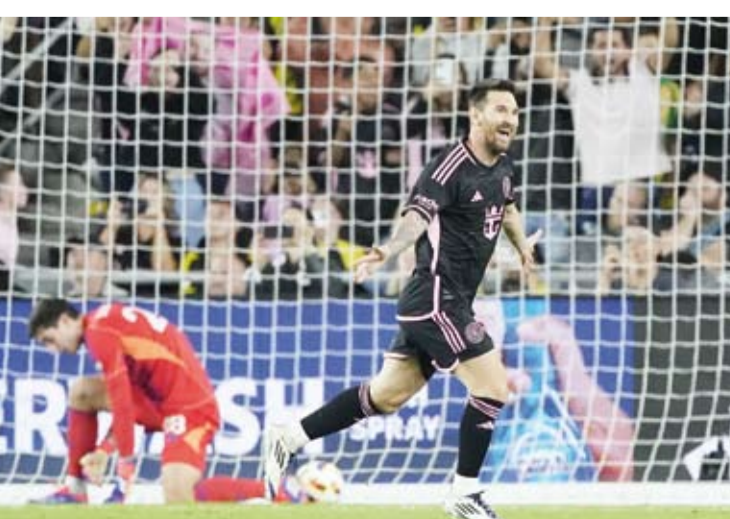
ميسي يحتفل بالتسجيل

على شيكاغو فاير (4-3)، ونيويورك سيتي على سينسيناتي (3-2)، وأورلاند سيتي على فيلادلفيا يونيون (2-1)، ونيويورك ريد بولز على تورنتو (4-1)، ومونتريال على أتلانتا يونايتد (2-1).