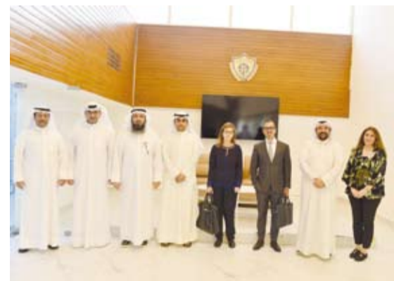
لقطة جماعية لممثلي الجهتين في ختام اللقاء