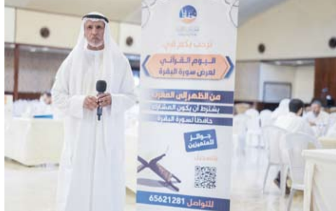
المرشد مشرفاً على فعاليات يوم البركة القرآني

البركة ومعانيها، ويتم تكريم المتميزين الحافظين لسورة البقرة الذين تمكنوا من حفظها وتسميعها في نهاية هذا اليوم. وبين المرشد أن عدد الحافظين لسورة البقرة من خلال مشروع (بركة) القرآني وصل إلى 1665 حافظاً لهذه السورة المباركة، وما زال الحصاد مستمراً من خلال استمرار الطلبة المسجلين في هذا المشروع المبارك والإقبال المتزايد عليه. ودعا المرشد الجمهور الكريم إلى التسجيل في برامج حفظ سورة