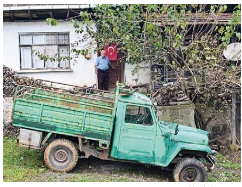
دورسون حقي أمام شاحنته

بصيانتها بنفسه، حتى إنني ركبت محركها بنفسه. ويتعجبون من شكلها لأنها نادرة. وذكر المسن التركي أن الناس يلتفتون صوراً مع شاحنته نادرة.