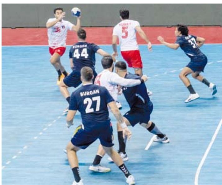
جانب من مباريات كأس الاتحاد المحلي لكرة اليد

تأهل فريقا (الكويت) و(السالمية) إلى الدور نصف النهائي لبطولة كأس الاتحاد المحلي لكرة اليد للموسم المؤجل (2023 - 2024) بتغلبهما على فريق (برقان) و(الصليبيخات) تواليا.