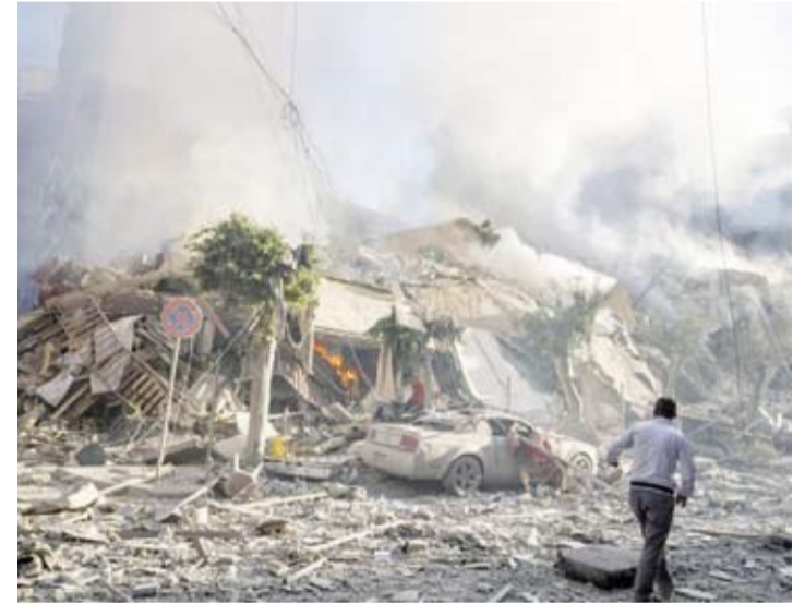
غارات الاحتلال أحدثت دماراً كبيراً

فيما شن الجيش الإسرائيلي، أمس، سلسلة غارات على الضاحية الجنوبية لبيروت ومناطق محافظة جبل لبنان في أوقات متقاربة مع تواصل العدوان الإسرائيلي الأعنف على لبنان منذ بدء المواجهات مع حزب الله قبل عام. من جانبها، أكدت جامعة الدول العربية، تضامنها مع لبنان وحكومته وأهله بكافة مكوناته بلا تمييز في هذا الظرف الصعب ووقوفها صفاً واحداً في مواجهة استهداف الدولة اللبنانية ومقدراتها وزرع بذور عدم الاستقرار فيها محذرة من اندلاع حرب إقليمية. وذلك في كلمة الأمين العام المساعد للجامعة السفير حسام زكي في اجتماع مجلس الجامعة العربية على مستوى المندوبين الدائمين في دورته غير العادية لمناقشة التضامن مع لبنان وتقديم المساعدات العاجلة لمواجهة «عدوان الاحتلال الإسرائيلي المتماهي.