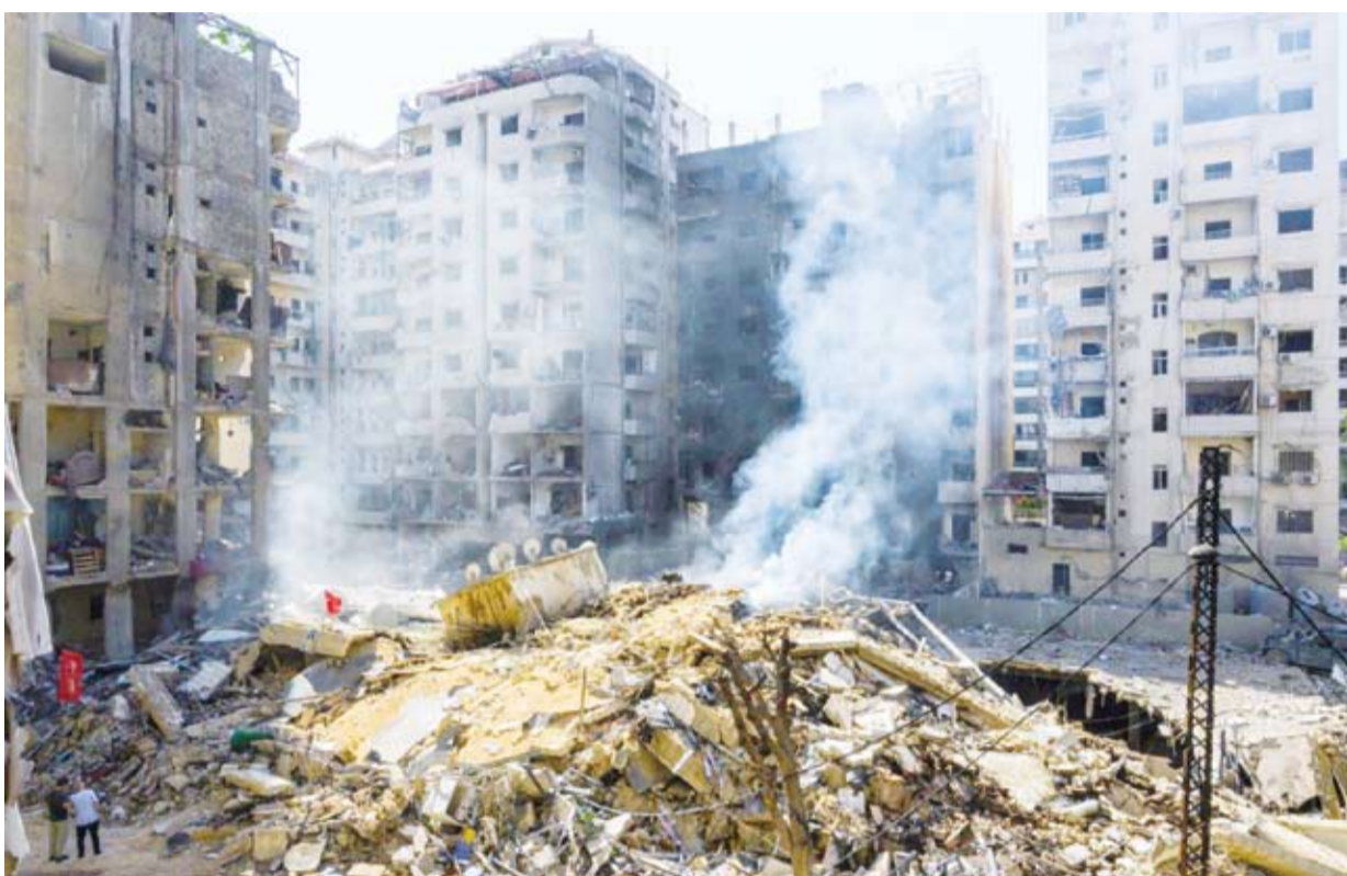
دمار في الضاحية الجنوبية

انتقلت المواجهات بين «حزب الله» اللبناني والجيش الإسرائيلي إلى مرحلة «الالتحام المباشر»، حيث أعد مقاتلو الحزب كمانن لقوات إسرائيلية كانت تدخل إلى الأراضي اللبنانية، في أولى مراحل التوغّل البري إلى الجنوب، والتي زعمت أن المقاومة لها «أضعف مما كان متوقّعا».