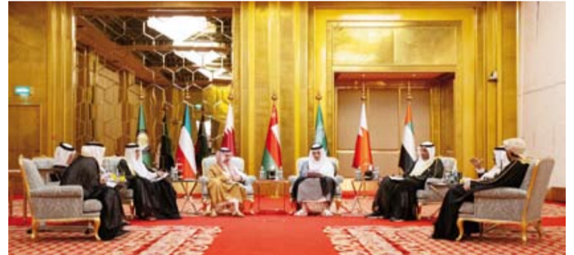
وزير الخارجية عبدالله الجحيا خلال الاجتماع

شارك وزير الخارجية الكويتي عبدالله الجحيا، في الاجتماع الاستثنائي الـ 45 للمجلس الوزاري لوزراء خارجية دول مجلس التعاون لدول الخليج العربية الذي عقد في العاصمة قطرية الدوحة. وتم خلال الاجتماع، الذي عقد