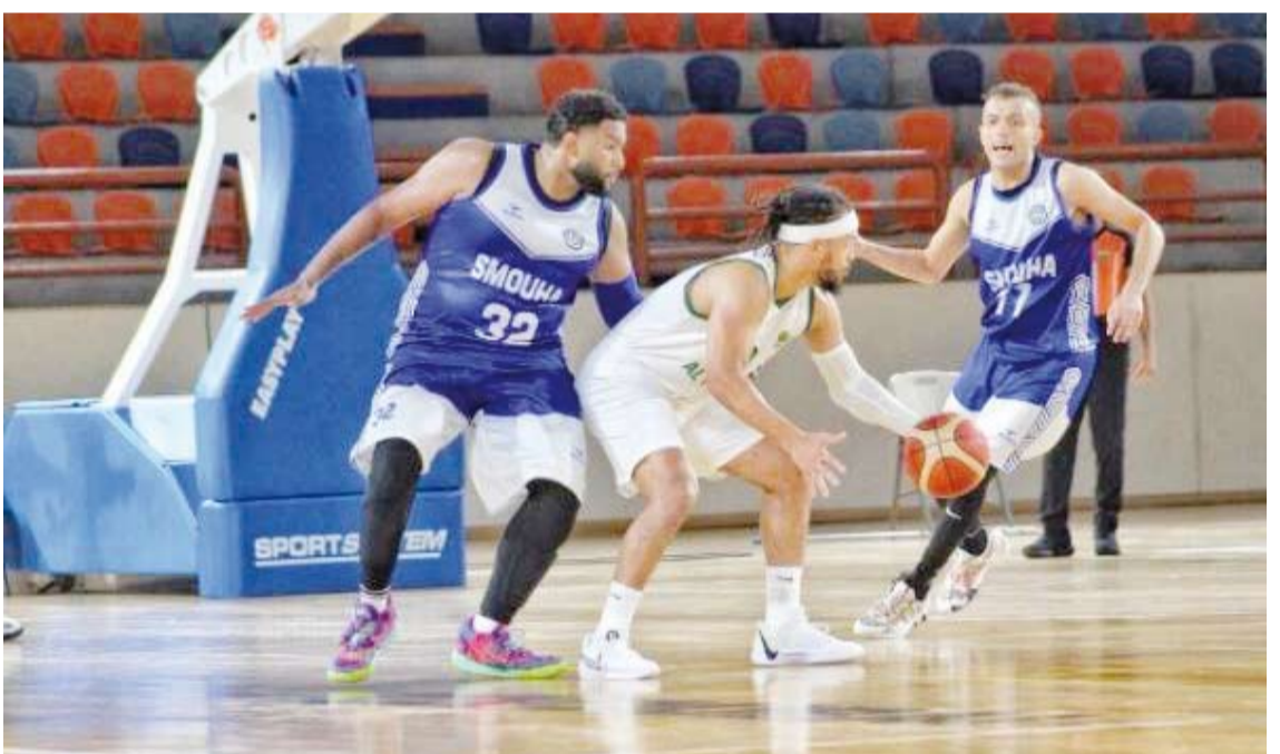
جانب من منافسات البطولة

من مختلف الدول العربية. وتتكون المجموعة الثانية للبطولة من فرق: البطائح الإماراتي، ووداد بوقاريك الجزائري، وكاظمة الكويتي، والشارقة الإماراتي، والقادسية الكويتي، وبيروت اللبناني، والأنطواني اللبناني.