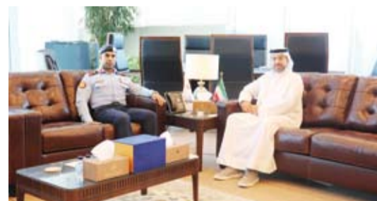
نائب رئيس الأركان خلال زيارته إلى الإدارة العامة للطيران المدني

وتطوير وزيادة كفاءة العمليات الجوية كما تناول الاجتماع حركة الطيران والخطط المستقبلية وتحديث الأنظمة التكنولوجية التي تدعم عمليات الطيران وتزيد من امان وسلامة المسافرين.