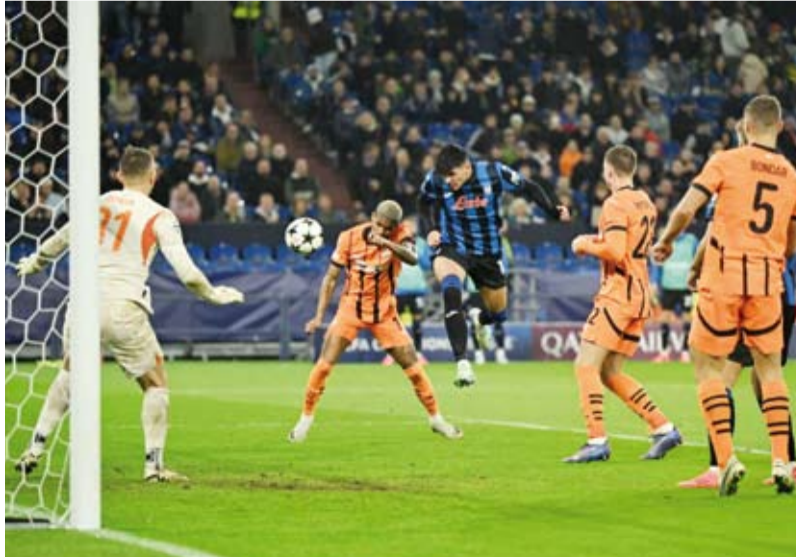
لاعب أتلانتا الإيطالي في طريقه للتسجيل

في البطولة. بتلك النتيجة، حصل فينورد على أول 3 نقاط في مسيرته بالبطولة ليتواجد في المركز 21 مؤقتا لحين انتهاء باقي مباريات الجولة، فيما بقي جيرونا بلا رصيد من النقاط في المركز الثامن والعشرين.