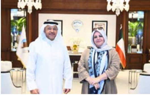
جانب من لقاء الشيخ عذبي الناصر العذبي الصباح وجدان العقاب

أكدت رئيس مجلس إدارة الجمعية الكويتية لحماية البيئة، الدكتورة وجدان العقاب أن لقاءها بمحافظ الفروانية الشيخ عذبي الناصر العذبي الصباح، بمكتبه بديوان عام المحافظة أثمر العديد من أطر التعاون المشترك، مشيدة بعمق العلاقات الثنائية الوثيقة والتعاون المستقبلي في مختلف المجالات ذات الاهتمام المشترك. وأوضحت د. العقاب مدى حرص محافظ الفروانية الشيخ عذبي الناصر على تفعيل العديد من مظاهر المسؤولية الاجتماعية المشتركة، لافتة إلى أن اللقاء تناول دعم الجمعية في مطلبها لقر دائم لمواصلة عطائها المجتمعي خاصة وهي تحتفل هذا العام بيوبيلها الذهبي ومرور 50 عاماً على تاسيسها عام 1974. وفي السياق ذاته، وفيما يتعلق بلجنة بيئة المحافظات، ذكرت العقاب "قبل سنوات كان للجنة بيئة المحافظات أثر مجتمعي إيجابي، والجمعية تشيد بأهداف مثل تلك اللجان لنشرها النوعية البيئية وتنظيمها أنشطة وفعاليات بيئية وتواصلها مع المجتمع، فبالنظر إلى أن لقاءها بمحافظ الفروانية الشيخ عذبي الناصر أشارت د. وجدان العقاب إلى أن لقاءها بمحافظ الفروانية الشيخ عذبي الناصر استعرض المسيرة الخمسينية للجمعية وإنجازاتها على كافة الأصعدة المحلية والإقليمية والدولية، ولعل منها مبادراتها الوطنية الدولية السنوية متعددة.