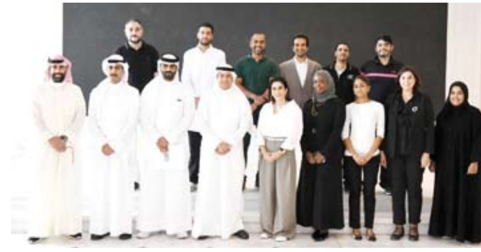
المشاركون في البرنامج التدريبي

النظري الذي منح المشاركين فرصة تطبيق المفاهيم المكتسبة على أرض الواقع متمنياً أن تسهم هذه البرامج التدريبية في تحسين الأداء الإعلامي لهذه المؤسسات. وقد تناول البرنامج عدة موضوعات منها معايير الخبر الصحفي ومصادره علاوة على البيان الصحفي والتصريح الصحفي وأهميتهما كذلك إعداد البيان الصحفي والتصريح الصحفي في المؤسسات المختلفة إضافة إلى إدارة الأزمات الإعلامية في المؤسسات الحكومية وبوسائل التواصل الاجتماعي. ويعتبر مركز «كونا» لتطوير القدرات الإعلامية الذي أسس في ديسمبر 1995 من أهم مراكز التدريب الإعلامية وقدم مئات برامج التدريب في مجالات إعلامية مختلفة ويهدف إلى تطوير القدرات والإمكانيات الشخصية الإعلامية والارتقاء بالعمل الإعلامي المهني.