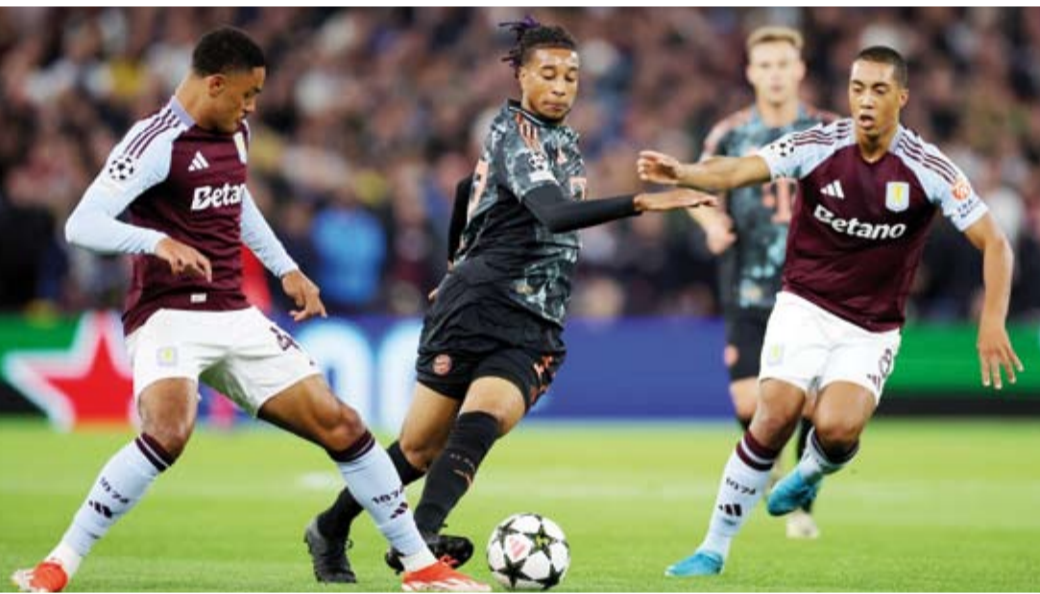
حصار للاعب بايرن ميونخ

فاز أستون فيلا 1-صفر على بايرن ميونخ في دوري أبطال أوروبا بفضل هداف رائع من جون دوران قرب النهاية إذ احتفل صاحب الأرض باستضافة أول مباراة في البطولة الأبرز للأندية الأوروبية منذ 42 عاما.