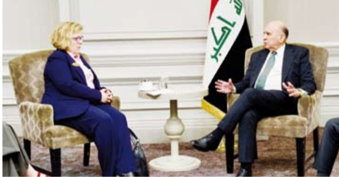
وزير الخارجية العراقي خلال لقائه مع مساعدة وزير الخارجية الأمريكي لشؤون الشرق الأدنى

اجتماع الجمعية العامة للأمم المتحدة في نيويورك أكدت أهمية الحوارات باعتبارها "السبيل الصحيح لحل المشاكل"، مشيراً إلى أنها ستبدأ في القريب العاجل. من جانبها أكدت مساعدة وزير الخارجية الأمريكي وفق البيان دعم واشنطن الكامل للعراق وجهود الحكومة العراقية في احتواء الأزمات. ووفق البيان ناقش الجانبان العراقي والامريكي الأزمات الحالية في الشرق الأوسط وشهدا على ضرورة إيقاف إطلاق النار في المنطقة وحل الخلافات عبر الطرق الدبلوماسية وضرورة بذل الجهود لمساعدة الناخبين اللبنانيين وتوفير الدعم لإنهاء الأزمة الإنسانية.