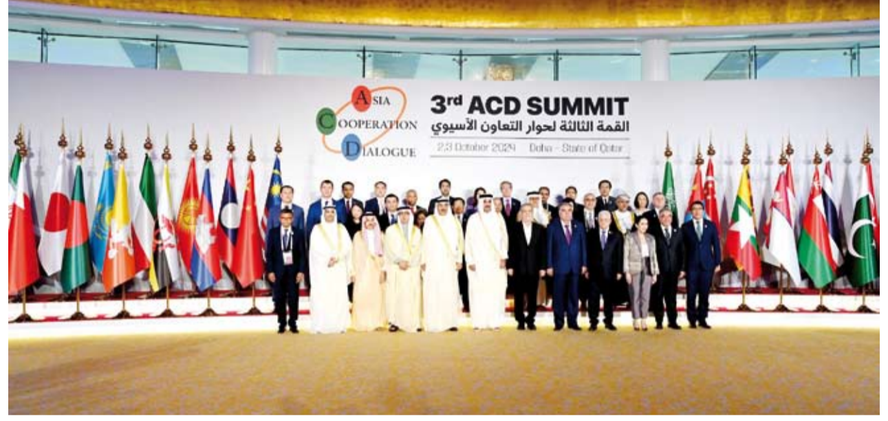
سمو ولي العهد خلال مشاركته في قمة منتدى حوار التعاون الآسيوي بالدوحة