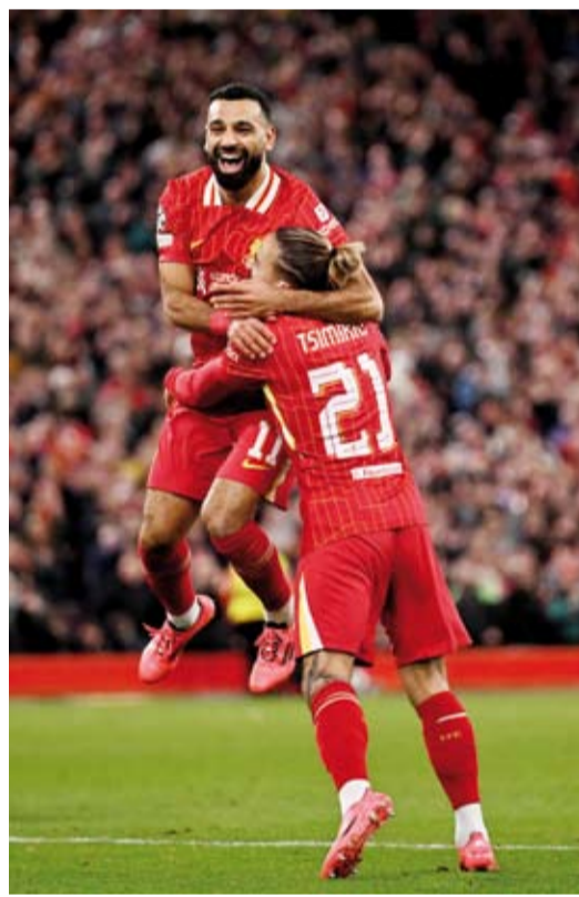
صالح يصنع ويسجل في فوز الريدز

سجل اليكسيس ماك اليستر ومحمد صلاح هدفين ليعودا ليفربول للفوز 2-صفر على بولونيا ليعزز الفريق بدايته المثالية لمشواره بدوري أبطال أوروبا لكرة القدم.