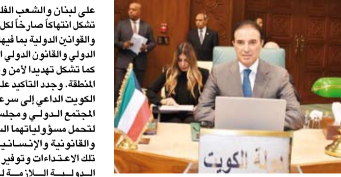
السفير طلال المطيري خلال الاجتماع الطارئ لمجلس الجامعة العربية

دولي عن هذه الانتهاكات. وأكد أن استمرار انخراط الاحتلال الإسرائيلي من العقاب يقوض احترام القانون الدولي كما يقوض مصداقية المؤسسات الدولية، محذراً من مخبة التصعيد المتزايد في المنطقة وتعرض دولها لخطر اتساع رقعة الحرب الناتجة عن استمرار العدوان الإسرائيلي. كما حذر السفير المطيري من عواقب تجاهل المشاهدات الدولية بوقف التصعيد وعدم الانصياع لقرارات مجلس الأمن ذات الصلة، مطالباً بوقف جادة وصارمة تجاه ما يرتكب من جرائم ضد المدنيين الأبرياء وإيقاف فوري لإطلاق النار. ووجد في هذا الصدد موقف الكويت الداعي إلى تطبيق قرارات الشرعية الدولية لا سيما قرار مجلس الأمن رقم 1701 لاستعادة الأمن والاستقرار في لبنان الشقيق.