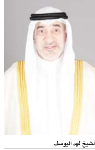
الشيخ فهد يوسف

عقدت اللجنة العليا لتحقيق الجنسية الكويتية اجتماعاً، أمس، برئاسة النائب الأول لرئيس مجلس الوزراء ووزير الدفاع ووزير الداخلية الشيخ فهد يوسف رئيس اللجنة العليا لتحقيق الجنسية الكويتية. وقالت وزارة الداخلية في بيان صحفي: إن اللجنة قررت سحب وقف وإسقاط الجنسية الكويتية من 133 حالة تمهيداً لعرضها على مجلس الوزراء.