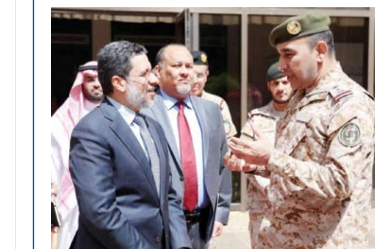
بن مبارك لدى لقائه سلمان

أجرى رئيس الوزراء اليمني الدكتور أحمد عوض بن مبارك اجتماعين في الرياض، الأول عسكري التقى خلاله القائد الجديد لتحالف دعم الشرعية في اليمن، والأخر إنساني تطرق إلى تنسيق العمل والأولويات الإنسانية مع مركز الملك سلمان للإغاثة والأعمال الإنسانية.