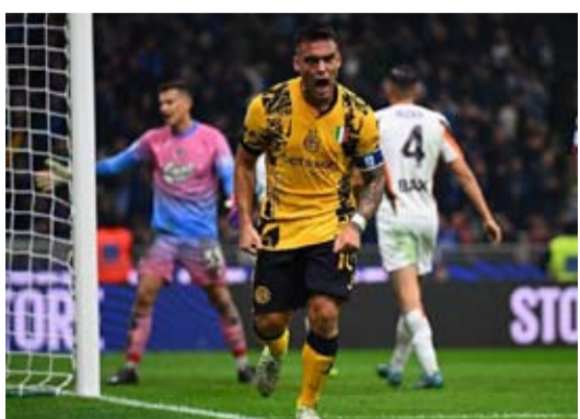
هدف لوتارو في شيك فينيزيا

حافظ فريق نابولي على صدارة الدوري الإيطالي لكرة القدم، رغم الخسارة أمام ضيفه أتالانتا بثلاثية نظيفة في المباراة التي جمعتهما ضمن الجولة الـ11 للمنافسة. سجل أهداف أتالانتا، أديمولا لوكمان في الدقيقة 10 و31، وماتيو ريتيجي (290+). وبهذه النتيجة أوقف أتالانتا انتفاضة مضيفه نابولي في الدوري، ليكسده الخسارة الثانية في البطولة خلال الموسم الحالي.