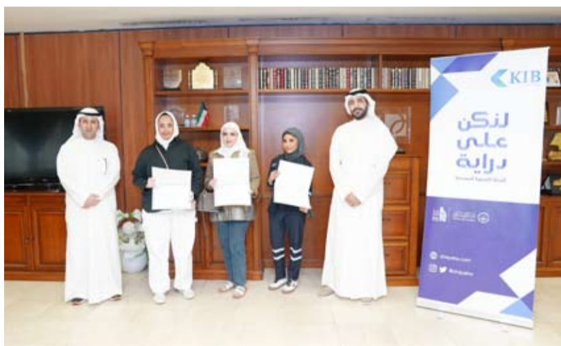
جانب من تكريم المشاركين

الخبرة المناسبة التي تؤهل شبابنا الطموح للاندماج في سوق العمل».