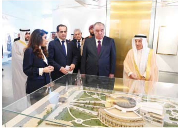
الرئيس إمام علي رحمان رئيس طاجيكستان خلال زيارة المتحف

وحضرة دولة الكويت والقاعات الرئيسية المكونة لمتحف قصر السلام وهي متحف الكويت عبر حكاهما ومتحف تاريخ قصر السلام ومتحف الحضارات التي سكنت الكويت. ورافق فخامته خلال الزيارة رئيس بعثة الشرف المرافقة المستشار بالديوان الأميري محمد أبو الحسن.