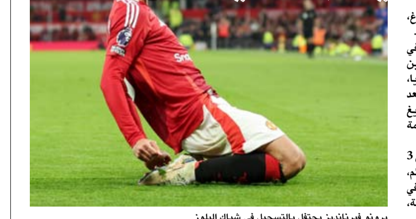
برونو فيرنانديز يحتفل بالتسجيل في شبك البلوز

واصل مانشستر يونايتد نيفز النقاط في بطولة الدوري الإنجليزي الممتاز لكرة القدم، بعدما سقط في فخ التعادل الإيجابي 1-1 مع ضيفه تشيلسي، في قمة مباريات المرحلة العاشرة للمنافسة. وجاء هدفا المباراة خلال الشوط الثاني في غضون 4 دقائق فقط، حيث بادر مانشستر يونايتد بالتسجيل عن طريق جمه البرتغالي برونو فيرنانديز في الدقيقة 70 من ركلة جزاء، وتعادل الإكوادوري مويسيس كايسيدو لتشيلسي في الدقيقة 74. وشهدت المباراة الظهور الأول ببطولة الدوري للهولندي رود فان نيستروي، الذي يتولى تدريب مانشستر