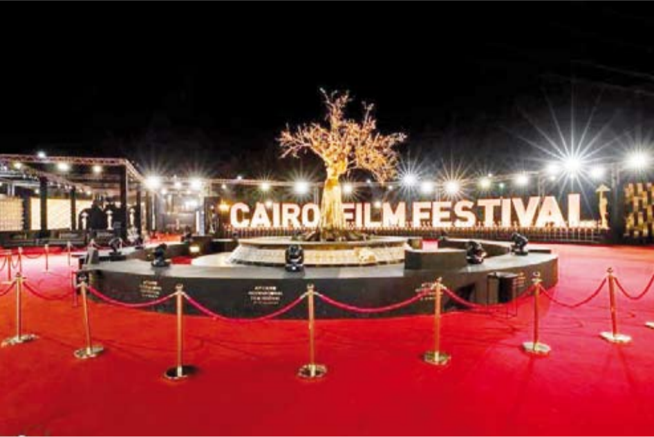
مهرجان القاهرة السينمائي

طويل، وأفضل فيلم آسيوي طويل، وأفضل فيلم وثائقي، فضلاً عن تخصيص مسابقة لأفلام غزوة وجائزة الفيلم الفلسطيني، إلى جانب تنظيم دورات تدريبية وحلقات نقاشية وورش عمل حول الإنتاج وتصميم الصوت، وكتابة القصة، والتوزيع، والترويج. ويعد مهرجان القاهرة السينمائي الدولي أحد أهم المهرجانات في العالم العربي وأفريقيا والأكبر انتظاماً، حيث تم اعتماده دولياً في العالم العربي وأفريقيا والشرق الأوسط، إلى جانب تسجيله ضمن الفئة A من قبل الاتحاد الدولي لجمعيات منتجي الأفلام من بين 14 مهرجاناً دولياً.