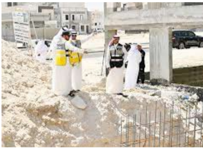
فريق البلدية يرصد المخالفات

والهيئة العامة للمعلومات المدنية وذلك لربط بيانات كافة الأنشطة التي تقع ضمن اختصاص رقابة البلدية ضمن البرنامج المزمع إعداده ليتمكن المخالفات إلكترونياً. وعمل «باركود» خاص لكل نشاط أو إعلان صادر له رخصة من بلدية الكويت، يمكن المفتش من خلاله إظهار بيانات الترخيص والإعلان لتسهيل قراءة بيانات الرخصة. ربط جميع الرخص الصادرة عن بلدية الكويت أيضاً نوعها، ليتمكن الوحدات الإدارية المختصة من متابعة انتهاء هذه الرخص. ويشمل البرنامج إحصائية لعمل المفتشين وذلك لمتابعة أداءهم، وربطها مع الامتيازات الوظيفية والمالية، مع مساهلة ذوي الضبطية الخاملة وتضمن التقرير التحول الرقمي للخدمات الحكومية من أجل تسهيل إجراءات الحصول على الخدمات وتحسين بيئة الاعمال لتوفير الخدمات في أي وقت ومن أي مكان بسهولة وبسرعة مع وجود وسائل للتفاعل مع الجهات لقياس مستوى الأداء والرضا العام عن التطوير والخدمات المقدمة، حيث سيتولى قطاع التطوير والمعلومات بالتنسيق مع قطاع المساحة وكافة قطاعات البلدية.