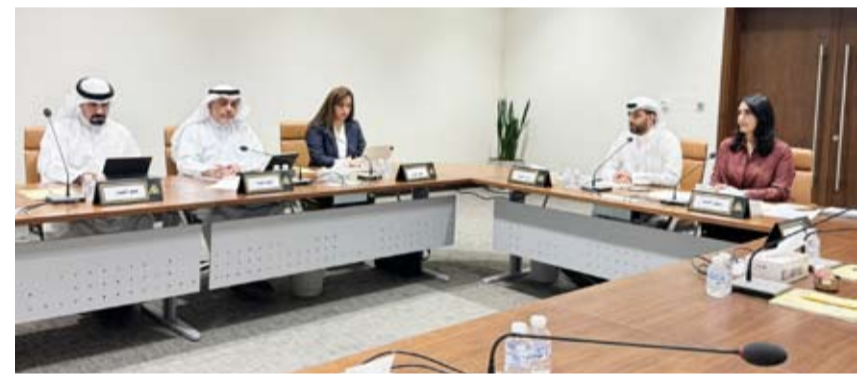
جانب من اجتماع لجنة مزاولة المهن الهندسية