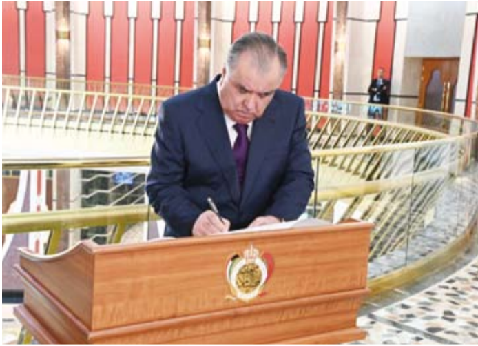
رئيس طاجيكستان يوقع على سجل الشرف