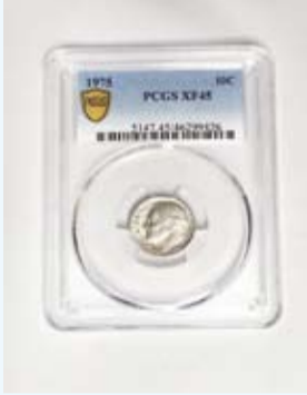
عملة 10 سنتات نادراً

أفادت وسائل إعلام أميركية، بأنه تم بيع عملة نادرة جداً كانت محفوظة في خزانة بنكية منذ أواخر السبعينيات، في مزاد باكر من 500 ألف دولار. والعملة هي "دايم" أميركي وقد تم إنتاجها من قبل دار سك العملة الأميركية في سان فرانسيسكو عام 1975. ووصفت العملة بأنها "واحدة من أندر العملات في القرن العشرين" حيث تتميز بصورة للرئيس الأمريكي السابق فرانكلين روزفلت.