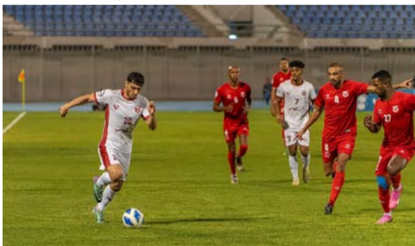
لقاء مثير بين الفحيحيل والنصر