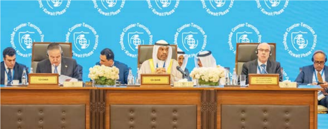
وزير الخارجية عبدالله الجحيا