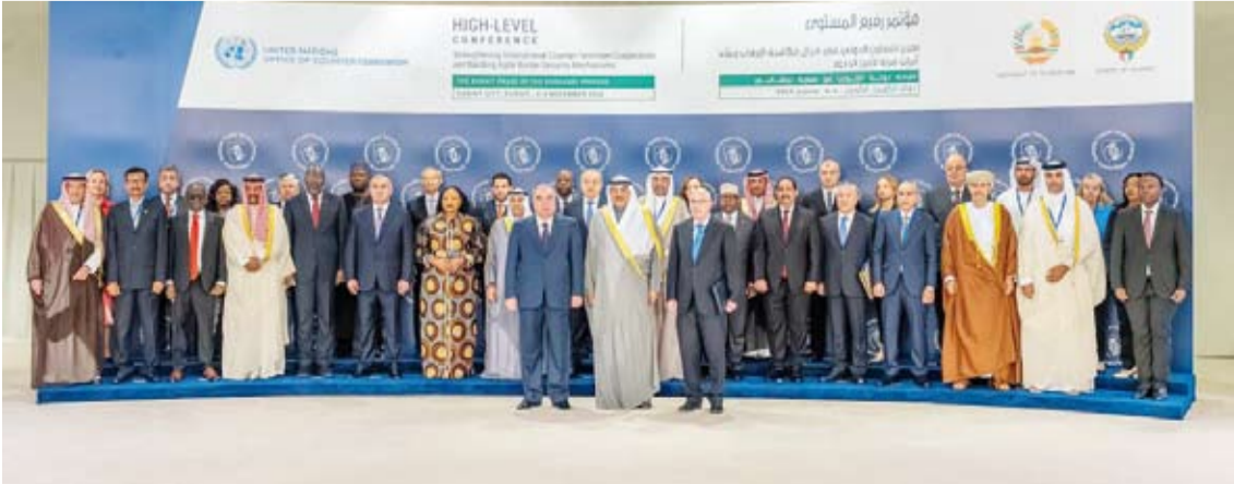
لقطة جماعية للمشاركة

فبناء على ذلك إلى جانب مواجهة هذه التهديدات يجب علينا أن نقوي تنسيق