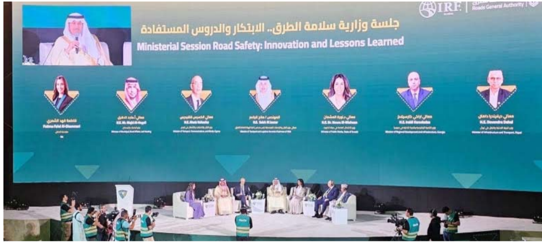
المشعان تشارك في المؤتمر

تقارب 50 في المئة متجاوزة الأهداف المحددة في الاستراتيجية الوطنية للنقل والخدمات اللوجستية مشيراً إلى تنفيذ عدة مبادرات تدعم الحفاظ على جودة وسلامة الطرق بالسعودية. وذكر الجاسر أن شبكة الطرق في المملكة تعد الأولى عالمياً من حيث الترابط وتعزز التنمية المستدامة للأفراد والبضائع وفق أعلى معايير الأمن والسلامة.