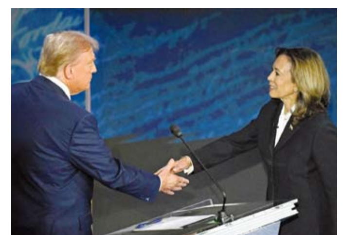
هاريس وترامب.. من سيصل إلى كرسي الرئاسة؟

ينطلق اليوم السباق الرئاسي الأمريكي الستين، حيث يتوجه الناخبون إلى صناديق الاقتراع اليوم الثلاثاء لاختيار الرئيس الأمريكي ونائبه للسنوات الأربع المقبلة، علماً بأن العديد من الأمريكيين كانوا قد أدلوا بأصواتهم في وقت سابق عبر التصويت المبكر، ومن خلال التصويت بالبريد الإلكتروني. وقد اكتسبت هذه الانتخابات بعداً جديداً وأزدادت سخونتها وخطت أوقافها بعد انسحاب الرئيس الأمريكي جو بايدن قبل أربعة أشهر من انطلاق السباق نحو البيت الأبيض لصالح نائبته كامالا هاريس، التي تخوض الآن السباق الرئاسي ضد المرشح الجمهوري دونالد ترامب، الساعي لإعادة انتخابه لولاية ثانية غير متتالية، بعد خسارته أمام بايدن في الانتخابات الرئاسية عام 2020.