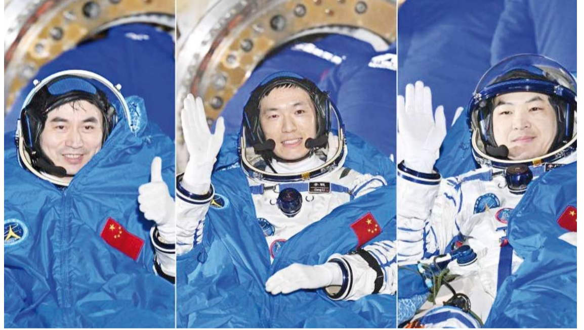
طاقم المركبة الفضائية «شنتشو-18»

«شنتشو-18» هبطت في موقع دونغفنغ للهبوط في منطقة منغوليا شمال الصين صباح أمس، وغادر جميع أفراد الطاقم كبسولة العودة. وأشارت الوكالة إلى أن رواد الفضاء الذين كانوا على متنها يتمتعون بحالة