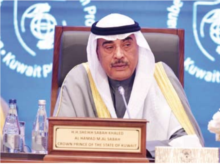
سمو ولي العهد الشيخ صباح الخالد متحدثاً خلال المؤتمر