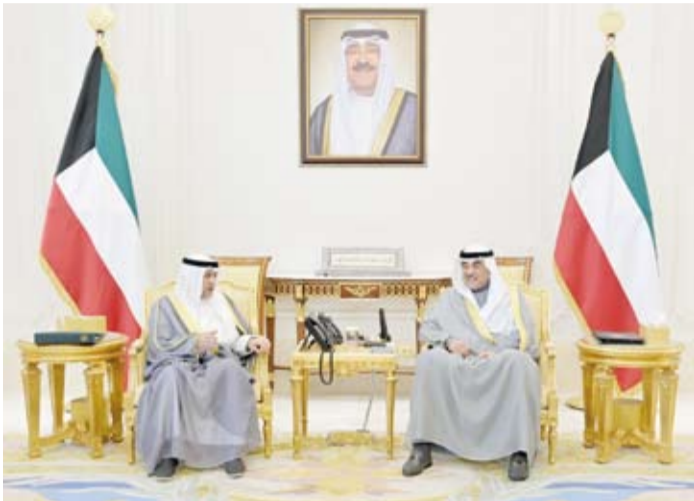
.. وسموه يستقبل الأمين العام لمجلس التعاون لدول الخليج العربية