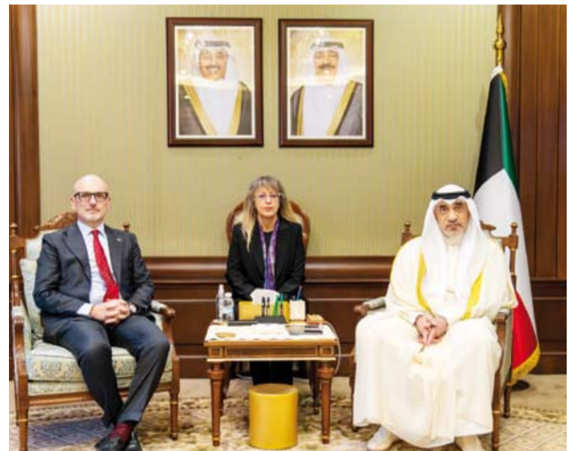
الشيخ فهد اليوسف خلال لقائه السفير الإيطالي

استقبل رئيس مجلس الوزراء بالإتابة وزير الدفاع ووزير الداخلية الشيخ فهد اليوسف، في قصر بيان، سفير جمهورية إيطاليا الصديقة لدى الكويت لورنزو موريني. وجرى خلال اللقاء استعراض سبل تطوير العلاقات الثنائية المميزة بين البلدين الصديقين وتعزيز التعاون في مختلف المجالات إضافة إلى تبادل وجهات النظر حول عدد من القضايا ذات الاهتمام المشترك، وحضر المقابلة رئيس ديوان رئيس مجلس الوزراء عبدالعزيز الدخيل ووزير الأشغال العامة الدكتور نورة المشعان ووكيل وزارة الدفاع الشيخ الدكتور عبدالله مشعل الصباح ونائب رئيس الأركان العامة للجيش اللواء الركن طيار الشيخ صباح جابر الأحمد الصباح.