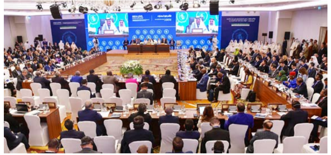
سمو ولي العهد متحدثاً خلال افتتاح المؤتمر

تسلم سمو ولي العهد الشيخ صباح الخالد، الدعوة الموجهة إلى صاحب السمو أمير البلاد الشيخ مشعل الأحمد، من أخيه خادم الحرمين الشريفين الملك سلمان بن عبدالعزيز ملك المملكة العربية السعودية للمشاركة في قمة عربية إسلامية مشتركة غير عادية والتي ستعقد في مدينة الرياض في 11 نوفمبر الجاري. وقام بتسليم الرسالة لسموه سفير خادم الحرمين الشريفين لدى الكويت سمو الأمير سلطان بن سعد.