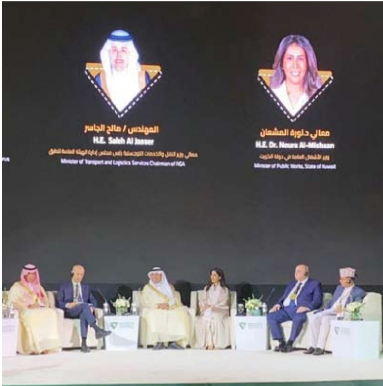
المشعان والوزراء أثناء المؤتمر