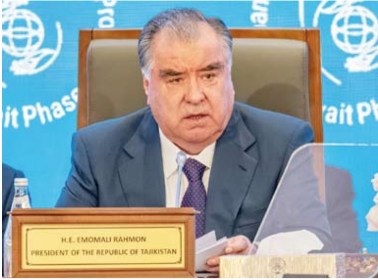
رئيس طاجيكستان امام علي رحمان

وأشاد بالجهود الكبيرة التي تبذلها دول المجلس في مكافحة الإرهاب بكل أشكاله مع تزايد التحديات الإقليمية إذ تمكنت دول المجلس من الحد من انتشار الفكر المتطرف في صفوف أوساطها أمام التهديدات التي تمس أمنها فيفضل تبادل المعلومات الأمنية وتطوير التشريعات الوطنية لمكافحة تمويل الإرهاب وتنفيذ برامج مكافحة التطرف.