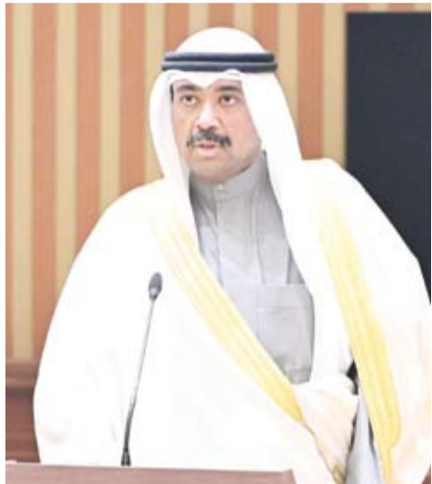
الشيخ عبدالله العلي يؤدي اليمين الدستورية