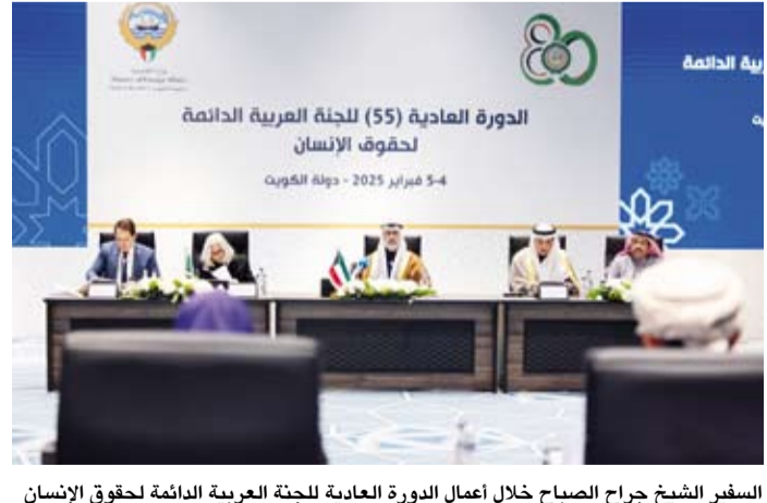
السفير الشيخ جراح الصباح خلال أعمال الدورة العادية للجنة العربية الدائمة لحقوق الإنسان

وأكد عزم دولة الكويت مواصلة الجهود الدؤوبة للارتقاء بمسيرة العمل العربي الحقوقي المشترك ودعم كافة المبادرات التي تأتي في إطار اللجنة الأم في منظمة حقوق الإنسان العربية التي تم إنشاؤها في عام 1968 متمنياً أن يخرج هذا الاجتماع بتوصيات فاعلة وملموسة تدعم وتعزز جهود وثقافة حقوق الإنسان في منطقتنا العربية. وقد انطلقت، أمس، أعمال الدورة العادية الـ 55 للجنة العربية الدائمة لحقوق الإنسان التي تستضيفها دولة الكويت لمدة يومين بحضور نائب وزير الخارجية السفير الشيخ جراح جابر الأحمد الصباح ومشاركة الجهات الحكومية المعنية في الدول الأعضاء.