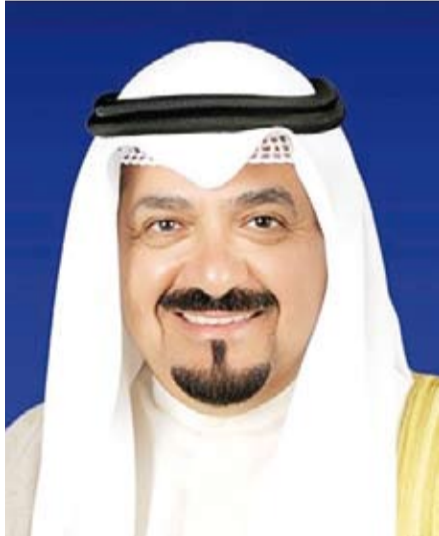
سمو الشيخ أحمد العبد الله