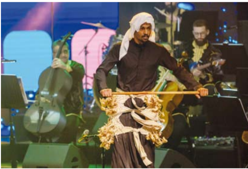
لوحات فنية ضمن حفل الافتتاح

وستستمر فعاليات المهرجان حتى 12 فبراير الجاري تحت شعار «ثلاثون عاماً من الريادة والعباء» وتجمع بين الفنون والموسيقى والآداب والندوات الفكرية كما سيتم تكريم شخصية المهرجان وهو السعودي الدكتور عبدالله الغدامي.