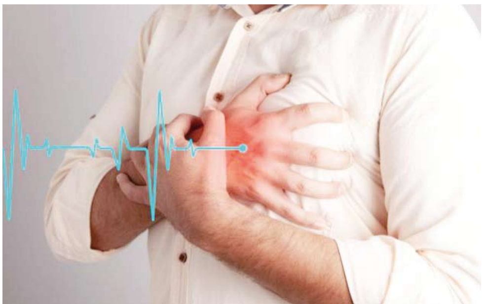
علاج قصور القلب

تمكن باحثون المان من تطوير رقاقات قابلة للزرع مصنوعة من خلايا عضلة القلب النابض، لعلاج المرضى الذين يعانون من قصور القلب المتقدم ومساعدة القلب في الانقباض بشكل أكثر فعالية. ووفقاً لدراسة حديثة، فإنه يتم تصنيع هذه الرقاقات من خلايا مأخوذة من الدم وتتم إعادة برمجتها لتعمل كخلايا جذعية، ما يمكنها من التحول إلى أي نوع من الخلايا في الجسم، وفي حالة قصور القلب يتم تحويل هذه الخلايا إلى خلايا عضلة القلب والأنسجة الضامة، لتتم بعد ذلك زراعتها في «ملاص الكولاجين» وتنميتها في قوالب مصممة خصيصاً تم تثبيت على غشاء للاستخدام البشري. وقال إنغو كوتشكا البروفيسور بالمركز الطبي بجامعة غوتنغن بألمانيا وأحد مؤلفي الدراسة: أصبح لدينا حالياً ولأول مرة رقاقة بيولوجية نمت في المختبر، لديها القدرة على استقرار وتحسين وظائف القلب ومنع تدهور حالته، بالإضافة إلى تقوية عضلته. وتعد هذه الرقاقات تطوراً مهماً، حيث تسمح بإدارة عدد أكبر من خلايا عضلة القلب مع تقليل المخاطر، على عكس حقن خلايا عضلة القلب مباشرة، والذي يؤدي إلى نمو الأورام أو عدم انتظام ضربات القلب، وهو ما قد يكون قاتلاً. يشار إلى أن أكثر من 64 مليون شخص حول العالم يعانون من قصور القلب الناتج عن أسباب مثل السبوبات القلبية وارتفاع ضغط الدم وأمراض الشرايين التاجية، ومع نقص الأعضاء المتاحة لعمليات زراعة القلب، وارتفاع تكلفة المضخات القلبية الاصطناعية ومضاعفاتها، يقدم الابتكار الجديد أملاً جديداً للمرضى.