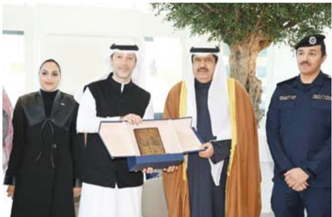
تقديم درع تذكارية لمحافظ حولي