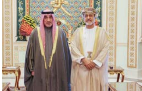
السلطان هيثم بن طارق المعظم يستقبل الشيخ فهد اليوسف

بعمق العلاقات التاريخية التي تجمع البلدين الشقيقين والتعاون المشترك في مختلف المجالات. وجرى خلال اللقاء تبادل الأحاديث الودية واستعراض العلاقات الأخوية الراسخة بين دولة الكويت وسلطنة عمان وسبل تعزيزها لشؤون الدفاع العماني صاحب السمو شهاب بن طارق آل سعيد.