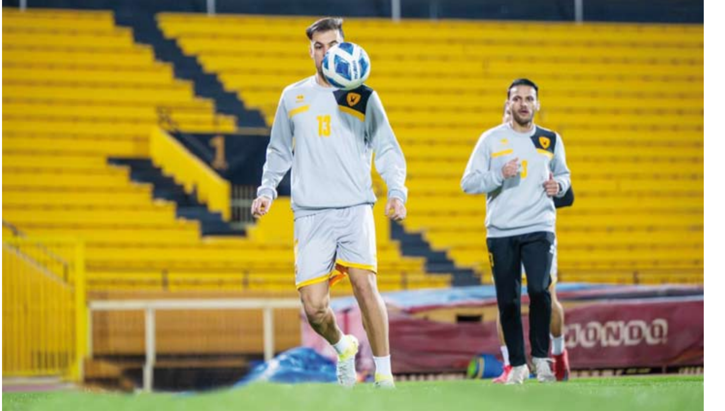
الأصفر استعد جيداً لمواجهة الخليجية