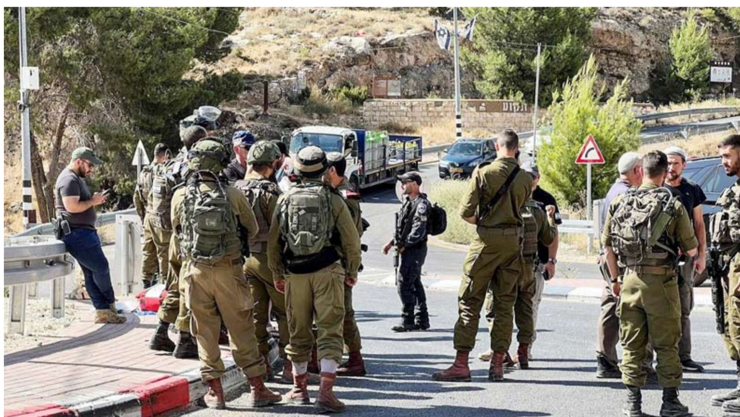
جنود الاحتلال قرب موقع إطلاق النار

وتشير بيانات وزارة الصحة في غزة إلى أن الهجوم العسكري الإسرائيلي على القطاع أودى بحياة أكثر من 47 ألف فلسطيني، وأثار اتهامات بالإبادة الجماعية وجرائم الحرب التي تنفيها إسرائيل. وتوقفت المعارك حالياً في ظل وقف إطلاق نار هش. واندلعت أحدث موجة من إراقة الدماء في الصراع الإسرائيلي الفلسطيني المستمر منذ عقود في السابع من أكتوبر 2023، عندما شن مسلحون من حركة المقاومة الإسلامية الفلسطينية (حماس) هجوماً على إسرائيل، تفيد إحصاءاتها بأنه تسبب في مقتل 1200 شخص واحتجاز نحو 250 رهينة. وأعلن الجيش الإسرائيلي، قتل مسلح خلال تبادل لإطلاق النار في شمال الضفة الغربية المحتلة حيث نفذ عملية عسكرية واسعة النطاق منذ نحو أسبوعين. وقال الجيش في بيان إن «إرهايباً أطلق النار على جنود قرب حاجز عسكري في تياسير» في شرق جنين مضيافاً «بتبادل الجنود إطلاق النار مع الإرهابي وقتلوه». وقالت خدمة إسعاف نجمة داوود الحمراء إنها قدمت العلاج لستة أشخاص كانوا في موقع الحادث، قبل أن تنقلهم إلى المستشفيات لتلقي العلاج. وأفساد المتحدث باسم مستشفى «بيلينسون» قرب تل أبيب، بأن أربعة من المصابين يخضعون لتقييم طبي أولي، فيما أعلنت إذاعة الجيش الإسرائيلي أن جنديين في حالة حرجة.