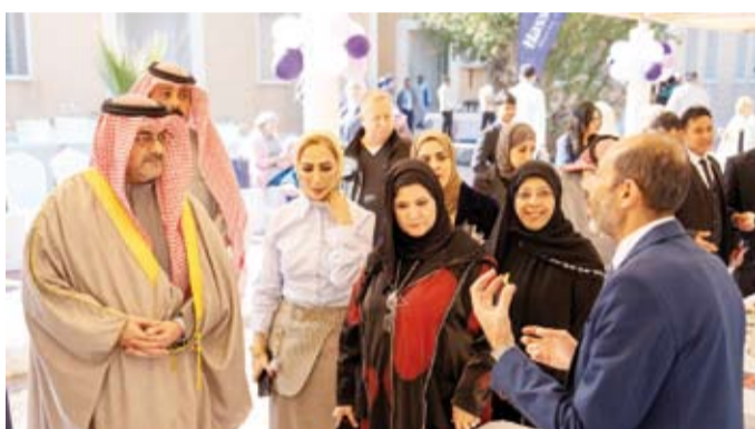
جولة في المعرض

نبهت إلى أن التهابات الأذن الوسطى الحادة تعد من أكثر المشاكل الصحية انتشاراً بين الأطفال ما يستدعي علاجها بشكل سريع لتجنب المضاعفات وتدهور القدرة السمعية مشيرة إلى تزايد أعداد الحالات بعد جائحة كورونا بما في ذلك ظهور حالات غير مسبوقة تمت متابعتها وعلاجها وفق أحدث الإجراءات الطبية.