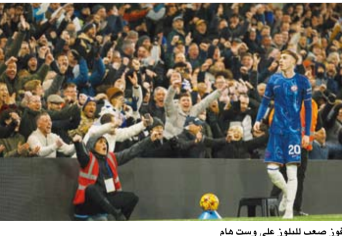
فوز صعب للبلوز على وست هام