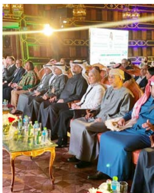
قيادي الأشغال والبلدية والكهرباء والدفاع والداخلية