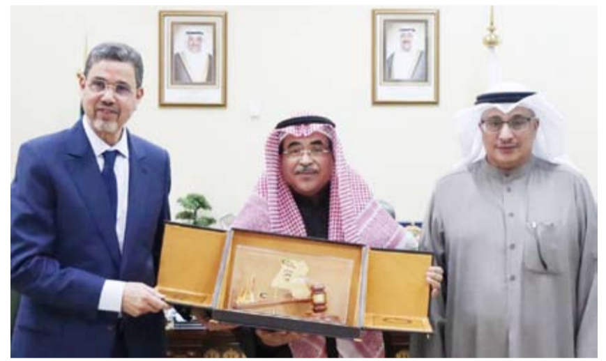
المستشار عادل البجوه والمستشار محمد عبد النباوي خلال اللقاء

بحث رئيس المحكمة الدستورية بالإنابة ووكيل محكمة التمييز المستشار عادل البجوه والرئيس الأول لحكمة النقض بالملكة المغربية الرئيس المنتخب للمجلس الأعلى للقضاء القضائية المستشار محمد عبد البجوه أو وجه التعاون المشترك. وذكرت وزارة العدل في بيان صحفي أمس أن هذا اللقاء يأتي في إطار تعزيز التعاون القضائي وتبادل الخبرات والممارسات الدستورية في مجال العدالة والقانون بما يساهم في تطوير الأنظمة القضائية وترسيخ مبادئ سيادة القانون. وأكدت أهمية هذا الحدث في تعزيز العلاقات الثنائية بين المؤسسات القضائية وتوطيد أواصر