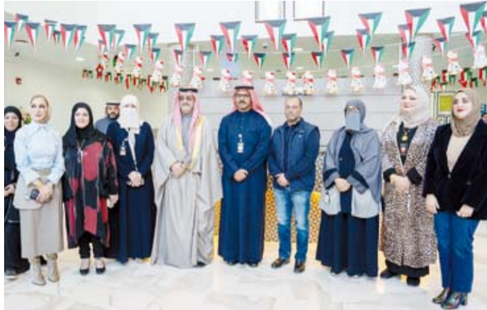
لقطة جماعية مع محافظ العاصمة الشيخ عبدالله سالم العلي الصباح