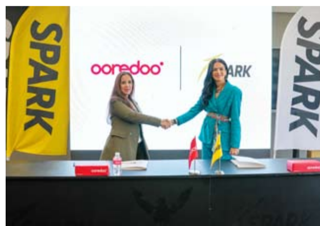
تجديد اتفاقية الشراكة