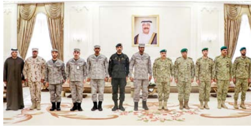
الفريق هاشم الرفاعي مستقبلاً قائد الحرس الوطني الإماراتي اللواء الركن صالح العامري والوفد المرافق

أكد وكيل الحرس الوطني الفريق الركن مهندس هاشم الرفاعي، أمس، أهمية إقامة التمارين المشتركة مع الأشقاء في دولة الإمارات العربية المتحدة بما يساهم في زيادة الخبرات ومواكبة المستجدات العسكرية والأمنية وتعزيز التعاون المشترك.