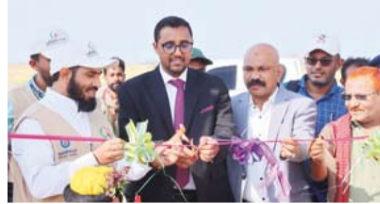
جانب من افتتاح القرية

المؤسسة لدعم الأسر الفقيرة والمحتاجة في اليمن، مشيراً إلى أن المشروع يهدف إلى توفير بيئة معيشية ملائمة وتحسين الظروف الحياتية لأهالي القرية. وأضاف أن هناك قريتين أخريين سيتم افتتاحهما خلال الأيام المقبلة، وذلك في إطار توسيع نطاق برنامج دعم الأسر الفقيرة والمحتاجة في اليمن، حيث تسعى هذه الجهات إلى تنفيذ مشاريع تنموية متكاملة تساهم في تحسين الظروف المعيشية للمواطنين اليمنيين، خاصة في المناطق التي تعاني من نقص الخدمات الأساسية.