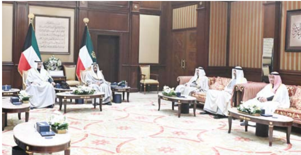
سمو الأمير يستقبل بحضور سمو ولي العهد سمو الشيخ أحمد عبدالله ووزير الدفاع