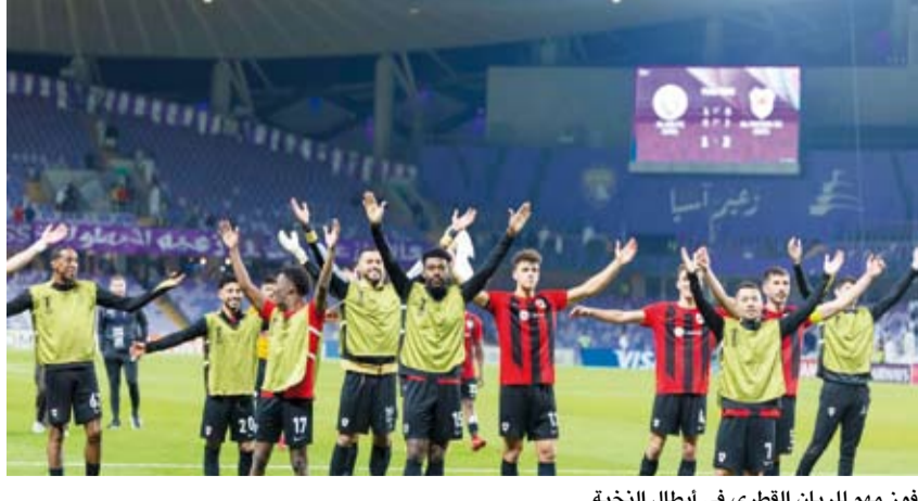
فوز مهم للريان القطري في أبطال النخبة

لحسم التأهل. بالمقابل تجمد رصيد العين حامل لقب النسخة الأخيرة من دوري أبطال آسيا 2023 - 2024، عند النقطة الثامنة في المركز الحادي عشر وقبل الأخير، ليغادر المنافسة بغض النظر عن نتيجة المواجهة الأخيرة أمام الشرطة العراقي. وسجل للريان اللاعب المصري محمود حسن "تريزيغيه" في الدقيقة (50) والبرازيلي روجر غيديش في الدقيقة (75).. وسجل للعين اللاعب البراغوياني اليخاندرو روميرو "كاكو" في الدقيقة (42).