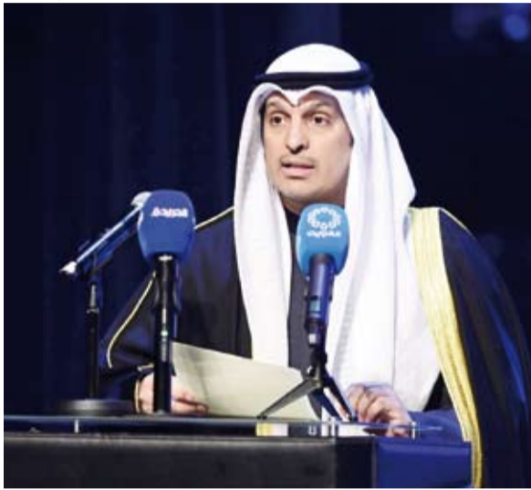
وزير الإعلام يلقي كلمة خلال افتتاح المهرجان