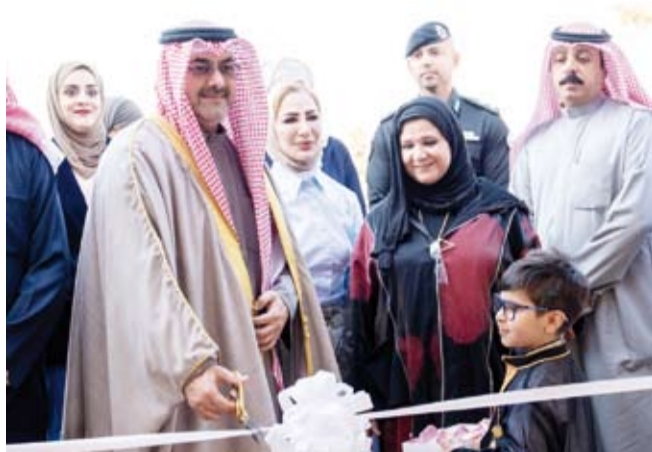
محافظ العاصمة الشيخ عبد الله سالم العلي الصباح يقف مع معرض اليوم التوعوي

بالمشاكل السمعية وأهمية معالجتها في أسرع وقت ممكن. وأشارت إلى تداعيات إهمال مشاكل السمع خصوصاً لدى الأطفال وتأثيرها السلبي على تحصيلهم الدراسي ومستقبلهم المهني مؤكدة أن هناك عدة خيارات علاجية متاحة بما في ذلك زراعة القوقعة التي يمكن أن تحدث فرقاً كبيراً في حياة الأطفال المصابين.