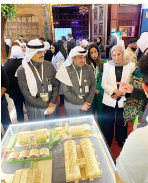
جولة في المعرض