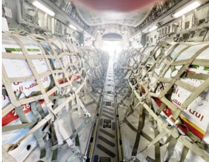
المساعدات على متن الطائرة