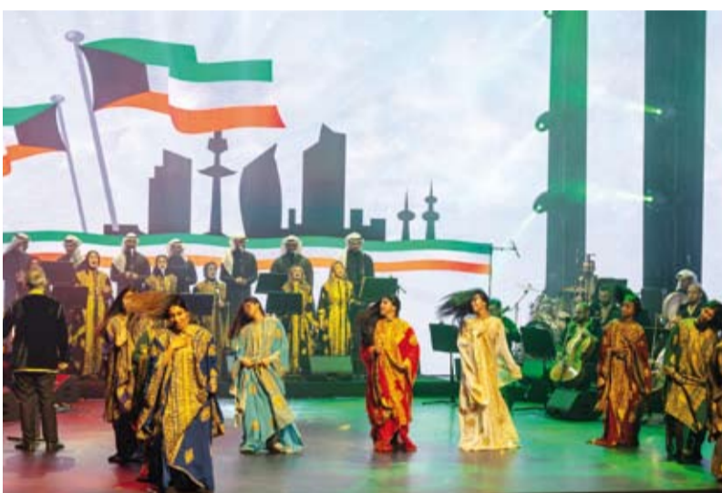
جانب من حفل الافتتاح

المطيري: المهرجان يعكس التزام الكويت العميق بدعم الفنون والآداب وتعزيز الهوية الثقافية الكويت سبّاقة في تأسيس رؤية ثقافية متكاملة منذ استقلالها