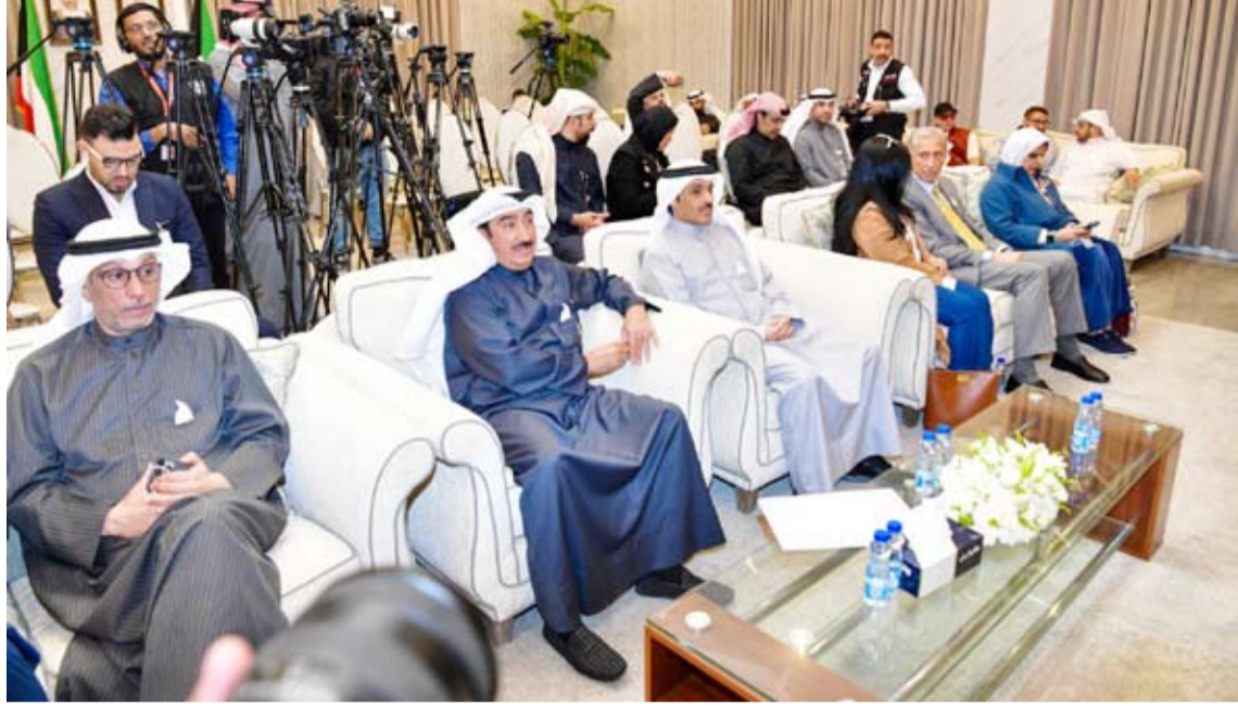
جانب من المؤتمر الصحفي

أوضح رئيس اللجنة العليا لجائزة «شراع» للإعلام الكويتية سعد العلي، أن الجائزة السنوية تهدف إلى تكريم الإسهامات البارزة للإعلاميين الكويتيين الذين لعبوا دوراً محورياً في ترسيخ مكانة الكويت كمناخ للتميز الإعلامي في العالم العربي، لافتاً إلى أنها تأتي كذلك لتعزيز روح الإبداع والابتكار في قطاع الإعلام الكويتي، وخلق بيئة تنافسية تعزز الجودة المهنية، وتسلط الضوء على الدور المحوري للإعلام في تشكيل الرأي العام ودعم القضايا المجتمعية. جاء ذلك خلال المؤتمر الصحفي الذي عقد في وزارة الإعلام أمس والذي تم فيه الإعلان عن تفاصيل الجائزة التي كان قد أعلن عن إطلاقها وزير الإعلام والثقافة عبد الرحمن المطيري الأسبوع الماضي.