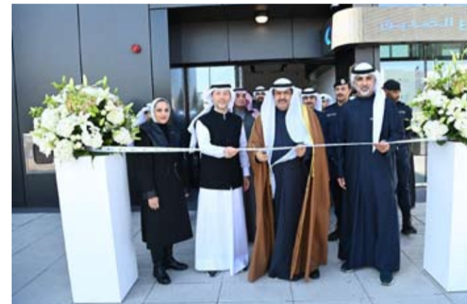
محافظ حولي يفتتح فرع بنك الكويت الدولي

معرفي. وقد أكد المحافظ على أهمية هذه الخطوة في تعزيز الخدمات المصرفية المتكاملة في المنطقة. كما أشار إلى أهمية تواجد أفرع