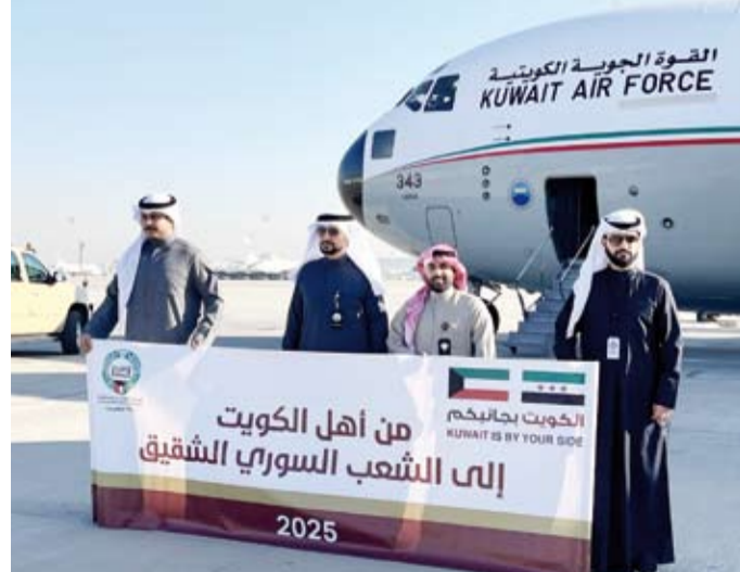
الجهات الرسمية المشاركة بالرحلة الإغاثية

بالقوة الجوية الكويتية لتسهيل إيصال المساعدات والتنسيق مع الجهات المعنية في سورية، مؤكداً أنه بفضل التوجيهات السامية تواصل دولة الكويت مسيرة عطائها الانساني في عون ومساعدة المحتاجين أينما كانوا. يذكر أن هذه الرحلة تعد الثانية لبيت الزكاة الكويتي بمجموع مساعدات إقلاع رحلة أخرى لبيت الزكاة الكويتي يوم الأحد المقبل محملة بـ40 طناً من المساعدات الإغاثية. وأعرب عن شكره لوزارة الخارجية ووزارة الدفاع ممثلة