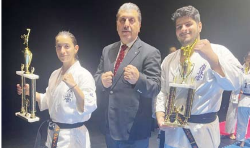
لاعب منتخب الكويت للكيوكوشن كاراتيه مع المدرب

الدولية». وأعرب عن رضاه عما قدمه الأبطال الكويتيون في البطولة التنافسية بمشاركة أبطال من أمريكا وكندا وبولندا ومنغوليا ونيوزيلندا وإيران. وأهدى هذا الإنجاز المشرف إلى دولة الكويت قيادة وحكومة وشعباً معرباً عن جزيل الشكر لرئيس اللجنة الأولمبية الكويتية الشيخ فهد ناصر صباح الأحمد الصباح ونائب رئيس اللجنة الأولمبية الكويتية الشيخ مبارك فيصل النواف الصباح على دعمهما "اللا محدود" ومساندتهما للفريق.