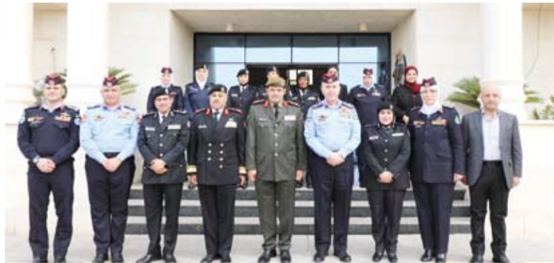
الوفد العسكري الكويت خلال الزيارة

قام وفد من كلية علي الصباح العسكرية وهيئة التعليم العسكري وأكاديمية سعد العبدالله للعلوم الأمنية بزيارة قيادة الشرطة النسائية الأردنية الهاشمية، بهدف تعزيز وتبادل الخبرات في مجال التعليم والتدريب الأمني للعنصر النسائي، حيث أطلع الوفد على نظام التسجيل والقبول والكلية