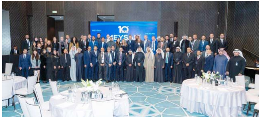
فريق ميسان ويتوسطهم أعضاء مجلس الإدارة والإدارة التنفيذية

الأشخاص واستثمارهم لوقتهم، حتى على حساب عائلاتهم.