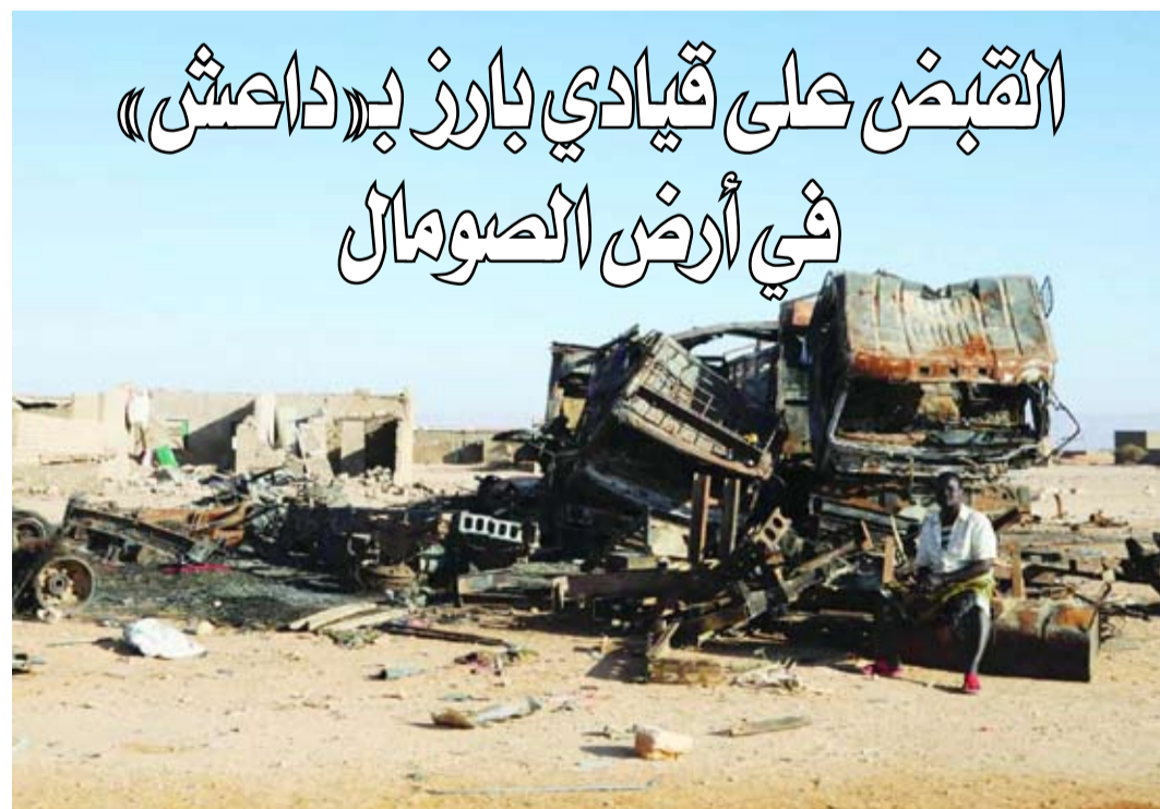
مركبات عسكرية محترقة استخدمها «داعش»