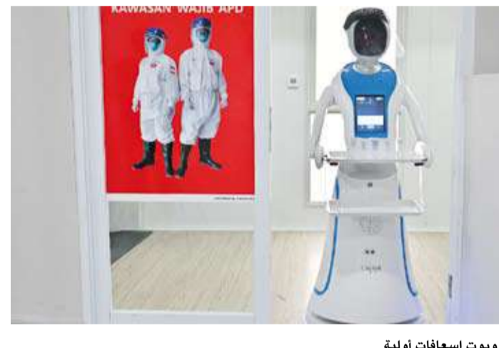
روبوت إسعافات أولية

مع انتشار حرائق الغابات بشكل أسرع مما كانت عليه في الماضي بسبب ارتفاع درجات الحرارة العالمية، ابتكرت شركة ألمانية تقنية جديدة لمكافحة الحرائق، تتمثل في كرة خضراء ضخمة تشبه كرة الغولف العملاقة، مزودة بالواح شمسية وتحوي على طائرة مسيرة تعمل بالذكاء الاصطناعي، يجري تطويرها لتكون قادرة على رصد الحرائق وإطفائها في غضون دقائق. وأدت موجة حر غير مسبوقة في صيف 2022م، إلى اجتياح النيران لغاية غربي برلين، ضمن سلسلة حرائق ضربت أنحاء ألمانيا، مدفوعة بعوامل مثل الجفاف والرياح القوية وارتفاع الحرارة، وتهدف هذه التقنية إلى مواجهة التحديات المتزايدة التي باتت تهدد حتى المناطق القريبة من العاصمة الألمانية برلين، في حين كانت الحرائق نادرة في السابق، ما دفع الشركة إلى تطوير أدوات حديثة للوقاية من الحرائق، وإدارتها أثناء اندلاعها، ومعالجة تداعياتها لاحقاً. ويعتمد النظام الجديد على الكرة الخضراء كمحطة مستقلة تعمل بالطاقة الشمسية، وتُطلق الطائرة المسيرة عند اكتشاف علامات مبكرة للحريق مثل الدخان أو الحرارة، باستخدام أجهزة استشعار متطورة مدعومة بالذكاء الاصطناعي، لتحديد موقع النيران بدقة وإخمادها قبل تفاقمها.