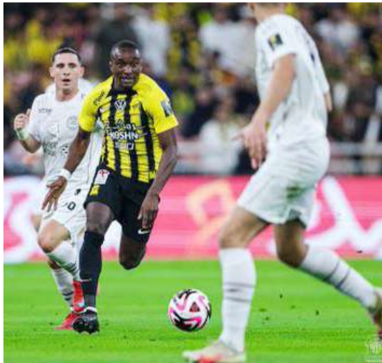
الوقت الضائع كلمة السر في فوز الاتحاد على الشباب