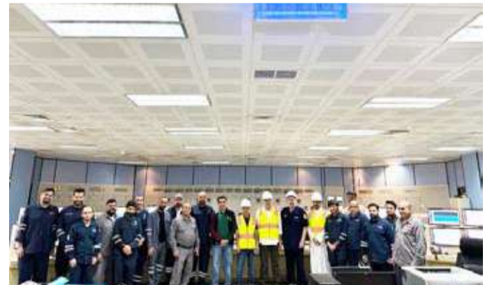
وزير الكهرباء متوسطا العاملين في محطة الصبية

الدكتور عادل محمد الزامل والوكيل المساعد لمحطات القوى الكهربائية وتقطير المياه بالتكليف المهندس محمد خزعل.