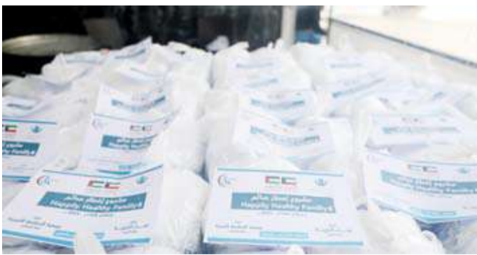
مشروع إفطار صائم