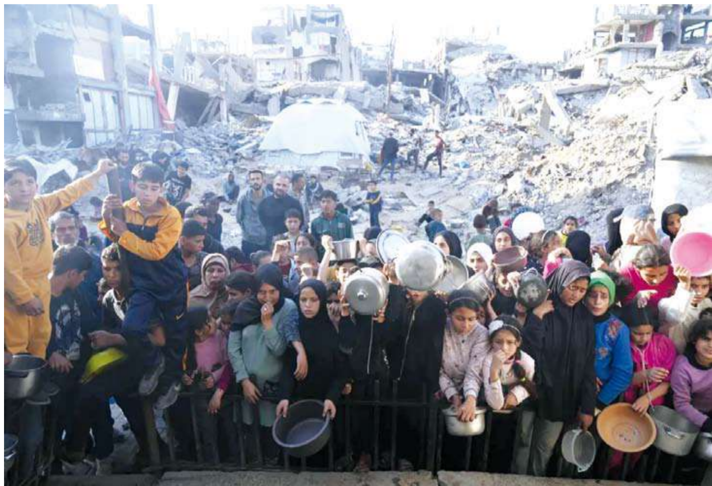
فلسطينيون ينتظرون توزيع وجبات مجانية

الإسرائيليون، وقال إن هذه هي الطريقة الوحيدة لإنهاء الحرب.