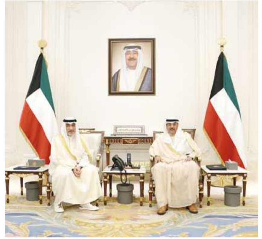
سمو ولي العهد يستقبل رئيس مجلس الوزراء بالإنابة

استقبل سمو ولي العهد الشيخ صباح الخالد، بقصر بيان، صباح أمس، رئيس مجلس الوزراء بالإنابة الشيخ فهد اليوسف.