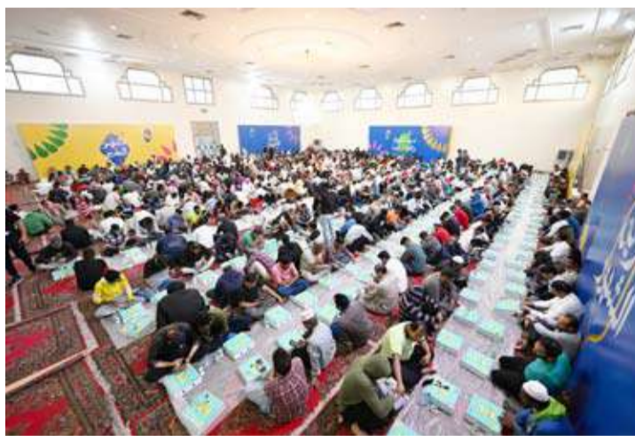
موائد زين استقبلت الصائمين يومياً

كعادتها في كل عام، استقبلت زين شهر رمضان المبارك بإطلاق حملتها الرضائية "زين الشهور"، التي تعد من أوائل وأبرز الحملات المجتمعية في الكويت، ومن بين أهدافها نطاقاً أوسع وأكثرها شمولية في البلاد، حيث انطلقت قبل أكثر من 11 عاماً، وتستمر سنوياً بتحقيق نجاحات كبيرة عبر مجموعة متنوعة ومتجددة من البرامج التطوعية والخيرية والإنسانية والاجتماعية والدينية التي انطلقت قبيل حلول الشهر الفضيل وتواصلت يوماً حتى عيد الفطر المبارك. سعت حملة زين الشهور إلى ترسيخ التطوع والتواصل عبر برامجها المتعددة، والتي ارتكزت جميعها حول قيم العطاء، ومساعدة الغير، والتعاون المشترك لتحقيق الأثر الإيجابي في المجتمع، كما فتحت زين كعادتها باب التطوع أمام موظفيها للمشاركة في إنشاء فريق زين الشهور التطوعي الذي تكون من موظفي الشركة من مختلف القطاعات والإدارات، الذين شاركوا بفاعلية في البرامج الإنسانية والتطوعية طوال الشهر الفضيل. في هذا التقرير، تستعرض زين أبرز محطات حملتها الرضائية للعام 2025: