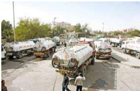
محطة ضخ الجهراء

أعلنت وزارة الأشغال العامة عن فتح عطاءات مناقصة إدارة وتطوير وتشغيل وصيانة محطة ضخ الجهراء والمرافق التابعة لها، حيث بلغ عدد العطاءات المقدمة 8، وفقا لكشف الأسعار المعتمد. وقرر مجلس إدارة الجهاز المركزي للمناقصات العامة إحالة وفائق العطاءات إلى وزارة الأشغال لدراستها وتقديم التوصيات اللازمة خلال 30 يوما، تمهيدا لاتخاذ القرار النهائي بشأن ترسية المناقصة. ويهدف المشروع إلى إدارة وتشغيل وصيانة وتطوير محطة ضخ الجهراء، بما يضمن تحسين أدائها واستدامة مرافقها.