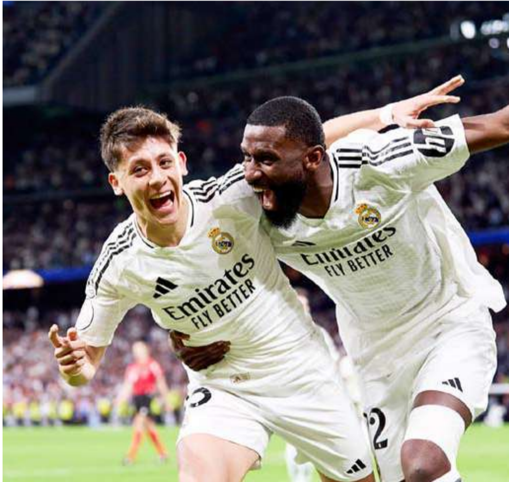
مباراة مثيرة بين ريال مدريد وريال سوسيداد

تاهل ريال مدريد إلى نهائي كأس ملك إسبانيا لكرة القدم بعد تعادل مثير مع ضيفه ريال سوسيداد بنتيجة (4-4) في إياب الدور نصف النهائي، في المباراة التي أقيمت على ملعب سانتياغو برنابيو.