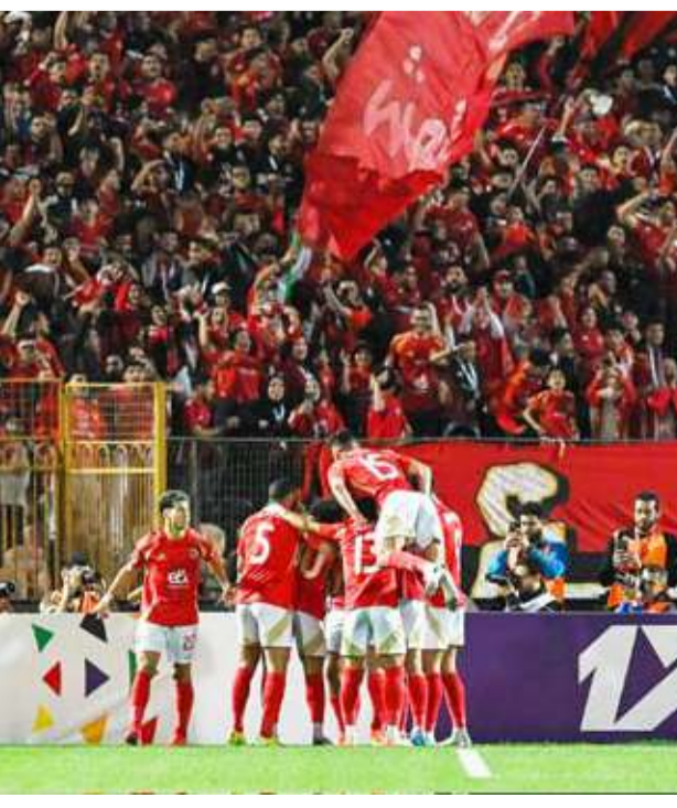
فوز غير مطمئن للأهلي المصري على الهلال السوداني

فاز ماملودي صن دوانز الجنوب إفريقي على ضيفه الترجي التونسي بهدف دون رد في ذهاب الدور ربع النهائي من دوري أبطال إفريقيا لكرة القدم. وسجل بيتر شالولي هدف المباراة الوحيد في الدقيقة (54). وتعد الخسارة هي الأولى للترجي أمام الفريق الجنوب إفريقي منذ أكتوبر عام 2000، حسب إحصائيات الاتحاد الإفريقي لكرة القدم، إذ التقى الفريقان (6) مرات فاز الترجي في ثلاث مباريات مقابل ثلاثة تعادلات. ويتعين على الفريق التونسي تحقيق الفوز بأكثر من هدف لضمان التأهل، عندما يستقبل الفريق الجنوب إفريقي في لقاء الإياب الثلاثاء المقبل في تونس.