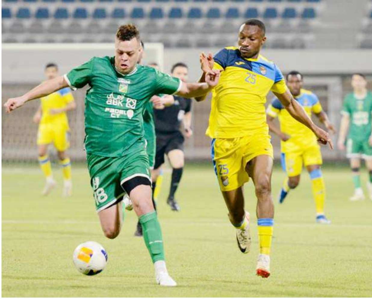
فوز صعب للعربي على الساحل

أعلنت رابطة الدوري الإنجليزي الممتاز لكرة القدم عن بدء تطبيق تقنية شبه آلية لرصد التسلسل في بطولة الدوري لأول مرة في وقت لاحق من الشهر الجاري. وأوضحت الرابطة، أن القرار يأتي بعد تجربة التقنية بنجاح في كأس الاتحاد الإنجليزي، ومن