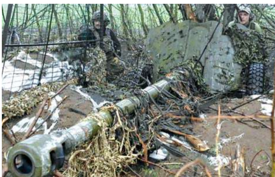
جنود أوكرانيون يستعدون لاستخدام مدفعهم الميداني

قالت وزارة الدفاع الروسية إن قواتها سيطرت على قرية روزليف في منطقة دونيتسك شرق أوكرانيا، وهي النقطة المحورية لتقديمها المستمر غرباً عبر المنطقة.