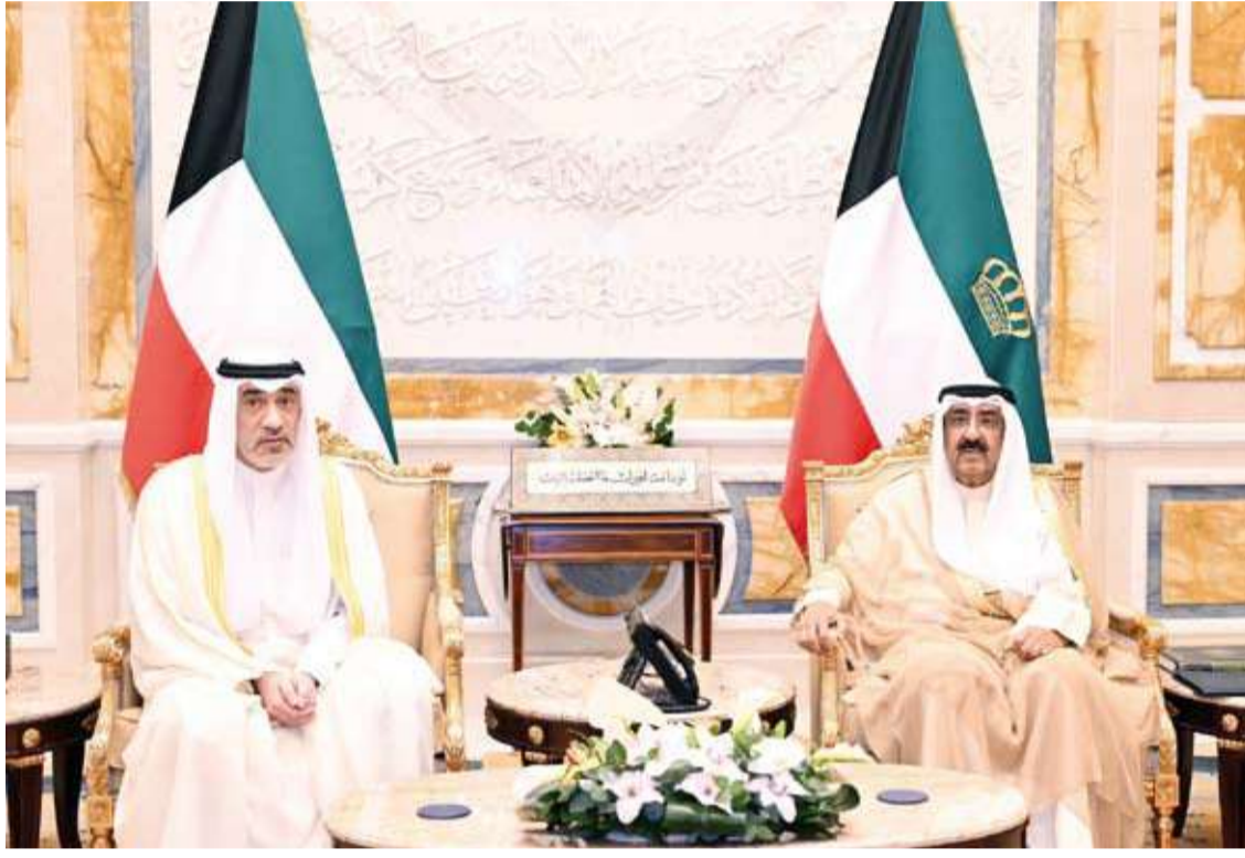
.. وسموه يستقبل الشيخ فهد اليوسف