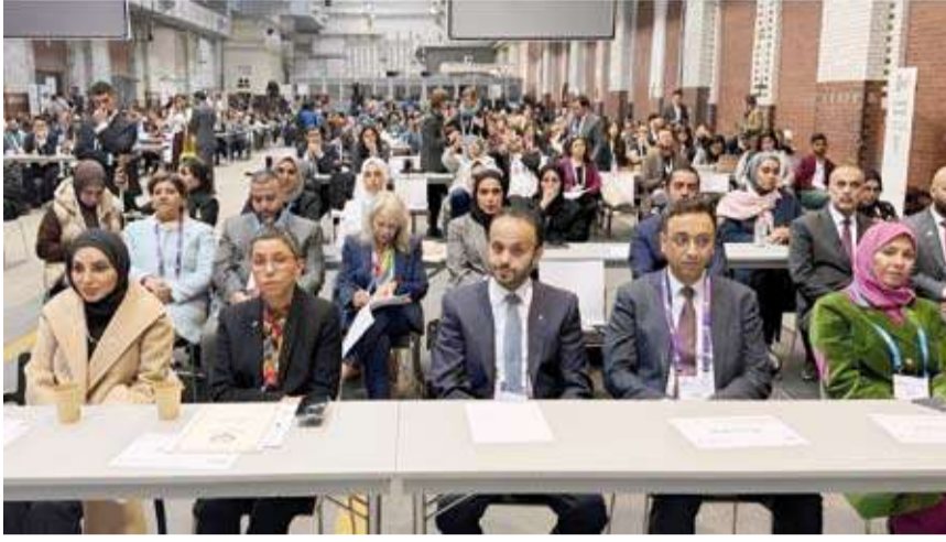
جانب من مشاركة الوفد الكويتي