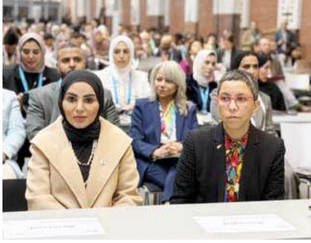
وزيرة الشؤون وسفيرة الكويت لدى ألمانيا ريم الخالد