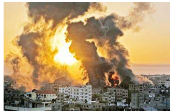
قصف الاحتلال متواصل على غزة

فيما استشهد 12 مواطناً فلسطينياً وأصيب آخرون بجروح، أمس، جراء تواصل عدوان الاحتلال الإسرائيلي على مناطق متفرقة من قطاع غزة. فقد أفادت مصادر محلية باستشهاد 3 مواطنين فلسطينيين جراء قصف الاحتلال لتجمعاً للمواطنين في منطقة السوارحة شمال غربي بلدة الزايدة وسط قطاع غزة، وتم نقل جثامين الشهداء إلى مستشفى شهداء الأقصى. كما استشهد مواطن فلسطيني جراء إصابته برصاص الاحتلال على شارع الرشيد غربي مخيم النصيرات وسط القطاع. وفي سياق متصل، أعلنت حكومة الكيان الإسرائيلي، أمس، توسيعاً كبيراً لعملياتها العسكرية في غزة كاشفة عن نيتها الاستيلاء على مناطق واسعة من القطاع وضمها إلى المناطق الأمنية إلى جانب عمليات إخلاء واسعة النطاق لمناطق بالطرق.