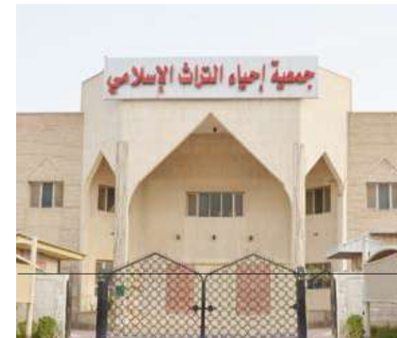
جمعية إحياء التراث الإنساني

عن طريق المساهمة في تبني المشاريع الخيرية والدعوة التي تقوم بها الجمعية مثل: وكالة الأيتام والطلبة المتفوقين، وكالة المدرسين، وعقد الدورات الشرعية، وبناء المساجد والمدارس، وترجمة وطباعة معاني القرآن الكريم، والكتب المختلفة في التوحيد والفقه والسيرة والأخلاق.