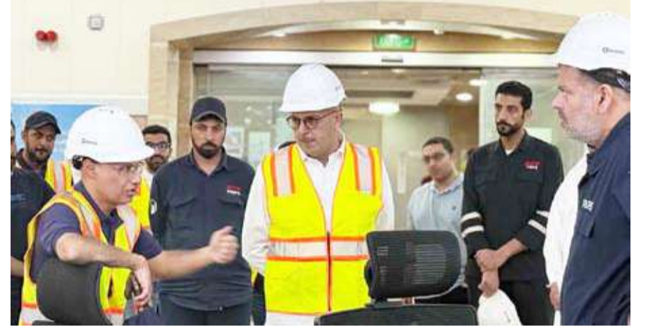
د. صبيح المخيزيم خلال جولته التفقدية في محطة الصبية أول أمس

أعلنت وزارة الكهرباء والماء والطاقة المتجددة، استقرار المنظومة الكهربائية وعودة التيار لجميع المناطق التي شهدت انقطاعاً محدوداً، صباح أمس. وقالت الوزارة في بيان صحفي: إنها تمكنت بالتنسيق مع هيئة الربط الكهربائي الخليجي من دعم الشبكة الكهربائية الوطنية وضمان استقرارها، مشيرة إلى أن الإجراءات الاحترازية التي اتخذت أسهمت