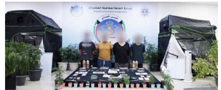
المتهمون الأربعة في قبضة رجال الأمن