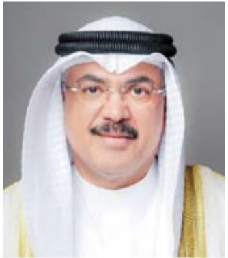
وزير التربية سيد جلال الطيبطائي

كذلك يتلقى ولي الأمر إشعاراً فوراً عبر تطبيق (سهل) فيقوم بتسجيل الإجازة المرضية في تجربة رقمية متكاملة تعكس دقة التنسيق بين الجهات الحكومية وسهولة الوصول إلى الخدمة.