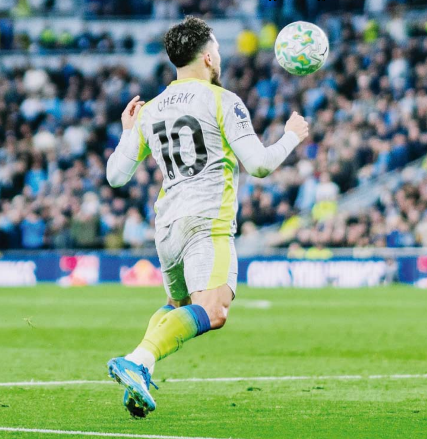
تعداد مخيب لسيتي أمام إيفرتون

نجا مانشستر سيتي في اللحظات الأخيرة من خسارة وشيكة أمام مضيغه إيفرتون، فارتضى التعادل 3-3 في المرحلة 35 من الدوري الإنجليزي لكرة القدم، إلا أن ذلك منح منافسه المباشرة، آرسنال، أفضلية صريحة في سباق اللقب. وأنهى سيتي الشوط الأول متقدماً بهدف جناحه البلجيكي جيريمي دوكو في الدقيقة 43. ودخل إيفرتون الشوط الثاني بقوة، ليحرز لاعبو «الشوفينز»، ثلاثة أهداف متتالية بواسطة كل من الفرنسي ثيرنو باري من خطأ قاتل لمدافع سيتي مارك غيهي في الدقيقة 68، قبل أن يضيف جاك أوبريان وباري من جديد هدفين في الدقيقتين 73 و 81. وقصص الترويجي إيرلنغ هالاند النتيجة في الدقيقة