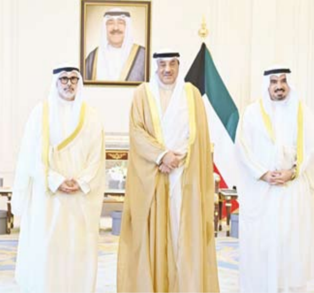
سمو ولي العهد مستقبلاً الشيخ جراح الجابر والسفير طلال الشطي

استقبل سمو ولي العهد الشيخ صباح الخالد، أمس، وزير الخارجية الشيخ جراح الجابر، حيث قدم لسموه رئيس البعثة الدبلوماسية الكويتية الجديد طلال الشطي سفيراً لدولة الكويت لدى جمهورية التشيك، وذلك بمناسبة توليه مهام منصبه الجديد، وحضر اللقاء رئيس ديوان سمو ولي العهد الشيخ ناهر الجابر وكبار المسؤولين.