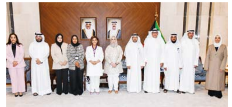
المشاركون في الاجتماع التنسيق

في تصريح لـ (كونا) عقب الاجتماع: إن هذا الاجتماع التنسيق ياتي في إطار تعزيز التكامل المؤسسي وتطوير التعاون في القضايا المرتبطة بسوق العمل الدولي بما يسهم في تحديث آليات استقدام العمالة وفقاً للمعايير الدولية والاتفاقيات الثنائية مع الدول المرسله.