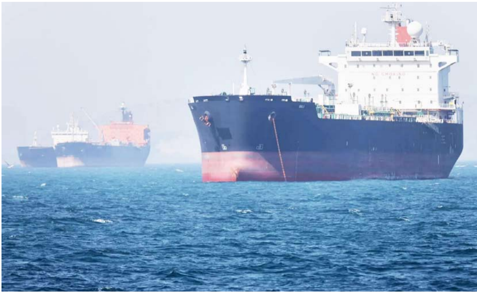
ناقلنا نفط راسبتان في مضيق هرمز