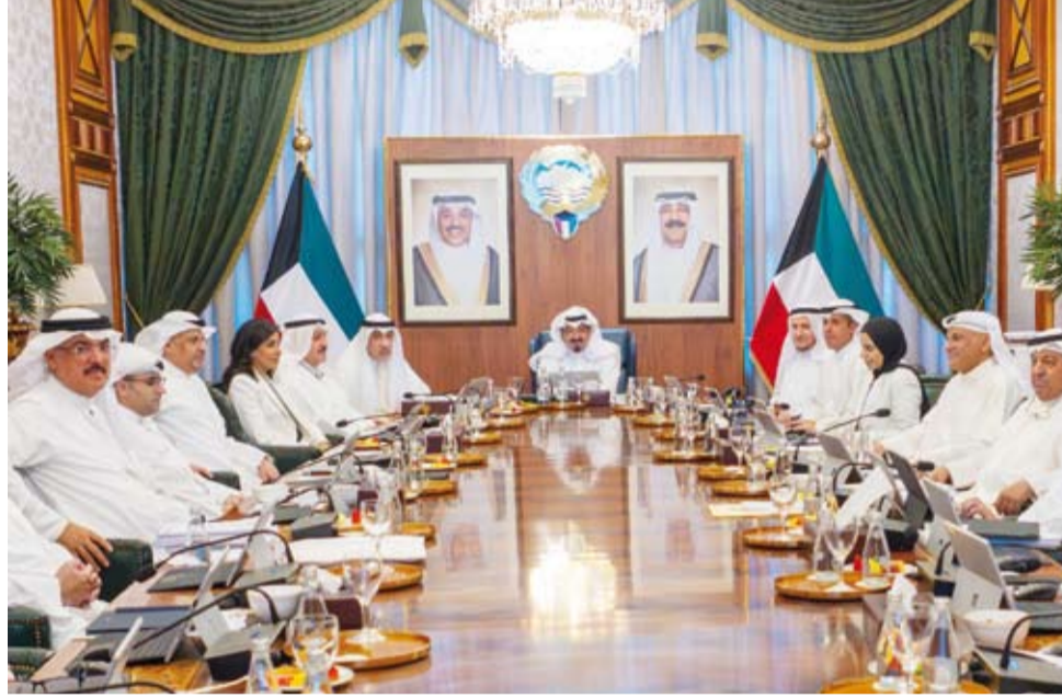
العبدالله مترسا اجتماع المجلس

استهدفت مواقع و منشآت مدنية في دولة الإمارات العربية المتحدة الشقيقة باستخدام الصواريخ والطائرات المسيرة وأدت إلى إصابة عدد من الأشخاص.