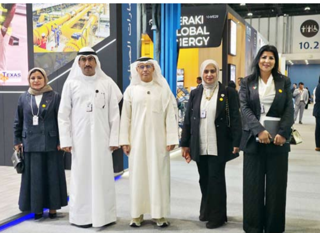
مسؤولو الأشغال والسكنية خلال حضور الفعاليات في أبوظبي

تحت شعار (الصناعة المتقدمة .. بنظير أقوى) بمشاركة وزراء وقادة أعمال ومستثمرين وصناعيين ومبتكرين من المنطقة والعالم. وتمثل مشاركة وفد الكويت في الفعالية بعدد من المسؤولين في قطاعات الأشغال والكهرباء والإسكان حيث تعد هذه النسخة الأكبر في الإمارات وتنتقل نحو 120 ألف زائر على مدار أربعة أيام وعلى مساحة عرض تبلغ 88 ألف متر مربع بمشاركة 1245 جهة عرضة تستعرض فرص التصنيع والمنتجات والتقنيات. ويضم وفد دولة الكويت المشارك في المنصة برئاسة وكيل وزارة الكهرباء والطاقة المتجددة الدكتور عادل الزامل ووكيل