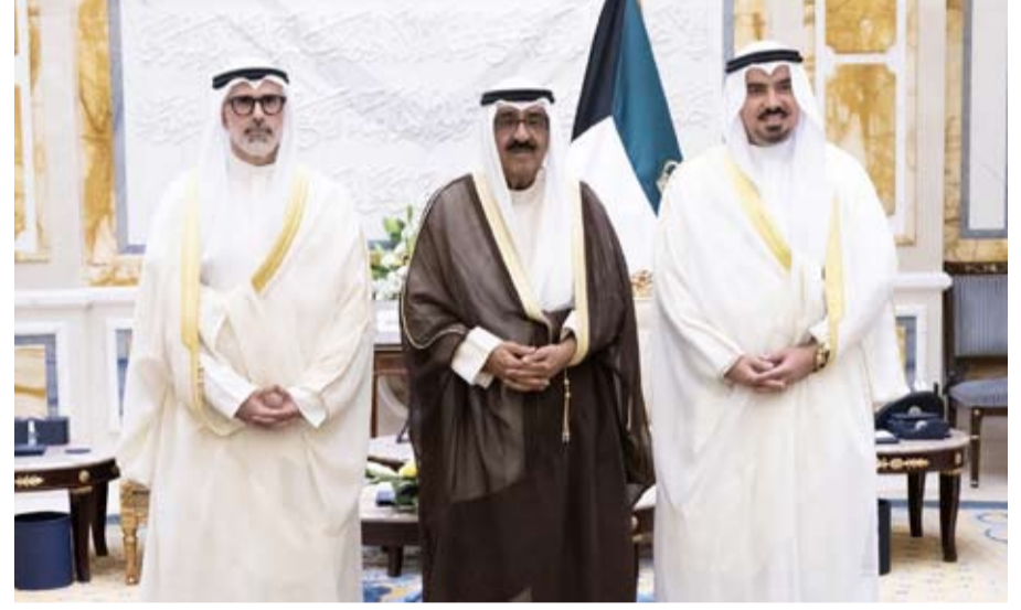
سمو أمير البلاد مستقبلاً الشيخ جراح الجابر والسفير طلال الشطي

استقبل صاحب السمو أمير البلاد الشيخ مشعل الأحمد الجابر، أمس، وزير الخارجية