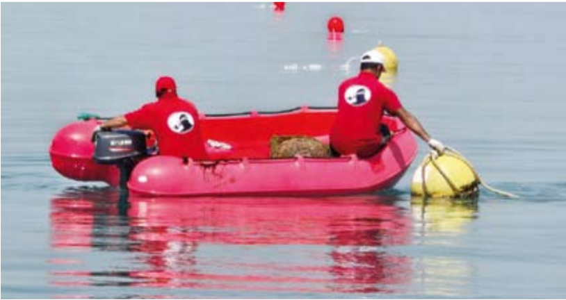
إنجاز عملية المرباط البحرية في جزيرة أم المرادم

وتاشد واد الجزر، ضرورة الابتعاد عن صيد الأسماك في مواقع الشعاب المرجانية للحفاظ على التوازن الحيوي وعدم رمي المخلفات على السواحل، مؤكداً أهمية حماية مناطق تعشيش السلاحف وعدم التعرض لها لتبقى جزر الكويت منارة للجمال الطبيعي والاستدامة البيئية.