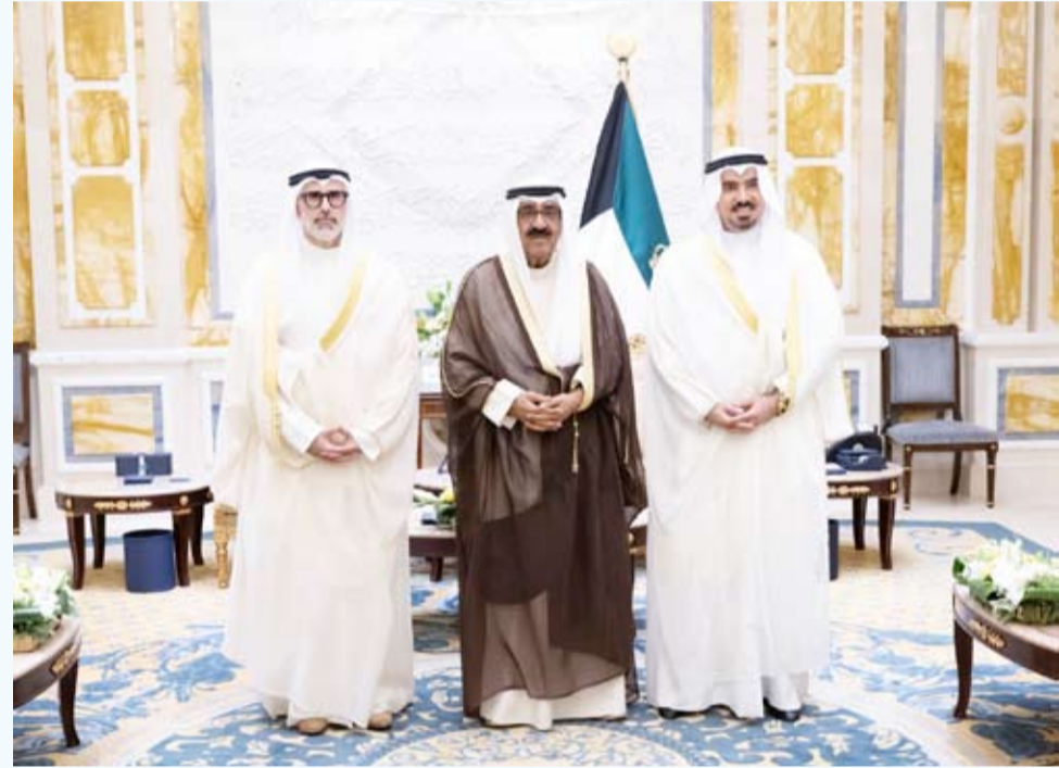
صاحب السمو مستقبلاً رئيس البعثة الدبلوماسية الكويتية الجديد

استقبل سمو أمير البلاد الشيخ مشعل الأحمد الأمين العام لمجلس التعاون لدول الخليج العربية جاسم البديوي. كما استقبل صاحب السمو الأمير امس وزير الخارجية الشيخ جراح جابر الأحمد حيث قدم لسموه رئيس البعثة الدبلوماسية الكويتية الجديد طلال عبدالسلام النبطي سفيراً لدولة الكويت لدى جمهورية التشيك السذي أدى اليمين القانونية أمام سموه وذلك بمناسبة توليه مهام منصبه الجديد.