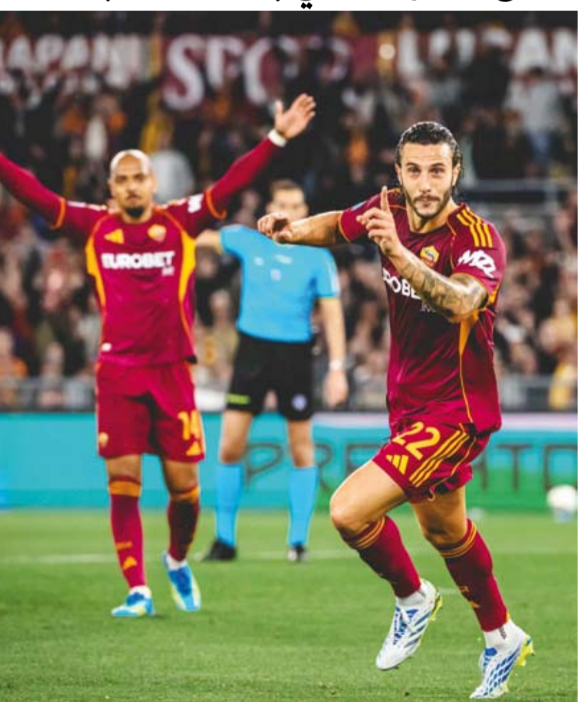
الذئاب تحقق فوز كبير على فيورنتينا

اكتسح روما ضيفه فيورنتينا 4-صفر، ضمن منافسات الجولة 35 من الدوري الإيطالي لكرة القدم. ورفع روما رصيده إلى 64 نقطة في المركز الخامس،