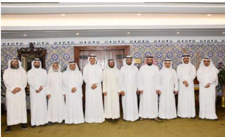
جانب من لقاء المحافظ ومسؤولي جمعية الوفرة السكنية