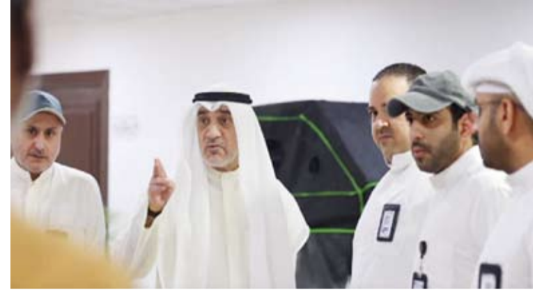
الشيخ فهد اليوسف خلال إشرافه على العملية

مشددة لزراعة المخدرات بقصد الاتجار تصل إلى السجن المؤبد أو الإعدام. وذكرت أن القانون يفرض على المدانين غرامات مالية ضخمة تتراوح بين 100 ألف دينار ومليون دينار أو ما يعادل قيمة المضبوطات أيهما أعلى مجددة بذلك عهدنا بالتصدي لآفة المخدرات وتطبيق القانون بصرامة مطلقة لحماية المجتمع من مهربيها ومروجيها.