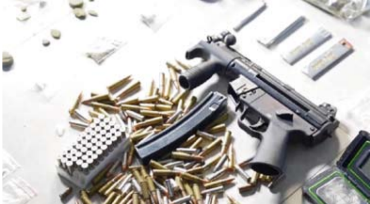
ضبط سلاح ناري وكمية من الذخيرة

ضبط 70 شتلة مزروعة إلى جانب نحو كيلوغرام من الماريجوانا المحصودة والجهازه للبيع