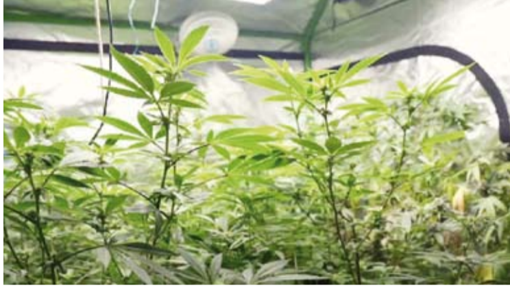
مزرعة (ماريجوانا) متكاملة