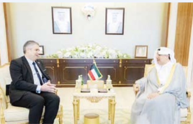
الشيخ حمد جابر العلي يستقبل سفير كوبا لدى البلاد

استقبل وزير شؤون الديوان الأميري الشيخ حمد جابر العلي، السفير آلان بيريز توريس سفير جمهورية كوبا الصديقة لدى دولة الكويت. وجرى خلال اللقاء بحث العلاقات الطيبة التي تربط دولة الكويت وجمهورية كوبا الصديقة وسبل تعزيزها وتعميقها بما يدعم مسار التعاون الثنائي ويخدم مصالح البلدين الصديقين.