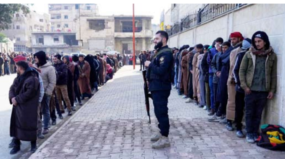
عناصر من «قسد» التي يقودها الأكراد

الذي سبق العلي في رئاسة «فرع 220»، ويُعرف باسم فرع «الجبهة» لإشراقه في منطقة تمتد من بلدة كناكر في ريف دمشق الغربي، وصولاً إلى المناطق الحدودية مع الجولان المحتل. ويُعد القبض على رئيس هذا الفرع، إن صح، بمثابة القبض على كثر معلومات تتعلق بعلاقة النظام المخلوع مع إسرائيل، وأيضاً العلاقات مع «حزب الله» وإيران وتنسيق طرق الإمداد والتزريب.