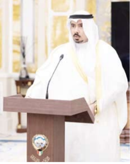
طلال الشطي يؤدي اليمين القانونية أمام سمو الأمير