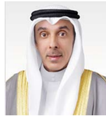
نائب وزير الخارجية السفير حمد المشعان

والاستقرار إقليمياً ودولياً، وأشار إلى الجولات التي قام بها وزير الخارجية الشيخ جراح جابر الأحمد الصباح