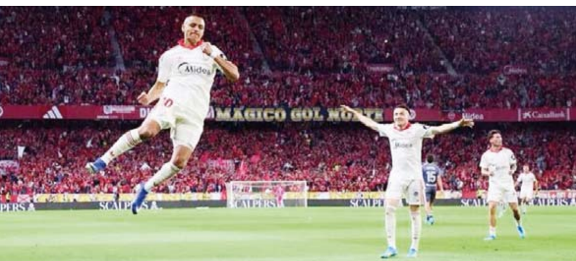
فرحة لاعب إشبيلية بالهدف

خرج إشبيلية من مراكز الهبوط ببطولة الدوري الإسباني لكرة القدم، وذلك بعد فوزه على ضيفه ريال سوسيداد 1-صفر، ضمن منافسات الجولة 34 من المباراة.