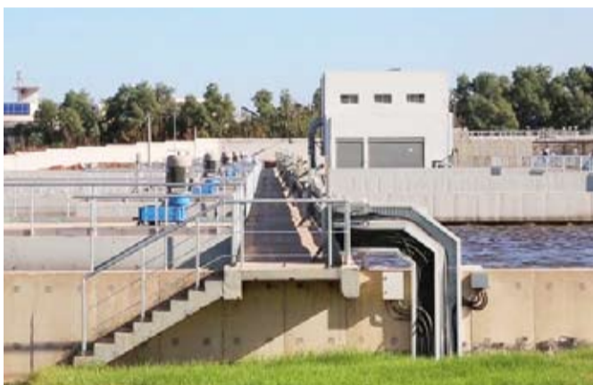
محطة ضخ الجهراء الرئيسية

في منطقة الجهراء والمناطق المجاورة. ويأتي هذا التمديد كإجراء مؤقت لحين الانتهاء من إجراءات طرح وترسية المناقصة الجديدة، خصوصاً في ظل الطبيعة الحساسة لهذه المشاريع التي تتطلب استمرارية العمل دون انقطاع، للحفاظ على السلامة البيئية والصحية وأعمال المعالجة المختلفة التي تتم في محطات المعالجة التي تضخ إليها مياه الصرف المختلفة. من جهة أخرى أعلنت وزارة الأشغال العامة بالتعاون مع الإدارة العامة للمرور عن إغلاق جزئي مؤقت لطريق الدائري الخامس باتجاه الجهراء بعرض ثلاث حارات من اليمين مقابل منطقة قرطبة وبطول 500 متر تقريباً، مع الإبقاء على ثلاث حارات مفتوحة لحركة المرور والإبقاء على الإبقاء على الطريق الخدمي الموازي للدائري الخامس للمقادم من السرة وشارع دمشق/ قرطبة مفتوح باتجاه الجهراء، أمس واليوم لاستكمال أعمال الاسفلت في تلك المنطقة.