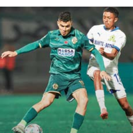
فرحة كتالونية بفوز سهل على مضيفه باريسيترو

تأهل برشلونة إلى دور الستة عشر لكأس إسبانيا لكرة القدم بفوزه على مضيفه باريسيترو (من الدرجة الرابعة) بأربعة أهداف دون رد في دور الـ 32 من المسابقة.