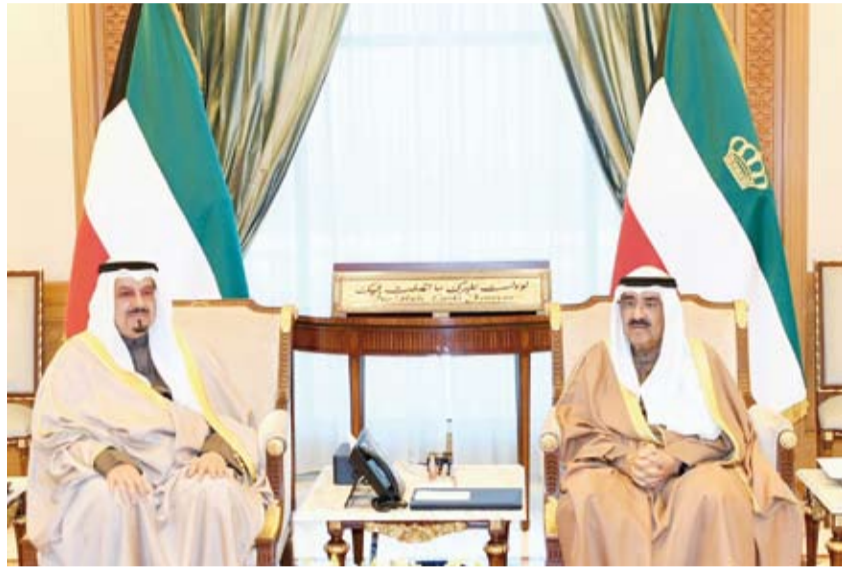
.. وسموه يستقبل سمو الشيخ أحمد العبدالله

بعث صاحب السمو أمير البلاد الشيخ مشعل الأحمد ببرقية تعزية إلى الرئيس جوزيف ر. بايدن رئيس الولايات المتحدة الأمريكية الصديقة، عبر فيها سموه عن خالص تعازيه وصادق مواساته بضحايا حادث الدهس الإرهابي الذي وقع في مدينة نيو أورليانز بولاية لويزيانا في الولايات المتحدة الأمريكية الصديقة وأسفر عن سقوط العشرات من الضحايا والمصابين. راجياً سموه لذوي الضحايا جميل الصبر والمصابين سرعة الشفاء والعافية.