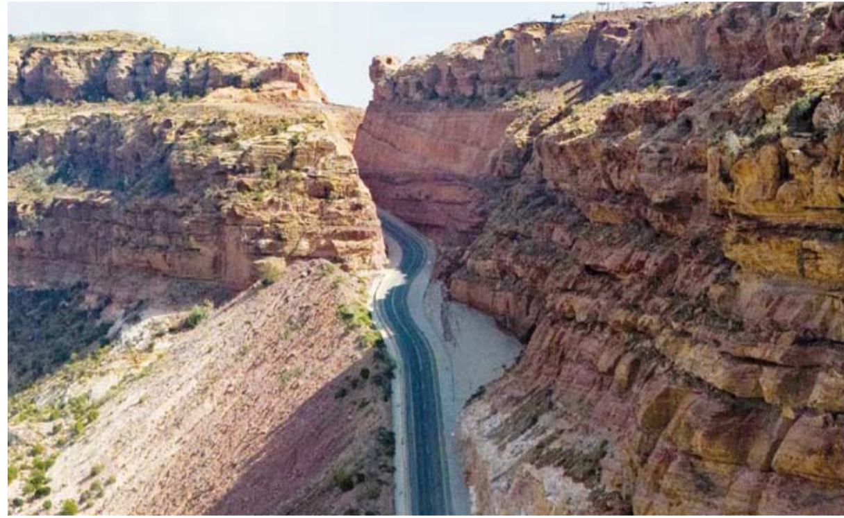
جبال القهر في منطقة جازان

تطل جبال القهر في محافظة الريث شمال شرق منطقة جازان كواحدة من أبرز اللوحات الطبيعية في المملكة، حيث تجمع بين الجمال البكر والتاريخ العريق. وتعد هذه الجبال أحد أبرز معالم المملكة الطبيعية، بارتفاعات تتجاوز 2000 متر فوق سطح البحر، وتمثل جزءاً من سلسلة جبال السروات الممتدة على طول الساحل الغربي لشبه الجزيرة العربية، مما يجعلها تحفة طبيعية فريدة. وتتميز جبال القهر التي تمثل وجهة سياحية مميزة لعشاق الطبيعة والمغامرة، بتضاريسها الفريدة التي تشمل قمماً صخرية شاهقة وأودية عميقة، منها وادي لجب، الذي يشكل مشهداً بانورامياً يجمع بين الصخور العمودية والمياه الجارية. وتزدان المنطقة بغطاء نباتي موسمي يشمل أشجار العرعر والطلح، مما يضيف على المكان جمالاً استثنائياً، خاصة خلال موسم الأمطار. وتحتضن جبال القهر نقوشاً صخرية قديمة تعكس الحضارات التي استوطنت المنطقة عبر التاريخ، حيث تشير الدراسات إلى أن الجبال كانت ممراً هاماً للقوافل التجارية في الماضي، مما يعكس أهميتها الاقتصادية والاجتماعية، وقد ارتبط اسمها بـ"القهر" نسبة لطبيعتها الوعرة التي ألهمت أهالي المحافظة حكايات وأساطير توارثتها الأجيال.