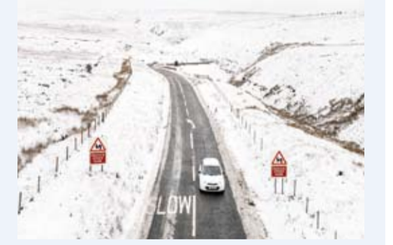
درجة الحرارة وصلت إلى 11 تحت الصفر في اسكتلندا

شهدت المملكة المتحدة إغلاق عدد من المطارات وتعطل وسائل النقل العامة وحركة المرور في مناطق واسعة منها بسبب كثافة الثلوج. وأكدت هيئة الإذاعة البريطانية (بي بي سي) أمس أن مطارات مانشستر وليفربول وبييرمنغهام اضطرت منذ الليلة قبل الماضية إلى إغلاق مدارجها بالكامل نتيجة كثافة الثلوج ما أدى إلى إلغاء عشرات الرحلات أو تحويلها. وأوضحت أن مطارات أخرى من ضمنها بريستول تشهد تذبذباً في خدماتها مع توقعات باستمرار ذلك طوال اليوم مضيئة أن المطارات أصدرت تحذيراً للمسافرين بضرورة التحقق من مرجحة رحلاتهم مع الشركات المعنية قبل التوجه للمطارات. من جهة أخرى قالت هيئة الأرصاد الجوية البريطانية إن تحذيرين من الدرجة الثانية عن كثافة الثلوج ومخاطر الجليد لا يزالان ساريين في عدد من المناطق بإنجلترا وأجزاء واسعة من اسكتلندا وويلز. وذكرت أن درجات الحرارة انخفضت إلى مستويات قياسية أدناها على الإطلاق سجلت بمنطقة (لوك غلاسكارنوك) في إسكتلندا وبلغت 11 درجة تحت الصفر.