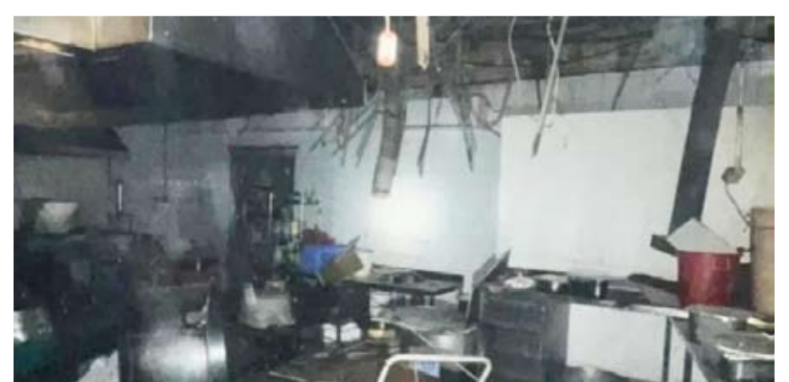
انار حريق مطعم الفروانية

تعاملت فرق إطفاء مركز التحريير ظهر امس الأحد مع حادث انفجار صهريج " تنكر " مياه أثناء عمل صيانته له باستخدام معدات " اللحميم " في منطقة سكراب أمغره حيث باشرت الفرق بالتعامل مع الانفجار والسيطرة عليه وقد أسفر الحادث عن إصابة عامل بحروق وتم تسليمه للطوارئ الطبية. كما تمكنت فرق إطفاء مركزي الفروانية وصبحان مساء أمس الاول من السيطرة على حريق مطعم في منطقة الفروانية حيث باشرت بمكافحته والسيطرة عليه، وأسفر الحادث عن