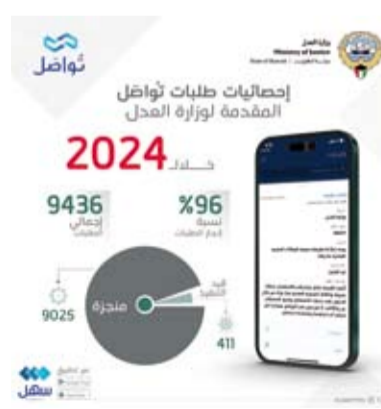
وزارة العدل تلقت 9436 طلباً عبر «سهل»

أعلنت وزارة العدل، أمس، أنها تلقت 9436 طلباً من الجمهور من خلال خدمة (تواصل) المتاحة عبر التطبيق الحكومي الموحد للخدمات الإلكترونية (سهل) خلال العام 2024. وذكرت الوزارة في حسابها على منصة التواصل الاجتماعي (إكس) أن فريق عمل (تواصل) نجح في الرد على 96 في المئة من هذه الطلبات وكان مقياس معدل رضا الجمهور عن الخدمة 3 من 5. وأوضحت أن فريق منصة (تواصل) في (العدل) عمل على استخدام المنصة كمرکز خدمة افتراضيا لإنجاز طلبات الجمهور وتعامل مع الطلبات كفرصة للتطوير من خلال التعرف على مكان الخلل بالأخص في الشكاوى والاستفسارات الواردة بشكل متكرر. من جهة أخرى، أظهرت إحصائية إدارة التسجيل العقاري والتوثيق في وزارة العدل اليوم الأحد تداول 86 عقاراً في البلاد خلال الأسبوع ما قبل الماضي بقيمة إجمالية بلغت 108.4 مليون دينار كويتي (نحو 357.7 مليون دولار أمريكي). وقالت الإحصائية المنشورة على الموقع الإلكتروني للوزارة عن تداولات الأسبوع (ما بين 22 و26 ديسمبر الماضي) إن عقود العقار الخاص جاءت في الصدارة بـ 61 عقاراً بقيمة 28.7 مليون دينار (نحو 94.7 مليون دولار). وذكرت أن عقود العقار الاستثماري جاءت ثانياً بتداول 21 عقاراً بقيمة 58 مليون دينار (نحو 191 مليون دولار) فيما شهد العقار التجاري بيع أربعة عقارات بقيمة 21.8 مليون دينار (نحو 72 مليون دولار) فيما لم يتشهد الشريط الساحلي أو المعارض