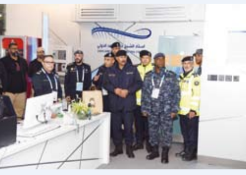
الشيخ فيصل النواف خلال متابعة الاستعدادات الأمنية

أشاد وكيل وزارة الداخلية، الفريق الشيخ سالم النواف، بجهود رجال الأمن في تنظيم العملية الأمنية وضمان سلامة جماهير بطولة كأس الخليج العربي لكرة القدم (خليجي زين 26) التي اختتمت منافساتها في الكويت أول أمس. جاء ذلك في بيان صادر عن الإدارة العامة للعلاقات والإعلام الأمني بوزارة الداخلية عقب جولة تفقدية قام بها الفريق النواف في استاد جابر الأحمد الدولي لمتابعة تأميين المباراة النهائية للبطولة التي انطلقت في 21 ديسمبر الماضي وشهدت مشاركة 8 منتخبات. وبحسب البيان نوه وكيل وزارة الداخلية بالمستوى الاحترافي لرجال الأمن الذي عكس المستوى المتميز لدولة الكويت في استضافة الفعاليات الرياضية الكبرى. ووجه الفريق النواف شكره للجماهير على تعاونهم وانضباطهم طوال فترة المباريات مؤكداً أن هذا الوعي ساهم في إنجاح البطولة وتعزيز الروابط الخليجية. ووفق البيان استمتع الفريق النواف إلى شرح مفصل من القيادات الأمنية حول الخطة الموضوعة لتأمين الحدث.