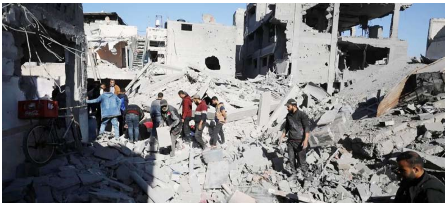
تدمير واسع نتيجة القصف المستمر على غزة

من ذوي الكفاءات الوطنية والمهنية، وتم تسليمها إلى الأشقاء في مصر». وأعلنت «حماس» في البيان ذاته عن أملها من «فتح» والسلطة المتحفظ على جهود تشكيل اللجنة الإسناد المجتمعي في إطار النظام السياسي الفلسطيني والعمل من خلال الإجماع الوطني ومشروعيته السياسية». كما تحدث مصدر فلسطيني مقرب من السلطة لـ«الشرق الأوسط»، عن أن الرئيس الفلسطيني يقف في موقف المتحفظ على تشكيل تلك اللجنة، خشية أن تتسبب في فصل غزة، وبالتالي «لم يوقع على مرسوم بشأنها رغم إنجاز نقاشات تلك اللجنة» منذ أوائل ديسمبر الماضي، «ويعلم ذلك علناً، وأبدى ذلك عبر تصريحات صدرت من متحدثين عدة، تعبر عن التحفظ بشأن صدور المرسوم»، متوقفاً استمرار جهود إضافية من القاهرة لإنهاء الانقسام على نحو يحفظ حقوق الشعب الفلسطيني.