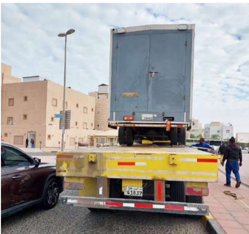
رفع سيارة مخالفة

أعلنت إدارة العلاقات العامة في بلدية الكويت مواصلة الفرق الميدانية لإدارة النظافة العامة واشغالات الطرق تكثيف جولاتها التفتيشية لرصد وإزالة المخالفات لأحتي النظافة واشغالات الطرق البلدية في كافة المحافظات وتفعيل الدور الرقابي للأجهزة الرقابية لتطبيق قوانين البلدية.