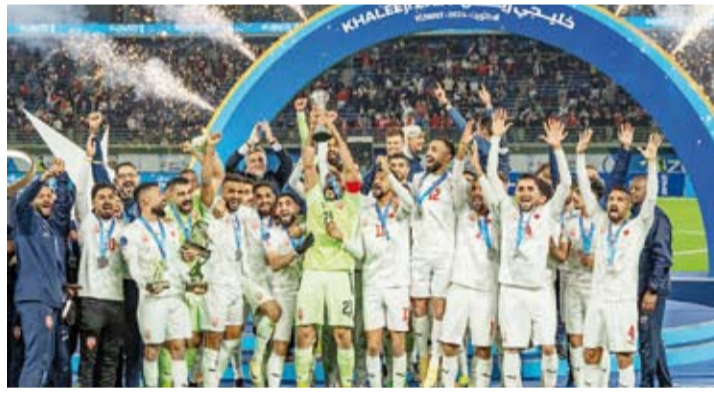
تتويج مستحق لمنتخب البحرين

أكد مدرب المنتخب البحريني، الكرواتي دراغان تالاييتش، بأن المنتخب البحريني قدم مستوى مميز طوال مشواره في بطولة كأس الخليج الـ 26، التي أسدل الستار عنها (السبت) بفوز «الأحمر» البحريني على نظيره العماني 2-1 في المباراة النهائية التي أقيمت في ستاد جابر الأحمد الدولي، وسط حضور جماهيري كبير. وقال تالاييتش: «نقدم اللاعبين مباراة مميزة أمام المنتخب العماني في النهائي، واستحقوا الفوز باللقب، ونبارك لهم جميعاً على هذا الفوز المستحق، ونبارك للجماهير البحرينية التي جاءت إلى الكويت في الأيام الماضية، وأيضاً للجماهير البحرينية التي تابعت مشوار الفريق من داخل البحرين».