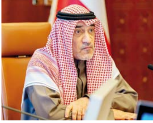
الشيخ فهد اليوسف مترسا الاجتماع امس

أكد النائب الأول لرئيس مجلس الوزراء وزير الدفاع وزير الداخلية الشيخ فهد يوسف سعود الصباح أمس أن الرسوم بقانون رقم (158 لسنة 2024) بتعديل نص المادة 16 من الرسوم الأميري رقم (15 لسنة 1959) بقانون الجنسية الكويتية يكفل العيش الكريم لفئة زوجات الكويتيين الأجانب وفقا للمادة الثامنة من قانون الجنسية الكويتية ممن سحبت جنسياتهم ويضمن كافة المميزات التي كن يتمتعن بها قبل صدور مراسيم سحب الجنسية. جاء ذلك في كلمة للشيخ فهد اليوسف خلال ترؤسه صباح أمس الاجتماع بقصر السيف مع قياديين ومسؤولي الجهات الحكومية المعنية لمتابعة الإجراءات التي اتخذتها تلك الجهات للتعامل مع ملفات فئة زوجات الكويتيين الأجانب وفقا للمادة الثامنة من قانون الجنسية الكويتية ممن سحبت جنسياتهم ومناقشة المقترحات لضمان توفير العيش الكريم لهن. وذكر أن المرسوم بقانون رقم 158 لسنة