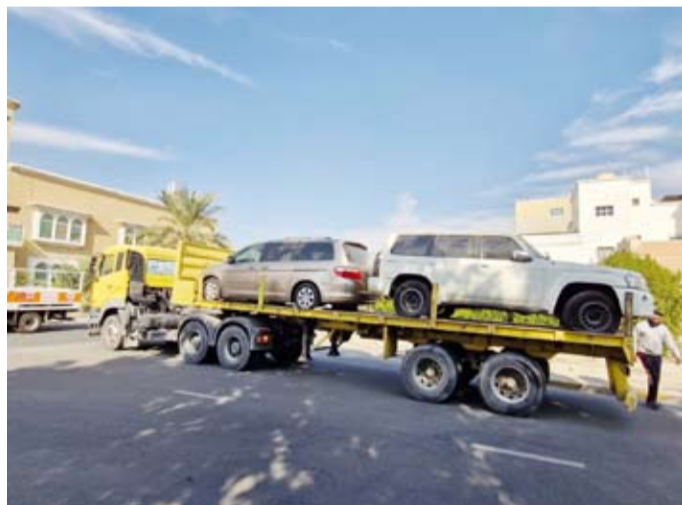
ليات البلدية تصادر سيارات مخالفة