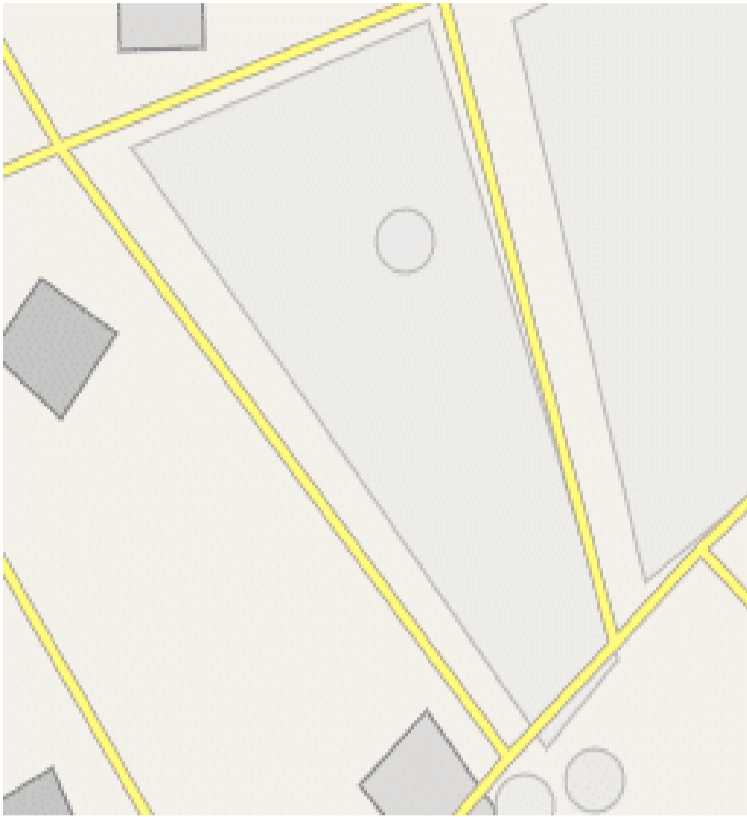
مخطط للساحة المقترحة

من السيول هو من اختصاص الهيئة العامة للطرق والنقل البري من خلال اتفاقيات استشارية ومناقصات محددة.