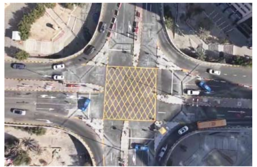
دروازة العبد الرزاق

أعلنت الهيئة العامة للطرق والنقل البري أنه تم أمس الأحد افتتاح الطرق الخاصة بدروازة العبد الرزاق بشكل كامل المشمولة بأعمال تطوير منطقة تقاطع أعلى نفق دروازة العبد الرزاق والمنطقة المحيطة. وتم ذلك بحضور محافظ العاصمة الشيخ عبد الله سالم العلي الصباح وبمشاركة ممثلي الهيئة العامة للطرق والنقل البري ووزارة الأشغال العامة.