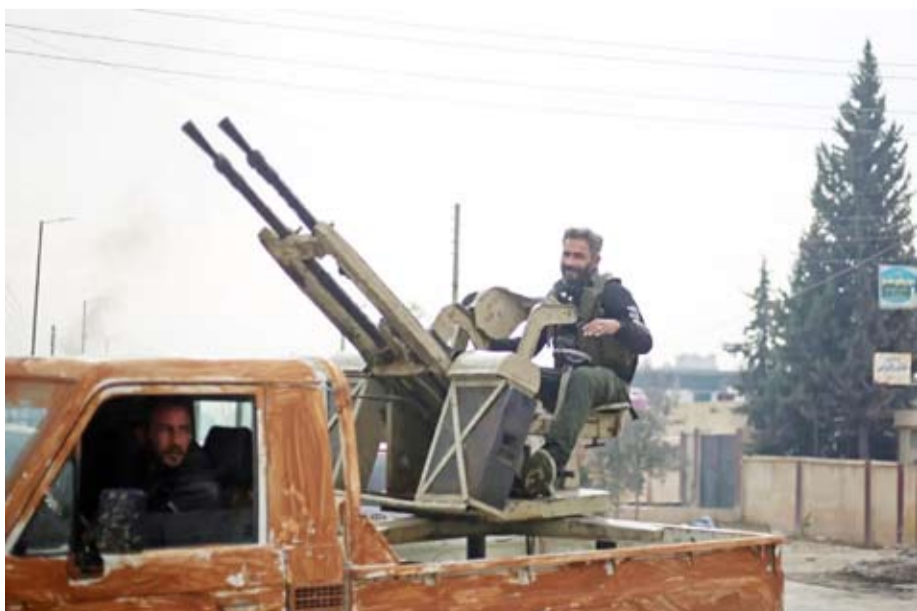
عناصر من الفصائل الموالية لتركيا