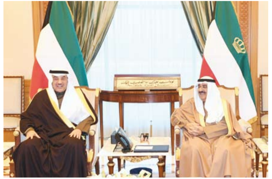
سمو أمير البلاد يستقبل سمو ولي العهد

أسعدت قلوبنا ليجدد الجميع لسموكم حفظكم الله ورعاكم العهد بالإخلاص لكويتنا الغالية والسعي الدؤوب لرفع رايثنا وإعلاء شأنها في مختلف المجالات وكافة الأصعدة نبراسنا رؤية سموكم الرشيدة وغايتنا تحقيق طموحاتكم العديدة داعين الله عز وجل أن يحيط سموكم بحفظه ورعايته وأن يديمكم للوطن ذخرا ولشعبه الوفي فخرأ.