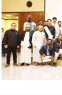
لقطة جماعية للمحرمين