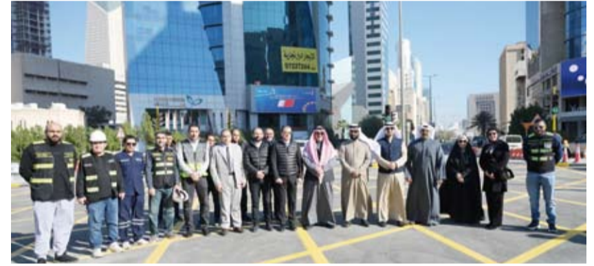
محافظ العاصمة خلال لقطة جماعية مع المشاركين في الافتتاح

بحضور محافظ العاصمة الشيخ عبدالله سالم العلي الصباح، افتتح يوم أمس، تقاطع « دروازة عبدالرزاق »، بعد معالجة كافة المشاكل الهندسية، وإقامة بالصيانة المتكاملة للمشروع خلال الفترة الماضية، بحضور المهندس خالد العصيمي مدير عام الخدمات العامة للطرق، والمهندس احمد الصالح الوكيل المساعد للتخطيط والتنمية بالتكليف والمهندس أنور البلوشي، وعدد من رجال الأمن والمرور. وصرح معالي المحافظ إن الدولة لن تدخر جهداً في دعم ومتابعة المشاريع التنموية والخدماتية بما يعكس الجهود المبذولة من قبل الجهات الرسمية في تنفيذ المشاريع والخدمات المقدمة للمواطنين، لافتاً إلى أن هناك الكثير من المشاريع المستقبلية التي يتوقع إنجازها خلال الفترة القادمة. وثنى المحافظ الجهود والمساهمات في الدعم والمساهمة في إنجاز المشروع من قبل وزير الأشغال العامة د. ثور محمد الشعلان، ورئيس جهاز متابعة الأداء الحكومي معالي الشيخ أحمد