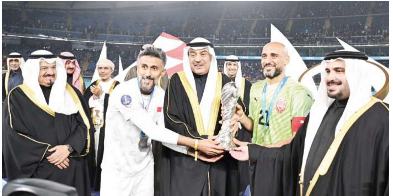
سمو ولي العهد يتوج منتخب البحرين بالكأس

أكد أن الرعاية السامية أسهمت في تحقيق نجاح تنظيمي باهر للبطولة