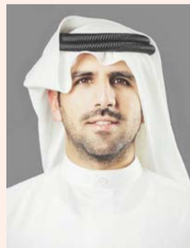
رئيس اللجنة الأولمبية الكويتية الشيخ فهد الناصر

الروابط بين شعوب المنطقة والشباب الرياضي الخليجي.