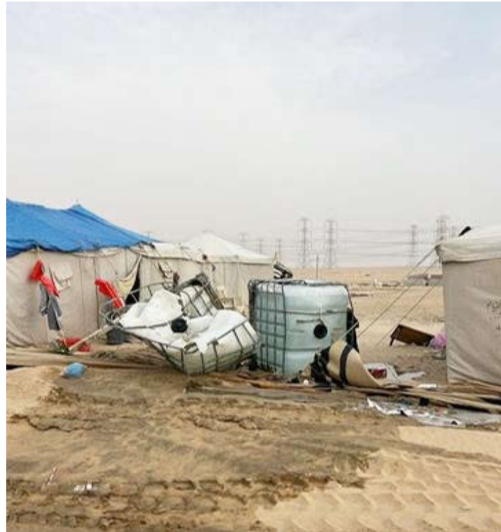
عمال البلدية يزيلون المخلفات