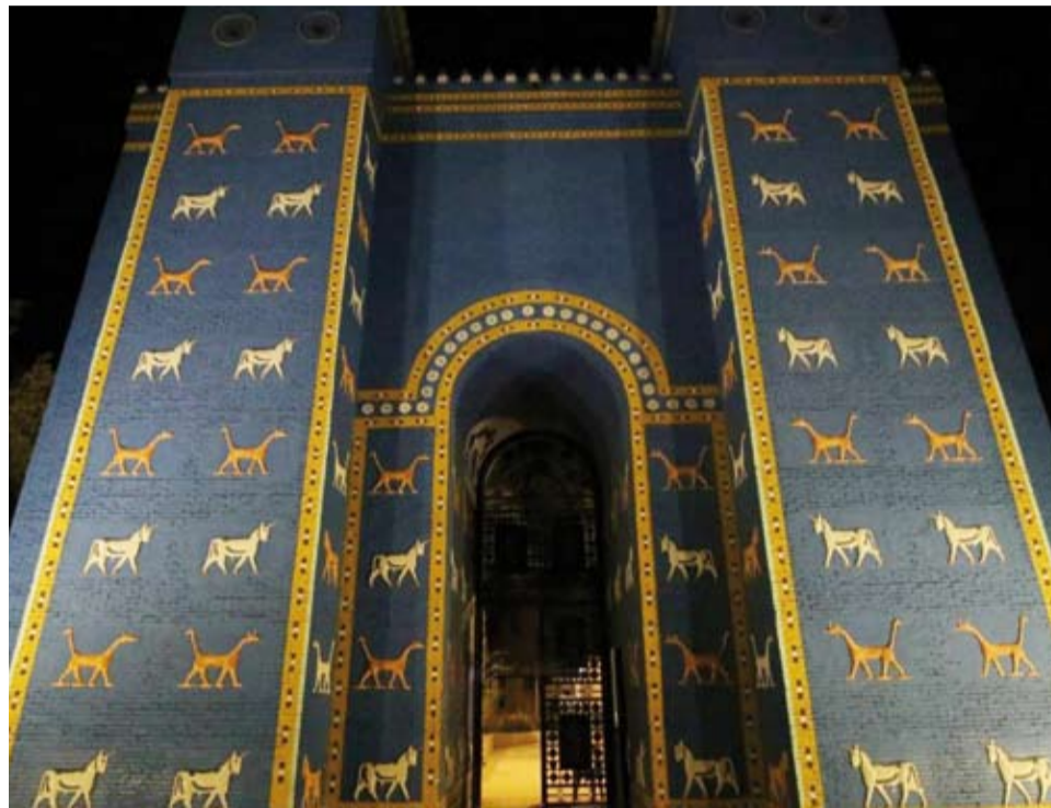
مهرجان بابل الثقافي