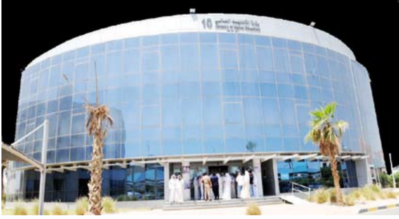
وزارة التعليم العالي