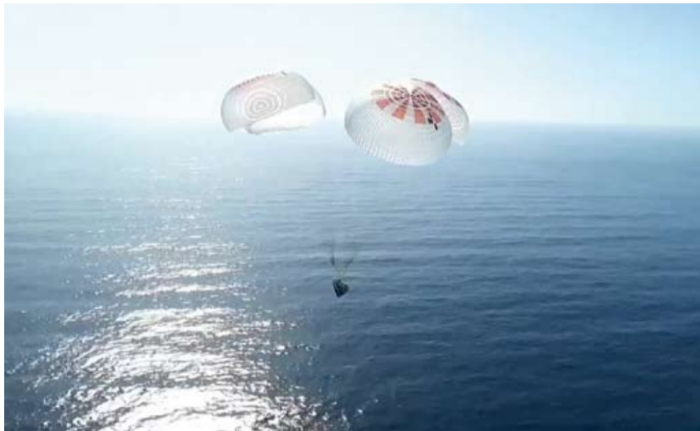
هبوط أفراد طاقم الكبسولة الفضائية

هبطت الكبسولة الفضائية "دراجون" الخاصة بهيئة "فرايم 2" التابعة لشركة سبيس إكس، التي تضم العالمة الألمانية رابيا روجه وثلاثة أفراد آخرين، بنجاح قبالة سواحل ولاية كاليفورنيا الأمريكية بعد رحلة استكشافية استمرت أربعة أيام. وتعتبر هذه الرحلة أول رحلة مأهولة حول قطبي الأرض، وهي جزء من جهود سبيس إكس المتواصلة لتوسيع نطاق الفضاء وتوفير الفرص العلمية للبحث والاكتشاف. وخلال مهمتها، قامت "فرايم 2" بإجراء 22 تجربة علمية، بما في ذلك دراسة تأثير انعدام الجاذبية على نمو هياكل الكبد.