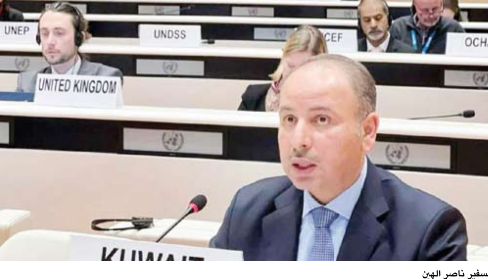
السفير ناصر الهين

بمبادئ حقوق الإنسان والعدالة وأهمية احترام القانون الدولي وقرارات الأمم المتحدة خاصة في دعم القضية الفلسطينية كأولوية أساسية والسودان وسوريا وتعزيز حماية حقوق الإنسان في المنطقة ككل. وشاركت مجموعة دول مجلس التعاون الخليجي برئاسة وفد دولة الكويت في المفاوضات المتعلقة بمشروع القرار المتعلق بالحق في البيئة نظيفة وصحية وسليمة ما ساهم في تحسين النص بشكل أكثر توازناً مؤكدة ارتباط هذا الحق بشكل رئيسي بالآثار السلبية لتغير المناخ والمبادئ التي تضمنتها اتفاقية الأمم المتحدة الإطارية بشأن تغير المناخ واتفاق باريس. ولفتت في هذا السياق إلى استمرار تضمن القرار للعديد من النقاط التي لا تتفق مع التزامات الدول الأعضاء في إطار الاتفاقيات الدولية والتشريعات الوطنية مطالبة بتعزيز التعاون الدولي من أجل حماية البيئة ومكافحة الآثار السلبية لتغير المناخ. وفي سياق متصل، أكدت الكويت احتفاظ دول مجلس التعاون الخليجي بحقوقها في تفسير وتنفيذ الأحكام الواردة في القرارات المعتمدة في مجلس حقوق الإنسان وذلك بما يتماشى مع تشريعاتها الوطنية وقيمتها الثقافية والدينية والاجتماعية وفقاً لالتزاماتها في إطار القانون الدولي لحقوق الإنسان. كما شأت بنفسها عن المفاهيم والمصطلحات غير الحكومية المشار إليها في مشاريع القرارات التي تتفق إلى إجماع دولي أو لا تتوافر لها تعريفات واضحة ضمن القانون الدولي لحقوق الإنسان. واختتم مجلس حقوق الإنسان