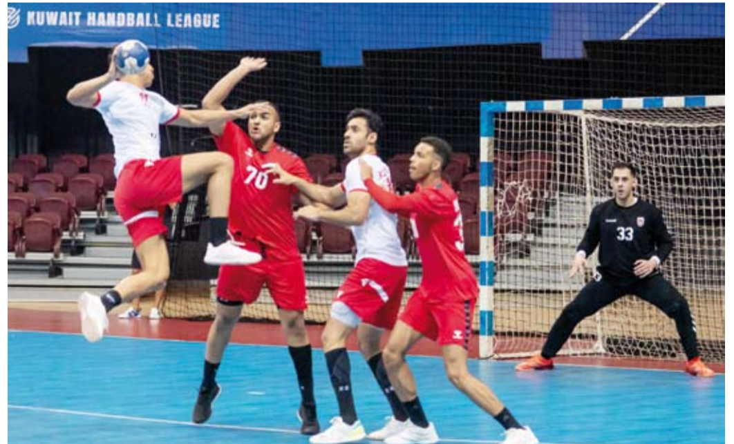
حافظ صد لاعبي الكويت من لاعبي الصليبخات

الجولة الأولى من القسم الأول للدوري الكويتي الممتاز لكرة اليد للموسم الرياضي 2025/2024.