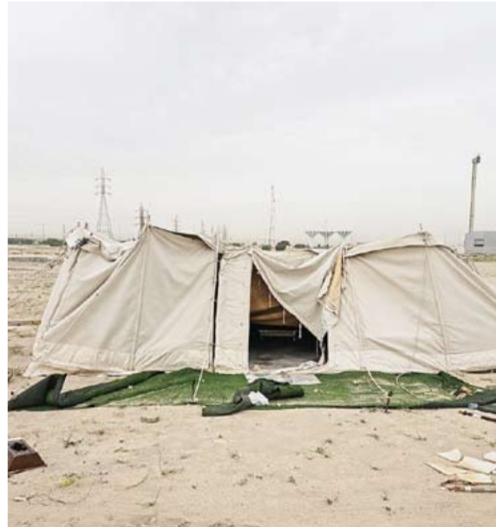
إزالة المخيمات المخالفة

توجيه 130 إنذاراً للمخيمات المخالفة نثمن استجابة أصحابها بإزالتها طواعية