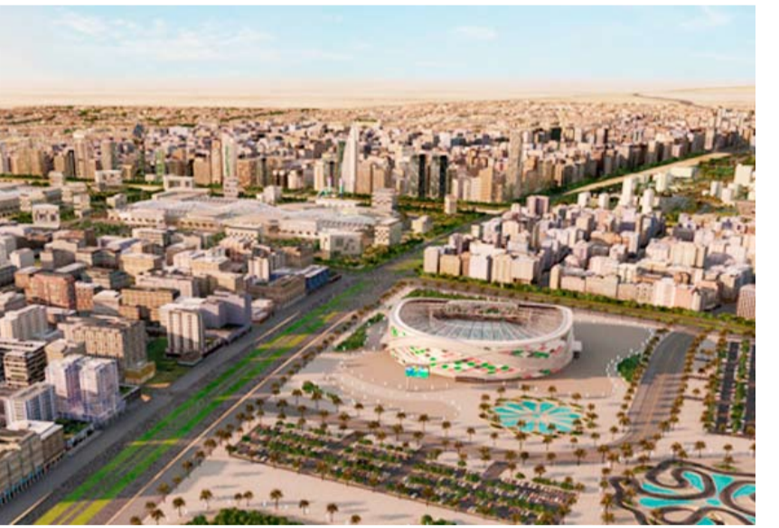
مناطق سكنية في المطلاع

أعلنت وزارة الكهرباء والماء والطاقة المتجددة عن البدء باستقبال طلبات إيصال التيار الكهربائي لـ466 قسيمة بمدينة المطلاع السكنية، ضاحية «N5»، أجزاء من قطعة 1 و قطعة 2، حيث تم التشغيل بالتعاون مع المؤسسة العامة للرعاية السكنية.