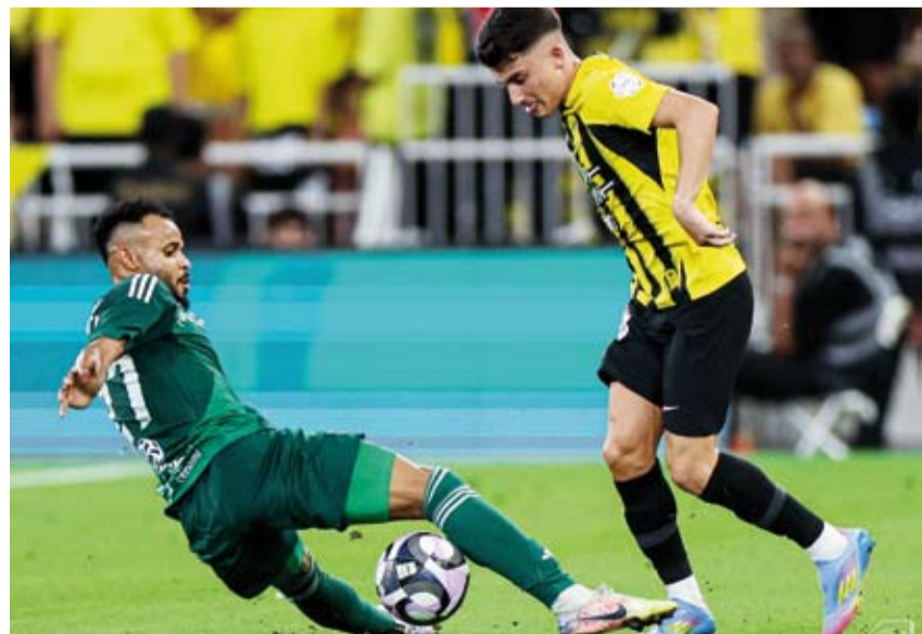
الاتحاد انتزع تعادلاً ثميناً أمام الأهلي

إلى 52 نقطة في المركز الرابع، وارتفع رصيد الاتفاق إلى 36 نقطة في الترتيب الثامن. كما تعادل فريقا الرياض وضيغه ضمك دون أهداف في مباراة اتها اليوم، ضمن الجولة السادسة والعشرين من الدوري السعودي. ورفع الرياض رصيده إلى 34 نقطة في المركز التاسع، وارتفع رصيد ضمك إلى 28 نقطة في المركز الثاني عشر.