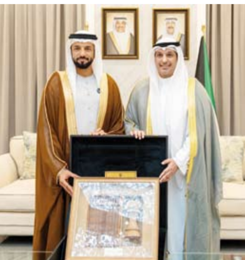
المطيري يقدم هدية تذكارية من الهيئة العامة للشباب للوزير المطيري