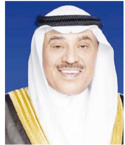
استقبل سمو ولي العهد الشيخ صباح الخالد، بقصر السيف، صباح أمس، رئيس مجلس الوزراء بالإنابة الشيخ فهد اليوسف.