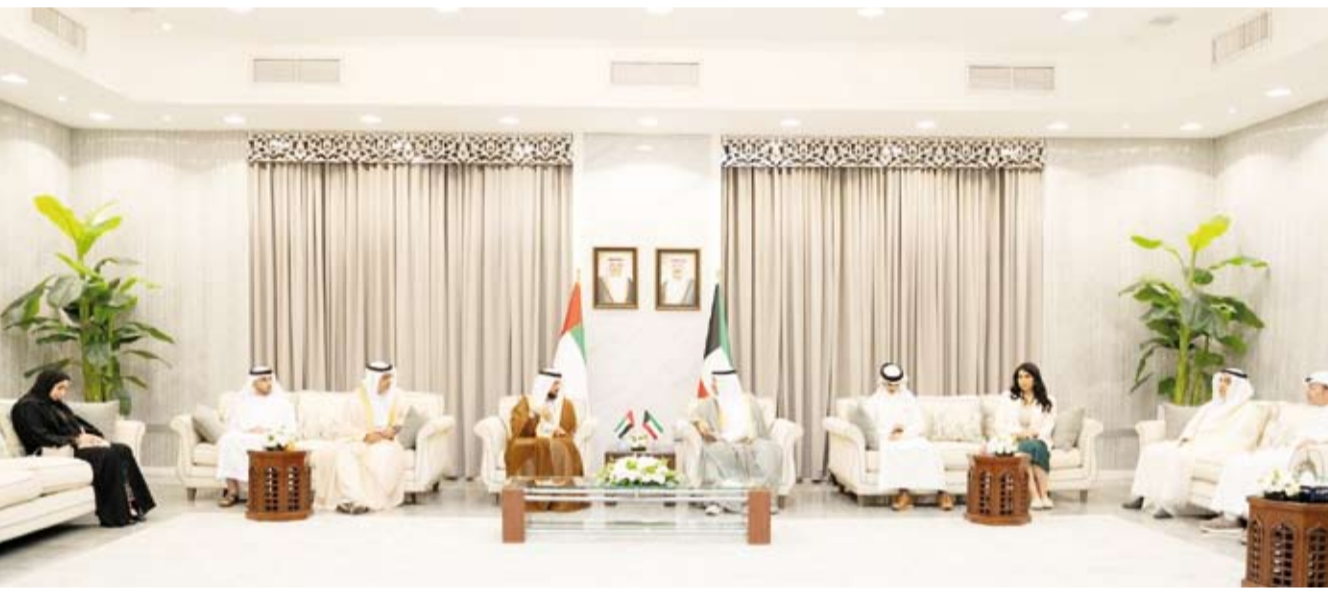
جانب من اللقاء

من جانبه أشاد الوزير الدكتور سلطان النيادي بالتجربة الكويتية الرائدة في مجال العمل الشبابي على مختلف الأصعدة معرباً عن تطلع الإمارات إلى