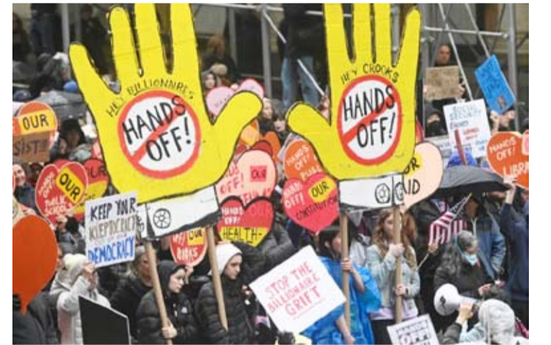
عشرات آلاف الأمريكيين شاركوا في مظاهرات تحت شعار «ارفعوا أيديكم»

شارك عشرات آلاف الأشخاص في مظاهرات شهدتها العديد من المدن الأمريكية، احتجاجاً على سياسات الرئيس الأمريكي دونالد ترامب وإدارته، ورفضاً لدعواته الهجمات الإسرائيلية في غزة. المظاهرات جرت تحت شعار "ارفعوا أيديكم" وردد المتظاهرون شعارات "اعزلوا ترامب" و"إيلون ماسك.. أنت خائن". ورد المتظاهرون شعارات مثل "ارفعوا أيديكم عن الديمقراطية"، و"اعزلوا ترامب"، و"إيلون ماسك.. أنت خائن"، و"رحلوا الكراهية". وهتف المتظاهرون بشعارات مثل "الحرية لفلسطين"، و"توقفوا عن الإبادة الجماعية"، و"ترامب، لا يمكنك الاختباء إزاء إبادة فلسطين".