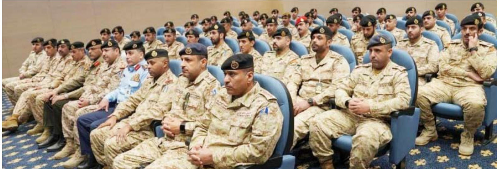
جانب من المشاركين في الدورة

برعاية نائب رئيس الأركان اللواء الركن طيار صباح الجابر، وبحضور رئيس هيئة التعليم العسكري العميد الركن جاسم العماني، ومدير مديرية برمجة الميزانية العميد الركن فارس الهدبان، افتتحت صباح أمس، دورة المحاسبة التخصصية رقم 1 للضباط، والتي تعقد خلال الفترة من 6 أبريل إلى