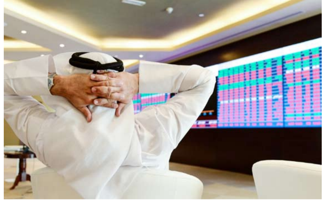
السوق السعودي أكبر الخاسرين.. 7.9 مليارات خسائر بورصة الكويت