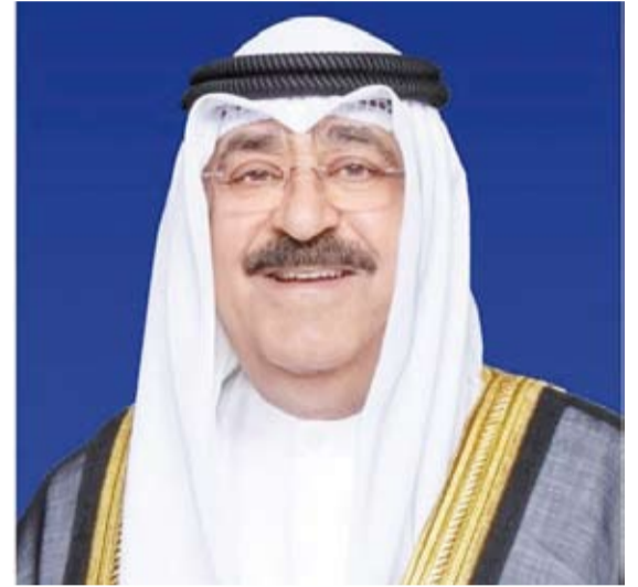
سمو أمير البلاد الشيخ مشعل الأحمد

استقبل صاحب السمو أمير البلاد الشيخ مشعل الأحمد، بقصر السيف، صباح أمس، سمو ولي العهد الشيخ صباح الخالد، كما استقبل سموه رئيس مجلس الوزراء بالإنابة الشيخ فهد اليوسف.