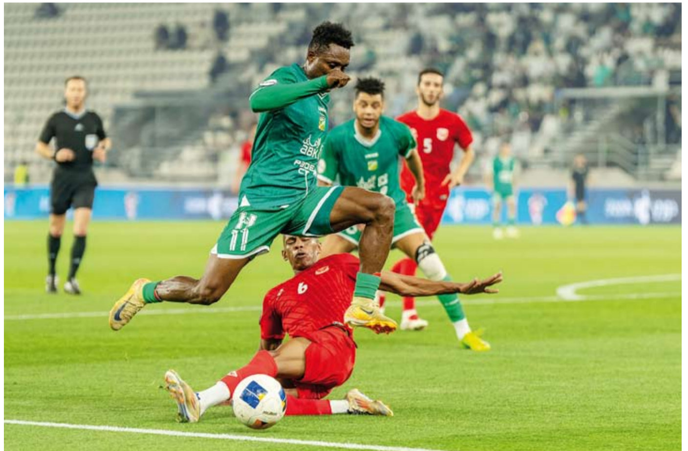
تعادل مخيب للعربي أمام الفحيحيل

الغفور. ولم تفلح محاولات العربي لتحقيق الفوز، رغم النقص العددي في صفوف الفحيحيل، لتنتهي المباراة بهدف لكل فريق. جدير بالذكر أن مدرب الفحيحيل السوري فراس الخطيب تحصل على البطاقة الحمراء بسبب اعتراضه على