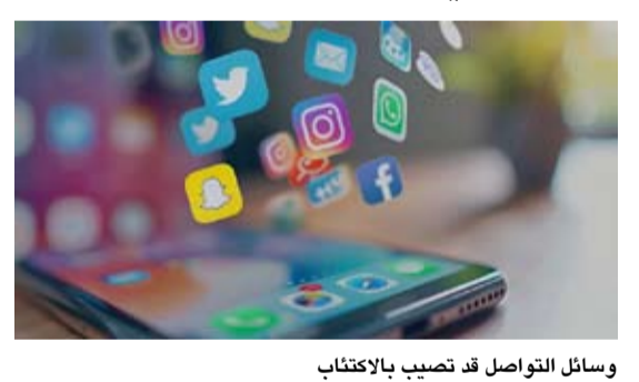
وسائل التواصل قد تسبب بالاكتئاب