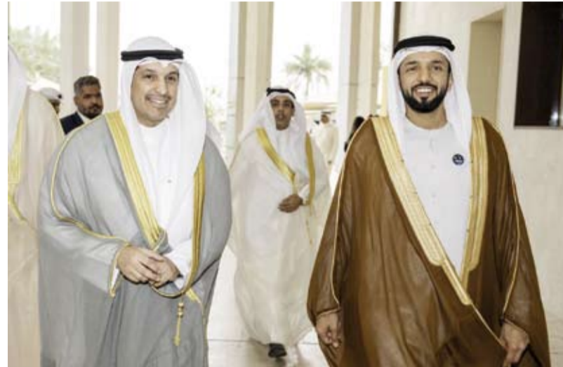
الوزير المطيري يستقبل الوزير النيابي في وزارة الإعلام

بحث وزير الإعلام والثقافة ووزير الدولة لشؤون الشباب عبد الرحمن المطيري، أمس، مع وزير الدولة لشؤون الشباب في دولة الإمارات العربية المتحدة الشقيقة الدكتور سلطان النيادي سبل تعزيز العلاقات الأخوية والتعاون المشترك بين البلدين في مختلف المجالات الشبابية.