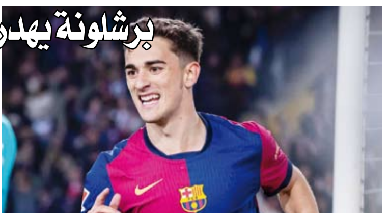
برشلونة عجز عن تحقيق الفوز أمام ضيفه ريال بيتيس

أهدر برشلونة فرصة لتوسيع الفارق الذي يفصله عن أقرب منافسيه في صدارة الدوري الإسباني، بتعادله 1-1 مع ضيفه ريال بيتيس. وبهذا التعادل يرتفع رصيد برشلونة إلى 67 نقطة بفارق أربع نقاط أمام ريال مدريد ثاني الترتيب، بينما ارتقى بيتيس إلى المركز الخامس برصيد 48 نقطة.