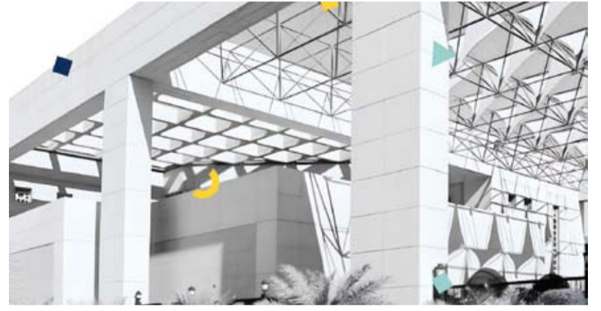
جامعة عبدالله السالم