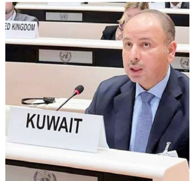
السفير ناصر الهين

أكد مندوب دولة الكويت الدائم لدى الأمم المتحدة والمخضات الدولية الأخرى في جنيف، السفير ناصر الهين، أن دولة الكويت حريصة على التوافق بين أصحاب المصلحة لضمان استقرار سوق العمل والحفاظ على حقوق العمال وتعزيزها لا سيما أن علاقة البلاد مع منظمة العمل الدولية قوية للغاية وراسخة.