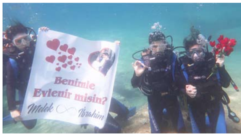
عرض زواج تحت الماء

وعقب رد الفتاة بالإيجاب، قام الشاب التركي بإلباسها كاميرا خاصة بالتصوير تحت المياه.