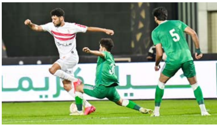
الزمالك يعود لسكة الانتصارات