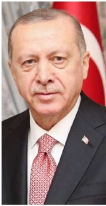
الرئيس التركي رجب طيب أردوغان