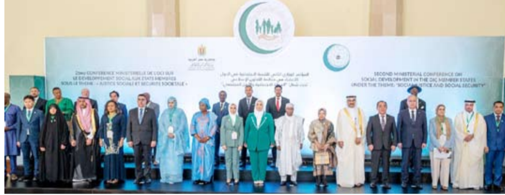
وفد الكويت المشارك في أعمال الدورة الثانية للمؤتمر

قيم ومهارات لضمان استقرارها ورفع مستوى التعليم للطفل ووضع قوانين لحمايته وتوفير الضمان الاجتماعي لكبار السن وتأمين حياة معيشية مستقرة لهم. وأضافت أن الكويت تعمل على إعداد دورات تدريبية في مجال المهن الحرفية والفنية لتكثيف الأيدي العاملة من الحياة الكريمة إضافة إلى الاهتمام برفعة ذوي الإعاقة وتوفير فرص عمل لهم وإعداد دورات تدريبية تؤهلهم في مجال المهن الحرفية والفنية.