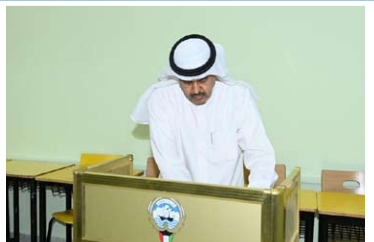
محافظ حولي والعاصمة بالوكالة يدلي بصوته

أشاد محافظ حولي والعاصمة بالوكالة على الأصفر جميع الاستعدادات التي تقوم بها الجهات المختلفة. وعقب جولته التفقدية لعدد من مراكز الاقتراع في مختلف الدوائر الانتخابية بمحافظة حولي والعاصمة قام بالإطلاع على الاستعدادات كافة لانتخابات (أمة 2023) معربا عن استعداد محافظتي حولي والعاصمة لتقديم الدعم والمساندة لجهات الدولة المختلفة المعنية من أجل