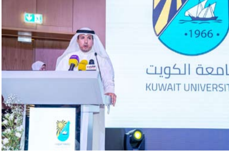
مدير جامعة الكويت بالإنابة الدكتور فهد الرشيدى يتحدثاً