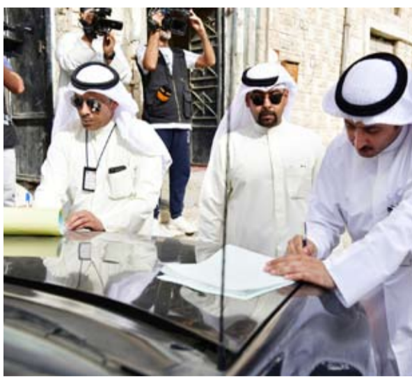
تحرير محاضر مخالفات بحق العقارات المخالفة

قال المدير العام لبلدية الكويت بالوكالة سعود الدبوس، أول أمس: إن أجهزة البلدية رصدت أكثر من 1150 منزلاً تستخدم كمقرات لسكن العزاب في مناطق سكنية مختلفة.