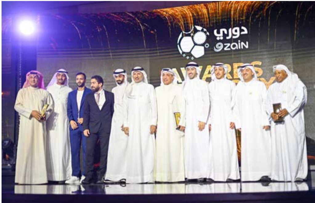
صورة جماعية للمكرمين