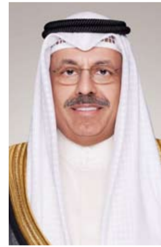
سمو الشيخ أحمد النواف

وأكد الشيخ سالم الصباح خلال اللقاء على أهمية تعزيز وتدعيم أمن الممرات المائية وضمان حرية وسلامة وحركة الملاحة في منطقة الخليج مشدداً على أهمية تعزيز الجهود الدولية والتعاون في محاربة القرصنة وتهريب المخدرات والأسلحة ولواجهة التحديات والتحديات المشتركة في هذا الإطار. من جانبه أعرب الأدميرال كوبر عن اعتزازه بعلاقات الصداقة التاريخية الوثيقة التي تربط