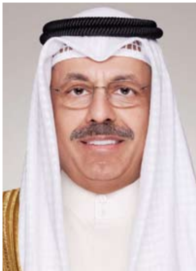
سمو الشيخ أحمد النواف

بعث سمو الشيخ أحمد النواف رئيس مجلس الوزراء ببرقيات شكر إلى سمو الشيخ سالم العلي الصباح رئيس الحرس الوطني والنايب الأول لرئيس مجلس الوزراء ووزير الداخلية ووزير الدفاع بالوكالة الشيخ طلال خالد الأحمد الصباح ووزير الدولة لشؤون البلدية ووزير الدولة لشؤون الاتصالات فهد