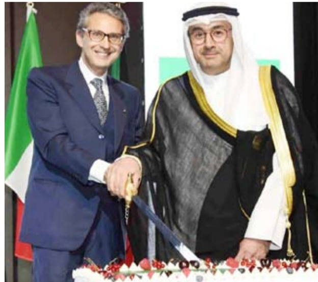
مساعد وزير الخارجية لشؤون أوروبا والسفير الإيطالي لدى البلاد

وتعد فرصها نحو آفاق أرحب ومجالات أوسع. وأشار إلى مجالات التعاون الاقتصادي بين البلدين لا سيما في قطاعي الصناعات النفطية والصناعات الصغيرة والمتوسطة علاوة على مجالات التبادل التجاري التقليدية بما تتميز به الصادرات الإيطالية من جودة عالية ونوعية خاصة والتي سجلت أرقاماً قياسية كبيرة في السنوات الأخيرة.