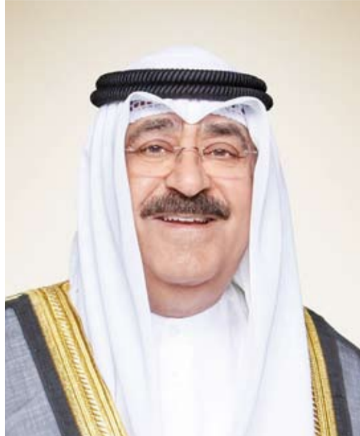
سمو ولي العهد الشيخ مشعل الأحمد

بعث سمو ولي العهد الشيخ مشعل الأحمد ببرقيات شكر إلى سمو الشيخ سالم العلي الصباح رئيس الحرس الوطني وسمو الشيخ أحمد نواف الأحمد الصباح رئيس مجلس الوزراء والشيخ طلال خالد الأحمد الصباح النائب الأول لرئيس مجلس الوزراء ووزير الداخلية ووزير التربية ووزير التعليم العالي والدكتور عامر محمد علي محمد وزير العدل ووزير الأوقاف والشؤون الإسلامية والدكتور أحمد الحضاري للوطن العزيز في هذا العرس الديمقراطي