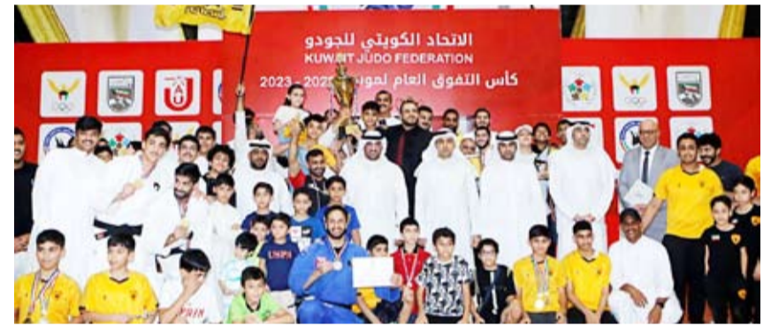
صورة جماعية للفائزين

للاعبها بصورة قوية في مختلف الفئات السنوية. وأضاف دلي أن ارتفاع مستوى منافسات بطولات الاتحاد انعكس إيجاباً على مستوى المنتخب الوطني بدليل تحقيقه ميداليتين في البطولة الآسيوية التي أقيمت في الكويت قبل أسابيع فضلاً عن تحقيق الأندية الكويتية نتائج طيبة في البطولة العربية للأندية التي اختتمت أخيراً في تونس.