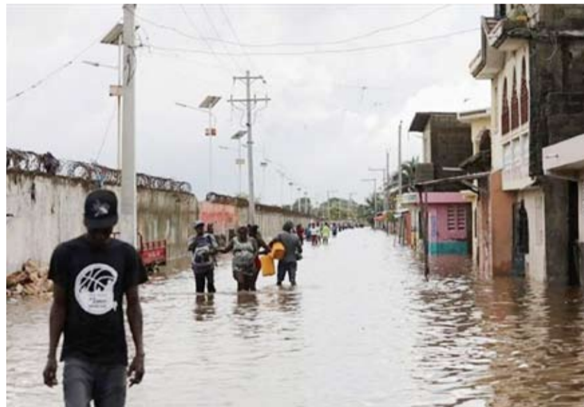
الفيضانات في هايتي

لقي 42 شخصاً على الأقل مصرعهم في هايتي واعتُبر 11 آخرون في عداد المفقودين إثر فيضانات نجمت عن هطول أمطار غزيرة في نهاية الأسبوع الماضي وتسببت كذلك بتشريد الآلاف، بحسب ما أعلنت السلطات. وتسببت الأمطار الغزيرة بحدوث فيضانات وانهيارات أرضية في سبع من مقاطعات البلاد العشر. وهايتي غارقة في أزمة إنسانية زادت فداحة أعمال عنف ترتكبها عصابات مسلحة، وفق ما ذكرته وكالة الصحافة الفرنسية. وبحسب الأمم المتحدة فإن الأمطار الغزيرة أدت إلى تضرر 37 ألف شخص ونزوح 13400 شخص عن ديارهم. ومن المناطق الأكثر تضرراً بالفيضانات مدينة ليويغان الواقعة على بعد 40 كلم جنوب غرب العاصمة بورت أو برنس والتي أدت الأمطار إلى فيضان ثلاثة أنهار فيها.