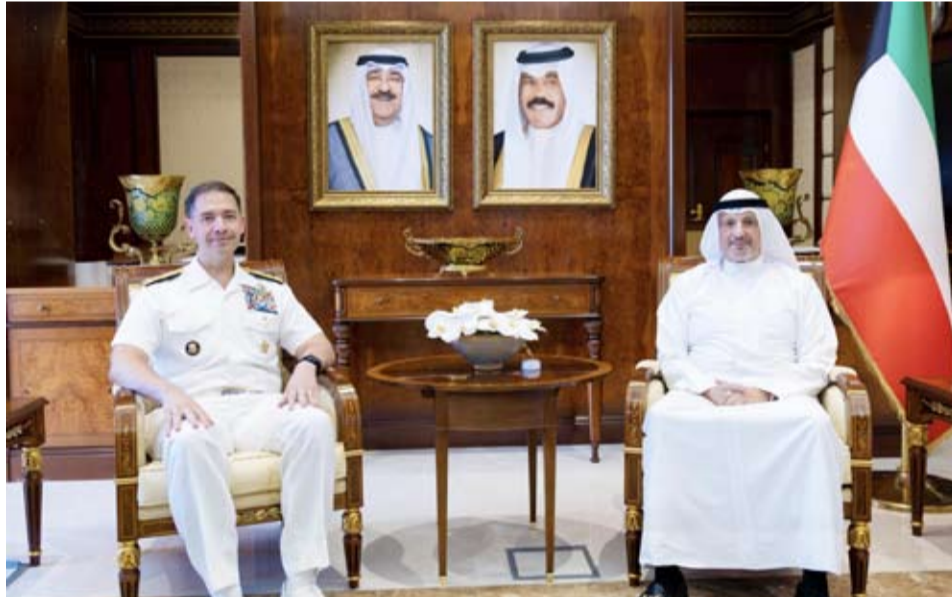
الشيخ سالم الصباح خلال لقائه الفريق الفرقي البحري الأدميرال براد كوبر

وأعرب عن تطلعه للعمل سوياً نحو تعزيز وتمتين العلاقات الثنائية والتعاون القائم بين البلدين الصديقين بما يحقق رؤى قيادتي البلدين وتطلعات الشعبين الصديقين.