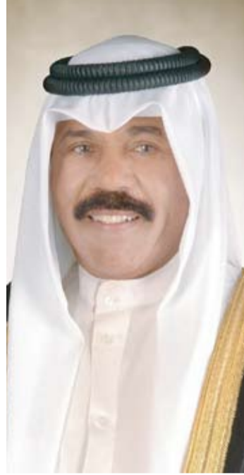
سمو أمير البلاد الشيخ نواف الأحمد

والارتقاء بأطر التعاون بينهما في مختلف المجالات إلى آفاق أرحب وبما يخدم مصلحة البلدين. سائلاً سموه، المولى تعالى أن يديم على فخامته موقور الصحة والعافية وأن يحقق للجمهورية التركية وشعبها الصديق كل ما تتطلع إليه من نمو وازدهار ورخاء.