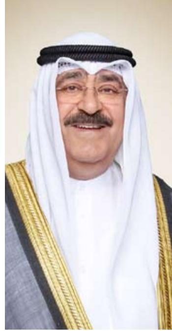
سمو ولي العهد الشيخ مشعل الأحمد