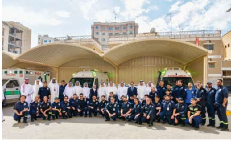
لقطة جماعية للحضور

يهدف إلى خدمة أهالي منطقة حولي والمناطق المجاورة وتلبية الطلب المتزايد على خدمات الطوارئ