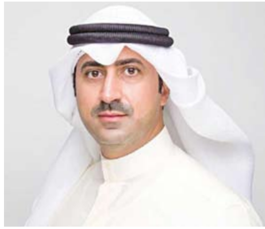
د. نمر الصباح

استضافة هذا المحفل يجسد الثقة الدولية بقدرة الكويت على قيادة الحوار حول مستقبل الطاقة