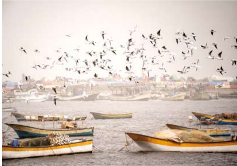
صورة من غزة التقطها المصور محمد أسعد