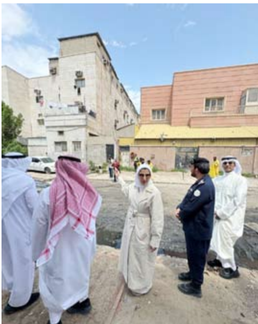
الفارسي متحدة في الجولة

ولفتت إلى أن من التوصيات الأخرى، وضع خطة طارئة وعاجلة لترميم الحفر العميقة وتطوير البنية التحتية ومعالجة شبكة الصرف الصحي، إضافة للحد من التكدس السكاني وسوء