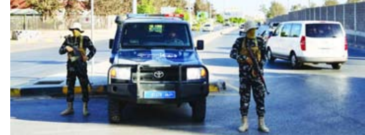
عناصر من قوات الأمن الليبي في طرابلس

أي تصعيد يحدث». كما سجل قادة «كتائب وسرايا الشوار» بمدينة مصراتة، رفضهم القاطع للتحركات العسكرية للقوة المشتركة التابعة لمصراة باتجاه العاصمة طرابلس، ووصفوا تحركات هذه القوة بأنها «غادرة وطنية في ظهر الوطن، ومحاولة لإشعال حرب أهلية لا تخدم إلا أعداء الشعب الليبي».