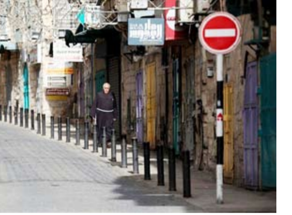
تعطيل العمل في المؤسسات العامة والخاصة وإغلاق المدارس والجامعات

عم الإضراب الشامل الضفة الغربية بمدنها وبلداتها ومخيماتها أسس استجابة لدعوات أطلقتها مجموعات شبابية عبر مواقع التواصل الاجتماعي وتبنتها القوى الوطنية والإسلامية رفضاً لحرب الإبادة التي يشنها الاحتلال الإسرائيلي في قطاع غزة. وشمل الإضراب مختلف مناحي الحياة حيث تعطل العمل في المؤسسات العامة والخاصة وأغلقت المدارس والجامعات أبوابها وكذلك المحال التجارية وتوقفت حركة المواصلات وختل الشوارع من المارة وسط دعوات للمواجهة مع الاحتلال عند نقاط التماس مع جيش الاحتلال.