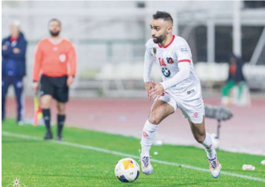
موسم مميز لعموري مع الأبيض

حلول، من إيجاد ثغرة لتسجيل هدف الإنقاذ والاستمرار في سياق حصص اللقب مع الكويت. في المقابل ظهر الفحيحيل بشخصية مميزة أملاً في الحفاظ على المكاسب التي حققها منذ بداية الموسم، كما أكد الأشاوس أنهم من الفرق التي ستحدد وجهة لقب الدوري في الموسم الحالي.