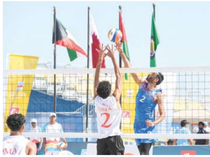
بداية قوية للازرق الكويتي