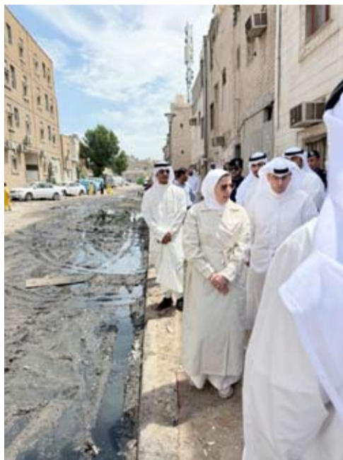
المشاري والفارسي أثناء الجولة

نفذتها إدارة النظافة العامة وإشغالات الطرق بمحافظة الأحمدى