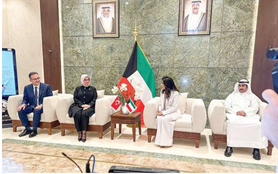
وزيرة الأشغال مستقبلة السفارة التركية

وقعت وزيرة الأشغال العامة الدكتورة نورة المشعان، بحضور سفيرة جمهورية تركيا لدى البلاد طويبي نور سونمن، عقد أعمال الدراسة والتصميم التفصيلي وإعداد مستندات مناقصة مشروع السكة الحديد «المرحلة الأولى» مع المكتب الاستشاري العالمي «برويابي» التركي. وأكدت الوزيرة المشعان أن المشروع يأتي تماشياً مع رؤية قادة دول مجلس التعاون لدول الخليج العربية بشأن إنشاء شبكة السكك الحديدية لتربط الركاب والبضائع، والتي تربط دول المجلس بطول إجمالي يبلغ 2,177 كيلومتراً، تبدأ من دولة الكويت مروراً بجميع دول المجلس وصولاً إلى مسقط في سلطنة عُمان. وأوضحت أن الجزء الخاص بدولة الكويت يتمثل في مسار يمتد من منطقة الشدادية، حيث تقع محطة الكويت المركزية للقطارات على مساحة تبلغ مليوني متر مربع، إلى منطقة النويصيب، بطول 111 كيلومتراً.