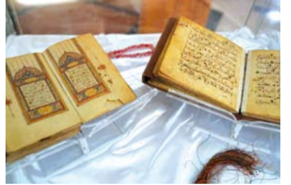
إدراج مخطوطين في سجل ذاكرة العالم

أعلن وزير الثقافة والفنون الجزائري، زهير بللو، نجاح المكتبة الوطنية والمركز الوطني للمخطوط في إدراج بترميم 17 ألف وثيقة العام الماضي، والاستعداد لترميم 30 ألف وثيقة مخطوطة خلال العام الحالي. وكشف الوزير الجزائري، في تصريحات له، عن تمكن الجزائر من إدراج مخطوطين في "سجل ذاكرة العالم" التابع لمنظمة الأمم المتحدة للربية والعلم والثقافة "اليونسكو"، وهما "مستلح من كتاب التكملة" لمؤلفه بن أحمد بن عثمان بن قايدان الذهبي، وكتاب "القانون في الطب" لابن سينا. يذكر أن مصلحة المخطوطات بالمكتبة الوطنية الجزائرية تضم "6902 مخطوط، من بينها أقدم مخطوط مكتوب يعود للقرن الثاني الهجري، وهو عبارة عن بعض الآيات القرآنية المكتوبة على جلد الغزال بالخط الكوفي العراقي، ومخطوطات أخرى أغلبها بالخط العربي بكل أنواعه.