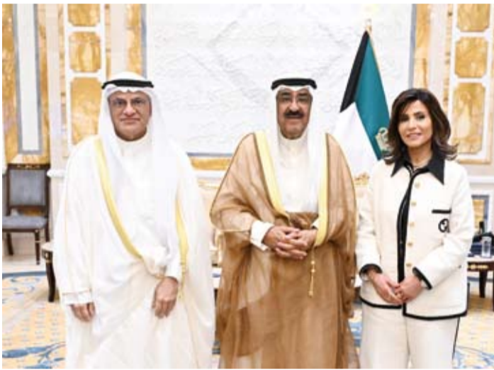
سمو أمير البلاد مستقبلاً الجلال والمبلم

المطروشي ومحمد عبد الرحيم الملا، وذلك بمناسبة زيارتهم للبلاد. وحضر المقابلة وزير الإعلام والثقافة ووزير الدولة لشؤون الشباب عبدالرحمن المطيري وكبار المسؤولين بال دولة.