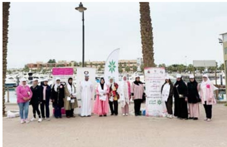
البنك نظم رحلة الأمل

انطلاقاً من اهتمام وسعي البنك التجاري الكويتي للمشاركة في العديد من الفعاليات الإنسانية والاجتماعية ضمن برامجها المتنوعة للمسؤولية الاجتماعية والاستدامة، قام البنك بدعم نادي "مكين" للدعم النفسي والمساندة للمرضى وذويهم ضمن "الحملة الوطنية للتوعية بمرض السرطان (كان)"، وذلك بتسيير رحلة للمتعافيات من السرطان تحت شعار "رحلة الأمل" إلى جزيرة فيلكا.