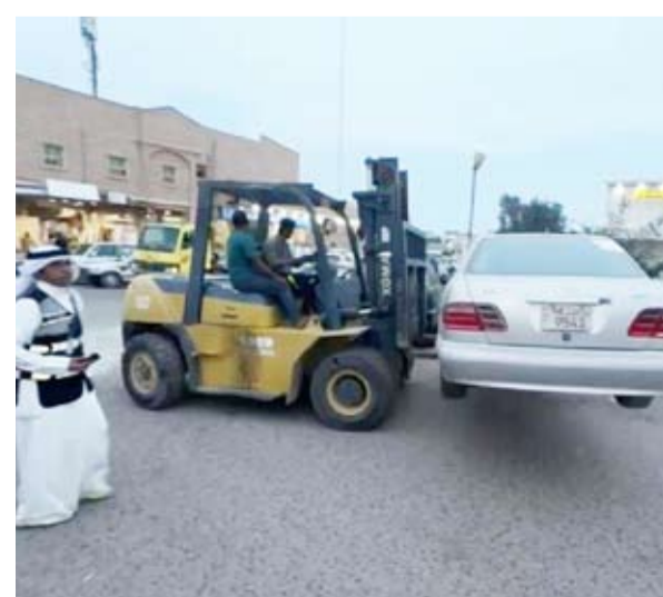
رفع سيارة مخالفة

أعلنت إدارة العلاقات العامة في بلدية الكويت عن الإنجازات التي حققتها إدارة النظافة العامة وإشغالات الطرق بفرع بلدية محافظة الأحمدى من مخالفات ورفع سيارات مهمله ونظافة عامة وكل ما يشوه المظهر الجمالي ويعمل على إشغال الطريق بجميع المناطق وذلك من خلال الجولات الميدانية التي يقوم بتنفيذها الفريق للحفاظ على المظهر الحضاري بالتعاون مع وزارة الداخلية.