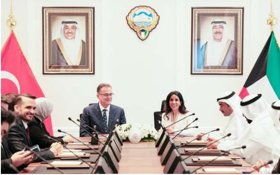
المشعان توقع العقد مع الشركة التركية

المشعان: طرح مناقصة التنفيذ والانتهاء من مرحلة التصميم