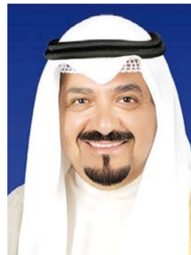
سمو الشيخ أحمد عبدالله

أعرب سمو الشيخ أحمد عبدالله رئيس مجلس الوزراء، أمس، اليوم عن تشرفه واعتزازه بتمثيل صاحب السمو أمير البلاد الشيخ مشعل الأحمد، في الاحتفال الذي سيقام بجمهورية ألمانيا الاتحادية الصديقة بمناسبة مرور 50 عاماً على الشراكة بين دولة الكويت ومجموعة (مريديس بنز Ag) يوم الخميس المقبل.