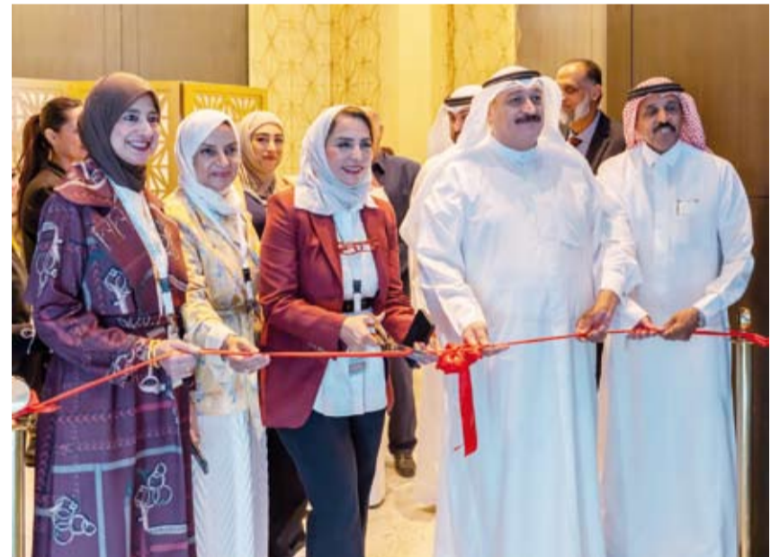
د. أحمد العوضي خلال افتتاح المعرض للمصاب

الاطفال إضافة إلى التقدم العلمي المحرز في تشخيص وعلاج سرطان الدم بنوعيه الحاد والمزمن وآخر الابتكارات والتطورات في العلاجات الخلوية والجزئية. وبين أن المؤتمر يسلط الضوء كذلك على العلاجات المناعية الموجهة باستخدام الأجسام المضادة والعلاج بالخلايا التائية المعدلة وراثياً (CAR Cells) التي تمثل نقلة نوعية في مجال علاج الأورام الخبيثة وتعرّز من فرص الشفاء والتعافي. وقالت الدكتورة الشريدة: إن قسم أمراض الدم وسرطان الأطفال وزراعة الخلايا الجذعية في مستشفى بنك الكويت يعتبر الوطني التخصصي للأطفال رئيس رابطة الأطفال الكويتية رئيس المؤتمر الدكتور سندهس الشريدة في كلمتها: إن المؤتمر يعتبر رسالة تحمل التزاماً إنسانياً وأخلاقياً تجاه أبنائنا الذين يواجهون تحديات صحية جسيمة. وقالت الدكتورة الشريدة: إن قسم أمراض الدم وسرطان الأطفال يضم 64 سريراً ويضم جناح الحالات النهارية 12 سريراً و50 الإشغال يتراوح ما بين 60 في المئة وعدد حالات الدخول السنوية 1154 حالة وعدد حالات الدخول في الجناح