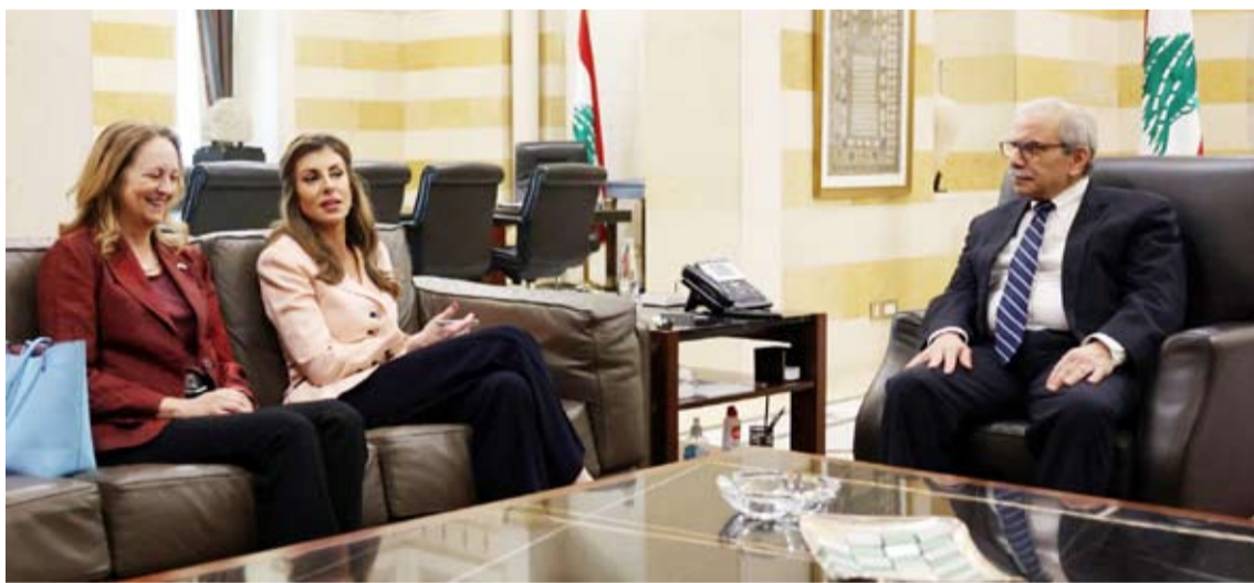
أورتاغوس خلال لقائها مع سلام

غاب عن لقاءات ثنائية المبعوث الخاص للرئيس الأميركي في بيروت، مورغان أورتاغوس، التمهول والوعيد، واتسمت بتبادل النيات الحسنة لإيجاد الحلول، وتعهد لبناني بحصر السلاح في يد «الشرعية» اللبنانية. وقالت مصادر رئاسية لـ«الشرق الأوسط»: إن أورتاغوس تحدّثت مع رؤساء الجمهورية جوزيف عون والبرلمان نبيه بري والحكومة نواف سلام بلغة هادئة كانت نقياً للتعبير التهديدية التي استخدمتها في لقاءاتها بزيارتها الأولى لبيروت، من دون أن تُسقط إصرارها على حصر السلاح بيد الدولة». وكشفت المصادر أن أورتاغوس تبليغتهم أنهم «لا جدال في حصريته، وأنه لا يعد قابلاً للتقاش وبات محسوماً». ولقبت المصادر إلى أن استعداد الدولة لوضع استراتيجية دفاعية لا يعني أن سحب السلاح غير الشرعي سيبقى عالقاً إلى أمد مديد، مضيفة أن أورتاغوس استمعت إلى موقف الرؤساء في تسليطهم الضوء على الوضع الحالي في الجنوب بامتثال إسرائيل عن التزام حرقية الاتفاق الذي نص على وقف النار، واحتفاظها باللقاط الخمس، ورفضها الانسحاب، ومواصلة خروجها وانتهاكاتهما للأجواء اللبنانية، وهذا ما يمنع الجيش اللبناني من توسيع انتشاره حتى الحدود الدولية.