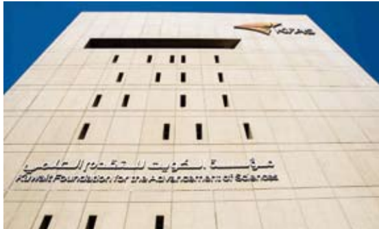
مركز صباح الأحمد للموهبة والإبداع

إدارة المشاريع من خلال تصميم وبناء سيارات سباق مصغرة باستخدام أحدث التقنيات كما يتيح للطلبة فرصة التعلم من خلال تجارب عملية وتحديات تنافسية تعزز الابتكار والعمل الجماعي. وذكر أن البرنامج يستهدف الطلبة الكويتيين وتمكين النشء من عمر 9 إلى 19 عاماً من التدريب وصقل المهارات الهندسية واستخدام التصميم والطابعات ثلاثية الأبعاد للمشاركة في المسابقات العالمية التي تحتضنها منظمة (فورمولا 1) العالمية. وأوضح أنه سيتم اختيار المشاركين بناء على