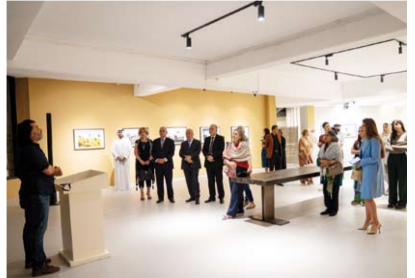
السفير الفلسطيني رامي طهبوب خلال حضوره افتتاح الفعاليات