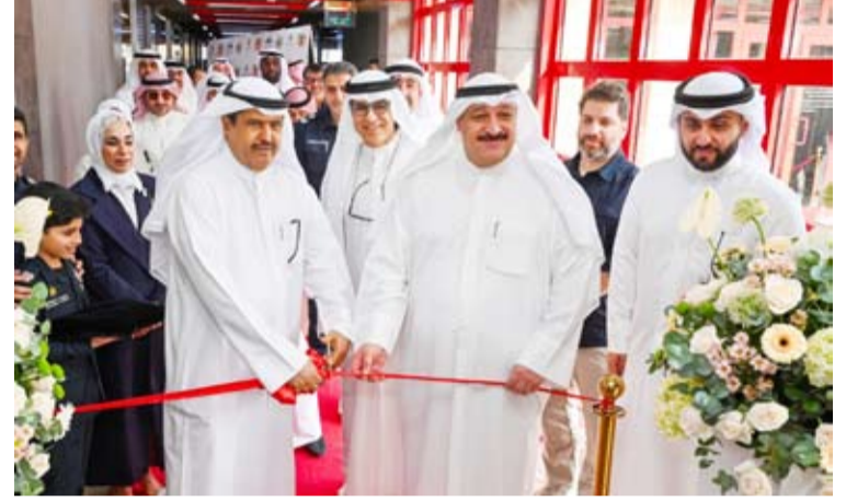
وزير الصحة ومحافظ حولي خلال افتتاح مركز إسعاف العثمان