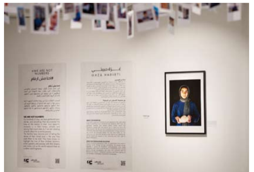
من معرض «غزة حبيبي»

بمعرض للمصور بعنوان (غزة حبيبي) لمصورين فلسطينيين ونقوا الحياة في غزة من غير الدمار وجمعوا قصصاً ملهمة ومتنوعة عن الشعب الفلسطيني. وينظم المهرجان الذي يستمر حتى الخميس المقبل سفارة دولة فلسطين لدى الكويت وجمبع كويت للمعارض ومنصة يرى وانتولد فلسطين ومنصة كاب والجامعة الأمريكية في الكويت.