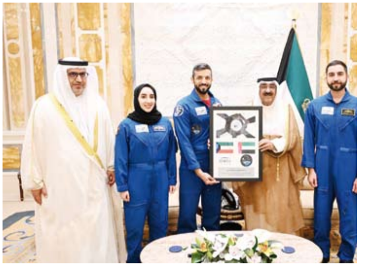
.. وسموه يستقبل الوفد الإماراتي