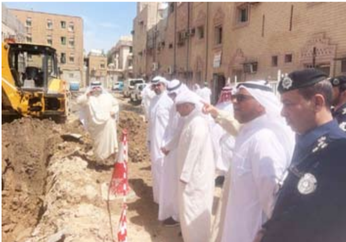
وزير البلدية ومحافظ الفروانية وأعضاء البلدي يتفقدون جليب الشيوخ

حيث تقدمنا بثمانى توصيات عاجلة مدروسة بعناية من خلال ورشة العمل الخاصة بالمنطقة وصادق عليها الوزير.