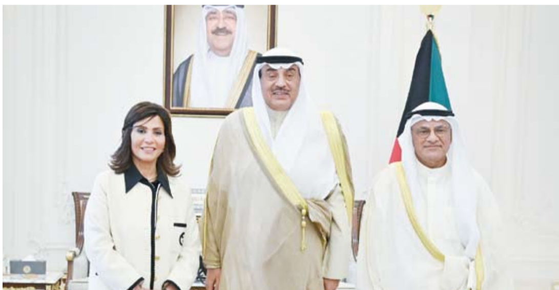
سمو ولي العهد يستقبل الجلال والمبلم

استقبل سمو ولي العهد صباح الخالد، بقصر بيان، ظهر أمس، وزير التعليم العالي والبحث العلمي الدكتور نادر الجلال، حيث قدم لسموه مدير جامعة الكويت الدكتورة دينا المبلم وذلك بمناسبة تعيينها بمنصبها الجديد. كما استقبل سمو ولي العهد الشيخ صباح الخالد، بقصر بيان، صباح أمس، وزير الدولة لشؤون الشباب بدولة الإمارات العربية المتحدة الشقيقة الدكتور سلطان بن سيف النيايدي ورائدي الفضاء نورة عيسى المطروشي ومحمد عبد الرحيم الملا وذلك بمناسبة زيارتهم للبلاد. وحضر المقابلة وزير الإعلام والثقافة ووزير الدولة لشؤون الشباب عبدالرحمن المطيري ومدير مكتب سمو ولي العهد الفريق متقاعد جمال محمد الذياب.