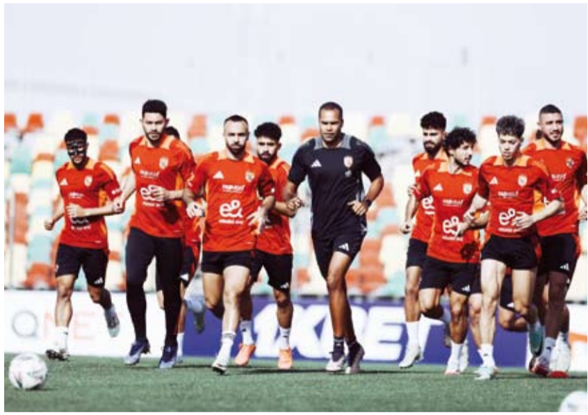
الأهلي المصري يواصل رحلة الدفاع عن لقبه

لاستعادة لقب دوري أبطال أفريقيا الذي خسره الموسم الماضي أمام الأهلي المصري، بهدف إضافة اللقب الخامس إلى خزائنه. وفي مباراة ثالثة تسيطر عليها الأزمات والمشاكل، تبدو فرص بيراميدز المصري قوية للغاية في عبور عقبة ضيفه الجيش الملكي المغربي بعد أن تغلب عليه ذهاباً بالقاهرة 1/4.