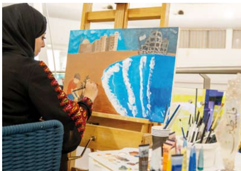
رسم حي مصاحب لافتتاح الفعاليات