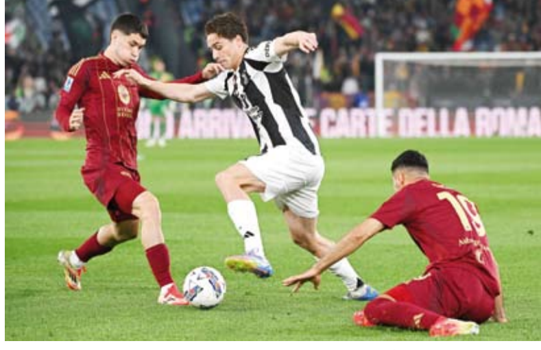
تعادل مستحق بين روما ويوفنتوس

تعادل روما مع يوفنتوس بهدف لمثله، خلال اللقاء الذي جمعتهما على ملعب الأول ليمبيكو، ضمن منافسات الجولة 31 من الدوري الإيطالي لكرة القدم. وتقدم يوفنتوس بهدف سجله مانويل لوكاتيلي في الدقيقة 40، وتعادل روما عن طريق الدور شومورودوف في الدقيقة 49، ليحصد كل فريق نقطة واحدة من قمة هذه الجولة.