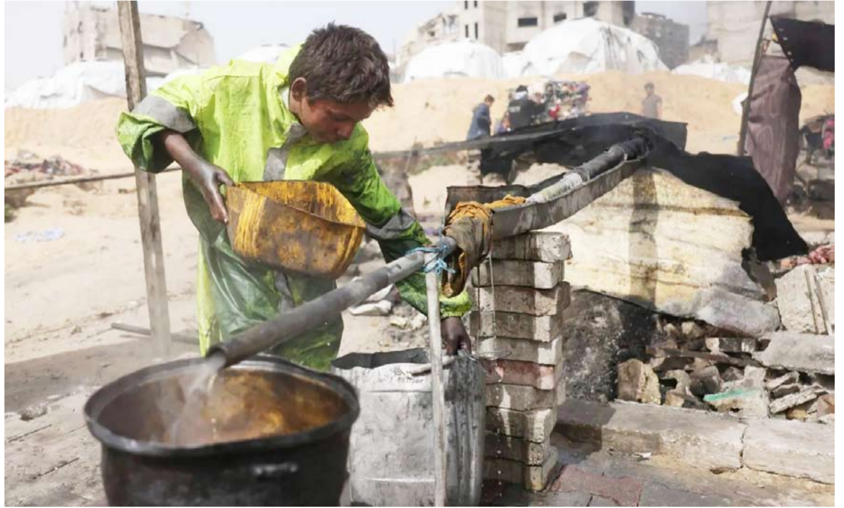
فلسطيني في معمل لاستخلاص الوقود من البلاستيك

أسبوع. وقد خُفّضت الوكالات توزيعات الغذاء على العائلات إلى النصف، والأسواق خالية من معظم الخضراوات. ولا يستطيع كثير من عمال الإغاثة التنقل؛ بسبب القصف الإسرائيلي. وعلى مدار 4 أسابيع، أغلقت إسرائيل جميع مصادر الغذاء والوقود والأدوية وغيرها من الإمدادات لسكان قطاع غزة، الذين يزيد عددهم على مليوني فلسطيني. وهذا هو أطول حصار حتى الآن في الحملة الإسرائيلية المستمرة منذ 17 شهراً، ولا توجد أي علامة على انتهائه، وفق تقرير سابق من وكالة «أسوشيتد برس».