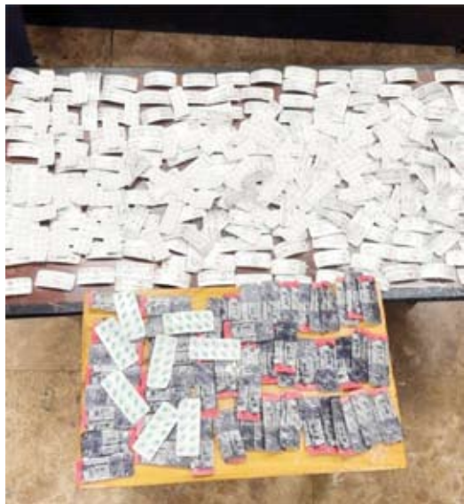
المضبوطات تم إحالتها إلى مكافحة المخدرات

تمكّنت الإدارة العامة للجمارك من ضبط مسافرة في مطار الكويت الدولي T1، وذلك بعد الاشتباه بها أثناء إجراءات التفتيش الجرمي، حيث كانت قادمة من أديس أبابا. وأسفرت عملية التفتيش عن العثور بحوزتها على كمية من الحبوب المخدرة تبلغ عددها 3458 حبة تقريباً من مادة «Tapentadol» المدرجة ضمن جدول المؤثرات العقلية، والتي كانت مخبأة داخل علب بودرة للجسم في محاولة لتهريبها إلى البلاد دون حمل أي وصفة طبية. وأوضحت الإدارة أن المسافرة تحمل