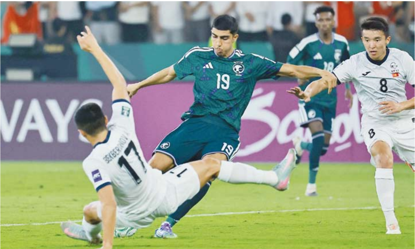
جانب من لقاء السعودية وقرغيزيا