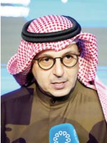
الدكتور صبيح المخيزيم

أشاد وزير الكهرباء والماء والطاقة المتجددة الدكتور صبيح المخيزيم أسس الأربعاء، بالأفكار والمشاريع الهندسية المبتكرة المشاركة في معرض التصميم الهندسي الـ49 والمقام في مدينة صباح السالم الجامعية.