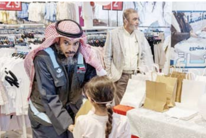
جانب من توزيع كسوة الشتاء