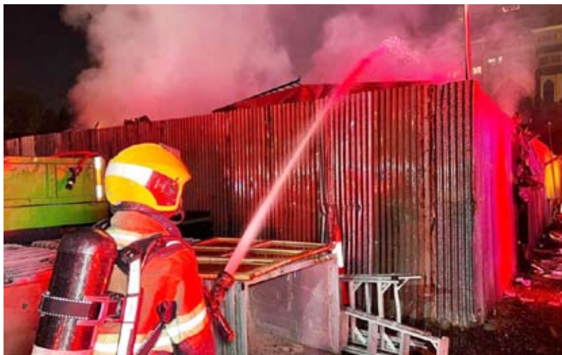
السيطرة على الحريق

ذكرت قوة الإطفاء العام أن فرق مراكز الشيوخ الصناعي والعرضية والإسناد سيطرت فجر أمس الأربعاء على حريق اندلع في شاليهات تُستخدم كسكن للعمال في منطقة الرقعي. وذكرت «الإطفاء» أن الفرق باشرت على الفور أعمال مكافحة الحريق واتخذت الإجراءات اللازمة للسيطرة عليه، مشيرة إلى أن الحادث لم يسفر عن أي إصابات تذكر.