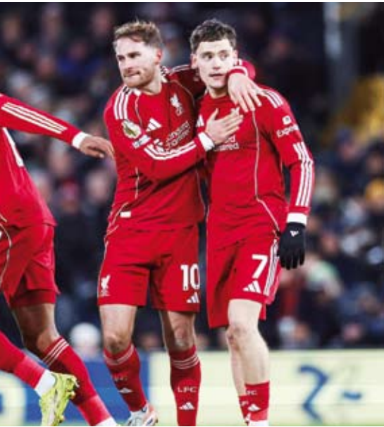
فيرتز امل ليفربول أمام آرسنال

المسابقة، المؤهلة لبطولة دوري أبطال أوروبا في الموسم المقبل. وفرط ليفربول في فوز كان في متناولهم أمام فولهام، بعدما تقدم 2 - 1 في الدقيقة الرابعة من الوقت المحتسب بدلًا من الضائع للشوط الثاني، لكنه فشل في تحقيق أي فوز خلال المرحلتين الماضيتين، بتعاقبه مع ليدز يونايتد، ثم فولهام، ليظل في المركز الرابع برصيد 34 نقطة، وبات آماله معقودة فقط على الوجود في المراكز الأربعة الأولى بترتيب