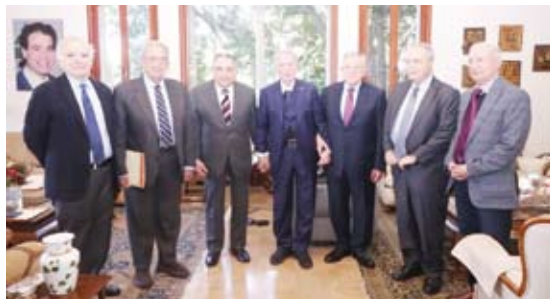
جانب من الاجتماع الاستثنائي للمجلس

والقدس والجولان واليمن والسودان والصومال إضافة إلى التطورات المتسارعة في فنزويلا وانعكاساتها على المشهد الدولي ولا سيما في المناطق الساخنة من العالم.