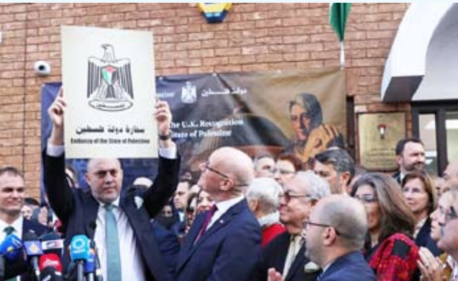
الاحتفال بفتح السفارة الفلسطينية في بريطانيا

لاستهداف من قبل ملثمين رفعا أعلام إسرائيل وأعلام الاتحاد البريطاني، حيث شوه المبني بمصلمات من بينها «أنا أحب جيش الدفاع الإسرائيلي»، وفقاً لصور التقطتها كاميرات المراقبة. وقال زملط إن اعتراف بريطانيا بالدولة الفلسطينية هو فرة «مئة عام من النضال المتواصل»، لكنه أضاف أنه يشعر بـ«الظل الثقيل الذي يخيم علينا» في ظل ما يعيشه سكان غزة من «جحيم».