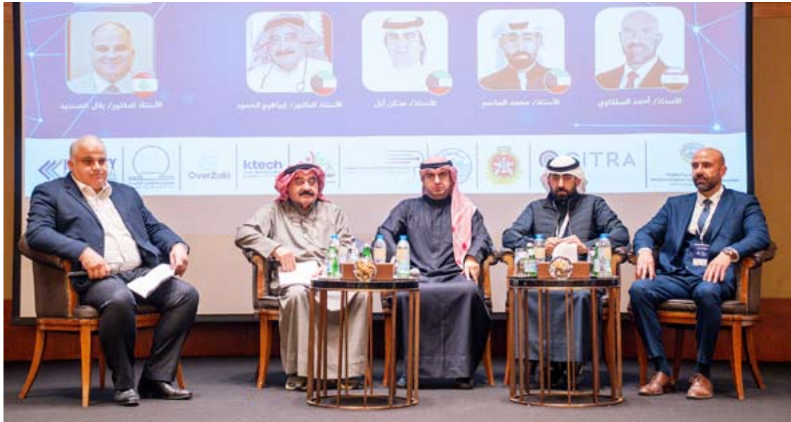
المتحدثون في المؤتمر

♦ إبراهيم: حماية الفضاء الإلكتروني مسؤولية وطنية مشتركة تتطلب تكاتف الجهود بين كافة الجهات ذات الصلة