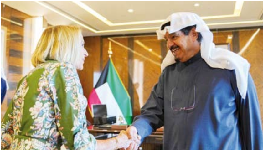
سمو رئيس مجلس الوزراء مستقبلاً الدكتورة مارسيا مكنوت

استقبل سمو الشيخ أحمد عبدالله الإحمّد الصباح رئيس مجلس الوزراء في قصر بيان أمس رئيس الأكاديمية الوطنية للعلوم في الولايات المتحدة الأمريكية الدكتورة مارسيا مكنوت والوفد المرافق لها وذلك بمناسبة زيارتها للبلاد. حضر المقابلة مدير عام هيئة تشجيع الاستثمار المباشر الشيخ الدكتور مشعل جابر الأحمد الصباح ومدير عام مؤسسة الكويت للتقدم العلمي الدكتورة أمينة رجب فراحان.