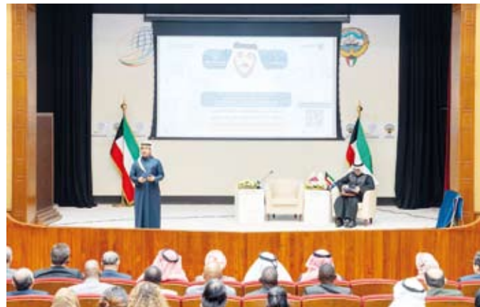
السفير الدكتور عبدالعزيز الحر

المساحة الجغرافية أو عدد السكان وبعيدا عن المفاهيم التقليدية للقوة عبر تبني سياسات فعالة في مجال الوساطة. وبين أن المحاضرة استعرضت كذلك الجهود التي تبذلها كل من الكويت وقطر في مجال حل النزاعات ودورها البارز في دعم مساعي السلام وتعزيز الاستقرار على المستويين الإقليمي والدولي.