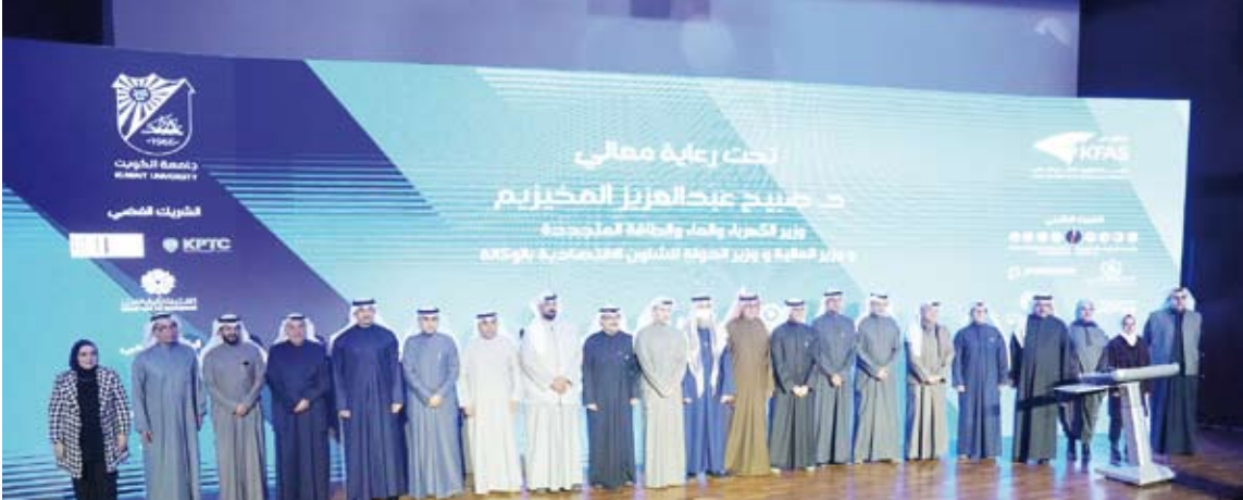
جانب من المشاركين في المعرض

وثنّى جهود الطلبة المشاركين على علمهم وروحهم الإبداعية العالية آملاً أن يشكل المعرض حافزاً للمزيد من الابتكار والتميز والتركيز على التطوير في مختلف مجالات الهندسة. يذكر أن المعرض يقام في نهاية كل فصل دراسي لعرض مشاريع الطلبة الخريجين من الكلية وتضم نسخته الحالية 46 مشروعاً هندسياً مبتكراً في رحاب كلية الهندسة والبتترول بمدينة صباح السالم الجامعية ويستمر يومين.