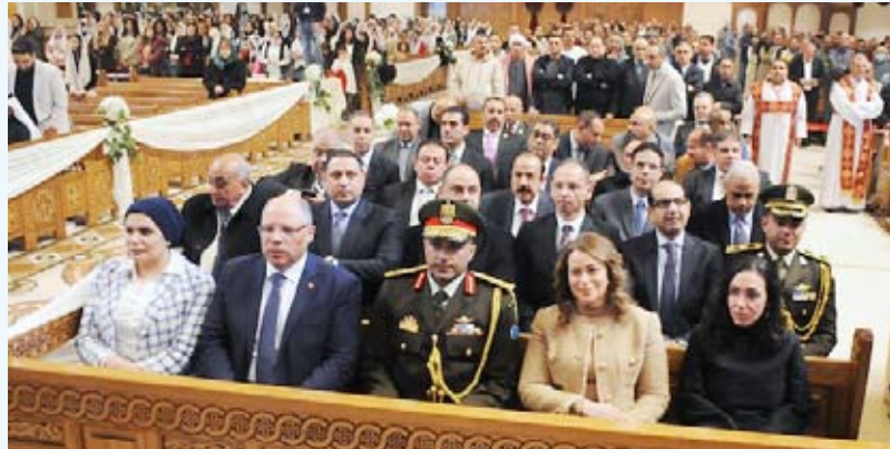
جانب من حضور القداس

أعلنت إدارة العلاقات العامة في بلدية الكويت مواصلة الفرق الميدانية لإدارات النظافة العامة وإشغالات الطرق تنظيف جولاتها التفتيشية لرصد وإزالة مخالفات لأحتي النظافة وإشغالات