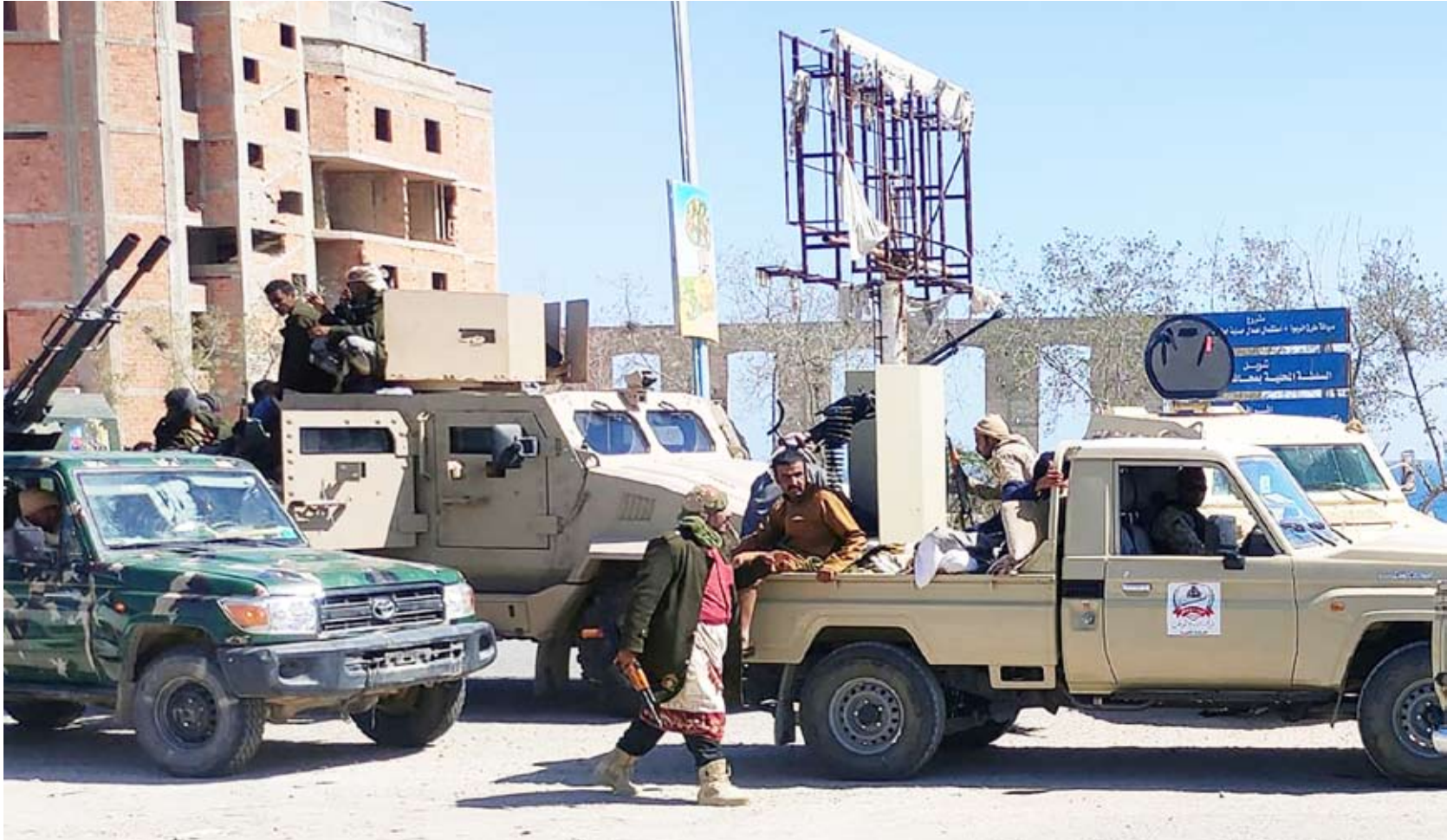
قوات درع الوطن في مدينة سيئون

كما قضت المادة الثانية من القرار بإسقاط عضوية الزبيدي في مجلس القيادة الرئاسي، فيما كلفت المادة الثالثة النائب العام باتخاذ الإجراءات القانونية اللازمة والتحقيق في الوقائع المنسوبة إليه، وفقاً للقوانين السارية.