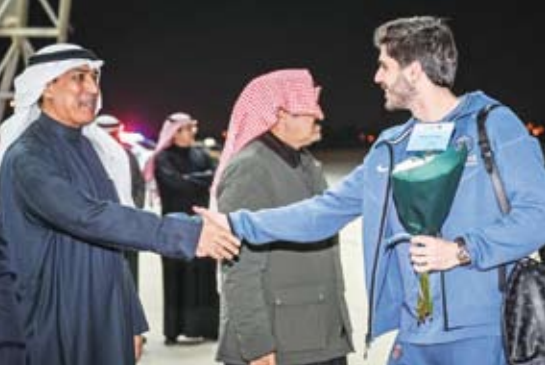
استقبال فريق باريس سان جيرمان