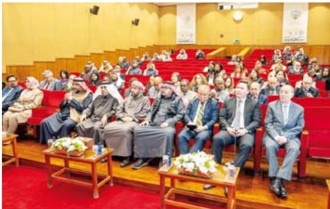
جانب من المحاضرة