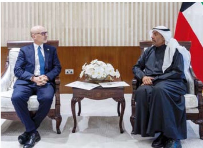
وجانب من لقائه تيمسجن فوشي