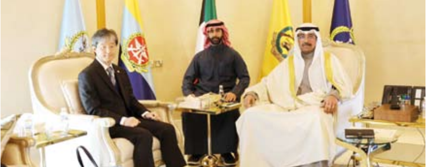
لقاء وزير الدفاع وسفير اليابان

بحث وزير الدفاع الشيخ عبد الله علي عبدالله السالم الصباح مع كل من سفير اليابان لدى البلاد كينيتشيرو موكاوي وسفير جمهورية بنغلاديش الشعبية لدى البلاد السلواء سيد طارق حسين التعاون بين الكويت وكل من البلدين