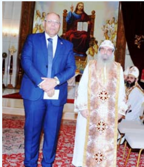
السفير المصري والانبيا بيجول

أقامت الكنيسة القبطية المصرية بدولة الكويت قداس عيد الميلاد المجيد في كاتدرائية مار مرقس للأقباط الأرثوذكس، وسط حضور رسمي ودبلوماسي ومجتمعي رفيع، وحشد كبير من أبناء الكنيسة والجاليات القبطية.