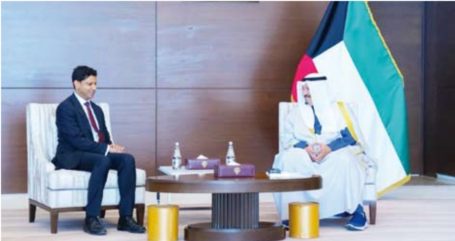
جانب من استقبال سفير المملكة المتحدة لبريطانيا العظمى وأيرلندا الشمالية