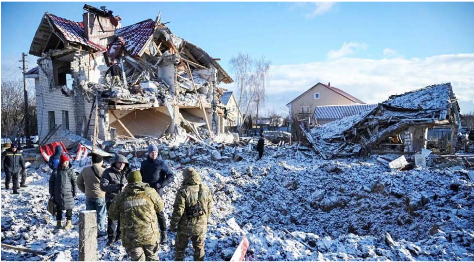
هجوم صاروخي روسي في تشيرنيهيف بأوكرانيا

أعلنت روسيا السيطرة على مدينة كوراخوف في شرق أوكرانيا، بعد ثلاثة أشهر من المعارك، معتبرة أن هذا التقدم سيبيح لقواتها الاستيلاء على باقي منطقة دونيتسك «بوتيرة متسارعة». ويأتي هذا الإعلان في حين تنشق القوات الأوكرانية، التي تتعرض لانتكاسات منذ أشهر في الجبهة الشرقية من البلاد، هجوماً جديداً في منطقة كورسك الروسية الحدودية، حيث تسيطر القوات الأوكرانية على مئات الكيلومترات المربعة منذ الهجوم الذي شنته في أغسطس 2024.