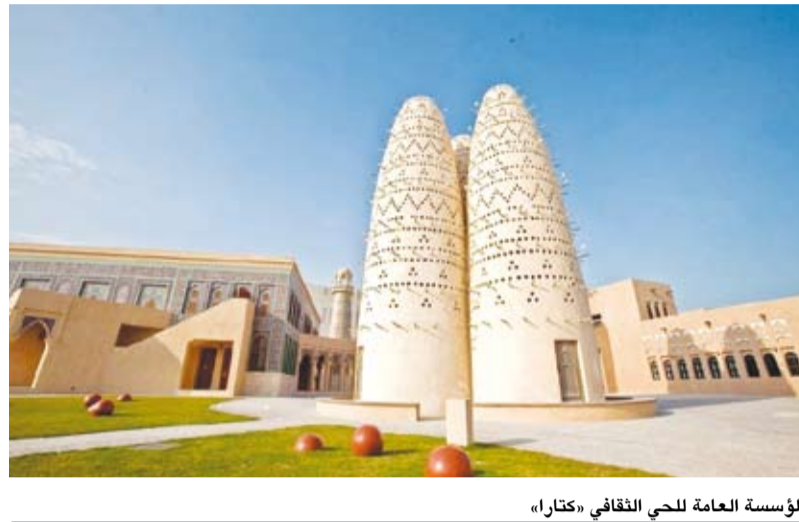
المؤسسة العامة للثقافة «كتارا»