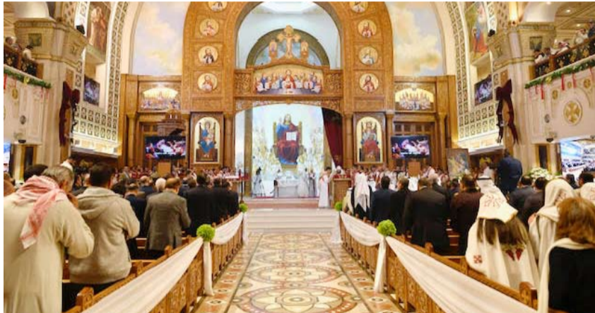
جانب من القديس