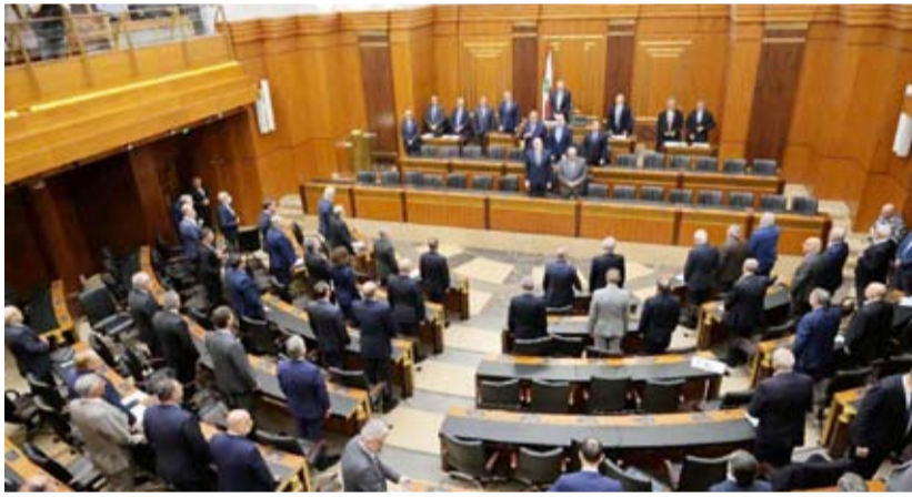
البرلمان اللبناني متعقداً في جلسة سابقة