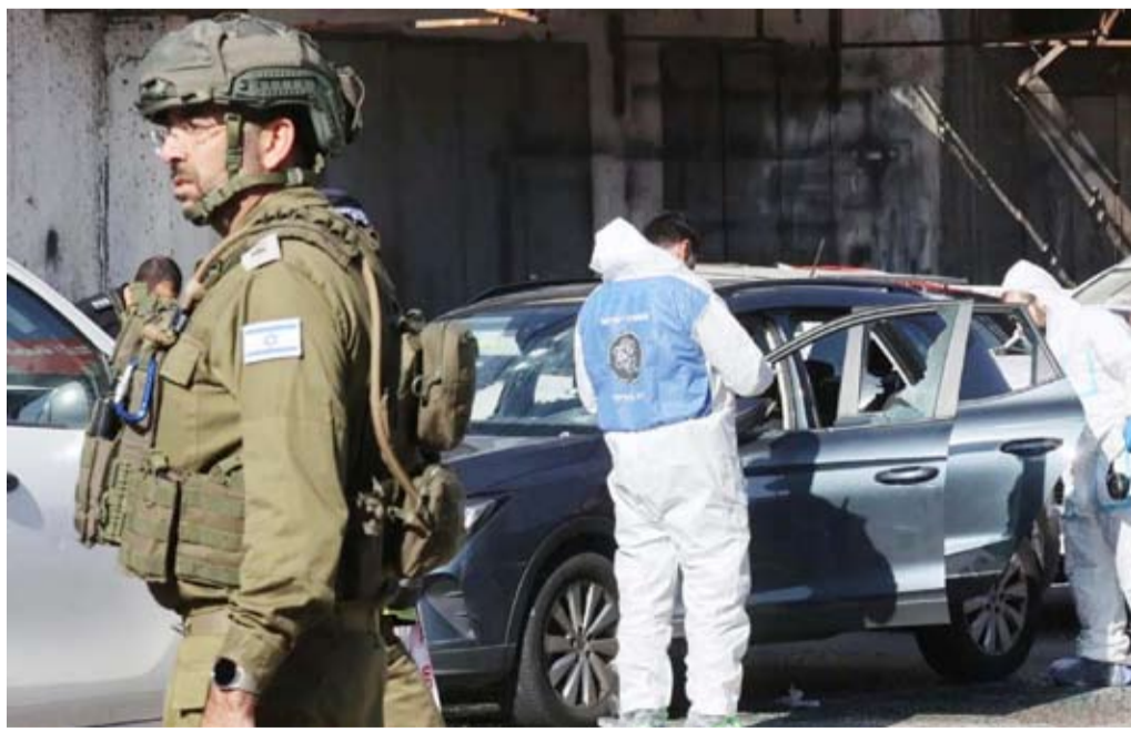
موقع هجوم بالضفة الغربية

«وكل من ساعدهم»، قال وزير الدفاع الإسرائيلي كاتس، إنه أمر باستخدام القوة الشديدة ضد أي مكان تقود إليه آثار منفذي الهجوم. ويبدو، قال وزير المالية الميموني المتطرف بتسليح سموتريتش: «إن مفهوم الأمن الذي كان قبل 7 أكتوبر ما زال موجوداً حتى ونذغ ثمنه (...). الإرهاب في الضفة وغزة وإيران هو