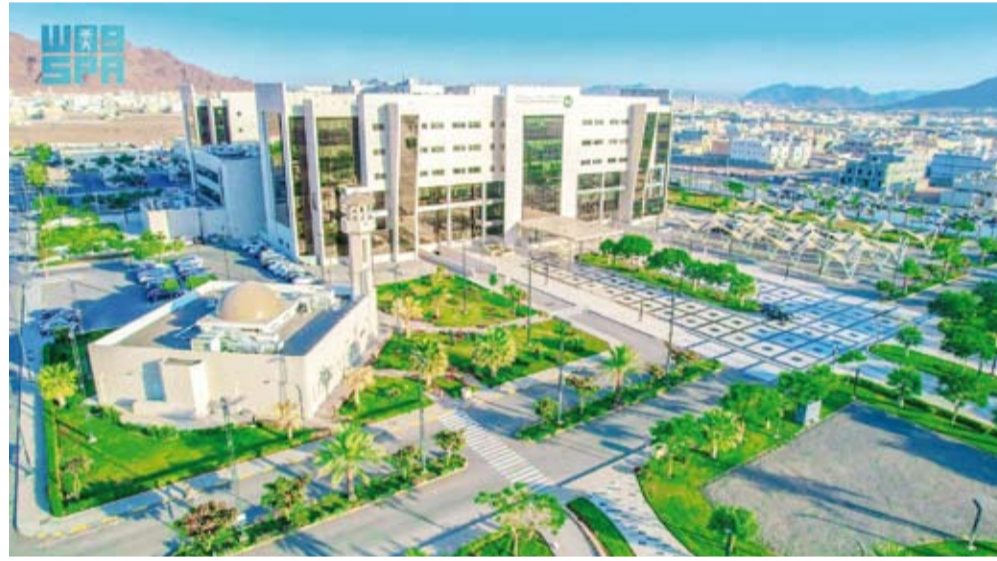
مستشفى الملك فيصل التخصصي

حصل مستشفى الملك فيصل التخصصي ومركز الأبحاث بالمدينة المنورة على شهادة الأيزو الدولية 41001:2018 في إدارة المرافق، تكريماً للجهود المتواصلة في تطبيق أفضل الممارسات العالمية لتحسين كفاءة التشغيل وتعزيز استدامة البيئة، إضافة إلى توفير بيئة عمل مثالية تتسم بالجودة والابتكار. وتعد هذه الشهادة معياراً عالمياً في مجال إدارة المرافق، حيث تقدم إطاراً فعالاً يساعد المؤسسات على تحسين إدارة الموارد، وتقليل التكاليف التشغيلية، وضمان بيئة عمل آمنة وصديقة للبيئة، كما تسهم الشهادة في تحسين تجربة المرضى والزوار من خلال تقديم خدمات صحية وآمنة، بما يتماشى مع التزام المستشفى بتوفير أعلى مستويات الراحة والجودة. وتعكس الشهادة التزام مستشفى الملك فيصل التخصصي بالمعايير العالمية أترأ إيجابياً على ممارسات الاستدامة البيئية، من خلال تحسين كفاءة استهلاك الطاقة