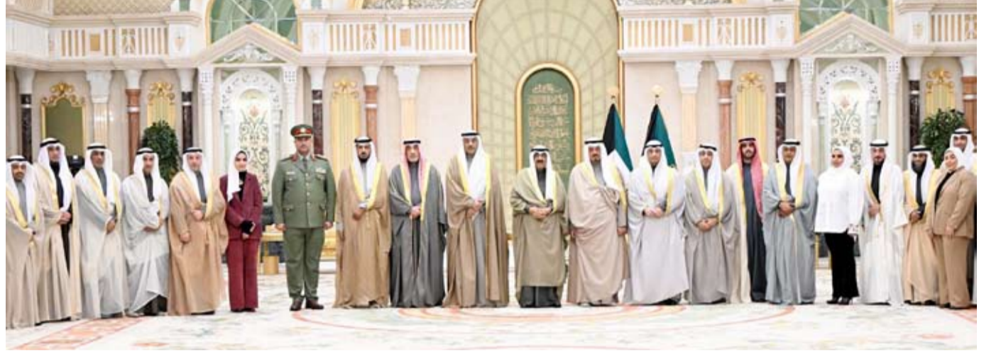
سمو الأمير يستقبل رئيس وأعضاء اللجنة المنظمة لـ«خليجي زين 26».

استقبل سمو أمير البلاد الشيخ مشعل الأحمد بقرص بيان صباح أمس وبحضور سمو ولي العهد الشيخ صباح الخالد ، و سمو الشيخ أحمد العبدالله رئيس مجلس الوزراء ، والنائب الأول لرئيس مجلس الوزراء ووزير الدفاع ووزير الداخلية الشيخ فهد اليوسف ، وزير الإعلام والثقافة ووزير الدولة لشؤون الشباب رئيس اللجنة العليا المنظمة لبطولة كأس الخليج العربي لكرة القدم عبد الرحمن المطيري ورئيس الاتحاد الكويتي لكرة القدم نائب رئيس اللجنة العليا الشيخ أحمد اليوسف ، وأعضاء اللجنة العليا وروساء اللجان العاملة المنظمة لبطولة كأس الخليج العربي لكرة القدم دورة خليجي زين 26. وخلال كلمة بالمناسبة، أكد صاحب السمو أن العطاء للوطن بهمة وإصرار و وضع الكويت في القلب ونصب العيون والعمل بروح الفريق الواحد من كائز النجاح والتميز وقد أثبت أبناء الكويت المخلصون ذلك في استضافة هذه البطولة وأكدوا أن العلاقات الأخوية والروح الرياضية اسمى فوز وأرفع تتويج.