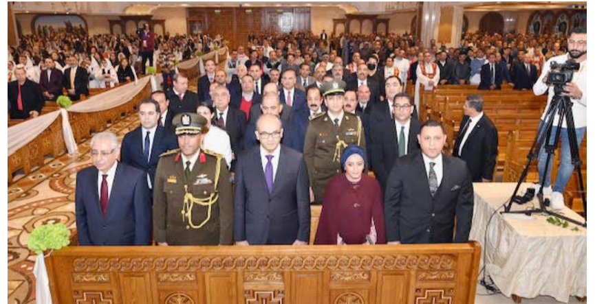
سؤولو السفارة المصرية في مقدمة الحضور

أيضا يحل التسامح تختفي الشرور ويتقوى نسيج المجتمع وتعلو القيم الإنسانية