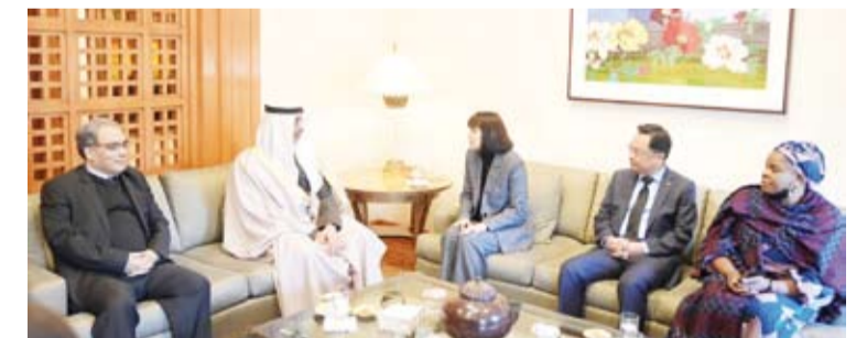
الشيخ محمد عبدالله يقدم واجب العزاء بالسفارة الأميركية

قام وزير شؤون الديوان الأميري الشيخ محمد عبدالله، صباح أمس، بزيارة إلى سفارة الولايات المتحدة الأمريكية لدى دولة الكويت، حيث نقل تعازي صاحب السمو أمير البلاد الشيخ مشعل الأحمد، وسمو