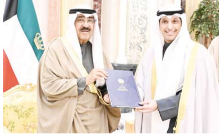
سمو الأمير ومعه وزير الإعلام عبد الرحمن المطيري

◆ سمو الأمير: «كفيتم بجهودكم.. ووفيتم بعهدكم» العطاء للوطن ووضع الكويت في القلب ونصب العيون والعمل بروح الفريق الواحد من ركائز النجاح والتميز ◆ دعم كامل للاستمرار فيما تشهد كويتنا الغالية من نهضة تنموية في شتى المجالات ◆ المطيري: رعاية سمو الأمير رسالة نبيلة تعكس عمق رؤيته الثاقبة وحرصه الدائم على تجسيد دور الكويت الرائد