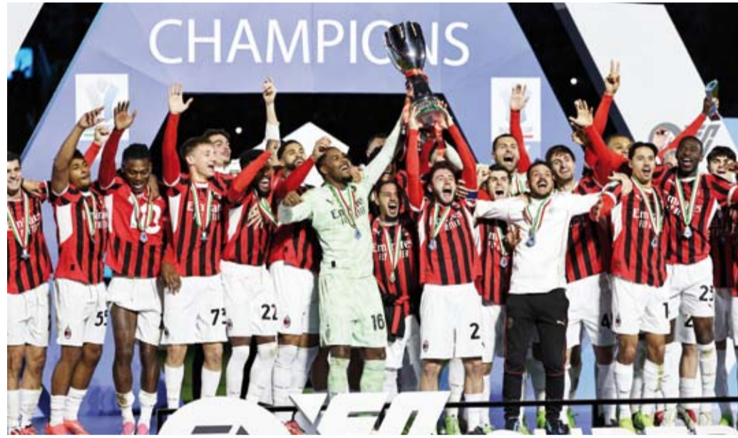
ميلان يحقق لقبه الأول من 2016

النهائي أمام يوفنتوس، حيث فاز عليه وكرر ميلان ما فعله في نصف (2-1) بعدما كان خاسراً بهدف، وهو