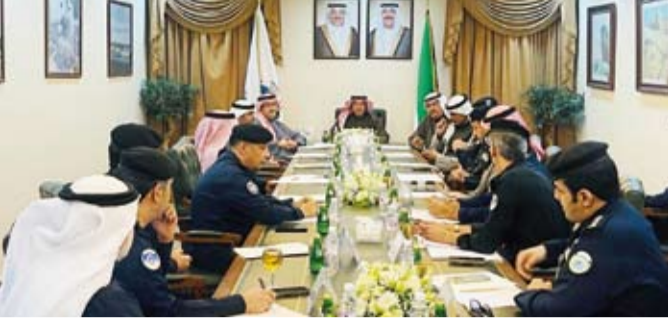
جانب من الاجتماع

ورحب محافظ العاصمة الشيخ عبدالله سالم العلي الصباح في الحضور، وجرى خلال الاجتماع استعراض الاستعدادات الخاصة في احتفالات الأعياد الوطنية، وأهمية تفعيل كافة الجوانب التي تساهم في إبراز الفرحة والبهجة في عموم البلاد. كما تناول المحافظون مناقشة التنسيق بين محافظات البلاد وتضافر كافة الجهات الحكومية، في سبيل الاحتفال بالأعياد الوطنية بأبهى وأجمل صورة مشرفة.