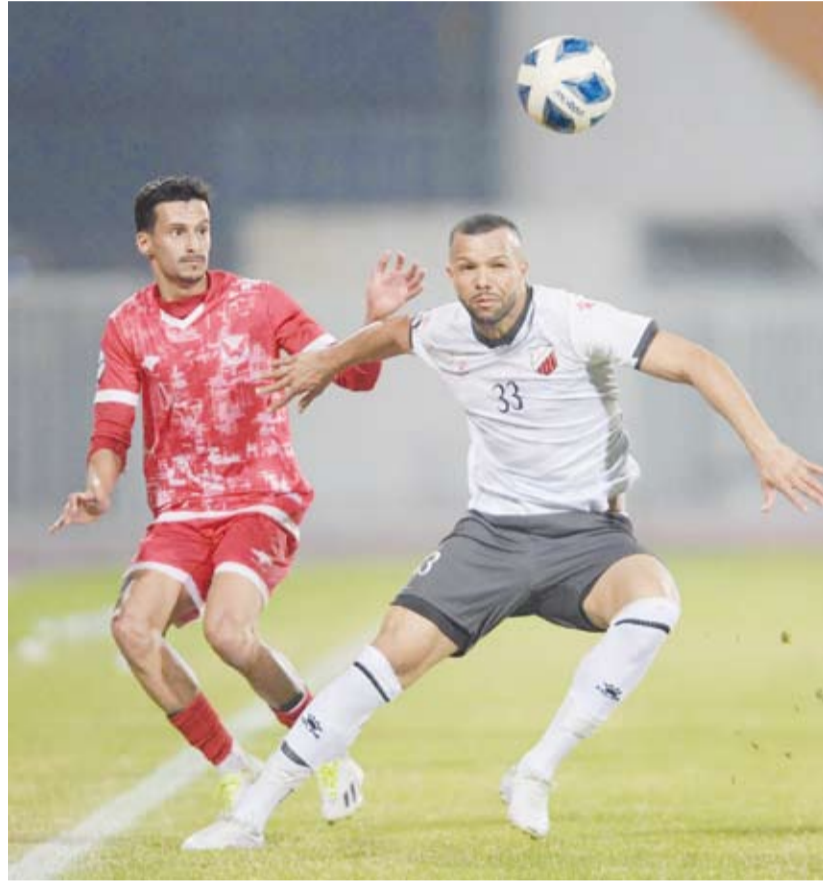
جانب من مواجهة سابقة للفريقين