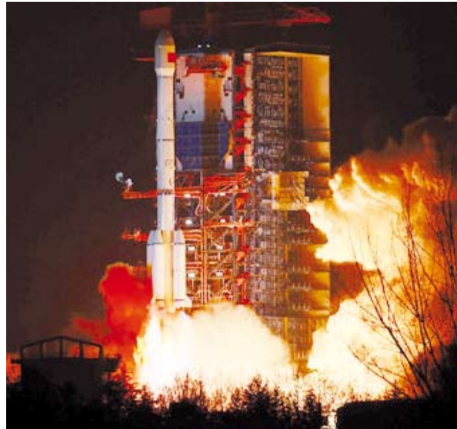
إطلاق القمر الصناعي

أطلقت الصين، أمس، بنجاح القمر الصناعي التجريبي «شيجيان-25» إلى الفضاء، على متن صاروخ من طراز «لونغ مارش-3 بي». وانطلق الصاروخ من مركز «شيتشانغ» لإطلاق الأقمار الصناعية في مقاطعة «سيتشوان» جنوب غربي الصين، وأرسل لاحقاً الحمولة إلى المدار المحدد. ويستخدم القمر الصناعي بشكل أساسي للتحقق من تقنيات تجديد وقود الأقمار الصناعية، وفقاً لأكاديمية «شانغهاي» لتكنولوجيا رحلات الفضاء، المطورة للقمر «شيجيان-25». وتمثل عملية الإطلاق اليوم المهمة رقم 555 لسلسلة الصواريخ الحاملة «لونغ مارش». جدير بالذكر أن المهمة رقم 554 من سلسلة صواريخ «لونغ مارش»، انطلقت في 20 ديسمبر الماضي، حاملة قمراً صناعياً تجريبياً لتكنولوجيا الاتصالات، من مركز «شيتشانغ» لإطلاق الأقمار الصناعية.