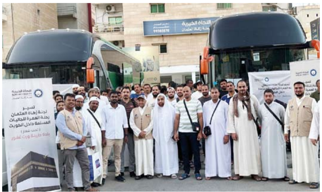
رحلات العمرة للرجال

له أضعافاً كثيرة والله يقبض ويبسط وإليه ترجعون، للتواصل والتبرع لزكاة العثمان الاتصال هاتفياً أو زيارة مقرهم بمنطقة حولي.