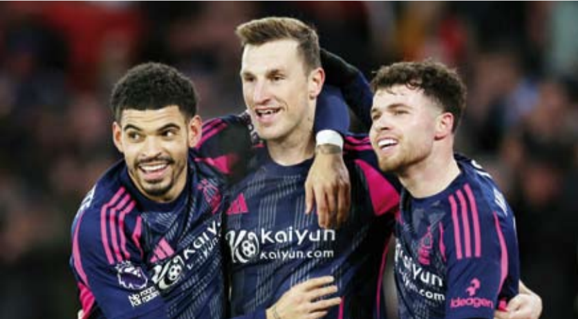
لاعبو نوتينجهام فورست يحتفلون بالفوز

وحقق نوتينجهام فورست فوزه الخامس على التوالي، ليرفع رصيده إلى 40 نقطة في المركز الثالث، بفارق الأهداف فقط خلف أرسنال صاحب المركز الثاني، ويفارق ست نقاط خلف ليفربول المتصدر. وفي المقابل، تجمد رصيده وولفرهامبتون عند 16 نقطة في المركز السابع عشر على جدول ترتيب المسابقة.