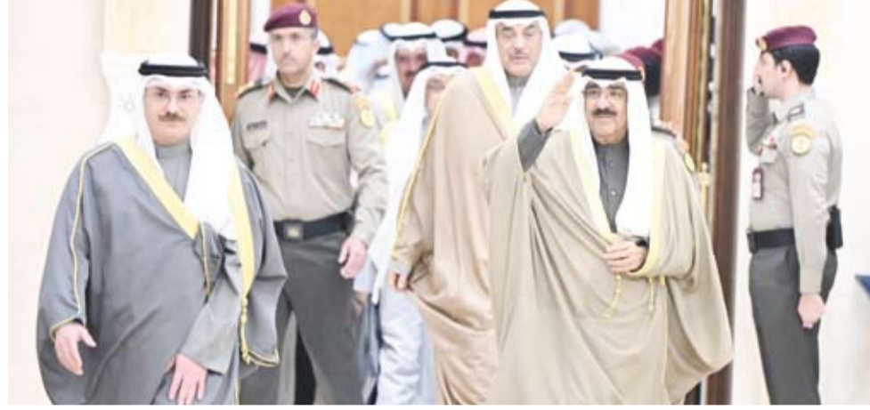
سمو الأمير يحيي الحضور

استقبل صاحب السمو أمير البلاد الشيخ مشعل الأحمد، بقصر بيان، صباح أمس، وبحضور سمو ولي العهد الشيخ صباح خالد وسمو الشيخ أحمد عبدالله رئيس مجلس الوزراء النائب الأول لرئيس مجلس الوزراء ووزير الدفاع ووزير الداخلية الشيخ فهد اليوسف، ووزير الإعلام والثقافة ووزير الدولة لشؤون الشباب رئيس اللجنة العليا المنظمة لبطولة كأس الخليج العربي لكرة القدم عبدالرحمن المطيري ورئيس الاتحاد الكويتي لكرة القدم نائب رئيس اللجنة العليا الشيخ أحمد اليوسف وأعضاء اللجنة العليا ورؤساء اللجان العاملة المنظمة لبطولة كأس الخليج العربي لكرة القدم دورة خليجي زين 26.