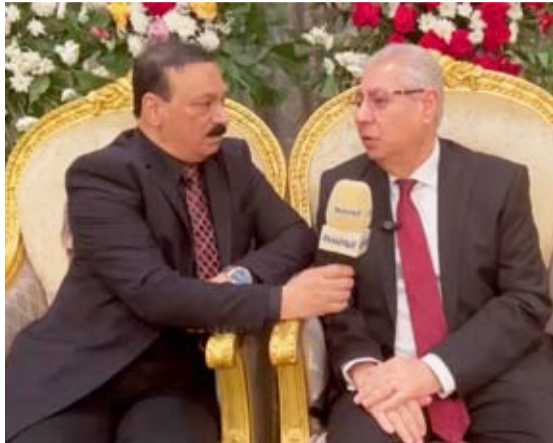
السفير المصري متحدثاً للوسط