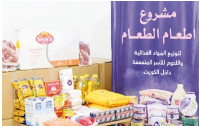
مشروع إبطام الطعام