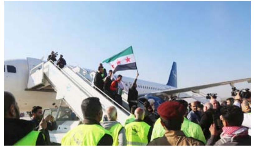
أول رحلة دولية تحط في مطار دمشق عقب التخلص من نظام الأسد