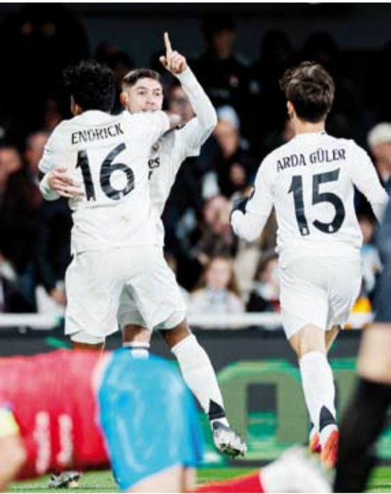
ريال مدريد اكتفى بخمسة أهداف في شباك ديبورتيفا مينيرا

حامل اللقب وريال بيتيس، وأوساسونا، وبرشلونة، وأتلتيكو مدريد، وختيافي، ورايو فايكانو، بالإضافة إلى