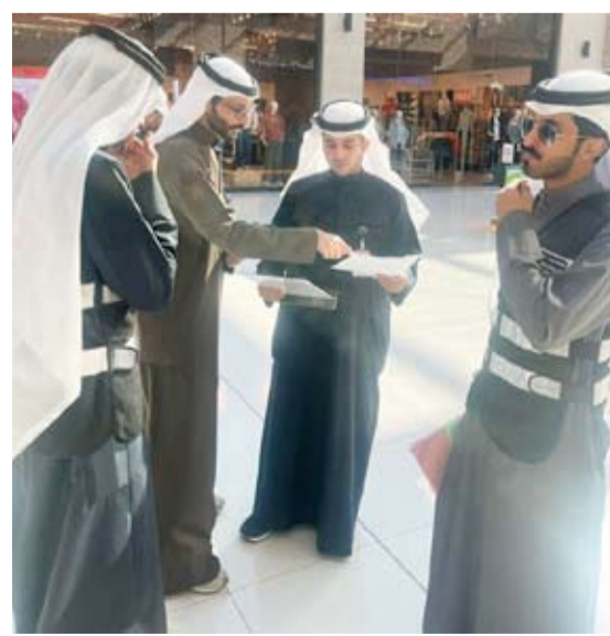
فريق البلدية يفحص التراخيص

اعلنت ادارة العلاقات العامة عن انطلاق اول حملة تفتيشية للفرق الرقابية في ادارات التدقيق ومتابعة خدمات البلدية للكشف على تراخيص المحلات والاعلانات واستمرارها طوال شهر يناير الجاري لاتخاذ كافة الاجراءات الرقابية بحق المخالفين والتأكد من مدى الالتزام باللوائح والنظم بهذا الخصوص.