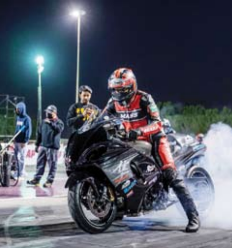
جانب من الاستعدادات

أعلن نادي قطر لسباق السيارات والدراجات النارية، اكتمال كافة الاستعدادات للبطولة العربية للدراج ريس المقرر انطلاقها اليوم الأربعاء عبر الجولة الأولى من البطولة التي تتكون من ست جولات وتنتصر حتى منتصف شهر فبراير المقبل.