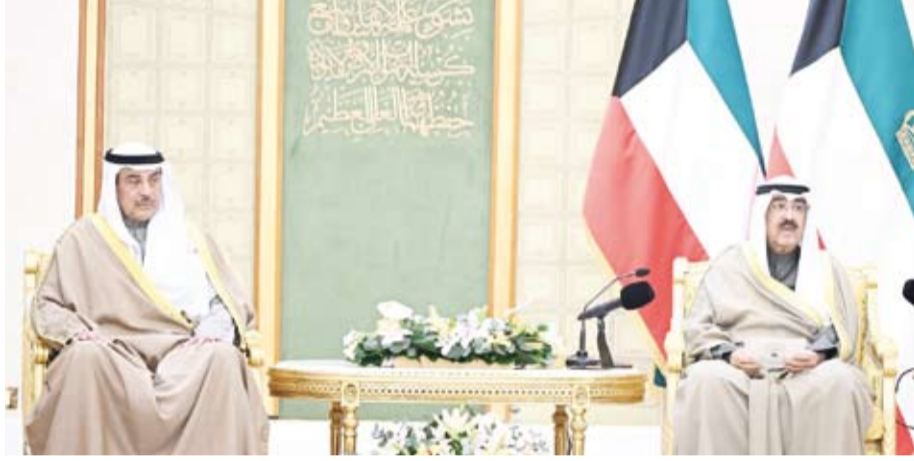
سمو الأمير يتحدث خلال اللقاء بحضور سمو ولي العهد