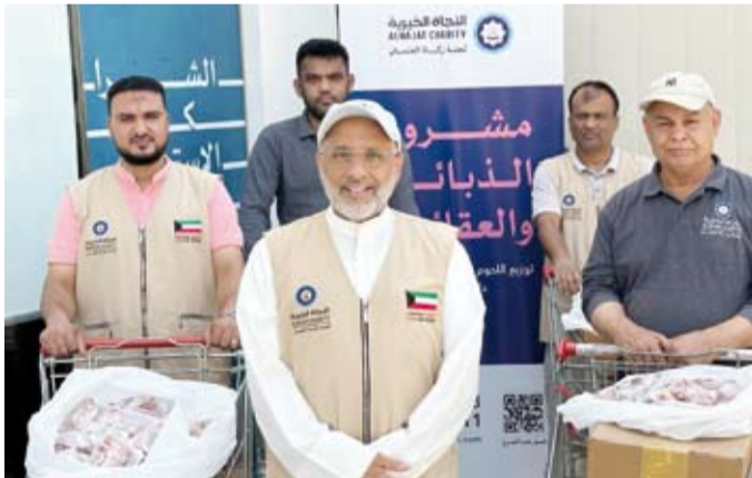
المطوع أثناء توزيع المساعدات