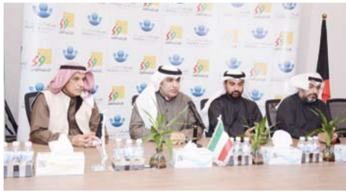
المندوبون خلال المؤتمر الصحفي

في الجامعات المعتمدة من وزارة التعليم العالي بدولة الكويت سواء داخل البلاد أو خارجها، داعياً الله عز وجل أن يكون هؤلاء الطلبة عوناً في تنمية الوطن وبناءه.