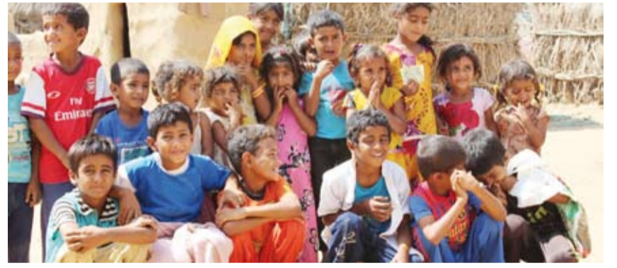
رعاية الأيتام في اليمن

وبيّن الشهاب أن النجاة الخيرية تكفل حالياً أكثر من 16 ألف يتيم في العديد من الدول والمجتمعات الفقيرة حول العالم، خاصة أيتام فلسطين وسوريا