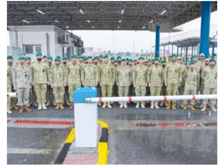
الفريق هاشم الرفاعي خلال الزيارة التفقدية

إلى أن الوثيقة التوجيهية للحرس الوطني 2025 (حماية وسند) تؤكد أهمية دور الحرس الوطني في تأمين المنشآت والمرافق الحيوية في البلاد. كما تفقد الفريق الرفاعي مديرية الخدمات الفنية بمعسكر التحرير للوقوف على سير العمل والتعرف على احتياجات الوحدات المختلفة.