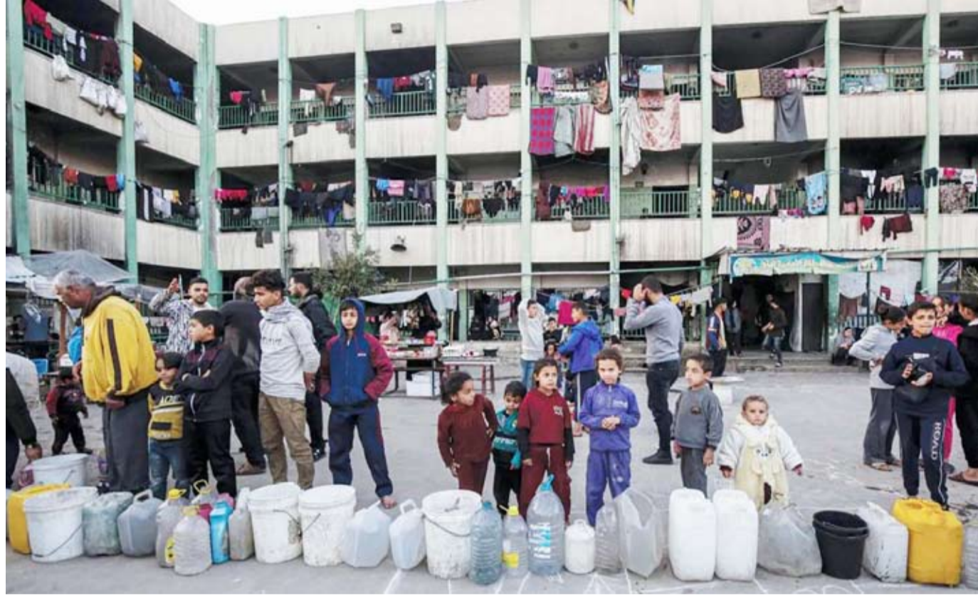
فلسطينيون بمخيم للنازحين في دير البلح

جدد الرئيس الأميركي المنتخب دونالد ترمب تهديداته لـ«حماس» بفتح أبواب «الجحيم» إذا لم تفرج عن الرهائن المحتجزين لديها. ويجري إبرام صفقة لوقف إطلاق النار مع إسرائيل قبل تسلمه السلطة في 20 من الشهر الحالي. وقال ترمب في مؤتمر صحافي بمنتجع مار لاغو بولاية فلوريدا: «إذا لم يطلقوا سراهم (الرهائن) بحلول الوقت الذي أتولى فيه منصبى فسوف يندلع الجحيم في الشرق الأوسط ولن يكون ذلك جيداً لـ(حماس) أو لأي شخص». ورفض ترمب الإفصاح عن ماهية الخطوات وشكل الجحيم الذي يهدده به. في غضون ذلك، صدق الجيش الإسرائيلي عملياته في الضفة الغربية، وقتل 3 فلسطينيين، بينما كان يواصل حملة مطاردة ضد متفذي هجوم قرب قلقيلية، وأدى إلى مقتل 3 إسرائيليين بينهم ضابط شرطة. وجاء هذا التصعيد بعد ساعات من إعلان رئيس الوزراء الإسرائيلي، بنيامين نتانياهو، المصادقة على زيادة العمليات الدفاعية والهجومية في الضفة الغربية، رداً على عملية قلقيلية.