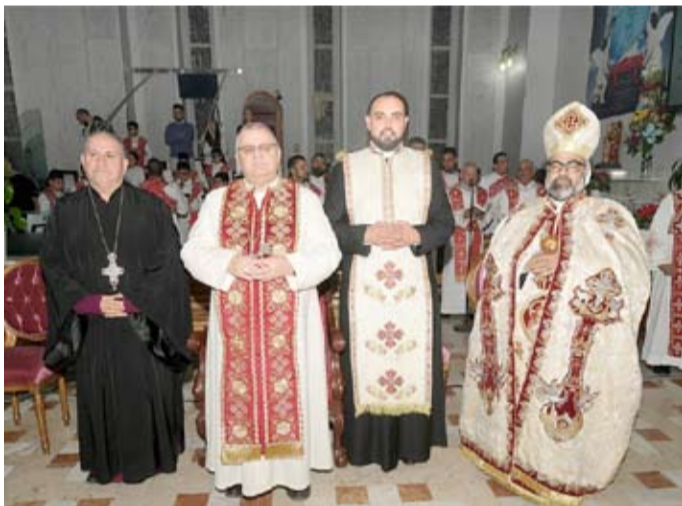
الآباء المشاركون في القداس

وسمو رئيس مجلس الوزراء الشيخ أحمد عبدالله، والوزراء والشعب الكويتي بالتبهاني بالعام الجديد وعيد الميلاد، داعياً الله أن يعيده عليهم بالصحة والعافية وعلى أرض الكويت الغالية بالخير.