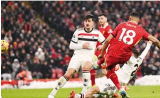
ليفربول يواصل صدارة الدوري الإنجليزي

قال والد الملياردير الأمريكي إيلون ماسك إن ابنه مهتم بشراء نادي ليفربول الإنجليزي لكرة القدم. وتمتلك نادي ليفربول مجموعة فينواي سبورتنس، التي لم تعلن عن رغبتها في بيع النادي ولكنها فتحت الباب أمام استثمارات خارجية في وقت سابق.