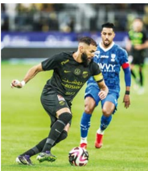
بنتيما أحرز هدف في اللقاء

تأهل فريقاً الاتحاد والقادسية إلى نصف نهائي كأس خادم الحرمين الشريفين، بعد فوزهما على كل من الهلال والتعاون على الترتيب، في ختام مباريات دور الثمانية للبطولة. ونجح الاتحاد في تجاوز عقبة الهلال بالفوز عليه بنتيجة (3 / 1) بركلات الترجيح، بعد انتهاء الوقتين الأصلي والإضافي بهدفين لكل منهما. أحرز الفرنسي كريم بنزيما هدف في الدقيقتين (63 و114)، فيما سجل هدفي الهلال كل من سالم الدوسري والبرازيلي ماركوس ليوناردو في الدقيقتين (71 و100)، قبل أن يتفوق الاتحاد في ركلات الترجيح. وتأهل القادسية لنصف النهائي، بعد فوزه على التعاون بثلاثة أهداف دون رد، وسجل الأهداف الثلاثة كل من إيميريك أوبامينج وكاميرون بويرتاس وجوليان كينونيس في الدقائق (34 و36 و49).