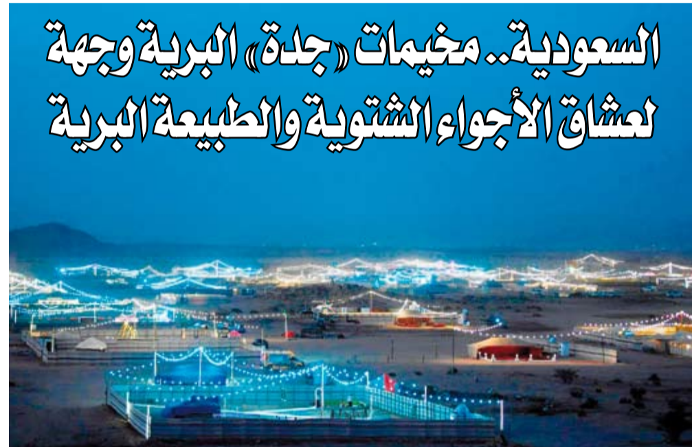
المخيمات البرية في جدة