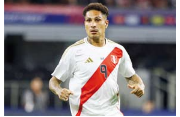
مهاجم منتخب البيرو باولو غيريرو

أعلن مهاجم منتخب البيرو باولو غيريرو، أفضل هداف في تاريخ بلاده اعتزاله كرة القدم الدولية بعد 20 عاماً مع المنتخب الأمريكي الجنوبي. وكانت المباراة التي خسرها منتخب بيرو بهدف ضد الأرجنتين في 19 نوفمبر الماضي ضمن تصفيات مونديال 2026، الأخيرة له مع بلاده بعد مشوار سجل خلاله 40 هدفاً في 125 مباراة. وخلال مسيرته الطويلة، حمل غيريرو (41 عاماً)، الذي استهل مشواره مع البيرو في أكتوبر 2004 ضد بوليفيا، ألوان بايرن ميونخ وهامبورغ الألمانيين وكورنثيانز البرازيلي من بين عدة أندية، وشارك مع منتخب البيرو ست مرات في كوبا أمريكا وفي كأس العالم 2018 في روسيا.