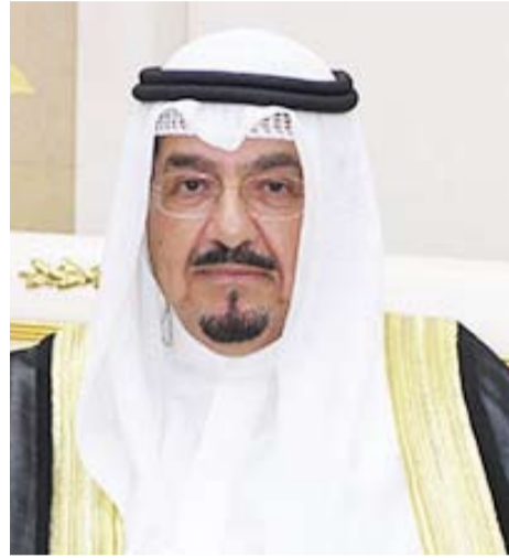
سمو الشيخ أحمد العبد الله