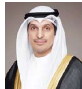
وزير الإعلام عبدالرحمن المطيري

أعلن وزير الإعلام والثقافة ووزير الدولة لشؤون الشباب رئيس المجلس الوطني للثقافة والفنون والآداب عبدالرحمن المطيري، نتائج جوائز الدولة التقديرية والتشجيعية للعام 2024 في مجالات الفنون والآداب والعلوم الاجتماعية والإنسانية. أكد الوزير المطيري في بيان صحفي، أول أمس، أن الجوائز تمثل اهتمام دولة الكويت بتكريم أبنائها المبدعين في مختلف المجالات تقديرًا لمساهماتهم المتميزين ودورهم الريادي في رفع اسم الكويت عالياً، متمنياً أن يكونوا نموذجاً يحتذى به للأجيال القادمة.