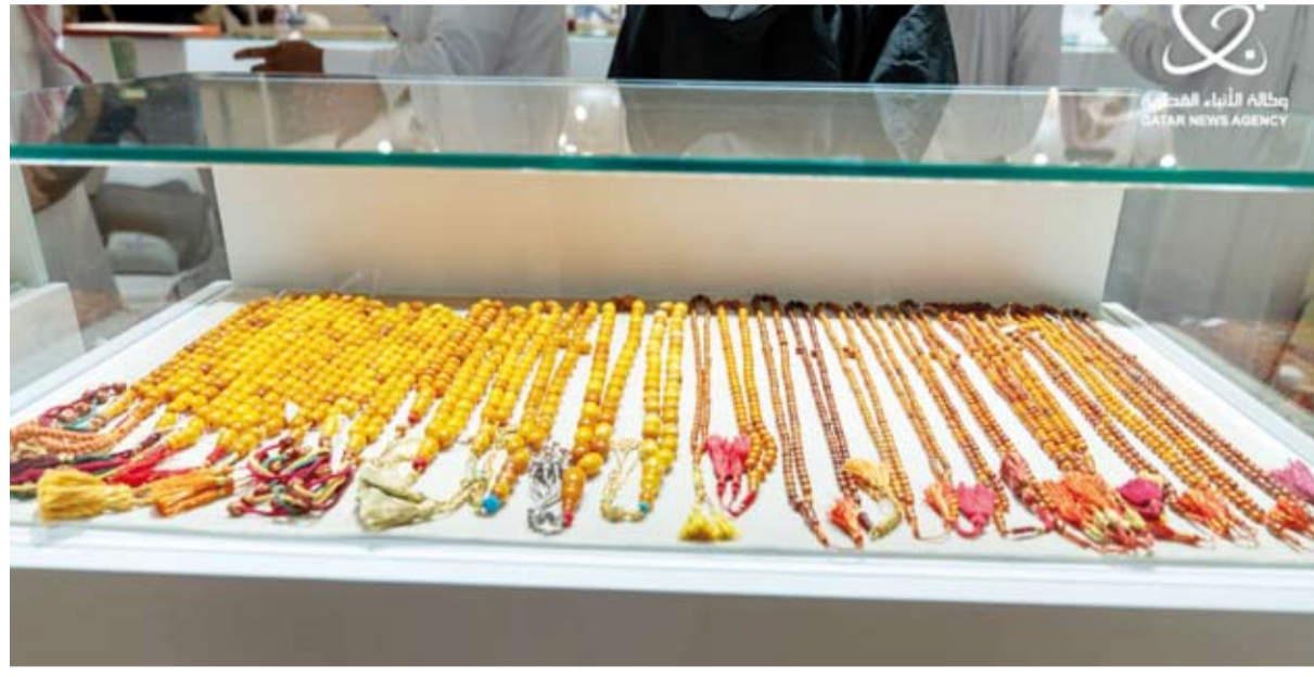
المعرض الأضخم من نوعه في قطر والمنطقة

افتتحت المؤسسة العامة للحرف الثقافية "كتارا"، أول أمس، النسخة الخامسة لمعرض كتارا الدولي للكهرمان، الذي تنظمه كتارا بمشاركة 14 دولة من مختلف دول العالم من خلال 77 جناحاً.