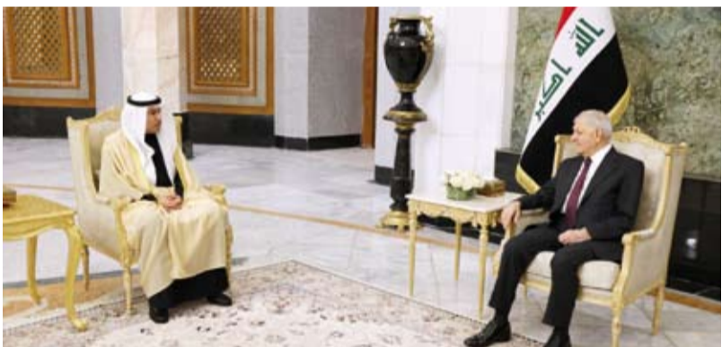
الرئيس العراقي لدى استقباله سفير الكويت

التي تربط العراق بدولة الكويت لما تشهده من تطور مستمر على مختلف المستويات متمنيا للسفير الجديد التوفيق والنجاح في مهامه الدبلوماسية. كما أكد الرئيس العراقي حرص بلاده على إقامة علاقات متوازنة وبناء جسور التعاون مع مختلف دول العالم وسعيه الدائم من أجل ترسيخ الأمن والاستقرار والسلام في المنطقة. وكان وزير الخارجية العراقي فؤاد حسين قد استقبل السفير الكويتي الجديد وأعرب عن عمق الروابط التاريخية والاجتماعية التي تجمع العراق والكويت، مشدداً على أهمية العمل المشترك لتطوير التعاون الثنائي بما يخدم المصالح المشتركة.