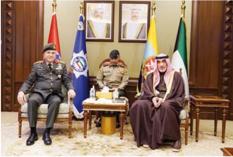
الشيخ فهد اليوسف خلال لقائه الفريق أول ماتين غوراك

المتميّزة التي تجمع دولة الكويت وجمهورية تركيا الصديقة وسبل تعزيز التعاون المشترك في مختلف المجالات ولا سيما في المجال العسكري. وتم خلال اللقاء الذي حضره نائب رئيس الأركان العامة للجيش الكويتي اللواء الركن طيار صباح جابر الأحمد الصباح وسفير الجمهورية التركية لدى البلاد طويبي سونمز وعدد من كبار الضباط القادة من كلا الجانبين مناقشة آخر المستجدات الإقليمية والدولية ذات الصلة بالجبال الدفاعي والأمني.