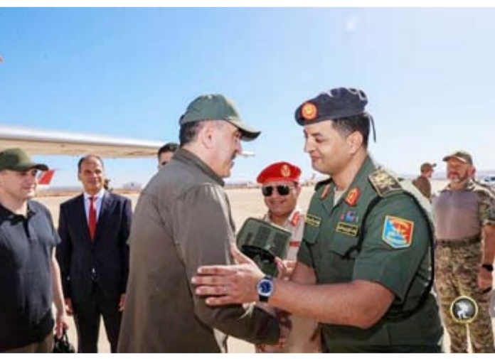
وصول نائب وزير الدفاع الروسي لمطار بيننا

السويسري «All Eyes On Wagner» نقل رادارات وأنظمة دفاع جوي روسية، من بينها إس-300»-«إس-400» من سوريا إلى ليبيا، مستندة في ذلك إلى مسؤولين ليبيين وأميركيين. وفي هذا الإطار، يؤكد حرشاوي أنه من سقوط الأسد في الثامن من ديسمبر الماضي، «تم نقل كمية كبيرة من الموارد العسكرية الروسية إلى ليبيا من بيلاروسيا وروسيا».