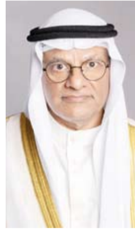
د. نادر الجلال

أحال وزير التعليم العالي والبحث العلمي، الدكتور نادر الجلال، أمس، 13 ملفاً إلى النيابة العامة لتقديمهم مستندات مخالفة للحقيقة أو قيامهم بتقديم شهادات علمية مزورة للحصول على معادلة الشهادات. وقال الوزير الجلال في تصريح صحفي: إن ذلك يأتي في إطار التزام الوزارة بحماية النظام التعليمي في دولة الكويت وضمان مصداقية الشهادات العلمية المقدمة من المؤسسات التعليمية الدولية، مضميناً أنه تم اعتماد توصيات قطاع الشؤون القانونية واتخاذ الإجراءات