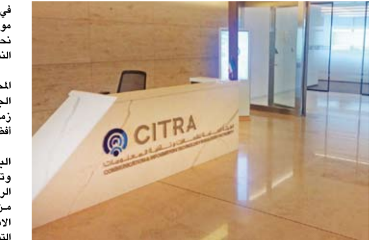
المرتبطة بصيانة الكابلات البحرية التي تؤثر على استمرارية الخدمة كما يوفر حلاً مرناً وآمناً لنقل البيانات دون انقطاع مما يعزز موثوقية البنية التحتية

أعلنت الهيئة العامة للاتصالات وتقنية المعلومات، عن إطلاق البوابة الدولية الجديدة للربط والعبور الدولي للكويت (مسار العراق) وذلك بالشراكة مع شركة (كيمز زاجل) للاتصالات. وقالت الهيئة في بيان لـ (كونا) أمس: إن (مسار العراق) يوفر بديلاً برياً متكاملًا للمسارات البحرية التقليدية ويتميز بزمن تأخير منخفض إذ تبلغ سرعة الاستجابة من الكويت إلى مدينة فرانكفورت الألمانية 78 مللي /ثانية ذهاباً وإياباً. وأضافت أن سعة الكابل تدعم ما يصل إلى 100 غيغابت في الثانية مما يجعله خياراً مثيراً للشركات الكبرى ومزودي الخدمات الدوليين إذ يتيح توجيه حركة البيانات من الكويت إلى أوروبا مروراً بالعراق بشكل آمن وفعال. وذكرت أن هذا المسار الجديد يمثل بديلاً للمسارات البحرية التي تمر عبر البحر الأحمر حيث يتفادى التحديات