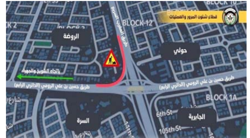
جانب من عمليات التفيش وإغلاق طريق المغرب السريع

إغلاق المخرج الفرعي، جهة منطقة الروضة، من شارع المغرب للقدام من المدينة باتجاه الأحدي المؤدي إلى الدائري الرابع باتجاه الجبراء، وذلك خلال الفترة من اليوم الخميس 9 يناير وحتى الجمعة 17 يناير.