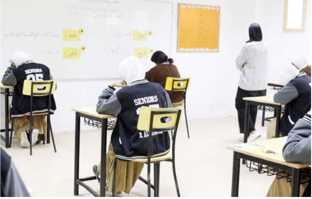
جانب من اختبارات الطلبة

أكدت وزارة التربية عدم صدور أية نشرات أو تعميمات أو توجيهات تتعلق بوقف إجازات الموظفين والموظفات المسحوبة جنسياتهم. وأوضحت الوزارة في بيان رسمي، أنها اتخذت إجراءات قانونية تجاه بعض مديري المدارس الذين قاموا بتصرفات فريدة مخالفة للوائح المنظمة للعمل، حيث أصدرت بعض المدارس نشرات داخلية دون أي تعميم رسمي صادر من الجهات المختصة، سواء من القطاع المعني أو المنطقة التعليمية، مبيّنة أن هذه التعميمات عارية من السند القانوني. وشددت وزارة التربية على التزامها الكامل بتوجيهات وتعليمات القيادة السياسية لضمان سير العمل بشكل منظم، وحفاظاً على مصلحة الجميع وضمان تطبيق القانون بشكل عادل. من جهة أخرى، وأصل طلاب وطالبات الصف الثاني عشر أداء اختباراتهم بهدوء وانتظام. في اليوم الثالث من اختبارات نهاية الفصل الدراسي الأول للعام 2024/2025، حيث أدى طلبة القسم العلمي اختبار مادة الأحياء، بينما أدى القسمين العلمي والأدبي كانت في