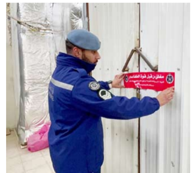
جانب من عمليات التفيش والإغلاق

نفذت قوة الإطفاء العام صباح أمس الأول حملة تفنيدية في منطقة صباح، وتهدف الحملة إلى رصد المباني والمنشآت المخالفة لاشتراطات السلامة والوقاية من الحريق. وقد أسفرت الحملة عن مخالفة وإغلاق إداري لعدد من المنشآت، وذلك بسبب عدم استيفائها للاشتراطات اللازمة، وعدم استخراج رخص الإطفاء، بالإضافة إلى تخزين مواد سريعة الاشتعال.