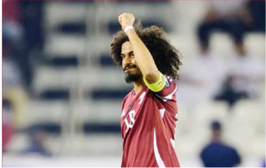
أكرم عفيف نجم العنابي القطري

مع ناديه السابق ليغريول الإنجليزي الذي سبق له التتويج معه بدوري أبطال أوروبا. ويستعد صلاح الذي غادر رسمياً صفوف نادي ليفربول بنهاية الموسم المقبل، لتدوين مشاركته الثانية في نهائيات المونديال بعد ظهوره الأول في روسيا 2018، حيث يبدو الطموح كبيراً في المساهمة بوصول منتخب مصر للأدوار الإقصائية لأول مرة. ويبرز قائد المنتخب السعودي سالم الدوسري، كواحد من الأسماء العربية اللمعة التي ينتظر أن تتوهج بشكل لافت في نهائيات المونديال القادم، بعدما واصل اللاعب حضوره المميز مع ناديه الهلال من جهة، إلى جانب إسهاماته الدائمة مع منتخب بلاده في مختلف البطولات.