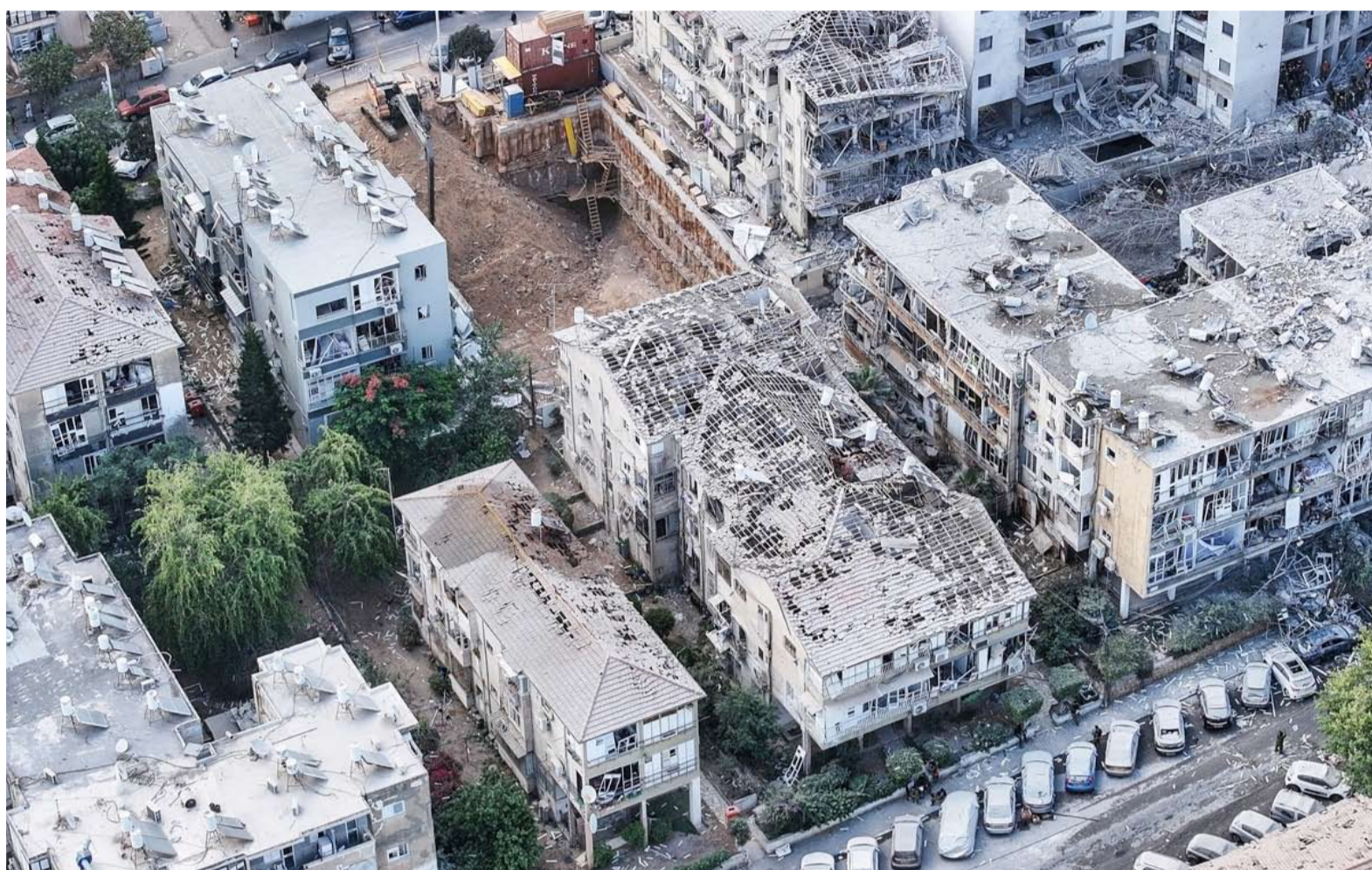
مبان متضررة في «بات يام» جنوب تل أبيب

جاء الهجوم الإسرائيلي في أعقاب ضربات صاروخية إيرانية على إسرائيل، وهي أولى الضربات من نوعها منذ شهرين، رداً على الهجمات الإسرائيلية على ضواحي العاصمة اللبنانية بيروت.