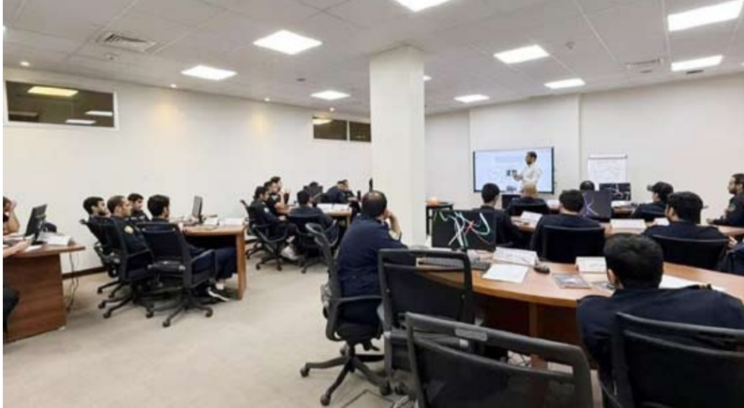
جانب من المباحثات

مشروعات التعاون التنموي مع الكويت، مؤكداً تطوع الجانب الصيني إلى تعزيز المشاريع القائمة والدفع نحو تنفيذ المزيد من المشاريع المشتركة التي تعكس متانة العلاقات الثنائية بين البلدين الصديقين، وتخدم المصالح المشتركة على المدى الطويل.