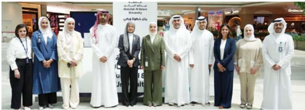
لقطة جماعية للقاءتين على الحملة

المطروحة وآليات القبول والالتحاق فضلا عن الاطلاع على مسيرة الجامعة البحثية والأكاديمية. ودعت الأحمد طلاب وطالبات الصف الـ 12 المقبلين على الدراسة الجامعية لزيارة جناح الجامعة خلال الفترة المعلنة وعدم التردد بطرح استفساراتهم وتساؤلاتهم حول البرامج الأكاديمية.