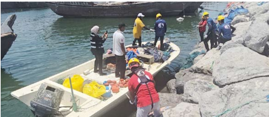
فريق الغوص الكويتي ينظف نقعة الفحيجيل