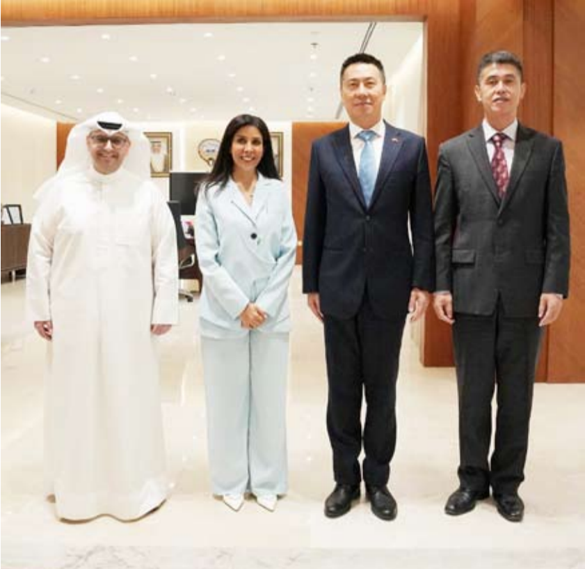
المشعان والسفير الصيني ووكيل الأشغال