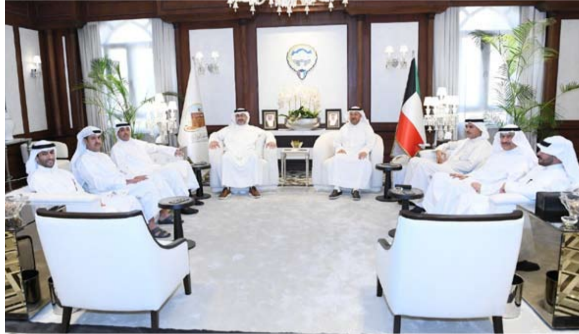
جانب من اجتماع المحافظين في محافظة الفروانية

الإدارة المحلية والتنمية المستدامة بما يواكب التحديات والمتغيرات التي تشهدها المدن العربية. وأكد الشيخ عذبي الناصر، أهمية تعزيز أو أصر التعاون والتنسيق بين المحافظات والجهات المعنية بما يسهم في تبادل الخبرات والاستفادة من التجارب الناجحة. وأشار إلى تأكيد المحافظين -خلال الاجتماع- حرصهم على تعزيز التعاون واستمرار اللقاءات التنسيقية بما يعزز العمل العربي المشترك ويخدم أهداف التنمية والتطوير في مختلف المدن والمحافظات العربية بالشكل الذي يلبق بسعة ومكانة دولة الكويت. كما أشادوا بالدور الريادي الذي تقوم به منظمة المدن العربية في خدمة العمل التنموي العربي المشترك مؤكداً أهمية تعزيز أوجه التعاون مع المنظمة والاستفادة من برامجها ومبادراتها التوعوية بما يسهم في دعم جهود التنمية المحلية وتبادل الخبرات والمعارف بين المدن والمحافظات العربية. حضر اللقاء من جانب منظمة المدن العربية مستشار الأمين العام شماري المباركي ورئيس قطاع الشؤون الخارجية والشركات عبدالله الرشيد.