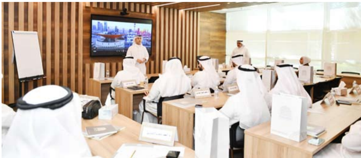
جانب من البرنامج التدريبي

معتمة تؤهلهم لممارسة العمل التحكيمي بكفاءة واقتدار. كما تنبج الحاجة إلى تطبيق اليات الوسائل البديلة لحل المنازعات من أهمية حسم الخلافات التجارية بسرعة وعدالة ناجزة، وتوفير الجهد والوقت للذات يعدان العاملين الأكثر أهمية في دورة رأس المال، ولحماية التعاملات التجارية المحلية أو الوطنية والاستثمارات التجارية وإزالة العقبات التي يضعها قانون كل دولة في وجه تدفق الاستثمارات والحركة التجارية عموماً.