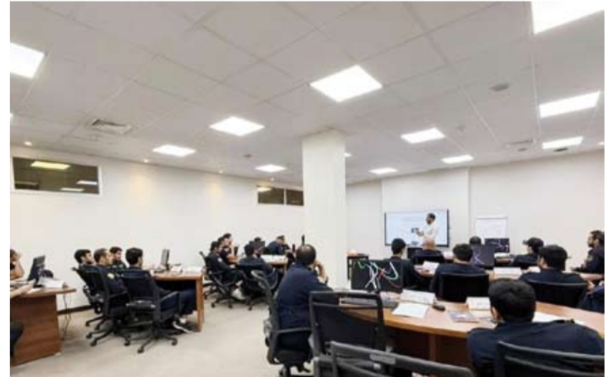
جانب من أحد البرامج التدريبية

في إطار جهود الإدارة العامة للجمارك الرامية إلى تطوير الكفاءات البشرية ورفع مستوى الجاهزية الميدانية، تواصل الجمارك تنفيذ برامج تدريبية متخصصة تستهدف المفتشين الجمركيين في مجالات النظم الأمنية وتقنيات المسح الإشعاعي، إلى جانب تنمية مهارات تحليل الصورة ورفع كفاءة التعامل مع الأجهزة الأمنية المساندة للتفتيش الجمركي. ويأتي هذا البرنامج ضمن خطة الإدارة لتطبيق أحدث التقنيات والأساليب الحديثة في التعليمات والإجراءات الجمركية، بما يسهم في تعزيز قدرات المفتشين على اكتشاف