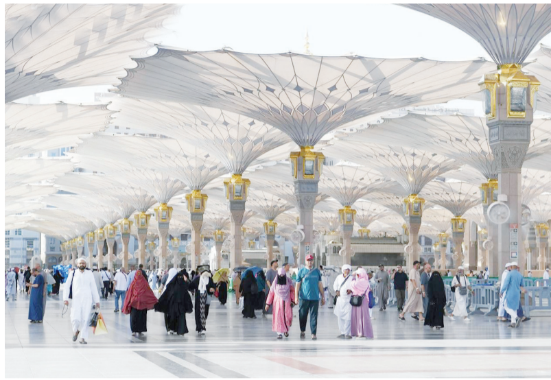
انسيابية تنقل الزائرين ساحات في المسجد النبوي