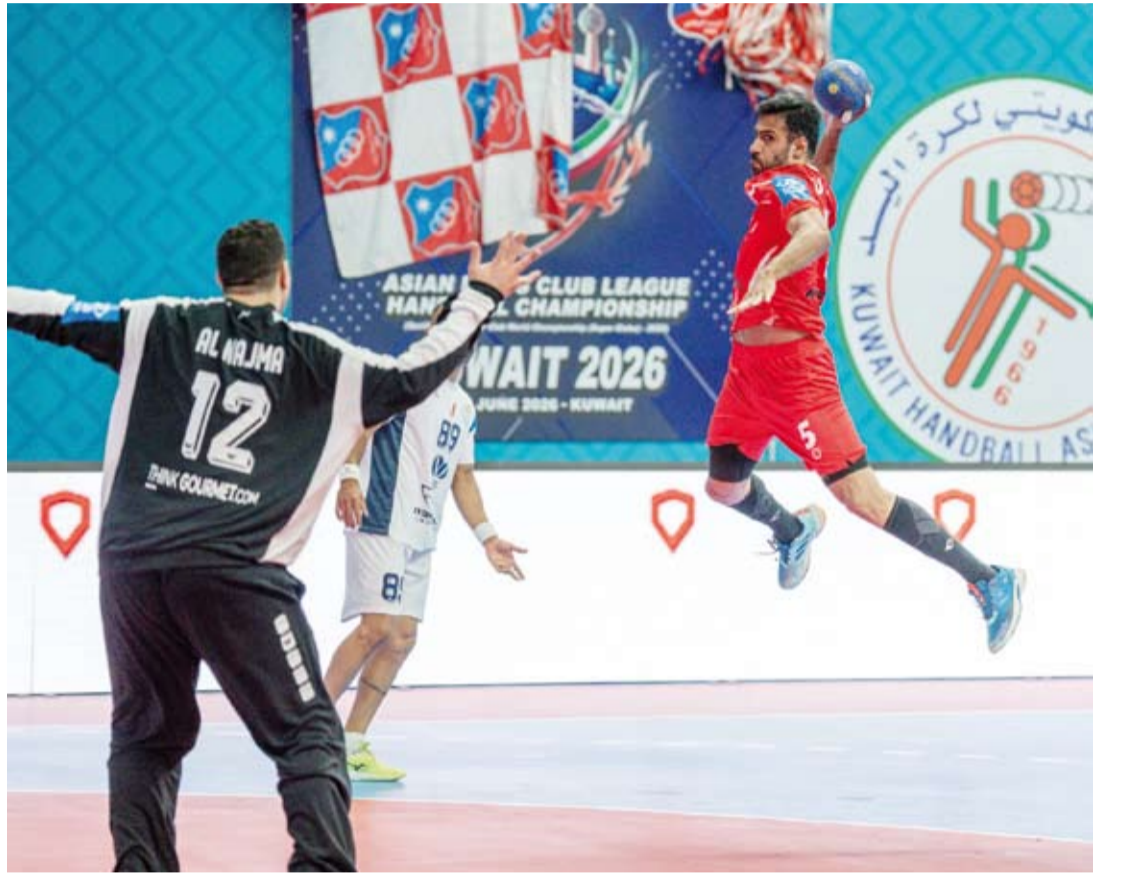
الأبيض الكويتي في صدارة البطولة

وتحصل فرق البطولة الآسيوية للنادية على راحة اليوم الثلاثاء طبقاً للجدول على أن تستأنف المباريات غداً بإقامة ثلاث مباريات حيث يلتقي برقان مع الخليج السعودي والكويت مع الدحيل القطري والشارقة الإماراتي مع النجمة البحريني.