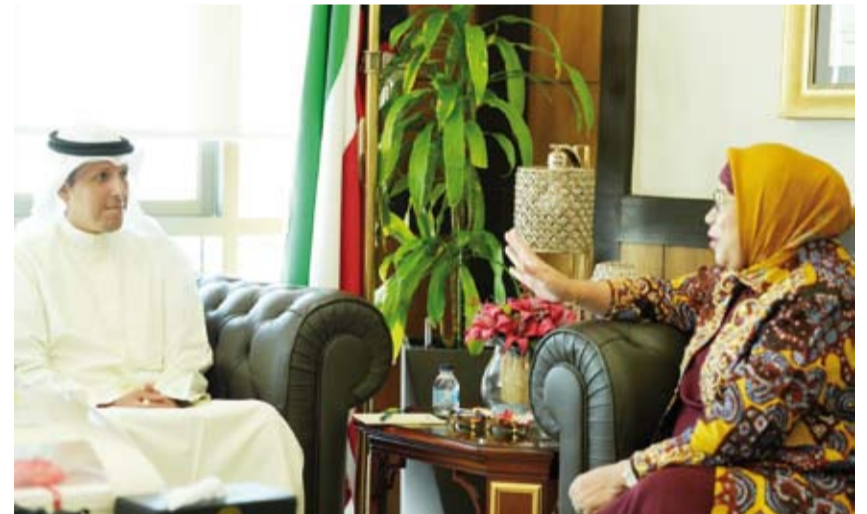
د. محمد الوسمي خلال لقائه سفيرة إندونيسيا لينا ماريانا

بحث وزير الأوقاف والشؤون الإسلامية الدكتور محمد الوسمي، مع سفيرة جمهورية إندونيسيا لدى دولة الكويت لينا ماريانا، أمس، سبل تعزيز التعاون في المجالات ذات الاهتمام المشترك بما يخدم مصالح البلدين الصديقين.