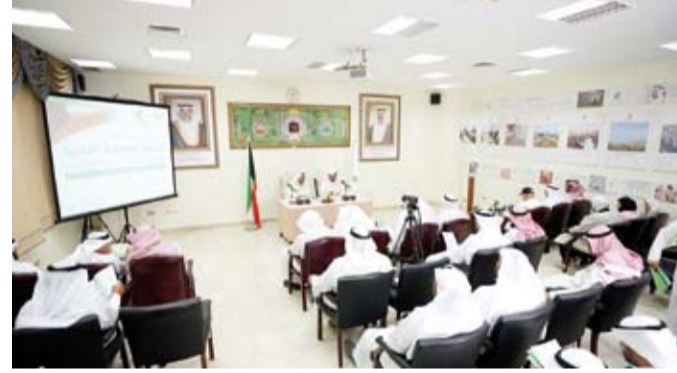
جانب من الجمعية العمومية لجمعية السلام