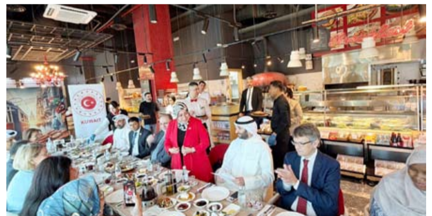
الحضور على الفطور

تنظمت سفارة جمهورية تركيا في الكويت فعالية إفطار في مطعم نملي غورميه في 7 يونيو بمناسبة اليوم العالمي للإفطار. وهدفت الفعالية إلى التعريف بثقافة الإفطار التركي وإتاحة الفرصة لتذوقها، وحضرها سفراء معتمدون لدى الكويت، وأعضاء من مجتمع الأعمال، وممثلون عن منظمات دولية، وأعضاء بارزون من السلك الدبلوماسي.