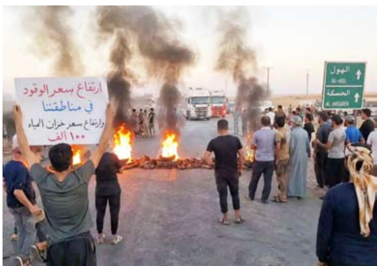
تجمع للاهالي على طريق الهول - الحسكة

المحدود أساساً، حيث إن أي قرار سيؤثر مباشرة على الوضع المعيشي للسكان». وأوضح الباحث أنه لا يوجد ما يشير إلى أن جميع سكان المنطقة الشرقية ينظرون إلى تسريع الاندماج بوصفه «حلاً تلقائياً» للأوضاع المعيشية ومشاكل التنمية، مستدرراً أنه «ربما تنظر بعض الشرائح بحدن من أن يؤدي مسار الاندماج إلى تطبيق سياسات اقتصادية لا تراعي خصوصية المنطقة».