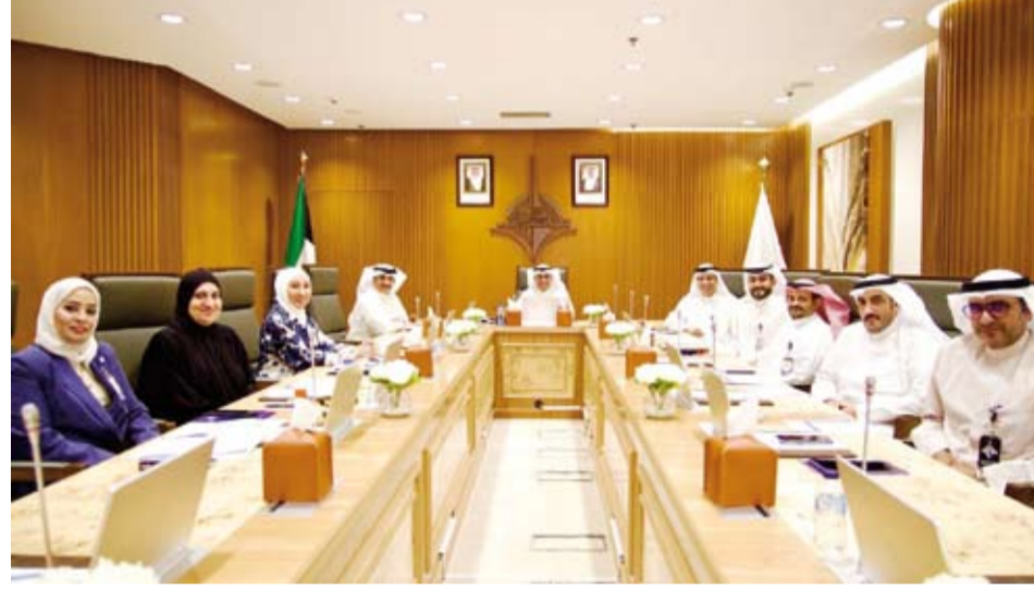
اجتماع اللجنة العليا لمسابقة المهارات الخليجية