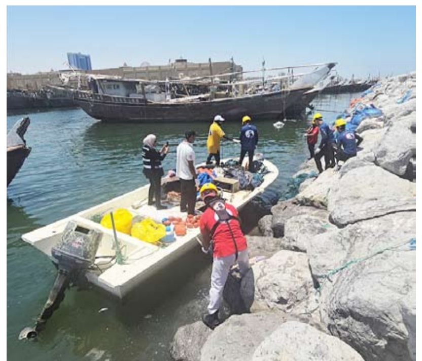
حملات ميدانية لحماية السواحل