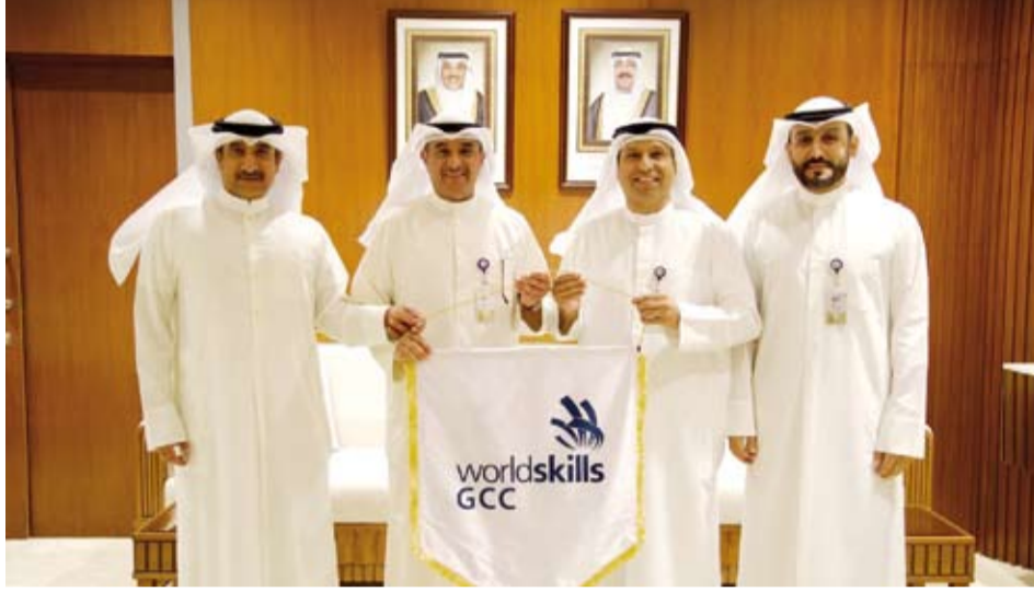
تسليم راية مسابقة المهارات الخليجية إلى الهيئة العامة للتعليم التطبيقي والتدريب