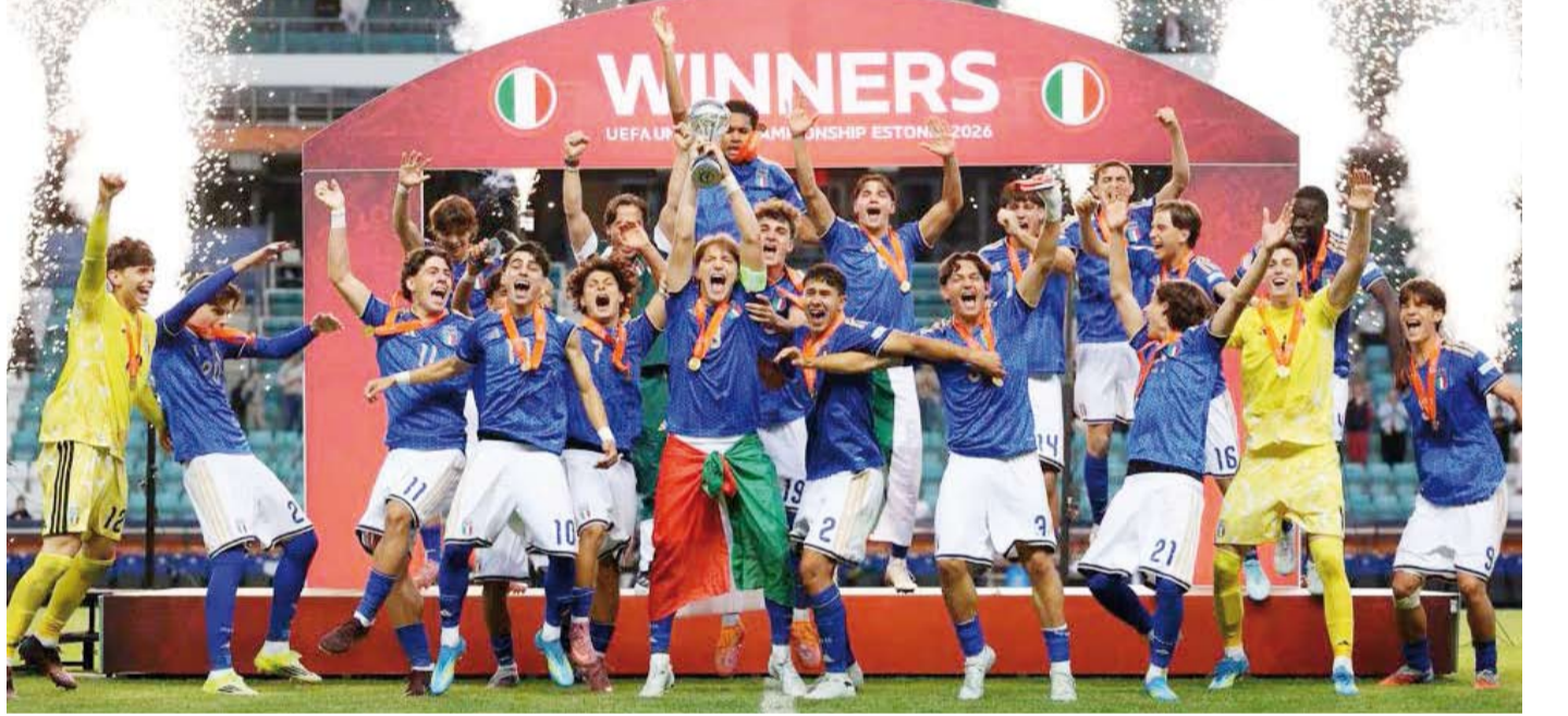
الطليان على منصة التتويج

(1986، و1993، و1998، و2013، و2018، و2019). في المقابل، أخفق المنتخب البلجيكي في حصد اللقب الأول في تاريخه بالمسابقة الأوروبية خلال خوضه لأول مباراة نهائية.