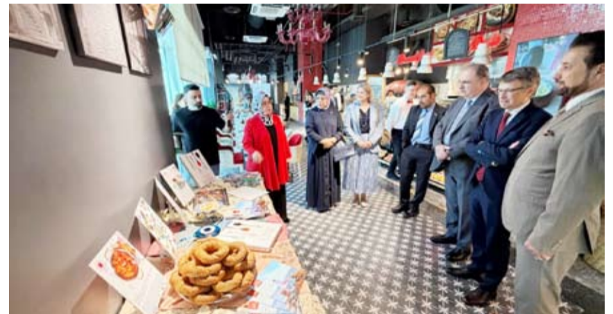
السفيرة التركية تشرح للحضور