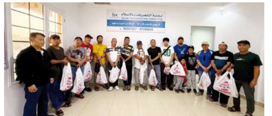
توزيع الأضاحي على المهتدين

والمثقف والوفرة والرقي والسامية والروضة، بما يضمن وصول الأضاحي إلى أكبر