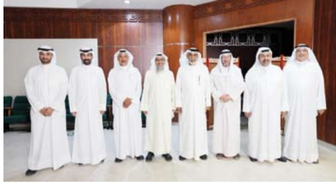
لقطة جماعية لأعضاء مجلس الإدارة الجديد