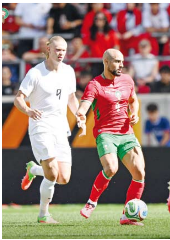
المغرب اطمأن على أداء لاعبيه قبل المونديال

تعادل المنتخب المغربي مع نظيره النرويجي بهدف لخطه الأول في ختام تحضيراته لخوض بطولة كأس العالم 2026 المقررة في الولايات المتحدة وكندا والمكسيك في الحادي عشر من يونيو الجاري إلى التاسع عشر من يوليو المقبل.