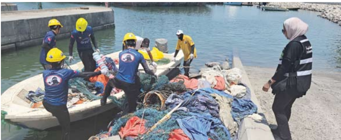
جانب من مخلفات الصيد والشباك المهملات التي رفعها فريق الغوص الكويتي

وأضاف الفاضل أن غواصي الفريق أنجزوا مهمة دقيقة في مرافق الفحيجيل أسفرت عن رفع وإزالة شبكات صيد عالق ومخلفات بلاستيكية ضخمة وأخشاب وحبال كبيرة مهملات كانت