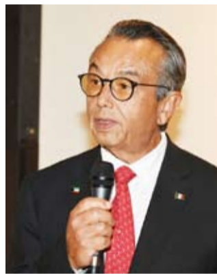
السفير بينيا هالر متحدتاً

فيها. يهدف هذا المعرض الفوتوغرافي إلى إظهار كيف كانت تمارس أقدم رياضة بالكرة في تاريخ البشرية في المكسيك ما قبل الحقبة الإسبانية: لعبة الكرة في أمريكا الوسطى، التي كانت تلعب في وسط وجنوب شرق المكسيك وأمريكا الوسطى. ويعود أصل هذه اللعبة إلى عام 1650 قبل الميلاد، أي قبل 3600 عام، وقد مارسها حضارات قديمة مثل الأولك والمايا والأزتيك.