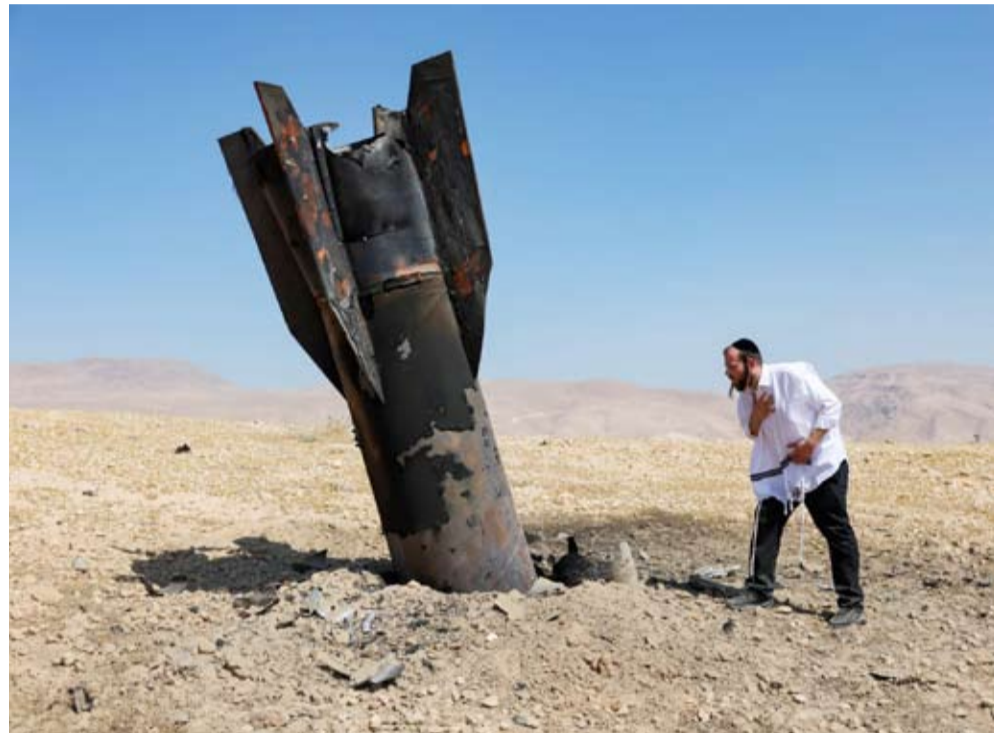
مطرفون صهيانية أمام بقايا صاروخ إيراني في الضفة الغربية

وبالأمس ترددت بعض الأنباء عن اتخاذ الحرس الثوري قرار مهاجمة الكيان المحتل دون الرجوع إلى الرئيس بزشكيان، وهو ما يؤشر إلى تحكمه فعلياً في مفاصل السلطة، بدعم مباشر من المرشد الأعلى. أياً كان الوضع في إيران أو الكيان المحتل، فالثابت أن كلا الطرفين له مشروعه التوسعي ولن يتنازل عنه.