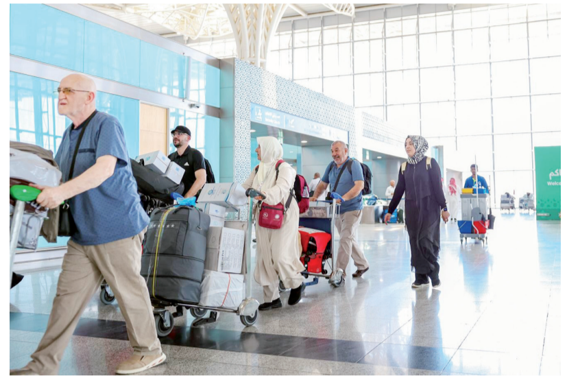
الحجاج يجادرون المدينة المنورة

التي تسهم في إضراء تجربة الزائر، وتعزيز مستوى الراحة والطمأنينة، بما يعكس ما توليه الحكومة الرشيدة من عناية واهتمام بالحجاج والمعتمرين في جميع مراحل رحلتهم الإيمانية. ويحرص الحجاج والمعتمرين على زيارة مسجد قباء، ومسجد القبلتين خلال فترة إقامتهم في المدينة المنورة، وترافقهم جهود تنظيمية تبذلها هيئة تطوير المدينة المنورة، لتهيئة بيئة آمنة وصحية للمصلين، ليؤدوا الصلاة في راحة وأمان. ويتزامن مع وصول طلائع المعتمرين إلى المدينة المنورة تنفيذ برامج توعوية وخدمات