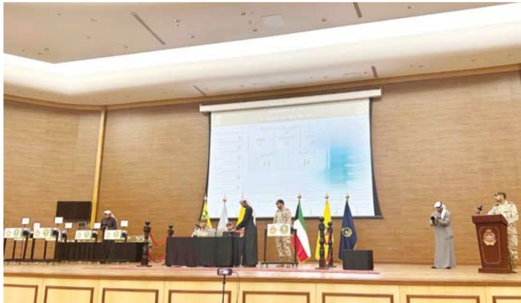
جانب من القرعة

أعلنت رئاسة الأركان العامة للجيش الكويتي أمس انطلاقاً مراسم القرعة العلنية لاختيار الطلبة الضباط حملة الشهادات الجامعية الدفعة الـ24 بحضور وزير الدفاع الشيخ عبدالله علي عبدالله الصباح. وقالت (الأركان) في بيان صحفي إن القرعة العلنية التي بدأت قبل قليل في مبنى متعدد الأغراض بمعسكرات المباركية بمشاركة 459 مقترعا من مختلف التخصصات الجامعية ستستفر عن اختيار 150 مرشحاً أساسياً و30 احتياطياً موزعين على 20 تخصصاً للاندماج إلى شرف الخدمة العسكرية. وأفادت بأنها تقوم حالياً ببيت مجربات القرعة مباشرة عبر الرابطين ( https://bit.ly/3ExqAh6 - https://bit.ly/3ExqAh6 ).