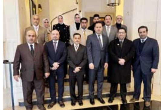
المشاركون في ورشة العمل

وأضاف أن أعضاء الوفد استمعوا كذلك إلى عروض تعريفية حول التجربة الفرنسية في الإدارة العامة وأساليب إعداد