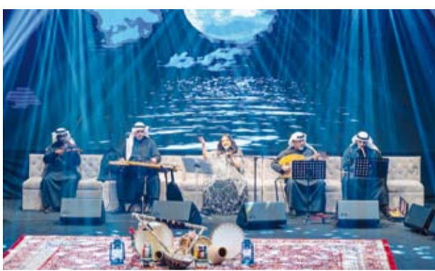
الفنانة سماح خالد

كما قدم الفنان سلطان المفتاح: صوت بالليل دانة - فدوة لج - ناعم العود - فن الحقوق - يا هل السامر - أبو عيون فتاة.