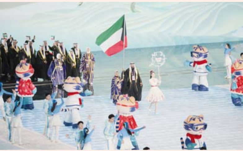
وفد الكويت المشارك في حفل الافتتاح