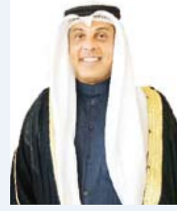
السفير حمد الهزيم

أعلن سفير دولة الكويت لدى البرتغال حمد الهزيم، أمس، أن وفداً من رجال الأعمال وأصحاب الشركات البرتغاليين سيترورون الكويت في الفترة من 18 إلى 21 فبراير الحالي بهدف تعزيز التقارب الاقتصادي والاستثماري والتجاري بين البلدين. وقال السفير الهزيم في تصريح لـ (كويتا): إن السفارة الكويتية في لشبونة نظمت الزيارة بالتعاون مع (الغرفة التجارية العربية - البرتغالية) و(اتحاد الصناعات البرتغالية) و(غرفة تجارة وصناعة الكويت). وذكر أن ذلك يأتي في إطار الرغبة المتبادلة في تنشيط العلاقات الاقتصادية والتجارية بين البلدين ووجود السفارة لإيجاد قنوات اتصال جديدة وفتح آفاق أوسع للتعاون بين البلدين إلى جانب التعريف بالمشاريع التنموية الكبيرة التي تشهدها دولة الكويت وإنجازاتها في مختلف المجالات. وأشار السفير الهزيم إلى أن المبادرة تنطلق من صلب عمل البعثة الدبلوماسية الكويتية مبيناً أن وزارة الخارجية الكويتية تدعم مثل هذه المبادرات التي تساهم بشكل فاعل في رفع العلاقات الثنائية بين الكويت والبرتغال إلى مستويات أرحب من خلال التعرف على المنتجات والخدمات المقدمة في البلدين. من جانبه أوضح رئيس (الغرفة التجارية العربية - البرتغالية) الدكتور لويس فيليب مينزاس في تصريح مماثل لـ (كويتا) أن الزيارة ستشتمل على اجتماعات عمل مع (غرفة تجارة وصناعة الكويت) ورجال الأعمال والسلطات المحلية.