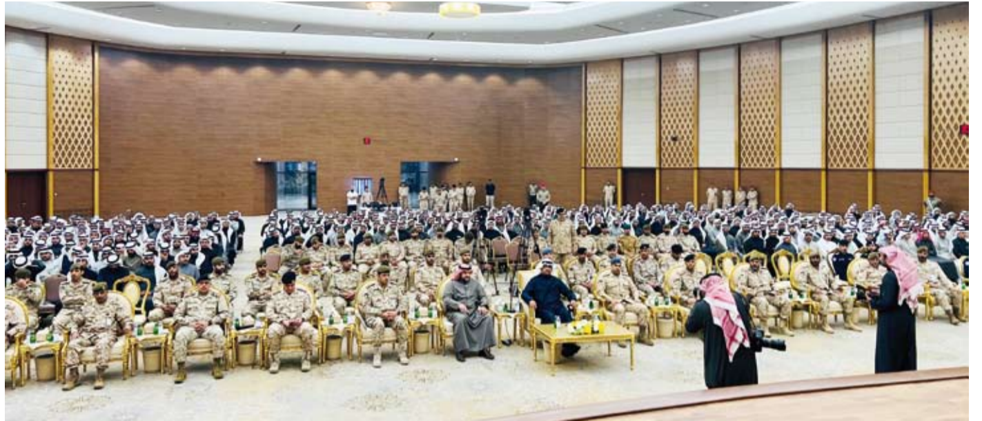
إجراء القرعة بحضور وزير الدفاع