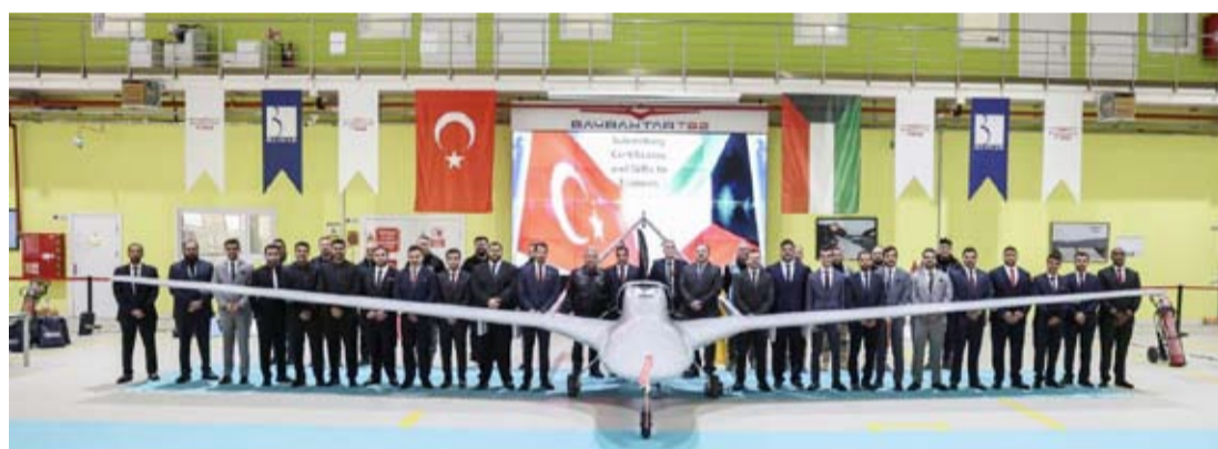
منتسبو القوة الجوية من الطيارين والرماة طارئة «بيرقادر تي بي 2»

أعلن الجيش الكويتي تخريج الدفعة الثانية من منتسبي القوة الجوية من «الطيارين والرماة» لطائرة «بيرقادر تي بي 2» في حفل أقامته شركة «بايكار» في مركزها التدريبي بمنطقة «كيشان» بجمهورية تركيا. وذكرت رئاسة الأركان العامة للجيش في بيان صحفي أنه اجتاز الدورة الثانية التي استغرقت أربعة أشهر عدد من الضباط وذلك ضمن برنامج تدريبي معد مسبقا لإعداد