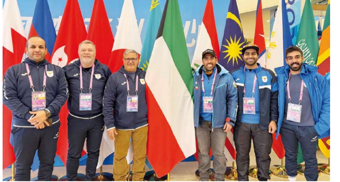
رئيس وفد الكويت على المري مع اللاعبين ومدربهم

المغلقة مثل الهوكي على الجليد والكيرلنغ والتزلج الفني (الفيجر) وأخرى تقام في المناطق الثلجية مثل التزلج على المنحدرات الجليدية. وشهد الحفل دخول الوفود المشاركة وسط استقبال حافل من الجماهير الصينية حيث حظي الوفد الكويتي بتفاعل كبير وألقت للجنة المنظمة الصينية كلمة ترحيبية تلاها نائب رئيس المجلس الأولمبي الآسيوي تيموثي فوك بكلمة عن المجلس.