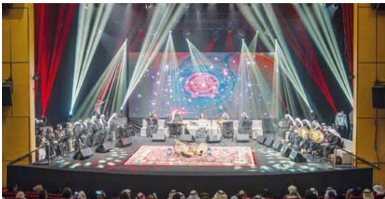
ليلة غناوي كويتية