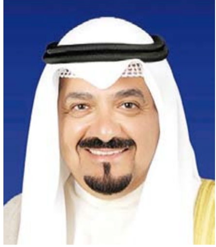
سمو الشيخ أحمد العبد الله

بعث سمو الشيخ أحمد العبدالله رئيس مجلس الوزراء، ببرقية تهنئة إلى السيدة سيسيل لا غرينادا حاكم عام غرينادا الصديقة بمناسبة ذكرى الاستقلال لبلادها.