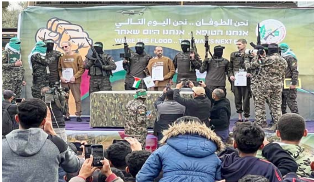
«حماس» خلال تسليم أسرى الاحتلال للصليب الأحمر في دير البلح أمس

فيما أكدت مصادر دبلوماسية مصرية إجراء مشاورات مع الدول العربية لعقد قمة طارئة بشأن فلسطين في القاهرة، برئاسة البحرين، الرئيس الحالي للقمة العربية، مرجحة انعقادها في 27 فبراير الجاري، شددت على أن القمة تهدف إلى صياغة موقف عربي موحد لرفض لفكرة تهجير الفلسطينيين من وطنهم ومحاولات تصفية القضية الفلسطينية، والدعوة إلى تضافر جهود المجتمع الدولي للتخطيط وتنفيذ عملية شاملة لإعادة الإعمار في قطاع غزة، بأسرع وقت بشكل يضمن بقاء الفلسطينيين على أرضهم. ميدانياً، ووسط قطاع غزة، في دير البلح تحديداً، سلمت حركة المقاومة الإسلامية «حماس»، صباح أمس، ثلاثة رهائن إسرائيليين إلى الصليب الأحمر