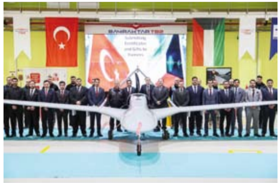
جانب من تخريج الدفعة الثانية من «الطيارين والرماة»