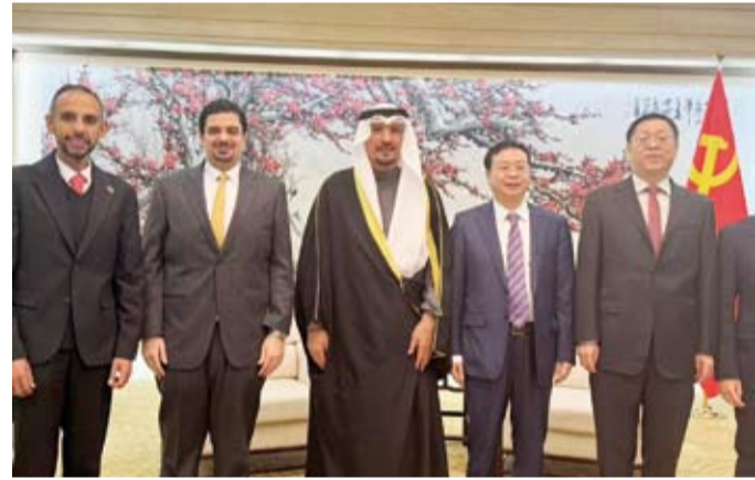
لقطة جماعية مع الوفد الكويتي

القانون الدولي والقانون الإنساني الدولي». وأشاد السفير الناجم بموقف الصين الأخير الرافض لتجهيز سكان غزة من أراضهم والتزامها بمبدأ حل الدولتين الذي يعد ضماناً لإيجاد حل دائم للسلام والاستقرار. يذكر أن دولة الكويت كانت أول دولة خليجية تقيم علاقات دبلوماسية مع الصين عام 1971 وأول دولة في الشرق الأوسط توقع مذكرة تفاهم للتعاون مع الصين في إطار مبادرة (الحزام والطريق) بعد إعلانها قبل 10 سنوات.