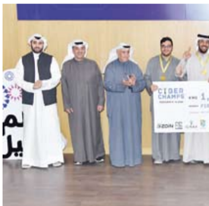
جانب من فعاليات المسابقة

أكد وزير التربية المهندس سيد جلال الطبيباني أن مسابقة (أبطال الكويت للأمن السيبراني) تأتي لتعزيز الثقافة الرقمية وبناء كوادر وطنية مؤهلة في مجال الأمن السيبراني بما يعزز قدرات دولة الكويت في مواجهة التحديات التقنية المستقبلية وضمان أمن المعلومات. جاء ذلك في كلمة ألقاها الوزير الطبيباني أمس خلال الحفل الختامي لمسابقة (أبطال الكويت للأمن السيبراني) التي أقيمت تحت رعايته وبالتعاون مع المركز الوطني للأمن السيبراني بمشاركة 100 طالب وطالبة من المدارس الحكومية والخاصة. وقال إن المبادرة انطلقت من إيمان راسخ بأهمية الاستثمار في طاقات الشباب الكويتي وتنمية مهاراتهم في مجال حيوي كالأمن السيبراني ليكونوا قادرين على حماية أنفسهم ومجتمعهم من مخاطر الغش الإلكتروني والمساهمة في بناء اقتصاد رقمي قوي ومزدهر. وأضاف الوزير الطبيباني أن مسابقة أبطال الكويت للأمن السيبراني تعد فرصة ذهبية للمتعلمين لاكتشاف شغفهم وتطوير مهاراتهم في مجالات متنوعة مثل التفكير النقدي وحل المشكلات والبرمجة والتحليل مما يهيئهم ليصبحوا قادة في مجال الأمن السيبراني وروادا في الابتكار التكنولوجي داعيا الطلبة إلى مواصلة السير والاكتشاف والتعلم. وكرم الوزير الطبيباني ثلاثة فرق كل فريق مكون