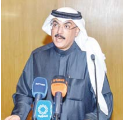
م. جلال الطبيباني متحدثنا

أكد وزير التربية المهندس سيد جلال الطبيباني أن مسابقة (أبطال الكويت للأمن السيبراني) تأتي لتعزيز الثقافة الرقمية وبناء كوادر وطنية مؤهلة في مجال الأمن السيبراني بما يعزز قدرات دولة الكويت في مواجهة التحديات التقنية المستقبلية وضمان أمن المعلومات. جاء ذلك في كلمة ألقاها الوزير الطبيباني أمس خلال الحفل الختامي لمسابقة (أبطال الكويت للأمن السيبراني) التي أقيمت تحت رعايته وبالتعاون مع المركز الوطني للأمن السيبراني بمشاركة 100 طالب وطالبة من المدارس الحكومية والخاصة. وقال إن المبادرة انطلقت من إيمان راسخ بأهمية الاستثمار في طاقات الشباب الكويتي وتنمية مهاراتهم في مجال حيوي كالأمن السيبراني ليكونوا قادرين على حماية أنفسهم ومجتمعهم من مخاطر الغش الإلكتروني والمساهمة في بناء اقتصاد رقمي قوي ومزدهر. وأضاف الوزير الطبيباني أن مسابقة أبطال الكويت للأمن السيبراني تعد فرصة ذهبية للمتعلمين لاكتشاف شغفهم وتطوير مهاراتهم في مجالات متنوعة مثل التفكير النقدي وحل المشكلات والبرمجة والتحليل مما يهيئهم ليصبحوا قادة في مجال الأمن السيبراني وروادا في الابتكار التكنولوجي داعيا الطلبة إلى مواصلة السير والاكتشاف والتعلم. وكرم الوزير الطبيباني ثلاثة فرق كل فريق مكون